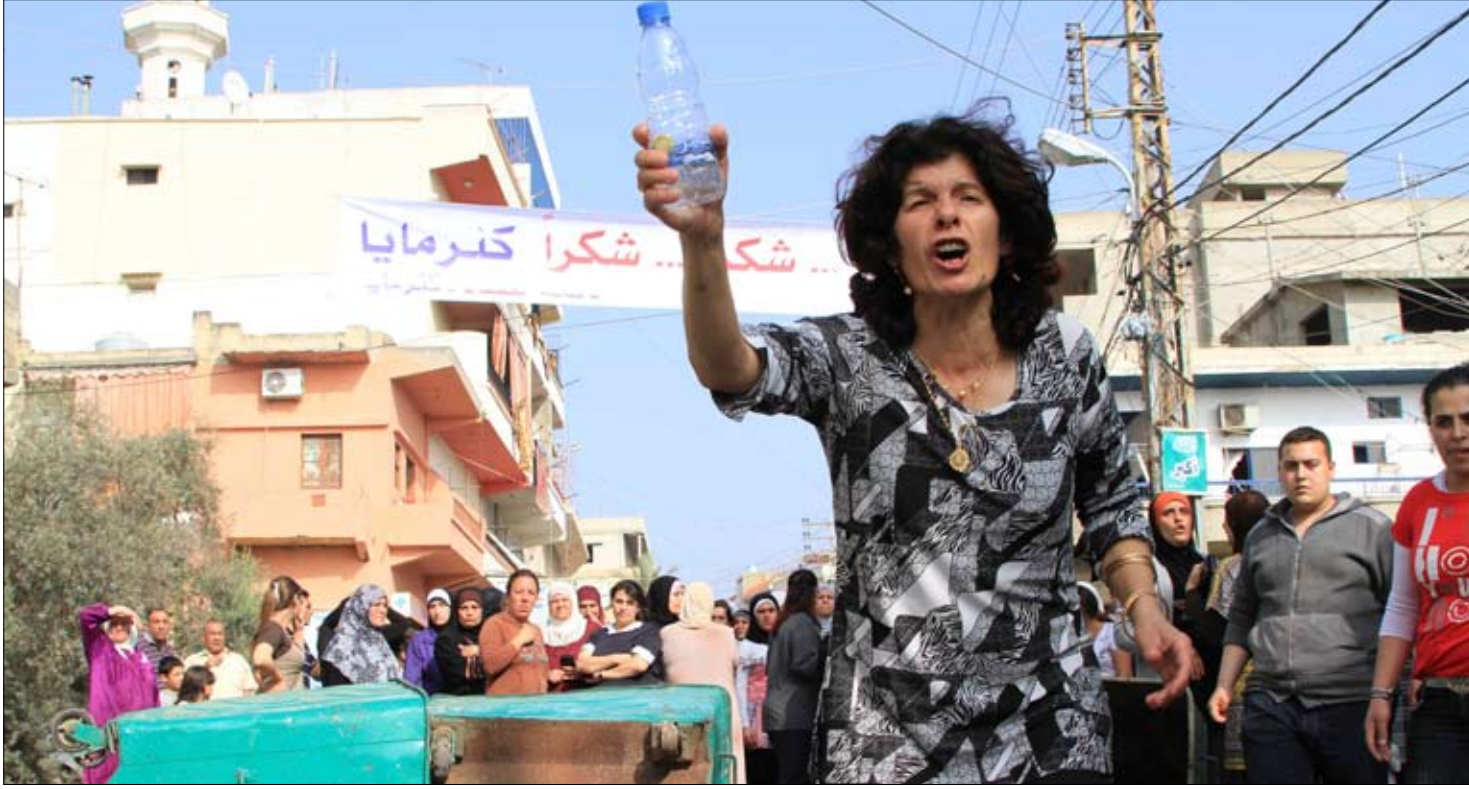
من تظاهرة أمام أحد الحواجز الإسرائيلية في الخليل السبت الفائت