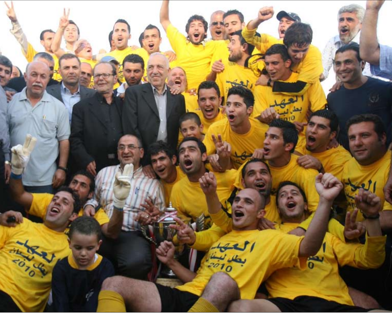
احتفال عهداوي بلقب بطولة الدوري الثاني في تاريخه (حسن بحسون)