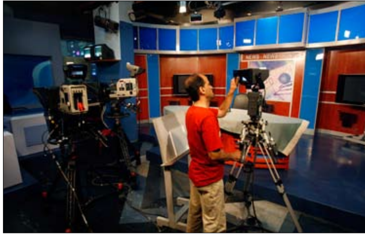
من استديوهات التلفزيون