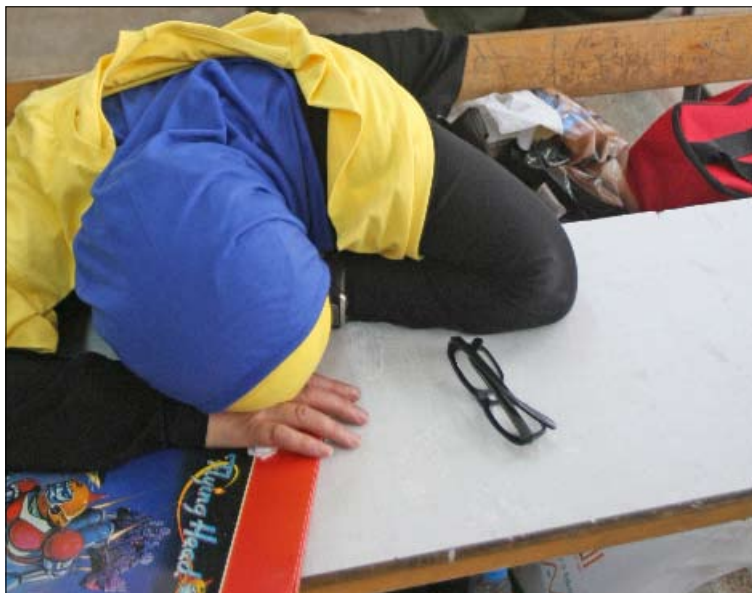
غفا مندوبو المرشحين في بعض المراكز بسبب ضعف الإقبال (بلال جاويش)

لكن في بيروت معركة، وهي غير متكافئة أبداً. معركة بين لائحة فازت قبل بدء عملية الاقتراع (وحدة بيروت)، ولاحتين تربيان إثبات الوجود (لائحة البيارة، ولائحة جمعية المشاريع). معركة بين لائحة امتلكت كل المقومات المالية، فوزعت وجبات طعام عدة على مندوبيها ورؤساء الأقالم، ولاحتين، اطعمتا مندوبيهما الحد الأدنى. معركة بين لائحة يدعمها رئيس حكومة لبنان، سعد الحريري، ولاحتين يدعمها ناشطون سياسيون