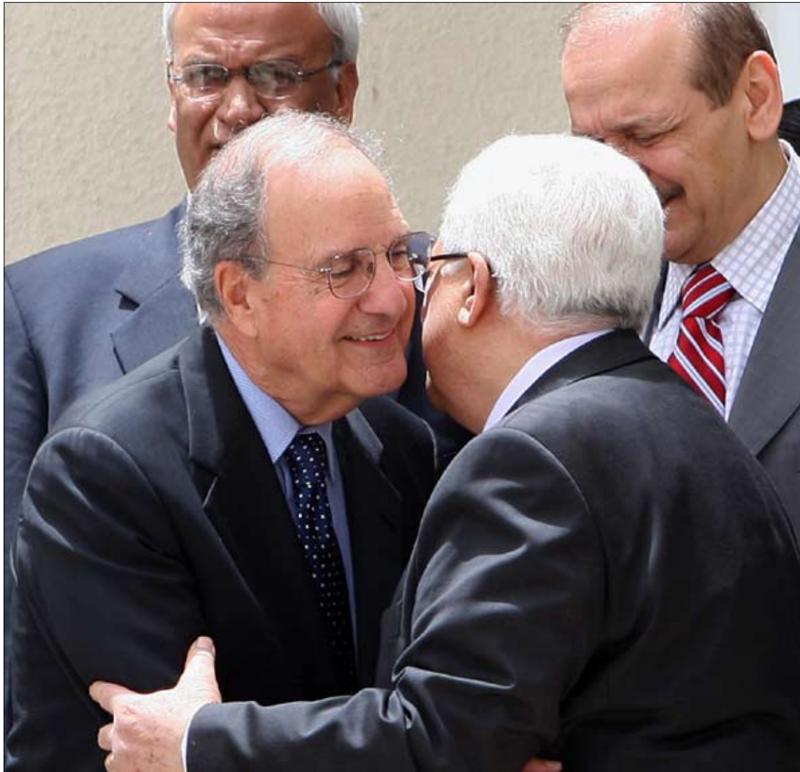
عباس معانقا ميتشل في رام الله أمس

وقال كبير المفاوضين الفلسطينيين، صائب عريقات، عقب اجتماع الرئيس الفلسطيني محمود عباس مع المبعوث الأميركي جورج ميتشل في رام الله أمس، إنه يستطيع أن يعلن رسمياً أن المحادثات غير المباشرة بدأت. وأضاف أن قضيتي الحدود الخاصة بدولة فلسطينية في المستقبل والأمن تمثلان القضيتين اللتين سيركز عليها الفلسطينيون في المفاوضات. وفي ما يتعلق بالمفاوضات المباشرة، قال عريقات: «عندما يعلن نتنياهو وقفه للاستيطان بما يشمل النمو الطبيعي وبما يشمل القدس واستئناف المحادثات من النقطة التي توقفت عندها في كانون