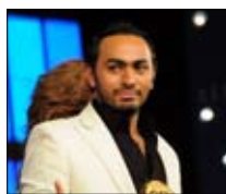
تامر حسني «العاطفي» «ميلودي أفلام» ■ 22:30