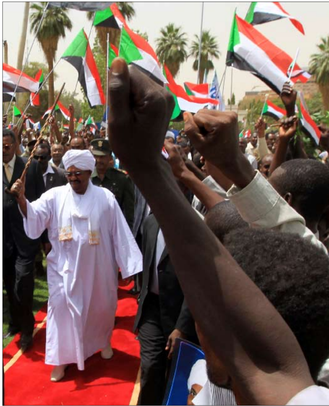
البشير بين أنصاره في القصر الرئاسي في الخرطوم