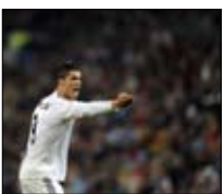
من الفورمولا إلى كرة القدم «السومرية» ■ 17:00