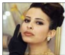
هل يدخل غسان السجن؟ OTV ■ 20:45