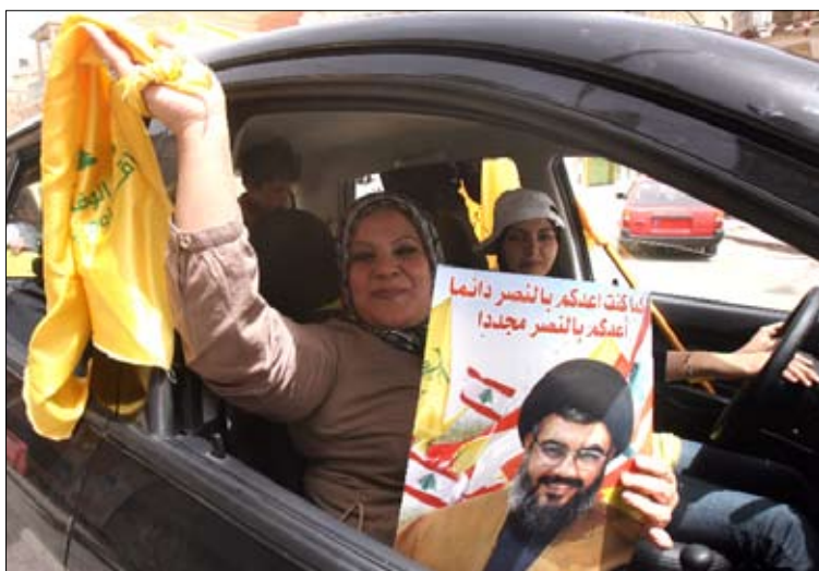
مؤيدون لحزب الله