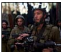
من يقرر في إسرائيل؟ «الجزيرة» ■ 22:05