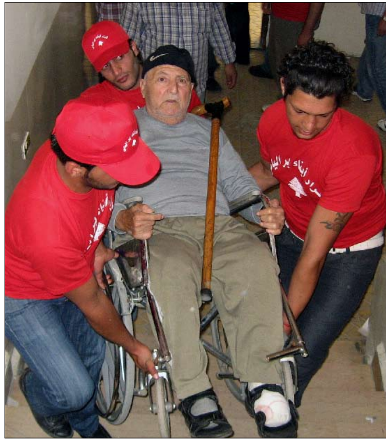
في بر الياس (عفيف دياب)

المحطة الثانية كانت في بلدة عين كفر زبد، حيث التنافس للوصول إلى رئاسة البلدية انحصر بين مرشحين من آل