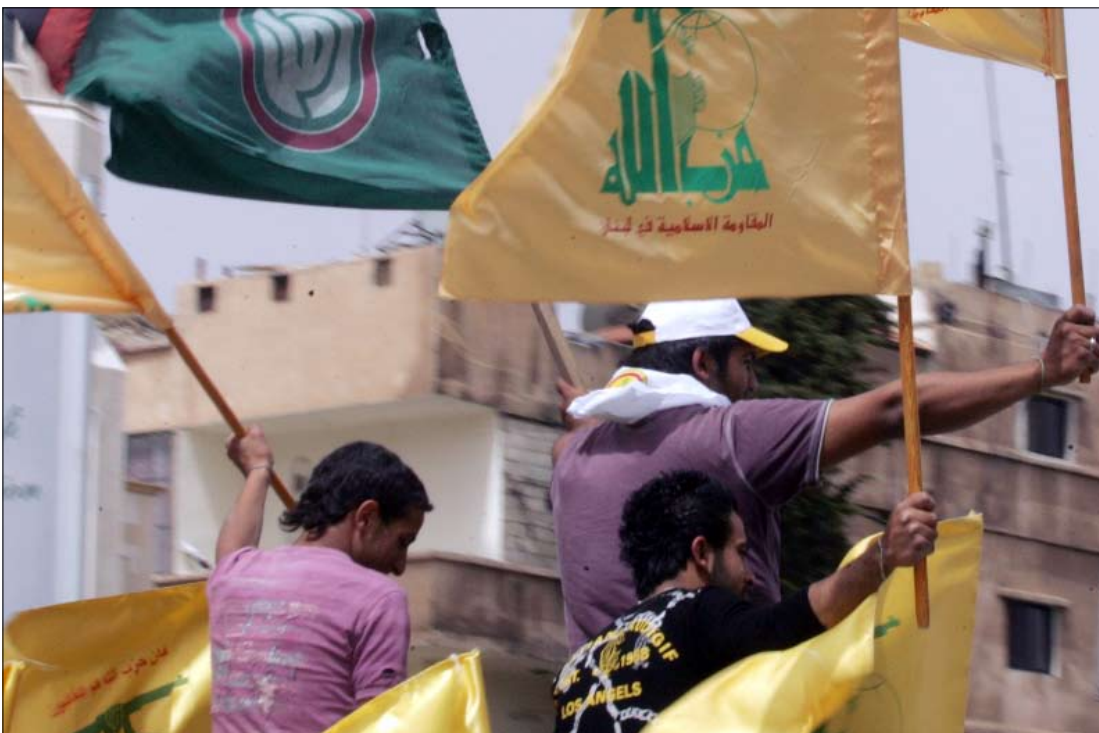
مؤيدون لحزب الله