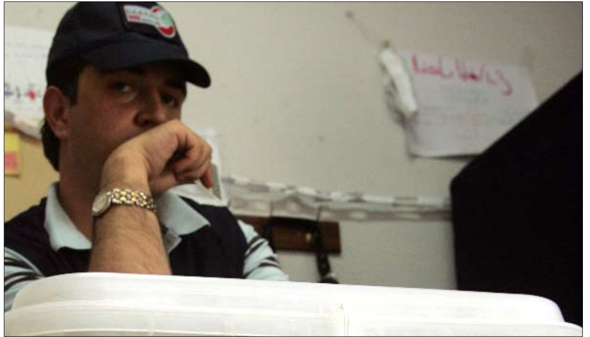
داخل أحد أقلام الاقتراع في البقاع

لم تعش البلدات التي نجحت في تزكية مجالس بلدياتها يوماً عادياً، أمس. فالانتخابات وإن لم تطلها «بلدياً» فإن بعضها شهد انتخابات اختيارية كانت أقل حدة من أخواتها في قرى شهدت تنافساً على المجلس البلدي أو الاختياري. ففي البقاع الأوسط تحققت التزكية في بوارج وشتورة وعنجر ونيحا، إذ لم تشهد هذه البلدات أي أجواء انتخابية وأمضى أغلبية الأهالي يومهم في متابعة الانتخابات عبر الشاشات. وتحولت تزكية بلدية شتورة إلى مصدر نكتة، إذ كان رواد مقهى من البلدة يتابعون عبر هواتفهم الانتخابات في زحلة وغيرها و«نسبة الاقتراع في شتورة صفر والنتيجة مش منبحة». وإذا بدكن دعم بزحلة لنطلع.. نحننا خلصنا الانتخابات قبل ما تبلش. كل الصبايا العونية جاهزين للدعم. ومن شتورة حيث «النكتة» انطلقت على القرى المجاورة تهكماً، فقد سجل تزكية 9 بلديات في قضاء راشيا. ففي كفردينس