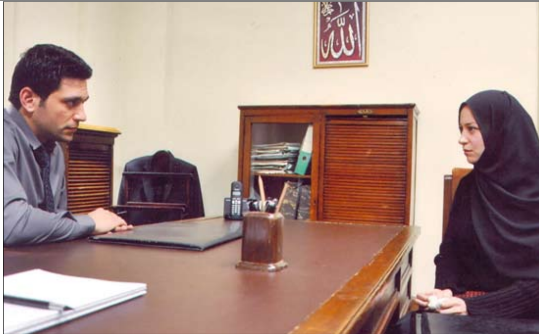
منة شلبي وحسن الرداد في مشهد من المسلسل