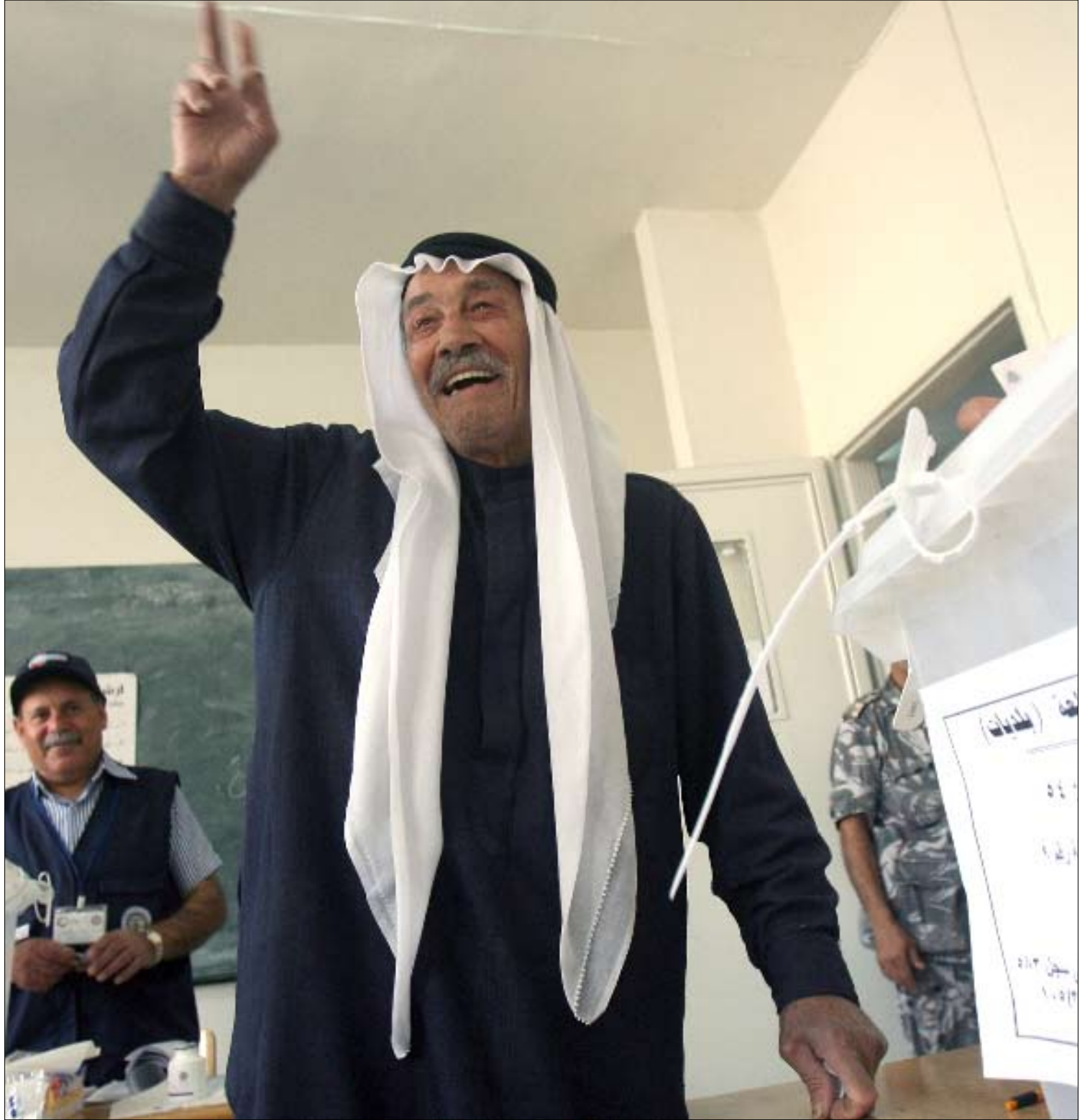
يرفع إشارة النصر بعد التصويت في بعلمك