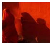
اختفت سعادى... «المستقبل» ■ 20:45