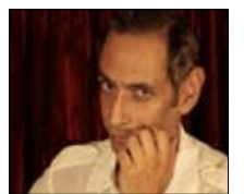
تحية للمتطوعين MTV ■ 21:30

تلقي حلقة اليوم من برنامج «سماش»، الضوء على آخر نتائج البطولات الأوروبية لكرة القدم وموقف الفرق المختلفة، إضافة إلى تقارير مفصلة عن جائزة إسبانيا ضمن بطولة العالم «لغورمولا وان»، ورالي نيوزيلندا الدولي ضمن بطولة العالم للرياليات.