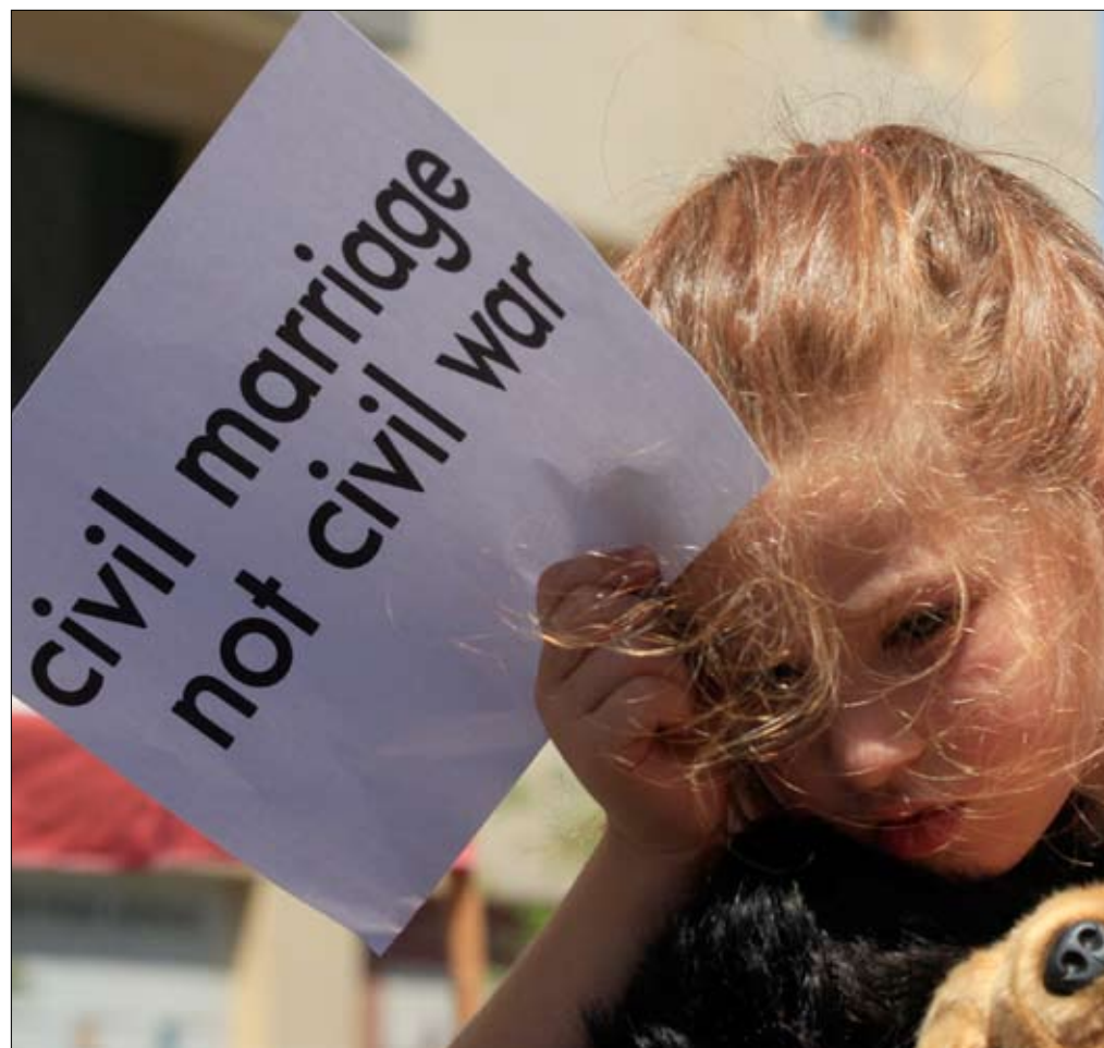
من مسيرة العلمانيين في بيروت