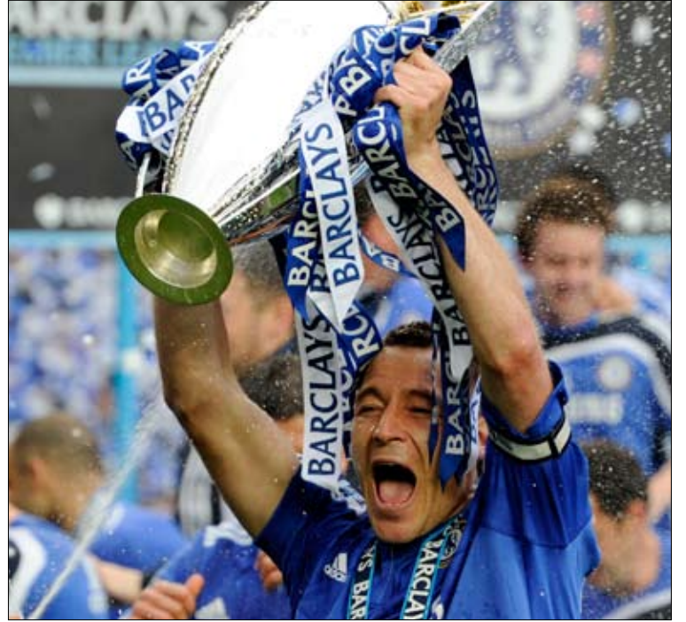
كابتن تشلسي جون تيري يرفع كأس الدوري الإنجليزي الممتاز

احتفل تشلسي وبايرن ميونخ على منصة التتويج ببطولتي إنكلترا وألمانيا لكرة القدم، بينما تأجل الحسم في إسبانيا وإيطاليا إلى المرحلة الأخيرة بعد خروج فرق الصدارة بانتصارات أبقى المنافسة مفتوحة ومحمدة في آن واحد