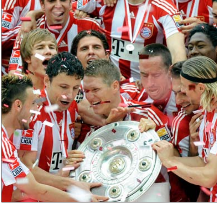
كابتن بايرن ميونخ مارك فان بومل محتفلاً ورفاقه بدرع الدوري الألماني