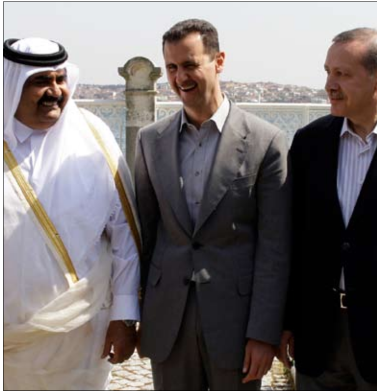
الأسد متوسلاً اردوغان وامير قطر في اسطنبول أمس

على وقع طبول الحرب التي تفرعها دولة الاحتلال بين الفينة والأخرى، يبدو أن العمل على فتح قنوات التفاوض على المسار السوري الإسرائيلي جارٍ، بوساطة تركية أو روسية