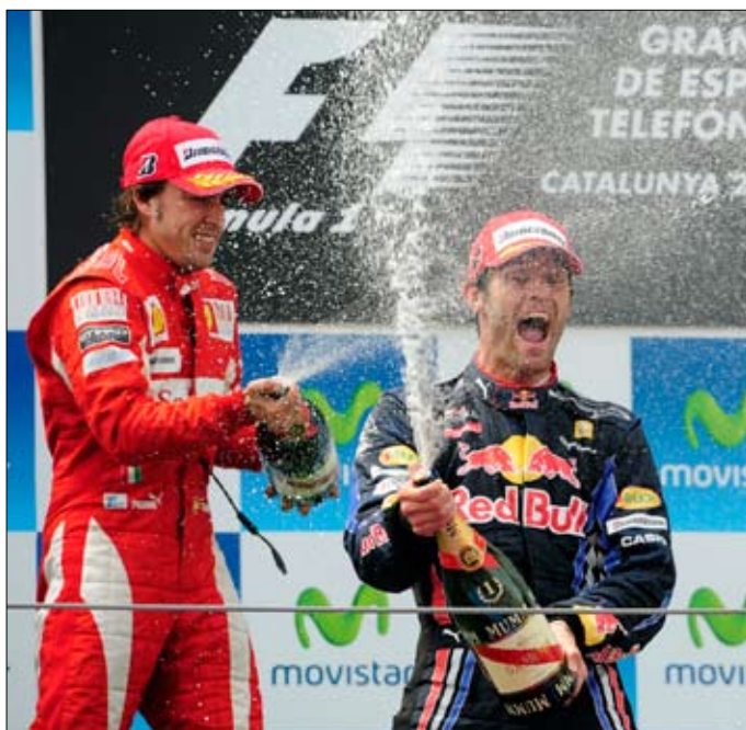
ويبر محتفلاً بفوزه في جائزة إسبانيا بمشاركة الونسو

خرج سائق «ريد بل ريسينغ» الأسترالي مارك ويبر متوجاً في جائزة إسبانيا الكبرى، المرحلة الخامسة من بطولة العالم لسباقات سيارات الفورمولا 1، التي أجريت على حلبة مونتيبلو في برشلونة. وهذا هو الفوز الأول لويسر هذا الموسم والثالث في مسيرته الاحترافية بعد سباق ألمانيا والبرازيل العام الماضي، وقد جاء انتصاره بعد انطلاق جيد، حيث حافظ على المركز الأول الذي انطلق منه للمرة الثالثة في تاريخه، قبل أن يسيطر على مجريات السباق من دون أن يترك المجال لأي من منافسيه للتفوق عليه.