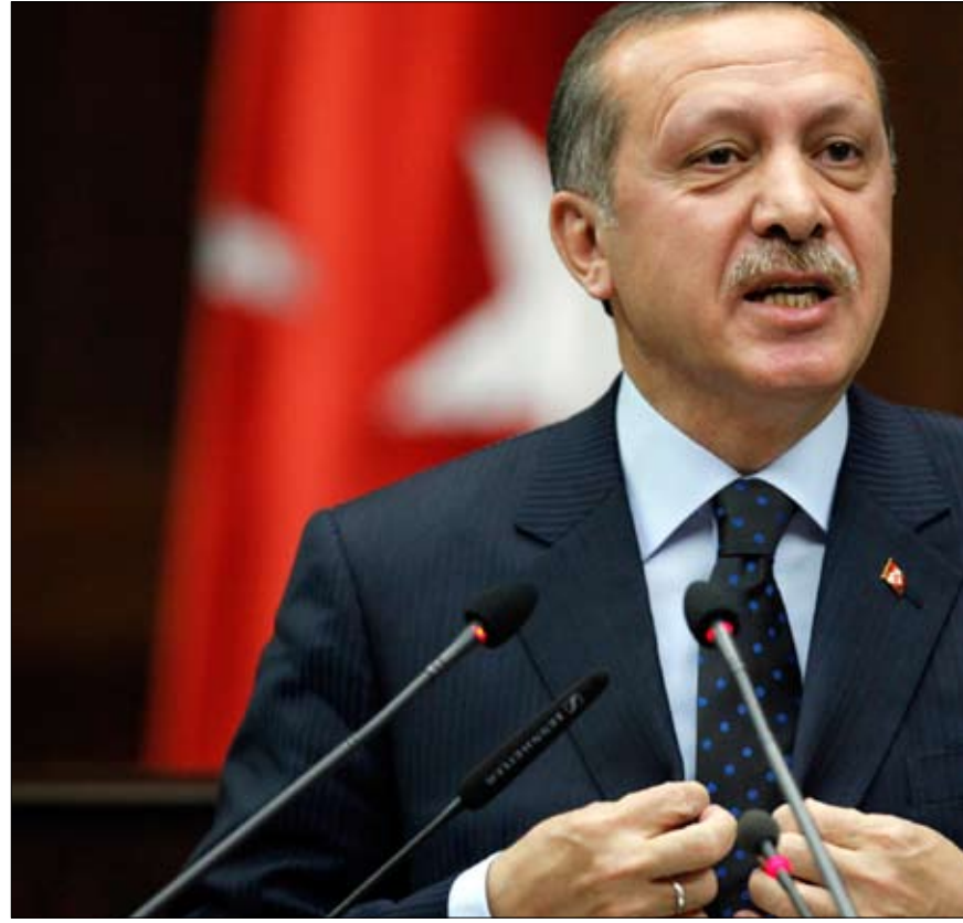
أردوغان مخاطباً نواب كتلة حزب العدالة والتنمية في البرلمان التركي أمس

أوباما يدعم تحقيقاً عادلاً وشفافاً: إيصال المساعدات من دون تهديد إسرائيل