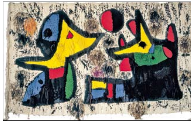
«سجادة حائط» (نسيج - 1980)

أكثر من 114 عملاً فنياً بين أعمال تركيبية وتمائيل ولوحات مسندية ومنسوجات فنية إضافة إلى أعمال سيراميك وبوسترات، استضافها متحف Arken في كوبنهاغن احتفاءً بالذكرى الـ 117 لميلاد ميرو. تحكي الأعمال قصة فنان جدلي طرح كمّاً هائلاً من الأفكار