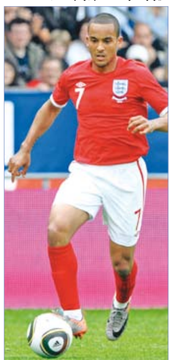
ثيو والكوت

للدفاع: ارته فريدريك (هرتا برلين) وفيليب لام وهولغر بادشتوبر (بايرن ميونخ) وبير مرتيساكر (فيردر بريمن) وجيروم بوتانغ ودينييس أغو ومارسيل يانسن (هامبورغ) وسردار تاسجي (شتوتغارت).