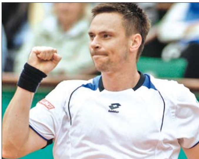
روبين سودرلينغ بعد فوزه على روجيه فيديرر

وتبدو فرصة ديمينتيفا، أفضل مصنفة لم تحرز أي لقب كبير حتى الآن، قوية هذه المرة لبلوغ النهائي واعتلاء منصة التتويج، بعد أن أزيحت من طريقها عقبة البلجيكية