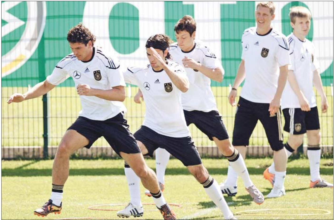
خلال حصة تدريبية للمنتخب الألماني أمس في جنوب أفريقيا

ابتداءً من اليوم لا مجال للتراجع بالنسبة إلى مدربي منتخبات الفرق المتأهلة إلى كأس العالم، التي تبدأ في الـ 11 من الشهر الجاري، بعدما انتهت أمس مهلة إعلان التشكيلات الرسمية التي ستخوض النهائيات. وفي وقت حسم فيه بعضهم خياراته منذ وقت طويل، انتظر البعض الآخر حتى اللحظة الأخيرة