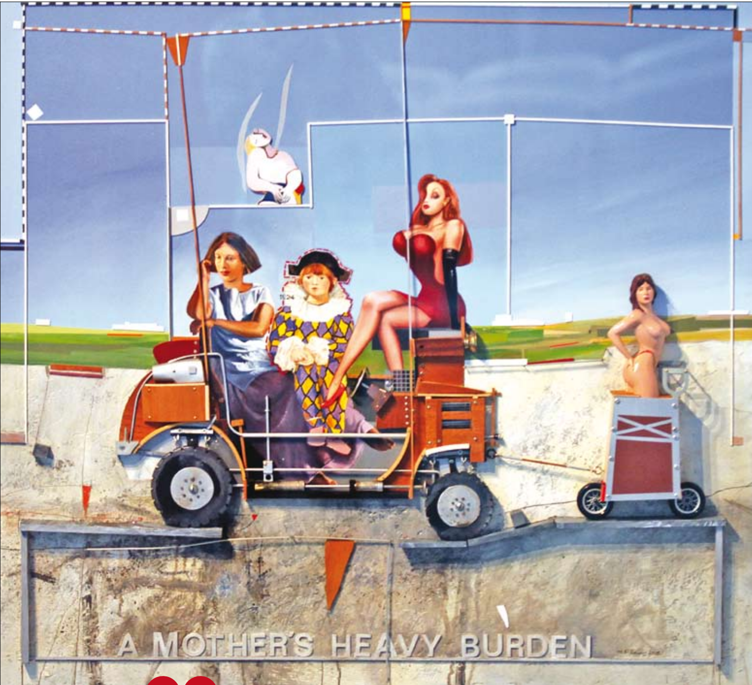
«أمهات باحمال ثقيلة» (جيكليه، طباعة رقمية على ورق — 42 × 45 سنتم — 2009)