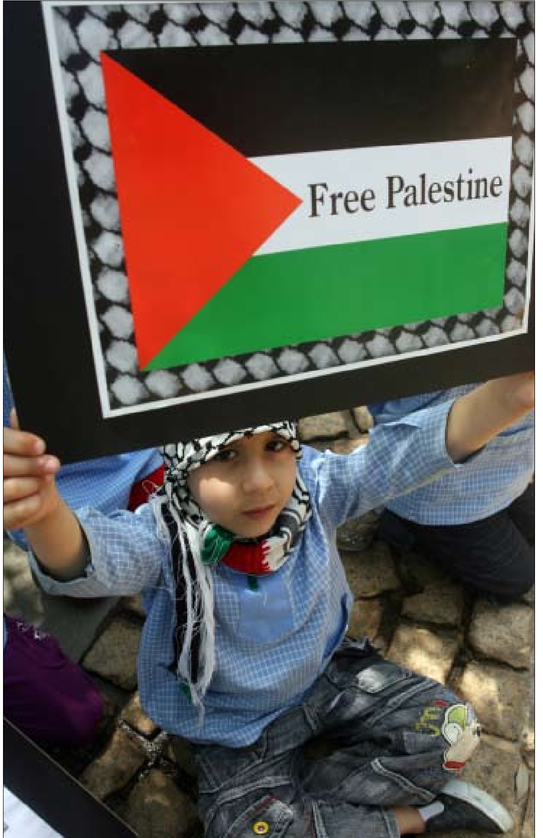
اعتصام تضامني مع سفن الحرية في بيروت (بلال جاويش)

في موازاة الهجوم وعمليات التحقيق والاعتقال، روجت الحكومة الإسرائيلية رواية ادعت خلالها أنها هاجمت الأسطول لأن قباطنة السفن لم يستجيبوا للإنذارات والنداءات التي وجهها إليهم الجيش الإسرائيلي، وأنهم كانوا «متجهين» نحو «المياه الإقليمية لدولة إسرائيل»، تضيف هذه الرواية إن المتضامين مع غزة