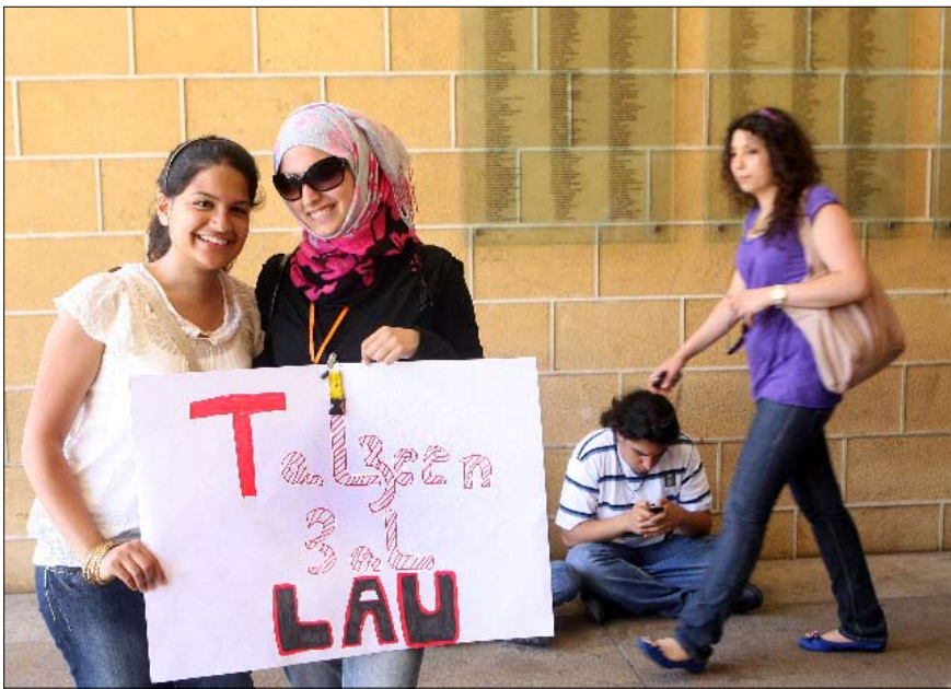
من اعتصام طلاب الجامعة الأميركية في بيروت

تامة. فالبورجوازية اللبنانية وفي جزء مهم منها تتلخص في العائلات التي تسيطر على القطاع المصرفي مثلاً، إلا أن تلك الطبقة غائبة الكلام عنها عند البقية من اللبنانيين سواء بصفتها البورجوازية أو بأي صفة أخرى. من المفيد الكلام هنا أيضاً عن التحول الذي حدث في الأيام الأخيرة من الاحتجاج والانشطار الطلابي الذي صاحبه الكلام عن «قيادة طلابية قومية يمينية فاشية» وأطراف «مواجهة لها» كاليساريين والفلسطينيين وغيرهم، حيث أسبغت تلك الصفات على كل من يدعي قيادة التحركات ضد إدارة الجامعة. إن أي متابع لا يستغرب أي انشقاق يحدث في أية حركة طلابية. إن هذا أمر أكثر من معتاد. إلا أنه من الملاحظ تحديداً، رسم هذه الانقسامات هنا باستعادة مفردات أيديولوجية موروثية من تاريخ حرب أهلية لا علاقة له بالمطالب الطلابية تجاه السياسات المالية للجامعة نفسها التي كان يدور الصراع حولها. بل حوّلت أي تباينات تحدث في المواقف إلى سياسات هوية مفهومة أوتوماتيكياً من جمهور الإعلام اللبناني، لتحليل التلميذ «يمينا» أو «يسارياً» حسب طائفته أو صداقته مع جهة حزبية معينة، بدل أن يحدد ذلك موقعه من الصراع الدائر. فجأة أصبح مطلوباً من التلميذ في الأميركية، وفي خضمّ المعركة، أن يحدد أولاً مكانه من الحكومة الطلابية، بدل أن يدور النقاش حول موقع الطالب من المطالب نفسها.