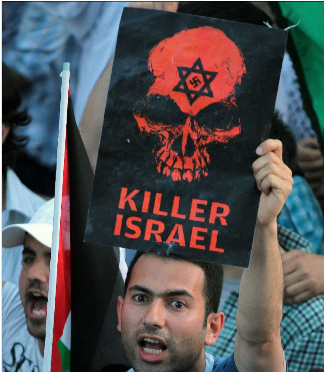
امام القنصلية الإسرائيلية في إسطنبول

وكان الدم التركي، الذي يسقط للمرة الأولى على أيدي الإسرائيليين، ثابتة في معظم افتتاحيات الصحف التي استعادت مبادئ العلاقات الثنائية التي يمكن أنقرة المبادرة إلى النظر بها، من العلاقات العسكرية إلى التجارية والسياسية والعلمية والنفطية والمائية... بعدما باتت الدولتان أقرب إلى العدوتين في السياسة، وفقاً لتعابير رجب طيب أردوغان. أما في المزايدات السياسية الداخلية، فلم ينزل أي موقف حزبي معارض تحت سقف الموقف الحكومي، حتى إن نواباً من حزب المعارضة الأكبر، «الشعب الجمهوري»، زادوا على الموقف الرسمي عندما حملوا الحكومة مسؤولية الجريمة لأنها «لم ترسل أسطولها البحري العسكري ليرافق ويحمي سفن المساعدات الإنسانية».