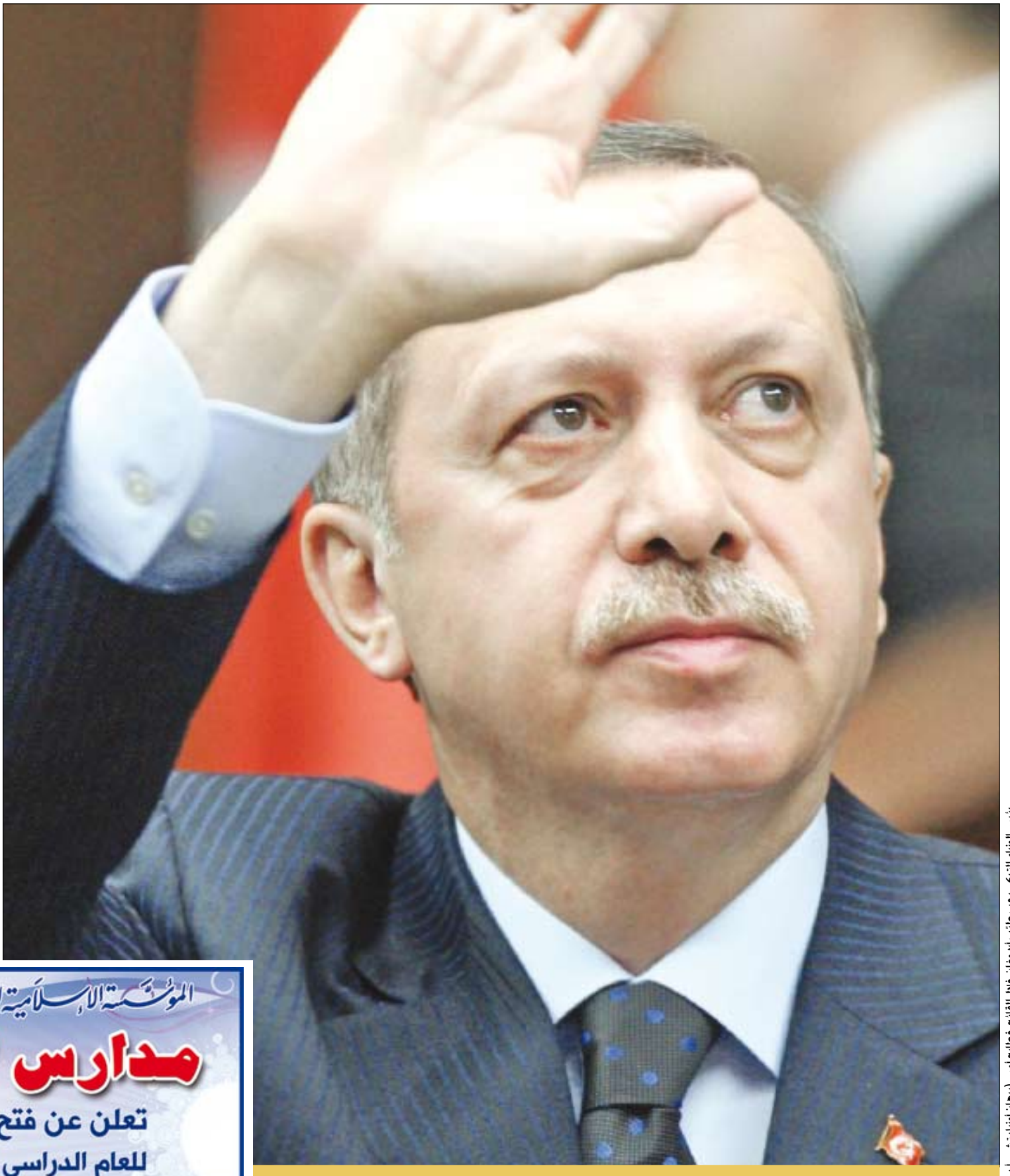
رئيس الوزراء التركي رجب طيب أردوغان خلال القائه خطابه مس برهان أوزلبينشي - (ب)

هند صبري «عايزة تنجوز» على الشاشة الصغيرة في أول بطولة تلفزيونية