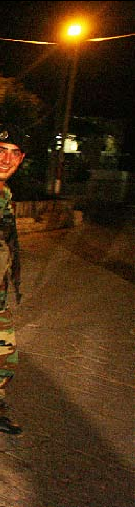
إجراءات أمنية مشددة في الناقلورة أمس

في «المعتقل»، قبل أن يعود إلى عملية الاعتقال. أوضح قائلاً: «نحن أعلننا أننا نريد التوجه إلى غزة. لكن عند مهاجمتنا، كنا في المياه الدولية». وبعدما سيطر رجال الكوماندوس على البواخر، جرى فرز الناشطين وعزلهم على نحو رهيب مع منع الكلام».