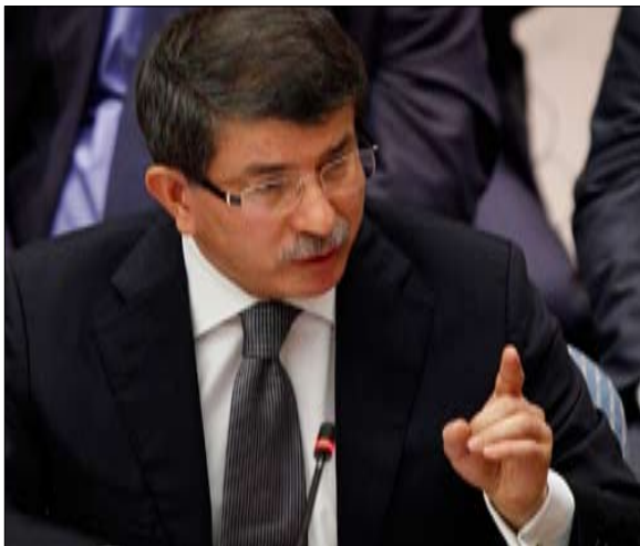
داوود أوغلو خلال جلسة مجلس الأمن

إلى ذلك، وفي إطار الخلاف على التحقيق، اقترحت فرنسا أن يأخذ الاتحاد الأوروبي على عاتقه إجراء تحقيق دولي. وقال وزير الدولة الفرنسي للشؤون الأوروبية بيار لولوش «يجب تسليط الضوء على هذه القضية. الأمم المتحدة طالبت لجنة تحقيق دولية... ويمكن الأوروبيين أن يضغطوا بهذه المسؤولية».