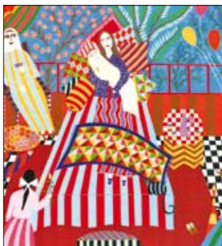
«ولادة طفل» (38 × 50 سنتم — طباعة على كانفاس — 2007)

وظيفياً يذهب إلى المعنى المطلوب من دون أي تلوّن. اللوحة مؤلفة من موضوعها، أما الباقي فلا يتجاوز حدود الزخرفة البسيطة والتزيين العادي. الزخرفة تساهم في بث مناخات شرقية طاغية. إنها البطلة المطلقة في هذه الممارسة التشكيلية المكتفية بالموضوع. ثمة نوستالجيا واضحة في اللعب على مفردة الوطن والبيت وتقاليد المكان الأول، كما هي الحال في لوحة Circle Home المنجزة بتكرار كلمة «بيت» المكتوبة بالبحر بشكل دائري، وكذلك لوحة Map of home التي تصور امرأة داخل خريطة لبنان. على أي حال، اللوحات كلها تحتوي قدراً من هذه النوستالجيا التي تتحول إلى هوية أو نبرة