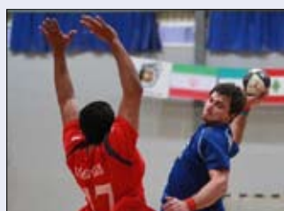
فوفو نجم مار الياس