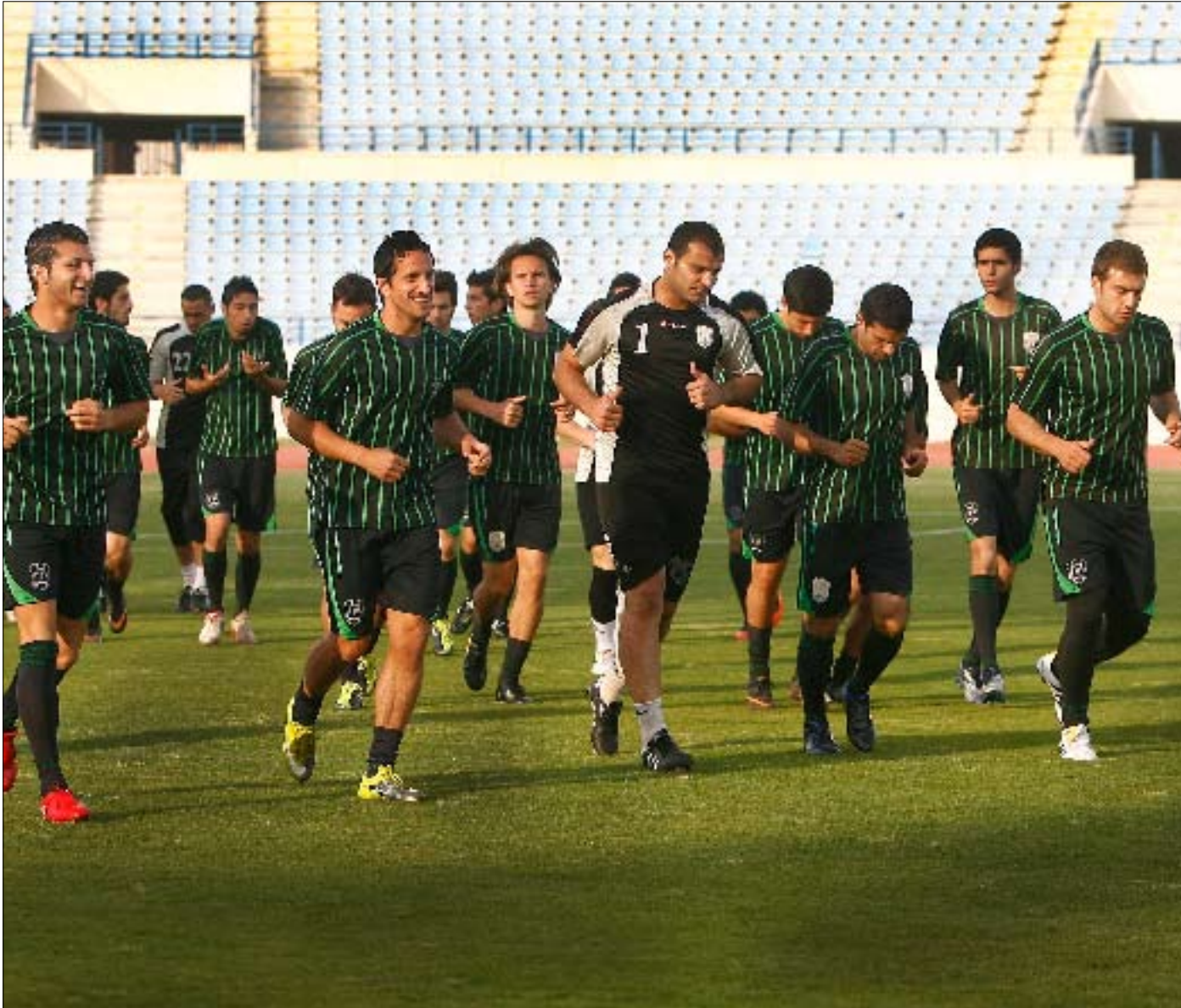
لاعبو الأنصار يؤدون حصتهم التمرينية أمس على ملعب المدينة الرياضية

يجب على ممثلي كرة لبنان تحقيق نتائج إيجابية في كأس الاتحاد الآسيوي. ويحل العهد، بطل الدوري، ضيفاً على أربيل العراقي بينما يستضيف الأنصار فريق ناساف الأوزبكي في بيروت، وشهد أمس تأهل أربع نواد من المنطقة الشرقية