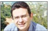
«من الآخر» بين السياسة والرقص 22:00 ■ Mtv