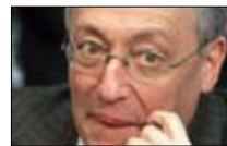
عين أحمد فتفت على سوريا أخبار المستقبل 21:00 ■

يطرح عمرو ناصف في برنامج «ماذا بعد» هذا المساء، موضوع تهديد الوحدة الوطنية المصرية ومحاولات زرع الفتنة بين المسلمين والأقباط، مستفسراً عن الأساليب والأدوات وعن المستفيد، وعن كيفية حماية نسيج مصر الوطني.