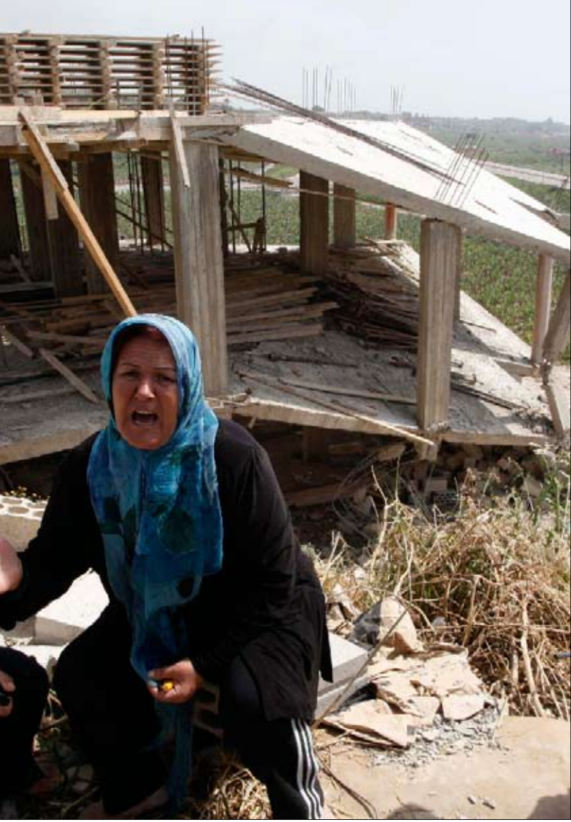
تدافعان عن منزلهما المخالف في بلدة عدلون لمنع قوى الأمن من هدمه

ورغم أن الرئيس نبيه بري أبلغ جميع الجهات في الدولة رفضه الاعتداء على الأملاك العامّة، ورفع الغطاء عن أي