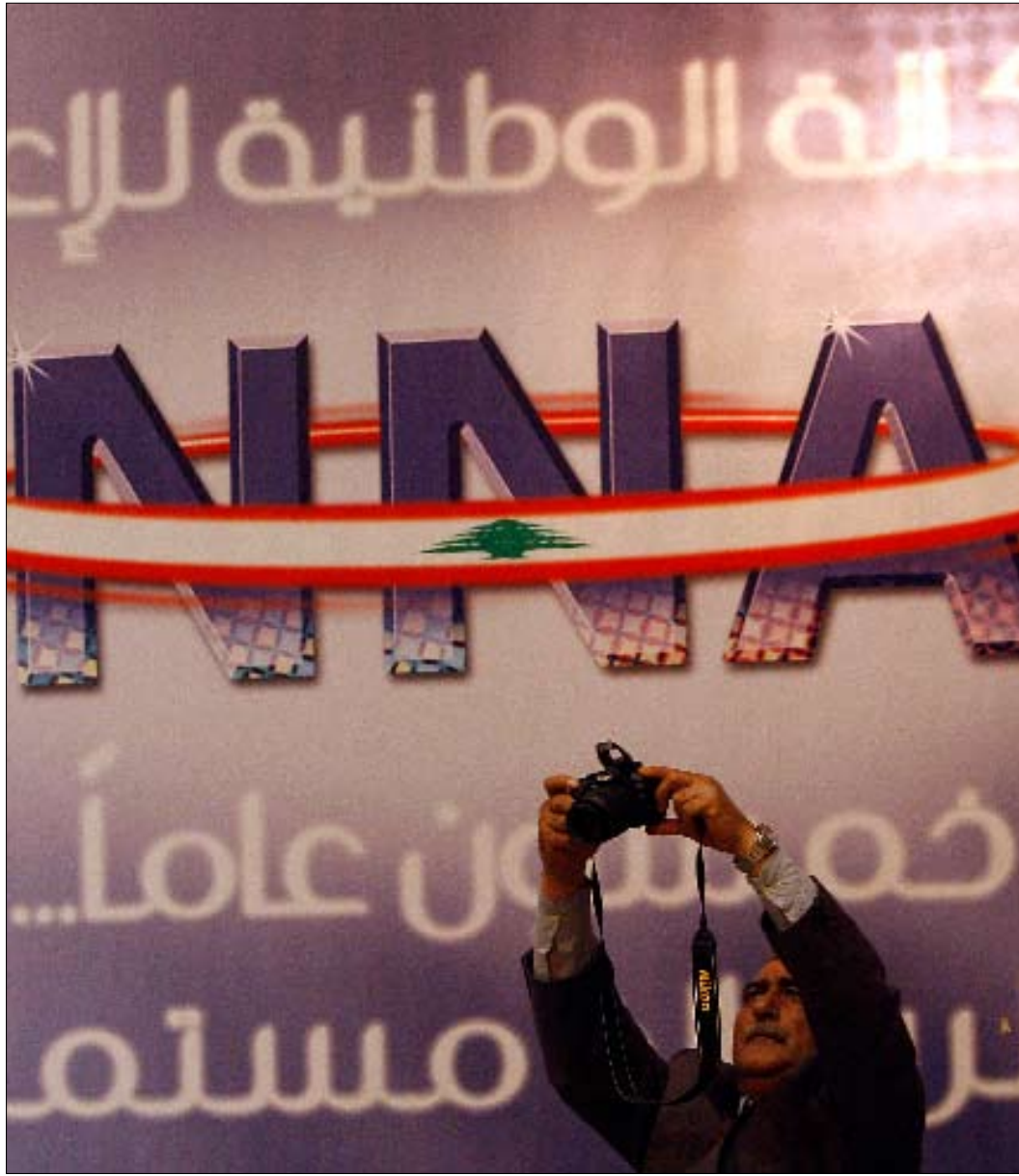
من مؤتمر اليوبيل أمس

«تشكلت لجنة لتسوية أوضاع العاملين في الوكالة، وقررنا البدء بتفعيلها بعد الانتهاء من احتفالات اليوبيل»، تؤكد