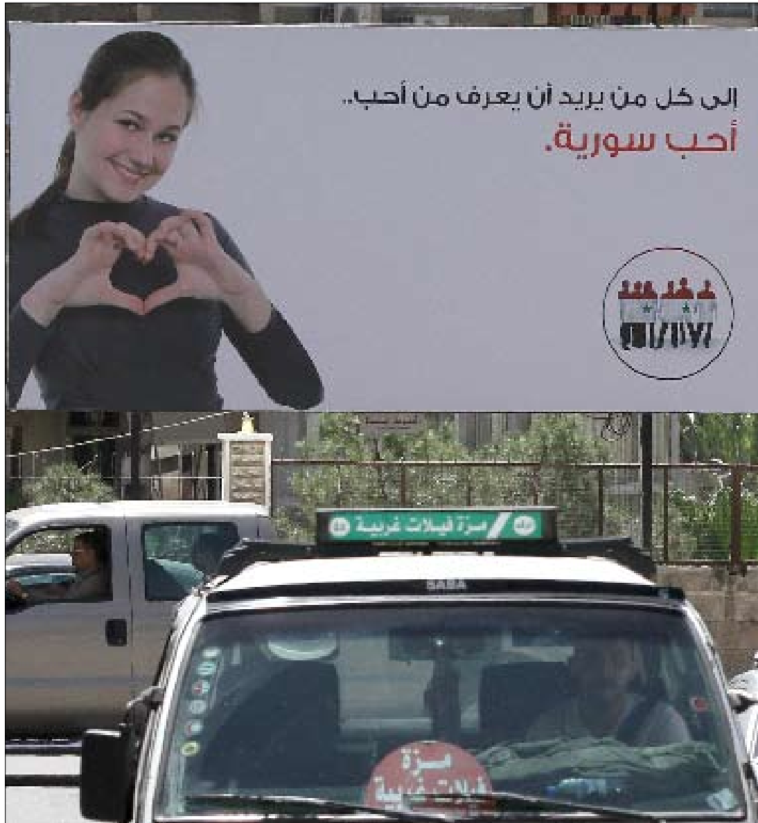
المركبة في احد شوارع دمشق امس

وكان سفراء الدول الـ27 الأعضاء في الاتحاد الأوروبي قد كلفوا الجمعة الماضي خبراء بالعمل على صياغة العقوبات التي قد تشمل حظر