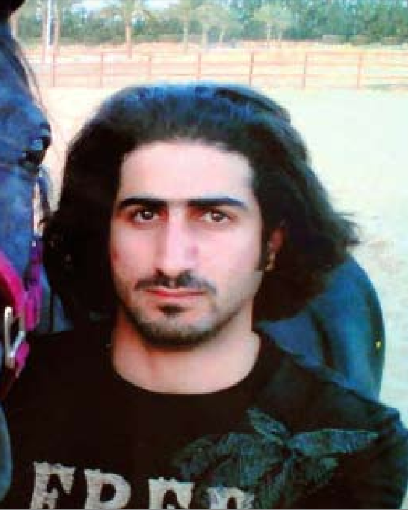
عمر بن لادن قرّر الانفصال عن حياة والده بعدما رفض تنفيذ عملية انتحارية