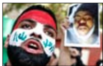
الفتنة عدو رقم واحد 20:30 ■ المنار