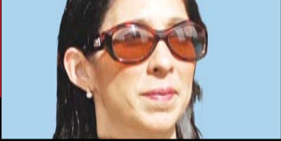
ميشال سيسون: طلبنا حماية الحريري والسنيرة وجنبلاط