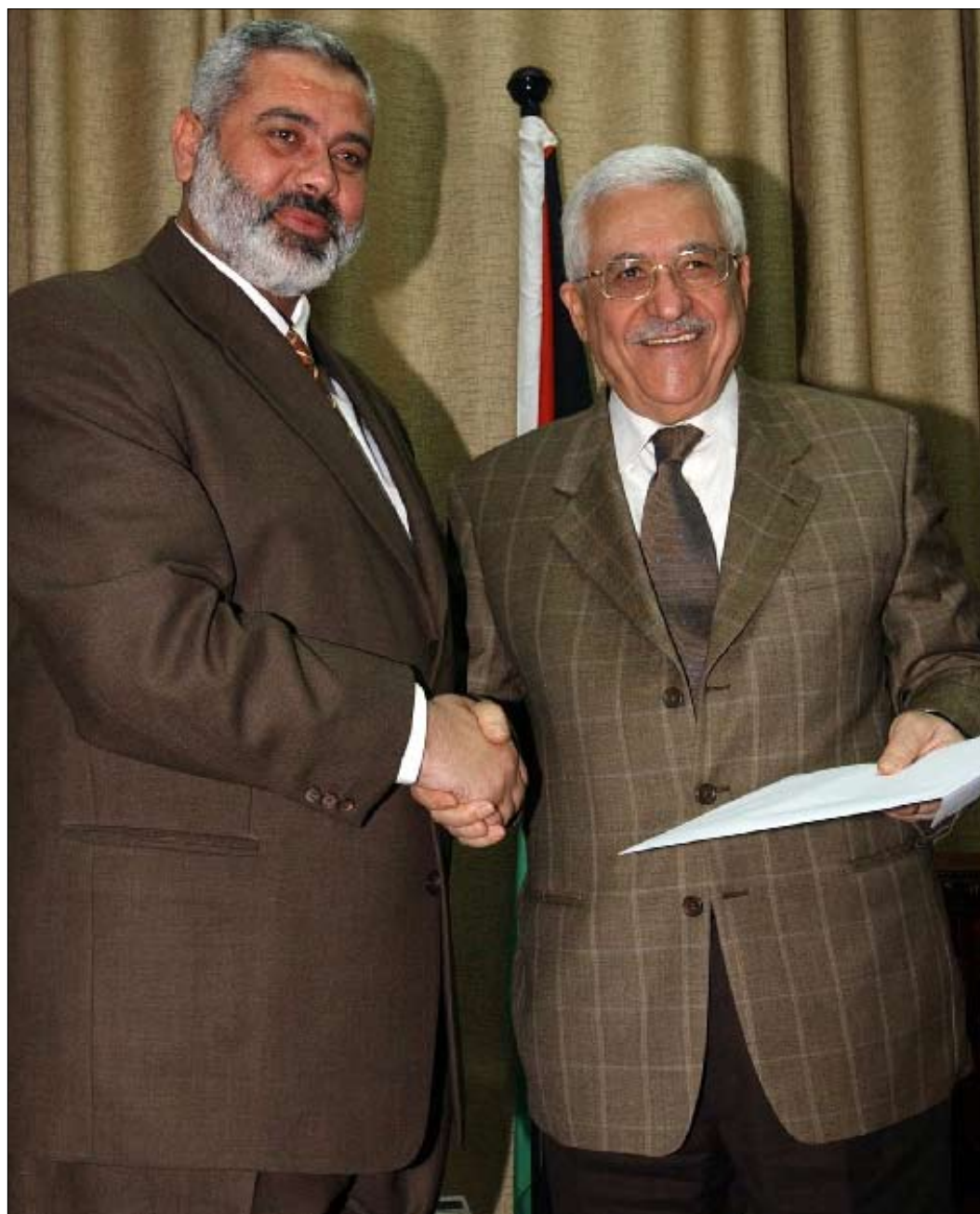
صورة تعود إلى عام 2006 تُظهر عباس وهنية يتصافحان