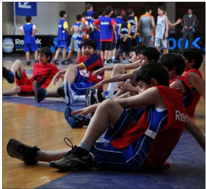
«نجوم المستقبل» خلال التمرين

المرتدة، وأخرها 33 كرة مع المتحد. كما أن هناك قائد الفريق فادي الخطيب المتحمس لتحقيق لقب للشانفيل في رابع وصول له الى النهائى.