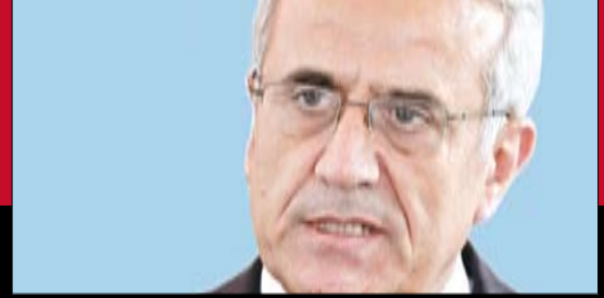
ميشال سليمان: سلوك حزب الله في بيروت ميليشيوي