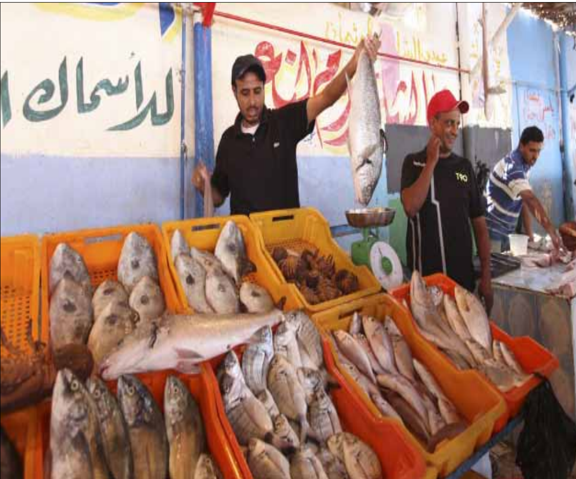
الأسماك في سوق بنغازي أول من أمس