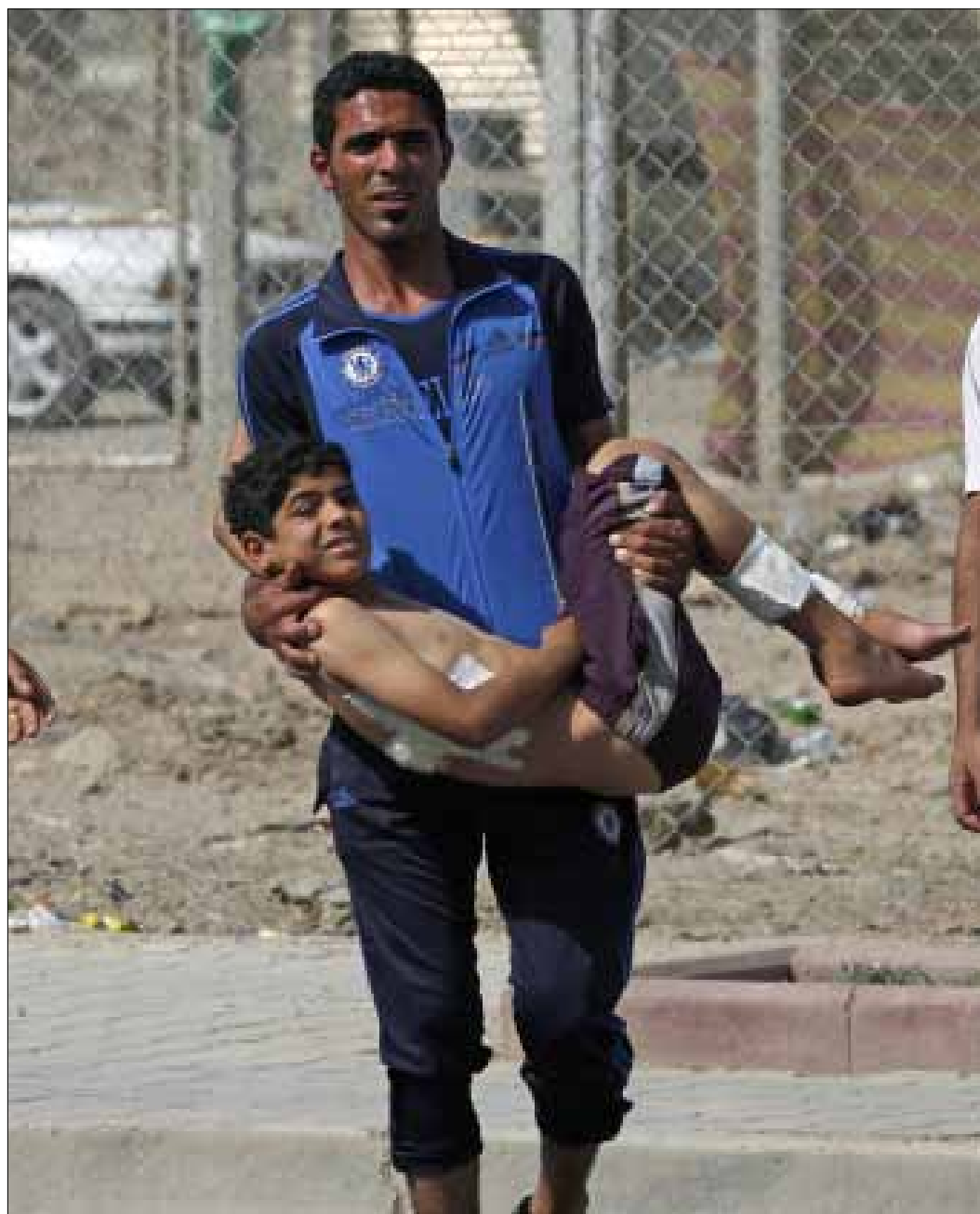
عراقي يحمل أخاه الجريح من جراء انفجار وقع في بغداد أول من امس

أن «هذه القائمة اتفقت مع نائب الرئيس الأميركي جوزيف بايدن على ما يبدو على أن يحصل السنة على إقليم خاص بهم غرب العراق، على شاكلة إقليم كردستان، و 17 في المئة من قيمة الإنتاج القومي من النفط، وأن يعاد الاعتبار لعلاوي الذي سيحول في بغداد إلى حالة شبيهة بجلال طالباني، في مقابل أن يتحول أسامة النجيفي أو صالح المطلق في الأنبار إلى حالة شبيهة بمسعود البرزاني، وذلك في مقابل التمديد للقوات الأميركية حتى عام 2016». بل يتحدث البعض عن محادثات تستهدف ضم كركوك إلى الإقليم السني الفقير بالثروة النفطية، في مقابل ضم دبال إلى كردستان العراق». وبما أن الاتفاقية الأمنية الحالية لا تنص على إمكان التمديد، فإن الأميركيين يصرون على أن يحصل ذلك عبر اتفاقية جديدة تدرم بطلب من السلطات العراقية التي عليها أن تتعهد بموجبها بأن تتحمل مصاريف وتكاليف بقاء هذه القوات في بلاد الرافدين.