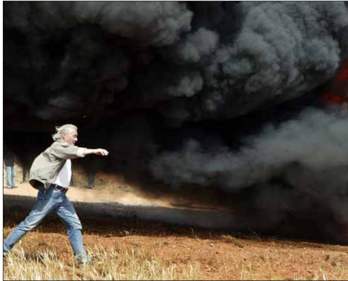
نجدت أنزور خلال تصوير «المارقون»

كثير الحديث أخيراً عن أزمة تسويق تعانها الدراما السورية في رمضان 2011. وأدرجت هذه الخطوة ضمن حملة مقاطعة مزعومة اعتمدها المحطات العربية ضد صناعات الدراما الذين وقفوا إلى جانب النظام. لكن في مقابل ذلك، طالب نجوم سوريون وسائل الإعلام بعدم الحديث عن أزمة التسويق كي لا تصبح حقيقية، بينما لا تحسم أمور البيع في كبرى شركات الإنتاج السورية إلا في الأيام الأخيرة التي تسبق رمضان. هكذا رأى دريد لحام في حديث سابق مع «الأخبار» (راجع عدده 2011/6/15) أن الدراما السورية صارت وجبة أساسية على الموائد الرمضانية، فيما طلب باسم ياخور تجاهل الموضوع وعدم تكرار الحديث عنه. لكن كما هي العادة، كان للمخرج الإشكالي نجدت أنزور رأي آخر مختلف عن زملائه. إذ أصدر المخرج السوري بياناً صحافياً قال فيه إن هناك قراراً عربياً غير معلن يقضي بمقاطعة الدراما السورية، أو شرائها بأبخص الأسعار. وسخر من