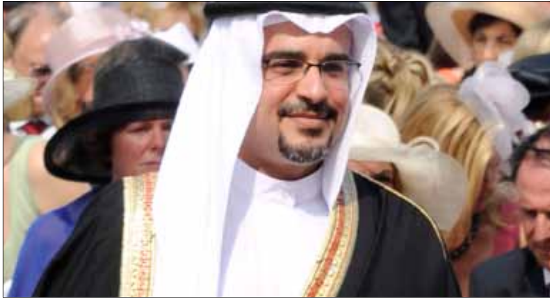
ولي العهد في موناكو الأسبوع الماضي لحضور حفل الزفاف الأميري

وتحدثت مصادر دبلوماسية عن صيغ كثيرة للحل، لعل أهمها تمحور حول تعديل الدوائر الانتخابية، بنحو يتيح للمعارضة رئاسة البرلمان المقبل. لكن الثمن بدا غالياً جداً، حيث بدأت السلطة حملة لتجنيس الآسيويين والعرب بنحو علني وفاضح، ويمكن أي شخص أن