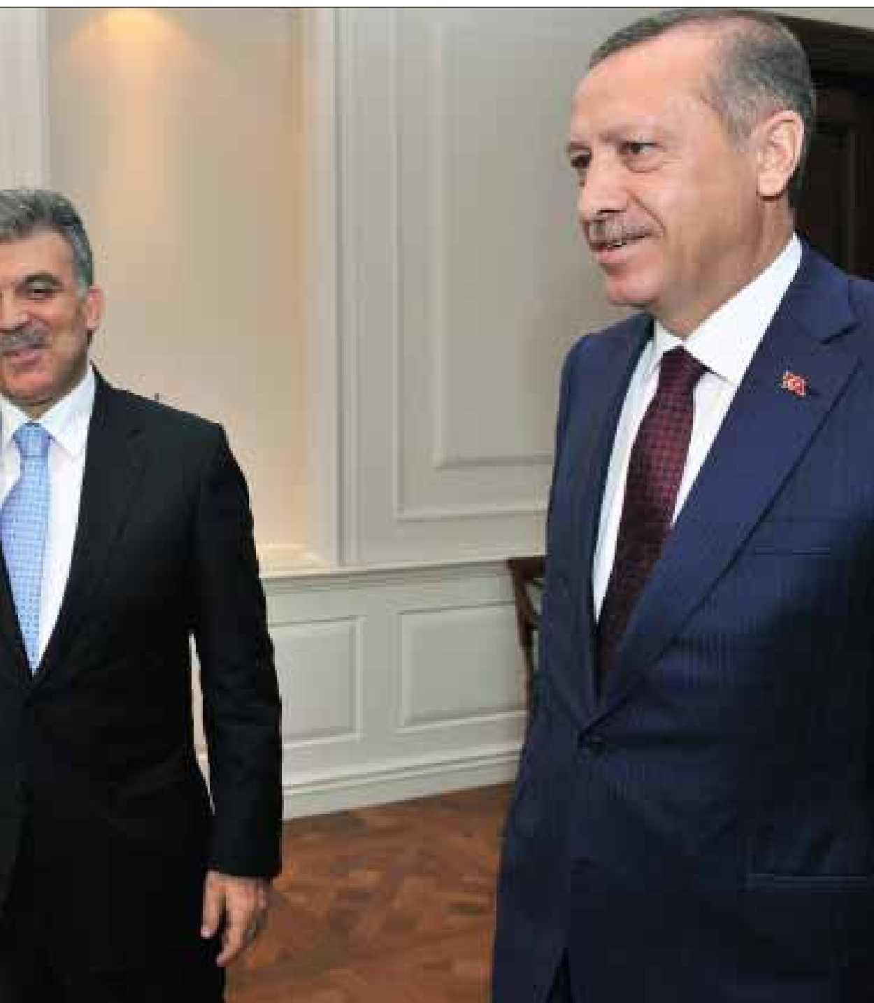
أردوغان وغول في القصر الرئاسي بأنقرة أمس (أ ب)