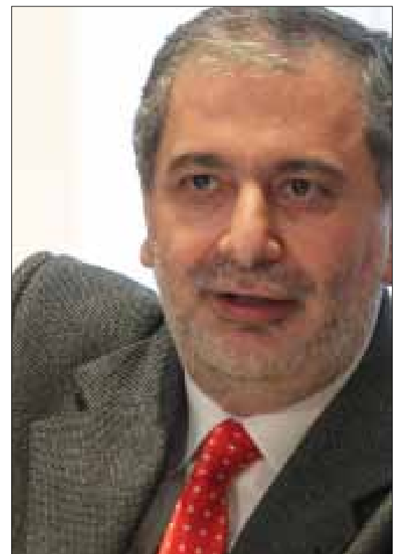
الأمين العام المساعد هاكوب خاجيريان