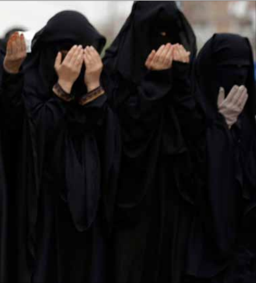
متظاهرات يطالبن باستقالة الرئيس اليمني في صنعاء

أما المرحلة الثالثة، فيمكن وصفها بأنّها كانت مرحلة هزيمة الشعوب وشبابها في ذلك الزمن، على مستوى الثقافة السياسية وتطبيق المبادئ الإنسانية الجامعة. وتعدّ تلك المرحلة الأسوأ على مستوى الحريات العامة وحقوق الإنسان وإقامة دولة القانون. فالشعوب العربية كانت تتطلع، مع بزوغ فجر الاستقلال والتحرر من الاستعمار، إلى بناء دول عصرية يحكمها القانون وأنظمة ومؤسسات ترعى شؤونهم كمواطنين، لكنها انهزمت ولم تفلح لسببين. أولاً: لأنّ معظم حركات الاستقلال تحوّلت إلى انقلابات عسكرية، تدبرها عصابات مسلحة أكثر مما هي حركات شعبية قام بها الناس (1). وثانياً: لأنّ الأحزاب العقائدية التي وصلت إلى السلطة أصبحت أكثر راديكالية بعد ممارستها