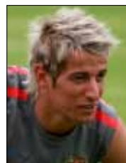
اعتبر كوينتراو مواطنه مورينيو أفضل مدرب في العالم

أتخيل اللعب مع هذا النادي الكبير. لقد تحقق هذا الحلم». في المقابل، سيوقع الأرجنتيني الدولي إيرزيكيال غاراي عقداً لمدة أربعة أعوام سينضم بموجبه إلى بنفكا تاركاً ريال مدريد، وذلك بعد الانتهاء من مشاركته في بطولة «كوبا اميركا»، وهو سيحصل على 5 ملايين يورو إلى الريال الذي سيحتفظ بنسبة 50% من حقوقه الاتحادية.