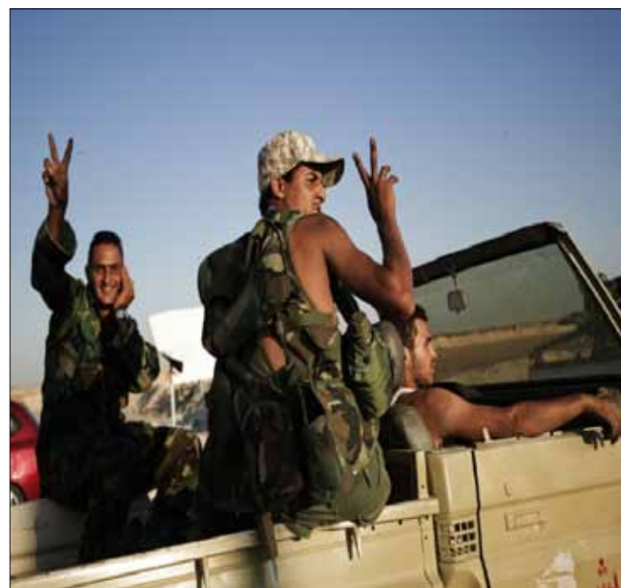
عناصر من المعارضة الليبية قرب اجدابيا