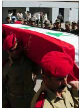
صورة وزعتها «سانا» تظهر تشييع أحد العناصر الأمنية من مستشفى في دمشق

جيرار بابت، أنه ليس هناك رغبة تذكر في المنطقة لمواجهة الرئيس السوري، لافتاً في الوقت نفسه إلى أن «مذبحة أخرى كبيرة في حماه من الممكن أن تؤدي إلى قرار من الأمم المتحدة، لكن من غير المرجح أن ينضم حماية السكان المدنيين بما أن الغرب بالفعل منخرط في العراق وأفغانستان وليبيا». في المقابل، رأى وزير الخارجية الإيراني، علي أكبر صالح، أن الحكومة السورية تعمل على تلبية مطالب شعبها، وأن الأوضاع بدأت تتحسن كما وعد الرئيس السوري. كذلك أشار صالح إلى «ضرورة التمييز بين الانتفاضات الشعبية وتحركات عدة قليلة في بعض الدول بدعم من بعض الجهات لاستغلال الأجواء الحاصلة جراء الثورات الشعبية في المنطقة، كما هي الحال مع الوضع في سوريا»، مضيفاً «إذا كانت لدى غالبية الشعب السوري مطالب مشروعة، ينبغي على حكومة بشار الأسد تلبيةها، وقد فعلت ذلك، ووفت بوعدها بتحسين الأوضاع».