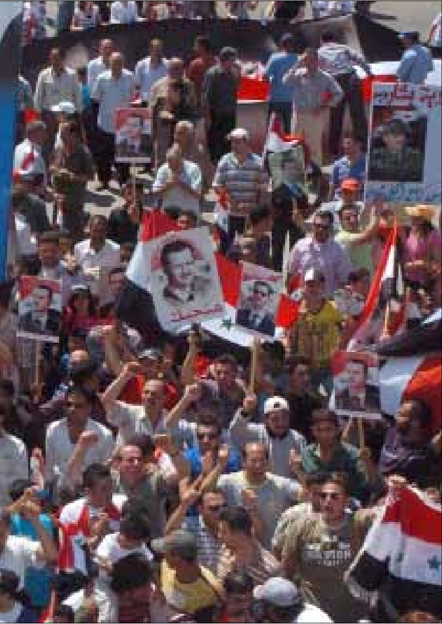
صورة وزعتها وكالة «سانا» تظهر مؤيدين للنظام في مدينة أزرع في درعا أمس (أ ب)

سواء بالعنف أو الحوار سيحد كثيراً من فاعلية هؤلاء الذين ينضمون إلى التظاهرة لكنهم ليسوا من يطلقها. أما المكون الثاني، التنسيقيات، فحدودوا مساء الإثنين الماضي موعداً للقاء «الأخبار» في اليوم التالي عند العاشرة صباحاً. وفي الوقت المحدد عاودوا