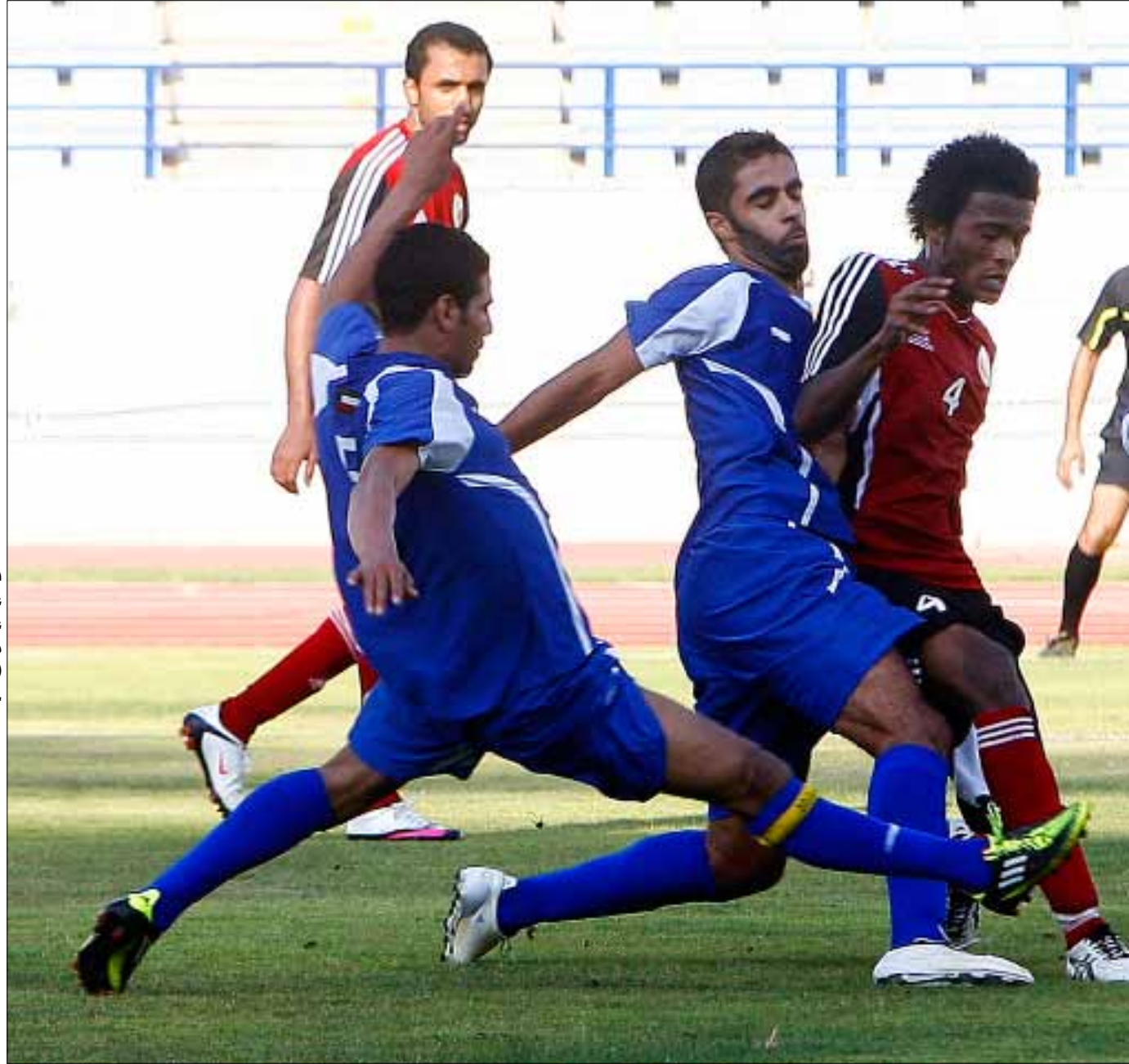
دفاع كويتي على لاعب عماني في مباراة أمس (مروان بو حيدر)

أنهى الاتحاد الدولي لكرة القدم «الفيفا» تحقيقاته في قضية الرشوة المتهم بها رئيس الاتحاد الآسيوي للعبة القطري محمد بن همام، معلناً أن لجنة الأخلاق لديه ستنتظر في القضية في 22 تموز الجاري.