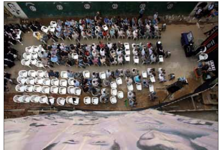
مطلوب من القراء ان يكونوا «شياحيين» منذ أكثر من عشر سنوات

بعد ثلاثة أيام، أتى الردّ مصحوباً بسؤال يتيم «من أي منطقة أنت؟». نجيب: «من الضاحية». إجابة غير شافية، إذ يطرح السؤال مجدداً: «جيد، لكن بتحديد أكثر... شيخ أو شو؟». إذ، هذا هو الشرط