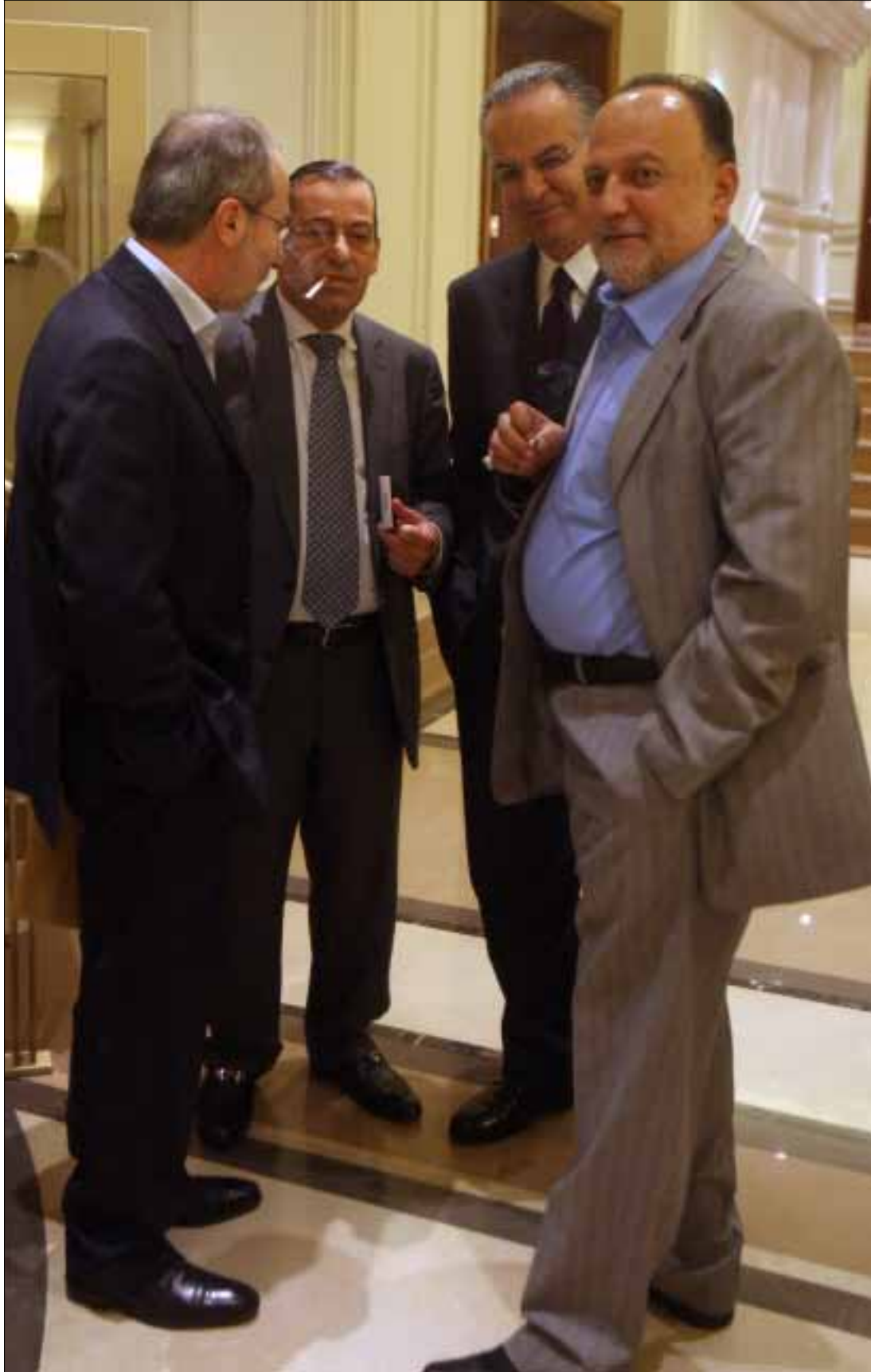
رعد في كتلة القوات اللبنانية! (أرشيف - هيثم الموسوي)

خليل، تنهي المهمة وتعود إلى كرسيها بضع دقائق لتحمل ورقة أخرى وتنتجها صوب وزير الداخلية. خالد ضاهر بحادث خالد زهران. أمام سامي الجميل علبة بونبون وفي يده مسبحة. لا بد من المسبحة حين يكون قاسم هاشم المتكلم. لكن نائب البعث يفاجئ الجميع بانتقاده الشديد للمسؤولين بشأن انقطاع الكهرباء والاتصالات الخلوية في المناطق الحدودية. لكن sil n'est pas avec nous يسأل الوزير نقولا الصحنواوي جاره سليم كرم. تمر ساعتان ومروان حمادة يدرش مع زميله السابق في اللقاء الديموقراطي أكرم شهيب، ينضم إليهما هنري حلو. يبدو حمادة، فعلاً، رئيساً للقاء الديموقراطي. ينتقد سيرج طورسركيسيان تدخل لجنة الأشغال في ترسيم الحدود البحرية، فينصحه بري بأن «بلاقي شغلة غير هالشغلة»، مستغرباً اعتراضه على تعاون المجلس والحكومة. لكن إبداعات طورسركيسيان الذي يثير أجواء المرح في المجلس بمجرد أن يفتح فمه، لا تنتهي هنا. فيقول إن تعثر الحكومة يسره، لكنه بأسف لأن وزارة الاتصالات لا تحول الأموال إلى وزير المال «الذي أنا أصلاً ضده». ياسين جابر فجرها بلفته إلى أن الحكومة أصدرت طابعاً بريدياً لقلعة الشقيف، فيما الرسم على الطابع لسرايا حاصبيا. ضحك المجلس، فيما الرئيس نبيه بري يردد: «يعملها السنيرة». أما الرئيس ميقاتي فتطوى ورقة جابر ودسها في جيب سترته. فيما كان رياض رحال ينهي إحصاء الحاضرين ويسرّب إلى عاطف مجلاني ورقة كتب عليها: «الحاضرون هنا مئة، 49 موالياً مقابل 51 معارضاً، لولانا لما توافر النصاب». يتوسط بري فريد مكاري وأنطوان زهرا. اشتاق حرب إلى مقاعد الوزراء، فزار علاء الدين ترو. تنهض ستريدا