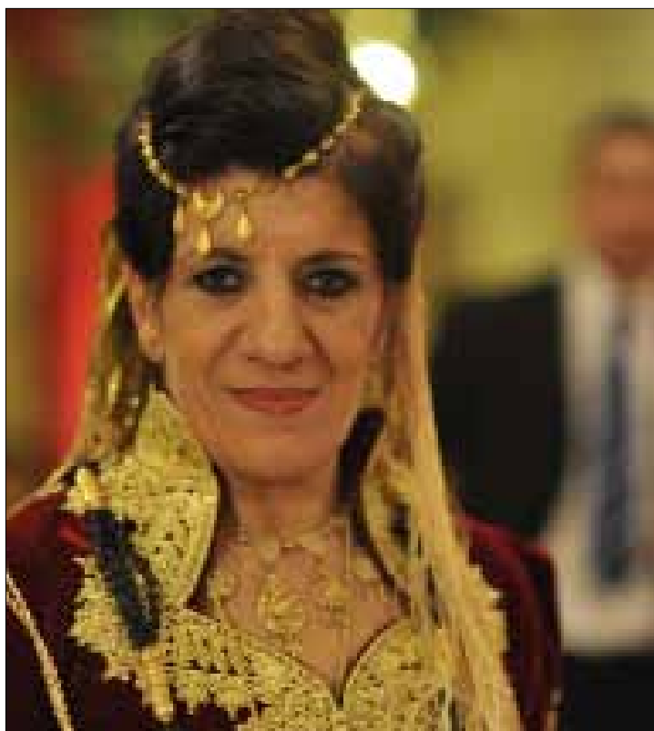
تقدم بيونة برنامج يومي بعنوان «بيونيات»

قناة «بور تي في» التي ينتظرها المشاهد الإعلامي الجزائري بشغف، لن تكون الفضائية الجزائرية الخاصة الأولى. قبل سنوات قليلة انطلقت قناة «خليفة»، التي يملكها رجل الأعمال الجزائري الشاب عبد المومن خليفة، من باريس. ثم أطلق قناة إخبارية استقطبت عدداً كبيراً من الإعلاميين الجزائريين والعرب، لكن القناة بفرعها الإخباري والترفيهي توقفت بمجرد تفجر ملف ما يسمى في الجزائر «فضيحة القرن»، التي أدت إلى انهيار إمبراطورية رجل الأعمال الشاب، الذي يقبع اليوم في أحد سجون بريطانيا بتهم فساد وإفلاس احتيالي.