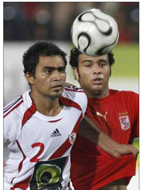
خاطب الاتحاد الأندية لتوفير أوضاعها