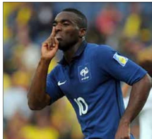
جبل سونو بعد تسجيله هدف فرنسا الأول

خرجت كولومبيا مضيئة كأس العالم للشباب في كرة القدم، فائزة ثانية لتقرب كثيراً من دور الـ 16، فيما تربعت البرتغال على صدارة المجموعة الثانية