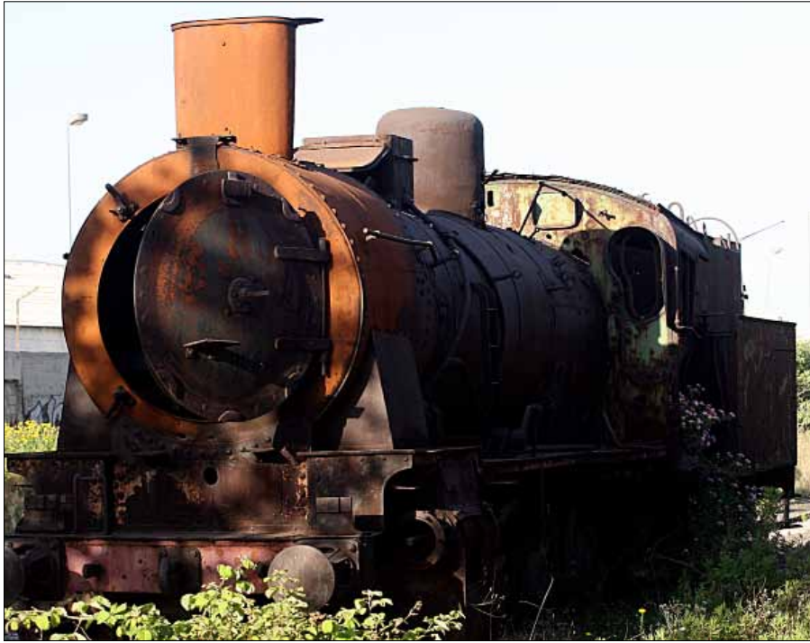
الحل يكمن في التوقف عن تعبيل الطرقات مقابل تقوية النقل المشترك

خطوط باصات القطاع العام». ويضيف: «كل ذلك أدى إلى اضمحلال دور قطاع النقل العام لمصلحة الناقلين وشركاتهم المنقعة بأسماء وهمية». يذكر «أن سائقي باصات مصلحة قطاع النقل العام كانوا يتعرضون للضرب على أيدي سائقي الزنقوت، في محاولة منهم لمنعهم من متابعة سيرهم».