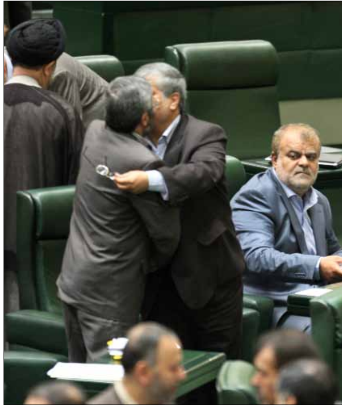
نواب إيرانيون خلال جلسة البرلمان أمس في طهران

صارم من القوى الغربية. وبالإضافة إلى قاسمي، يخضع ثلاثة مسؤولين رفيعي المستوى في الحكومة الإيرانية، لعقوبات دولية على علاقة بالبرنامج النووي، وهم وزير الخارجية علي أكبر صالح (على لائحة الاتحاد الأوروبي) ووزير الدفاع أحمد وحيد (عقوبات أميركية وأوروبية) ونائب الرئيس فريدون عباسي - دواني رئيس المنظمة الإيرانية للطاقة الذرية، المدرج على لائحة المسؤولين الذين فرضت عليهم الأمم المتحدة عقوبات بعدما دانت البرنامج النووي الإيراني في سنة قرارات منذ 2006.