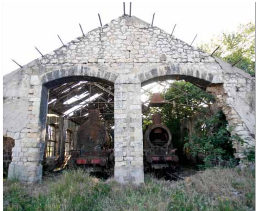
محطة القطارات المتوقفة في الشمال

لم يعد سراً على المواطنين، الذين انتظروا خطوات ملموسة منذ انتهاء الحرب الأهلية، أن ثمة من يريد القضاء على قطاع النقل العام. ويشرح فلطي أنه عام 1997، جرى «شراء 200 باص كاروسا دون المواصفات الفنية، ولا تتعدى مدة استهلاكها الأربع إلى الخمس سنوات، أطلقت على 27 خطأ في مدينة بيروت وضواحيها، مقابل دعم بعض الناقلين لشركات النقل الخاصة، عن طريق إعطائها 20000 متر مربع من مصلحة سكك الحديد والنقل المشترك في ساحة العبد، ببدل ألف ليرة رمزية في السنة لمدة عشر سنين، والسماح لها بالسير على