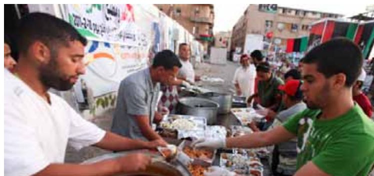
توزيع طعام الإفطار الرمضاني في بنغازي

حظر الأسلحة على ليبيا. ونقلت وكالة الأنباء الإيطالية «أكي» عن لاروسا قوله في مؤتمر صحافي إن «صاروخاً أطلق صباح اليوم الأربعاء (أمس) من الأراضي الليبية ضد سفينة تابعة لبحريتنا تلتزم بمهمة حماية السواحل» بموجب قرار صادر عن مجلس الأمن الدولي. وأضاف أن «الصاروخ سقط في البحر بعيداً على مسافة كيلومترين من سفينتنا بيرساليري». لكن السفينة ابتعدت قليلاً باتجاه عرض البحر لأسباب أمنية. وقال إنه «ليس من الواضح إن كان الصاروخ قد أطلق نحو البحر، أو أنه صاروخ مضاد للطائرات لم يُصَب هدفه فسقط في الماء». ميدانياً، تمكن ثوار مدينة زليتن الليبية من صد هجوم مضاد شنته كتائب العقيد