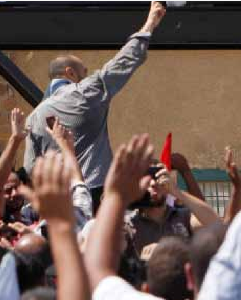
مصريون يتابعون مشهد مبارك في قفص الاتهام من أمام كلية الشرطة في القاهرة

اليد تلعب في الرأس، تُنظف الأنف، وتشكل علامة حكمة تحت الذقن، وتوضع خلف الرأس، أو ينادى بها على الابن الأسرع في الاستجابة: جمال، المذنب، يحاول أن يحمي أبيه. أشار إلى الحراس المدنيين بالانتباه إلى مكان الكاميرات، وأدى دور الحارس بالتناوب