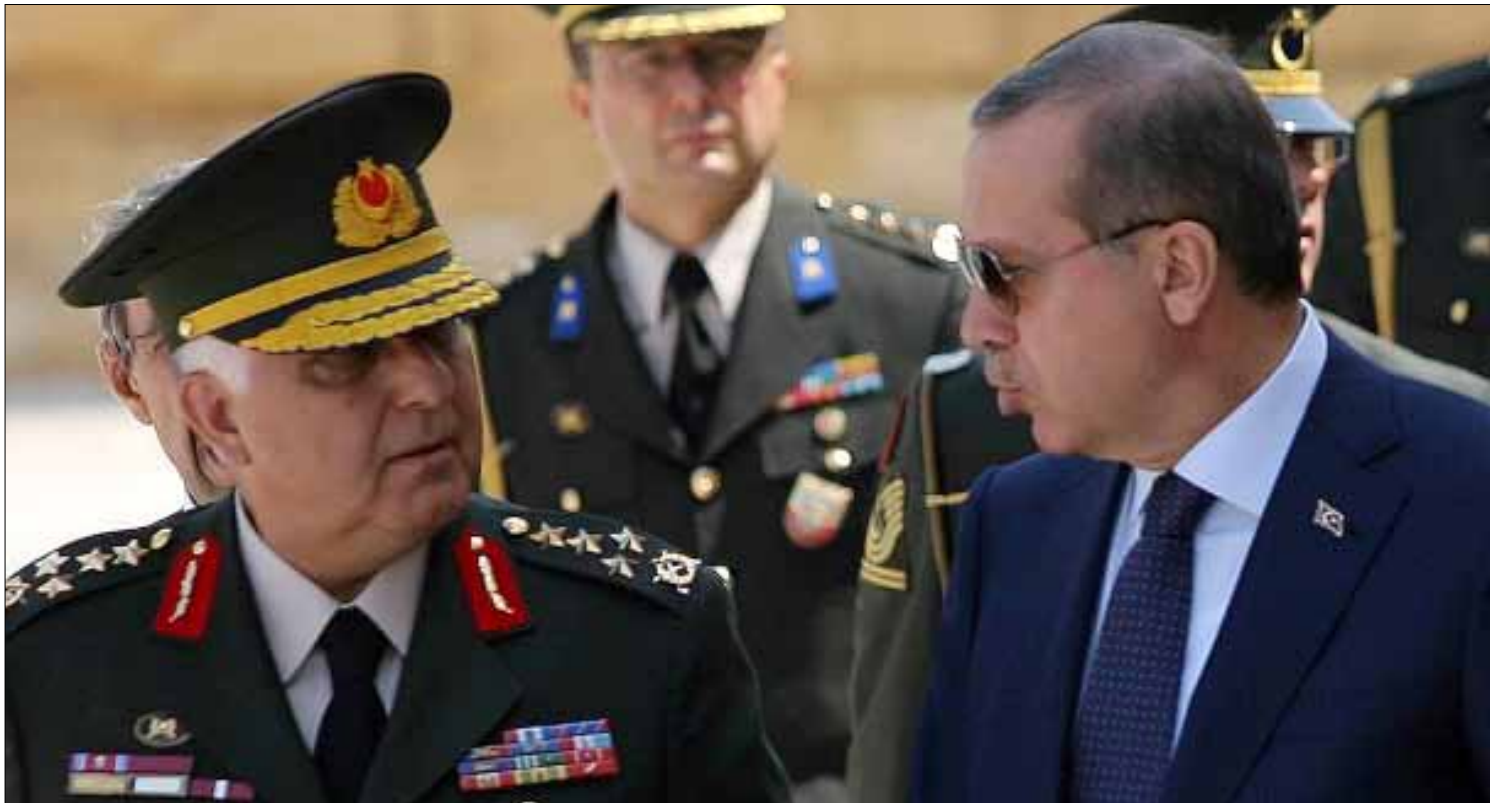
أردوغان والجنرال أوزل في أول اجتماعات المجلس العسكري في أنقرة يوم الاثنين (أ ف ب)

الكلمة الأولى والأخيرة في الشأن السياسي من جهة ثانية. مشروع التحديث يتعلق بموازنة الجيش وألية الترقيات والخدمة الإلزامية وهيكلية الألوية والصفة القانونية وسلطة الوصاية... بينما يعلن الرئيس عبد الله غول اليوم قرارات «المجلس العسكري الأعلى» لتكريس إرادة السياسيين على أصحاب البرأت المرفقة