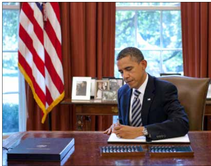
الرئيس الأميركي أوباما يوقع على القانون في البيت الأبيض

«سيترتب على الأرجح اتخاذ تدابير إضافية لضمان بقاء مسار الميزانية على المدى البعيد متناسباً مع علامة اي اي اي»، مشيرة إلى «خلافات سياسية واسعة في وجهات النظر» في الجدل القائم في واشنطن. وأضافت «إن خفض معدلات النمو الاقتصادي أخيراً ونسبة النمو الضعيفة جداً في النصف الأول من عام 2011 يعيدان النظر في متانة طاقات النمو خلال السنة المقبلة أو السنتين المقبلتين».