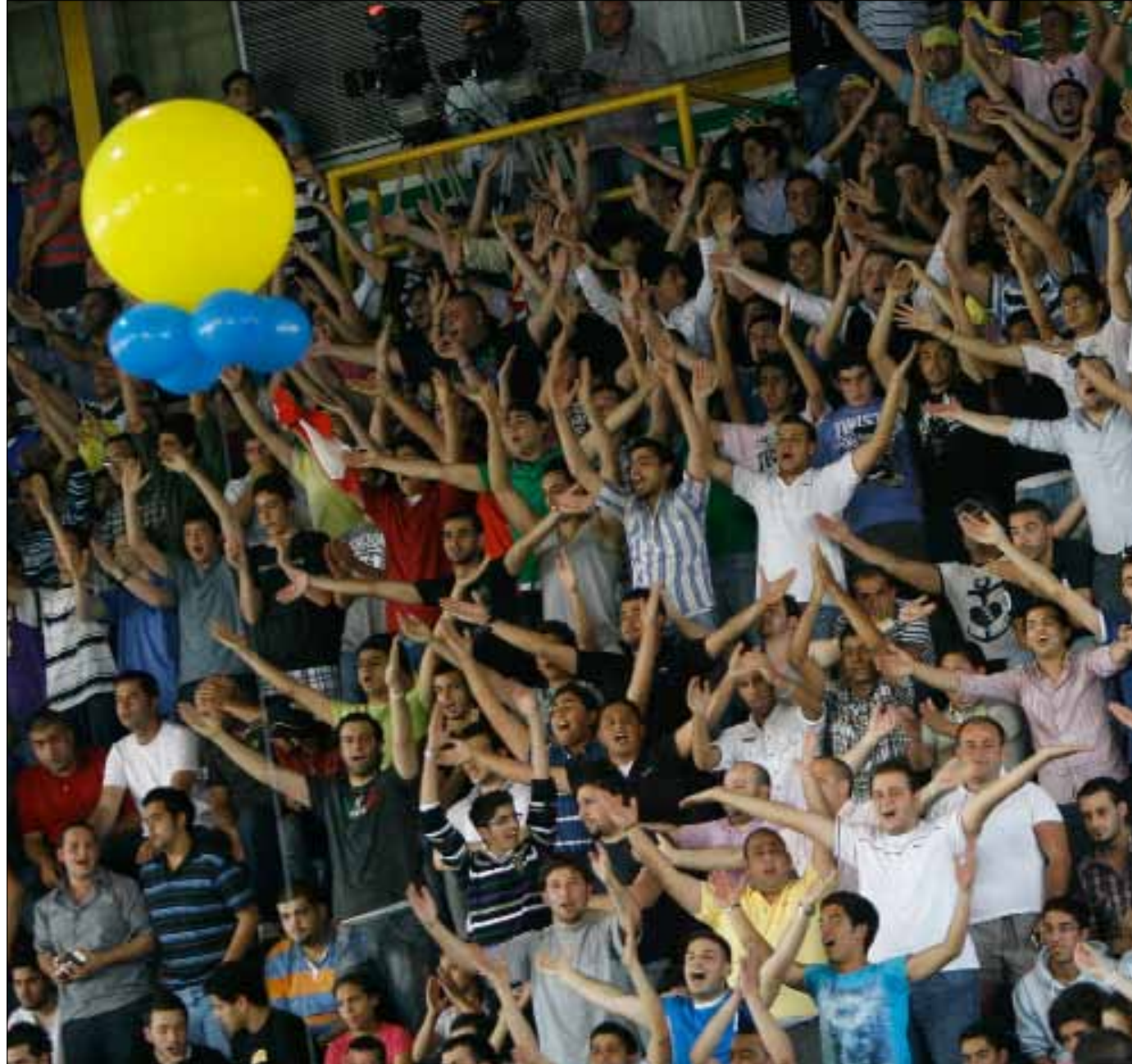
المحافظة على الجمهور وضبطه من أهم عناصر تطوير اللعبة

بسلبية مع اجتماع دام ثلاث ساعات وحمل طابعاً إيجابياً تجاه اتحاد اللعبة، وجرى التطرق فيه إلى أمور كثيرة يجب على الاتحاد سماعها، أو الاستفسار من بعض الأعضاء الذين كانوا حاضرين. وعليه، فإن الأندية بانتظار أن يقوم الاتحاد بالخطوة المتوقعة وتحمل مسؤوليته تجاهها فالفكرة أصبحت الآن في ملعبه كما يقول قانصوه تعليقاً على ما هو منظر.