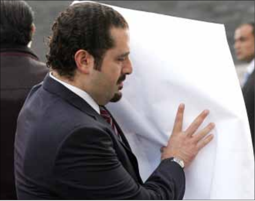
الحريري لن يعود إلى بيروت ولا إقطارات تنتظره

بقاء الحريري في السعودية في الوقت الحاضر، وربما إلى وقت غير محدد، وترتبط مباشرة بموقف المملكة؛ أولها، عدم رغبتها في تعكير عمل حكومة ميقاتي بعد تجاوزها الشكوك التي أحاطت بتأليفها، والحرص على إبقاء الاستقرار السياسي في لبنان في حدود دنيا من الثبات، إذا لم يكن في الإمكان تجنبه تردّدات الأوضاع