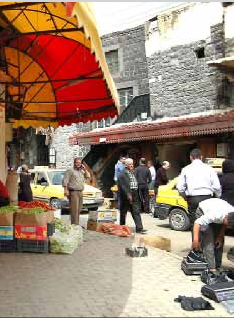
الاستهلاك في سوريا عند حدود دنيا فيما السياحة معدومة