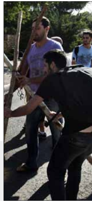
متحتجون يغلقون الطريق المؤدي الى الكنيسة في القدس المحتلة أمس

تبنى البرلمان الإسرائيلي، أمس، قانوناً يتعلق بالإسكان قُدِّمته الحكومة، رغم تهديد الحركة الاحتجاجية الاجتماعية التي انطلقت في منتصف تموز بسبب غلاء المعيشة والسكن، بتصعيد تحركها إذا جرى التصويت عليه. وأوضحت مصادر برلمانية أنه تم التصويت لصالح القانون في القراءة الثالثة والأخيرة، أول من أمس، بـ 57 صوتاً مقابل 45. كما أفادت الإذاعة العامة الإسرائيلية بأن رئيس الوزراء بنيامين نتنياهو ركب بالقانون، قائلاً إنه «يسمح بتسهيل البدء ببناء العديد من المساكن». وبحسب القانون، تقوم «لجنة فرعية وطنية للبناء» مسؤولة عن النظر في مشاريع الإسكان بالموافقة عليها. وتضم اللجنة خصوصاً ممثلين عن مكتب رئيس الوزراء ووزارة الداخلية، إلا أن قادة التظاهرات يتخوفون من أنه قد يروج للمساكن الفخمة، بدلاً من المساكن المنخفضة الثمن. بدوره، أوضح المتحدث باسم نتنياهو، غادي شميرلينغ، أن القانون الذي يتضمن إجراءً جديداً لتسريع الحصول على رخص للبناء يهدف إلى «خفض تكلفة المساكن كما يطالب المشاركون في حركة الاحتجاج»، فيما أعلن رئيس