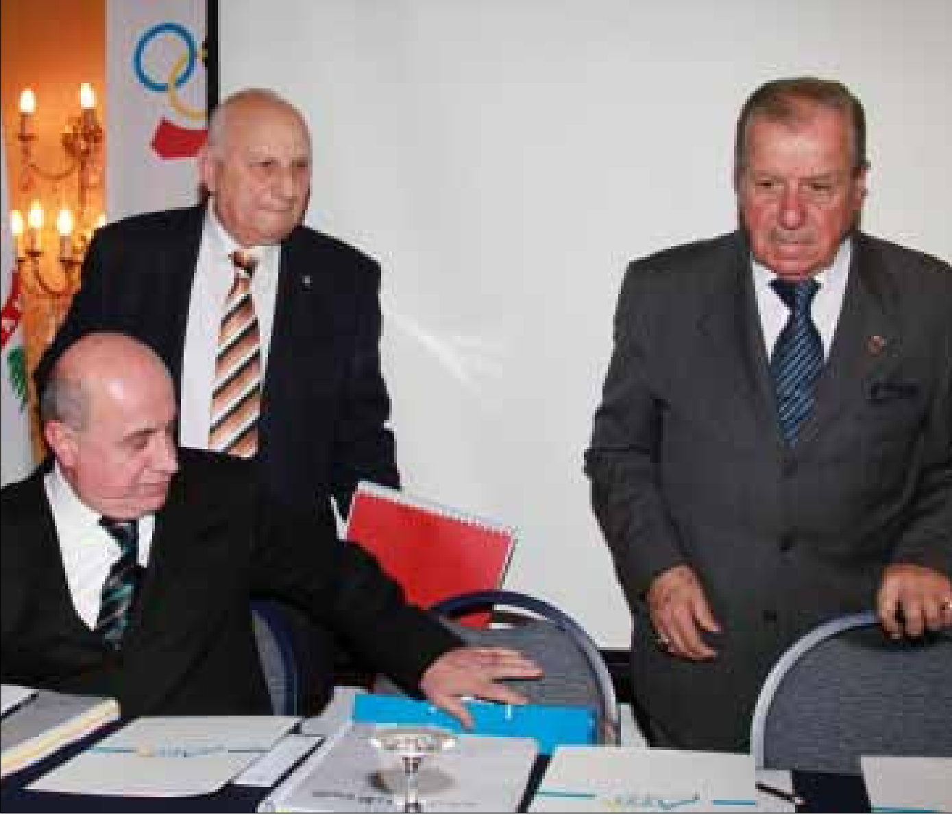
هل بدأت نهاية اللجنة الأولمبية اللبنانية؟