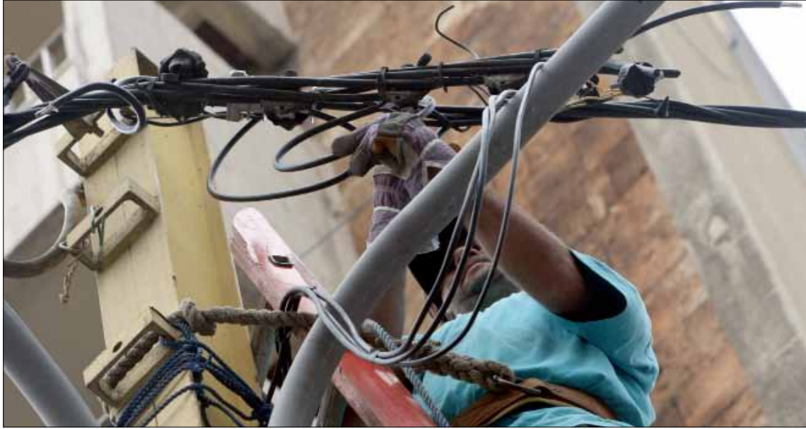
7% زيادة الطلب على استهلاك الكهرباء سنوياً

ويضيف الوزير بأسيل أن بعض النواب لم يقرأوا الخطة، ولا يعرفون على ماذا سيوافقون، «فهل سيفهمون الخطة خلال هذا الأسبوع بعد إجراء دورة مكثفة في الكهرباء».