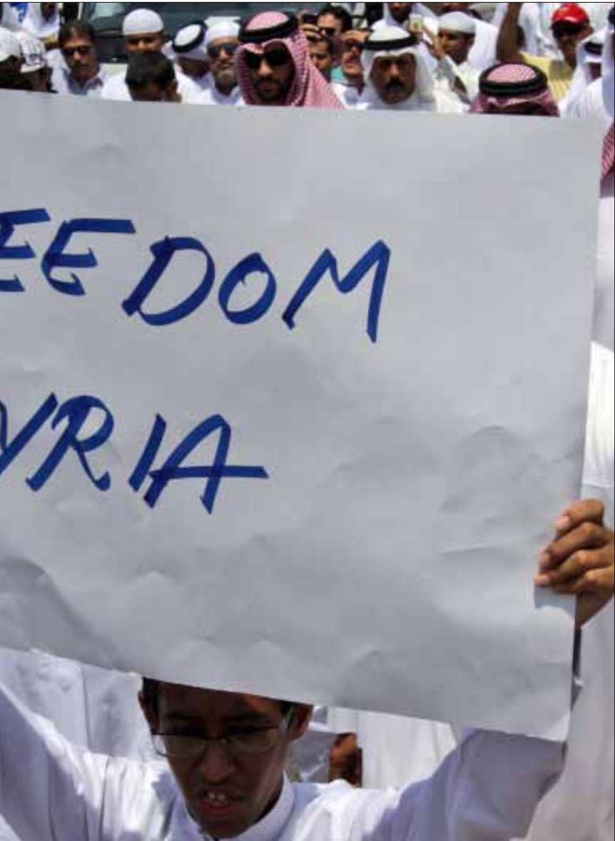
متظاهرون في البحرين تضامناً مع الشعب السوري أمس

وضع الفنان التشكيلي السوري المعارض، يوسف عبدلكي (الصورة)، ما أشاعه الإعلام الرسمي السوري عن انسحاب وحدات الجيش من بعض المدن والمناطق السورية في خانة «المحاولة البائسة لكسب بعض الوقت ليس أكثر، وما أشيع عن مدة الأسبوعين التي منحتها أنقرة للنظام السوري ما هو إلا مادة إعلامية لا تمتلك أية قيمة حقيقية على أرض الواقع». ورأى المعارض السوري أن الممارسات القمعية التي تتعامل بها السلطة مع الشارع «لم تعد مجدية أمام شعب اعتاد هذه الأساليب القمعية»، متوقفاً خروج تظاهرات كبيرة في الأيام القليلة المقبلة والمزيد من القمع والتصعيد في الممارسات الأمنية. لا يعترف عبدلكي بأهمية مجمل الحراك السياسي الدولي، ويحتمل النظام مسؤولية ما ستؤول إليه الأمور «بعدما رفض العديد من الطروحات وأوراق العمل التي قدمت له»، معرباً عن تشاؤمه؛ لأن «هذا النظام سيقدونا حتماً نحو شلال من الدماء».