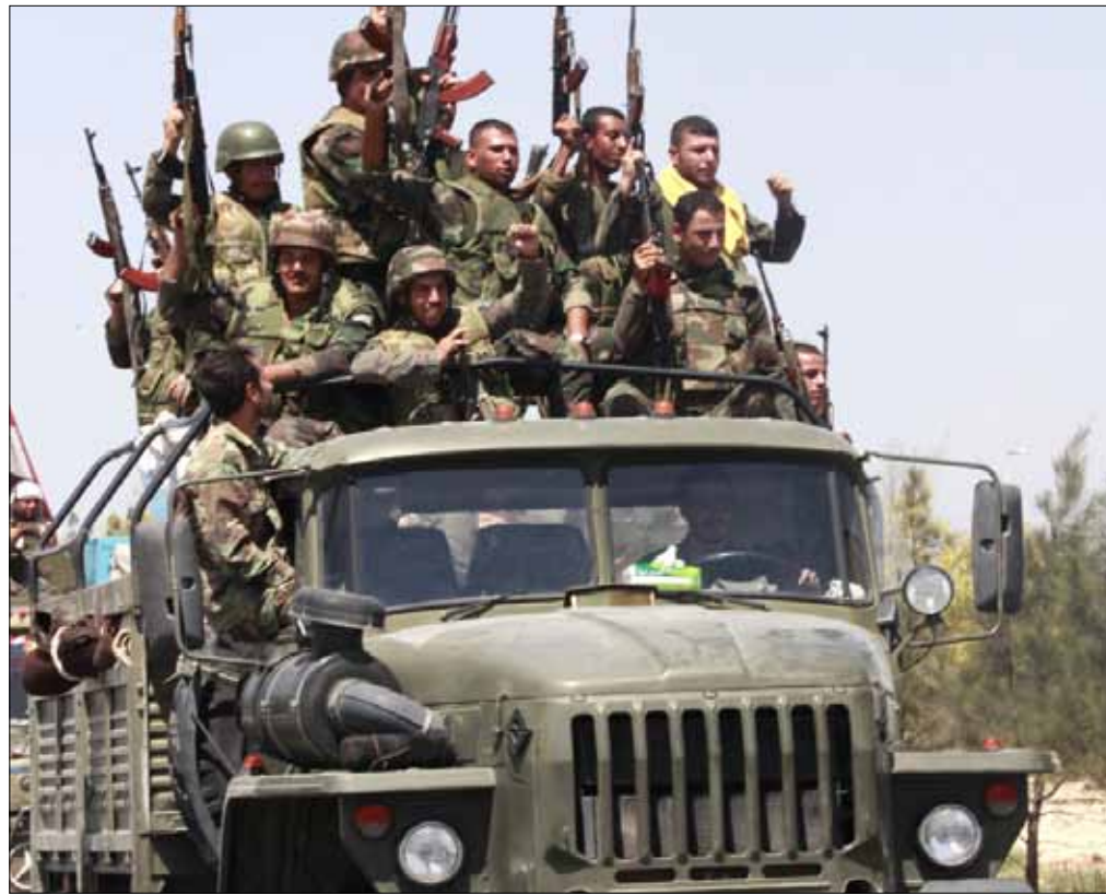
الجيش السوري منسحباً من حماه

الحاج صالح مقالة بعنوان «حماس وعبّاس والشيطان» في جريدة «الجريدة»، عثر فيها بصراحة عن آرائه في الصراع العربي - الإسرائيلي. رأى أن «القوة الناعمة» هي أفضل طريقة لتحرير فلسطين، أي أنه نصح لحركة المقاومة بانتهاج الخطب والدبلوماسية في مواجهة إسرائيل. (لم يدع - كي أكون أميناً - الشعب الفلسطيني إلى تغيير النشيد الوطني الفلسطيني إلى «هزي يا نواعم»). يرى الحاج صالح في «القوة الناعمة» رفعة «أخلاقية». يحذو حذو فؤاد السنيورة في تفضيل «النضال» الحضاري. ولو قرأ الحاج صالح كتاب جوزف ناي، بدلاً من أن يقرأ عنه، لعلم أن الكاتب اجترح المفهوم كوصفة لإحكام السيطرة الأميركية حول العالم، لا كوسيلة تحرير من الاحتلال.