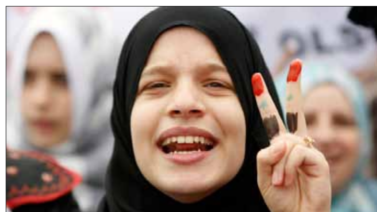
سورية تشارك في تظاهرة ضد النظام في اسطنبول أمس

كذلك وجه وزير الخارجية الإيطالي، فرانكو فراتيني، «نداءً قوياً إلى السلطات السورية للإفراج فوراً» عن الريحاوي. وأعرب عن الأمل أن يقوم مجلس حقوق الإنسان التابع للأمم المتحدة بـ«إسماع صوته لدى سلطات دمشق لإطلاق سراح عبد الكريم ريحاوي عبر الانضمام إلى