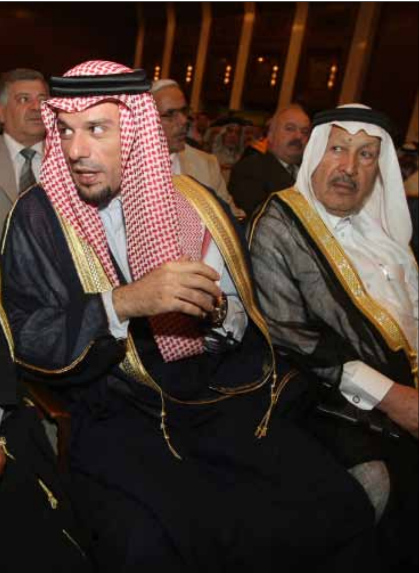
اجتماع لمجلس الصحو في الأنبار

وكانت الفصائل العراقية حينها أقل عدداً من اليوم، أهمها: جيش محمد، الجيش الإسلامي، تنظيم التوحيد والجهاد (الذي تحول لاحقاً إلى القاعدة)، كتائب النعمان، جيش الفاتحين، كتائب ثورة العشرين، فصائل الناصر صلاح الدين. ونظم المعركة الأولى ضابط سابق من الجيش العراقي، تمكن من مقارعة الأميركيين ومنعهم من دخول المدينة طوال فترة المعارك، ثم أتى تنظيم القاعدة على خلفية المعركة الأولى لينتشر في المدينة، وبدأ توافد المقاتلين الأجانب من مختلف الاتجاهات لمصلحة تنظيم القاعدة، ومن لم يكن منهم من تنظيم القاعدة اضطر إلى الالتحاق بالتنظيم