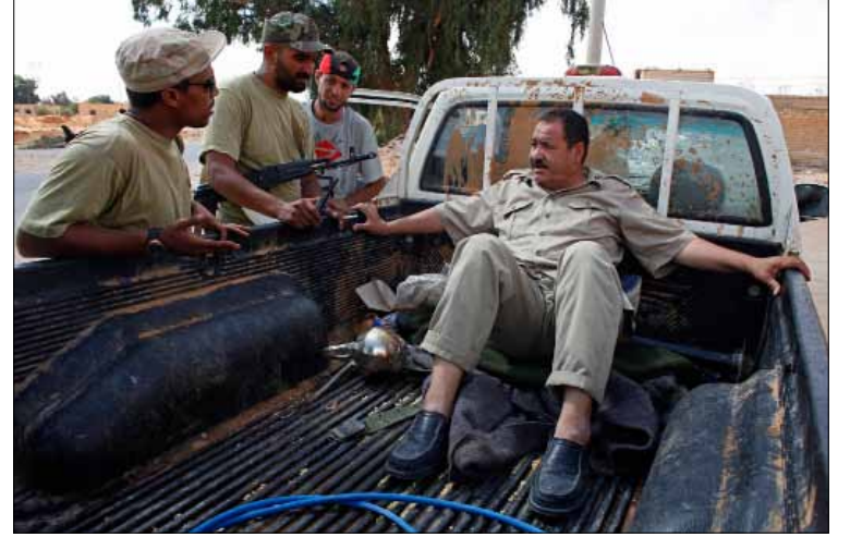
الضابط الليبي المعتقل لدى الثوار كما بدأ أمس

يبدو أن التطورات الميدانية على الأرض الليبية، التي تتجه لصالح قوات المعارضة، قد وضعت الطبقة الحاكمة أمام مصيرها المجهول فباتت تقتنص الفرص من أجل الاحتفاظ بما توفر من مقتنيات للحكومة قبل مصادرتها تحت عنوان قرارات العقوبات