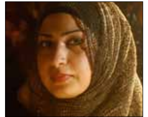
«شي فاضل» أمام السفارة السعودية

يروى المختار كما يروي سواه قصة استغلال كبير يحصل ومتاجرة