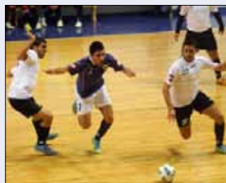
من لقاء الفريقين في نهائي الدوري الماضي