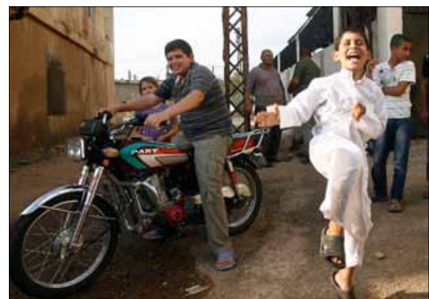
اطفال يلهون في وادي خالد