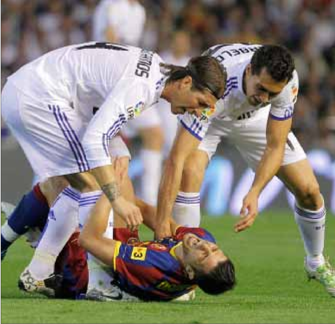
حفلات لقاءات ريال مدريد وبرشلونة في الموسم الماضي بكل أنواع المواجهات

تاريخياً يعد ملعب «سانتياغو برنابيو» الأصعب لبرشلونة، لكن ليس للمدرب غوارديولا الذي منذ تسلمه الفريق لم يخسر هناك، محققاً ثلاثة انتصارات مقابل تعادل واحد، وهو في زيارته الأولى للملعب المذكور فاز فريقه 6-2 في موسم 2008-2009، ثم أتبعه بفوز 0-2 في الموسم الذي تلاه. أما الموسم الماضي فشهد تعادلاً 1-1 في «الليغا» وفوزاً 0-2 في دوري الأبطال.