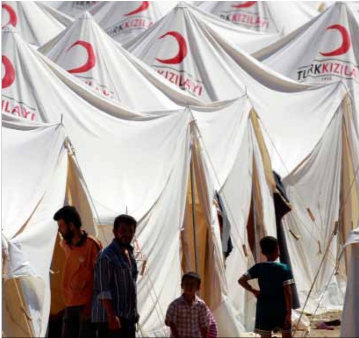
مخيم اللاجئين السوريين عند الحدود التركية

ونقل صاحب التقرير، الصحافي إركان يافوز، عن «مصادر مسؤولة» تأكيداً أن المسؤولين يتوقعون أن يرتفع عدد اللاجئين السوريين في مخيمات اللجوء التركية التي لا تزال محصورة بمحافظة هاتاي، والتي يتوقع البعض أن تمتد إلى ماردين وكيليش، إلى أرقام لا يتوقعها أحد، «بدليل أن هناك 17 ألف لاجئ في طريقهم حالياً إلى الأراضي التركية لينضموا إلى اللاجئين الـ 7239 الموجودين أصلاً في تركيا»، ما يذكر بما حصل بعد حرب الخليج الثانية حين استضافت تركيا عشرات الآلاف من اللاجئين العراقيين، وخصوصاً الأكراد منهم من دون أن تتلقى أي مساعدة أجنبية على هذا الصعيد. وبحسب التقرير، أصدرت رئاسة أركان الجيش