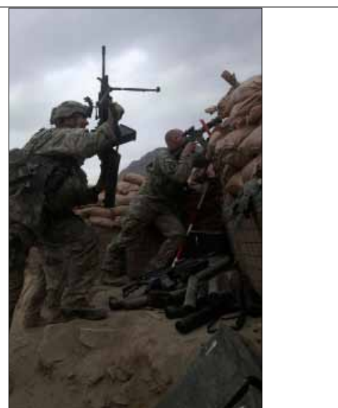
في وادي الموت (رفيق مقبول - أ ب)

ومع اشتداد الضغط الأميركي في معارك الفلوجة الثانية، يروي السكان أن عناصر القاعدة العرب والأجانب تجمعوا في أحد أطراف المدينة ذات