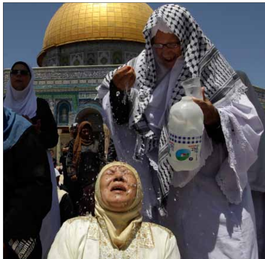
منى تعود القدس إلى الفلسطينيين؟

أولاً: تقرير المصير حق تقرير المصير هو أهم الحقوق الأساسية وغير القابلة للتصرف للشعب الفلسطيني. إنّ إنهاء الاحتلال ما هو إلا إحدى ركائز ممارسة ذلك الحق. إنّ حق تقرير المصير المتمثل في الحالة الفلسطينية بمنظمة التحرير الفلسطينية ويعرف عادة بأنه حق «جميع الشعوب... في أن تقرر بحرية وبلا تدخل خارجي مركزها السياسي والسعي إلى تحقيق التنمية الاقتصادية والاجتماعية والثقافية»، وهو حق لكل الفلسطينيين، بغض النظر عن موقعهم الحالي، بحكم القانون الدولي ومبادئ السيادة الشعبية والديموقراطية. فجميع الفلسطينيين، بمن فيهم اللاجئون في الشتات والمواطنون