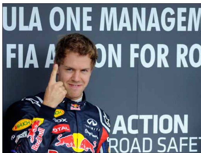
بطل العالم الألماني سيباستيان فيتيل

موضع تحقيق 3 انتصارات اخرى في السباقات المقبلة». وتتعقياً على قول فيتيل بأنه سيواصل هجومه وتحقيق الانتصارات، قال هورنر: «هذا