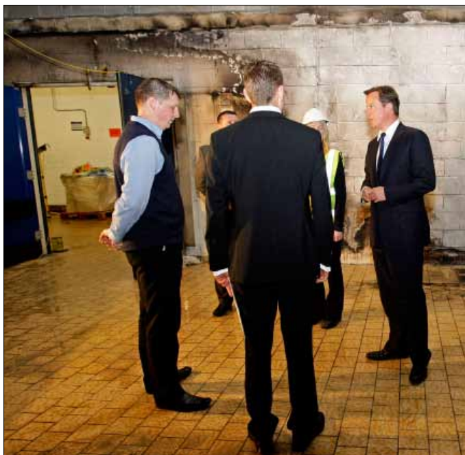
كاميرون يزور احد المتاجر التي تعرضت للنهب وأعمال الشغب

الشغب التي لحقت بنظام العدالة قد تصل إلى أكثر من 100 مليون جنيه استرليني، حيث من المقرر أن تتعامل المحاكم مع ما لا يقل عن 1300 شخص ستوجه الشرطة تهماً ضدّهم لتورطهم بأعمال الشغب والنهب. وسط هذه الأجواء، تنقسم الآراء في بريطانيا بشأن دوافع موجات النهب والاحراق العمد، ويخشى كثيرون من انه اذا تم تقليص حجم قوات الشرطة ضمن سياسة خفض الإنفاق التي تنتهجها الحكومة فإن البلاد ستشهد مزيداً من المخاطر اذا تفجرت قلاقل جديدة. وفي هذا الإطار، يواجه رئيس الوزراء