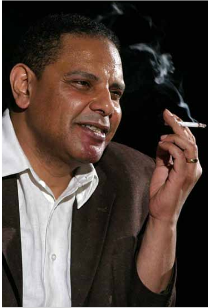
نفي علاء الأسواني أن يكون قد شكك في وطنية يسري فودة

بداية الأزمة كانت أول من أس عندما بعث علاء الأسواني رسالة إلكترونية هاجم فيها يسري فودة، متهماً إياه بالانضمام إلى فلول نظام مبارك. وأضاف الكاتب المصري أن فودة أغلق الهاتف في وجهه مساء الأربعاء الماضي، عندما حاول الاتصال ببرنامج «آخر كلام» للردّ على التصريحات التي أدلى بها ضيف الحلقة حسام بدرابي. وهذا الأخير قيادي بارز في «الحزب