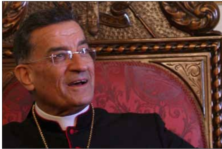
أرشيف - هيثم الموسوي

وعن احتمال زيارته لسوريا، أشار إلى أنه «واجب على البطريرك زيارة كل الأبرشيات مرة كل خمس سنوات، وهذا ما نقوم به الآن. أنا علي أن أزور أبرشياتنا في سوريا وفي الأردن وفي قبرص وفي مصر وفي الأراضي المقدسة، وسنذهب لاحقاً إلى كندا وأستراليا».