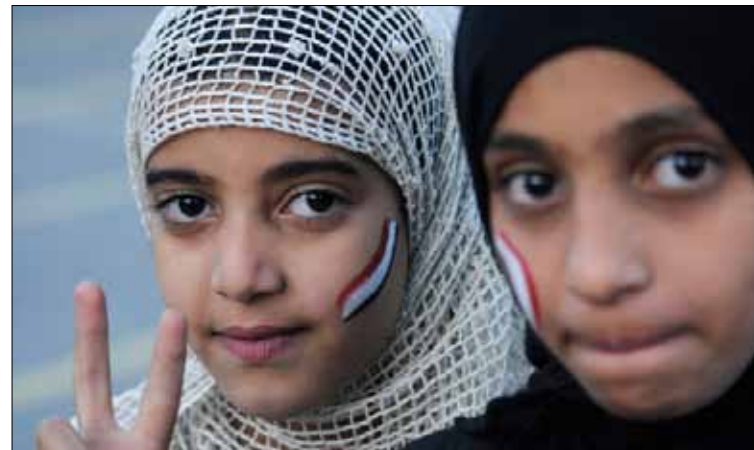
المراقبون يستبعدون أقدام صالح على إعلان الحرب على كل الجبهات

كبيرة في الجيش، الذي لا يزال في صف صالح وأقاربه، وذلك بالنظر إلى غياب الروح القتالية والمعنوية لجنود يدركون أنهم يخوضون حرباً عبثية لإنقاذ فرد وحكم عائلية، على العكس من دوافع حرب صيف عام 1994 التي كان هؤلاء الجنود