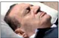
الاقتصاد من مبارك... «طبعاً ممكن» 02:00 ■ «القناة المصرية الأولى»