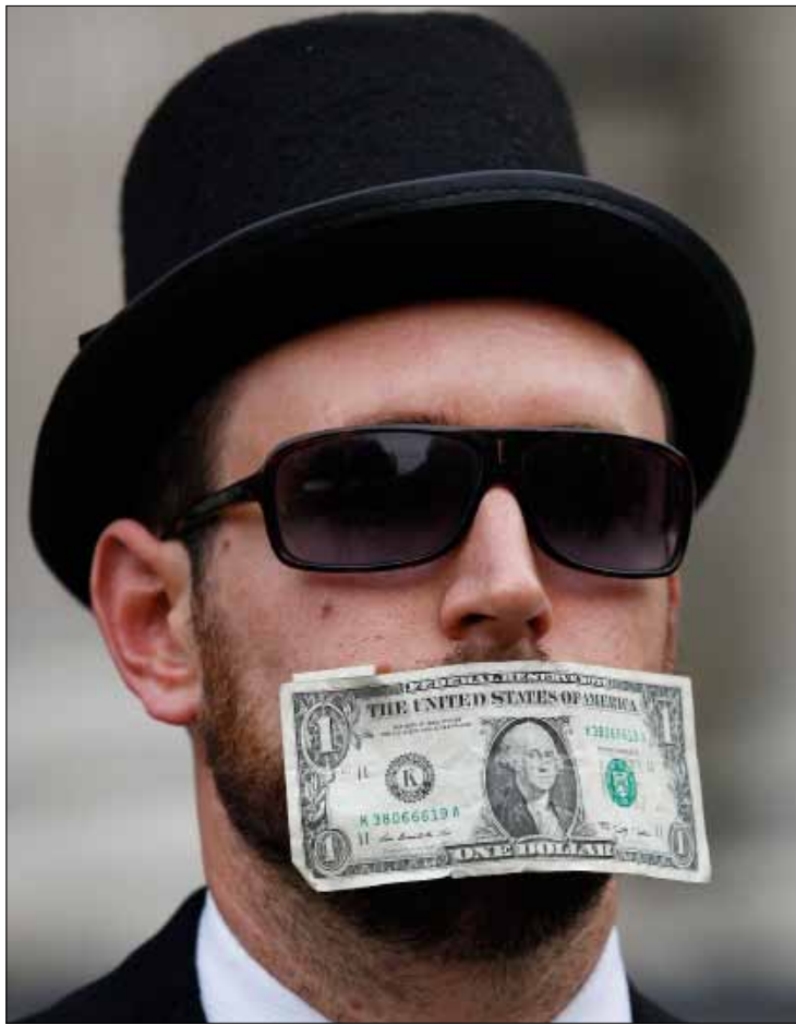
امام كاتدرائية سان بول وسط لندن

ساحة الكاتدرائية تقفل للمرة الأولى منذ الحرب العالمية: مطالبنا ستتحقق