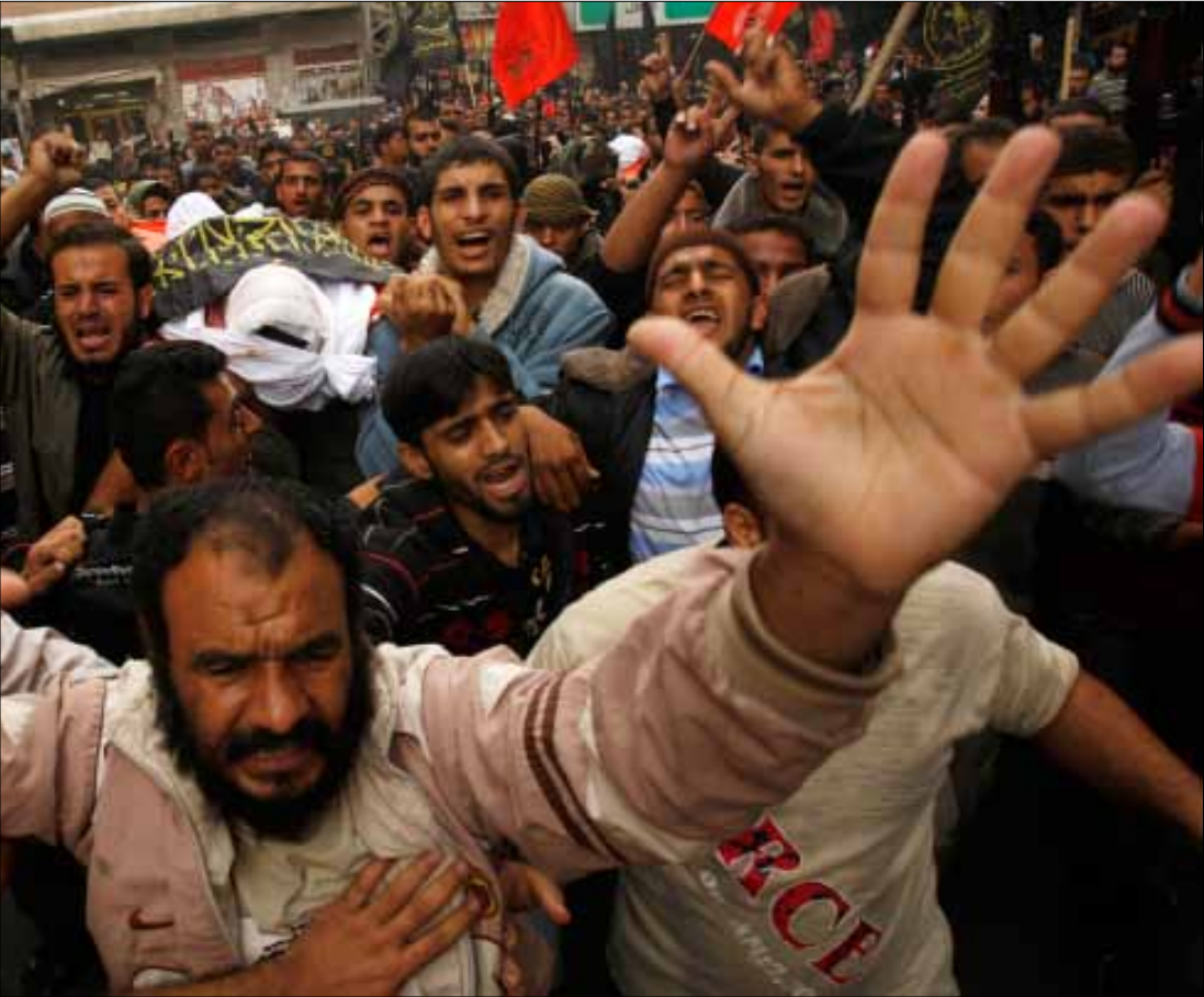
خلال تشييع أحد شهداء «الجهاد الإسلامي» في غزة أمس

في المقابل، نفى رئيس الوزراء الإسرائيلي، بنيامين نتانياهو، الأنباء التي تحدثت عن التوصل إلى وقف لإطلاق النار بوساطة مصرية. وقال، في افتتاح جلسة الحكومة الأسبوعية في مدينة صفد، «ليس هناك