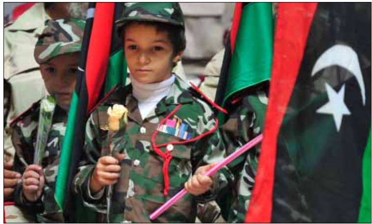
خلال حفل تكريم المقاتلين في بنغازي