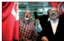
تونس تقرب الصفحة 21:05 ■ «الجزيرة»