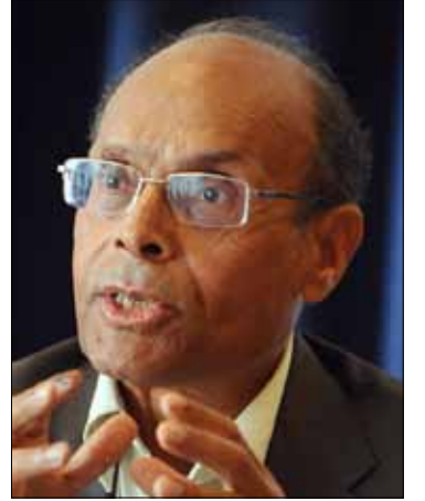
منصف المرزوقي

طلوت تونس صفحة الاضطرابات الأمنية التي عرفتها مدينة سيدي بوزيد، مهد ثورة 14 كانون الثاني، لتدخل الأطراف الفائزة في الانتخابات مرحلة الصراع السياسي الناعم