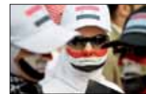
المبادرة الأخيرة... 22:30 ■ «المنار»