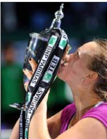
كفيتوفا تقبل الكاس

وستكون المهمة المقبلة لكفيتوفا هي قيادة بلادها في نهائي كأس الاتحاد أمام روسيا الأسبوع المقبل في موسكو، وهي نصبت نفسها لاعبة تتمتع بمستقبل واعد بين كبار اللاعبات، وقد بدت في رأي الكثيرين أفضل من فوزنياكي، التي لم تحرز أي لقب كبير حتى الآن.