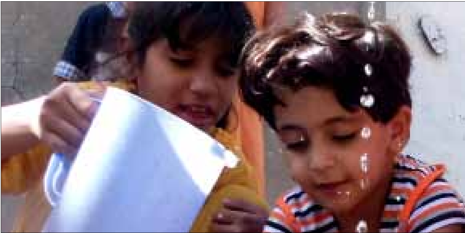
طفلتان عراقيتان في مدينة الصدر

المحافظات العربية السنة صلاح الدين والأنبار ونيون قررت التحول إلى إقليم أو لوحّت بالامر