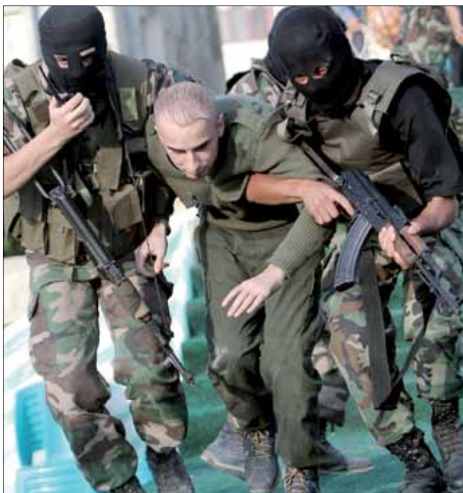
تمثيل عملية خطف شاليط من قبل عناصر من كتائب القسام