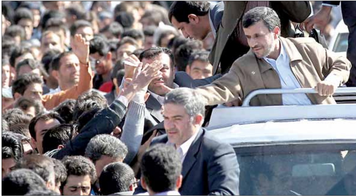
نجاد يحيي انصاره في مدينة بيرجاندا (شرق طهران) الأسبوع الماضي

هؤلاء، وخاصة الرياض، ضد الجمهورية الإسلامية». وبحسب المصادر فإن «المشكلة تكمن في أن السعوديين وقعوا في الفخ، رغم أن إيران كانت دائماً تؤكد للخليجيين أنه عند أي ضربة أميركية على إيران فإن الرد سيستهدف القواعد الأميركية في الخليج وليس قصوركم ولا مؤسساتكم». وتشير إلى أن «السعودية تخشى على ما يبدو من تحركات واسعة في خلال الحج كأحد تداعيات الربيع العربي وبدعم إيراني. شيء قريب من الطقوس التي اعتاد الحجاج الإيرانيون أن يقوموا بها في عرفة، لكن هذه المرة على نطاق أوسع، بمعنى أن يتحول إلى سلوك إسلامي وليس إيرانياً».