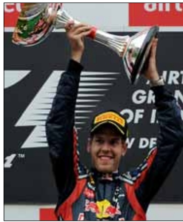
فيتيل متوجاً في الهند

وضع سائق «ريد بل رينو» الألماني سيباستيان فيتيل، الذي حسم اللقب لمصلحته للموسم الثاني على التوالي، بصمته على المرحلة السابعة عشرة من بطولة العالم للفورمولا 1، عندما حقق الفوز في النسخة الأولى من جائزة الهند الكبرى، على حلبة «بوده».