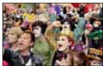
رافين نصيرا للمهمشين 21:30 ■ «المستقبل»

ما الذي جعل التونسيين يقبلون على انتخاب «حركة النهضة» ذات التوجه الإسلامي؟ كيف سيكون شكل الحكم المقبل في تونس؟ وهل فوز الإسلاميين في انتخاباتها نموذج يقبل التعميم؟ الجواب عن كل هذه الأسئلة نكتشفه في حلقة الليلة من برنامج «في العمق» على «الجزيرة».