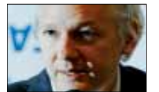
أسانج عند مارسيل 20:30 ■ «Ibc الفضائية»