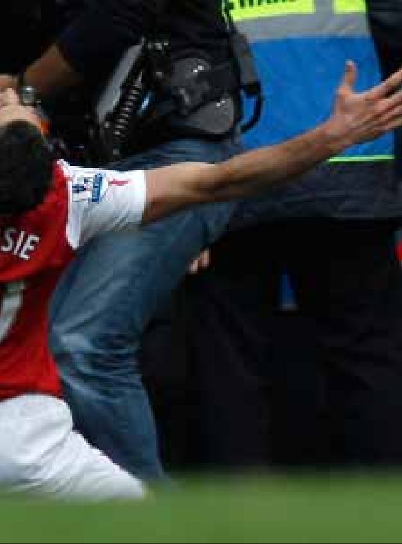
الكابتن روبن فان بيرسي وقع على «هاتريك» في مرمى تشلسي

1- بايرن ميونيخ 25 نقطة من 11 مباراة 2- شالكة 21 من 11 3- بوروسيا دورتموند 20 من 11 4- فيردر بريمن 20 من 11 5- بوروسيا مونشنغلادباخ 20 من 11