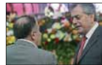
... أم بداية الحل؟ 21:30 ■ otv