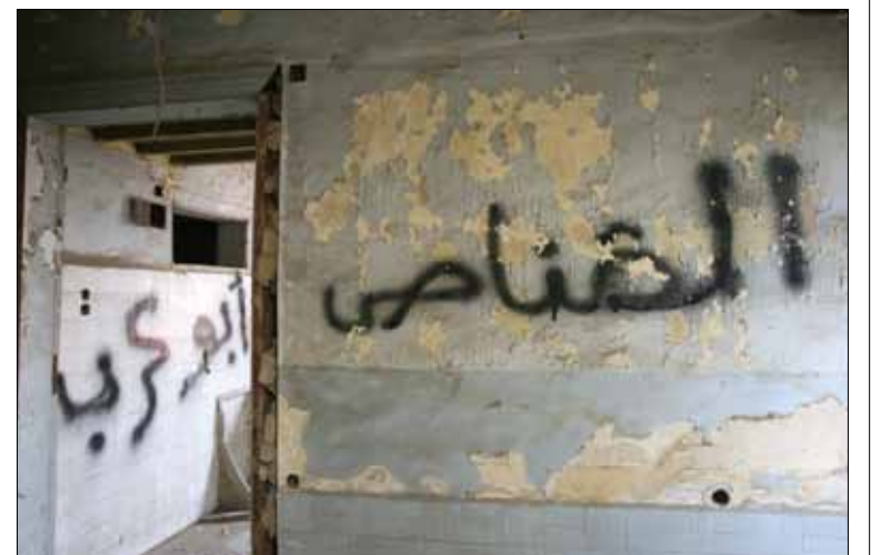
في لبنان تحول أمراء الحرب إلى أمراء السلم الوهمي (مروان طحطح)

جدلية الحرب غير المنتهية هذه، تتجدد يوماً بعد يوم في الأزمات التي تعيشها بيروت، و«الحقد» الكامن في النفوس، ظاهراً كان أو مستتراً. سبب دفع بمستشفى جبل لبنان إلى استضافة