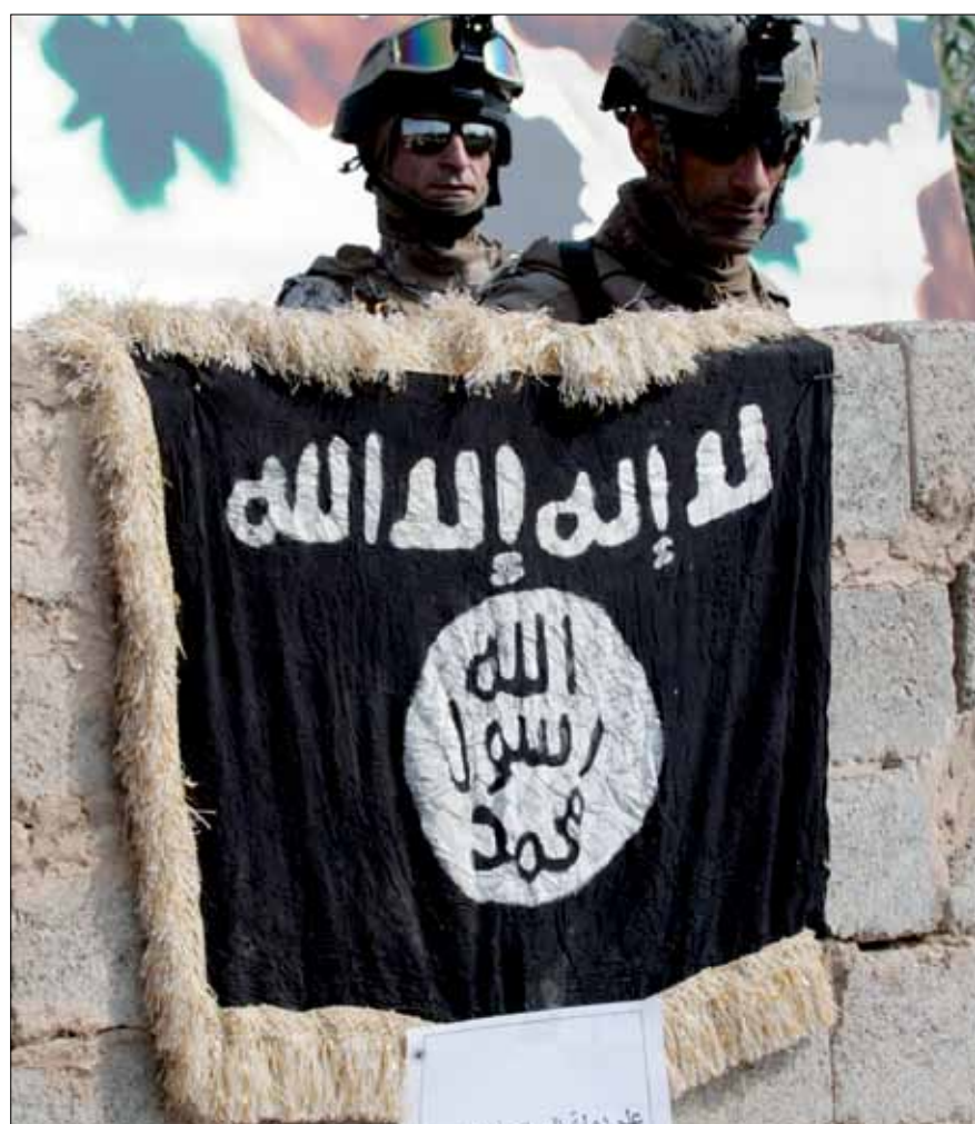
جندبان خلال مدهمة منزل لتنظيم القاعدة في بغداد

ولم يتوقف العمل في الداخل، فتواصل إصدار البيانات المشتركة مع التيار العربي والحزب الشيوعي - القيادة المركزية ومؤتمر حرية العراق، وانضم إلى تلك القوى حزب الاستقلال. كذلك جرى إصدار كتابات وكراسيس، آخرها حمل عنوان: «العملية السياسية الأميركية: