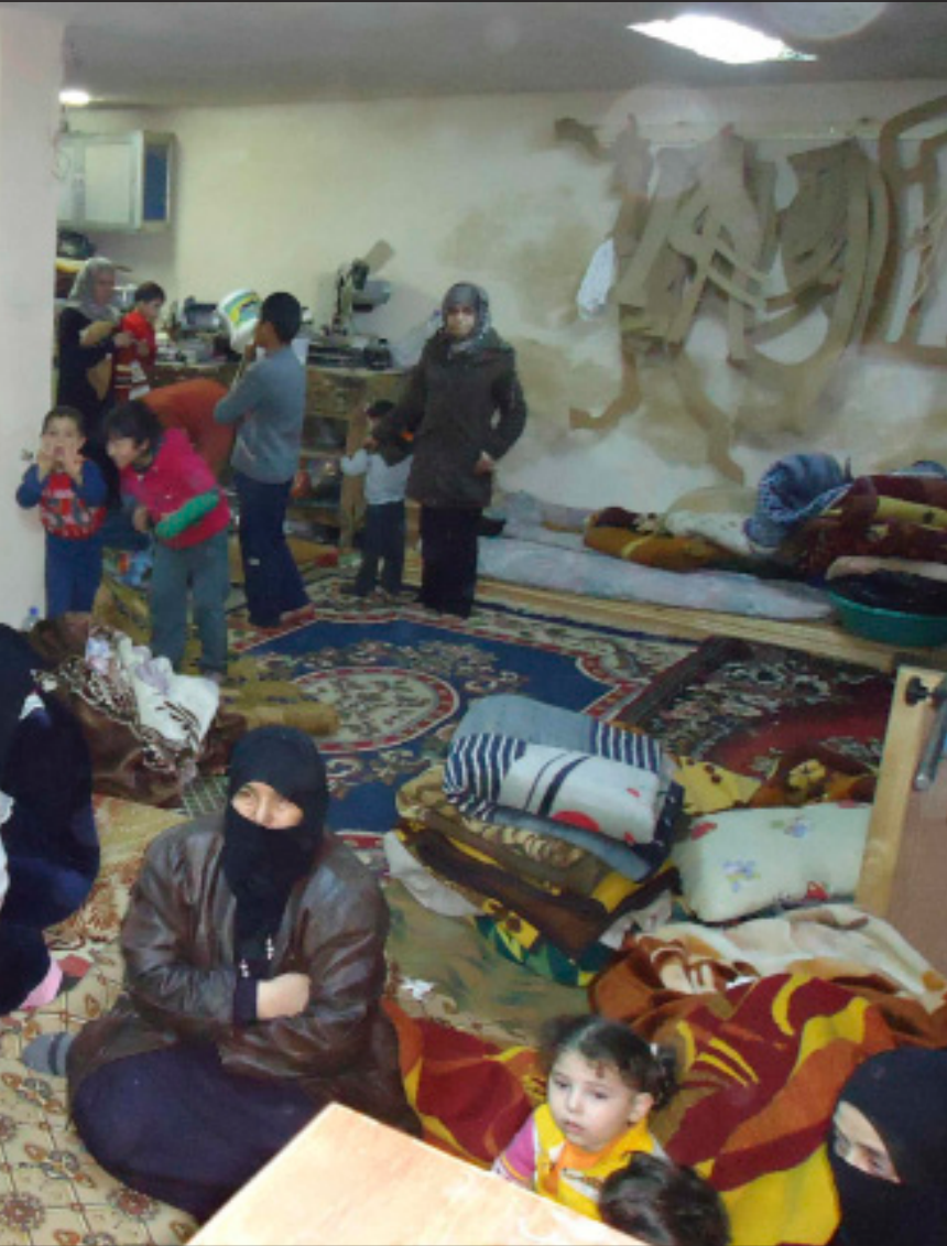
مواطنون في أحد الملاجئ في بابا عمرو

بعد خمسة وعشرين يوماً من الاشتباكات بين قوات الجيش السوري ومسلحي «الجيش السوري الحر» المتحصنين في بابا عمرو في حمص، بدأ أن الأمور في هذه المنطقة تتجه إلى الحسم النهائي، وسط تأكيدات بسيطرة الجيش على المنطقة التي قد تعلن «أمنة» في الساعات المقبلة