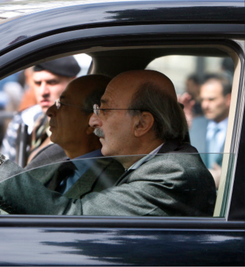
المعارضة تبحث عن آلية لتحجيم جنبلاط ولم تعط أهمية لمواقفه الأخيرة

بأي خطوة للشعب السوري». لكن ماذا عن زيارته للسعودية؟