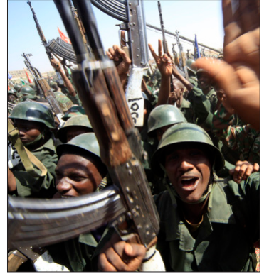
الخرطوم حذرت من نفاذ صبرها مما تصفه ممارسات مستفزة من جوبا

لم يمض شهر على الحبر الذي وقعت فيه الجارتان المتشاكستان، جوبا والخرطوم، مذكرة «عدم الاعتداء» بينهما، فضلاً عن تعهدهما عدم دعم الجماعات المتمردة التي ينتم كل طرف الآخر بدعمها وإيوائها على أراضيها، حتى أتت الأنباء عن عودة الاشتباكات في منطقة جنوب كردفان، بعد الهجوم الذي تبنته الجبهة الثورية على منطقة بحيرة الأبيض صبيحة الأحد الماضي، لتشير إلى أن البلدين باتا يمارسان ضغوطاً من نوع مختلف، وهما يدخلان مرحلة بالغة الحساسية من