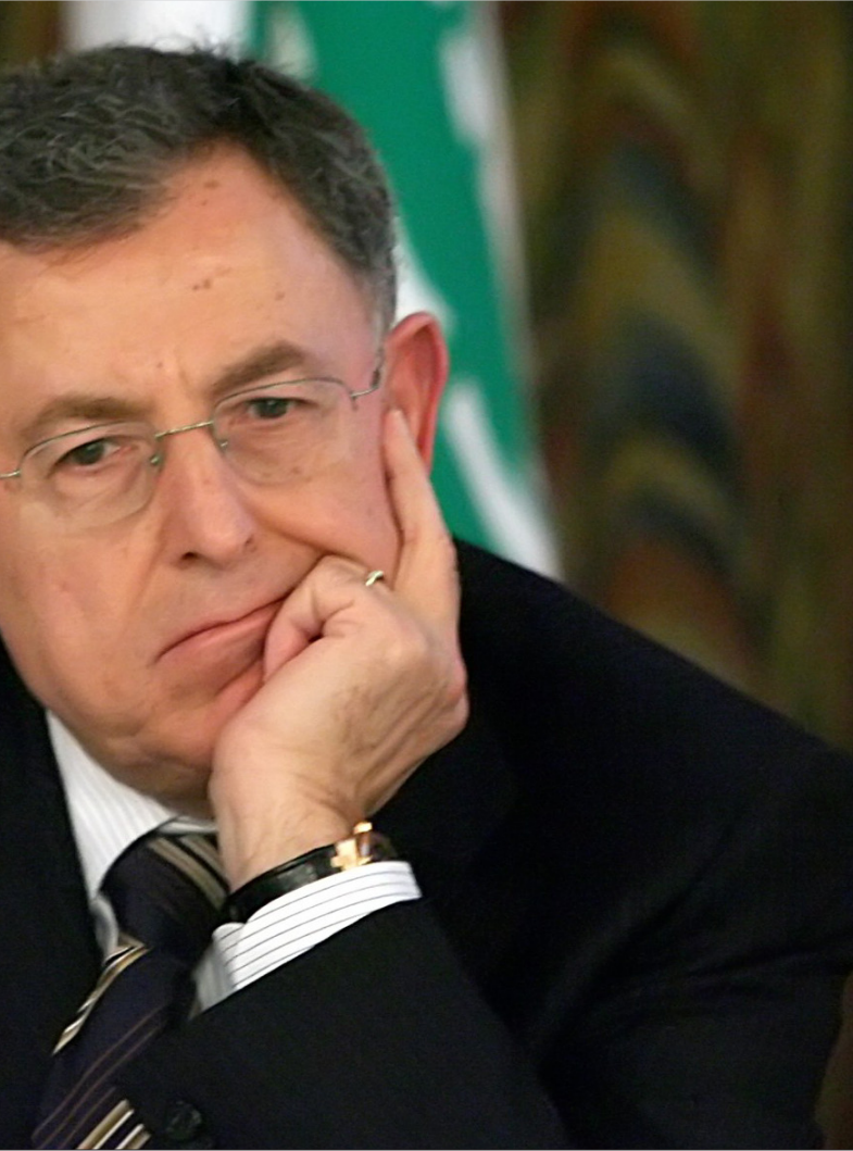
الرئيس فؤاد السنيورة في انتظار «الحل» (أرشيف)

أي طرف من الطرفين، وإنما رائحة مخالفات تدفع للبقاء. وفي الضفة الأخرى، أو الأعلى، يهمس العارفون أن «طبخة» ما بدأت تُعد على نار سياسية حامية. «طبخة» عناصرها كل من «البصلة» و«قشرتها». و«الطبخة السحرية» ستكون المخرج من أزمة الأرقام التي تغرق البلاد منذ العام 1993 حتى الآن. ماذا يعد رئيس مجلس النواب نبيه بري ورئيس الحكومة نجيب ميقاتي مع الرئيس السابق فؤاد السنيورة؟ الاجتماعات قائمة بين بري وميقاتي والسنيورة، يقول النائب عن تيار المستقبل جمال الجراح. البحث عن حل مشترك ليس مستبعداً أبداً، فالحل لمصلحة البلد في ظل