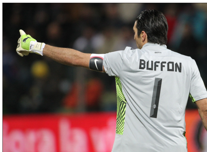
الحارس الإيطالي جانلويجي بوفون

مواقفي. يمكن الناس أن يكتبوا ما يشاؤون. أؤكد أنني في هذا الموقف لم أُر شيئاً».