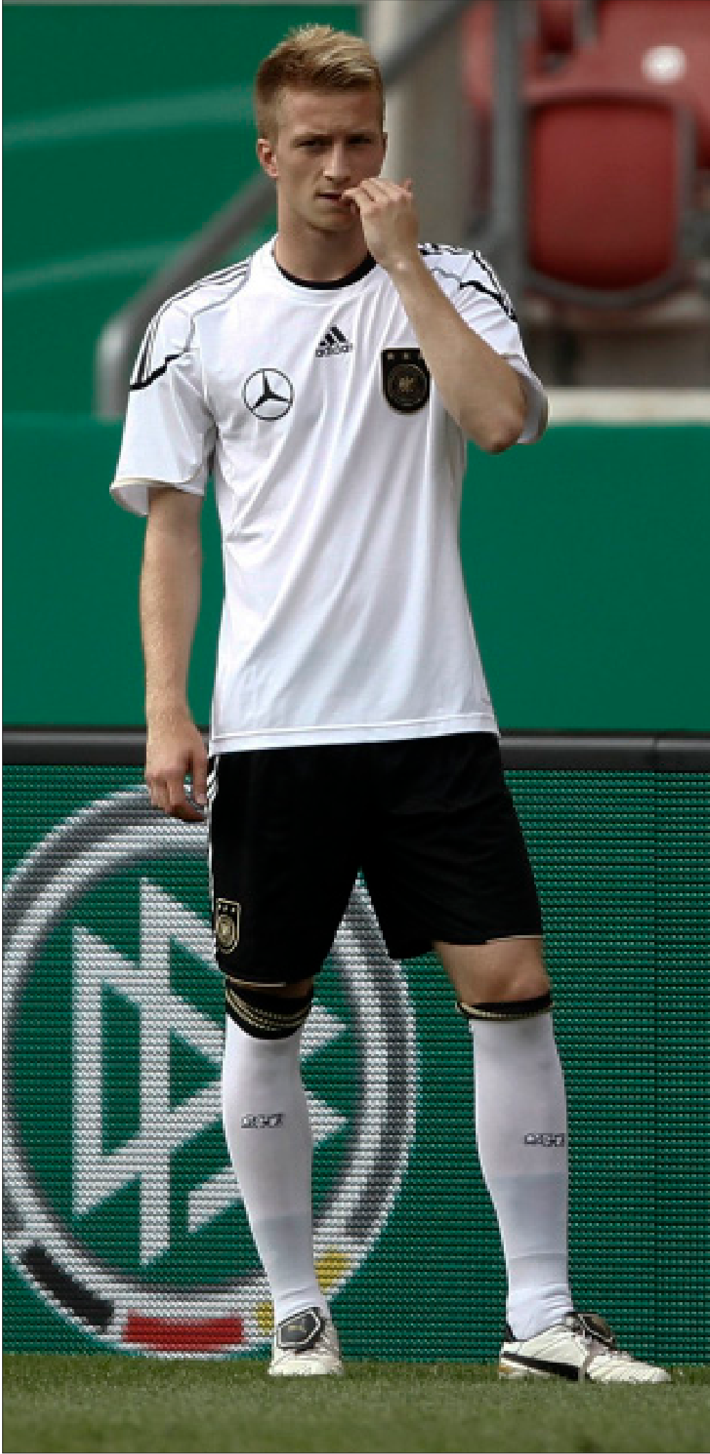
يفترض أن يأخذ ماركو رويس مكانه في التشكيلة الأساسية لألمانيا الليلة (اليس دومانسكي - روبرتز)