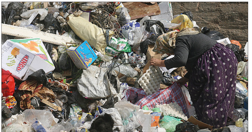
تلقت البلديات مبادرة الأهالي وأسهمت في المشروع

المشروع الذي بدأه «لقاء الأثنين» في الحي الكسرواني بعد استفتاء السكان، يهدف بحسب طموح اللقاء إلى جعل الحي المذكور نموذجاً بيئياً يعتم على المنطقة، وعلى لبنان في مراحل متقدمة. في 31 آب 2011 دُعي أبناء المنطقة، الموافقين على الدخول في المشروع، وبلديات المنطقة واختصاصيون من وزارتي البيئة والطاقة، إلى اجتماع يحددون فيه الأهداف والخطوات التي يجب اتباعها لتحويل حيهم إلى حي بيئي «نموذجي». هنا لا يمكن عبارة «نموذجي» أن تأخذ معناها الكامل، بما أن هذا النوع من الأحياء يُنشأ من