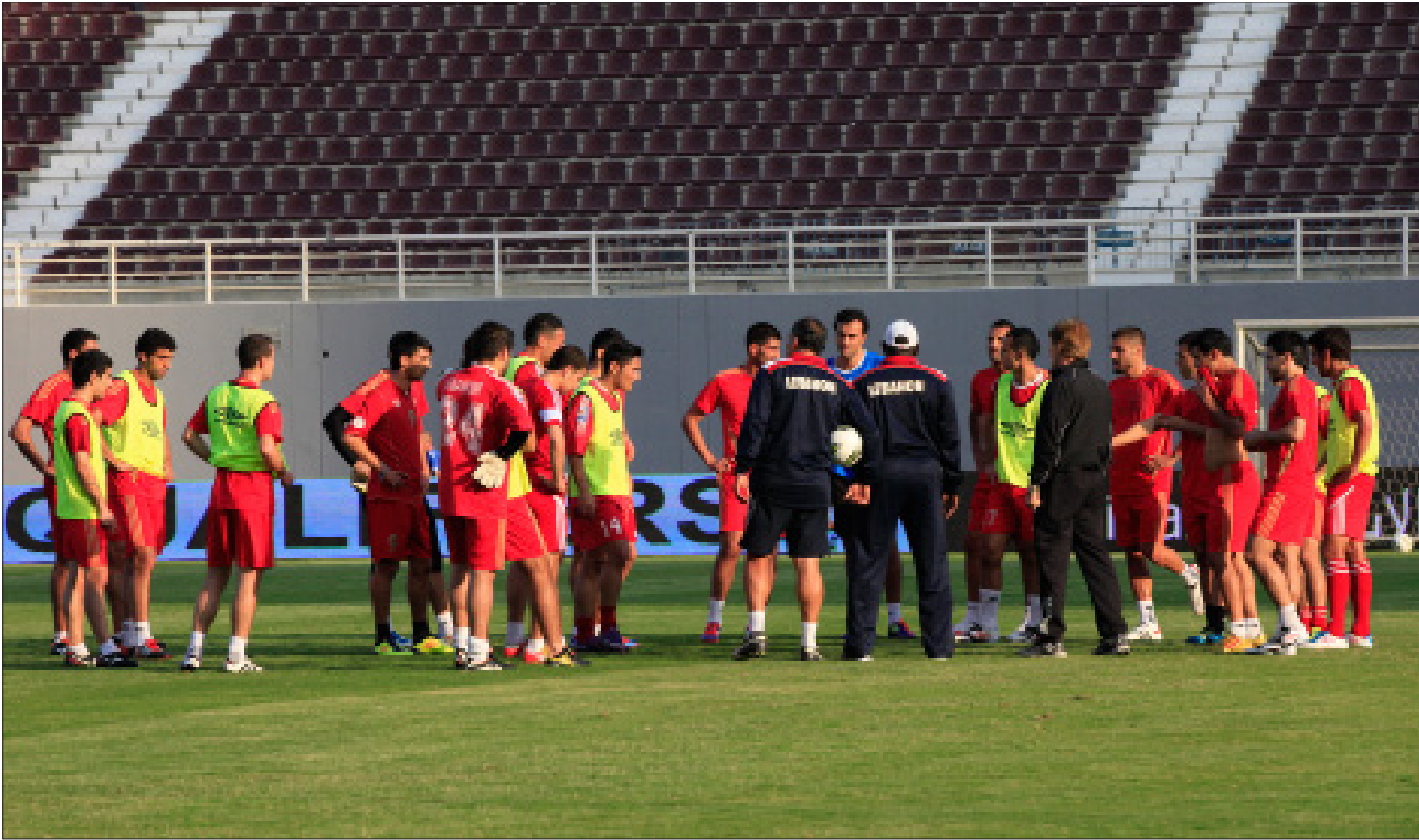
لاعب المنتخب اللبناني خلال التمرين الأخير أمس

إنه يوم الحسم. يوم المباراة الأخيرة في تصفيات الدور الثالث المؤهل إلى كأس العالم 2014. يوم تحقيق الحلم. يوم العبور من مرحلة الهواية إلى مرحلة «الاحتراف». يوم لقاء لبنان ومضيفته الإمارات عند الساعة 14,00 بتوقيت بيروت