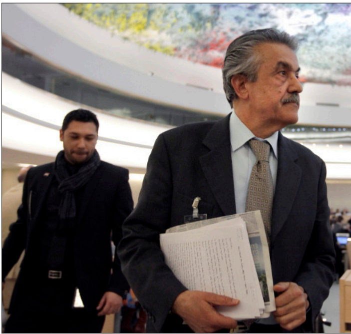
المنسوب السوري يغادر اجتماع جنيف

حديث مع صحيفة «الشروق» الجزائرية، «نحن شكلنا هيئة لتنفيذ قرارات المجلس الوطني، ولا سيما ما يتعلق بدعم الجيش الحر، وللخروج من شعارات الدعم المعنوي إلى الدعم الحقيقي على الأرض سميهاها (جبهة العمل الوطني لدعم الجيش الحر)، وهو ما نعمل عليه حقيقة بالتنسيق مع مختلف الهيئات». ونفى «نقياً» قاطعاً ما ذهب إليه أمس الإعلام العربي والدولي في وصفه للخطة بالانشقاق عن المجلس الوطني المعارض».