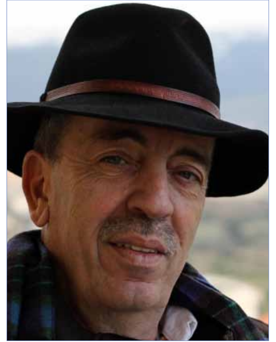
جبور الدويهي / لبنان