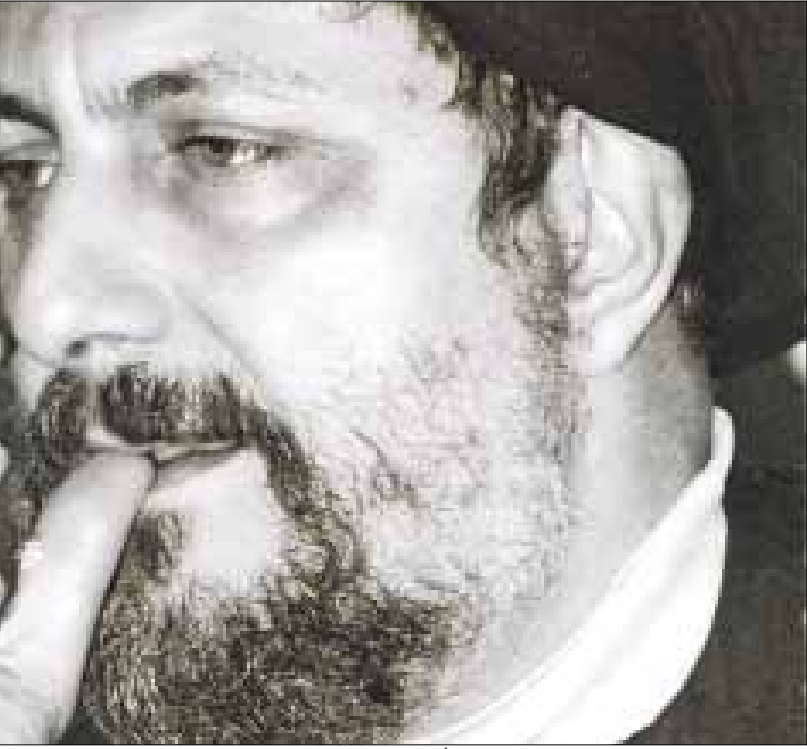
تقرير رسمي ليبي يؤكد الوصول إلى حراسه وأنه أصيب بمرض السكري وتوفي قبل عشر سنوات (أرشيف)

بكشف المعطيات السابقة كما التالية. خامساً، في أثناء اعتقاله في سجن أبو سليم في العاصمة الليبية، بدأ الصدر يعاني عوارض سريرية من مرض السكري. غير أن المشرفين على سجنه تمنعوا عن معالجته وعن إعطائه أدوية كان اعتاد تناولها وهو في حاجة إليها. وهذا ما أدى إلى وفاته في فترة لم يتمكن التحقيق من تحديدها بدقة بعد، مع ترجيح أن يكون تاريخ وفاة الإمام الصدر مطلع العقد الماضي.