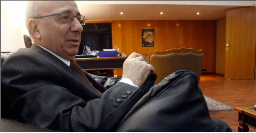
وزير العدل لن يستقيل (مروان طحطح)