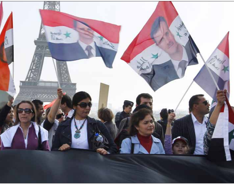
تظاهرة مؤيدة للأسد في باريس الأحد (أ ف ب)

إنها مراهنة رابحة على إرادة الطبقات الشعبية وقوة اندفاعها نحو التغيير ووعي هذه الطبقات لمصالحها، فدائماً وعبر التاريخ امتلكت الشعوب حسها السليم والحقيقي. وما دعم الشعوب العربية في مصر وتونس واليمن وبقية البلدان للثورة السورية إلا تعبير صادق عن هذه الحقيقة التاريخية، وما تقاعس وتردد نخب اليسار إلا تأكيد لهذه الحقيقة أيضاً.