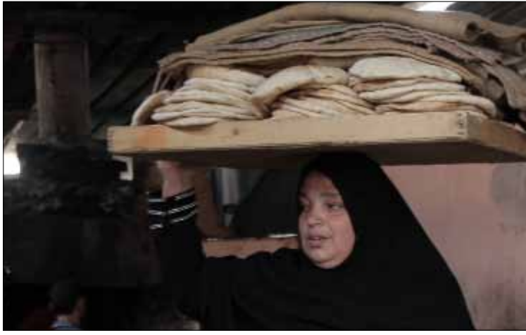
تحمّل الخبز الطازج في مخيم رفح بغزة امس