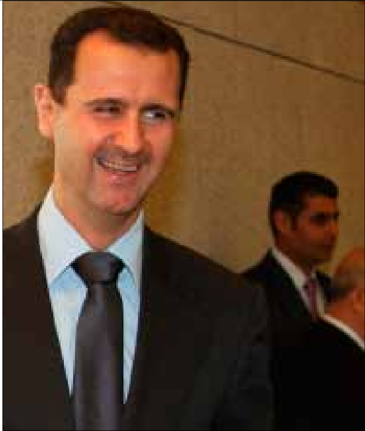
دمشق: لا للبننة سوريا (أرشيف)