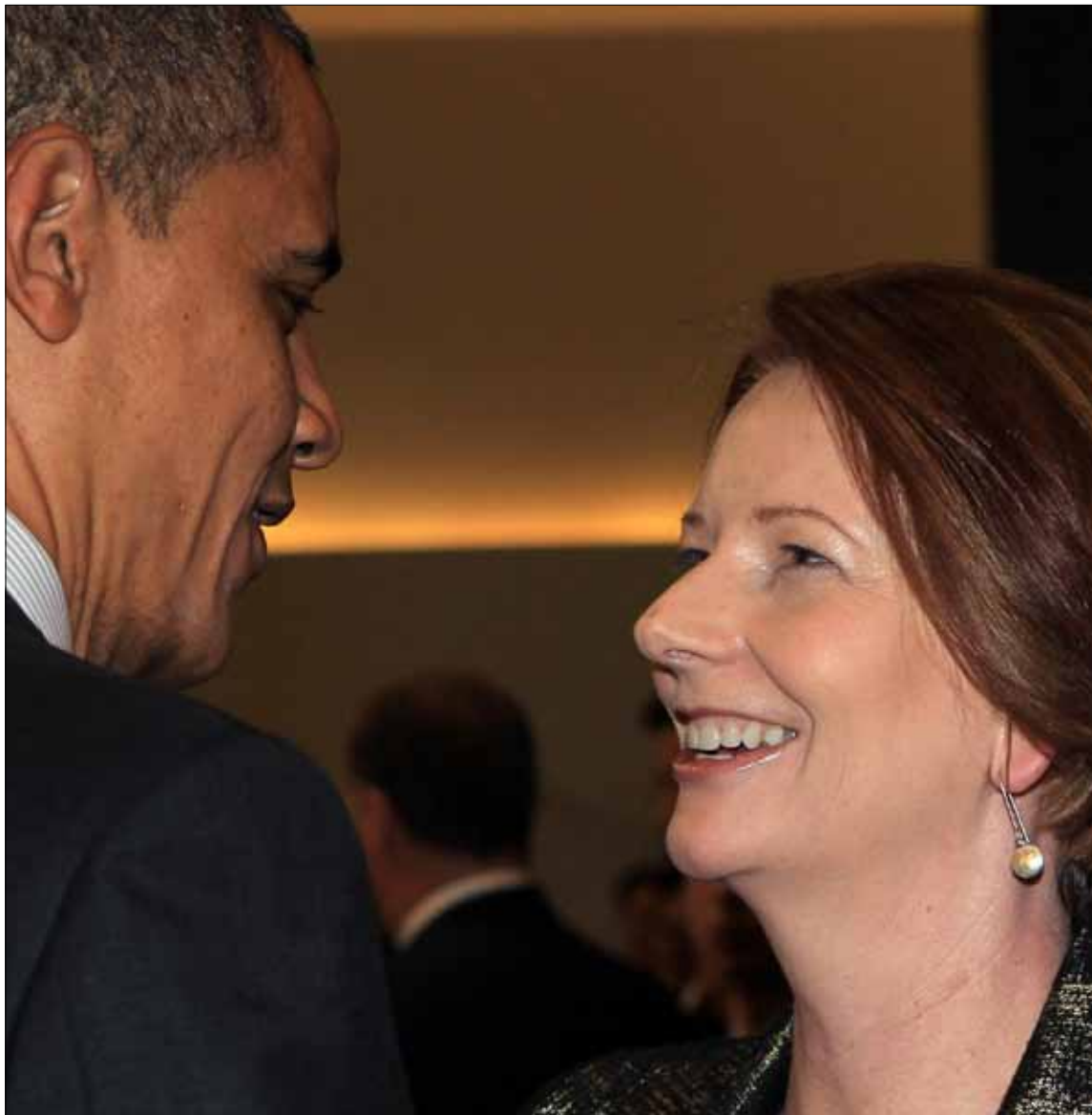
أوباما متحدثاً إلى رئيسة الوزراء الأسترالية جوليا جيلارد خلال مشاركتهما في قمة الأمن النووي في سيول

اتهم أوباما إيران بأنها «سلكت طريق الإنكار والخدام»