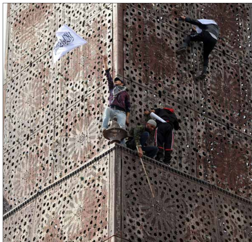
خلال تظاهرة إسلامية في تونس نهاية الأسبوع الماضي