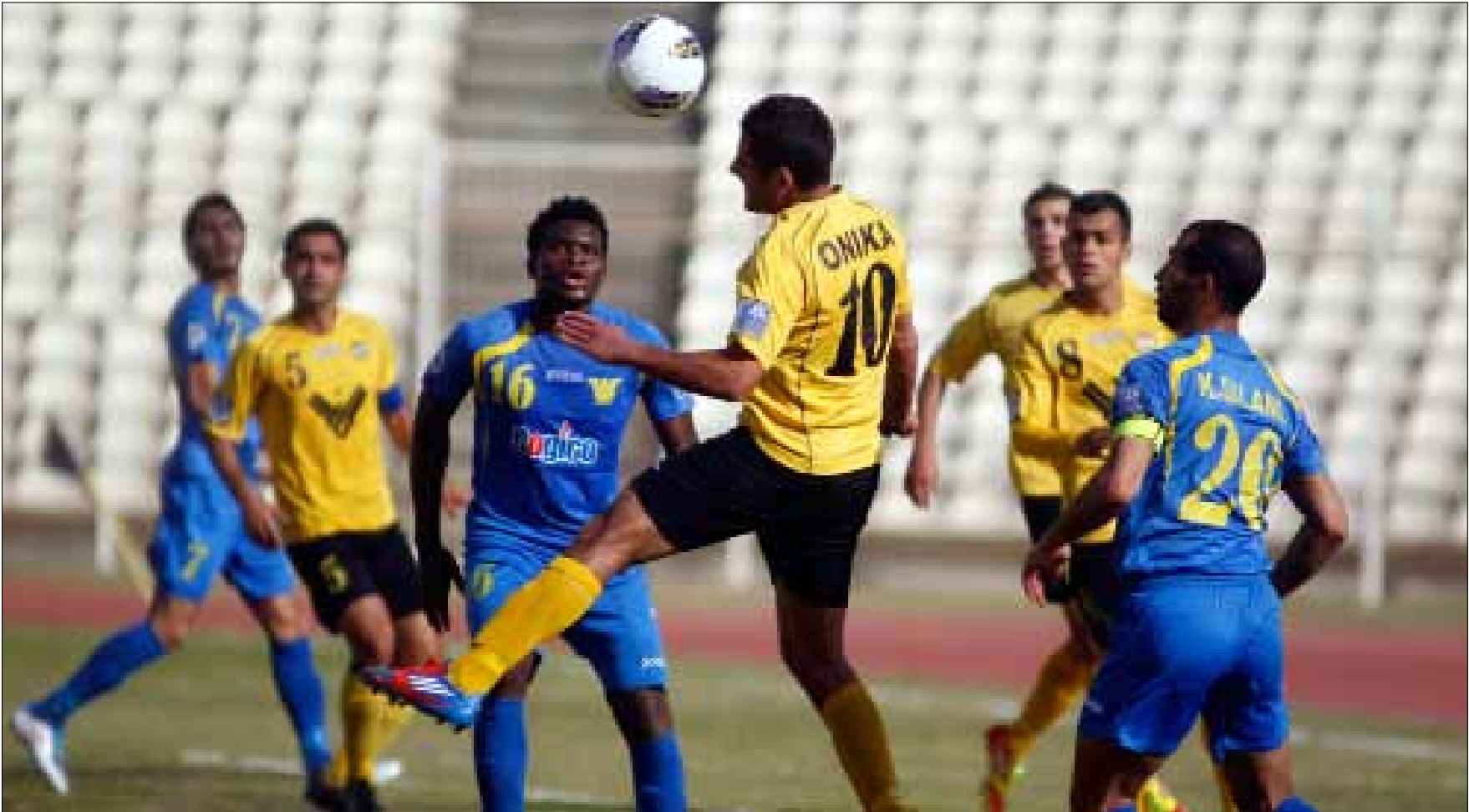
تعادل العهد والصفاء أضربهما وأبقى الأفضلية للنجمة (حسن بحسون)

أحداث كثيرة رافقت المرحلة الـ 20 لبطولة الدوري الكروي، وطلعت على مبارياتها الهامة، وخصوصاً لقاء الدربي البيروتية بين النجمة والأبطال وقمة العهد والصفاء وهبوط الأهلي صيدا إلى مصاف أندية الدرجة الثانية، وأبرز الأمور هي منع جمهور الكلاسيكو الـ 55 ثم السماح له