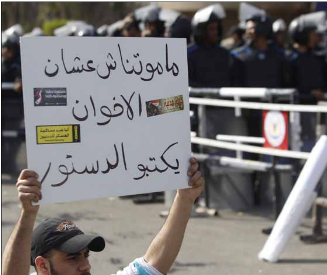
متظاهر يندد بمحاولة الإخوان المسلمين السيطرة على كتابة الدستور يوم السبت الماضي

بيدهم لا بيد غيرهم، وُزط الإسلاميون أنفسهم في الأزمنة، بعدما أصروا على أن يحتكروا كتابة الدستور بأغليبيتهم في البرلمان، لتسجل الساعات التي تلت اختيار الأعضاء الذي يفترض أن يشاركوا في صياغة الدستور انسحابات متوالية ويصبح على أثرها مصير الجمعية التأسيسية أمام مستقبل مجهول، ولا سيما أن الانسحابات تترافق مع 20 دعوى مرفوعة أمام القضاء الإداري لبت بطلان قرار «اختيار نصف أعضاء الجمعية التأسيسية من داخل البرلمان». الإسلاميون في الجمعية تجاوز تمثيلهم 75 في المئة من الأعضاء من داخل البرلمان بمجلسيه الشعب والشورى، بينما مثل نفس التيار من خارج البرلمان بقرابة