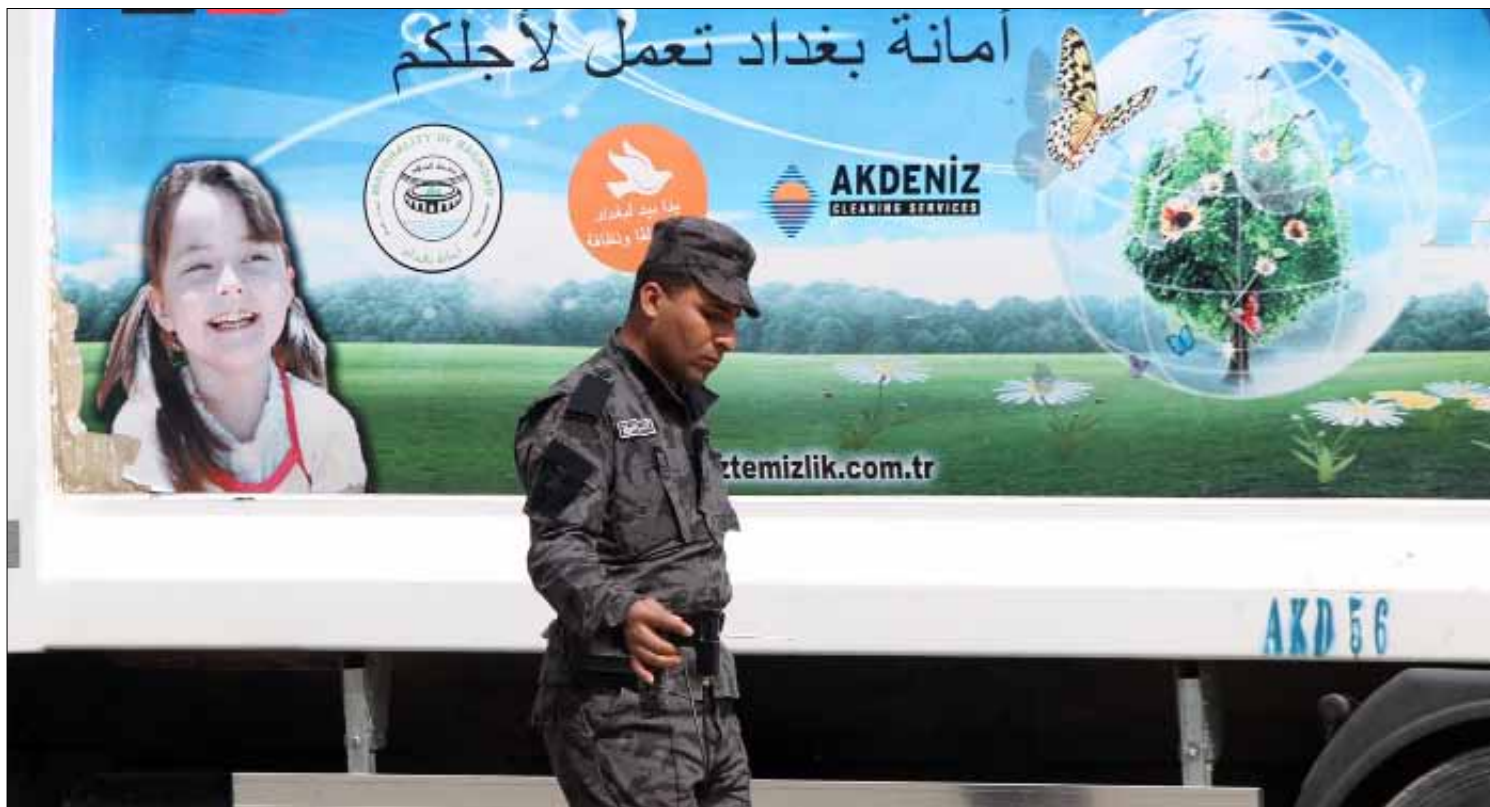
شرطي عراقي قرب المنطقة الخضراء في بغداد

المالكي تفاهم مع النجيفي ووطد علاقته بالطالباني وكسر الجليد مع العيساوي