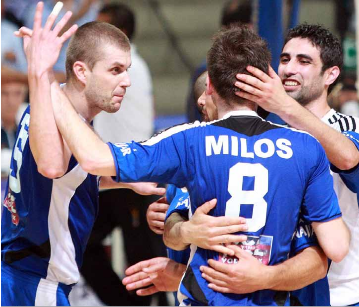
البوشرية استنق لقب وعاد إلى منصة التتويج بعد غياب

أسدل الستار عن موسم الكرة الطائرة، الشبيبة البوشرية عاد إلى منصة التتويج، والأنوار اكتفى بالوصافة، في موسم عدّ الأقوى في السنوات الأخيرة، لكن الناديين المتنيين أديا مخاوفهما من نذرة نشء اللعبة، الذي يتناقص تدريجياً مهدداً اللعبة وشعبيتها