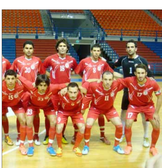
لاعبو المنتخب اللبناني قبل المباراة

أراوجو على سحب بعض عناصره الأساسيين لحمايتهم، وهو الذي افتقد اصلاً أهداف المنتخب على طينيس بسبب الإصابة، ما أثر أيضاً