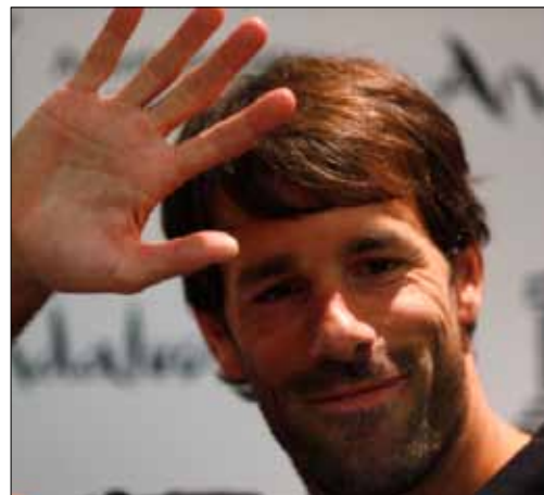
نيستلروي في المؤتمر الصحفي معلناً اعتزاله

وضع الهولندي رود فان نيستلروي، مهاجم ملقة، حداً لمسيرته المظفرة في الملاعب عن 36 عاماً، بعد 20 موسماً تنقّل خلالها في ملاعب كرة القدم بين بلاده وانكلترا وإسبانيا وألمانيا