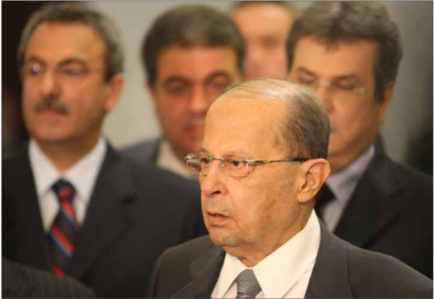
عون: يُعدون الأجواء لتطير الانتخابات

يتعاطى رئيس تكتل التغيير والإصلاح العماد ميشال عون، بقلق حيال الوضع في شمال لبنان بعد الأحداث. لكنه يتعامل بهدوء غير اعتيادي مع الأزمة الحكومية التي يواجهها بثقة لافتة مع حليفه الرئيس نبيه بري و«حزب الله»