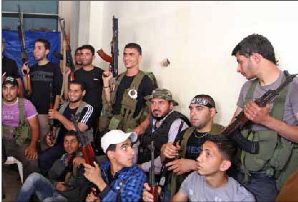
فقد «المستقبل» سيطرته على الشارع لمصلحة الإسلاميين (زينون النابلسي)

نكتب لك هذه الكلمات، وتكر في الببال وجوههم وأسماءهم وصورهم المتركمة على الحيطان، في جدارية تعبيبية من النوع السوريالي. نكتب إليك وتطن في بقايا الذاكرة لعلعات الرصاص لدقائق قليلة في «عراسهم» الجنائزية. أحد متعهدي طبع تلك الصور صار من أكبر أثرياء البلد. كان الخطوط السود التي كانت تشطب صور من سبقك على تلك الدرب، كانت بمثابة القرش الأبيض لكل أيامه اللاحقة. عرف كيف يراكمها، فيما كانت المقابر المستحدثة تراكم أمثالك. باعة الرصاص لأعراس الصغار الذين تشبههم، صاروا من كبار تجار البلد. نراهم كل يوم، وقد مسختهم أثمان الموت الماضي أناقة مذهلة وبعض كلمات أجنبية. أما الذين أرسلوا أمثالك الى الموت، فباتوا حكام البلد وطبقة سياسية الثوابت. فبعد نفاذ المجانين من أمثالك، وبعدما تعبوا من رنائهم وقرقروا من رائحة جثثهم، جاؤوا بورقتين اثنتين لطى الموضوع. كتبوا على الأولى أن أمثالك «ماتوا ليحيا لبنان»، وكتبوا على الثانية عفواً عاماً عنهم. ضنوا الورقتين في جيوبهم مع سعر الدم والعمالات والعمولات، وصاروا حكماً عليك وعلينا وعلى كل الوطن. لو أن الذين ماتوا قبلك، بعدما كانوا مثلك، يرون زوجتي اثنين من الزعماء الذين تقائلوا بهم، حتى قتلوهم، باتتا اليوم من أعز الصديقات، كما زوجاهما، تتبادلان الهدايا والاهتمام بأخبار الأزياء وأحذية التماسيح والدموع ضحكاً على ظهر شعب كامل. حتى إنهما اكتشفتا بالصدفة أنهما نباتيتان. لا تاكلان ذرة لحم. كي لا تقتلا حيواناً واحداً. أما البشر، فحساب آخر. إلى غافروش طرابلس، أرم سلاحك، وانزع قناعك، وأظهر وجهك، واضحك طويلاً في وجوههم، ولا تعظهم من جسدك البريء إلا ما يستحقون: بصفة... أو أكثر.