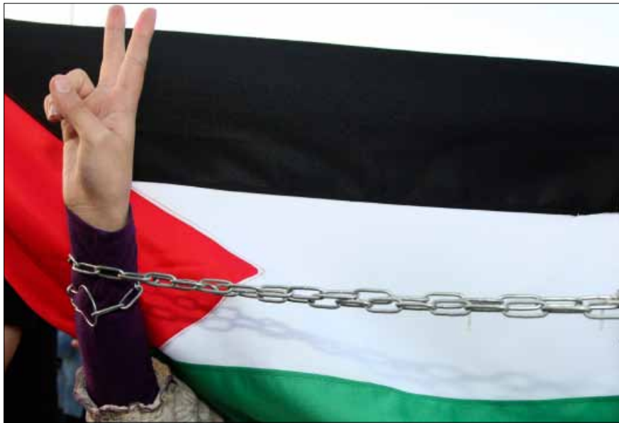
اعتصام تضامني مع الأسرى الأردنيين والفلسطينيين في إسرائيل أمام السفارة الأميركية في عمان

وكان الخصاونة عنوان هذا المسار الذي واجه اعتراضاً شديداً، سواء من قبل بيروقراطية الدولة أو من قبل الحركة الوطنية. أدار الملك أزمة الضغوط المتعارضة بشأن عودة «حماس»، وانتهى إلى إفشالها. في هذه اللحظة بالذات، تلقت حكومة الخصاونة الضربة الموجعة الأولى، لكنها ماتت سياسياً منذ مطلع شباط 2012 حين اتضح أن الحلف الروسي - الصيني