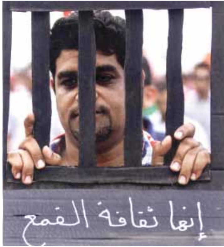
من العدد الأول

أخيراً، أصبح للصحافيين البحرينيين جريدتهم المستقلة. فقد صدرت «مرأة البحرين» من خارج الجزيرة الصغيرة، تزامناً مع اليوم العالمي لحرية الصحافة (3 أيار/ مايو)، وفي وقت تداس فيه الحريات تحت مدرعات النظامين السعودي والبحريني. مع مرور سنة على الثورة، بدأ العمل في «مرأة البحرين» إلكترونياً مع طاقم صحافي، فضل أغلبيته عدم الإفصاح عن اسمه. لكن العدد الورقي الأول لم يصدر إلا أمس في بيروت ليغطي حال الصحافة والإعلاميين منذ بدء «ثورة 14 فبراير» عام 2011 حتى اليوم. في افتتاحية العدد المطبوع، أكدت هيئة التحرير أنّ مهمة الصحيفة تتمثل في كشف وجه الديكتاتورية المعيب، وأخباره الكاذبة. لماذا يقرأ الناس «مرأة البحرين»؟ لأنها ستكون المرة الأولى في تاريخ الصحافة البحرينية التي يتم فيها إطلاق صحيفة مستقلة في الفضاء الحر، تكون رديفاً ومكملاً لما يحصل على الأرض من تحركات. يأتي هذا في الوقت الذي عدت