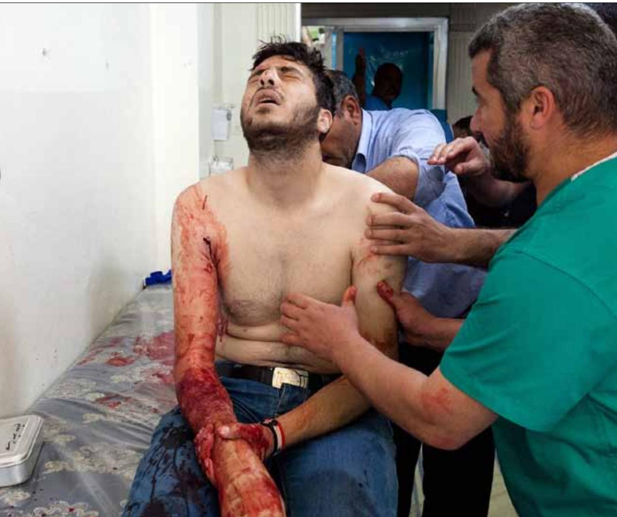
معالجة جريح في مستشفى ميداني في بلدة القصير على الحدود اللبنانية السورية

القوات النظامية تحاول اقتحام الرستن... والفصيل يرى أن الثقة بمهمة آنان «تتناقص كثيراً»