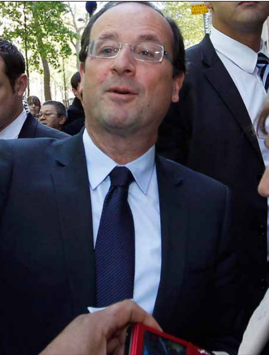
هولاند لدى وصوله أمس إلى مقر حملته الانتخابية في باريس

يعود الاشتراكيون اليوم إلى قصر الإليزيه على وقع مساعي الرئيس الجديد فرانسوا هولاند في تأكيد نيته القطع مع عهد سلفه نيكولا ساركوزي والوفاء بوعوده الانتخابية