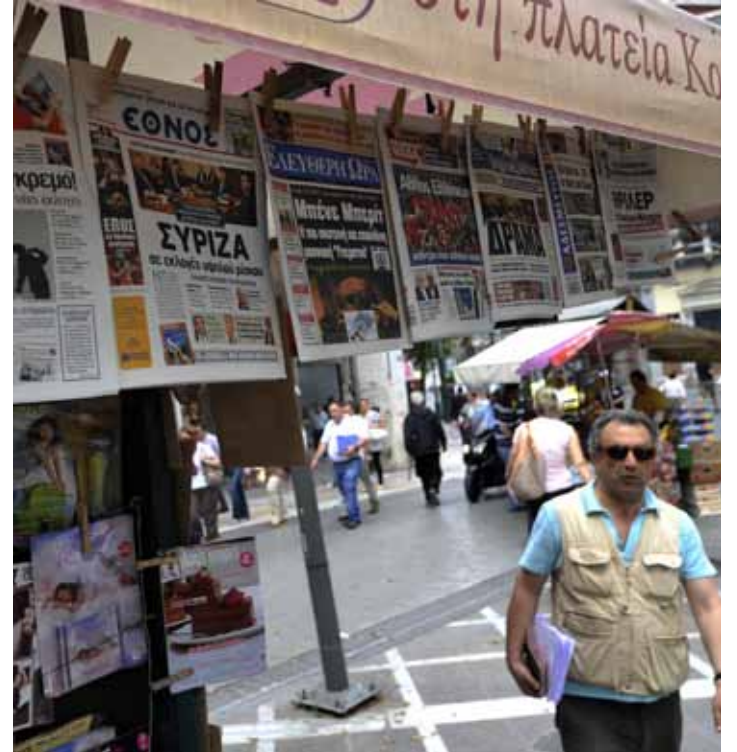
أعربت الصحافة اليونانية عن شكوكها في احتمال إجراء انتخابات

تراجعت الآمال في اليونان بتشكيل حكومة ائتلاف بعد أسبوع من المشاورات السياسية غير المنجزة، ليكون إجراء انتخابات جديدة الحل الوحيد الباقي، رغم أنه قد يطيل أمد الأزمة ويعزز مخاوف منطقة اليورو والأسواق التي بدأت تنعكس عليها التطورات اليونانية سلباً.