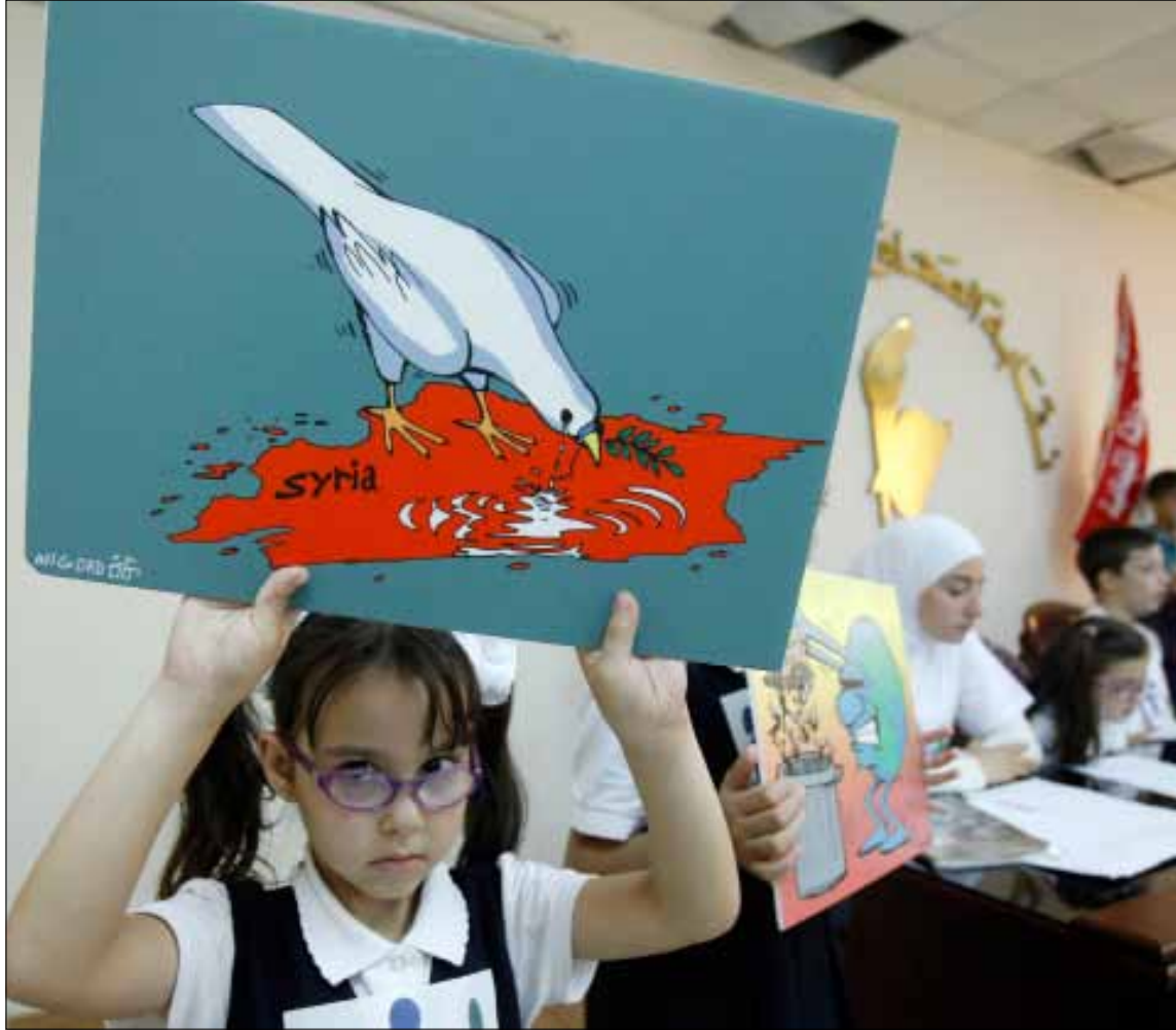
اطفال من أجل السلام، في نقابة الصحافة اللبنانية تضامناً مع اطفال سوريا

قتل عدد غير محدد من المدنيين، بينهم نساء وأطفال، في مجزرة جديدة وقعت في ريف حماة بوسط سوريا، ونددت بها الأسرة الدولية أمس، فيما لم يتمكن المراقبون الدوليون من الوصول الى موقعها