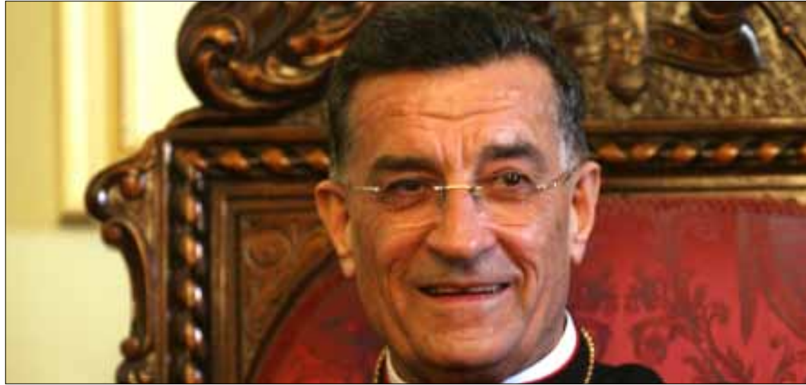
اهتمام وإيجابية وجدية وتفاؤل... تلك أجواء الصرح حيال أي طرح وطني جدي

وأكمل الراعي كرازته: في 7 أيار الماضي في مونتريال: «ندعو الي وقفة وطنية نسميها عقداً اجتماعياً ففي العام 1943، طرح اللبنانيون عقداً اجتماعياً اسمه الميثاق الوطني، ميثاق العيش معاً والذي كان قائماً على «لأعين»: لا للشرق ولا للغرب، اي لا للتبعية لأي بلد. وبعد 70 سنة تقريباً يوجد عندنا أكثر من لبنان، وأصبح كل ينادي بلبنانه ويريد لبنان على قياسه. أن الأوان لنعمل من