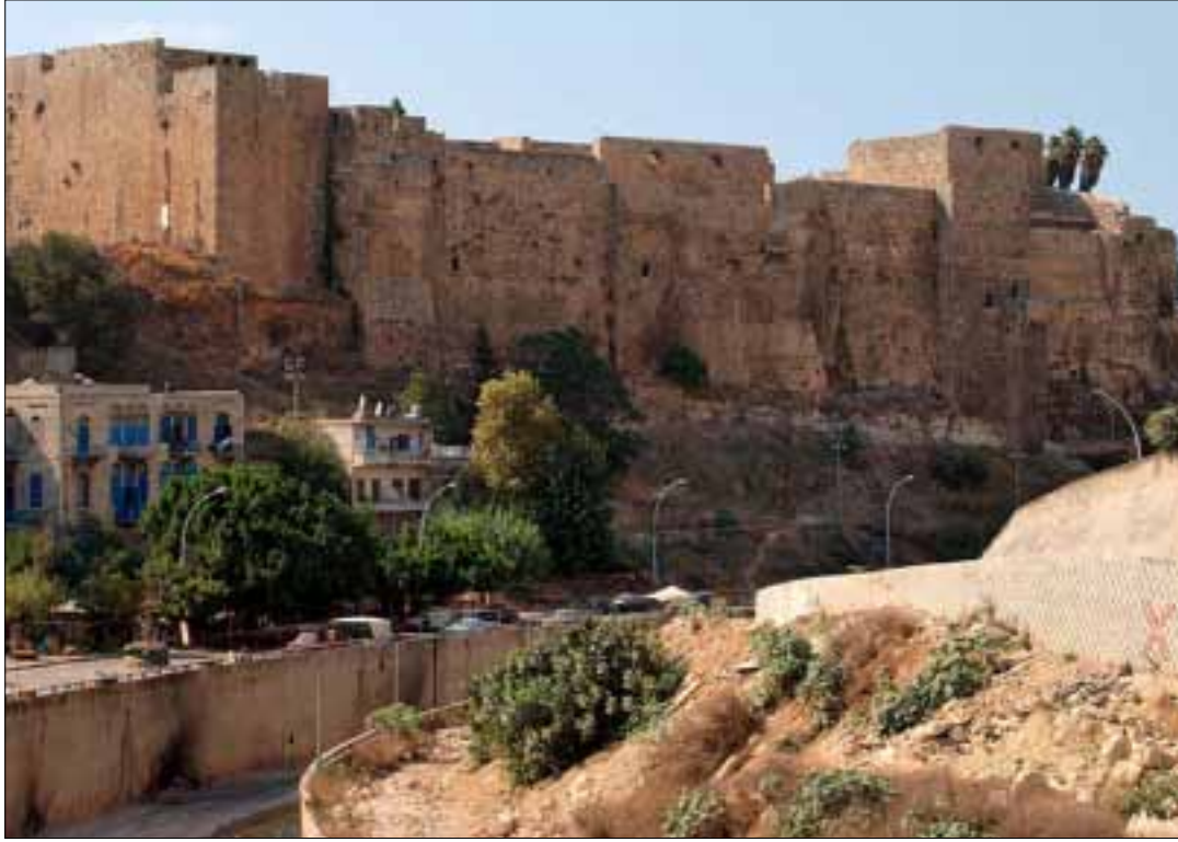
تعتبر طرابلس القديمة منطقة تراثية في خطر ويجب العمل على حماية هويتها ومعالمها

جلس في مكاتب المعهد الفرنسي في بيروت، وفي الجامعة اليسوعية، عشرات من أهل الاختصاص، في اليومين الماضيين، للبحث في سبل حماية التراث. المؤتمر الذي مولته السفارة الفرنسية في بيروت بالتنسيق مع مكتب منظمة اليونسكو الإقليمية، حاول أن يجمع المعنيين من العالم العربي وفرنسا. فكان هناك لبنانيون وفلسطينيون وعراقيون ويمنيون ومصريون وأردنيون وسعوديون، التي جانب فرنسيين من العاملين في مكافحة الاتجار بالآثار أو في حماية الآثار في فترات الأزمات. افتتحت الورشة بكلمات لكل من مدير المعهد الفرنسي ومدير مكتب منظمة اليونسكو الإقليمية ووزير الثقافة والسياحة اللبنانيين ووزير الآثار المصري والنائبة بهية الحريري رئيسة لجنة التربية والثقافة النيابية. تناول السياسيون أهمية التراث في العالم العربي وضرورة المحافظة عليه، وتمنوا للعلماء النجاح في المؤتمر. وكان تشديد على ضرورة توقيع البروتوكول الثاني لاتفاقية لاهاي 1954 لحماية الممتلكات الثقافية في حال النزاع المسلح. وفي سياق العرض والمناقشات بين