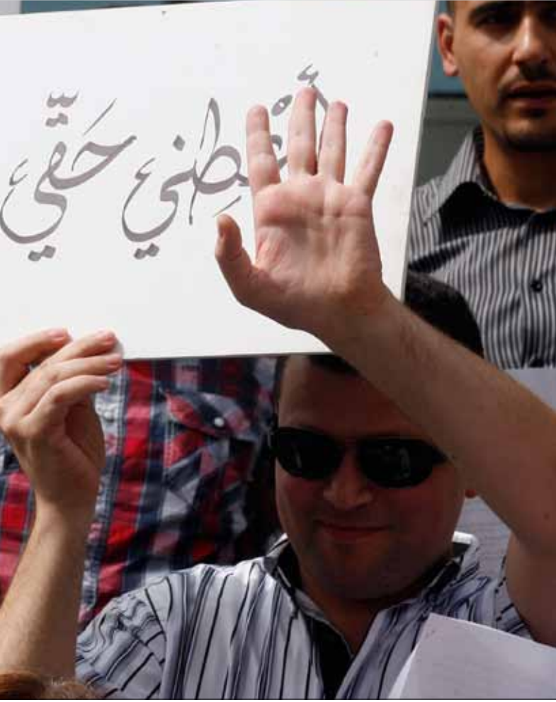
يمكن إقرار سلسلة الرتب والرواتب بصورة منفصلة عن موازنة 2012

«التنسيق النقابية» توافق على مراقبة الامتحانات الرسمية