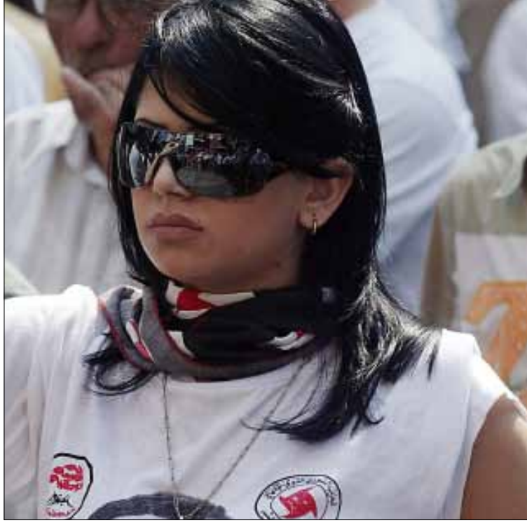
فريقان يخوضان الانتخابات للمرة الأولى منذ أكثر من عشر سنوات (أرشيف)

لا لوائح بالمعنى التقليدي للكلمة، وإنما مجرد تحالفات أولية لن تتطور ملامحها النهائية قبل اليوم. الأكيد أن فريقين يخوضان الانتخابات هذه المرة، للمرة الأولى منذ أكثر من عشر سنوات.