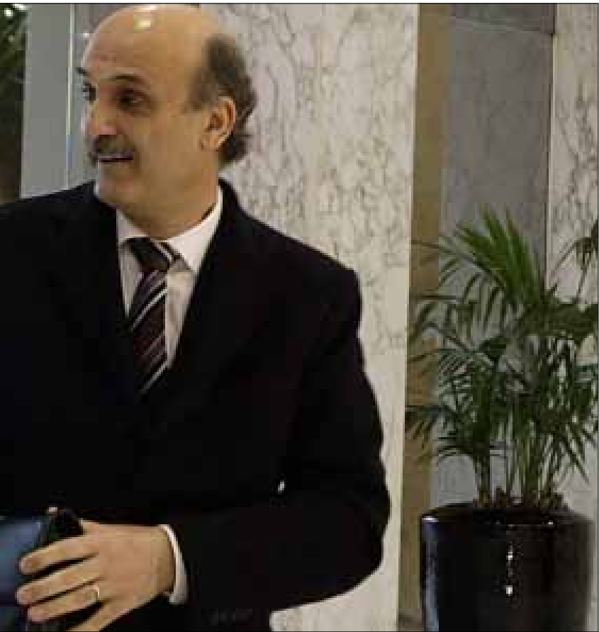
تمايز ججع يعيد الاعتبار لموقف مسيحي مستقل داخل المعارضة بعيداً عن تأثيرات عربية (أرشيف)

«بيت الوسط»، وإصدار بيان موزع على سلسلة نقاط، لوضع خطة مرحلية لإسقاط الحكومة. وهو أمر بدأ واضحاً أنه لم يجد بعد تغطية عربية ودولية له. لكن ذلك لم يمنع حصول نقاشات في الأيام الأخيرة وجس نبض في أكثر من صالون سياسي معني مباشرة بتأليف حكومات حول سيناريوهات بديلة إذا فشل التوافق