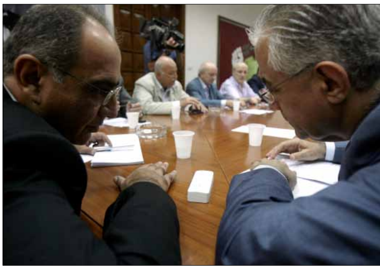
الأمانة العامة تحولت منبراً للمواقف الأسبوعية لا أكثر (أرشيف)

الراجح حتى الآن أن الحديث عن عدد الأعضاء في هذا المجلس ودوره وصلاحياته، لا يزال مجرد كلام. وهذا يعني أن 14 آذار لم تتخذ قراراً بالخطى في هذا الأمر بعيداً. فتارة يحكى عن هيئة عامة ستضمّ نحو عشرة أشخاص إلى جانب المجلس الذي ستخضوي تحت لوائه 350 شخصية حزبية ومدنية. وتارة أخرى يجري الحديث عن عملية انتخابية لم تحدد آلياتها تؤدي إلى تأليف مجلس من نحو 200 عضو حداً أقصى من وزراء حاليين وسابقين ورؤساء أحزاب، إضافة إلى نقابيين وأصحاب مهن وقاعليات وشخصيات اجتماعية واقتصادية. كل هذا التخبط في المعلومات يتطرق إليه قيادي قواتي على اطلاع مباشر على الملف. يؤكد أن «القوات تؤيد المبدأ مئة في المئة، إلا أن التعمق في دراسة المشروع يبقى أساسياً حتى لا تتكرر تجربة الأمانة العامة لقوى 14 آذار، مع العلم بأن مفهوم المجلس مغاير كلياً لمفهوم الأمانة العامة». وإذا