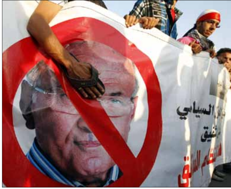
مليونية اليوم ستجد المطالبة بعزل شفيق