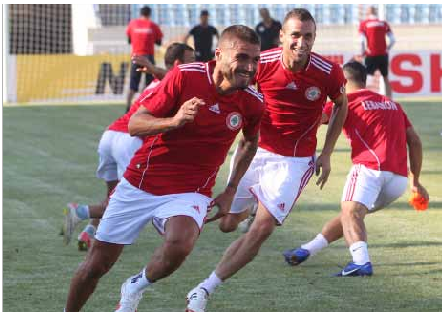
لاعبو المنتخب اللبناني خلال التدريب (عدنان الحاج علي)

وفي المجموعة الثانية، يواجه منتخبا عمان والأردن امتحانين في غاية الصعوبة، عندما يستقبل العماني المنتخب الأسترالي في مسقط عند الساعة 16,00، ويحل الأردني ضيفاً على الياباني عند الساعة 13,30. وكانت عمان قد سقطت في المباراة الأولى خارج أرضها امام اليابان 0 - 3، فيما تعادلت الأردن على أرضها مع العراق 1 - 1.