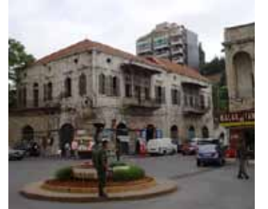
لم يبق من مدينة جونبة التاريخية إلا الواجحة البحرية