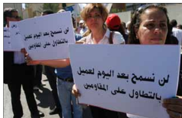
رفع المحزرون مجموعة مطالب إلى بري (هينم الموسوي)

بري أشار، وفق ما نقل عنه المحزرون، إلى عدد من الظواهر التي تؤكد كلامه، ومنها الأحكام الأخيرة الصادرة بحق العملاء، والاستقبالات التي تقام لهم إثر الإفراج عنهم، حتى إن وزيراً في الحكومة اللبنانية لم يتردّد في نقل أحدهم من جهمتهم، رفع الأسرى المحررون جملة من المطالب ومنها: تعديل القانون الذي