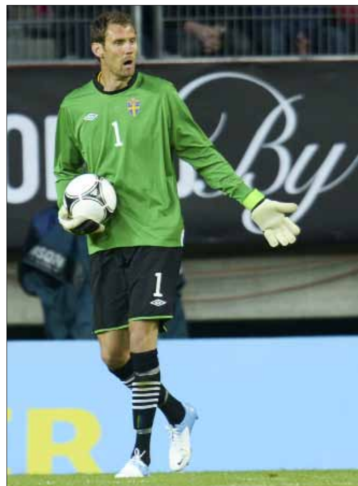
حارس السويد أندرياس إيزاكسون أطول لاعبي البطولة

سجّل عداد كأس أوروبا العديد من الأرقام في النسخ الماضية وفي نسخة 2012. أرقام تتطرق إلى أدق التفاصيل، من طول اللاعبين ومعدل أعمارهم، وصولاً إلى عدد أهدافهم... فما هي هذه الأرقام؟