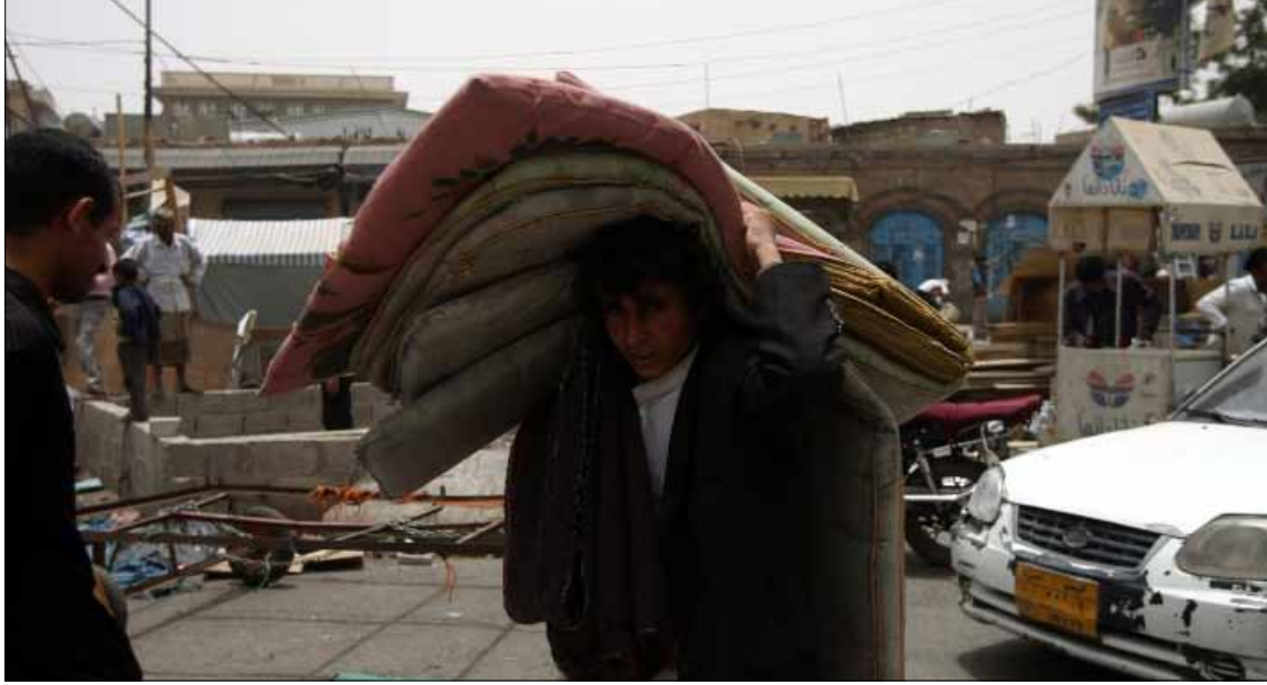
ضغوط سعودية - أميركية دفعت للإسراع باتخاذ قرار إخلاء الساحات

انتهت «العبة الثورة» وصار الوقت مناسباً كي تعودوا إلى بيوتكم وإلى مقاعدكم الدراسية. أرفعوا خيمكم من الساحة، فقد انتهت المهمة ونجحتكم في إسقاط الرئيس. هكذا وصلت الرسالة إلى شباب الثورة اليمنية، من قبل بعض أحزاب اللقاء المشترك، وإن كان ذلك بشكل غير مباشر. فقد قرأ الشباب هذه الرسالة عبر عمليات الجرف، التي طاولت أول من أمس مساحات واسعة من منطقة «ساحة التغيير» التي يقيمون فيها منذ شباط من العام الماضي، وضحى من أجل بقائها مئات من الشباب سقطوا برصاص قوات الرئيس المخلول علي عبد الله صالح. الحجة المعلنة أن الخيم صارت تعرق وصول عربات الإسعاف إلى المستشفى الكبير المجاور لها. لكن هذا المستشفى في مكانه منذ وقت طويل، ولم يتحدث أحد عن الإعاقة التي تمثلها مجموعة الخيم. وهو ما دفع مئات الشباب إلى التظاهر احتجاجاً على إزالة الخيم، ما أجبر اللجنة التنظيمية العليا للثورة على الإعلان أن الثورة مستمرة، وأن عملية الإزالة ما هي إلا «نوع من إعادة ترتيب الساحة وملء الفراغات بداخلها بعد رحيل عدد من شباب القبائل منها». لكن هذا التبرير لم يُقنع الكثيرين من شباب الثورة، وخصوصاً بعد واقعة الاعتداء بالعصي والأسلحة البيضاء، التي تعرض لها عدد منهم مساء أول من أمس، من جنود تابعين للفرقة الأولى مدرع التابعة للواء علي محسن الأحمر بمعية شباب قبيل إنهم تابعون لحزب التجمع اليمني للإصلاح، نتيجة مطالبة أولئك الشباب بالصعود إلى المنصة، ومخاطبة شباب الساحة بعدم الرحيل منها إلا بعد تحقيق كامل أهداف الثورة. هذا الإجراء أشعر الشباب بأنهم قد تعرضوا لخديعة. يقول محمد العديني،