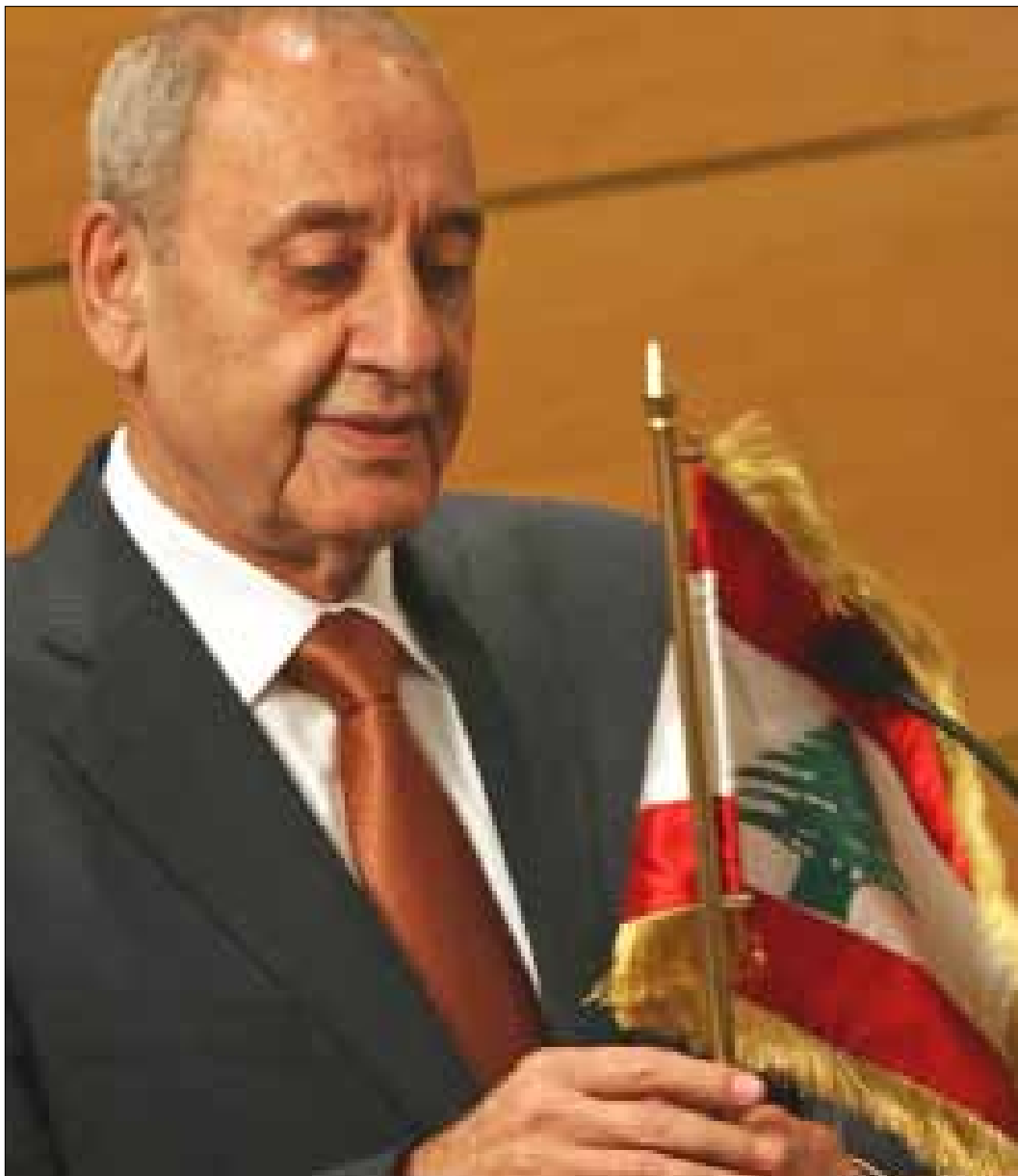
المدعي الدولي اتهم بري بانتهاك المادة 62 من النظام الداخلي لمجلس النواب (أرشيف)

قرار المصادقة على اتفاق المحكمة صدر عن سلطة خارجة على هيئات العيش المشترك