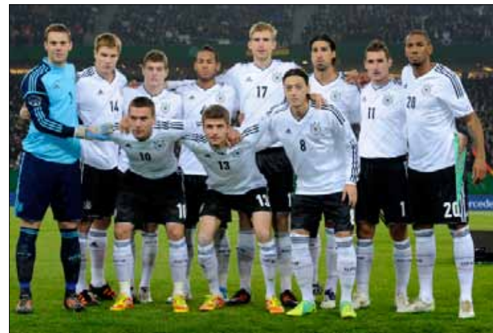
منتخب ألمانيا الأكثر تتويجا بلقب البطولة والأصغر سناً في هذه النسخة

هذا من الماضي، أما بالنسبة إلى النسخة الحالية فإن الأرقام لها كلمتها أيضاً. فهل تعلم أن المنتخب التسعة الفائزة باللقب موجودة جميعها في بولونيا وأوكرانيا؟ هل تعلم أن حارس مرمى اليونان كوستاس شالكياس هو الأكبر سناً