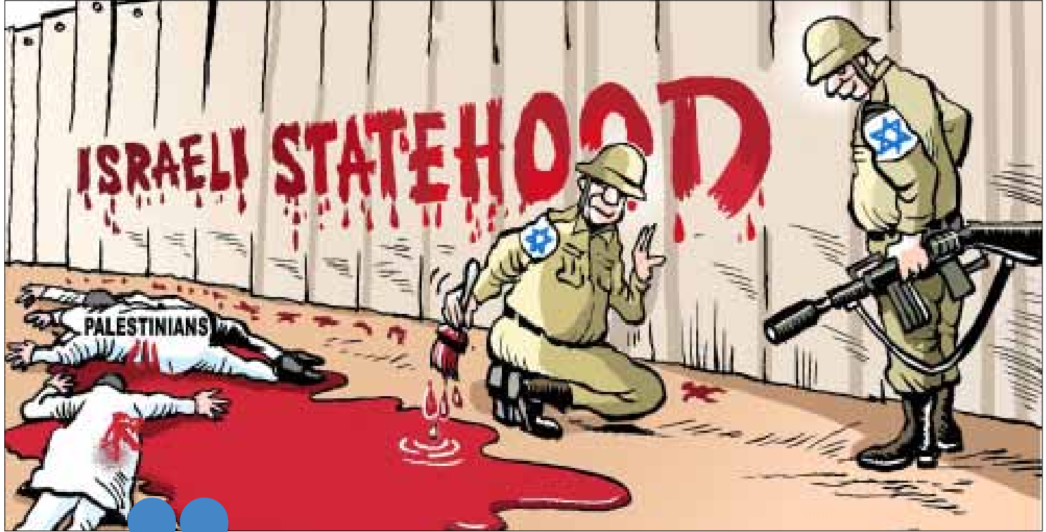
باريش نافي - الهند

عشية وصولها إلى تل أبيب، أدلت نادية الفاني بحوار لصحيفة «هآرتس» كزرت فيه الحجج الواهية ذاتها: «لا أزال أعارض صهيونية إسرائيل، ولم أبدل آرائي السياسية»، لكن هذه التلميحات لم تمنع الصحيفة العبرية من التساؤل عن سر قرار المخرجة زيارة إسرائيل، وهي التي وقعت بعد عدوان تموز عام 2006، عرضة لمقاطعة إسرائيل. أما رد الفاني على تساؤل الصحيفة، فجاء ملتبساً ومتناقضاً: «بعد التشاور مع أصدقائي الفلسطينيين (!) قررت أن أكسر عهداً كنت قد قطعته على نفسي، قبل سنوات، بالأنا تظاً قدامي إسرائيل»، قبل أن تضيف «ثم إن هذه ليست دعوة إسرائيلية، بل هي دعوة للمشاركة في ملتقى فرنسي».