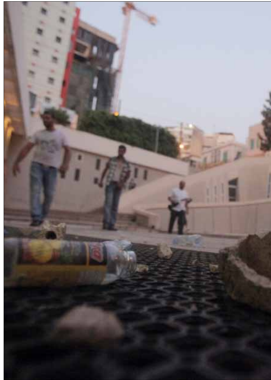
آثار معركة أمس الأول لا تزال موجودة أمام مؤسسة الكهرباء