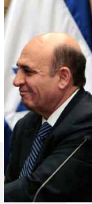
موفاز خلال مؤتمر صحفي في القدس المحتلة في أيار الماضي

وقال موفاز إن «موضوع التجنيد هو موضوع ميدئي، وإن أي تنازل بهذا الخصوص سيضرب بصورة حزب «كاديما» لدى الجمهور الإسرائيلي». وأشار إلى أنه كان مصمماً على بذل قصارى جهده للتوصل إلى اتفاق مع حزب «الليكود»، بل وأن يدفع مقابل ذلك ثمناً لدى الرأي العام الإسرائيلي، لكن رئيس الوزراء رفض كل الاقتراحات بهذا الشأن، ومن بينها صيغة جديدة لقانون الخدمة العسكرية والمدنية والمعروف بقانون «المساواة في تحمل الأعباء»، التي تجبر اليهود المتدينين والعرب على أداء