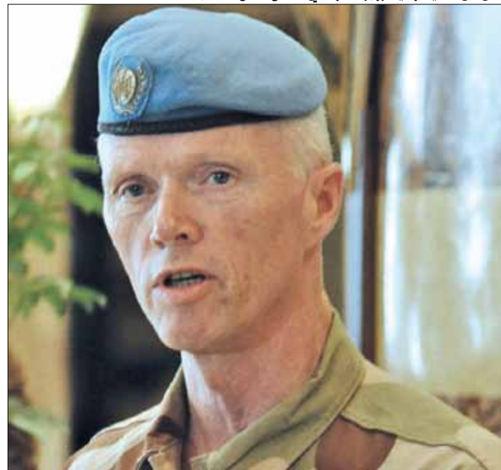
أعلن عن نهاية ولاية روبرت مود في دمشق أمس (أ ف ب)

إزاء هذه المعطيات وغيرها، ورغم الموقف الأميركي المعلن إما أن يكون هناك قرار تحت الفصل السابع أو يتم إلغاء بعثة المراقبين من أساسها في سوريا، بدأت الدول الغربية بقيادة الولايات المتحدة تعيد الحسابات بهدف تقليص الخسائر وحصر نتائج نيران الانتكاسة العسكرية