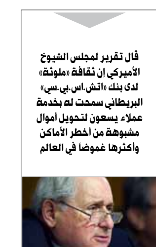
قال تقرير لمجلس الشيوخ الأميركي إن ثقافة «ملونة» لدى بنك «اتش.إس.بي.سي» البريطاني سمحت له بخدمة عملاء يسعون لتحويل أموال مشبوهة من أخطر الأماكن وأكثرها غموضاً في العالم

أكدت وزيرة الخارجية الأميركية هيلاري كلينتون في القدس المحتلة أول من أمس أن الولايات المتحدة ستستخدم «كل عناصر القوة الأميركية» لمنع إيران من الحصول على السلاح النووي، فيما اعتبرت طهران الاعتداء الأميركي على زورق قبالة سواحل الإمارات بأنه «يكشف التهديد الذي تشكله القوات الأجنبية على الأمن الإقليمي». وقالت الوزيرة الأميركية «سنستخدم كل عناصر القوة الأميركية لمنع إيران من حيازة السلاح النووي»، مضيفاً أنه «كما قال الرئيس (الأميركي باراك) أوباما، فإن العالم أجمع حريص على منع إيران من حيازة السلاح النووي. بفضل جهودنا لتوحيد صفوف المجتمع الدولي فإن إيران تخضع لضغوط أقوى من أي وقت مضى. وهذا الضغط سيتواصل وسيستمر ما دامت إيران لم تف بتعهداتها الدولية». وتابعت كلينتون «نفضل حلاً دبلوماسياً والقادة الإيرانيون لا تزال لديهم إمكانية القيام بالخيار الصائب. في النهاية الخيار يعود إليهم». وقالت «قلت بوضوح إن الاقتراحات المقدمة حتى الآن من إيران في إطار مفاوضات مجموعة 5+1 لم تكن مقبولة. وعلى الرغم من ثلاث جولات من المحادثات، لم تتخذ إيران بعد على ما يبدو بعد القرار الاستراتيجي بالاستجابة لمخاوف المجتمع الدولي والإبقاء بتعهداتها». وأشارت الوزيرة الأميركية إلى أنه بفضل الجهود الأميركية لحشد المجتمع الدولي للتحرك في مواجهة التهديد النووي الإيراني، تخضع طهران «لضغوط أكبر من قبل»، مشيرة إلى أن إدارة أوباما «تضغط للمسير قدماً بنشاور وثيق مع إسرائيل».