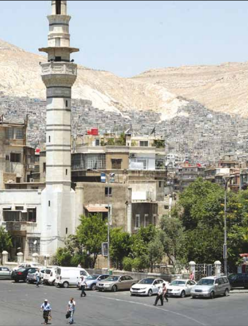
ساحة السبع بحرات في دمشق، أمس

انتقلت بوصلتة «الاشتباكات» إلى عاصمة الأمويين. حشد «الجيش الحر» قواه العسكرية والإعلامية، وخلفه الإخوان المسلمون لكسب «المعركة الفاصلة»، بينما أعلنت وزارة الإعلام عن «التصدي لمقاتلين تسللوا إلى دمشق»