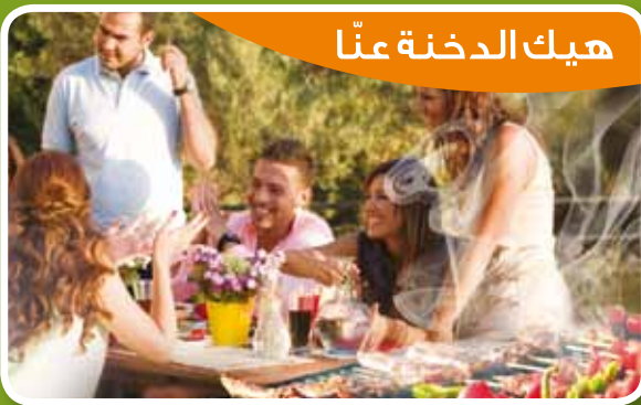
هيك الدخنة عنا