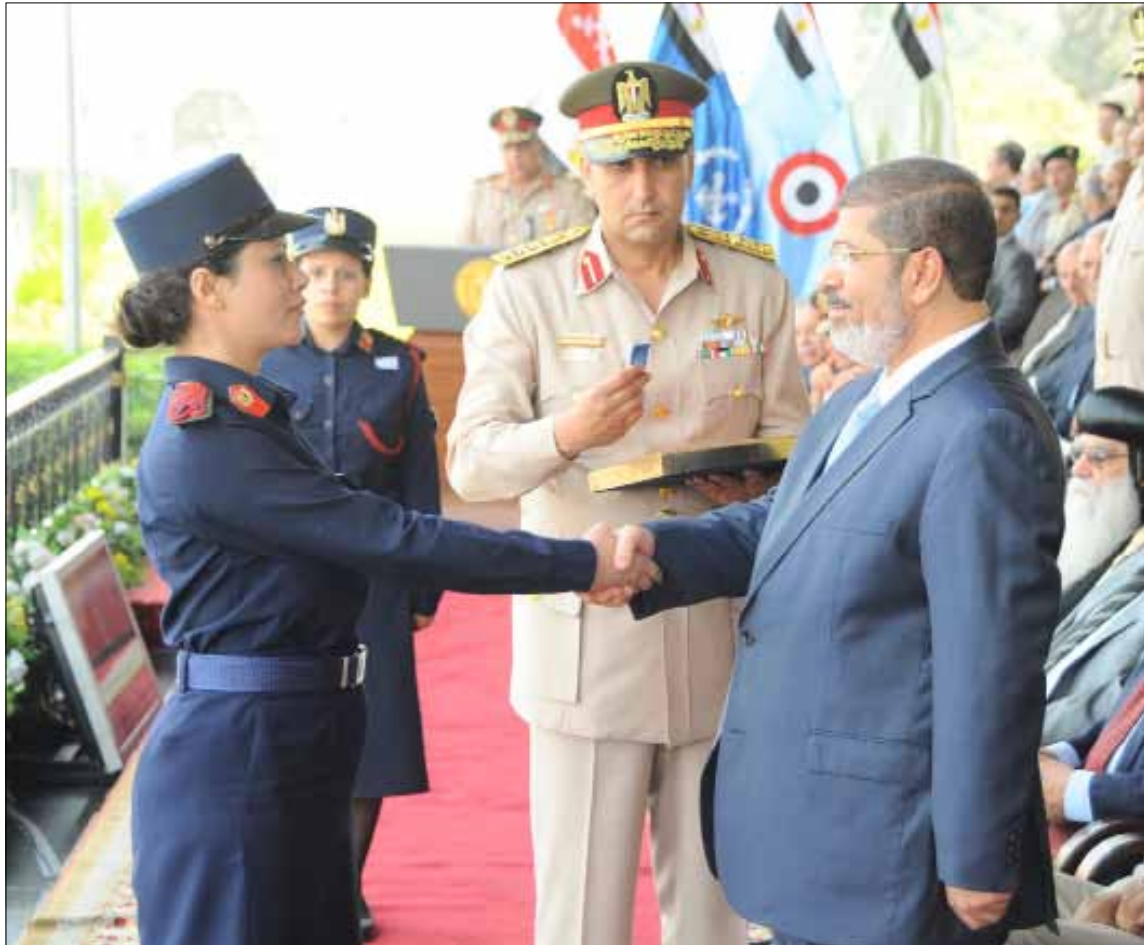
مرسي خلال مشاركته في حفل التخرج في الأكاديمية العسكرية أمس

وأجلت المحكمة الحكم في دعوى حل الجمعية التأسيسية لصياغة الدستور إلى يوم غد بعدما تقدم محامو الإخوان بطلب رد هيئة المحكمة. كذلك أجلت إلى اليوم نفسه أيضاً دعوى إلغاء الإعلان الدستوري المكمل. ويرى عدد من المراقبين أن تلك هي المعركة الأخيرة للعسكر مع الإخوان، ففي حالة إلغاء تشكيل الجمعية التأسيسية الحالية سيكون المجلس العسكري هو المسؤول عن تشكيل الجمعية الجديدة، وأيضاً في حال إلغاء الإعلان الدستوري المكمل، سيصبح رئيس الجمهورية متمتعاً بالصلاحات التي نص عليها دستور 1971 الذي يمنح الرئيس صلاحيات واسعة. ويرى عدد من القانونيين أن إلغاء الإعلان الدستوري المكمل، سيحدث أزمة في مسألة الصلاحيات باعتبار أن الإعلان الدستوري الذي تم الاستفتاء عليه لم يتطرق إلى تلك المسألة، في وقت يعتبر فيه دستور 1971 ملغى. ملامح تلك المعركة كانت واضحة أمس في الأعداد الكبيرة التي دفعت بها جماعة الإخوان المسلمين إلى ساحة المحكمة، والتهافتات التي طالبت بتطهير القضاء، وتأييد مرسي إلى جانب عدم حل الجمعية التأسيسية لصياغة الدستور. يأتي هذا في الوقت الذي هاجم فيه أعضاء مجلس الشورى، ذي الأغلبية الإسلامية، والأكثرية الإخوانية، وسائل الإعلام واتهموها بتضليل الرأي العام والوقوف ضد الرئيس. وقالوا في جلسة لهم أمس، إن الإعلام لا يهتم بنشاط الرئيس في الخارج ولا سيما زيارته لدولة إثيوبيا وعودته بالصحافية شيماء عادل، التي كانت قيد الاحتجاز في السودان. ولغفتوا إلى أن هذا الإعلام نفسه كان «يهلل لمبارك لو ذهب لأي دولة في الخارج».