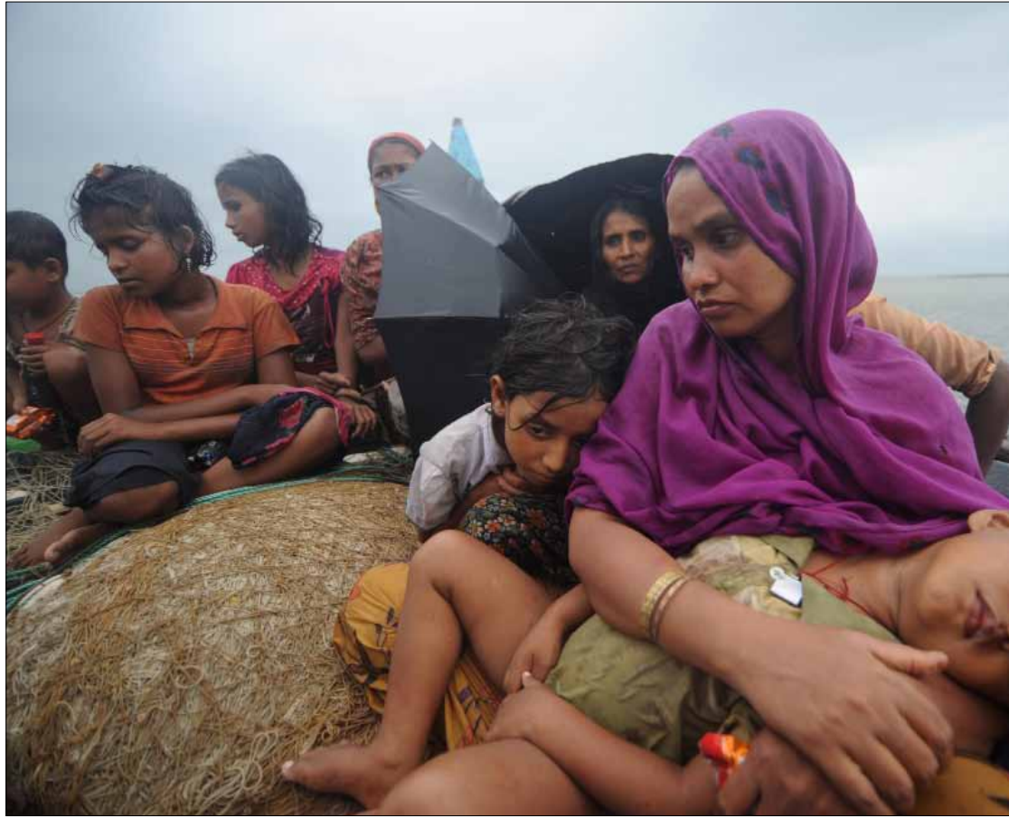
لجا المسلمون إلى الهرب بالقوارب باتجاه بنغلادش

كذلك وصفت مراسلة صحيفة «نيويورك تايمز» في بنغلادش، الاحداث بأنها ليست عنفاً طائفياً فقط بل «تطهير عرقي تدعمه الدولة»، وأن دول العالم لا تضغط على ميانمار لوقفه، مشيرة إلى أنه حتى زعيمة المعارضة و«أيقونة» الديموقراطية في ميانمار» والفائزة