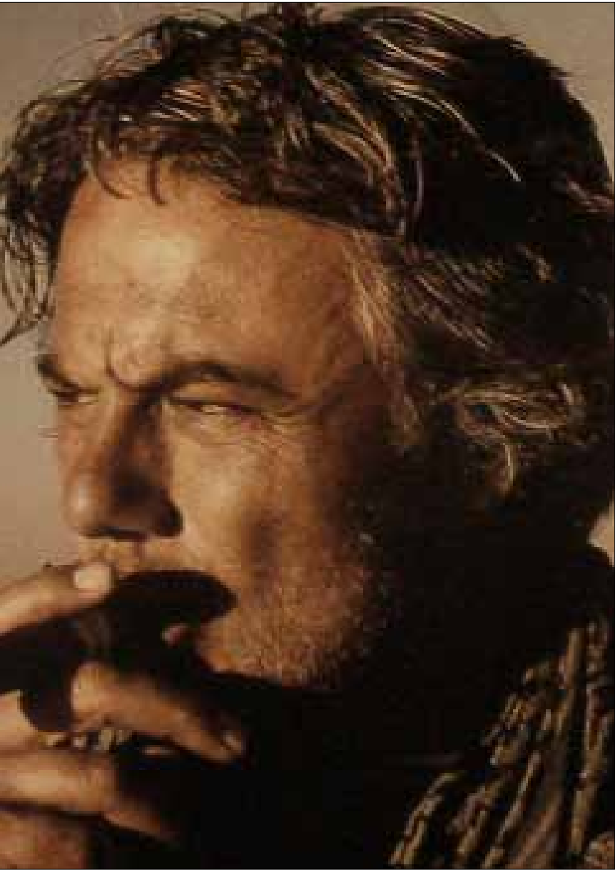
مناف طلاس (أرشيف)

في منزله في حي المزة، درج بعد إعلان اعتكافه احتجاجاً على اهمال خياره السياسي للتعاطي مع الأزمة، على استقبال أصدقاء له، منهم من يوافقه رأيه أو يختلف معه، حيث يجاهر أمامهم بأنه غير راض عن الخيار الأمني لحل الأزمة السوريّة، ويعدد أمامهم أسماء مجموعة أشخاص في الأجهزة الأمنية وداخل الحلقة الضيقة حول الرئيس، بوصفهم المسؤولين عن أخذ