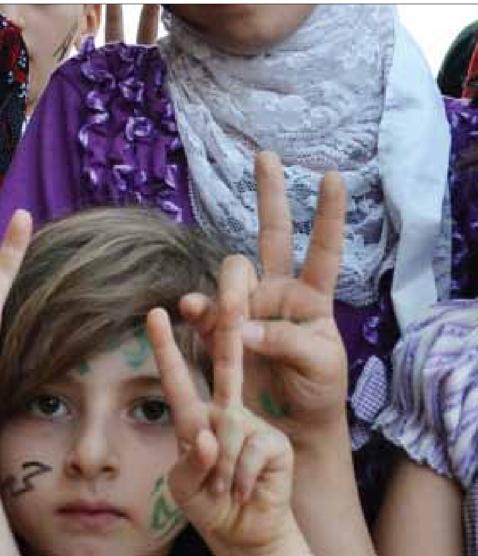
اطفال كفرنبل ينظرون

واحد من كبار ضباط بشار الأسد وابن أحد أكبر رموز نظام حافظ الأسد؟ البعض يرى أن هذين الانشقاقين يؤكدان السقوط القريب لنظام الأسد. والبعض يعطي موعداً قبيل/أو نهاية العام الجاري. ويؤكد آخرون أن العديد من السياسيين والعسكريين لا يؤيدون النظام، لكنهم لا يجروؤن على إعلان انشقاقهم خوفاً على عائلاتهم ومصالحهم. وفي الوقت نفسه، يؤكد هؤلاء سيطرة الجيش السوري الحر على 40 أو 60 أو 70% من الأراضي السورية؛ إذا كان صحيحاً ما يقولون، ألا يوجد أي من عائلات التي تخضع لسيطرة ومصالحهم في المناطق التي تخضع لسيطرة الجيش الحر؟ وأين هي عائلات نواب حمص وحماه وإدلب ودرعا حيث تدور معارك