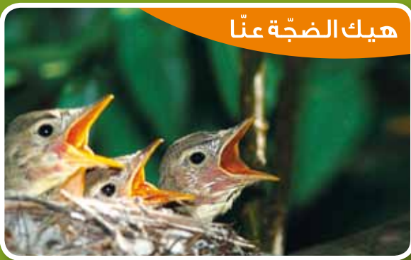
هيك الضجة عنا