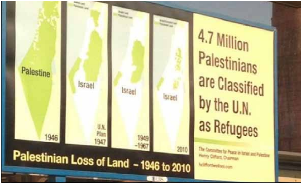
اللوحات التي انتشرت في مترو نيويورك

قناة «فوكس نيوز» المحافظة والأكثر مشاهدة في الولايات المتحدة، وصفت الحملة بـ«الاستفزازية»، وركزت على الانتقادات التي تتهم الإعلان بأنه «مضلل يفتقر إلى الدقة»، كما توقّف