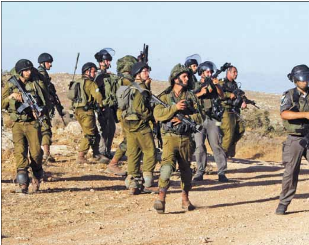
جيش الاحتلال: تم تاهيل منظومة الاحتياط وتدريبها بنحو غير مسبوق (أرشيف)

وواصلت إسرائيل أمس، كما في الأيام والأسابيع الماضية، التأكيد