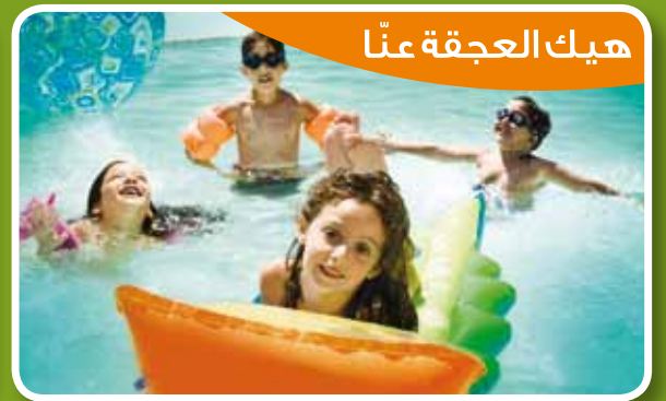
هيك العجقة عنا