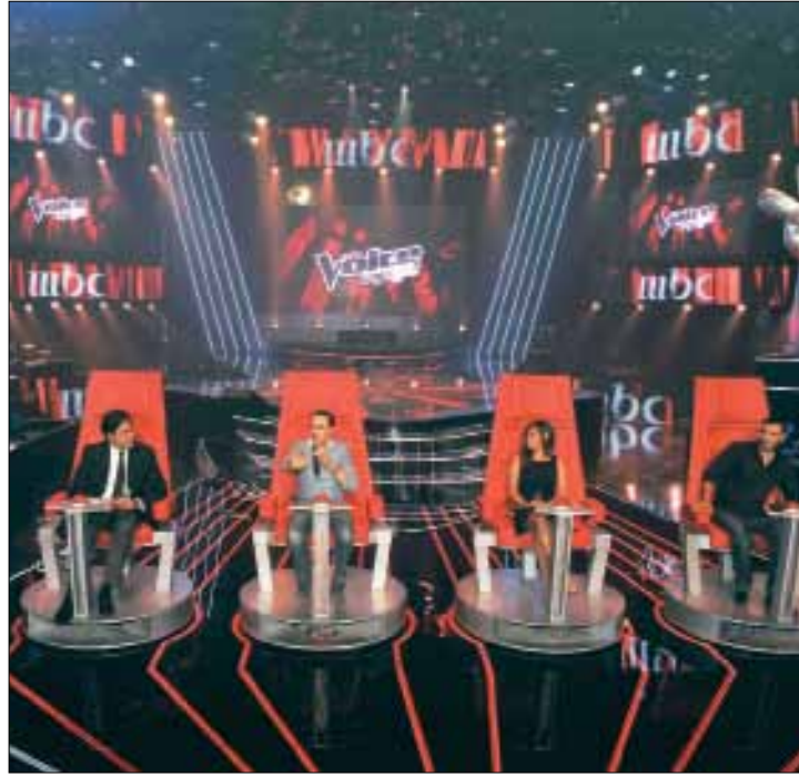
كازم وشيرين وصابر ومازن حايك خلال المؤتمر أول من أمس

يكفي أن نعرف أعضاء لجنة تحكيم (أو المدربين) برنامج The Voice، لنؤكد من ضخامته. البرنامج الذي سينطلق في نسخته العربية في الشرق الأوسط وشمال أفريقيا بعد رمضان على mbc1، سيتولى انتقاء مشاركيه وصقل مواهبهم كل من كازم الساهر، عاصي الحلاني، شيرين عبد الوهاب، وصابر الرباعي. أربعة نجوم حضر ثلاثة منهم المؤتمر الذي عقدته mbc1 أول من أمس في استوديو البرنامج في ذوق مصبح (شمالي بيروت). أما الغائب عاصي الحلاني، فقد أطل من مدينة موناكو في رسالة مصورة قال فيها إن The Voice سيكون البرنامج «الأفضل والأقوى والأهم، وخصوصاً أنه سيتحدى المقولة السائدة بأن الجمهور العربي صار يسمع بعبونه». «البرنامج صعب»، هكذا بدأ كازم الساهر حديثه، مشيراً إلى أنه يشارك في هذه التجربة «رغم صعوبتها بالنسبة إلي، بما أنني اعتدت الابتعاد عن الأضواء». وأضاف «القيصر»: «تذكرني هذه التجربة ببداياتي حين كنت أركض من مكان إلى آخر بحثاً