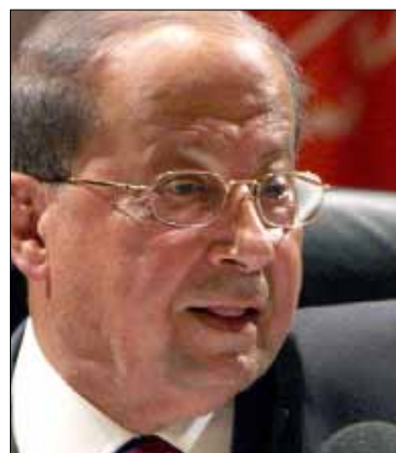
عون: الهجوم أفضل وسائل الدفاع (أرشيف)

في قيادة الرابطة اليوم العماد ميشال عون وجرانان: صهر مدني يدعى الوزير جبران باسيل وآخر عسكري يقود فوج المغاوير يدعى العميد شامل روكز. وتحيط القيادة نفسها بمجموعة ضباط مدنيين يقفون في الصف حاملين ملفات أحسنوا تحضيرها