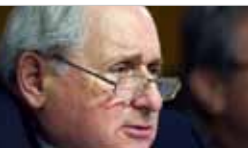
بما في ذلك المكسيك وإيران وجزر كايمان والسعودية وسوريا. وقال رئيس لجنة التحقيقات الدائمة في مجلس الشيوخ كارل ليفين (الصورة) إن «ثقافة اتش.إس.بي.سي» تلوّنت على نطاق واسع لفترة طويلة».