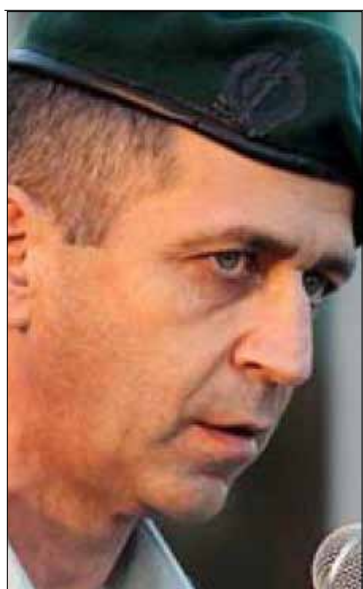
أيف كوخافي (أرشيف)

بعد أحداث بابا عمرو، أصبح أكثر وحدة، لكن صلته بالأسد لم تنقطع. الهاتف ظل مفتوحاً بالاتجاهين بين منزله في المرزة وبين مقر الرئاسة. علق: