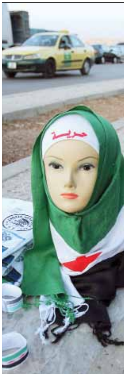
اعلام وقمصان للبيح امام السفارة السورية في عمان

يجب أن تنتهي السلطة ويرحل من قرر هذا الخيار الديموي. وكذلك لكي تمارس مؤسسات الدولة نشاطها لا بد من أن تنتهي السلطة التي قررت اختصار الدولة بالعنف المسلح. الوضع يتسم بالشلل الكامل في الاقتصاد والدولة. والفكرة التي باتت واضحة هي أن هذه السلطة عاجزة عن الحسم، ولهذا يجب أن ترحل. ولا شك في أن هذا الشلل يؤثر إلى أن العقدة يجب أن تحل، أي إن الجمود يجب أن ينتهي عبر تغيير السلطة، فهذه السلطة هي من أوصل إلى ذلك، ولهذا عليها أن ترحل.