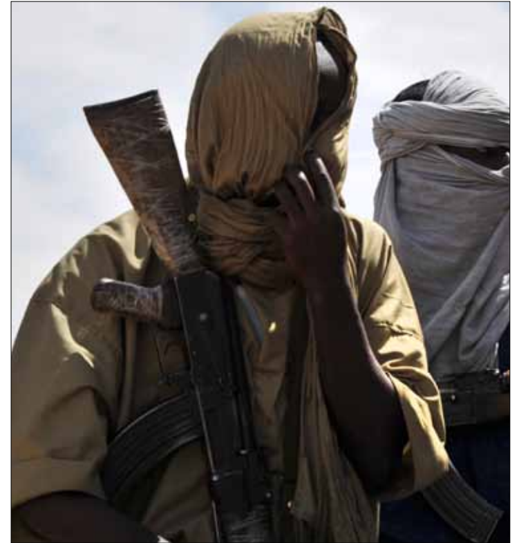
مسلمان إسلاميان في غاو شمال مالي

شمال مالي «تشكل تهديداً أمنياً لكافة دول منطقة الساحل ولكافة الأنظمة الديمقراطية بالمنطقة». ووسط هذه التطورات أجلت الحكومة الإسبانية متعاونين إسبان وفرنسيين وإيطاليين من شمال مالي بسبب «تزايد انعدام الأمن». وقال وزير الخارجية الإسباني، خوسيه مانويل غرثيا مرغابو، إن شمال مالي تحول إلى «مقل إرهابي»، وثمة مؤشرات صحيحة تدل على «تزايد انعدام الأمن بشدة في المنطقة»، موضحاً أن المتعاونين الإسبان كانوا حتى الآن في مخيمات اللاجئين الصحراويين في منطقة تندوف، جنوب الجزائر. وأكدت الخارجية الإسبانية أنها ستكون «مستعدة لدراسة دعم بعثة في إطار المجموعة الاقتصادية لدول غرب أفريقيا التي تضطلع بالدور الرئيسي في المنطقة»، وفيما تنتظر المجموعة الأفريقية تفويضاً من مجلس الأمن الدولي ومساعدة خارجية، وخصوصاً لوجستية وتقنية، يبدو أن الوضع في مالي يسير نحو المجهول بحسب المراقبين.