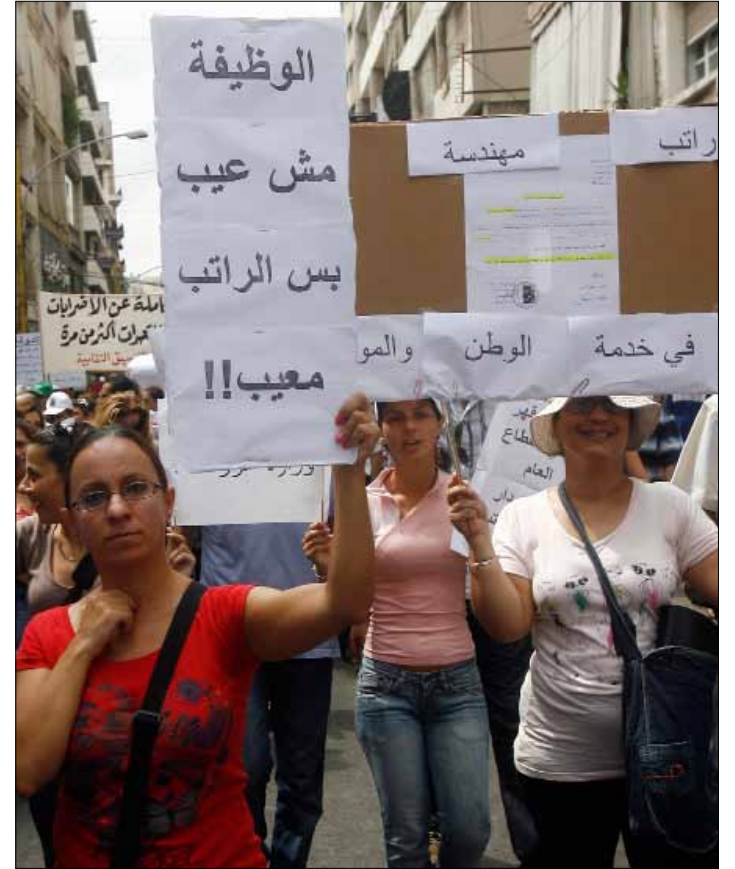
جزم وزير التربية بان إعطاء الإفادات مسألة غير واردة

اللائق دعوة وزير الاقتصاد نقولاً نحاس في حديث إذاعي صباحي الجميع إلى تحمل المسؤولية وإراحة الناس والابتعاد عن تسجيل الانتصارات والمواقف؛ لأن القضية تتعلق بانتظام المال العام. الوزير نفسه دعا قبل أيام