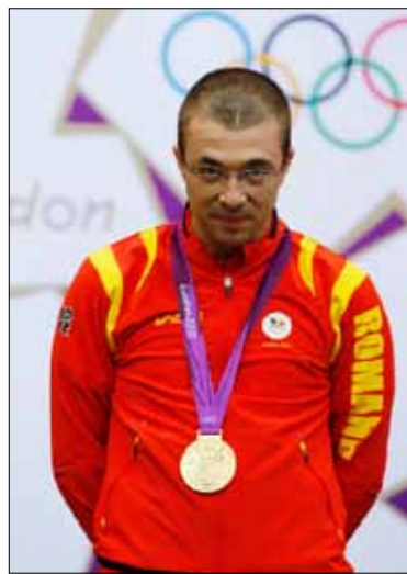
مولدوفيانو على أعلى منصة التتويج