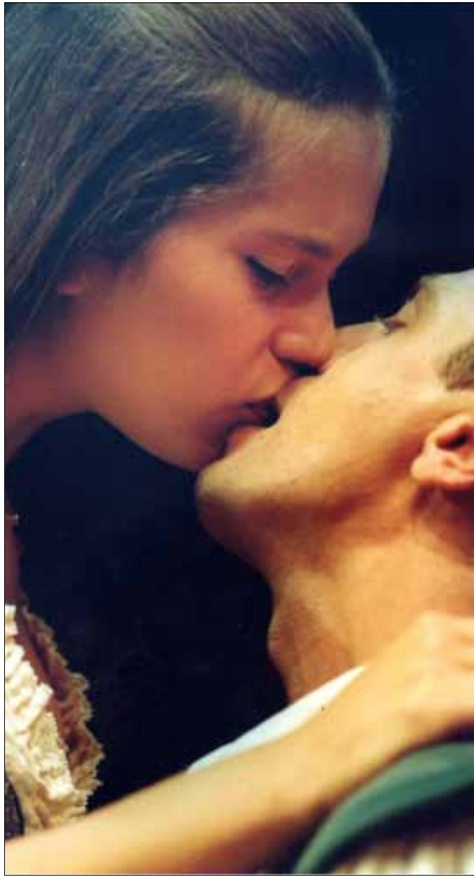
من «روميو وجولييت»

لنتذكر أيضاً هنا شراكة مسرح «القصة» مع مسرح «الخان» الإسرائيلي في إنتاج مسرحية «روميو وجولييت» (1994) التي حوّلت الصراع العربي الإسرائيلي إلى مجرد خلاف بين عائلتين «يعيشون في نفس الأرض منذ عصور سحيقة... بهدف التذكير بأنّ ثمن كراهية الأجداد هو موت المحبة» كما أوضح منشور العمل الذي ترجم يومها إلى لغات عدة.