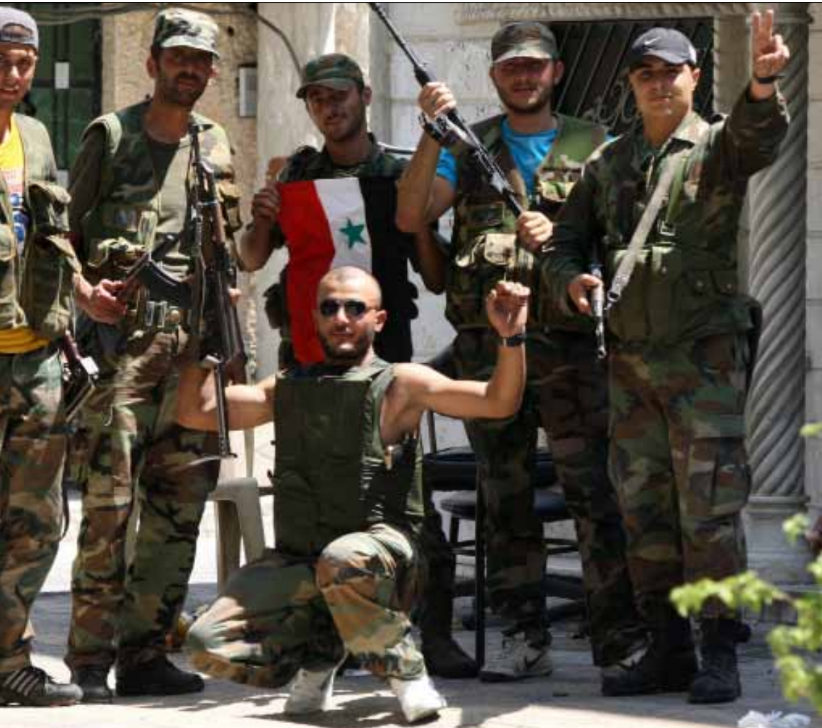
عناصر من الجيش السوري في الميدان قبل أيام

منذ بداية الاحتجاجات الشعبية في سوريا وتطوراتها المتسارعة، تأثرت مجمل مخيمات اللاجئين الفلسطينيين الموزعة جغرافياً على غالبية المحافظات والمدن السورية، بتداعيات الأزمة السياسية والإنسانية، طالوت أحداث الأزمة السورية الدامية عدة مخيمات في الفترة القريبة الماضية، ما جعل فصائل المقاومة الفلسطينية في سوريا تعمل جاهدة لـ«منع انجراف الشارع الفلسطيني في الحرب الدائرة على الأرض، وتأكيد مفهوم الحياد الإيجابي»، كما صرح لـ«الأخبار» مسؤول إعلامي في مكتب تابع لإحدى فصائل المقاومة، فضل عدم ذكر اسمه، أو التنظيم الذي يمثله. ويوضح المسؤول الإعلامي أنه «مع اشتعال الشرارة الأولى للانتفاضة في مدينة درعا الحدودية الجنوبية، سرعان ما وجه الإعلام السوري الرسمي والخاص المحسوب عليه، أصابع الاتهام إلى شباب مخيم درعا للاجئين الفلسطينيين، وسماهم مخربين وخارجين عن القانون». وأضاف: «تضحّت الصورة بعدها، وعرفت حقيقة الأمر»، لافتاً إلى أن «هذا ما تكرر في مخيم الرمل الفلسطيني على شاطئ اللاذقية، واليوم في مخيم اليرموك أيضاً»، في إشارة واضحة منه إلى «الفتنة، والتعتيم على الحقيقة، واللعبة الرخيصة والمفضوحة التي تعمل عليها أطراف لاعبة في الصراع في