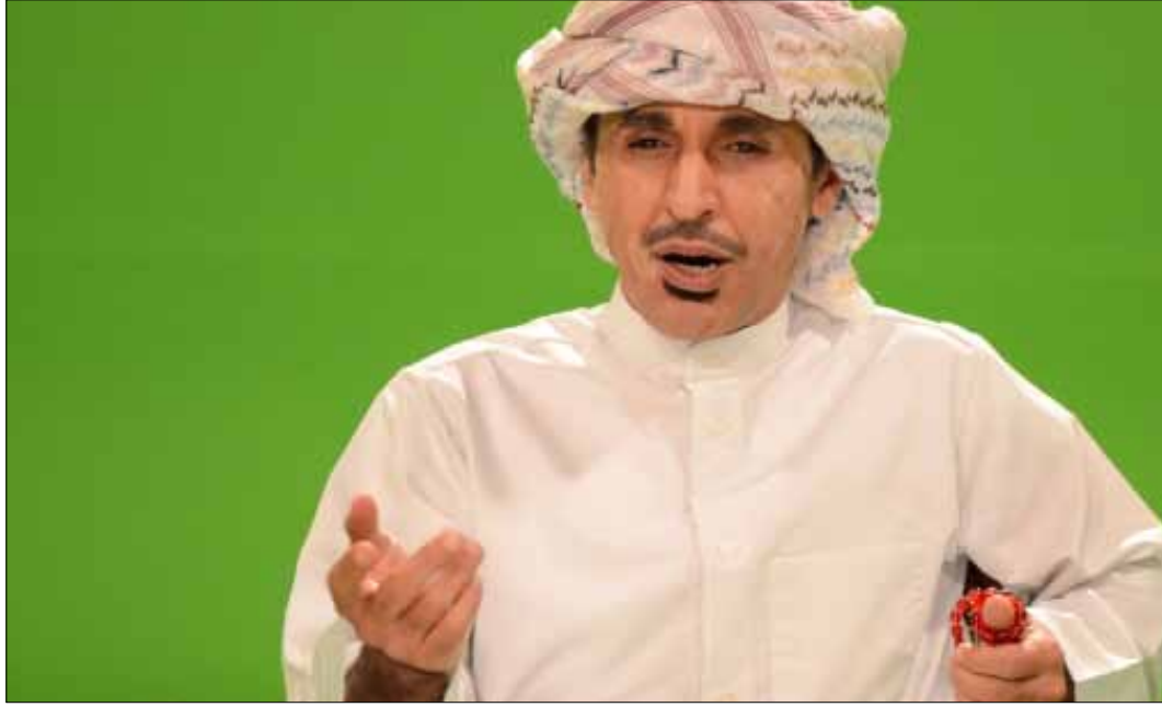
من «واي فاي»

يبدو أنّ القائمين على الفضائيات التي يزيد عددها بإطراد في صنعا، يتعاملون باستسهال مع مسألة إنتاج أعمالهم وبرامجهم الرضائية، وخصوصاً أنّ «لا أحد يتابع القنوات المحلية في عصر الفضائيات»، مكتفين بتقديم إنتاجهم كيفما اتفق، لأن المهم هو ملء الفراغ؛ وسط الانقسام في الآراء السياسية واختلاف الأهداف والمصالح، اتفق اليمينيون على أنّ برنامج الاستكشافات الساخرة «واي فاي» هو عمل يسيء إليهم، ويقدم المواطن اليمني على أنه «إرهابي جاهل وأحمق». إذ أعلن محامون وناشطون يمنيون عن نيتهم رفع دعوى ضد «أم بي سي» السعودية بحجة بثها هذا العمل الذي يظهر اليمينيين كجماعات إرهابية جهلة وحمقى، ولا يهتمون سوى بالتفجيرات وتناول الطعام ومضغ القات. لكن إذا تعقنا أكثر في القضية، لرأينا أنّ البرامج والأعمال اليمنية هي المسؤولة عن ترويج هذه الصورة. في هذا الإطار، يبرز مسلسل «همي هك» على قناة «السعيدة» اليمنية، كأحد الأعمال التي تذهب بعيداً في مسألة إظهار الفرد اليمني كشخصية بلهاء وفوضوية ودائمة الصراخ وفي ثياب رثة طوال الوقت. وفي المحصلة، ينجح العمل في تسويق صورة هزيلة عن المواطن اليمني، علماً بأن هذا العمل يتطرق إلى قضايا اجتماعية غاية في الأهمية، وتمس الحياة اليومية للفرد، لكن طريقة الطرح سيئة وتصيبه في مقتل.