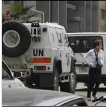
تضم الشبكة لبنانيين مسيحيين ومسلمين

للموساد داخل المجموعة أمراً وارداً، نظراً إلى أن كميات من الأسلحة المضبوطة في حوزتها هي ذات مصدر إسرائيلي.