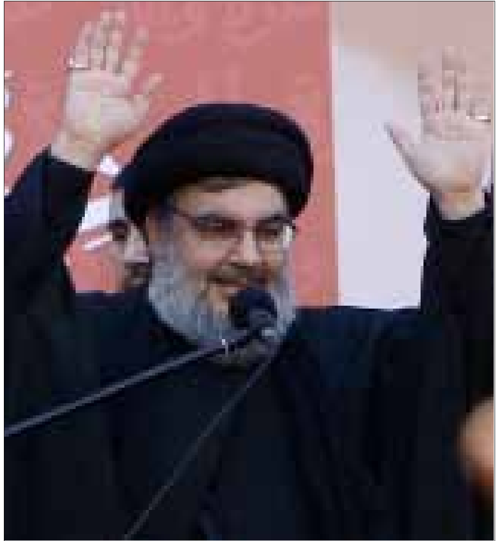
السيد حسن نصر الله (مروان بو حيدر)

حزب إسلامي أو حزب عربي أو حزب قومي أو حزب شيوعي. هذا ليس مهماً. ليس مهماً أنك تعمل لحيه أو تحلق لحيته، تلبس كرافات أو لا تلبس كرافات. المهم ما هي سياستك». وهكذا، فبالنسبة إلى الإسلامي نصر الله أيضاً، لا يهم أن تكون إسلامياً أو يسارياً أو قومياً. المهم ما هي سياستك نحو الحلف الأميركي. الصهيوني. المهم هو الموقع السياسي الذي تنطلق منه وتنتهي إليه في ممارستك السياسية الفعلية. تقترح هذه المعيارية فضاءً وطنياً وإقليمياً ودولياً لحوارات وتحالفات لا تقوم على الدين والطائفة، بل على السياسة. وهذا هو جوهر العلمانية تحديداً.