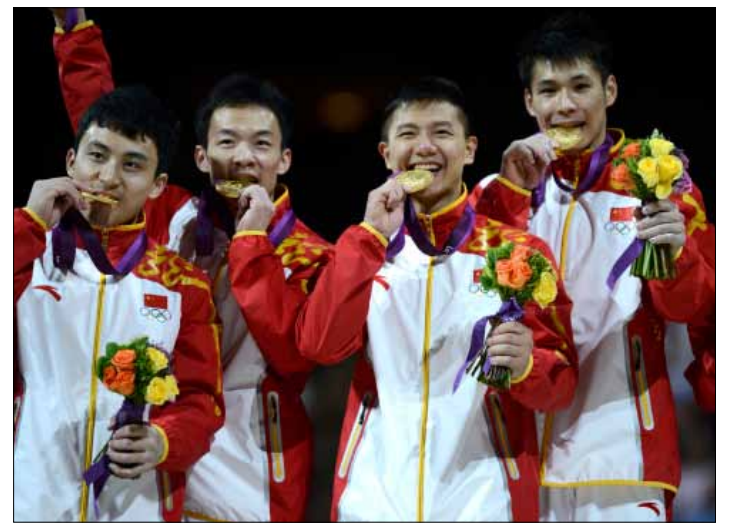
الفريق الصيني محتفلاً بذهبية الجمباز