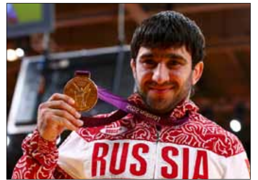
ايسايف وذهبية وزن دون 73 كغ في الجودو