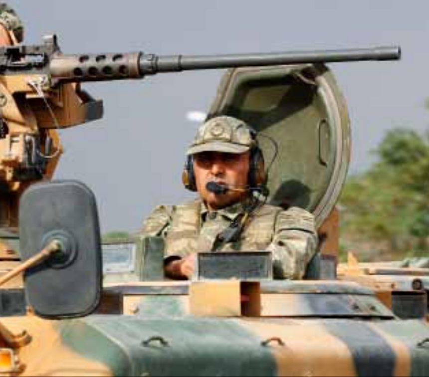
الجيش التركي يواصل تعزيز وحداته على الحدود السورية

وتشهد الأحياء التي يسيطر عليها المقاتلون المعارضون في مدينة حمص، وتحديداً جورة الشياح، والخالدية، والقصور، وأحياء حمص القديمة، قصفاً ومحاولات اقتحام من القوات النظامية منذ أشهر. وبحسب ناشطين، فإنّ حيّ جورة الشياح يشكل خطّ تماس، فهو الحيّ الفاصل في مدينة حمص بين