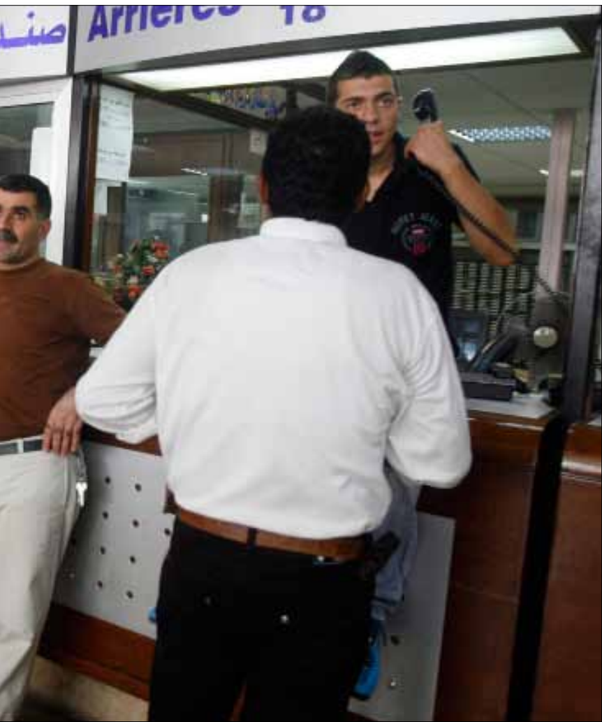
معتصمون في مبنى مؤسسة كهرباء لبنان أمس

وأكد أن «وحدة المؤسسة العسكرية هي اليوم أكثر تماسكاً وصلابة من أي وقت مضى، ولن تنجح محاولات البعض الاضطهاد في الماء العكر للإيقاع بين الجيش وأهله». وتطرق إلى الاستحقاقات الدستورية المقبلة، معرباً عن ثقته بأن «الجيش سيكون الضامن الأساسي لإجرائها، وسيثبت مرة جديدة أنه الحارس الأمين للاستقرار ولقيم الديمقراطية والحرية والعدالة».