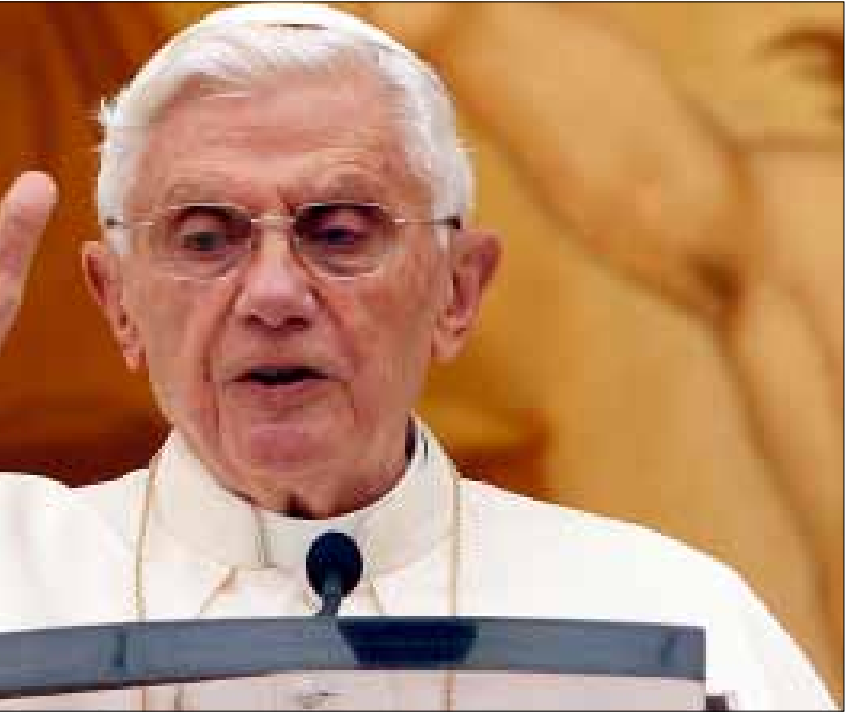
ينظر الكرسي الرسولي بقلق إلى مصير مسيحيي الشرق (أرشيف)

الرسولي يمثل هدفاً جوهرياً في تأكيد إصراره على تشبث المسيحيين بأرضهم، وخصوصاً بعد أحداث العراق التي أدت إلى مغادرة قسم كبير من مسيحييه، والتهديدات التي واجهها أقباط مصر، ثم ما قد يواجهه مسيحيو سوريا من أخطار مشابهة. وهو بذلك يدعو المسيحيين إلى ممارسة دورهم الفاعل في المجتمع، لا التخلي جانباً والتفرج. أن لا يكونوا طرفاً في نزاع فريق مع آخر، ويحرصوا على البقاء صلة الوصل مع كل الطوائف والمجموعات الإنسانية الأخرى.