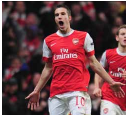
روبين فان بيرسي (أرشيف)

يطالب مهاجم أرسنال، الهولندي روبن فان بيرسي بالراتب ذاته الذي يحصل عليه نجم مانشستر يونايتد واين روني للانتقال للعب إلى جواره، ما قد يحول دون انضمامه إلى «الشياطين الحمر»