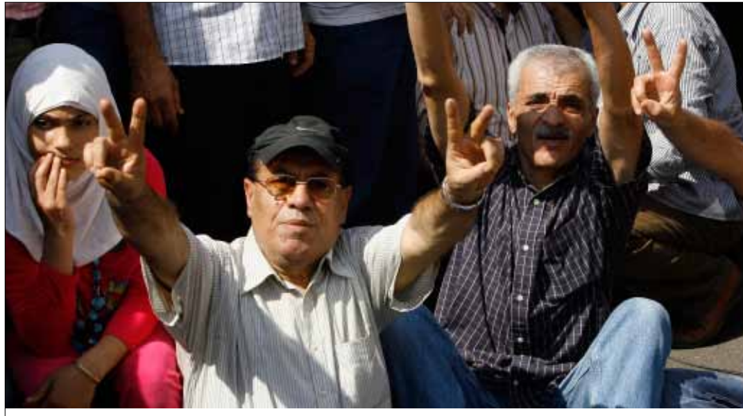
خلاف بين قوى 8 آذار وقوى 14 آذار على توقيت الإضراب