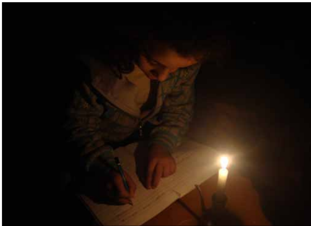
وعد بتركيب العدادات والأعمدة والكابلات قبل نهاية العام الجاري

وإلى حينه، يمكن الإشارة إلى أنه وفيما لو جرى تركيب عدادات لما يقارب خمسة آلاف مشترك، فبالناكيد سيقصر التعدي على الشبكة على قلة!