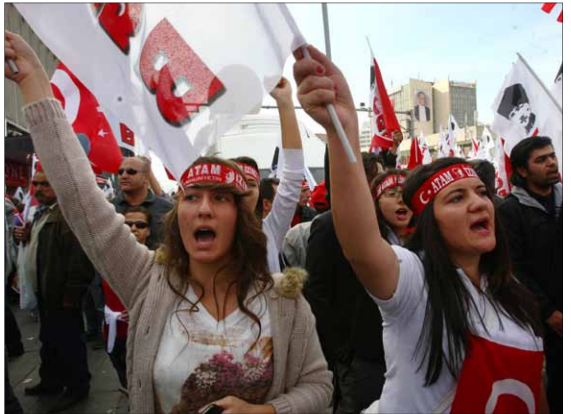
خلال مسيرة يوم الجمهورية في أنقرة أمس

وفي الوقت الذي كانت فيه الاشتباكات في الشارع، بدأ خلال الاحتفال الرسمي هذا العام أن الحرب الباردة بين العسكر و«العدالة والتنمية» قد انتهت. في السنوات السابقة، كان القادة العسكريون يرفضون علناً التواجد في الغرفة نفسها مع زوجات قادة «العدالة والتنمية» المحجبات. كما لم يكونوا سعداء أيضاً بوجودهم في الغرفة نفسها مع نواب حزب «السلام والديموقراطية» الموالي للأكراد. وحتى وقت قريب، كان غول يعقد في هذه المناسبة احتفاليين منفصلين، الأول خلال ساعات الظهيرة للجنود، والثاني في المساء. وكان الجنرالات يقيمون استقبالهم الخاص في المساء. هذا العام الوضع اختلف. كان هناك احتفال واحد شارك فيه الجنرالات والزوجات المحجبات ونواب حزب السلام والديموقراطية في قاعة واحدة.