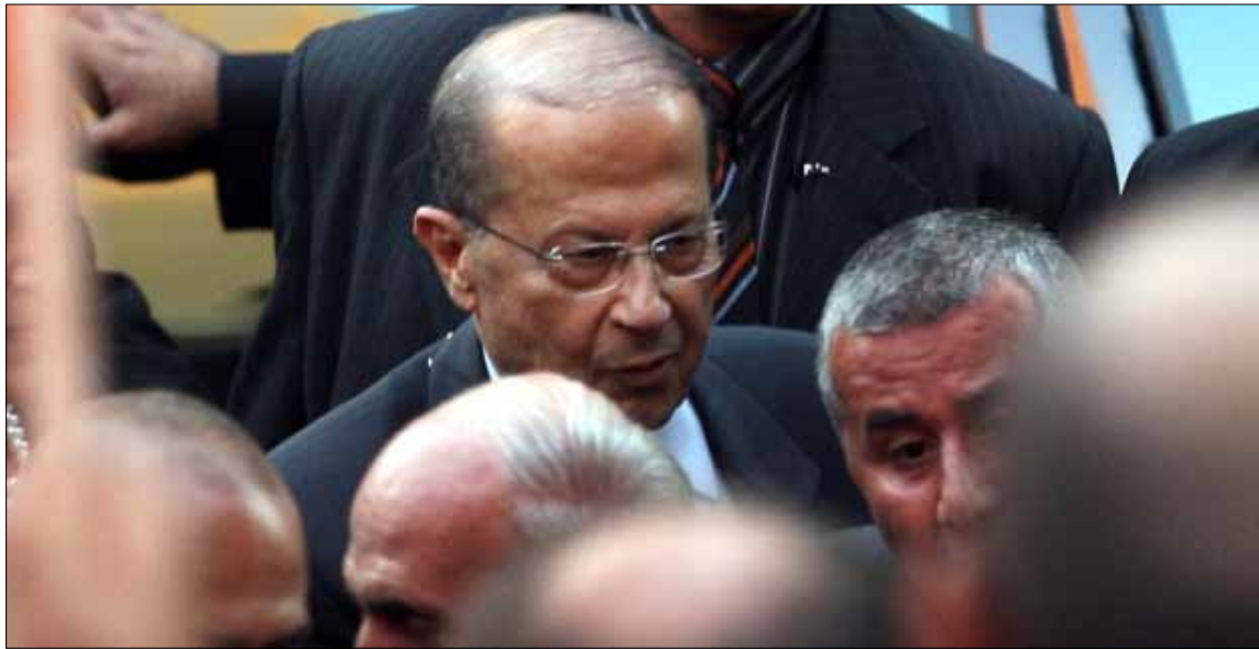
«الجنرال» من المسيحيين الأصليين والذين يسهل تقبلهم كسروانيا

اغتيال الرئيس رفيق الحريري، فانقسم البلد بين فريق يطالب بخروج الجيش السوري وبالإستقلال، وآخر تظاهر وفاءً للسوري. بين 8 و 14 آذار توزع الرأي العام الكسرواني. عزز هذا الأمر عودة العماد ميشال عون من منفاه الباريسي، وخروج رئيس القوات اللبنانية سمير جعجع من السجن، فلم يعد للعائلات صحن يقتاتون منه. أجبرتهم الأحداث أن يسيروا خلف الأحزاب. نزع منهم القيادة فلم يعودوا قادرين على تأليف لوائح من دون غطاء حزبي. هذا المد والجزر «ضرب» البيوتات التي كانت