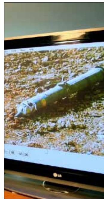
صورة لاختار منقبة من مجمع «اليرموك» في الخرطوم

قصة «الإنجاز» الإسرائيلي غير المسبوق، في السودان، لا تنتهي فصوله، وتعمل تل أبيب على استثماره حتى حدوده القصوى، بيد أن طهران وجهت رسالة ميدانية إلى إسرائيل من خلال رسو سفن حربية لها في السودان