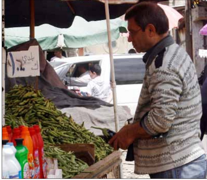
63% من اللبنانيين يواجهون صعوبات في تأمين حاجاتهم اليومية

أيها اللبناني، هل تضع خطة لموازنتك الشهرية؟ «مش تبيكون عندي موازنة بالأول؟» جواب بديهي سيعطيه أي مواطن عادي في بلاد الأرز يحارب لتأمين رزقه وقوت عيشه بكل الوسائل الممكنة. لكن على قاعدة «جود من الموجود»، قد يكون ممكناً له أن «يمد رجليه على قد بساطته»، أو على الأقل المحاولة! عادت هذه القضية إلى الواجهة حين خصصت «حديث المالية» النشرة الداخلية لوزارة المالية (عدها الصادر هذا الشهر) مساحة لنموذج اعتبرته بمثابة «نقطة انطلاق» لموازنة شهرية يستطيع المواطن اللبناني على أثرها تقدير «واقعه المالي». وأعقب النموذج بثلاثة «سيناريوهات» تمكن اللبناني من معرفة وضعه المالي، إضافة إلى بعض النصائح في حال كانت الإيرادات الشهرية دون النفقات، وإلى جانب النموذج، عرضت النشرة النتائج الأولية للمسح الوطني «حول الإلمام بالمسائل المالية» الذي أجراه «معهد باسل فليحان المالي والاقتصادي» بالتعاون مع البنك الدولي و«مؤسسة البحوث الاستشارية». ما توصل إليه المسح لا يشكّل مفاجأة إلا لجهة ارتفاع النسب، إذ أظهر أن أكثر من 55% من اللبنانيين يفتقرون إلى فائض