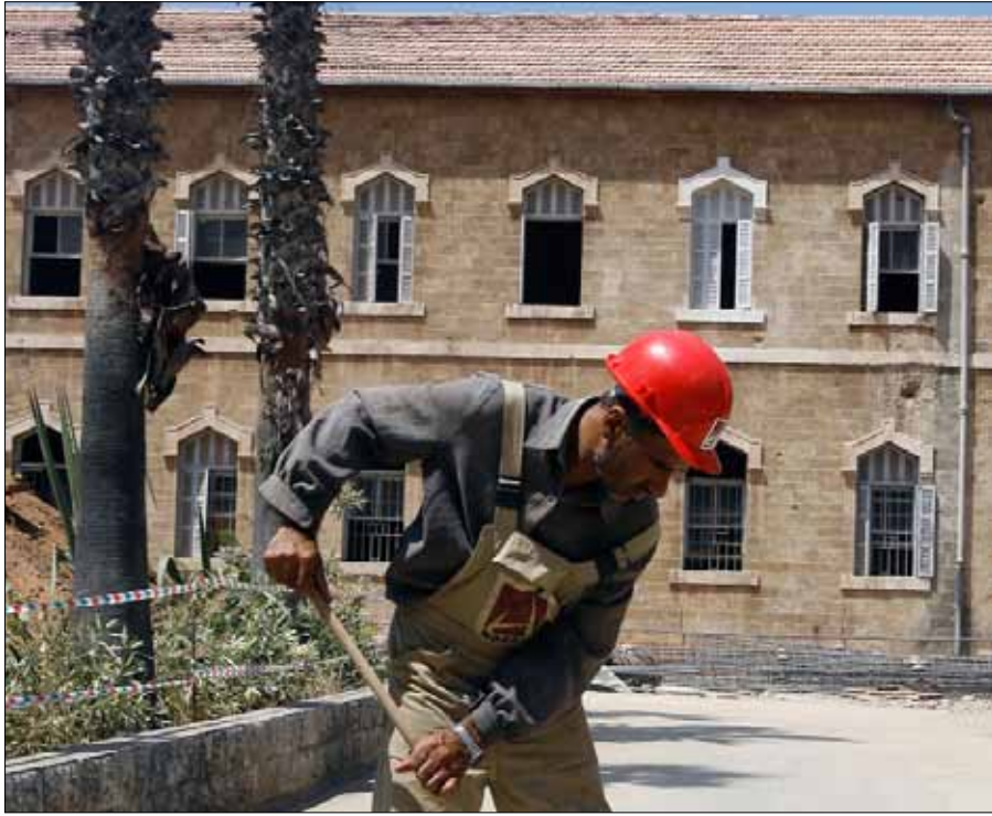
سيتم إصلاح القرميد الذي أعطته الشمس شينا من بهتانها