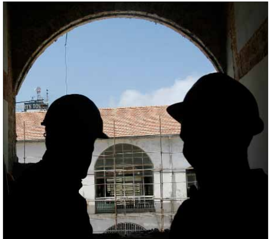
تحدو «إرغا» حدو النموذج الفرنسي في شكل المكتبة وتجهيزها

السلطان عبد الحميد الثاني، مع ختمه وكلمة «الغازي». وتضيف وثيقة عرييد أنّ الطبقة الأرضية من مدرسة الصنائع كانت تتألف من 14 قاعة للصفوف النظرية والتطبيقية إضافة إلى 5 صالات. بينما كانت الطبقة الثانية تضمّ 5 صفوف و15 مهجعاً. كما تشير الوثيقة إلى أنّ مساحة مبنى مدرسة الصنائع كانت أكبر مما هي عليه اليوم، بما أنّ جزءاً منه اقتطع عندما شق شارع الحمرا في خمسينيات القرن الماضي. يشير فراس قصيفي إلى المكان الذي اقتطعت منه الأمتار، ليمرّ مكانها شارع الحمرا. بقليل