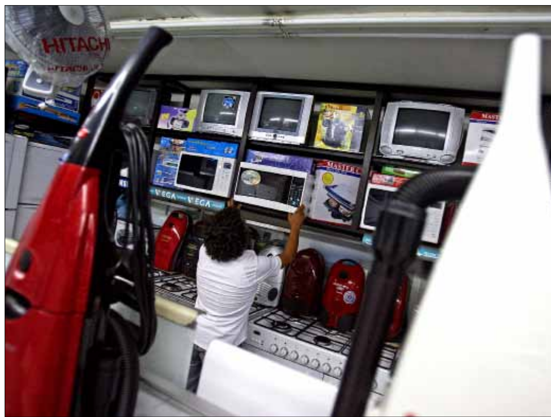
مصرف لبنان طلب من المصارف الحذر في منح تسهيلات لبعض الشركات التجارية (مروان طحطج)

آل خوري يدرسون عرض موسى الفرحان لحسم وضع 20 شركة