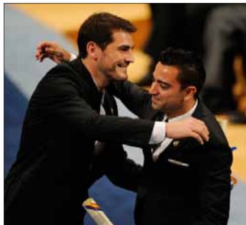
صمّت الـ23 لاعباً إسباني

استحوذت إسبانيا على «حصّة الأسد» في إعلان لأحة الـ23 لاعباً المرشحين لجائزة الكرة الذهبية «الفيفا» لأفضل لاعب في العالم بـ7 لاعبين، وكُشف عن أسماء 10 مرشحين لجائزة أفضل مدرب