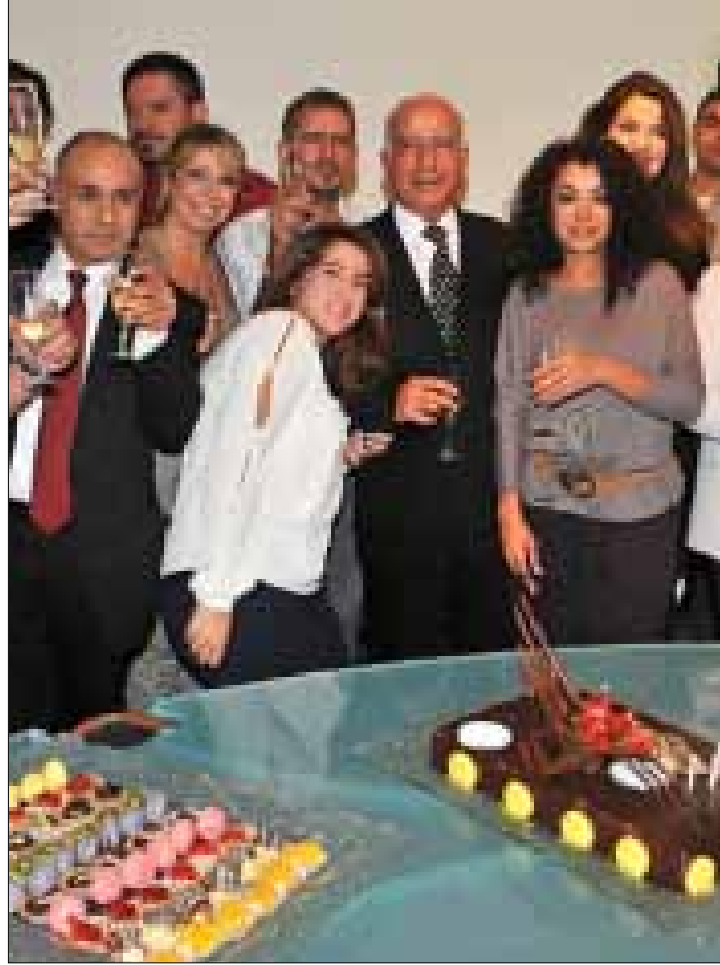
تحسين خياط متوسطاً فريق عمل «الجديد» احتفالاً بعيدها العشرين

القسم الأكثر إثارة واهتماماً بالتأكيد ترك للجزء الأخير من الحلقة. على طريقة تلفزيون الواقع، اقتحمت الكاميرا منزل خياط ورافقتة إلى مكتبه ولم تنس أن تظهر وجهه الإنساني من خلال سيره في الشارع وإلقائه التحية على قاطنيه. بدأ المشاهدون أمام مسلسل أعد السيناريو الخاص به سلفاً. هكذا اكتشف الجمهور حلاقة الخاص المرافق له منذ أكثر من 20 عاماً وتعرفوا أيضاً إلى أبنائه وأحفاده وزوجته سمر الخائفة عليه وعلى أولادهما من جرعات الجراحة التي يبثها خياط في محطته. رافق المشاهدون الرجل السبعيني الذي يمارس رياضة كرة المضرب يومياً صباحاً مع المدرب وكريمته كرمي... صور بزاوية وإخراج حميمية العائلة إلى العلن وتصوير خياط كاملاً منزهاً عن الأخطاء. مع ذلك، أصر صليبي الذي خلع كليا من ثوب الإعلامي في الحلقة، على سؤال ضيفه عن سر كثافة الإعلانات المروجة للحلقة في الشارع وعلى وسائل التواصل الاجتماعي، ثم ختم كما بدأ بأن الحلقة لا تقع ضمن نية (عميد الجراحة) في الخوض في أي عملية انتخابية أو رئاسية لكونه «سنياً متزوجاً شيعياً» وليس «شيعياً» كما يعتقد كثيرون، وبالتالي يحق له تولي منصب رئاسة الحكومة!