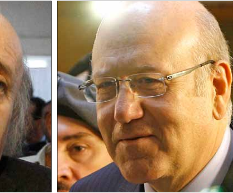
التقط السفراء صورة بشعة ومكلفة عن قوى 14 آذار في الشارع

تستقبل «الأخبار» رسائل القراء على العنوان الإلكتروني الآتي: letters@al-akhbar.com. على أن تنطلق الرسالة من أحد المواضيع المنشورة في «الأخبار»، ولا يتجاوز نصها 150 كلمة.