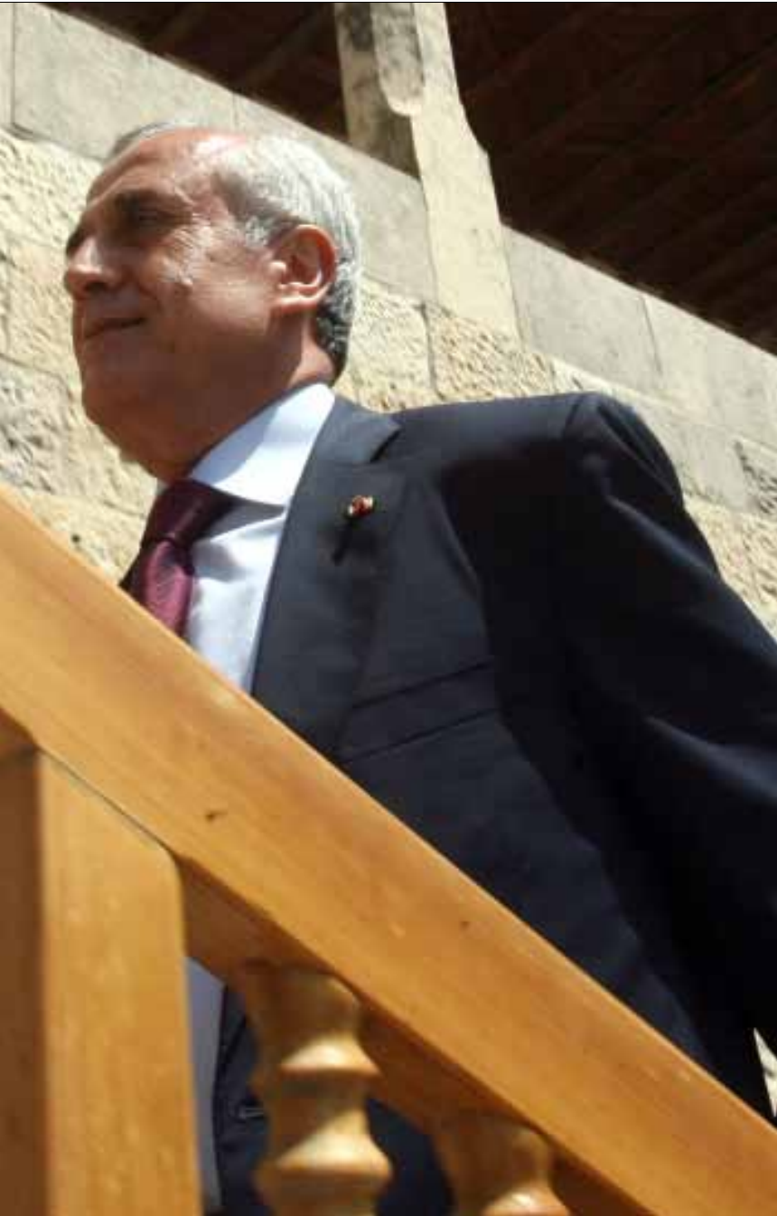
لم يرتح سليمان لبيان المعارضة: لا يُفضي إلى أي هدف

إلى القانون النافذ، وهو قانون 2008. في أكثر من مناسبة سمع المسؤولون اللبنانيون من سفراء دول عربية بارزة يقولون لهم: لا يسعكم تعطيل الانتخابات في وقت يذهب فيه كل العالم العربي إليها.