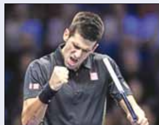
ديوكوفيتش فائزاً على موراي