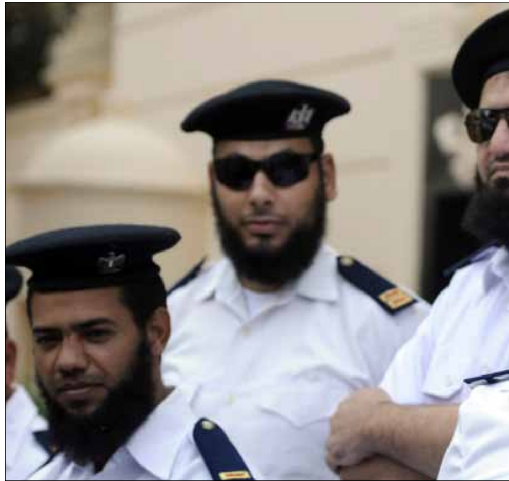
عناصر من الشرطة المصرية يشاركون في اعتصام للمطالبة بالسماح لهم باطلاق لحاهم

الداخلية لأي مبادرة تقدم من داخلها ويعاقب مقدموها على تلك المبادرات». أما وزارة الداخلية، فتقول إن سياستها اختلفت بعد الثورة، وأنه تم ادخال مواد جديدة على الطلبة في كلية الشرطة لاحترام حقوق الإنسان. ولفت ضابط في العلاقات العامة في الوزارة، فضل عدم كشف اسمه، إلى أن حالات التعذيب التي يجري الحديث عنها في وسائل الإعلام، «ما هي إلا حوادث فردية يعاقب من ثبت تورطه فيها». وأوضح أن «وزارة الداخلية بعد الثورة قررت إعادة فكرها الذي كان سائداً قبل الثورة، وأصبحت في خدمة القانون والشعب، وتلتزم بمبادئ ثورة 25 يناير من الحرية والكرامة، لأي مواطن حتى لو كان متهماً فهو إنسان في النهاية». ولفت إلى أن «وزير الداخلية أعطى توجيهاته من اليوم الأول له من توليه منصبه، ألا يتم التسرر على جريمة أو أن يفلت منهم من عقاب حتى لو كان من قيادات الوزارة».