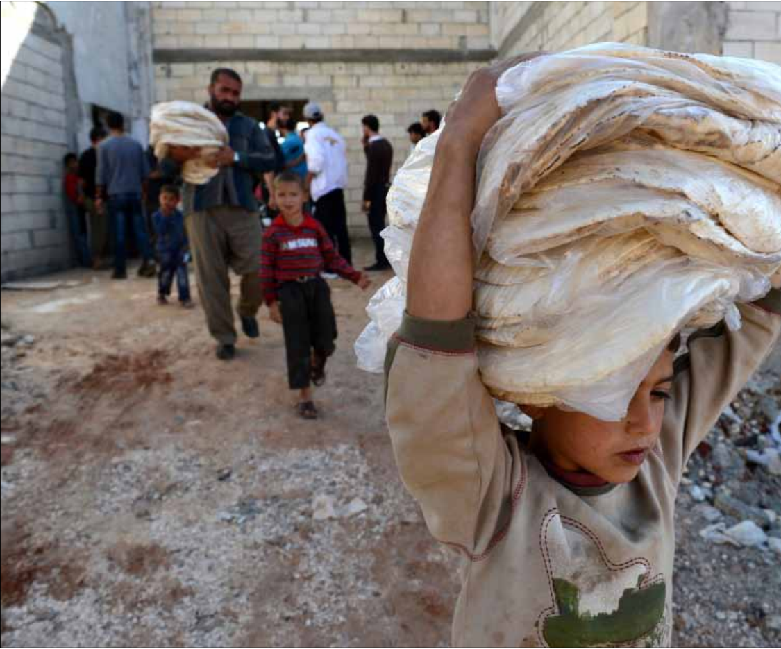
في بلدة الأتاب في حلب أمس

من ناحيته، أعلن وزير الخارجية البريطاني وليام هيج أنه أوعز إلى مسؤولين في وزارته بإجراء اتصالات مباشرة مع ممثلي جماعات المعارضة المسلحة في سوريا. ورأى هيج، في بيان، أن هذا التحرك «سيساعدنا على فهم أفضل للوضع في سوريا والعلاقة بين جماعات المعارضة السياسية والمسلحة، حتى نتمكن من دعم الانتقال السياسي بنحو صحيح». وأضاف أن جميع الاتصالات مع المعارضة المسلحة «ستجري خارج سوريا وضمن بيئة نراها آمنة فقط، وسيجري استكشاف كل اتصال محتمل بحذر وعلى أساس كل حالة على حدة». من جهة أخرى، قالت وزارة الخارجية السورية إن سوريا ستقف بحزم ضد أي محاولة لزعج الفلسطينيين بما يجري في سوريا. ونقلت وكالة الأنباء السورية الرسمية «سانا» عن مصدر مسؤول في وزارة الخارجية قوله، إن الطريق الوحيد أمام اللاجئين الفلسطينيين في سوريا، وفي كل مكان لجأوا إليه، هو طريق فلسطين والتمسك بالحقوق الثابتة وفي مقدمتها حق العودة. وأضاف أن «المجموعات الإرهابية المسلحة صعّدت