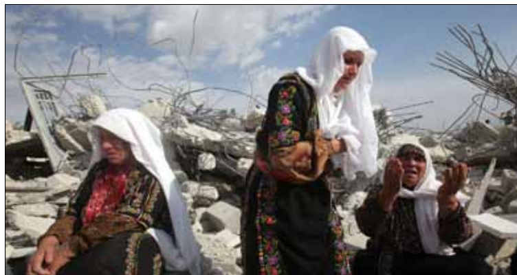
فلسطينيات يبكين على أطلال بيوتهن التي هدمتها إسرائيل قرب الخليل

وبحسب أحد الوزراء المشاركين، فإنه «لا يزال هناك المزيد من الوقت إلى حين التصويت، وإذا ما كان ممكناً منعه فإن هذا سيكون الأفضل». كذلك كان لافتاً أن