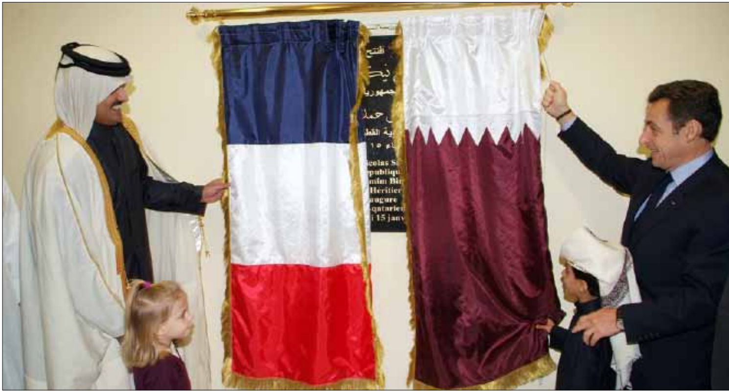
ساركوزي وولي العهد القطري خلال افتتاح المدرسة في الدوحة (الأخبار)

شكّلت قطر مجموعة ضاغطة لتدعم انضمامها الى المنظمة الفرنكوفونية