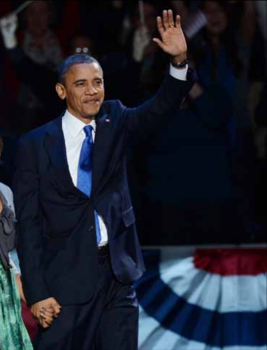
الرئيس وعائلته قبيل لقاء خطابهم في شيكاغو فجر أمس

فاز باراك أوباما، لكن فوزه لم يكن بنكهة عام 2008؛ فخطاب النصر لم يرق إلى مستوى 2008، كذلك الحشود لم تكن بكثافة ذلك العام، ربما لأن للمرة الأولى دوماً رهبتها، بما أنها أدخلت أول رئيس أسود إلى البيت الأبيض