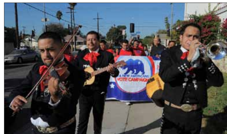
الناخبون أرادوا مرشحاً لا يكذب عليهم

إلى الآخر، لا يمكنك العودة إلى المحافظ الذي كنت عليه. أحترم خيارات أهلي الجمهوريين الاجتماعية والاقتصادية وحتى السياسية، حين يحترمون خياراتي. حبيبته الصينية تقول إن الديموقراطيين فازوا لأن أكثرية الشعب