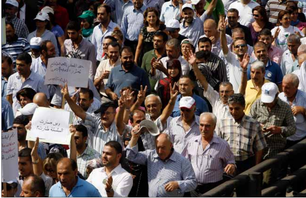
رفضت هيئة التنسيق تدخل البنك الدولي في السلسلة

لم تنتظر هيئة التنسيق النقابية انتهاء جلسة مجلس الوزراء لتعلن المضي في إضرابها. فالأجواء السلبية عشية الجلسة فرضت تصعيد التحرك لإنقاذ سلسلة الرتب والرواتب ورفض مشروع الزيادات الضريبية وتدخل البنك الدولي