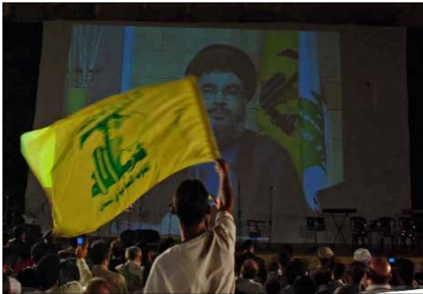
خلال احتفال لحزب الله