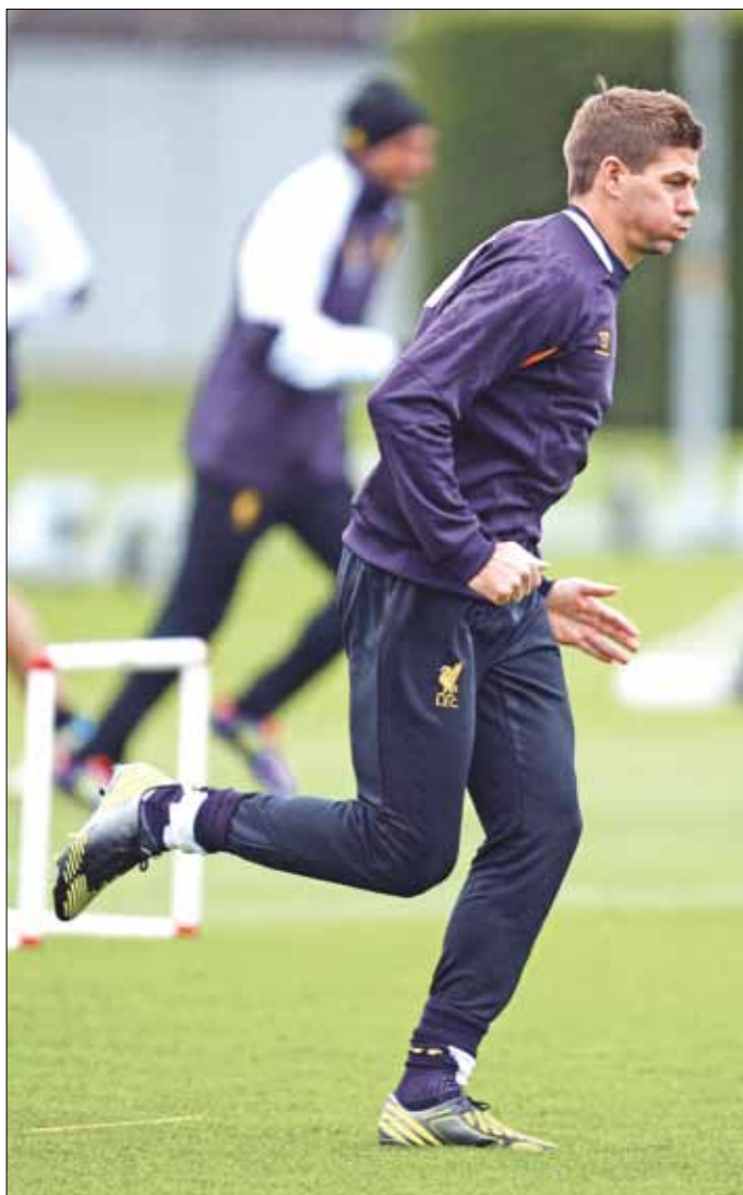
ستيفن جيرارد في حصة تدريبية لليفربول