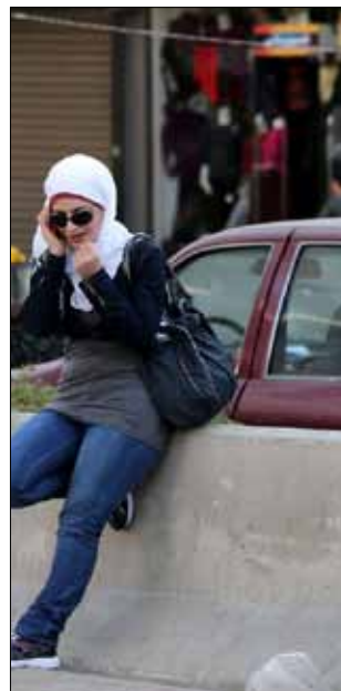
كل سيارة متوقفة هي مرشحة للانفجار في دمشق

كل سيارة متوقفة هي مرشحة للانفجار بالنسبة إلى المارين، بعد عدة إشاعات تناقلها الناس عن وجود عدة سيارات مفخخة تجول في شوارع العاصمة. وكل كيس غريب أو حقيبة تستدعي من المارة التبليغ، فيما الهولة هي الصفة الأبرز لطريقة مشي سكان المزة تحديداً. رامي، مقيم في دمشق، يقود سيارته باتجاه المزة. يتجاوز السرعة القصوى، متجاهلاً كاميرات المراقبة. إنه يفضل