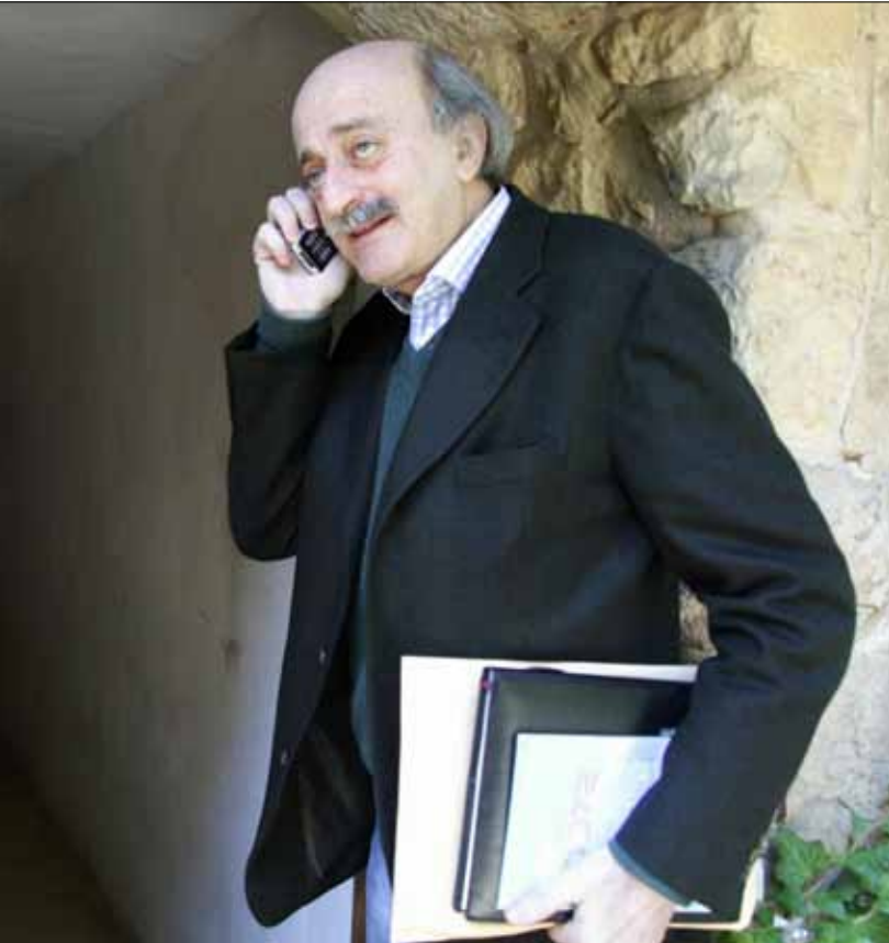
من يُرد أن ينتقد النظام السوري لا يمكنه أن يبقى رئيساً لـ35 عاماً