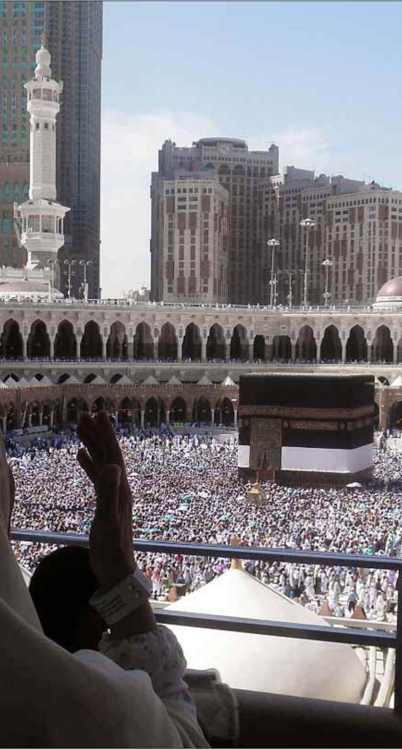
في زحمة الحج يجد الحجاج اللبنانيون طريقهم بسهولة نسبية