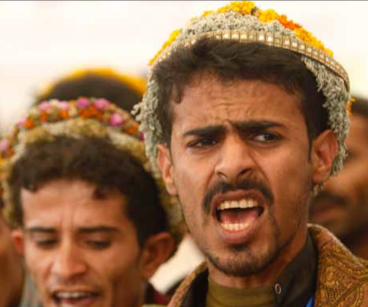
مؤيدون للحوثي خلال احد الاحتفالات في صعدة

في هذه الأثناء، أوضح الخيواني لـ«الأخبار» أن عملية تسليم الرفات تمت في إطار التهيئة للحوار وأن الرئيس هادي جاد في تلبية المطالب الحقوقية