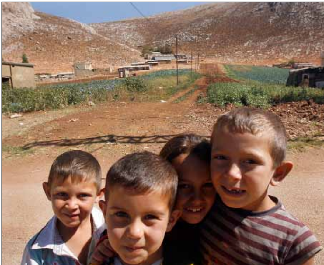
يدحض عرب الفاعور كل الشائعات التي تطاولهم، من تلقيبهم بالمجنسين، الى شراء أصواتهم

أما كيف وصل عرب الفاعور الى المتن الشمالي؟ فلهذا قصة أخرى يرويها خالد. قديماً، كان قسم من العريبان يكسب لقمة عيشه من تربية الماشية وقسم آخر من صيد السمك. وفي حين كان يقصد مربو المواشي سهل البقاع صيفاً، لم يترك البحارة المتن أبداً وبقوا مقيمين في المنطقة الى أن تم إحصاؤهم في سنة 1982 مع سكان المتن. أما الرواية