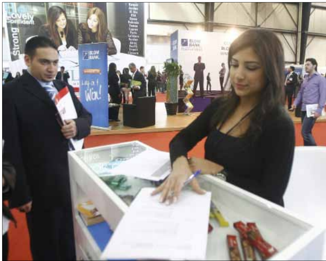
من شأن الإصلاحات السريعة أن تُشكّل بيئة مؤاتية لتبني إصلاحات أعمق تكون ناجحة على المدى الطويل

إجراءات سريعة المفعول للإصلاح: من بناء المستودع إلى الاستيراد