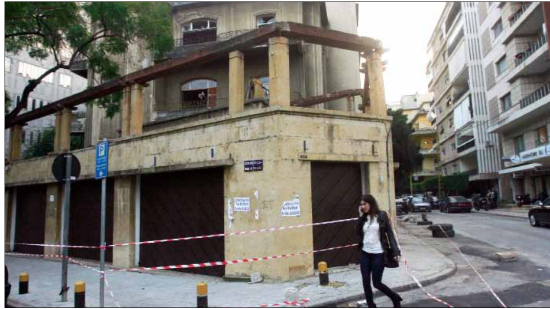
يمثل منزل امين معلوف نمطاً هندسياً مدينيًا لا يزال يحتفظ بفرادته

لم يصمد قرار ليون بمنع هدم المبنى سوى أربعة أشهر