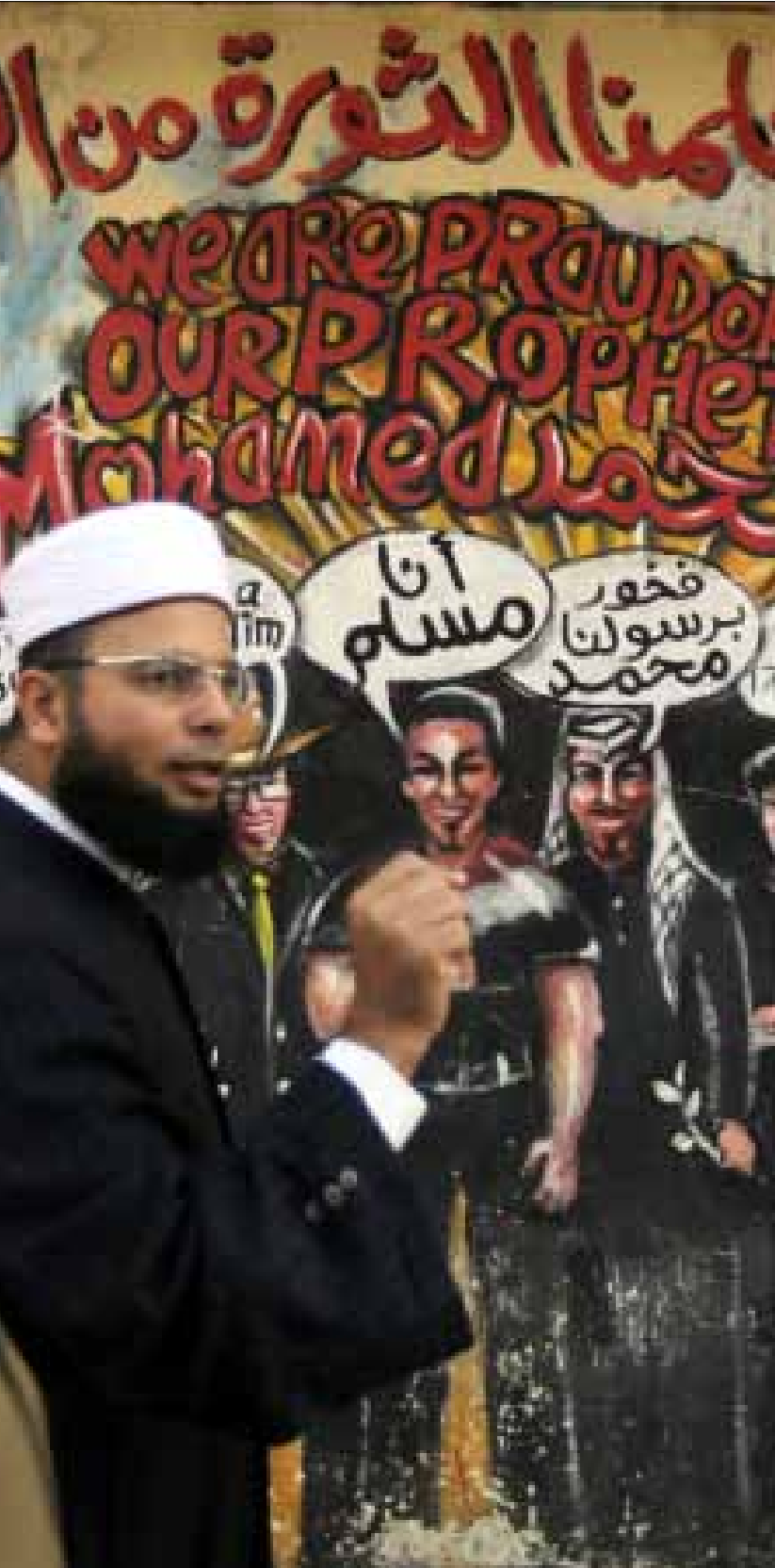
يفضل حزب الوطن استخدام الشعارات الوطنية بدلاً من الإسلامية

فعلى مستوى الحالة السلفية، كشفت السرعة الكبيرة التي استطاع بها عبد الغفور تدشين هذا المؤتمر وجذب هذا العدد الكبير من الحضور، أن التيار السلفي التنظيمي لا يحمل داخله شكلاً