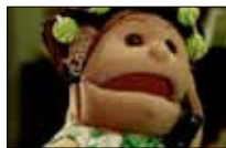
أبلق باسم يوسف 22:30 ■ «سي. بي. سي»