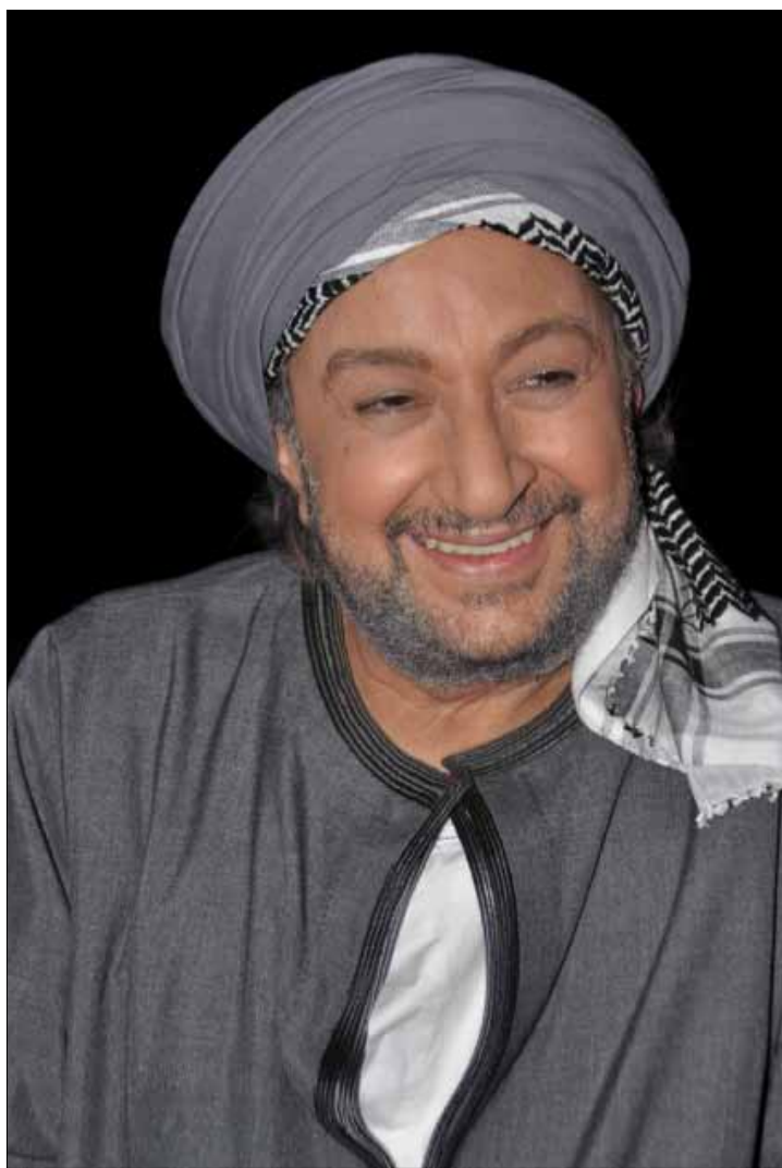
في شخصية «خلف الله»

يؤكد الشريف أنه لا يفضل حصره في نوعية محددة من الأدوار، لذا وجد أن «خلف الله» فرصة للعودة إلى الجلاباب الصعيدي، بعدما قدم دور كبير الصيادين في «عرفة البحر» العام الماضي، مشيراً إلى أنه يتعمد التنقل بين الشخصيات التي يقدمها منذ احترافه التمثيل. وأضاف أنه وقع تعاقداً مع شركة «بانوراما» بعد إعجابه بسيناريو «خلف الله» قبل