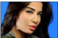
الاب تابت عند عبد... النجدة 20:30 ■ «تلفزيون لبنان»