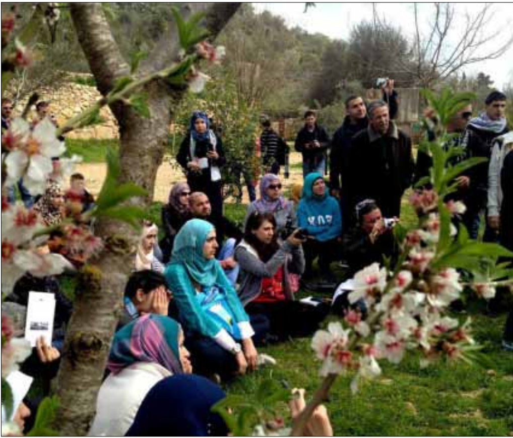
أحياء ذكرى المجزرة في فالونيا

بيتاً وذبحوا النساء والرجال والأطفال والشيوخ. مجزرة وقعت بعد أسبوعين من توقيع معاهدة سلام مع المستوطنين اليهود، لتكشف عن سمة الغدر عند الصهاينة، وكانت مقدمة لموجات من التهجير للأهالي من قراهم الى مناطق أخرى من فلسطين