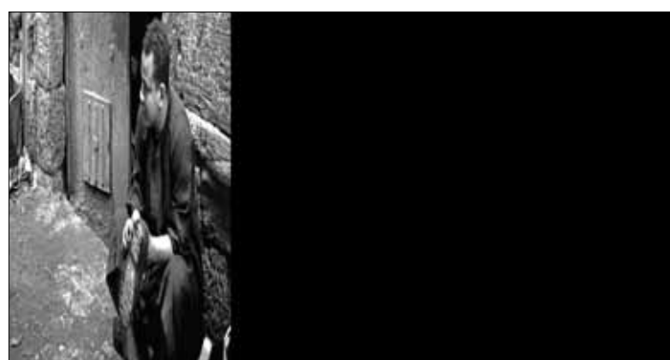
ترقب حذر يسود الشارع المصري

في الشأن المصري، 0 إلى جانب «إيران وخطورة التعاون العسكري معها». وأوضحت المصادر أن لقاء مرسي بوزير الدفاع عبد الفتاح السيسي وقيادات الجيش محاولة من الرئيس للوقوف على موقف القيادات العسكرية التي عبرت سابقاً عن استيائها من أداء