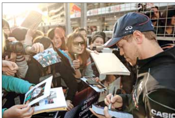
فيتيل يوقع لمجموعة من المعجبات الصينيات في شنغهاي

قدمنا اداءً جيداً في ذلك اليوم. كفريق، اعتقد اننا قمنا بعمل جيد جداً، حققنا نتيجة مذهلة». وسيسعى الإسباني فرناندو