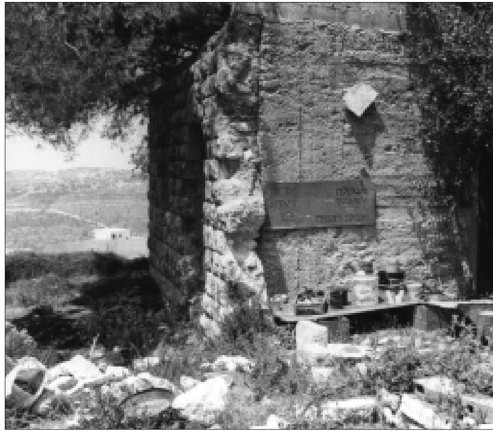
وقعت المجزرة بعد سقوط قرية القسطل واستشهاد عبد القادر الحسيني

لكن بشكل عكسي، من باب العمود إلى قرية فالونيا، يقول: «بعد النكسة كنت أقول إن البلاد قد تحررت الآن، لأنه أصبح بإمكاننا رؤية دير ياسين؛ لم يكن هذا متاحاً في عهد الحكم الأردني، لكن الطريق تغيرت، وكل شيء في البلد تغير. البيوت مهدامة. الأراضي الزراعية الشاسعة شقوا شوارع ضخمة فيها».