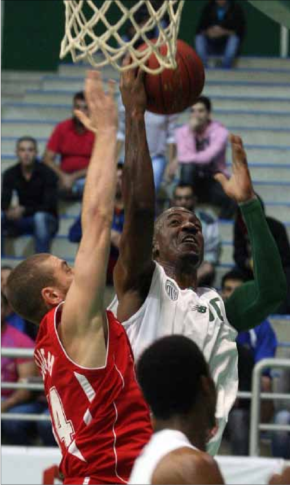
سيضي الحكمة بارون هاربر لإفساح المجال امام وصول كيونسي دوبي (سركيس يرتسيان)