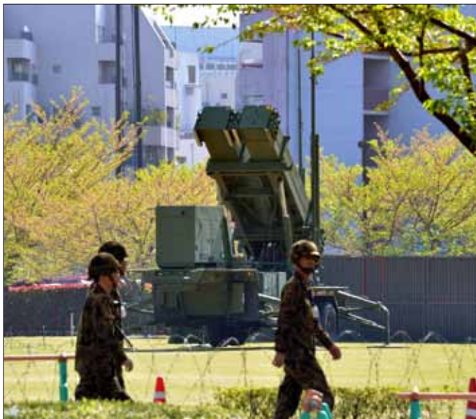
اليابان تناهب لأي حرب محتملة في شرق آسيا

زيارة للمسؤول الأطلسي إلى كوريا الجنوبية وتستمر ثلاثة أيام، حيث يلتقي الرئيسة باك غون هاي، ووزير الدفاع كيم كوان جين.