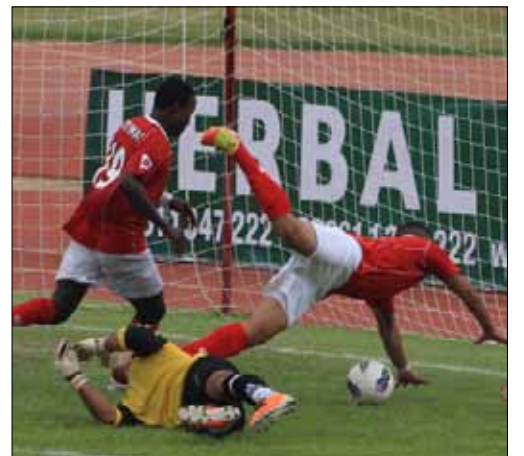
فرصة عهداوية أمام مرمى الاجتماعي في الذهاب (عدنان الحاج علي)

تعود بطولة الدوري اللبناني لكرة القدم بعد فترة راحة لأسبوع إفساحاً في المجال أمام ربع نهائي الكأس، إلا أن الأسبوع السابع عشر سيكون ماراتونياً حيث ينطلق اليوم ويختم الاثنين