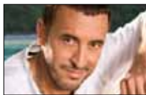
مفاجات قيصريّة 21:30 ■ «MTV»