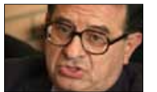
بقرادوني يضرب بالمندل 21:30 ■ «المنار»