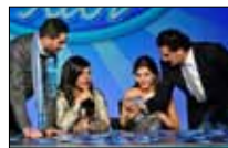
«أراب آيدول» موسم التصفيات 21:00 ■ «LBCI»