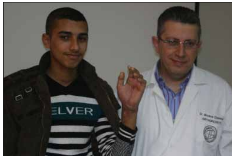
استغرقت العملية خمس ساعات