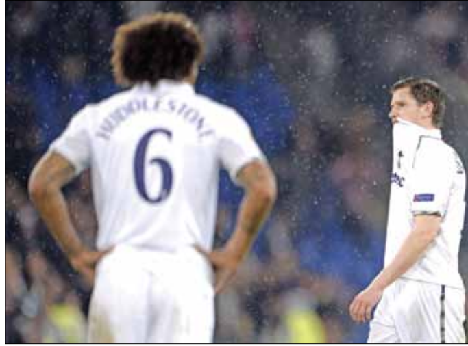
حسرة لاعبي توتنهام بعد الخروج من البطولة

كذلك، تأهل بازل السويسري الى نصف النهائي لأول مرة في تاريخه بعد تغلبه على توتنهام الانكليزي بركلات الترجيح (1-4) إثر انتهاء المباراة بالتعادل الايجابي 2-2 في الوقتين الاصلي والاضافي (2-2) ذهاباً. سجل المصري محمد صلاح