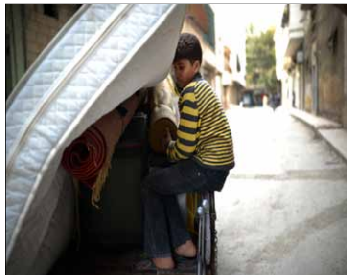
التهجير حال معظم السوريين

إلى الشمال قليلاً، وحيث يمتدّ الريف على مساحات واسعة من المزارع والغابات التي تصل حتى الحدود التركية، لسواء اسكندرونة المحتل، يمكن أن تتناهى للمرء أصوات بعيدة لمدفعية تضرب قرى جبل التركمان أو أصوات رصاص يخترق صمت تلك الجبال ليلاً. الجيش السوري واللجان الشعبية بالمرصاد لأي محاولات تقدم