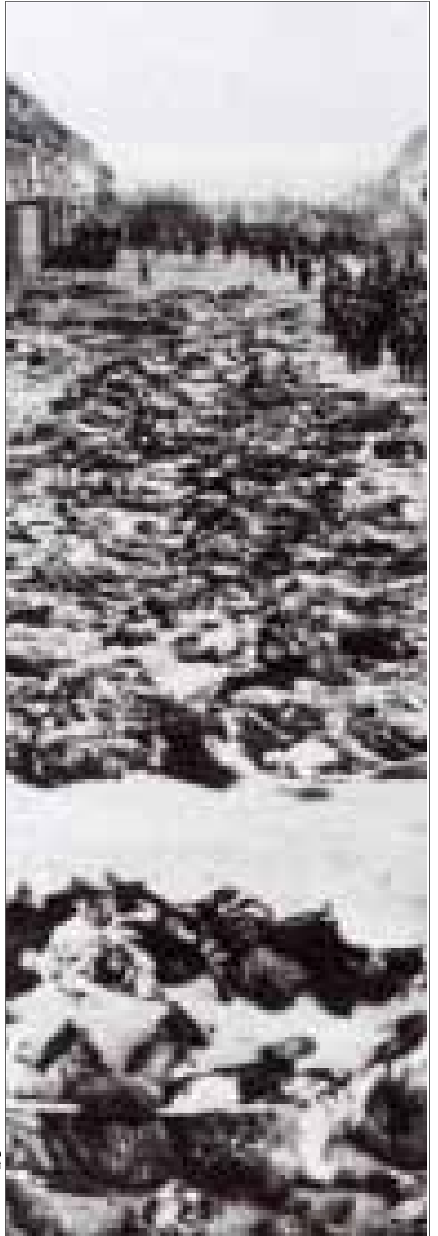
صورة قديمة للمجزرة

لا يزال أبو طارق يذكر طفولته المكبرة التي قضاه في دير ياسين جيداً. طرقات القرية وبيوتها ونواحيها التي غيبتها الاحتلال، لم تغب عن ذهنه. يتحدث عن أشجار الزيتون واللوز والبرقوق والمشمش، التي كانت في كل بيت في القرية، وعن أهل القرية الكادحين الذين كانوا يعملون في الكسارات، ويصنعون الحجر، وعن مدارس القرية التي لا يزال يذكر أسماء بعض مديريها: «أمين قطينة، وصبري الزيتاوي».