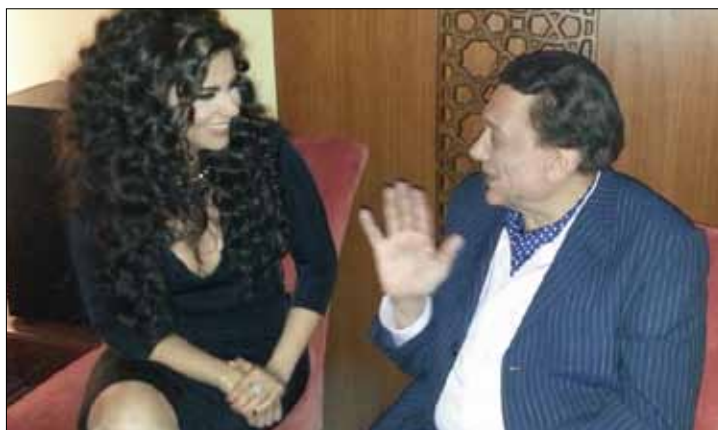
عادل إمام ودانا حمدان في «العراف»

نفسية تستعرض أوضاع المصريين بعد الثورة. وفي حكاية «أمن الغولة»، تؤدي دور شخصية تضطر إلى دخول مستشفى الأمراض النفسية بسبب الأوضاع في مصر. من جهتها، اختارت يسرا الجانب الاجتماعي ليكون مضمون مسلسلها «إنهم لا يأكلون الخرشوف». تجسد شخصية صاحبة مطعم تواجه مشكلات عدة في حياتها. بينما تطل كل من كندة علوش ورانيا يوسف وممنة شلبي في مسلسل «نيران صديقة». تدور أحداثه حول علاقة مجموعة من زملاء الدراسة، والمشكلات التي تواجههم في حياتهم خلال حقبة