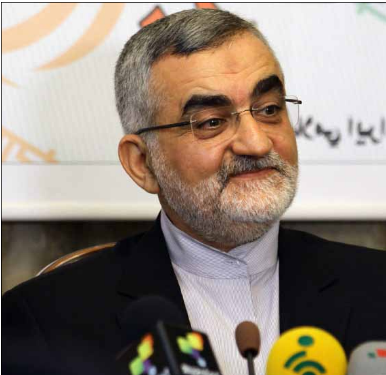
بروهجردي: أفضل خيار هو استمرار الأسد إلى صيف 2014

تبدو حكاية حي كرم الشامي من المفارقات الغريبة في المشهد السوري؛ فالحي يتميز بطبيعة سكانية معارضة للنظام، وترفع شعار المطالبة بالعدالة في تظاهرات أيام الجمعة في زمان سلمية الثورة، إلى أن توقف بالتزامن مع بدء العمليات العسكرية في المناطق المجاورة من حمص القديمة وباب السباع. رفض أهالي الحي منذ اللحظات الأولى حمل السلاح، إذ وجدوا أن حمل السلاح لا يخدم موقفهم السياسي. موقف لطالما حلم جميع السوريين باعتناقه من قبل الأطراف المتصارعة. ورغم احتضانهم العوائل النازحة الهاربة من ساحات المواجهة في المناطق الأخرى، إلا أنهم لم ينجروا لكل محاولات توريث منطقتهم في الصراع الدائر، معتبرين أنهم بهذا حموا منطقتهم من الدمار وحافظوا على بيوتهم من أن تكون عرضة لنيران الجيش فيما لو احتضنوا مسلحي المعارضة. يقف حاجز الجيش السوري في الحي بلا أية مشاكل، يبتسم أحد الأهالي قائلاً: «كنا الأبعد نظراً خلال الثورة السورية».