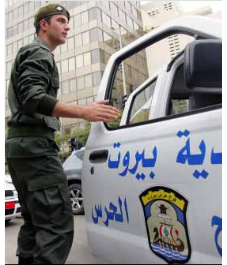
يطالب الحرس بمساواتهم بفوج الإطفاء

علق عناصر فوج الحرس في بلدية بيروت اعتصامهم المفتوح الذي كان مقرراً أمس، بعدما تلقوا دعوة إلى وزارة الداخلية والبلديات لمناقشة مطالبهم. فهل يغلق الحراس باب الإضرابات اليوم؟