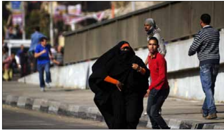
الأحزاب الإسلامية والمدنية لم تقف بدورها مكتوفة الأيدي تجاه هذه الأزمة (ا ف ب)

وتعليقاً على الاتهامات التي توجه إلى حزب الحرية والعدالة بالسعي إلى أخونة القضاء، قال: «أتحدى أن نجد سفيراً أو قاضياً أو ضابط شرطة من الإخوان، فجميعنا يعرف كيف كان يُستبعد الإخوان من تلك المناصب».