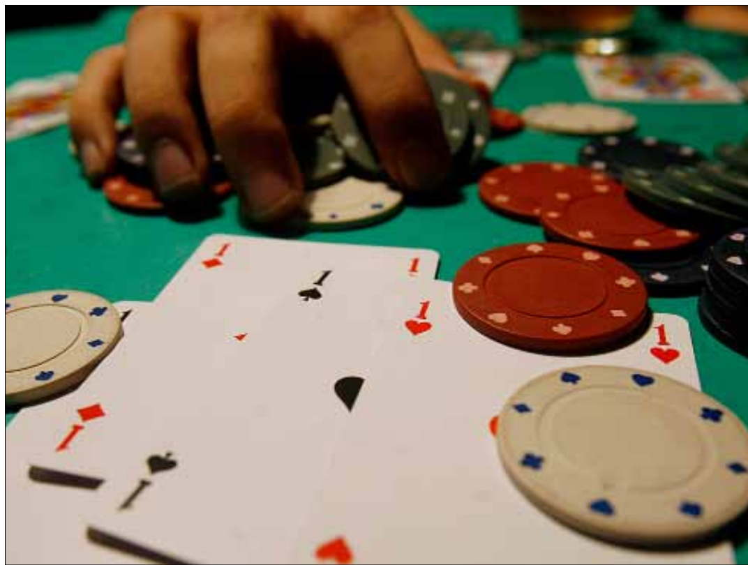
من يسيطر على «انترا» قد تمتد سيطرته إلى كازينو لبنان

هل يستهدف السيطرة على الشركة كونها ممراً للكاзино وبنك التمويل؟