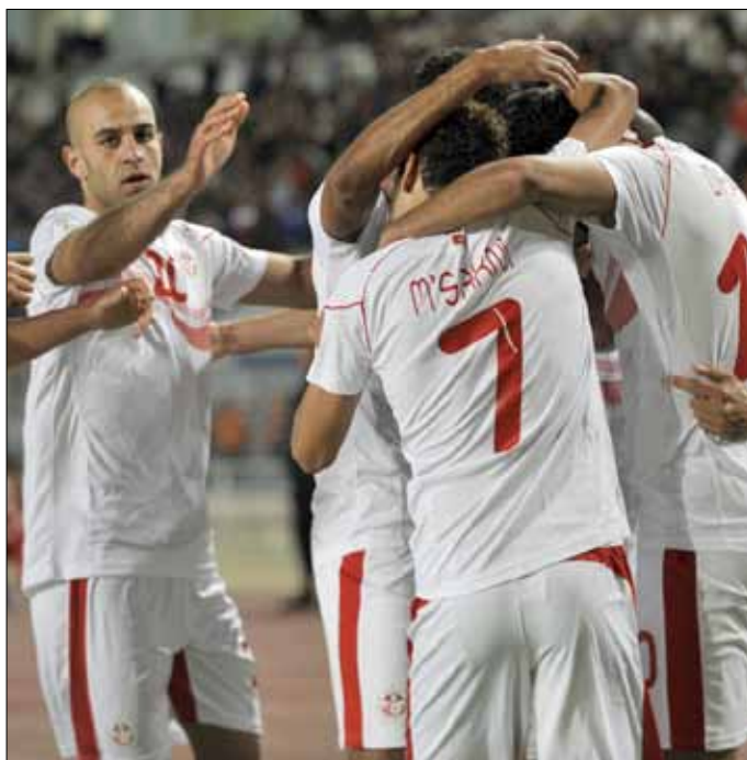
يتأثر المنتخب الوطني بالمشاكل الداخلية

عينة بسيطة من ملف الدعوى الذي سنقدم به غدا (الاثنين) إلى القضاء التونسي (وهو) عبارة عن تسجيلات هاتفية مزودة أيضا بوثائق وأدلة دامغة أخرى تثبت التلاعب الحاصل في مباراة النادي البنزرتي وشبيبة القيروان نضعها في أيدي