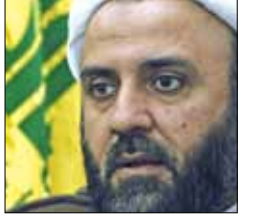
«واجب وطني» أم «إعلان حرب»

أيها السنة حي على الجهاد. هبوا لنصرة إخوانكم في القصير، وأعدوا لهم ما استطعتم من سلاح ومال ورجال. أمس، تحت ضغط الشارع، أعلنت التعبئة العامة. أفتى رجال دين بوجوب الجهاد. وسط الاندفاع الحماسي ومحاولات تخفيف الغليان، تسير طرابلس بخطى واثقة نحو الانهيار