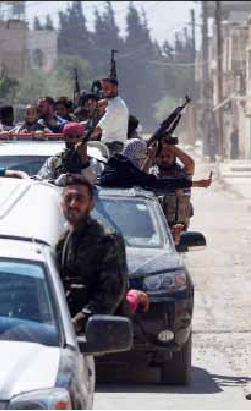
قصف الجيش اللبناني للمعارضة السورية قد يؤثّر المجتمع الدولي والعربي على الجيش ولبنان معا (أ ف ب)

في المقابل، سألت مراجع سياسية كيف يمكن الجيش أن يرد على مصادر النيران. فقصف المعارضة السورية انطلق من خارج الحدود اللبنانية، من بقع عمليات متنازع عليها، وباتت الآن في يد الجيش النظامي، وأي قصف للأراضي السورية يعني قفراً فوق كل الاعتبارات الحدودية والعسكرية والأمنية. ويعتبر تدخلاً في الشؤون السورية الداخلية، وانحيازاً لفريق دون آخر، مع العلم بأن احتمالات تجدد القصف باتت ضئيلة، بعدما سيطر