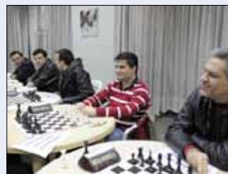
لاعبو الأنصار في اليوم الأخير