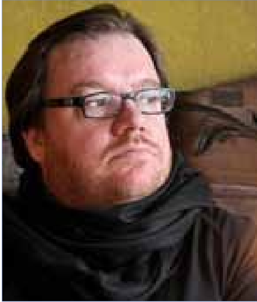
سنان أنطون - العراق