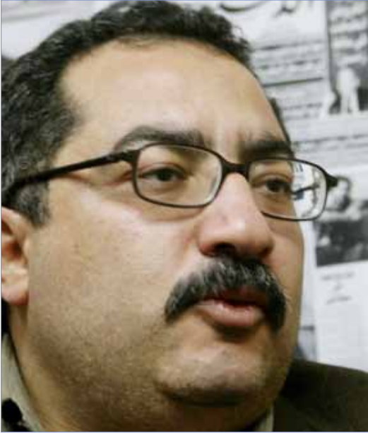
إبراهيم عيسى - مصر