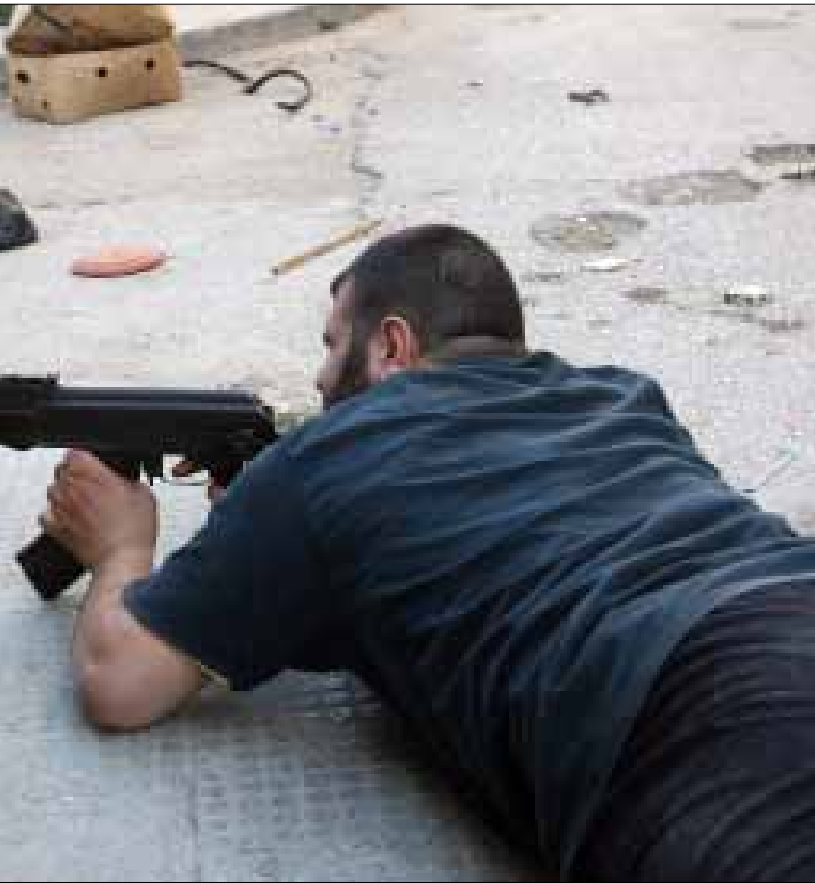
شربل: غالبية المسلحين خرجوا عن أوامر بعض السياسيين