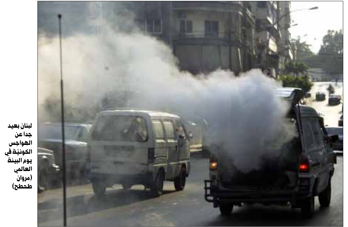
لبنان بعيد جداً عن الهواجس الكونية في يوم البيئة العالمي (مروان طمطح)