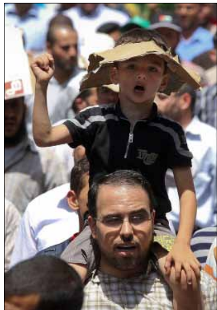
شهد الأردن منذ 2010 حراكاً شعبياً لم يضيّع بوصلته الوطنية والقومية

قدرات الحركة الوطنية محدودة، وبالتالي فإنها لم تستطع أن تقدم شيئاً ملموساً يمنع غزو العراق عام 2003، لكنها عبأت الشعب الأردني ضده كما لم يحصل في بلد عربي آخر. وهذا هو الحال نفسه في كل مفاصل التضامن مع الشعب الفلسطيني.