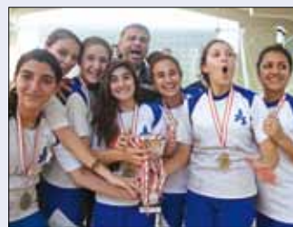
تنويج إحدى الفئات