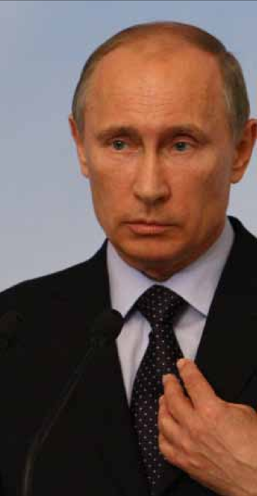
أعلن بوتين أن روسيا لم تسلم سوريا صواريخ «إس 300»