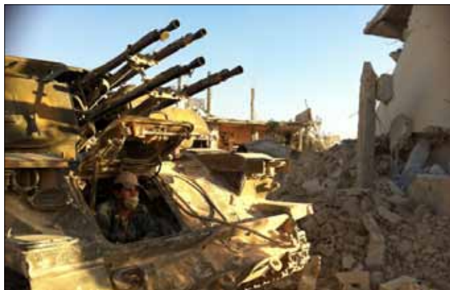
خلال توغل الجيش السوري في الجهة الجنوبية لمدينة القصير

في حيّ برزة والقابون تعرضت للقصف، ولم ترد معلومات عن خسائر بشرية، كما تجدد القصف المدفعي على حي جوير». وفي ريف دمشق، أشارت التنسيقيات إلى أنّ «قصفاً جويّاً طال مدينة الزبداني، إضافة إلى قصف مدفعي وصاروخي على المدينة، وسط انباء عن سقوط عشرات من الجرحى، فيما تعرضت بلدة الذبابية للقصف وانباء عن مصرع مواطنين اثنين».