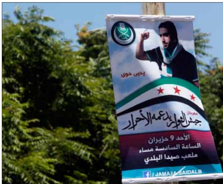
في شوارع صيدا (مروان طحطح)

الذي يسمع عن «ثورة»، وعن حفل في «الملعب البلدي» لدعم «جيش الأحرار»، يشعر بأننا في أيرلندا منتصف الثمانينيات. فارق بسيط: «الجيش السوري الحر» لا «جيش التحرير الإيرلندي». «الحى طويلة، وليس من شاربى خمر بين المحتفلين في الـ«كونسرت». وبدلاً من «كرانبيرز»، يحضر «غرباء جروب» (جروب = Group) الملتزمون بالإقاعات الإسلامية البديعة موسيقياً. وبدلاً من دولوريس أوريوردان، الإيرلندية الشهيرة بادائها التفاعلي، هناك «الحاج فضل شاكر» المنشق حديثاً عن الشيخ أحمد الأسير. وللمناسبة، يقولون له «الحاج»، رغم أن العارفين يؤكدون أنه لم يذهب إلى الحج في حياته، بل أمضى وقتاً طويلاً في «الفن». الفن العادي، «الهدام»، لا الفن الإسلامي الذي «يدعم الثورات». وعلى ملصق «الجماعة الإسلامية» الذي يدعو الجميع للحضور، دعماً