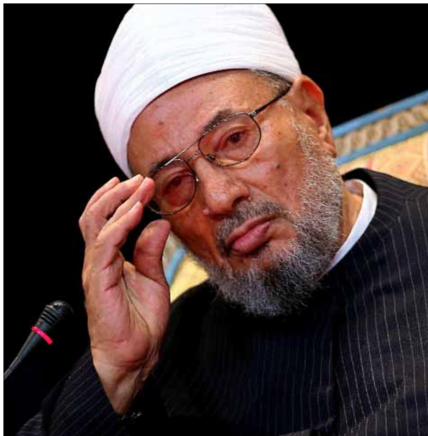
استبدال القرضاوي مصطلح «مذاهب» بـ«فرق» يشي بموقف عقدي

.تكفير الشيعة، فاستبدال القرضاوي مصطلح «مذاهب» بـ«فرق»، يشي بموقف عقدي، وقوله