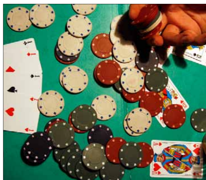
اللعاب القمار في الكازينو