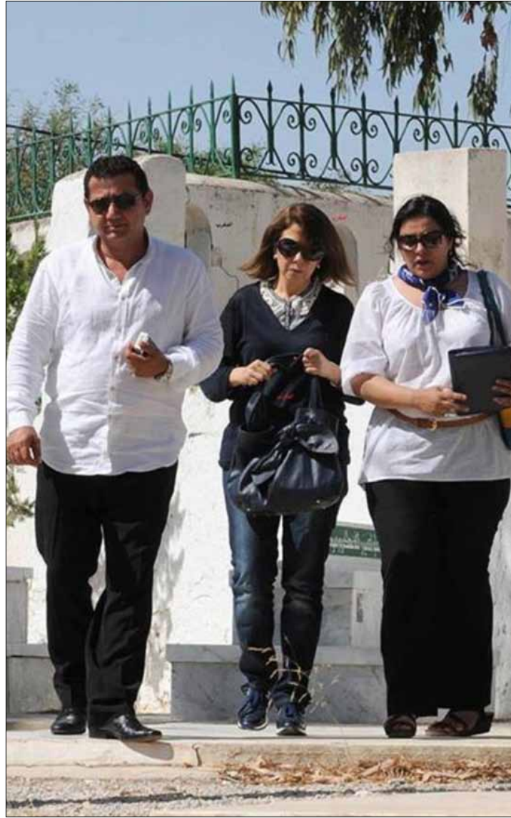
ماجدة الرومي خلال زيارة ضريح شكري بلعيد

زيارة سرّية قامت بها الفنانة اللبنانية إلى مقبرة المناضل اليساري المعروف بعد حلولها على تونس أول من أمس. هناك، وضعت باقة من الورد، وتوجّهت إلى الشهيد الذي صار «رمزاً لأنصار الحرية في كل العالم»