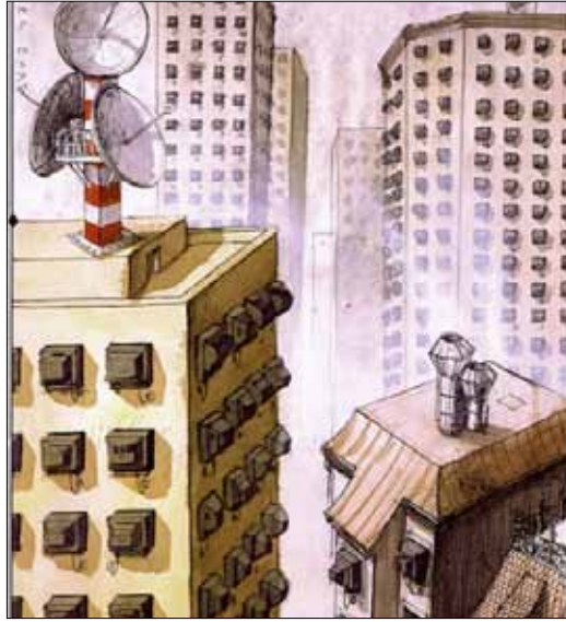
(رينر ايرت - ألمانيا)

«حان الآن موعد صلاة الفجر». هذا ما ستقوله الشاشة الصغيرة لمشاهديها، قبل أن يعلو الأذان بعد ثوان: «الله أكبر. أشهد أن لا إله إلا الله. أشهد أن محمد رسول الله. حي على الصلاة». ربما هو أمر معهود على معظم الشاشات العربية والخليجية الدينية والتجارية. لكن أن تذكر شاشة بريطانية عامة بمواعيد صلاة المسلمين، فهو أمر مفاجئ. هكذا قررت «القناة الرابعة» البريطانية، وهي قناة وطنية عامة، أن تذيع أذان الفجر طوال رمضان. وفي أول يوم من شهر الصوم، ستوقف المحطة برامجها خمس مّرات عند كل موعد صلاة وتعلن في فيلم صغير من 20 ثانية اقتراب وقت الصلاة.