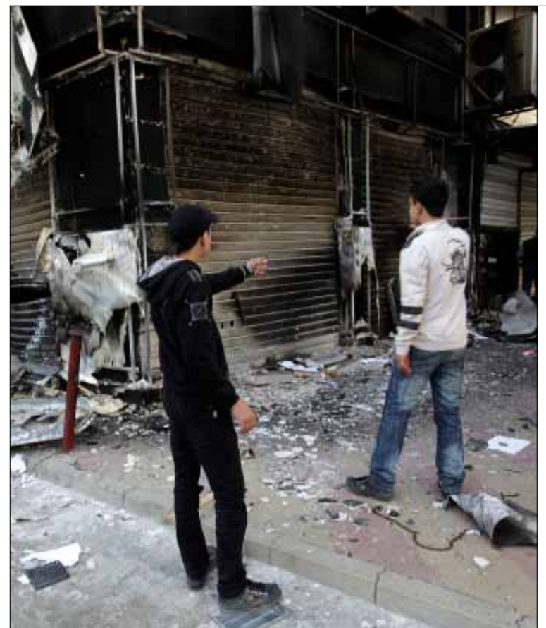
في أحد أحياء اللاذقية في الأسابيع الأولى من الأزمة السورية (أرشيف)

ويزداد الدور القيادي للجماعات الإسلامية المتشددة في الانتفاضة السورية، وامتد نفوذ الكثير من الوحدات الإسلامية التي يرتبط بعضها بتنظيم القاعدة إلى خارج ساحة القتال وأسست جهازاً للشرطة ومجالس إدارية في بعض المناطق الخاضعة لسيطرة المعارضة، تضيف الوكالة.