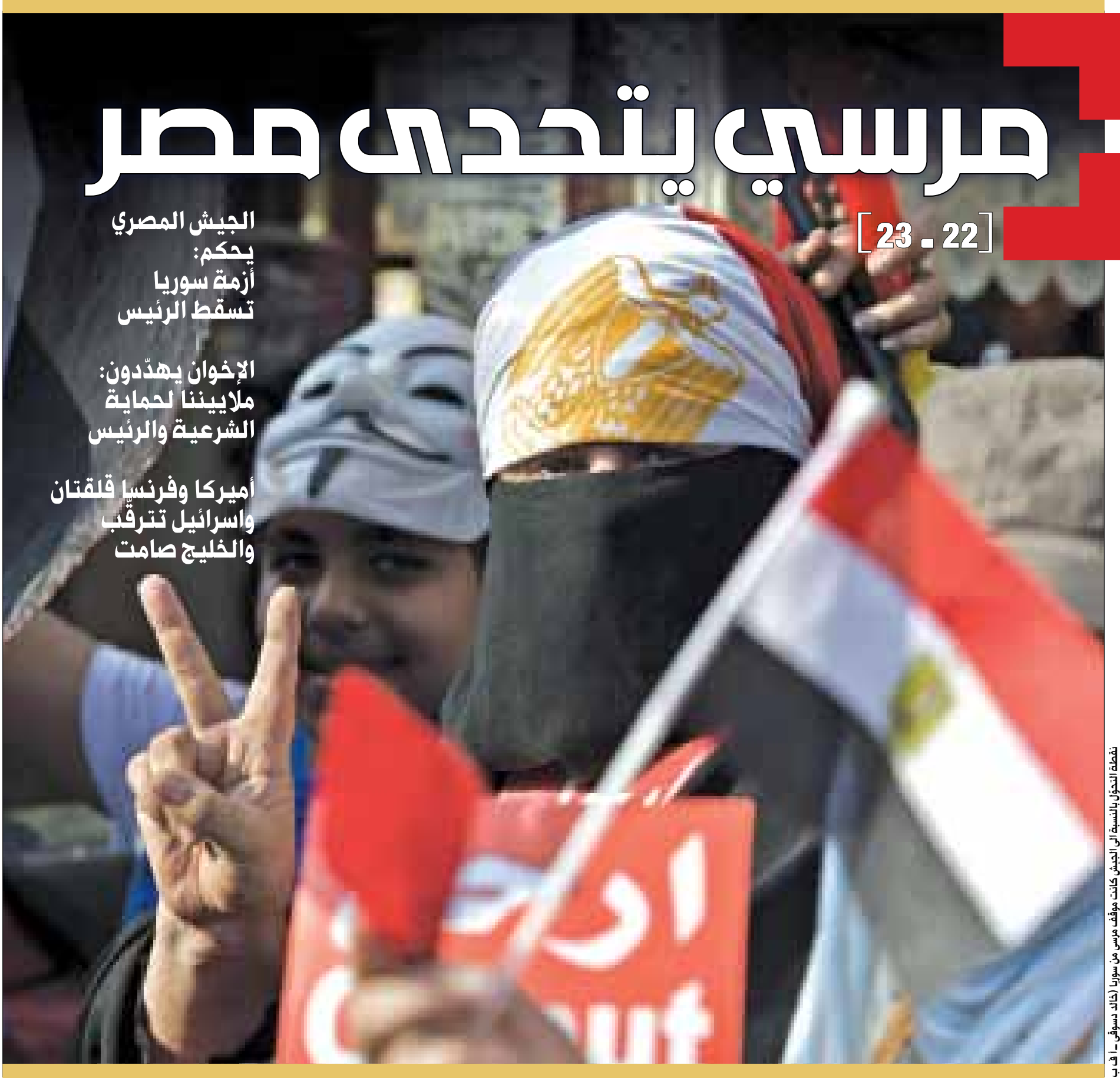
نقطة التحول بالنسبة الى الجيش كانت موقف مرسي من سوريا

أميركا وفرنسا قلقتان واسرائيل تترقب والخليج صامت