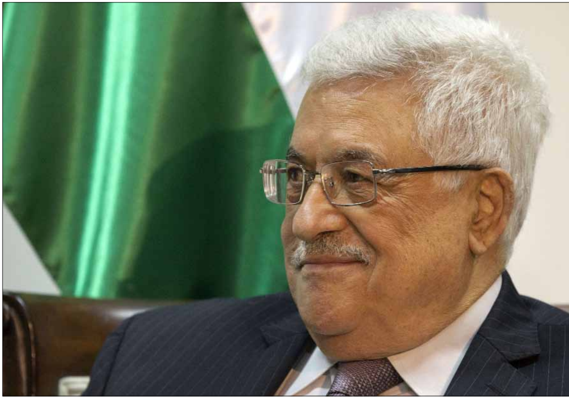
أوضح عباس أن مقترحات كيري تحتاج إلى مزيد من التوضيح والتفسير لنتمكن من العودة للمفاوضات

استنساخ السياسة الأميركية ذاتها القائمة على إضاعة الوقت وخداع الرأي العام، وإعطاء مظلة للاحتلال الإسرائيلي للاستمرار في مشاريعه الاستيطانية، والالتفاف على الحقوق الوطنية المشروعة للشعب الفلسطيني من خلال طرح مبادرات مخادعة وغير ذات جدوى.