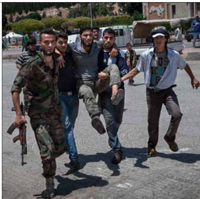
معارضون ينقلون جريحاً باتجاه الأراضي التركية

محافظ حمص، أكد في تصريح له «الأخبار» أن لا جدول زمنياً حتى الآن في ما يخص إعادة الإعمار النهائي، إنما قامت المحافظة بواجبها بناءً على خطط إسعافية تهدف إلى إعادة تنظيم المخطط التنظيمي لمدينة القصير وتأمين الخدمات تدريجياً كالكهرباء والماء وخطوط الهاتف ووضع برنامج للإغاثة. بالإضافة إلى تسجيل أسماء المواطنين من أصحاب العقارات المتضررة لتقويم حجم الأضرار والتعويض عليهم. 100 ألف ليرة سورية رصدتها الدولة من قيمة الأضرار، بحسب محافظ حمص، لكل منزل إلى حين تقدر الكمية الكاملة للخسائر للتعويض النهائي على المواطنين. وتوقع استئناف عودة المدنيين مع بداية الأسبوع المقبل. ويعتبر المحافظ أن الكلام عن جنسيات شركات الاستثمار سابق لأوانه إذ إن الدولة لم تبت هذا الملف حتى الآن، ناهياً الكلام عن حجز أماكن على خارطة إعادة الإعمار لشركات إماراتية أو روسية. وقارن المحافظ بين نموذج الحرب الصعبة في القصير والأعمال العسكرية للجيش السوري، ونموذج المصالحة الوطنية في تلكخ التي حققت الدماء وصانعت الممتلكات، حيث نزع أهالي القصير منذ أكثر من سنة ولم يكن أي مجال للقيام بمصالحة أو تشبيك اجتماعي. كما دافع عن فكرة عقد المؤتمر المنعقد حالياً في هذه الظروف، لضرورة التأكيد على عروبة سوريا، رافضاً الحديث عن نبذ فكرة العروبة من قبل بعض السوريين، إذ وصف بعضهم بالمرجوحين من تدخل بعض الأنظمة العربية سلباً في الداخل السوري، وبعضهم الآخر بالمجورين.