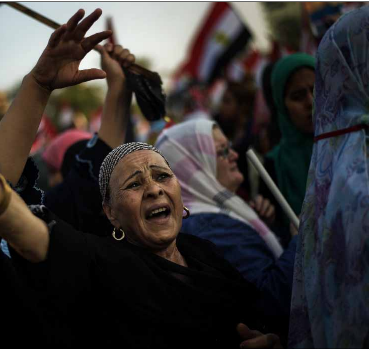
راى مرسى أن ما يجري انقلاب عسكري ناعم ضده (غيانلويغي غارسيا - أ ف ب س)

«الأمر لي». أمر عمليات يبدو واضحاً أن الجيش المصري يترجمه عملياً على الأرض بكل أبعاده. سيطرة على المنافذ وعلى المواقع الحيوية، وعلى الرئيس نفسه. حتى قرار الحسم لا يزال يمسك به بين يديه بانتظار إعلانه عند الرابعة من بعد ظهر اليوم في حال استمر المأزق السياسي. العيون شاخصة على قائده، عبد الفتاح السيسي، الذي يؤكد كثر أنه من بدير اليوم البلاد... والعباد