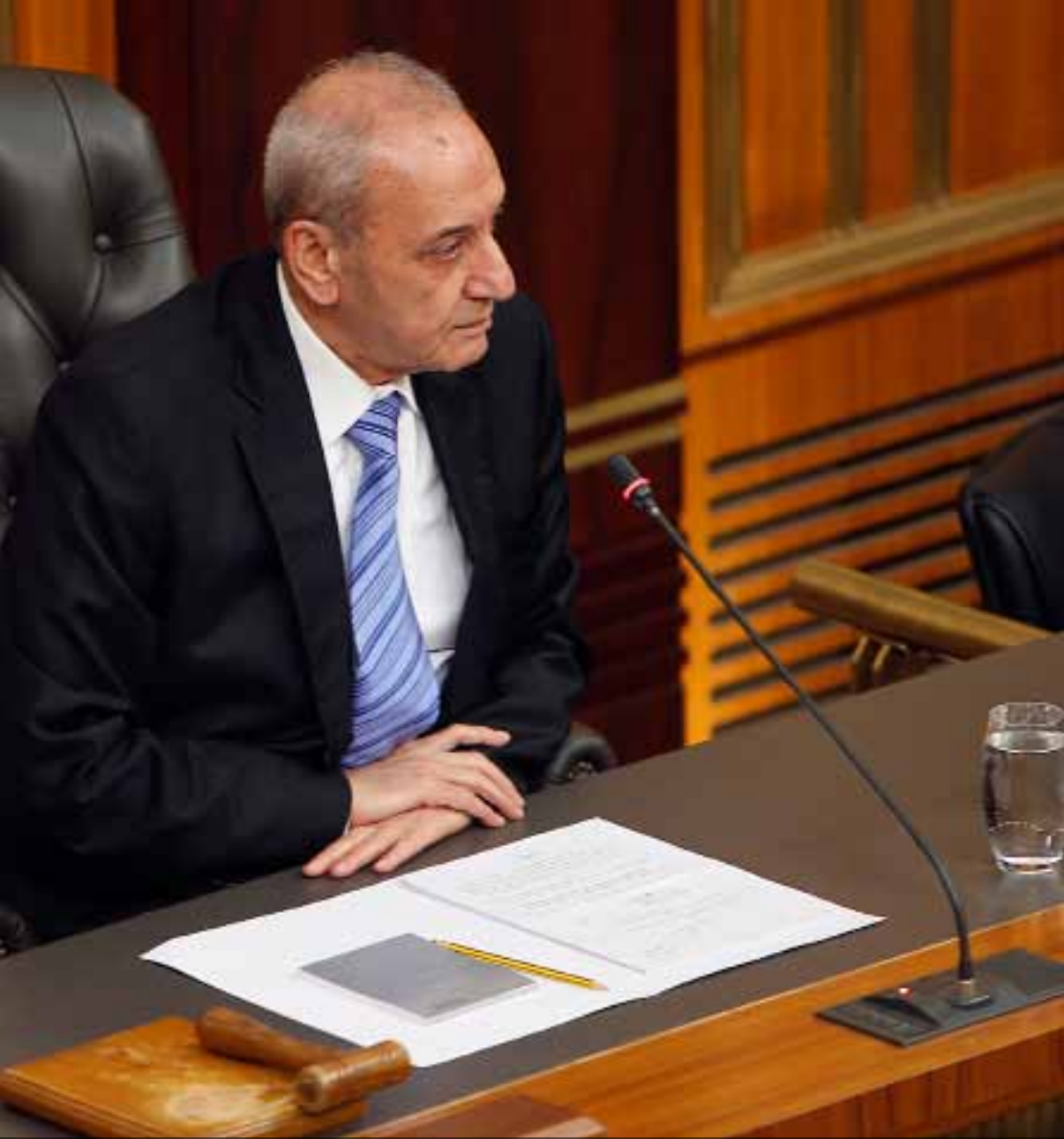
لن اغبر في مواعيد جلسات مجلس النواب وجدول أعماله حرف لا يقرا (هينم الموسوي)

رئيس المجلس النيابي خائف من الوضع الأمني، لافتاً إلى أن «البلد يهز كلو سوا». وإذ استعجل تأليف الحكومة، أكد أن فريق الرئيس المكلف، «أي 14 آذار»، يعطل تأليف الحكومة