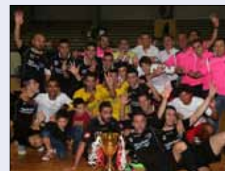
لاعبو الصداقة مع الكأس السوبر

تبدأ في اتحادات رياضية وتنتهي في اللجنة الأولمبية نفسها عبر استقالة الأعضاء الشبعة وما قد يؤدي الى استقالات أطراف أخرى قد تُسقط اللجنة الأولمبية. ورغم أن السيناريو الأخير لا يزال بعيداً إلا أنه وارد في حال لم تتم معالجة الأمور سريعاً وإعادة الاعتبار الى الطرف المتضرر الذي من المفترض أنه حليف للطرف القوي في لعبة كرة السلة.