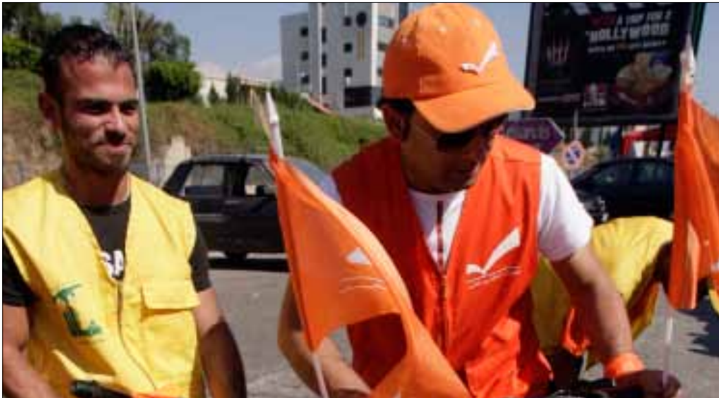
ثمة توجه لعقد لقاء قمة بين عون والسيد حسن نصر الله (هيثم الموسوي)

يبدو أن الخلاف الأخير بين التيار الوطني الحر وحزب الله سائر نحو الحل، في ظل حرص الجانبين على إنهاءه، وحتى تطوير التفاهم بينهما ووضع آليات جديدة له، فيما لا يزال فريقاً 8 و14 آذار على موافقهما تجاه تأليف الحكومة، ما يعني استمرار العرقلة إلى أجل غير مسمى