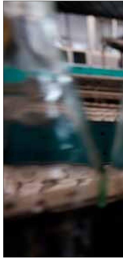
«سوليفر» لم يتمكن من التنافس مع مستوردي الزجاج من مصر والكويت وتركيا

هذا الإنذار، سبق أن وجهه مصنع يونيسيراميك، لكنه لم يلق أذناً صاغية، وانتهت معركته بالهجرة. في حين أن صمم الأذان في حالة «سوليفر» عجل بتحويل المصنع إلى مجرد صفقة عقارية مريحة. إنه موسم الهجرة من الصناعة إلى «مول».