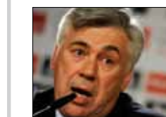
أنشيلوتي يندرج كাকা