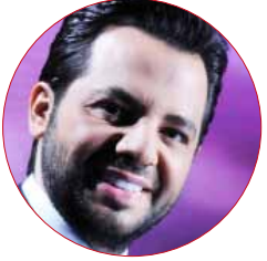
الليلة هم نيشان

«حكاية حياة» على cbc (21:00) و art حكايات» (20:00) «مزاج الخير» على «النهار» (13:00) «القاصرات» على «أم. بي. سي. مصر» (23:30) «موجة حارة» على «أم. بي. سي. دراما» (21:00)