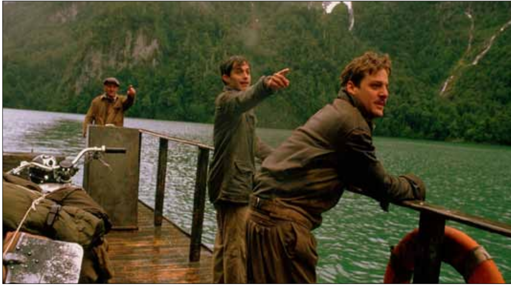
مشهد من «مذكرات دراجة نارية»

عروض Night Riders: من 20 تموز (يوليو) حتى 12 تا (أكتوبر). The Gar- ten (بيال . وسط بيروت) . للاستعلام: 01/332661