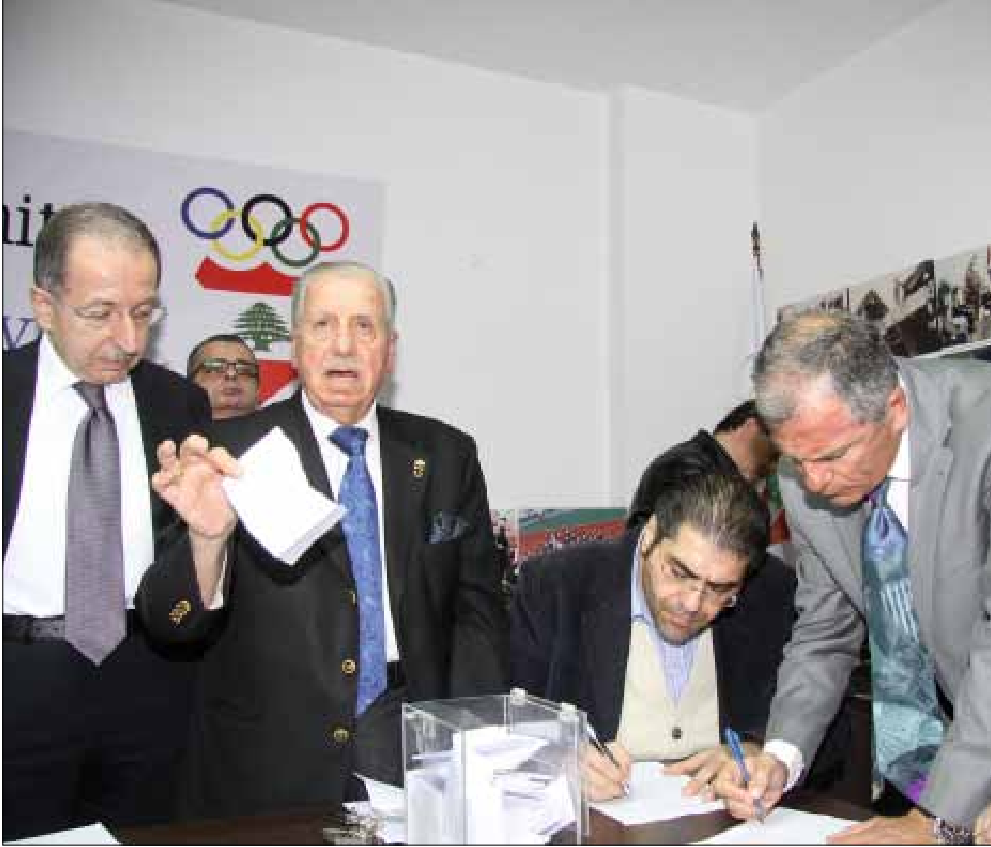
هل تدفع اللجنة الأولمبية ثمن أخطاء السلة؟

انتهت أزمة كرة السلة اللبنانية وبقي منتخب لبنان في شرق آسيا بانتظار رفع الفيفا للايقاف، فجاء الفرج عبر القضاء اللبناني الذي رد دعوى نادي عمشيت في سيناريو أشبه بأفلام الدرجة السابعة وبإخراج فاشل وسط تساؤلات عن أسباب عدم الوصول الى هذا الحل سابقاً