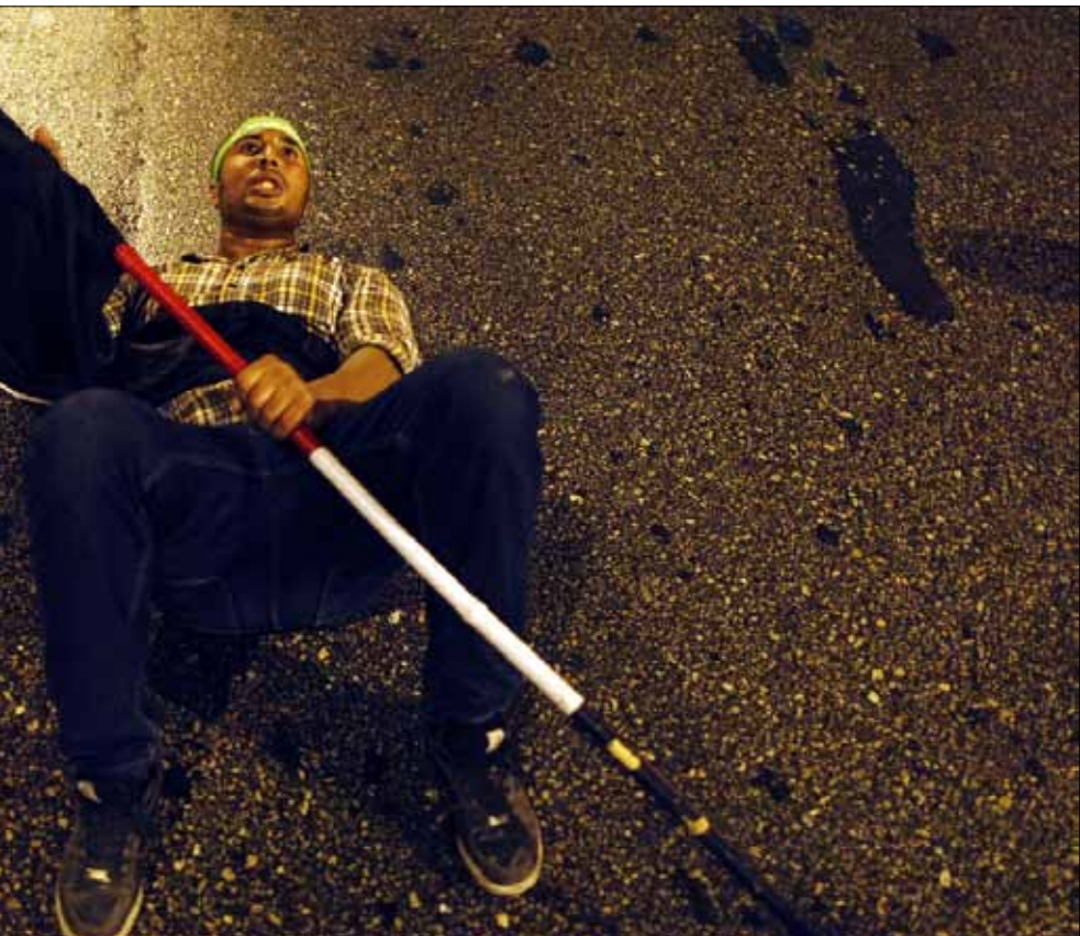
الإخوان فهموا الدرس جيداً وبدؤوا بتصرفون في هجومهم المعاكس كطبقة (أ ف ب)

على اليسار المتشكك استيعاب الأمر سريعاً قبل أن يستوعبه الإخوان وبيدوا فعلياً بالهجوم المضاد. من مصلحة الجميع الآن استعادة مشهد يوم الأحد قبل الماضي، والتصرف بفوقية أقل مع الناس الذين انتفضوا جماعياً ضد الإخوان، فنحن بالفعل إزاء تحول تاريخي تلعب فيه الطبقات التي همشتها الموجة الأولى من الانتفاض دوراً رئيسياً. البارحة فقط أسهم هؤلاء في دحر الهجوم الإخواني على ميدان التحرير والمعتصمين فيه. لقد تابعت على مواقع التواصل الاجتماعي التحيات التي