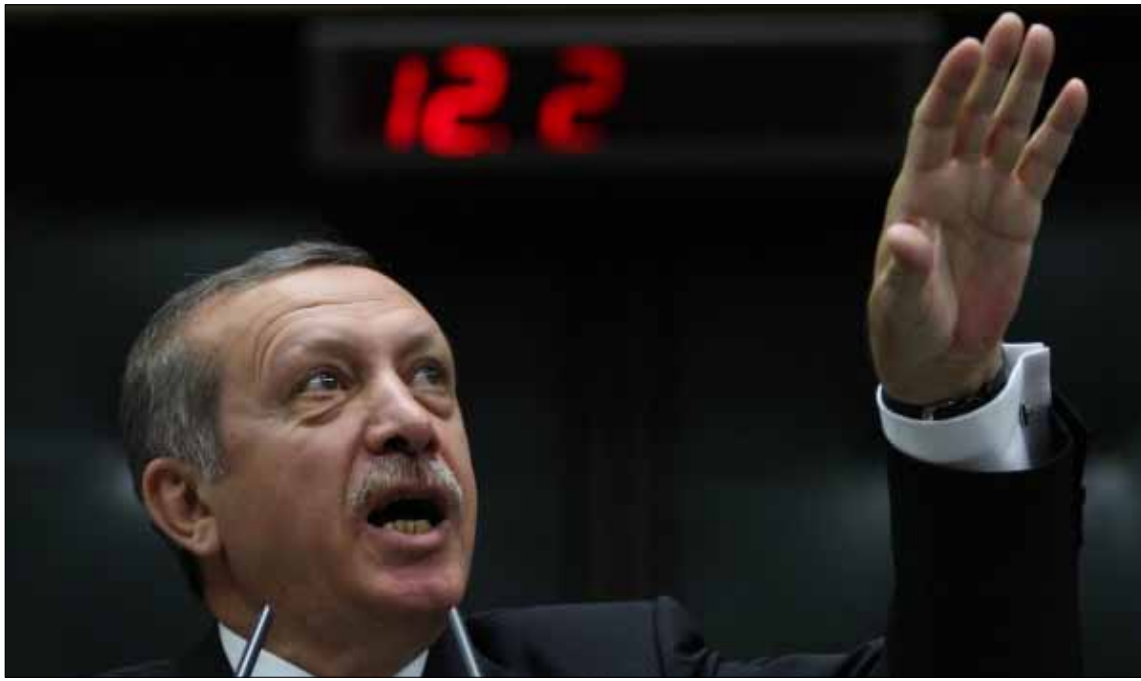
عين أردوغان أخيراً أحد أبرز مروّجي نظريات المؤامرة مستشاراً رسمياً له

«يجب علينا أن نوقف لوبي معدّل الفوائد عند حدّه، لأنهم لا يريدون نمو تركيا وتطورها» قالها رئيس الوزراء التركي منذ أن وطأت قدماه الأراضي التركية في المطار بعيد بدء التحركات الاحتجاجية في اسطنبول. أردوغان كرر الكلام عن «لوبي معدّل الفوائد» في اجتماعات برلمانية وخطابات لاحقة ودائماً في معرض اتهام المتظاهرين بتلبية «مؤامرة هذا اللوبي» الشرير. الإعلام الموالي للنظام، بقيادة بولوت، تناوب على شرح ماهية ذاك اللوبي ومن يديره وما هي أخطاره. هو «لوبي يقوده ممولون يهود بالاشتراك مع منظمي أوبوس ديي Opus Dei وإيلوميناتي