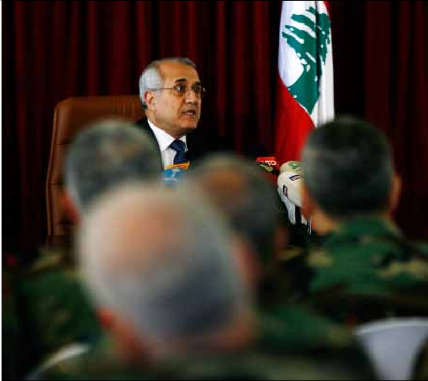
باستعداده لتدمير كرة السلة، أهدى سليمان العونيين نصراً لم يكن في الحسبان (مروان بوحيدر)

حين أطلق الرئيس سليمان سباق الماراتون في بيروت قبل ثلاث سنوات، ظن بعض العدائين أن بوسعهم الانطلاق في الركض. لكن الحرس الجمهوري قمع حماسهم ريثما يفسح الرئيس - متصدر السباق - الطريق أمامهم فيكون تقدمهم عليه ناجماً عن خروجه من السباق وليس تفوقهم عليه. الأمر نفسه يتبعه الرئيس في ما يخص التمديد: هو يعلم أن القوى السياسية جميعها ستسابق للتمديد له، لكنه يقطع الطريق عليهم بإعلانه رفضه التمديد. هكذا اقترح محامي النادي ومستشار الرئيس سحب الدعوى القضائية مقابل عودة الاتحاد اللبناني لكرة السلة عن قراره تغليب الشانفيل على نادي عمشيت وتحديد موعد جديد للمباراة يتغيب عنها النادي الجبيلي ليهدي الشانفيل فوزاً لا يستحقه بالضرورة. هكذا لا يزعل ابن الرئيس. أساساً لا يجوز «إزعال» ابن الرئيس، دعم من علاقة والده الوطيدة بالأمير القطري السابق، أسالوا حرس الجامعة اللبنانية الأميركية في قريطم والطلاب وسلسلة مطاعم السمك في المعاملتين.