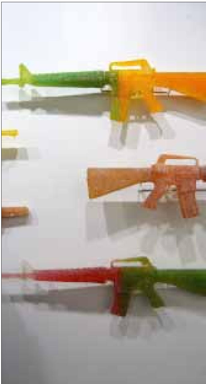
عمل للفنان البريطاني دارين لاغو في «آرت بازل»

هذا الحضور الآسيوي قوي إلى درجة أن المشروع الفني الذي أقيم في الساحة الخارجية لأرض المعارض، أي قبل الدخول إلى مباني صالات المعرض، نفذه الفنان الياباني تاداشي كاواماتا وهو عبارة عن 18 كوخاً خشبياً مستوحاة من المباني العشوائية والأحياء الفقيرة في أميركا اللاتينية. هذا العمل شبه التفاعلي، إذ تجلس فيه كاستراحة، وهو نموذج للأعمال التي نستخلص منها درساً جوهرياً في فلسفة الفن، ألا وهو أن الأعمال الفنية قد تتغير معانيها باختلاف الأجيال أو الأماكن التي تعرض فيها. لو عرضت هذه الأكواخ في حي عشوائي في بلد أفريقي أو أميركي - لاتيني، لفقدت فوراً مغزاهما الفني والجمالي الذي يمكن أن تراه عين ساكن المدينة الأوروبية المتحضرة. بشكل أكثر كثافة من أي عام مضى، حضرت الفنانة اليابانية المقيمة في برلين شيهارو شيويتا (1972)، بخيوطها السوداء التي تنسج منها في فراغ المعرض المتاح ما يشبه بيت عنكبوت هائلاً ومتداخل الأنسجة والطبقات ويدخله مفردات كالبيانو أو المقاعد أو