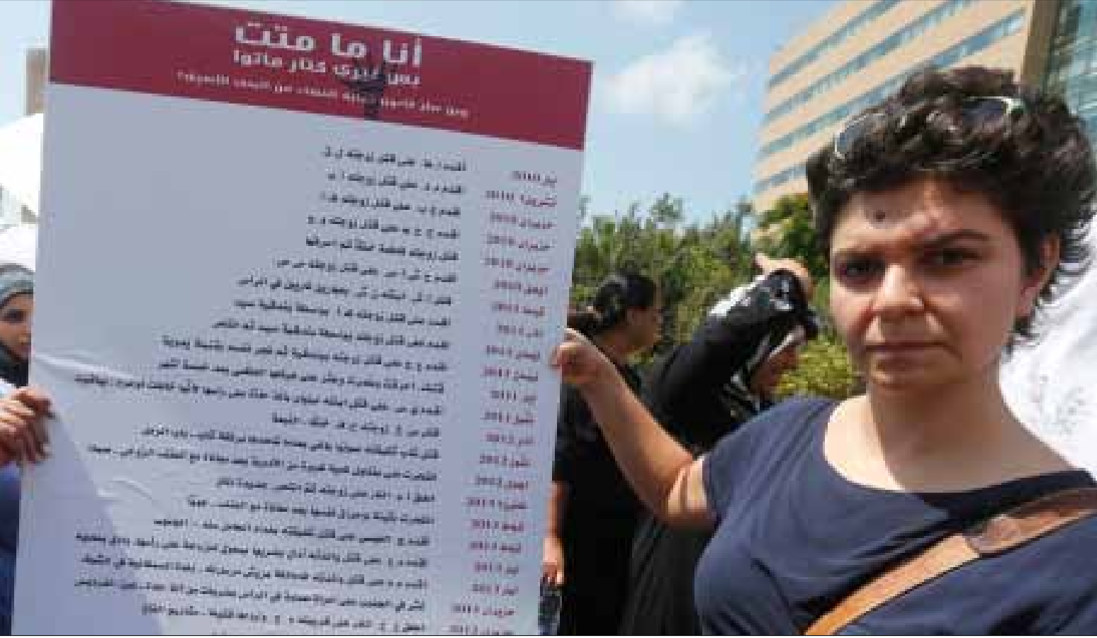
اعتصمت النساء أمس تزامناً مع انعقاد جلسة اللجان النيابية المشتركة

رياض الصلح بدعوة من منظمة «كفى عنف واستغلال»، تزامناً مع انعقاد اجتماع اللجان في محاولة للضغط على السياسيين لإقرار قانون حماية المرأة من العنف الأسري، بعد إقرار القانون، ورغم التحفظات العديدة، التي سجّل بعضها النائب إليي كيروز بعد انتهاء انعقاد اجتماع اللجان، رأت «كفى» أنه «تمّ بجهودنا جميعاً اجتياز محطة أساسية من مشوارنا الطويل نحو الإقرار النهائي لمشروع حماية النساء من العنف الأسري في الهيئة العامة لمجلس النواب». فيما رأت الناشطة في مجموعة «نسوية» نادين