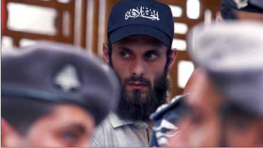
نصح أصحاب هذا المشروع بأن يهتموا بتعبدهم وبيتعدوا عن شؤون الحكم (هيثم الموسوي)