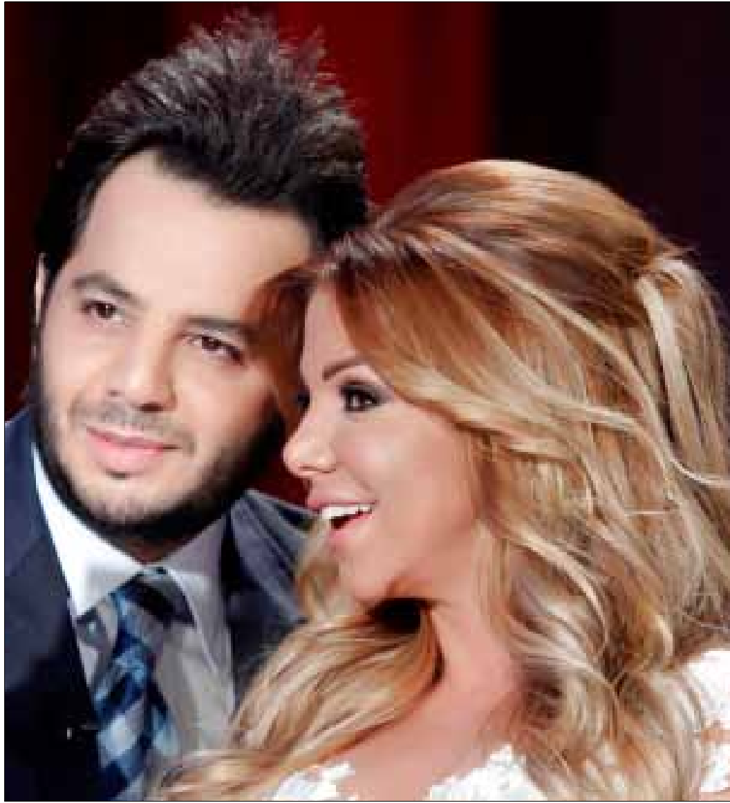
نيشان ورزان مغربي

يستضيف نيشان ديرهاروتيونيان في برنامج «أنا والعسل 2» اليوم الثلاثاء المغنية الإماراتية أحلام (الصورة). وقد ذكرت بعض المصادر المقرّبة من الفنانة أنها سوف تطلّ في البرنامج التلفزيوني مرتدية الحجاب لأنها تضعه خلال شهر رمضان. كما ستعرض أحلام الغناء في المقابلة، فهل تصدق تلك التوقعات؟ وتحلّ غداً الأربعاء الفنانة عفاف شعيب ضيفة على البرنامج في أول مشاركة لممثلة محببة خلال حلقات هذا الموسم من العمل التلفزيوني. فيما يستضيف في حلقة بعد غد (الخميس) الموسيقار حلمي بكر، ليكون ثالث ضيف رجل نيشان بعد باسم يوسف وحسن الشافعي.