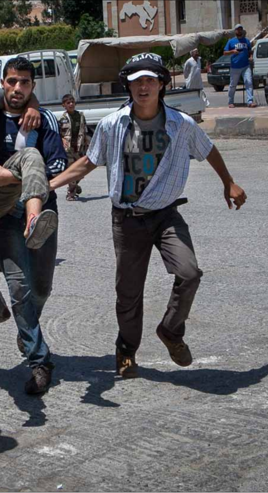
حمل تسجيل الجولاني عنوان «قائل الأيام خير من ماضيها»