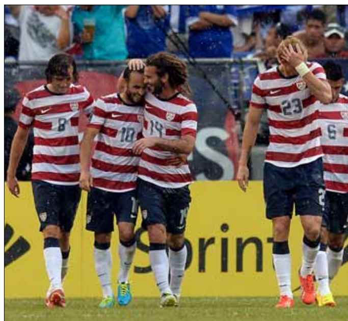
فرحة أميركية بأحد الأهداف الخمسة

ستتواجه الولايات المتحدة المضيفة مع هندوراس في نصف نهائي مسابقة الكأس الذهبية في كرة القدم لمنتخبات منطقة الكونكاكاف (أميركا الشمالية والوسطى والكاريبي) بعد بلوغهما هذا الدور، وذلك إثر فوز الأولى على السلفادور بسهولة 5-1، والثانية على كوستاريكا 1-0، ضمن الدور ربع النهائي.