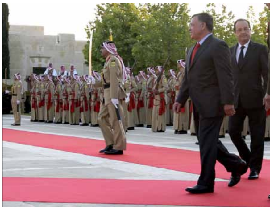
أي تسويغ لكل سياسات عمان تخدم بالمطلق أعداء امتنا والمتامرين على قضايانا

علي، الابن الأكبر، عين نفسه ملكاً على الحجاز بعدما اعتقلت بريطانيا والده، لكن القوات الوهابية المدعومة أميركياً سرعان ما طردته من هناك، حيث لجأ إلى شرق عبر الأردن، إلى جانب شقيقه، تحت رعاية «الأم الحنون»