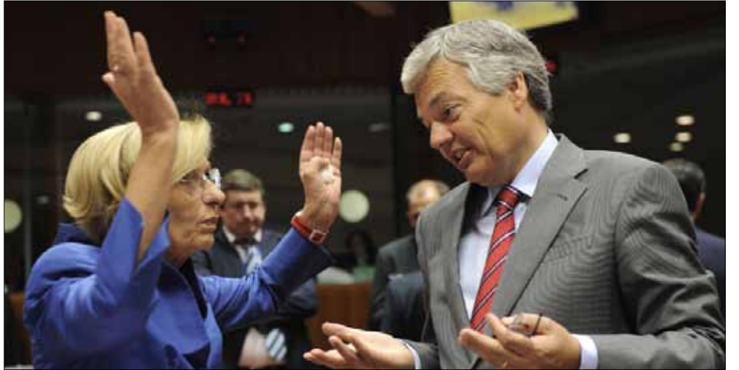
وزيرة الخارجية الإيطالية إيمان بونينو ونظيرها البلجيكي ديديه ريندير قبيل اجتماع وزراء خارجية الاتحاد أمس

بعد جهود دبلوماسية أميركية وإسرائيلية، قرر وزراء خارجية الاتحاد الأوروبي أمس إدراج ما سُمي «الجناح العسكري لحزب الله» على قائمة المنظمات الإرهابية، مؤكداً في الوقت نفسه أنهم يريدون «مواصلة الحوار» مع كل الأحزاب السياسية اللبنانية بما فيها حزب الله