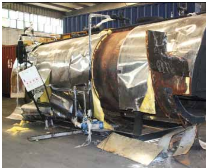
تم رصد الشاحنة التي تنقل الآلة ونقلها على الفور إلى المرفأ

حبوب «الكبتاغون» مجدداً في دائرة الضوء. فقد أحبط مكتب مكافحة المخدرات المركزي بإمرة العقيد غسان شمس الدين محاولة تهريب 5 ملايين حبة «كبتاغون» إلى السعودية. الخمسة ملايين حبة المضبوطة لا تعني إلا أن هناك ملايين أخرى تمكن تجار المخدرات من تهريبها، لا سيما أن التقارير الأمنية ترصد عمليات تهريب مئات آلاف الحبوب عبر الحدود اللبنانية، ترانزيت، لا يُضبط منها إلا اليسير. وفي هذا السياق، أعلنت المديرية العامة لقوى الأمن الداخلي أن العملية تمت بناء على توافر معلومات عن محاولة تهريب كمية من المخدرات من سوريا إلى إحدى الدول العربية عبر مرفأ بيروت بواسطة آلة تكيف عملاقة تستعمل في منشآت كبيرة أو مراكز صناعية. وقد ذكر بيان المديرية أنه بنتيجة المتابعة تم رصد الشاحنة التي تنقل الآلة، ولدى محاولة ركنها في منطقة عمشيت على مدخل بيروت الشمالي تم ضبطها ونقلها على الفور إلى المرفأ حيث احتجزت هناك. وعلمت «الأخبار» أن الكلاب البوليسية لم