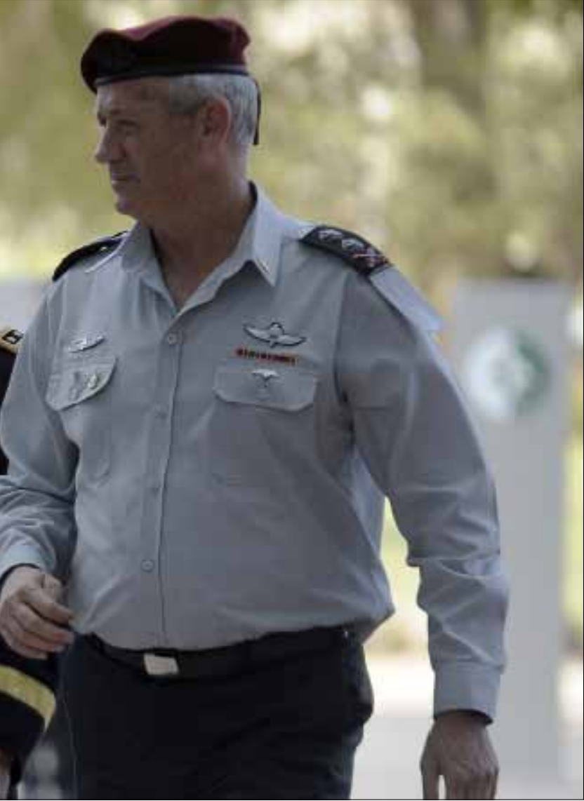
ديمبسي: الجيش السوري ينقل الأسلحة الكيميائية من مكان إلى آخر بهدف ضمان أمنها

بالتزامن مع تدفّق السلاح نحو سوريا وازدياد نفوذ «الجهاديين»، ما زالت واشنطن «التي تراقب التعاون بين المقاتلين المعتدلين والمتشددين» متمسكة بعقد «جنيف 2»... من دون الرئيس السوري «الفاقد للشرعية»