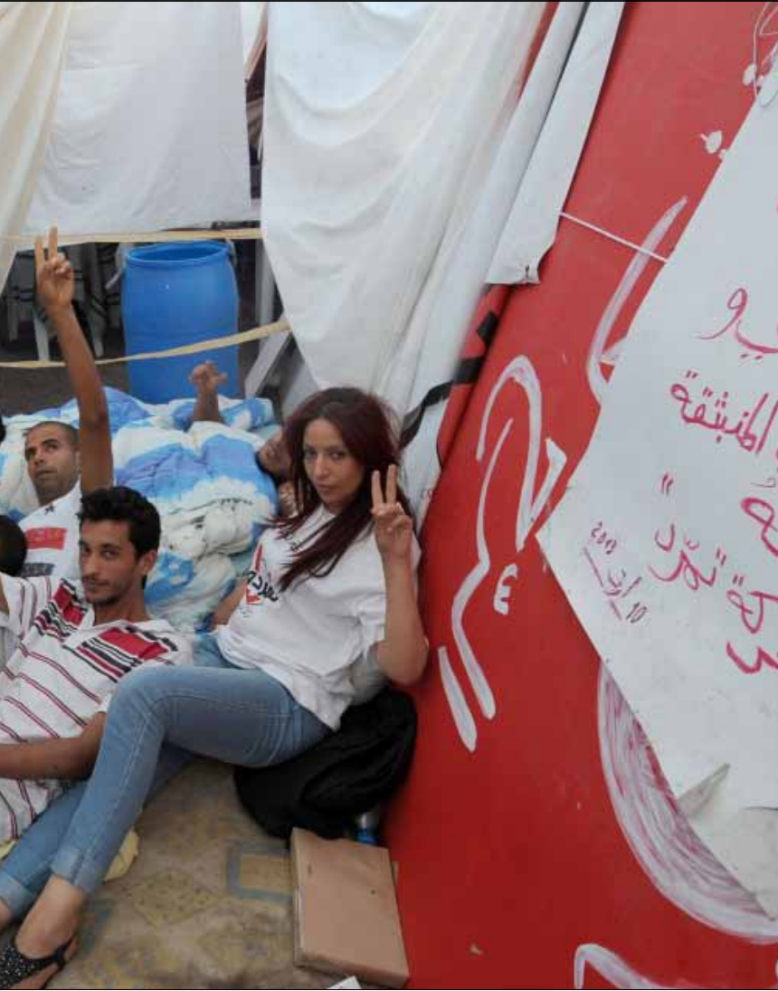
المرزوقي دعا المجلس التأسيسي الى استئناف عمله واقترح تشكيل حكومة وحدة وطنية

فيما تتوالى الضربات الأمنية الموجعة التي تسدها القوى الأمنية التونسية منذ أيام للمجموعات الإرهابية، تبدو آفاق الوصول إلى وفاق بين الخصوم ضئيلة بعد فشل اللقاء بين الغنوشي والعباسي