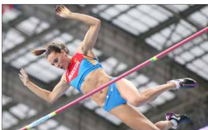
إيسينباييفا فائزة ذهبية القفز بالزانة

على الفضية (1,43,55 د). وتوج الألماني روبرت هارتينغ بذهبية مسابقة رمي القرص مسجلاً 69,11 متراً. وعادت الفضية إلى البولوني بيوتر مالاخوفسكي