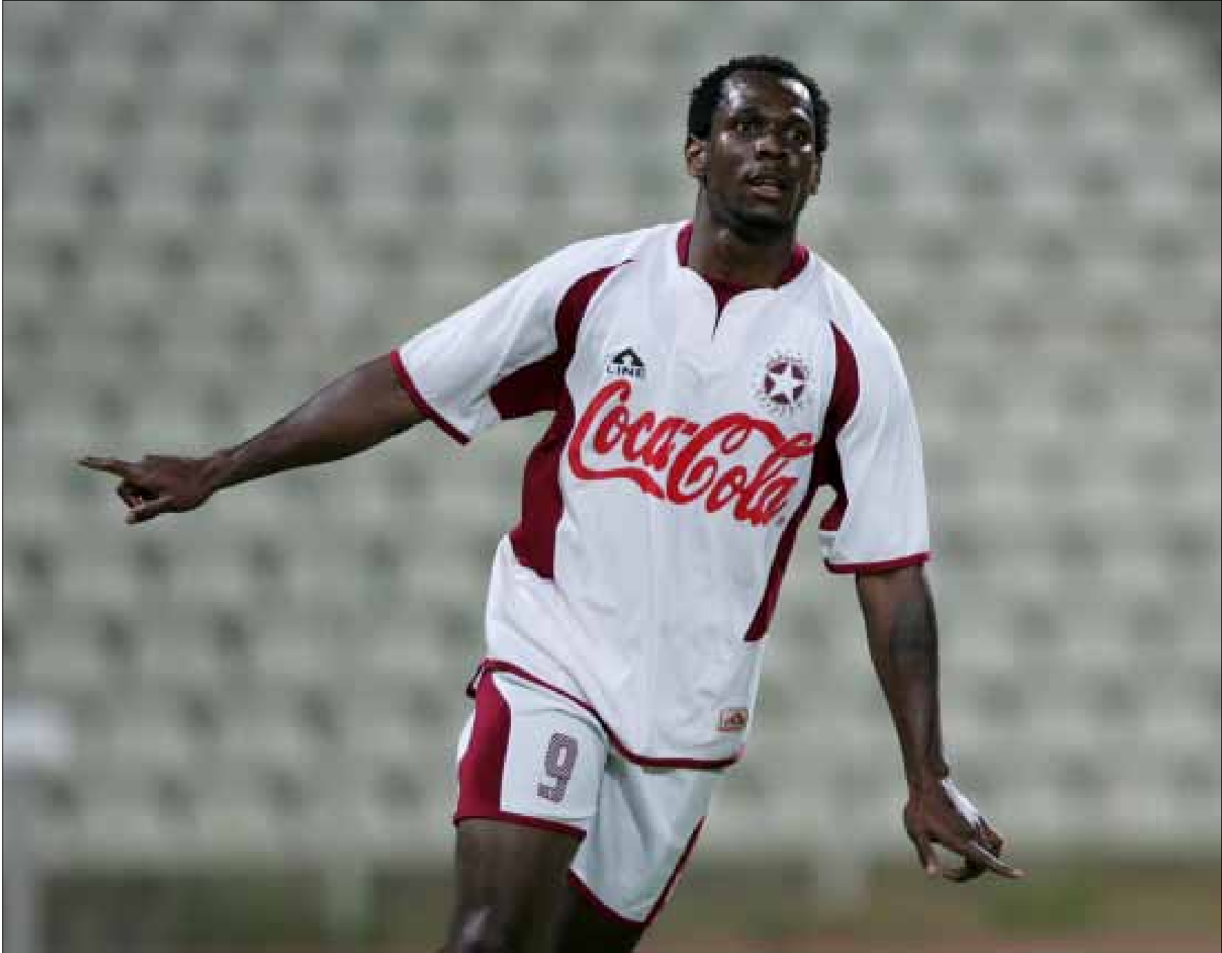
لن نرى قريباً اجانب في لبنان من مستوى إيرول ماكفرلاين مثلاً