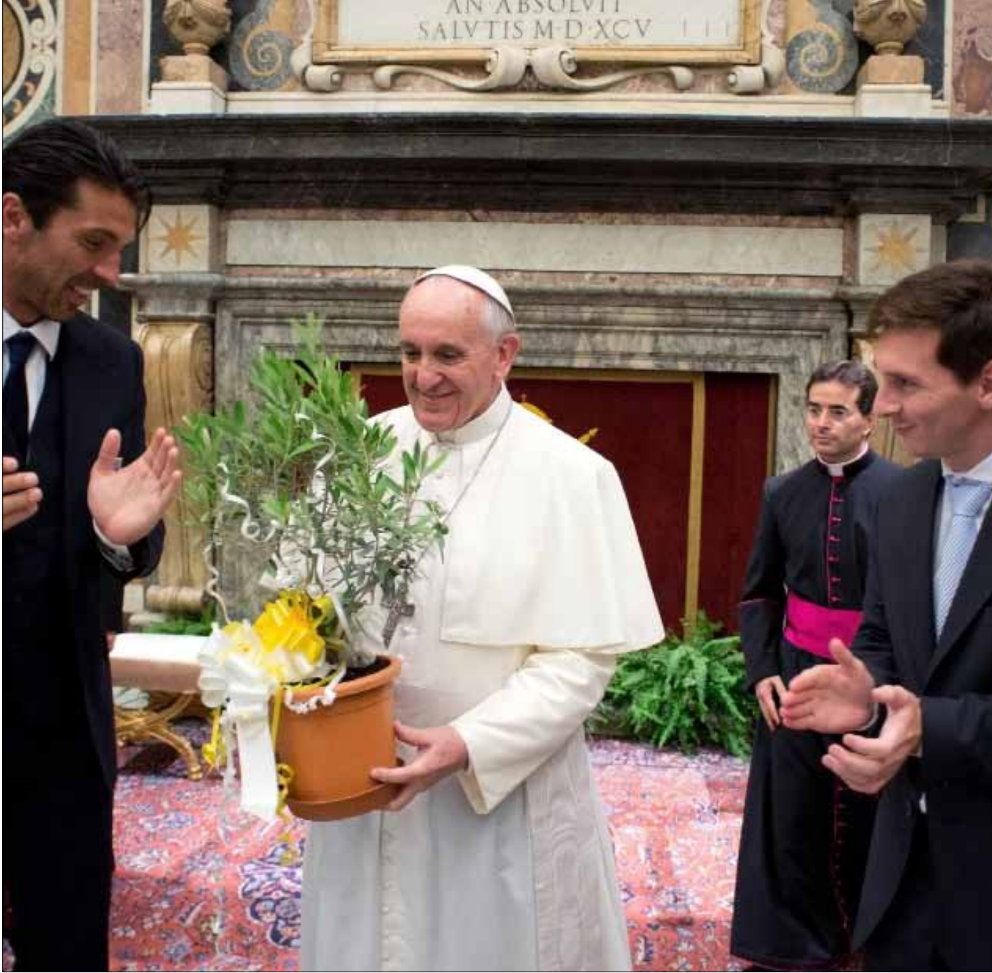
ميسي وبوفون يقدمان شجرة الزيتون الى البابا فرانسيس خلال زيارة منتخبى الأرجنتين وايطاليا الى الفاتيكان امس

لقاء ودي كبير بين إيطاليا والأرجنتين على شرف بابا الفاتيكان فرانسيس. مباراة على ملعب «الأولمبيكو» في روما تعيد بالذاكرة الى نصف نهائي مونديال 1990 بين الاثنين، والتي كان نجم الجمهوريين فيها «الأسطورة» مارادونا. هذه المرة لن يتعاطف أحد مع الأرجنتينيين، سيهتفون فقط «إيطاليا»