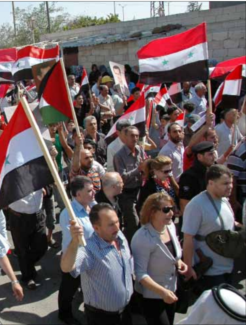
خلال تظاهرة داعمة للجيش السوري في ريف حمص امس

الذي وقع في خان العسل. في السياق، أعلن رئيس الحكومة الأردنية، عبد الله النسور، أن «بلادنا مستعدة لاندلاع حرب كيميائية مقبلة من الأراضي السورية». وقال النسور، في مؤتمر صحافي، «صرحنا علناً وقلنا بأن لدينا احتمالات حروب كيميائية، ولم نقل حروباً كيميائية ممن». وأضاف «يبدو أن هناك (سلاحاً) كيميائياً، وإذا كان سواء عند هذا الطرف أو ذلك، فيجب أن نخاف منه ومن واجبنا أن نحكي شعبنا وأن نحمي قرانا الحدودية وخاصة مخيم الزعتري حيث يقم 130 ألف (لاجئ سوري)».