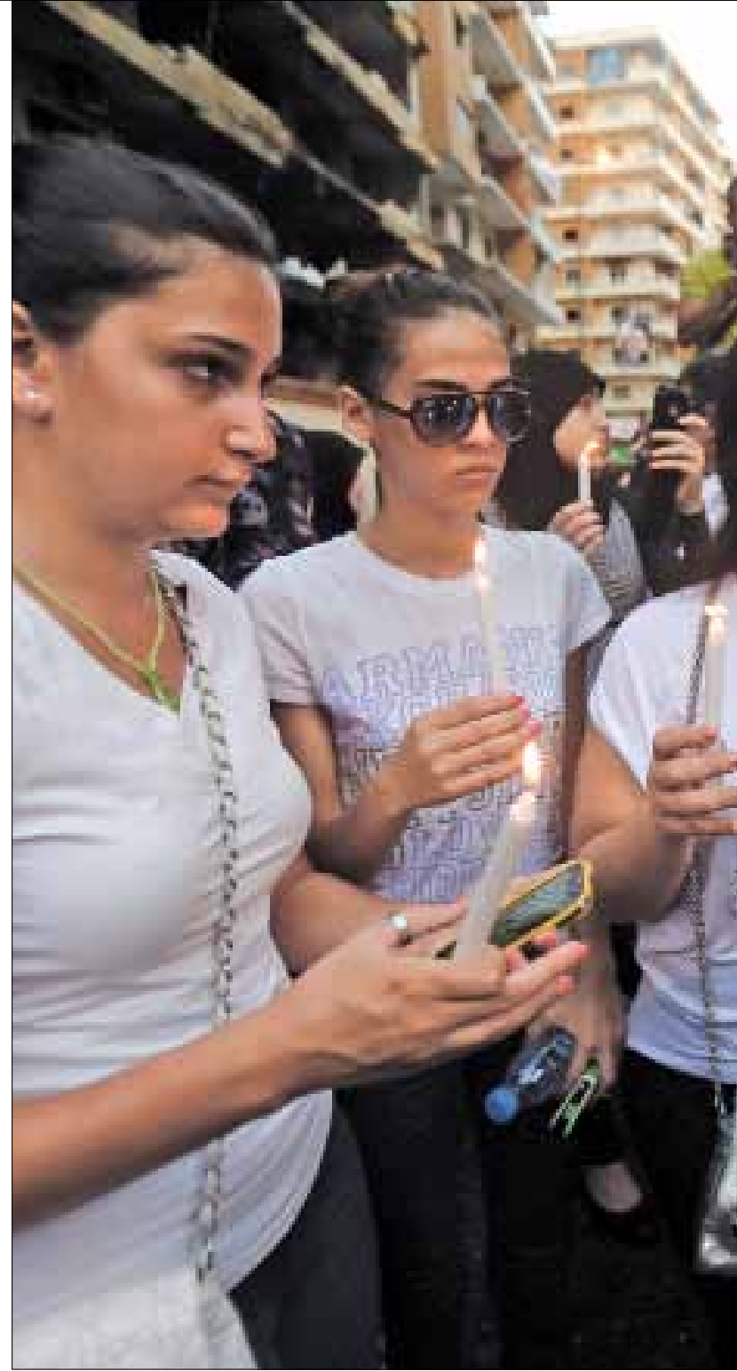
من اعتصام «وفاء للضاحية وأهلها» في مكان تفجير الرويس أمس

بلدة زوطر في الجنوب بعدما تم احتجازه بلضعة أيام في الضاحية الجنوبية».