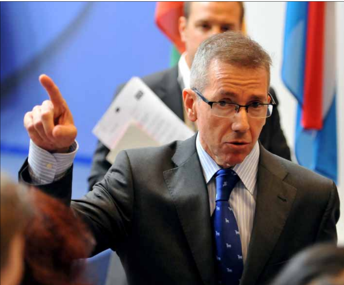
«فرض حظر سلاح على مصر أحد الخيارات التي يبحثها وزراء خارجية الاتحاد»

كذلك هاجم المجتمع الدولي قائلاً «اللاسف الشديد نرى أن الموقف الدولي تجاه الأحداث الجارية في مصر يتعارض مع مواقفه تجاه الأحداث في سوريا. فإين الحرص على حقوق الإنسان وحرمة دمه والمذابح التي تجري كل يوم في سوريا والتي أدت إلى قتل أكثر من مئة ألف سوري ودمرت سوريا بأكملها دون أن نسمع همسة واحدة من المجتمع الدولي». بعد أطروحة الوزير السعودي، جاء رئيس الوزراء الأردني عبدالله النسور ليتابع المسير على الخطى نفسها، قائلاً إن «القرار الأردني تم اتخاذه في اللحظات المناسبة؛ نحن مع الدولة المصرية الصامدة الواثقة التي تحل هي مشاكلها بنفسها». وأضاف «نحن لا نقول ماذا يجب عليهم أن يفعلوا، نحن نقول إن جيش مصر يجب أن يبقى ويثبت، لأنه إن راح جيش مصر راحت مصر».