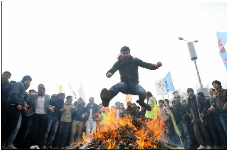
الحكومة التركية بدأت بمناقشة مطالب الأكراد أمس

وبدأ مقاتلو الحزب المتمركزون في جبال القنديل الواقعة بين تركيا وإيران والعراق وسوريا، بالانسحاب نحو إقليم كردستان العراقي في آيار الماضي، في إطار اتفاق يتضمن تعزيز الحقوق الكردية الثقافية والسياسية ضمن الدولة التركية.