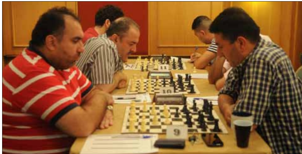
المتنافسون خلال إحدى الجولات