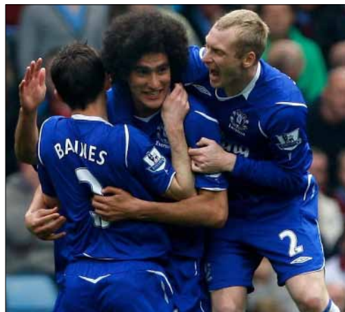
رفض افرتون عرض يونايتد لضم فيليني وباينز (أرشيف)

جماهير أرسنال تطالب بتجميد مفاوضات تمديد عقد مدرب الفريق أرسين فينغر، وافرتون يرفض عرضاً من مانشستر يونايتد لضم لاعبيه مروان فيليني ولايتون باينز