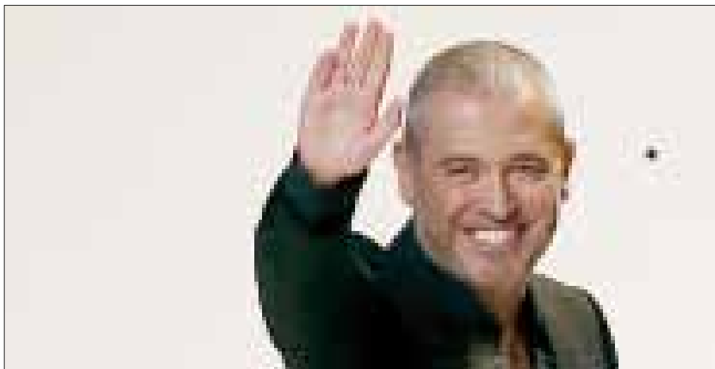
إيلي صعب (ارشيف)

في اختصاصات مماثلة، كثيراً ما يقع الطلاب ضحية للصورة الإعلامية المبهرة عن هذا العالم، وللاسف المشهور الذي تتشاركه معه الجامعات من أجل الترويج من خلاله لاختصاصها الجديد. لكن ستيل يشدد على أهمية أن لا يتمثل الطلاب بالمشاهير من المصممين، ويشير إلى أنه يجيب الطلاب الذين يعربون له عن رغبتهم في أن يصبحوا مثل فيفيان ويستوود وإيلي صعب بـ «أن يكونوا أنفسهم».