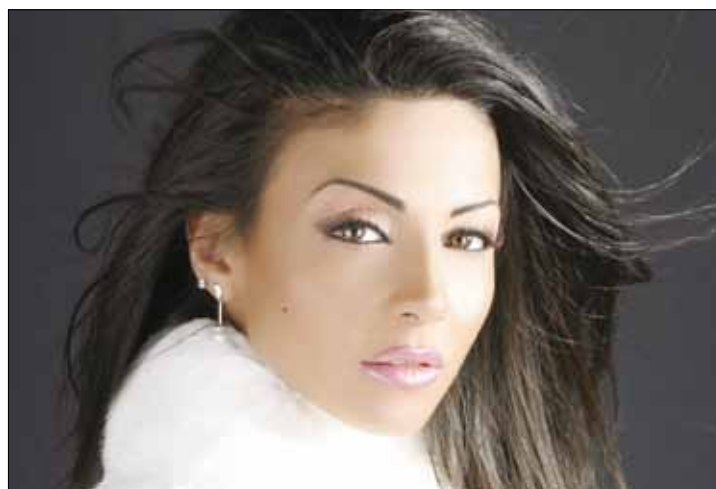
وافقت دوللي شاهين على أداء البطولة

بطلة المسلسل باسم «نوران شويري»، فيما رشح لبطولة العمل الذي يخرج به حازم فوده، كل من سميحة أيوب، وشادي شامل، وعزت أبو عوف الذي وقع عقد الانضمام إلى المسلسل أخيراً. وكانت فنانات كثرات قد رُشحن سابقاً لأداء بطولة العمل؛ منهن: نادين نجيم، عادة عبد الرزاق، عبير صبري، نادين الراسي وأخيراً المغنية اللبنانية قمر التي اعتذرت قبل انطلاق التصوير بسبب ظروف