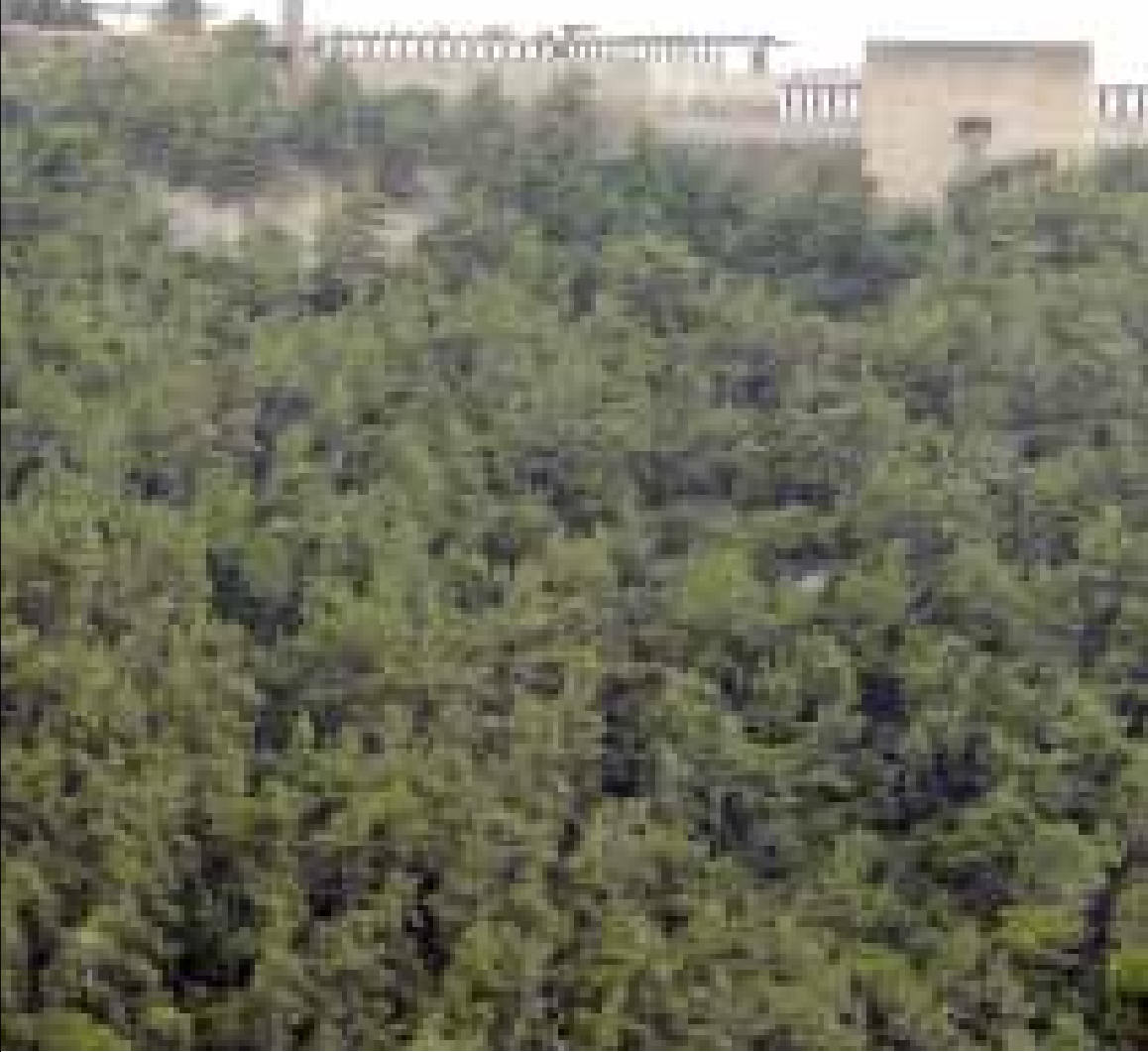
من أين سيأتي أصحاب المشروع بكميات كبيرة من المياه لري «الغازون»؟

ما زال مصير غابة الصنوبر في رومية معلقاً بانتظار صدور تقرير «تقييم الأثر البيئي». في هذا الوقت، يجري البحث في اقتراح استبدالها بأشجار يافعة في بقعة أخرى. هذه الغابة البالغة الأهمية تمثل عقبة أمام مشروع استثماري سيقام على عقارات تمتلكها شركة «إنترا» التي تمتلك الدولة حصّة كبيرة منها، وسيكون له تأثير سلبي بالغ على مخزون المياه الجوفية