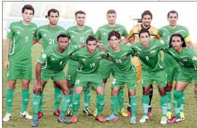
المنتخب العراقي قد يتأثر بالصراع بين الوزارة والاتحاد (عدنان الحاج علي)

وجاء في بيان الاتحاد العراقي «أن الاتحاد تسلّم في الثامن عشر من الشهر الجاري ومن محاميه تليغاً من المحكمة الرياضية العليا في لوزان، يتضمن نسخة من القرار التحكيمي على الاستحقاقات القضائية مع الوثائق المتعلقة بها والتي يفترض أن تحكمها السرية حسب القوانين النافذة». وأضاف البيان «في ضوء التبليغ، لا يجوز لأطراف نشر بيان أو معلومات، إلا أن محامي المدعين (المعترضين) أصدر بياناً لوسائل الإعلام يتعلق بمضمون القرار». وكان محامي المعترضين على