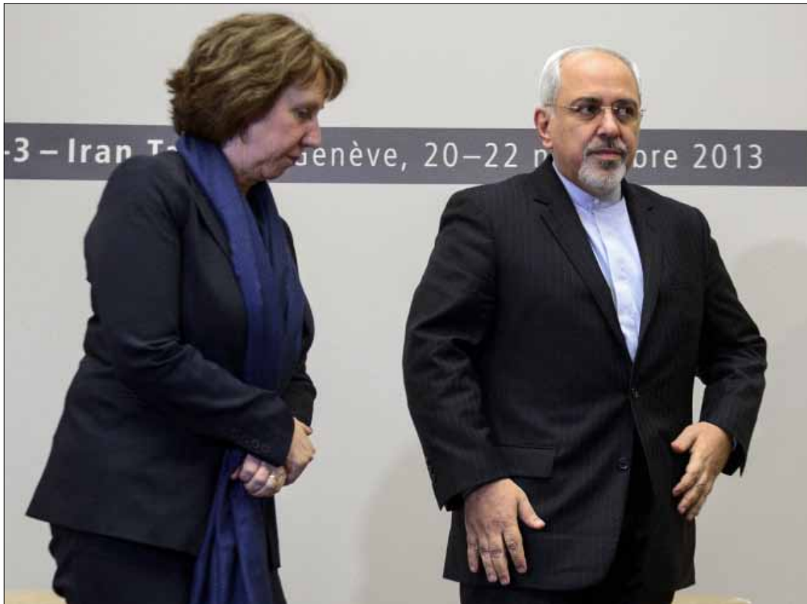
وصف ظريف محادثاته مع اشتون أمس بأنها جيدة