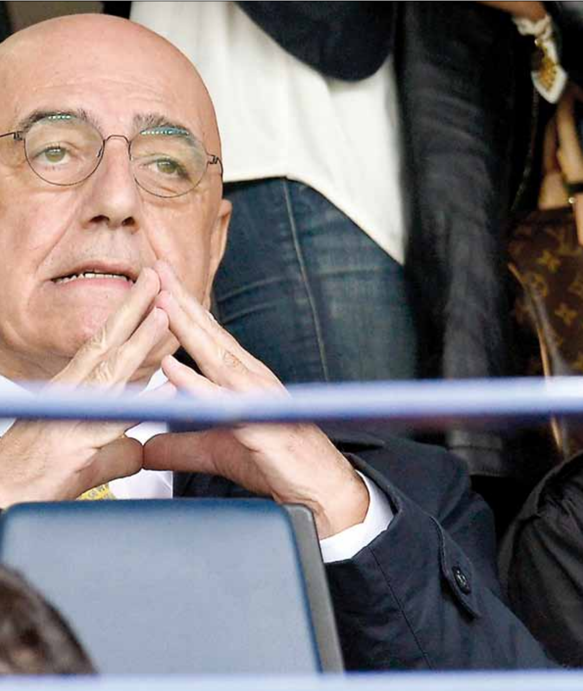
قض غاليلاني 25 سنة في نادي ميلان

الاول لباربرا برلوسكوني اعادة ميلان الافضل في العالم