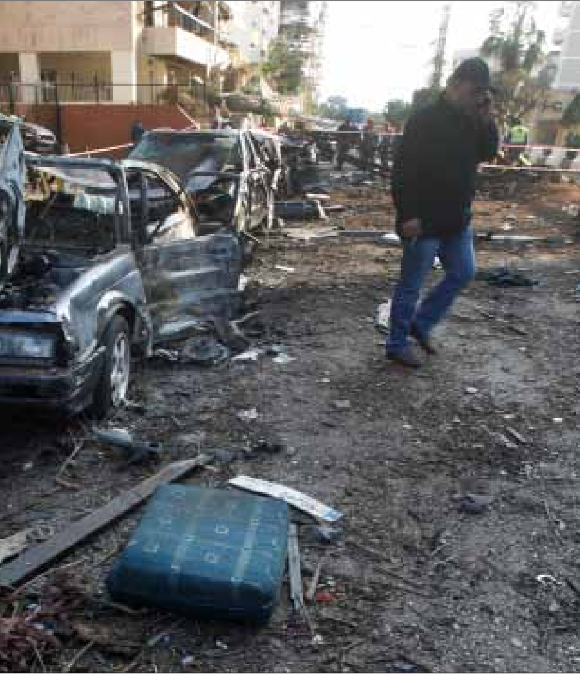
امكن من خلال التحقيقات الوصول إلى خيوط تدل على الجهة المشغلة للانتحاريين في لبنان (هينم الموسوي)

عليها في مسرح الجريمة، تتضمن بيانات حقيقية لشخص لبناني. وهذه الهوية مزورة، لكونها تحمل الرسم الشمسي لغير صاحبها الحقيقي. وقد أوقفت الأجهزة الأمنية صاحب الهوية الحقيقية، لكن من دون وجود أي شبهة بحق.