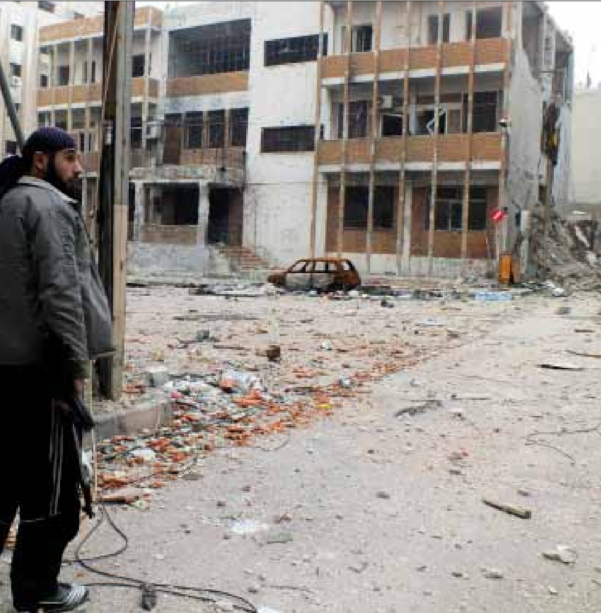
عنصر من المعارضة المسلحة في مدينة حمص (أرشيف)

تحيط بحي الوعر حمامات الدم التي شهدتها المنطقة الوسطى، بدءاً بالريف المشتعل حول دمشق، وصولاً إلى أحياء حمص المنكوبة التي تهدمت تبعاً بفعل الحرب المستمرة منذ أكثر من سنتين. الحي الماهول بالسكان المدنيين، ومن خلفهم المسلحون الملتزمون، ضاق ذرعاً بالحصار المفروض عليه. أكثر من ثلاثمئة ألف نسمة، يتوزعون بين الوعر القديم والجديد ويدفعون فاتورة «ثورة» لم يختاروا جميعهم الوقوف إلى جانبها. حُكم عليهم أن يكونوا دروعاً بشرية تؤخر دخول الجيش إلى المنطقة، خشية وقوع المجازر بحق الأبرياء. هنا تكمن قوة المسلحين، التي على أساسها يفاوضون الحكومة من أجل إنجاز تسوية سلمية يكونون فيها الرابحين الوحيدين. فيما تتبع الحكومة استراتيجية وحيدة في حل مسألة الوعر، هي التعامل مع جميع