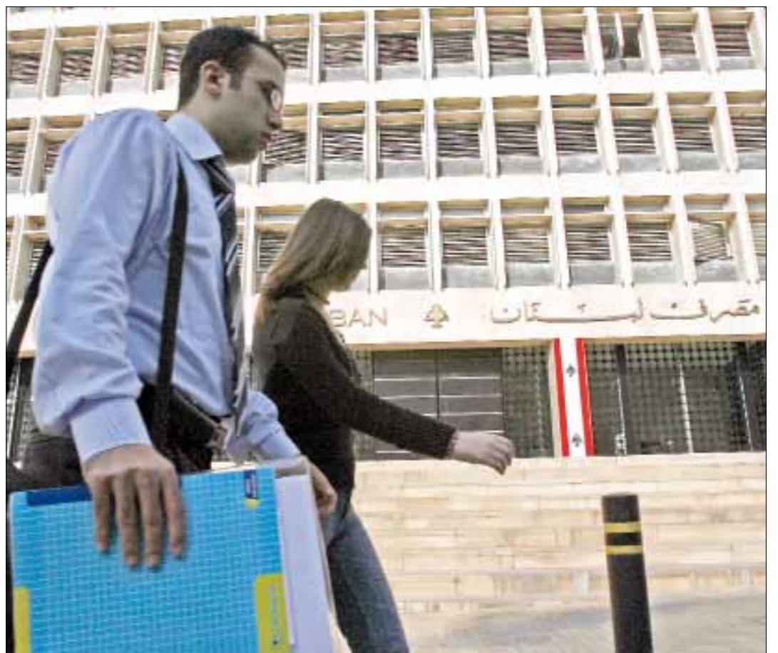
تقرير مصرف لبنان يقدم صورة غير واضحة عن حالة الاقتصاد (أرشيف - مروان طحطح)

- ارتفع المؤشر الاقتصادي العام لمصرف لبنان بنسبة 6,4% على أساس سنوي من 230,0 نقطة في آب 2012 إلى 244,8 في آب 2013، علماً أنه شهد تذبذبات لافتة في الأشهر الماضية إذ بلغ ذروته 273,9 نقطة في آذار. - سجل ميزان المدفوعات عجزاً بما يوازي 223 مليون دولار في آب 2013. وقد تمثل هذا العجز بانخفاض الموجودات الخارجية الصافية لدى مصرف لبنان بقيمة 298,8 مليون دولار وارتفاع الموجودات الخارجية