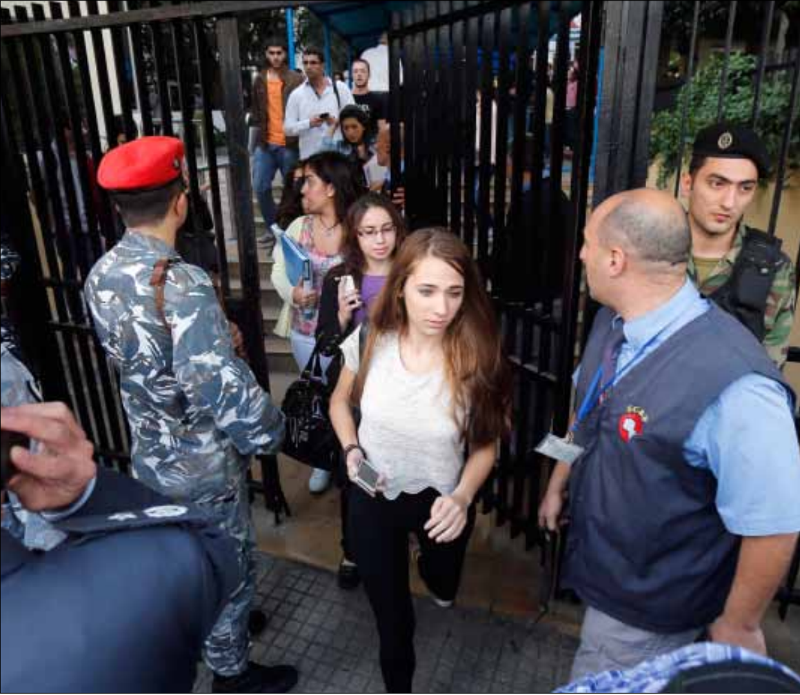
إخراج الطلاب والطالبات من حرم الجامعة إثر الإشكالات (هيثم الموسوي)

قررت إدارة الجامعة اليسوعية فتح تحقيق داخلي في الإشكالات التي حصلت في حرمها في الأشرفية أمس. جاء ذلك بعد يوم مشحون بالتوتر الطائفي، كاد أن يحول الجامعة إلى ما يشبه ساحة حرب بين مناصري حزب الله ومناصري القوات اللبنانية والكتائب. الاتصالات والاجتماعات التي توصلت حتى ساعة متأخرة من الليل أدت إلى تهدئة الأجواء بانتظار نتائج الإجراءات التي ستتخذها الجامعة