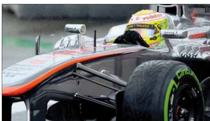
بيريز على متن سيارة ماكلارين خلال سباق البرازيل

مع فورس إينديا، وذلك بعدما قرر فريقه التخلي عنه وضمّ الدانماركي كيفن ماغنوسن، إذ اعترف ويتمارش بأنه اتصل بعدد من مديري الفرق لكي يبحث عن