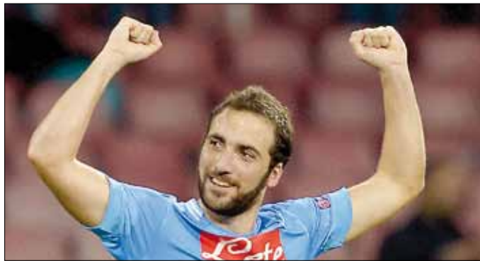
هل يثبت نابولي بأنه على قدر طموحات وآمال جماهيره؟

أذاً، لا اختلاف في أن الأجواء ستكون غير اعتيادية أمسبة اليوم في مدينة دورتموند. لا يمكن أن تكون غير ذلك وفريقها يقف أمام التحدي الأبرز في هذا الموسم، ذلك أن خسارته تعني الخروج من المسابقة التي اذهل بها العالم بأسره في نسختها الأخيرة وحل فيها في الختام وصيفاً لمواطنه بايرن ميونيخ، أما التعادل فلن يكون كافياً. لن يرضى بالتأكيد أبناء بورغن الأقصائية لنتيجة المباراة الأخيرة بين نابولي وأرسنال الإنجليزي، هم الذين تصدروا مجموعتهم في الموسم الماضي أمام ريال مدريد الإسباني ومانشستر سيتي الإنجليزي وياكس امستردام الهولندي. الحسابات واضحة: دورتموند بست نقاط ونابولي وأرسنال المتصدر بـ 9 نقاط، إذاً لا مناص من الفوز أمام الفريق الأصفر. الليلة يقف دورتموند أمام الامتحان الأهم، فبعد ابتعاد اللقب المحلي عنه على نحو كبير بعد الخسارة القاسية أمام الضيف والغريم بايرن ميونيخ 3-0، لم يعد من حلم أمام بطل أوروبا عام 1997 سوى البطولة القارية الكبرى. الأجواء التي ترشح من مدينة