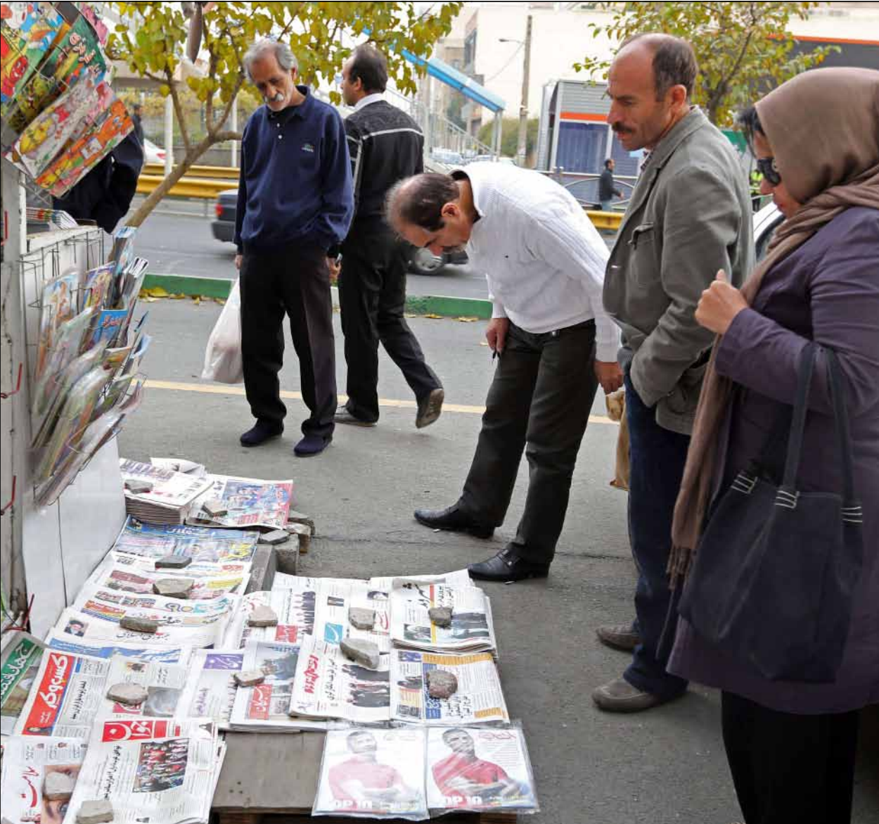
الصحف الإيرانية رحبت باتفاق جنيف باستثناء صحيفتين

في غضون ذلك، رحبت الصحف الإيرانية الصادرة أمس بالاتفاق النووي مع القوى الكبرى، مشددة على النجاح الشخصي لوزير الخارجية الإيراني، لكن عدداً