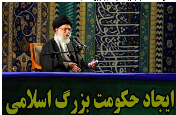
إيجاد حكومت بزرگ اسلامی

إلى ذلك، رأى الباحث في معهد الأبحاث الامن القومي، أفرايم كام، أن «بعض الإيجابيات التي تحققت في الاتفاق كانت بفعل الموقف المتشدد لباريس، وإن توقعه بعد مفاوضات قصيرة نسبياً، جرى لأن الطرفين، إيران والغرب، أراداه جداً». ولفت كام إلى أن «بعض الإيجابيات في الاتفاق تتمحور حول التراجع الذي وافقت عليه إيران، فيما يتميز الاتفاق بعيوب كبيرة لجهة إبقاء مخزون اليورانيوم المخصب بدرجة 3,5%، الأمر الذي يمكنها من الاحتفاظ بخيار الانطلاق نحو السلاح النووي لو اتخذت قراراً بذلك. كما أن الاتفاق لا يبين ما الذي سيحدث إذا لم يجر التوصل إلى اتفاق نهائي، وهل ستبقى الاتفاقات سارية المفعول. إضافة إلى الثغوب الملحوظة في الرقابة الدولية على المنشآت النووية، لكونه لا يتضمن رقابة منظمة لموقع بارتشين العسكري، كما لم توافق إيران على البروتوكول الإضافي الذي يحدد تشديد الرقابة على المواقع».