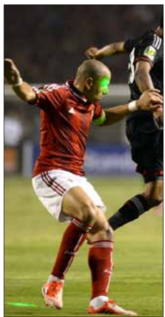
وائل جمعة

رفض قائد فريق الأهلي المصري لكرة القدم وائل جمعة الحديث عن اعتزال كرة القدم، مؤكداً أنه يتطلع للمشاركة مع فريقه في كأس العالم للأندية في المغرب. وتردد أن جمعة (38 عاماً) يعتزم الاعتزال بعد اخفاق منتخب مصر أمام غانا، وعدم تأهله إلى نهائيات كأس العالم في البرازيل.