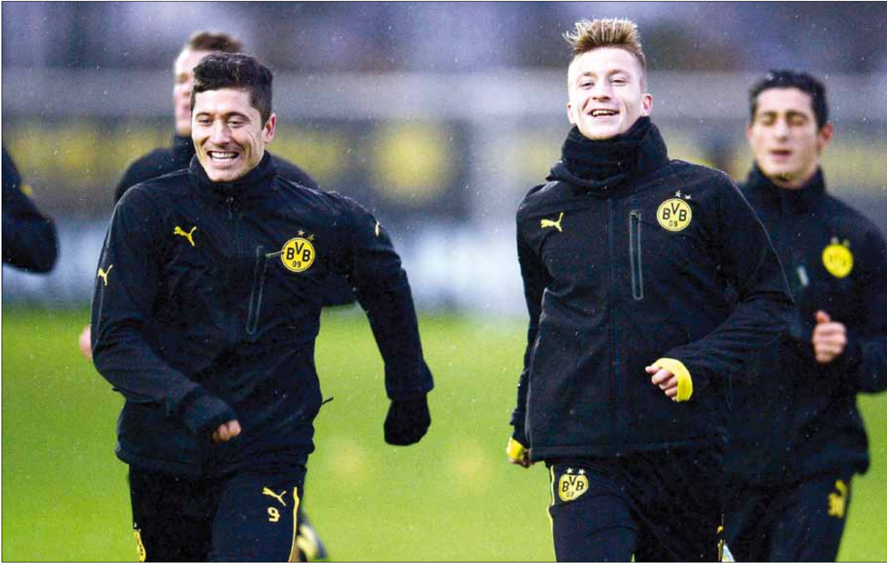
سيغند بورغن كلوب على حماسة لاعبيه

تستحوذ موقعة بوروسيا دورتموند وضيافته نابولي على أهمية كبيرة لطرفيها وتحديدًا للفريق الألماني المطالب بالفوز ولا شيء سواه إذا ما أراد بلوغ الأدوار الإقصائية لدوري أبطال أوروبا، وذلك مع الوصول إلى المرحلة قبل الأخيرة من دور المجموعات