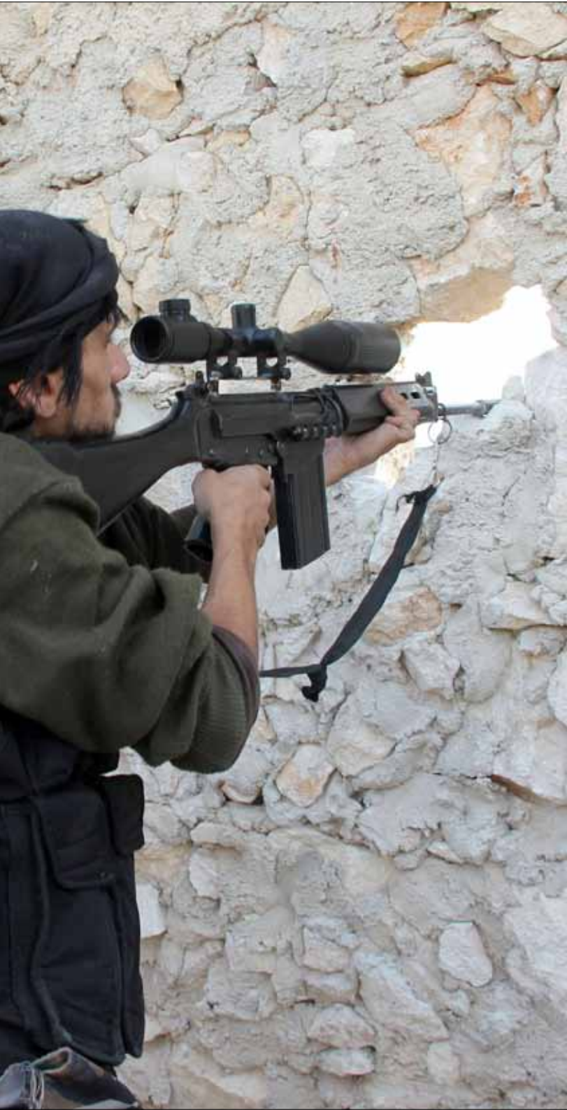
مسلحان في حلب أمس

لخطوات سياسية تسبقه. ويستفاد من منطق الإبراهيمي أنّ مسار الحل السياسي، أو جزء منه على الأقل، في إطار «جنيف 2»، سيتم تحت النار. ومقابل هذه الرؤية، ترى دمشق أنّ «جنيف 2» محكوم بأن يبدأ خطوته الأولى نحو النجاح من بند وقف تمويل وإمرار السلاح والمسلحين إلى سوريا. وفي حال توافر هذا الأمر، فإنّ لدى الجيش السوري القدرة على إنهاء بؤر الإرهاب خلال أقل من ستة أشهر.