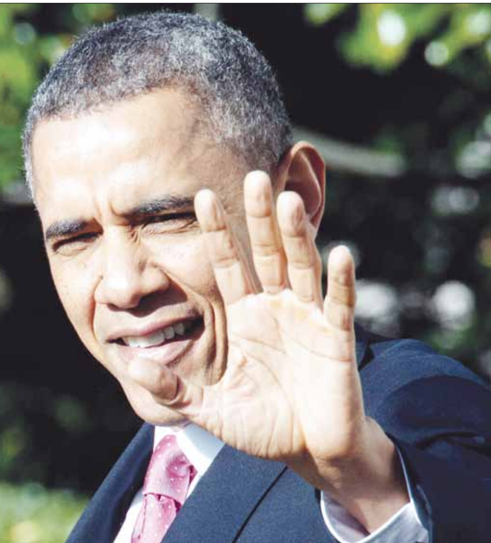
لا حاجة إذن إلى التعجب من السبب في أن السيد أوباما وكل من يعمل في البيت الأبيض يكون لنا الكراهية

يفترض بها أن تكون، وإنما لكل دولار، وهو ما يضمن ناتجاً غير ديموقراطي. ولزيد من الإيضاح، فإن التصويت في الانتخابات لا يضمن حرية الفرد في أن يختار ممثله وفقاً لمصالحه الخاصة. وإنما أصبح التصويت، بدلاً من ذلك، جزءاً من نظام قررت قواعده الطبقة البورجوازية القوية في إطار محاولاتها استيعاب الطبقة المناقضة، أي الطبقة العاملة. لم يحدث أبداً أن جرى توفير «الحق الإنساني» في الاختيار الحر للشعوب المستعمرة حتى