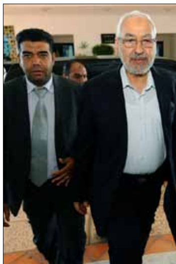
هل تشهد حركة النهضة انشقاقات في صفوفها؟

وكانت كتلة الحركة في المجلس الوطني التأسيسي قد رفضت قرار المكتب التنفيذي بالتراجع عن التنقيحات في النظام الداخلي للمجلس، التي عدتها المعارضة «انقلاباً داخل المجلس» أدى إلى تعميق أزمة الحوار الوطني. وعقدت على إثره كتلة حزب التكتل من أجل العمل والحريات (شريك النهضة في الحكم) عضويتها داخل المجلس.