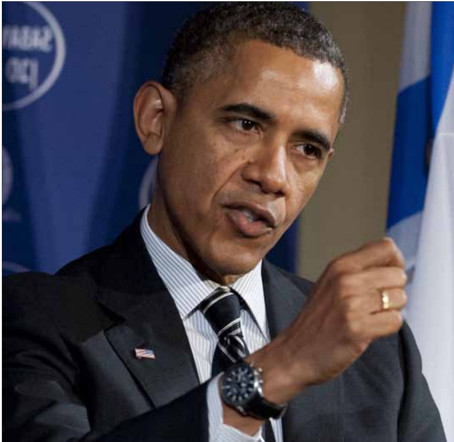
ان إسرائيل في حساب مالكة الأميركي تحتاج إلى تخفيض رتبة من وكيل حارس إلى امتداد محروس (أ ف ب)

روسيا وكوريا الجنوبية). والحال أن مكان العرب الأکید هو في الخيمة الأوراسية بامتياز... هناك الشرق غير الاستعماري، وترات التعاون القديم، واستهداف الغرب اللاتيني - الأنجلوساكسوني منذ منتصف السداس عشر، فضلاً عن تعاطف المصالح المشتركة في الطاقة والسلاح والتجارة والتفانة والأمن والثقافات.