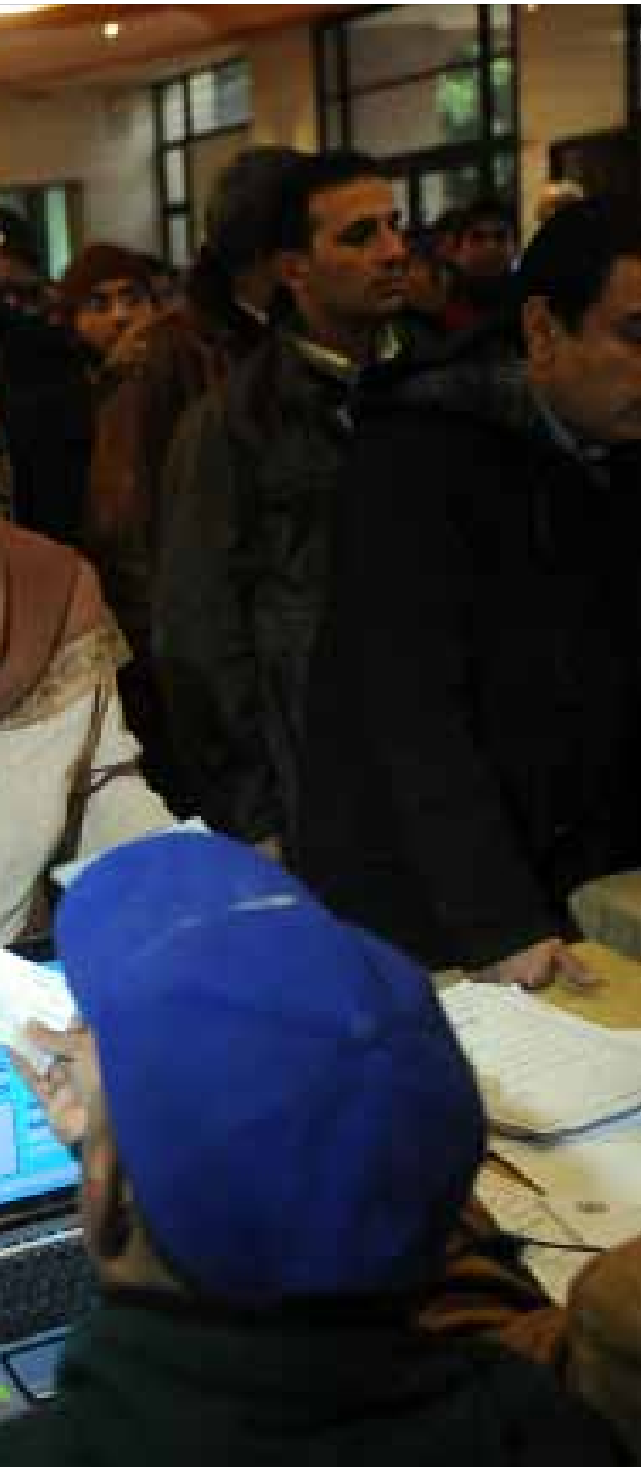
خلال التصويت في انتخابات نقابة الأطباء يوم الجمعة الماضي

لـ«الأخبار» «إننا الآن في حالة ثورية في الشوارع والجامعات، ولا فائدة على الإطلاق من خوض الجماعة للانتخابات، حتى وإن كانت نقابية ومهنية، في ظل نظام يمارس حرباً شرسة على الجماعة بالتنسيق مع