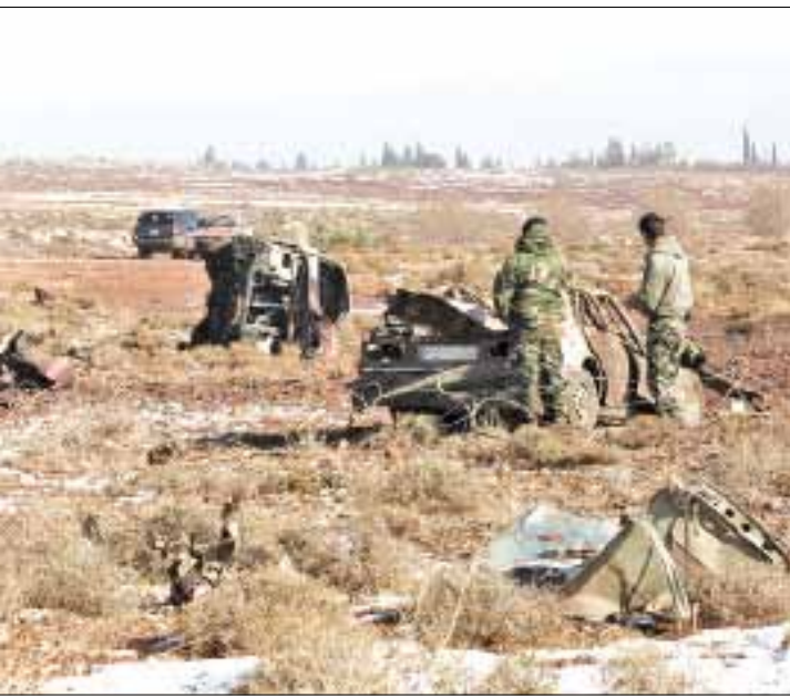
خلف الانفجار حفرة قطرها 5 أمتار بعمق 50 سننيمترا (الأخبار)

سمعت أصداؤه في القرى المحيطة، وتبعه إطلاق نار كثيف استمر أكثر من 20 دقيقة، بحسب ما أكد شهود لـ «الأخبار». وقال هؤلاء إن عناصر من حزب الله فرضوا طوقاً أمنياً على المكان، ليتبين مع شروق الشمس أن أربع سيارات دُمرت في موقع التفجير. وحدها سيارات الإسعاف التابعة للهيئة الصحية الإسلامية، حضرت إلى مكان الانفجار، وعملت على نقل ثلاثة جرحى من عناصر الحزب، حال أحدهم حرجة، بحسب مصادر حزبية. وفي وقت لاحق، غص المكان بالأجهزة الأمنية على اختلافها، وضرب الجيش طوقاً أمنياً على مسافة تقارب الثلاثمئة متر مربع، حول موقع الانفجار، الذي تناثرت فيه قطع سياراتين، واحترقت سيارة أخرى انقلبت على جانبها، فيما تضررت مقدمة السيارة الرابعة، وعثر داخلها على آثار دماء.