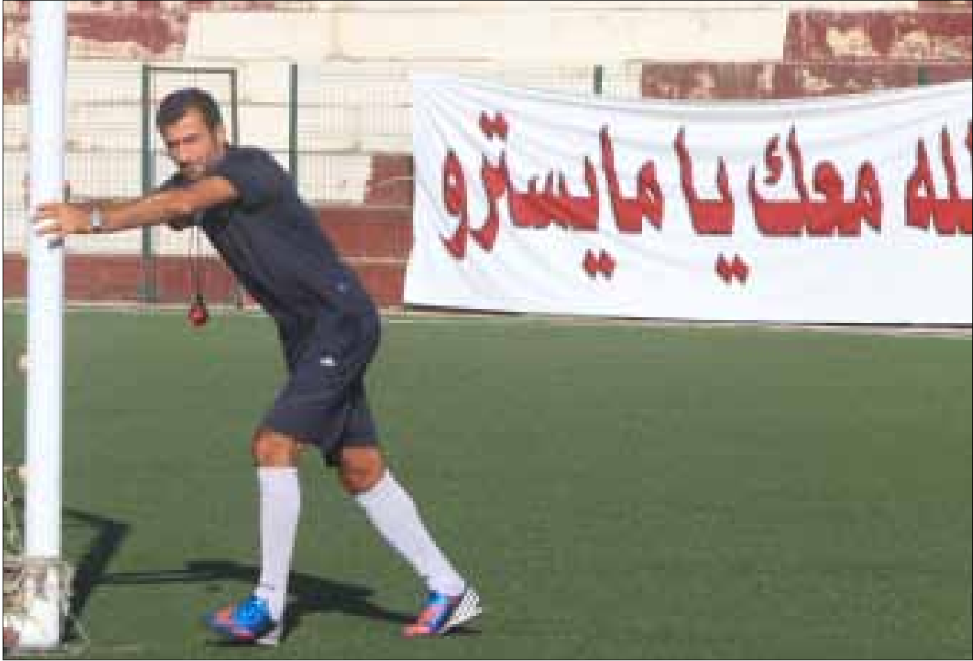
اتهم حجيح اشخاصاً من داخل النادي بالسعي الى افساله (ارشيف)

قرار حجيح ونقطة النجمة له يعكسان قناعة بضرورة وقوع الطلاق بين النجموي الاصيل وفريقه الام، ايداناً بفتح صفحة جديدة وشق طريق نحو مرحلة جديدة لا يريدونها القيمين على النجمة أن تخرج عن خط ثقافة النادي بكوادره البشرية، لذا لم يكن مستغرباً ان يحضر أرمين الى ملعب صيدا البلدي مرتدياً نفس الجاكيت التي ارتداها حجيح امام الاخلاء، ففي نهاية المطاف النجمة للنجمويين.