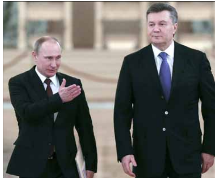
أمل يانوكوفيتش بتسوية قضية الغاز بين البلدين

شددت واشنطن على أن الاتفاق لا يستجيب لمطالب المتظاهرين