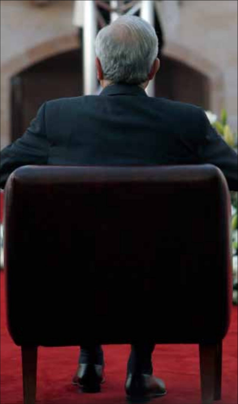
الفراغ الرئاسي معبر إجباري للوصول الى حل؟ (هيثم الموسوي)

روزنامة مواعيد إقليمية، منها، أولاً نتائج مؤتمر جنيف أو مونترال السويسرية حول أزمة سوريا ومصير الانتخابات الرئاسية فيها، وثانياً مصير الاتفاق الإيراني - الأميركي واحتمال تجديده لسنة أشهر جديدة، مع ما يمكن أن يتأتى منه من مفاعيل تنعكس على المنطقة، من العراق الى سوريا ولبنان. وتبعاً لذلك، لا يمكن تصور حدوث خرق محلي في لبنان على مستوى انتخاب رئيس جديد في فترة إقليمية دقيقة لها استحقاقاتها وتداعياتها الكثيرة، ما لم تنكشف الأوراق المستورة من اتفاق وزير الخارجية الأميركي جون كيري والروسي سيرغي لافروف، وما لم تتضح آفاق التسوية مع إيران واحتمال تجديدها أو توقفها.