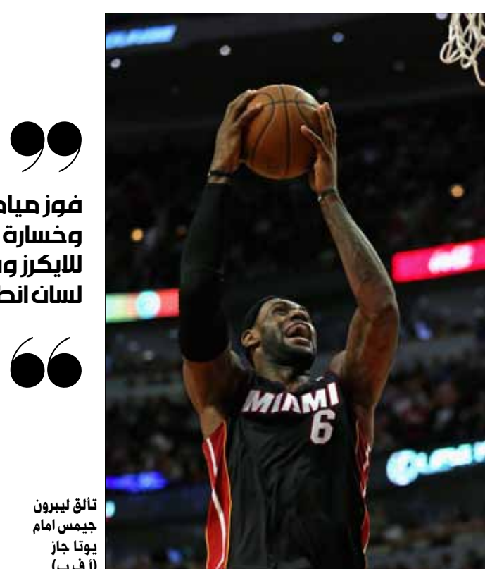
تالق ليبرون جيمس امام يوتا جاز (ا ف ب)

فشل انديانا بايسرز في الحفاظ على سجله خالياً من الهزائم على ملعبه هذا الموسم بعد 11 فوزاً بخسارته امام ديترويت بيستونز 96-101، ضمن دوري كرة السلة الأميركي الشمالي للمحترفين. وبهذه النتيجة بقي أوكلاهوما سيتي تاندر الوحيد من دون خسارة على ملعبه (12 فوزاً). وتعلق جوش سميث في صفوف ديترويت بتسجيله 30 نقطة، ولدى الخاسر، كان لانس ستيفنسون الأفضل بـ23 نقطة. ورغم اصابته في كاحله في الربع الثالث، قاد ليبرون جيمس ميامي هيت الى فوز كبير على ضيفه يوتا جاز 94-117. وضرب «الملك» بقوة بتسجيله 30 نقطة الى 9 متابعات و9 تمريرات حاسمة، بينما كان البديل اليك بوركس الأفضل لدى الخاسر بـ31 نقطة و7 تمريرات حاسمة. ومنى لوس انجلس لايكرز بخسارة جديدة وجاءت امام مضيفه اتلانطا