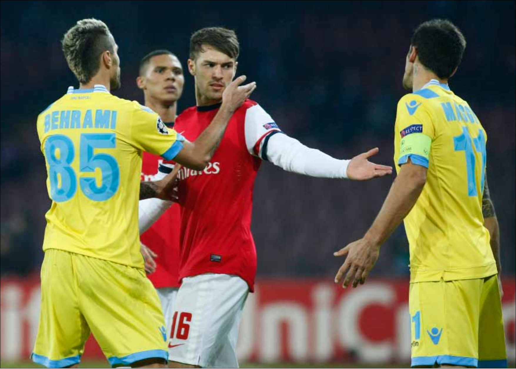
سرق أرون رامسي من كل نجوم أرسنال