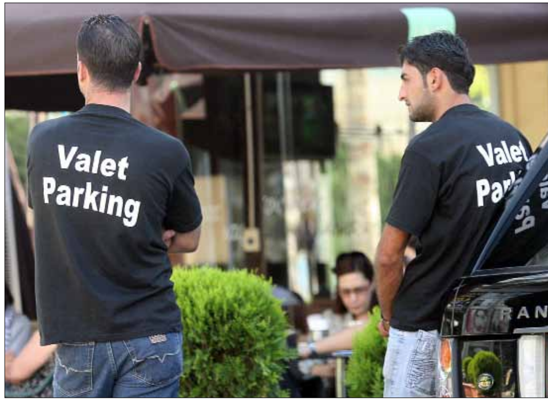
اضطرت إحدى شركات «الفاليه باركينغ» إلى مغادرة عملها في مونا

“ يطلب الموقف إبقاء المفتاح من دون ان يكون مسؤولاً عن السرقة