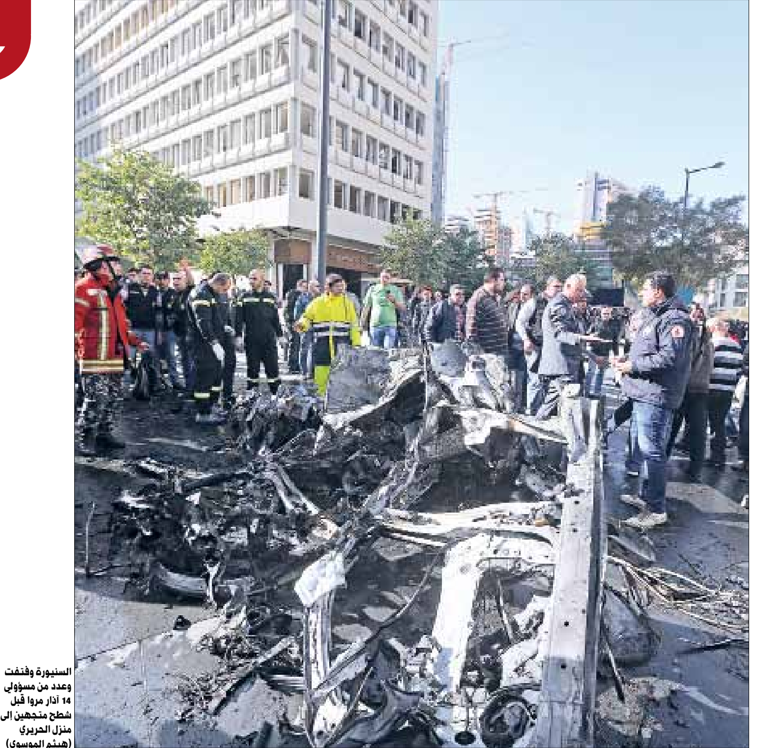
السيورة وفتنت وعدد من مسؤولي 14 آذار مروا قبل شطح متجهين إلى منزل الحريري (هينم الموسوي)

أمنياً، الجريمة قاسية. من نغذها أراد، بحسب أمّتين، القول إنه يستطيع الوصول إلى أي كان. فقبل موكب شطح، من الرئيس فؤاد السنيورة والوزير السابق أحمد فنتق وغيرهما من شخصيات فريق تيار المستقبل باتجاه منزل الرئيس سعد الحريري في وادي أبو جميل. التحقيقات بدأت أمس، لكن كالعادة، من دون تنسيق يُذكر بين الأجهزة الأمنية. يجري العمل على عدة خطوط: