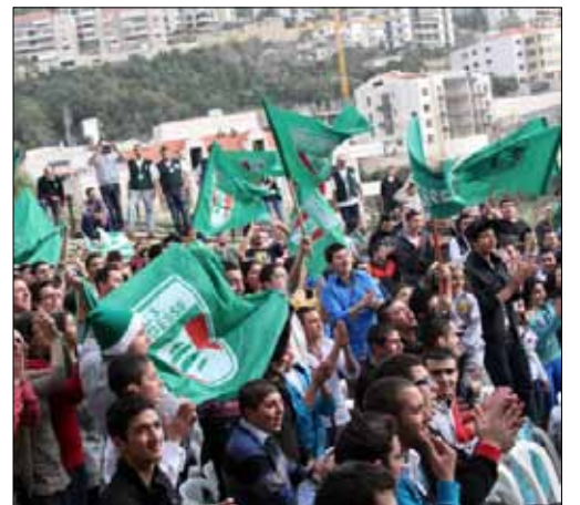
يعيش الجمهور الحكماوي حالة قلق على وضع ناديهم

يعيش نادي الحكمة حالة من التناقض بين خطوات ادارية لتدعيم الفريق قبل الموسم الجديد، وعرقلات من قبل جهات معينة لا يبدو أنها ستلتزم اتفاق المطرانية، ما قد يعطي ذريعة للطرف الآخر