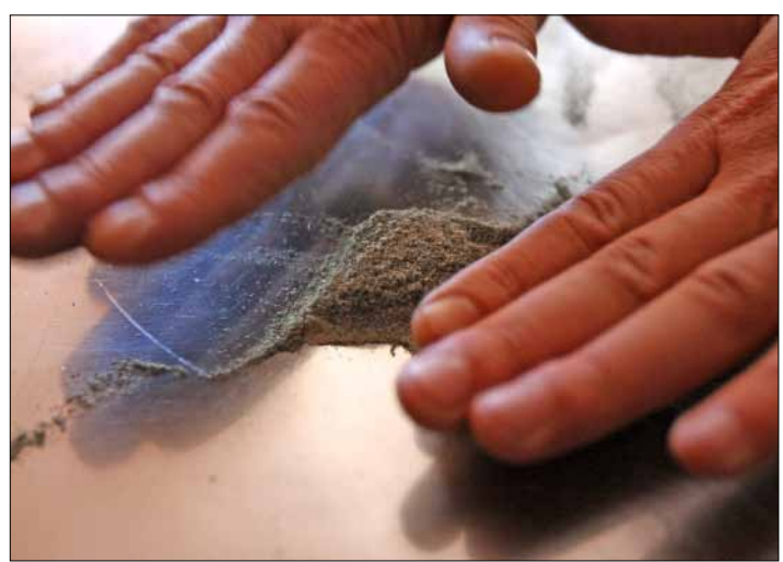
بذور القنبر هي نوع من انواع «القنبر» ولكنها متاحة في متاجر كثيرة

بعد وقت طويل فهم الشابان انهما متهمان بتعاطي الحشيش. انكرا التهمة جملة وتفصيلاً، إلا ان اللافت ان