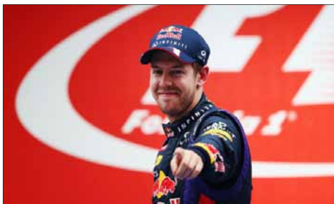
فيتيل «رياضي العام» بحسب وكالات الأنباء الأوروبية (أرشيف)

«هيمنته حصلت بفعل موهبته، بلا أي شك. سيباستيان سائق ممتاز ويستحق كل ما حققه»، وأضاف: «كثير من الأشخاص يعتبرون