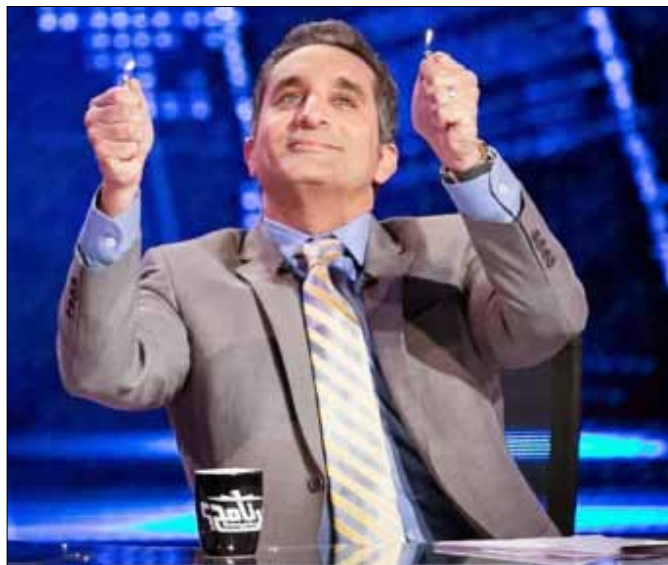
ما يُقال صراحة أنّ برنامج باسم يوسف توقف في «عهد السيسي»

غير أن ذلك التقدم الذي يعدّ - بلغة الرياضة - تقدماً بالنقاط لا بالضربات القضائية، إذ يحقق تحسناً نسبياً ولا يلغي جذور المشكلات «مبدأ الحبس في قضايا النشر»، هو مثال لا على الدستور فحسب، بل على الوضع السياسي برمته الذي يستعيد فيه الشارع هدوءه بالتدريج، وتتقدم فيه العملية السياسية ببطء، مع بقاء النار تحت الرماد، والآلاف المعتقلين في السجون، والعمليات الإرهابية هنا وهناك، وحفنة قوانين التظاهر ومكافحة الإرهاب المعدة للتطبيق. إنه وضع «من يصرخ أو يستسلم أولاً»، وهو وضع قد يجرى فيه استفتاء ويقر دستور وتصدر صحف وقنوات، لكنه - تحت سيف الأوضاع الأمنية الحادة والمتوهمة - أقرب إلى جو الحروب، جو «معي أم ضدي؟» وهو مناخ لا يصلح للصحافة ولا تصلح الصحافة فيه.