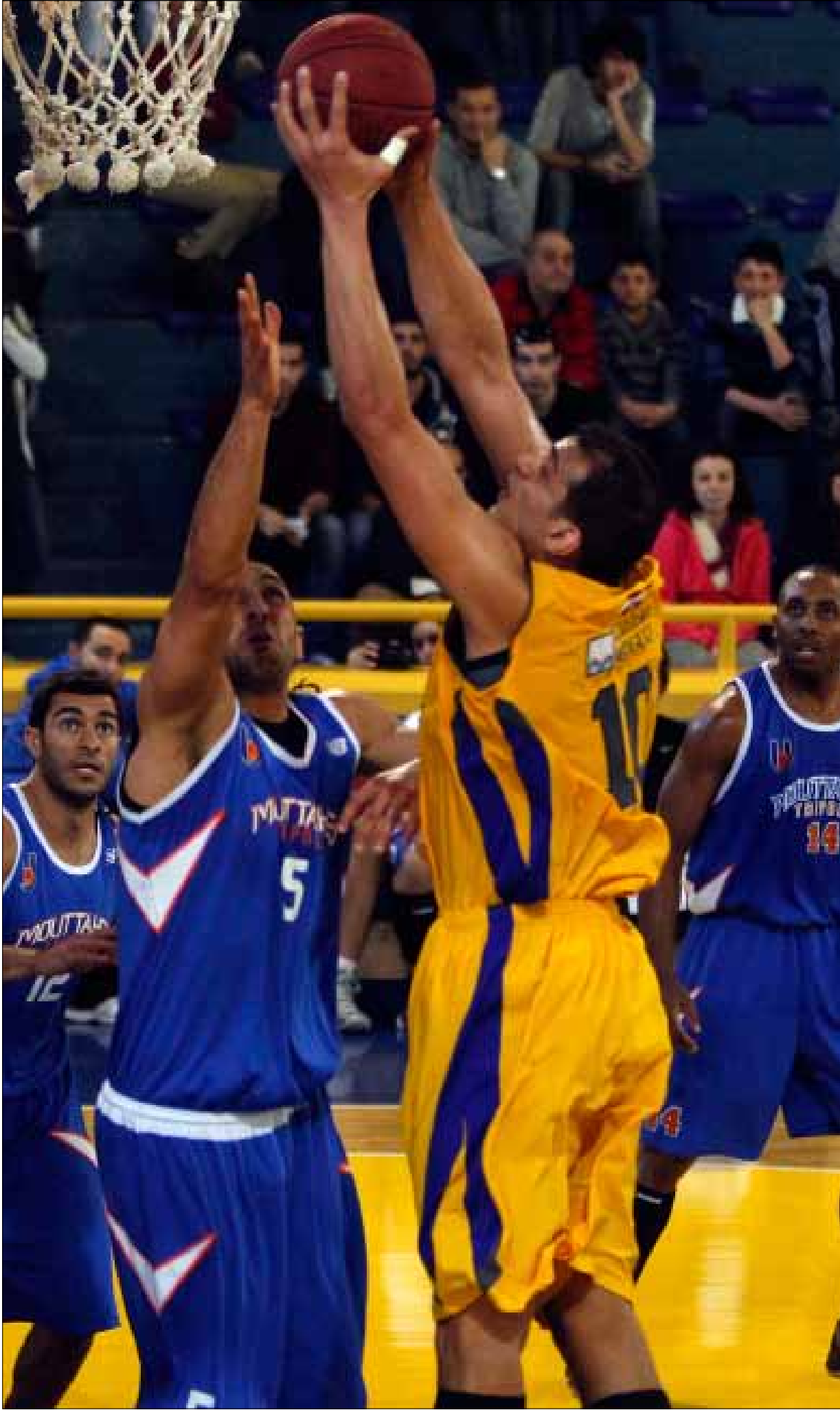
تسعى فرق الرياضي والمتحد والحكمة للمشاركة في دورة دبي (أرشيف)

وقررت اللجنة الإدارية أيضاً ترفيع نادي هومنتن والتضامن إلى مصاف أندية الدرجة الأولى، بحيث أصبح عدد الأندية في هذه الدرجة 12 عملاً بالصلاحيات الاستثنائية الممنوحة للجنة الإدارية الجديدة، والتي أقرتها الجمعية العمومية لتعديل النظام. ومن القرارات المهمة تعيين مساء الاثنين من كل اسبوع موعداً لاجتماع اللجنة الإدارية. فهذا الأمر يحصل للمرة الأولى حيث كانت جلسات الاتحاد تغيب أسابيع وتغيب معها النشرات الإعلامية حول القرارات، وهو أمر يبدو غريباً على لعبة بحجم لعبة كرة السلة في لبنان.