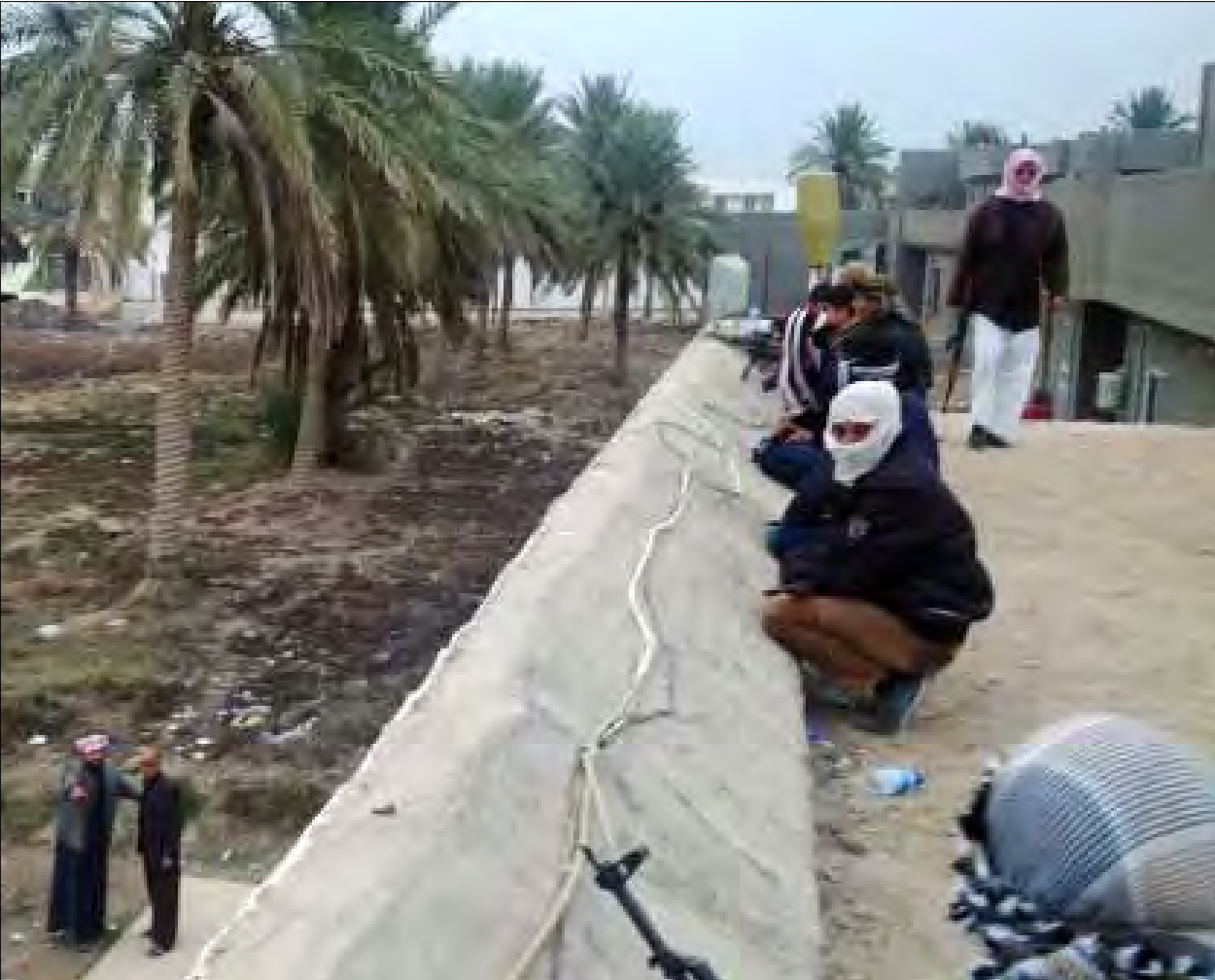
قتل 15 من مسلحي العشائر خلال الإشتباكات مع قوات الأمن