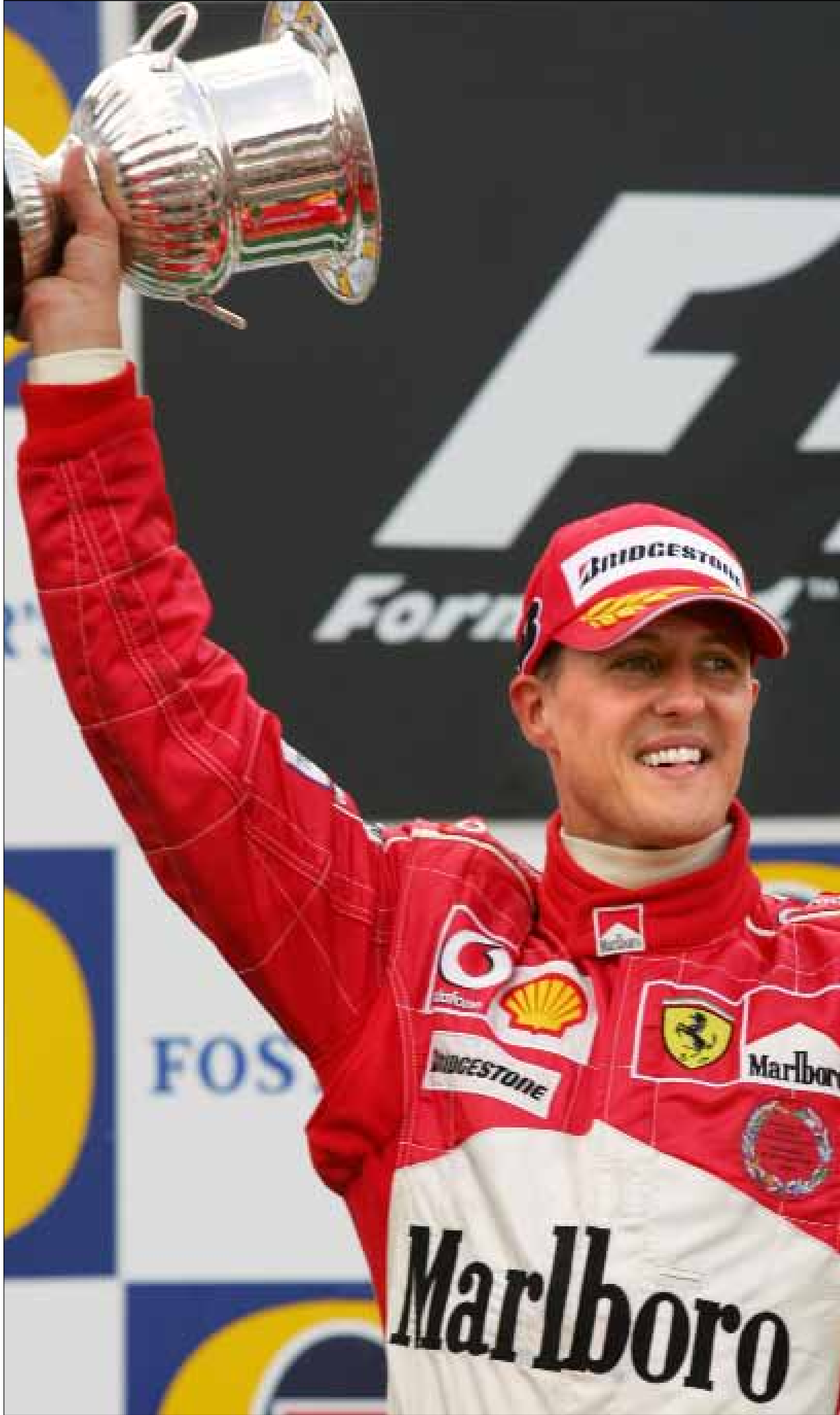
ميكائيل شوماخر

ما يعيننا حتى الثواني الأخيرة من 2013 أن يستيق شوماخر من غيبوته. أن يُقفل عام ونستقبل عاماً... والابتسامته ترتسم على وجه «شومي».