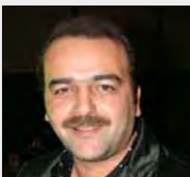
حصاد الثقافة 2013 على موقعنا

شكّل 2013 تكلمة للعامين السابقين. الرحيل كان العنوان الأبرز للفنانين السوريين الذين فرقتهم أزمة بلادهم. على خط مواز، لا يزال الإعلامي المصري باسم يوسف حديث الصحافة العربية والأجنبية التي واكبت صراعه مع الرئيس المعزول محمد مرسي، وصولاً إلى توقيف برنامج «البرنامج» على قناة «سي. بي. سي.»، لبنانياً، كان غياب وديع الصافي الأبرز على الصعيد الفني، بينما شهدت الدراما تقدماً من خلال «وأشرق الشمس» الذي أعاد الثقة إلى المسلسلات اللبنانية