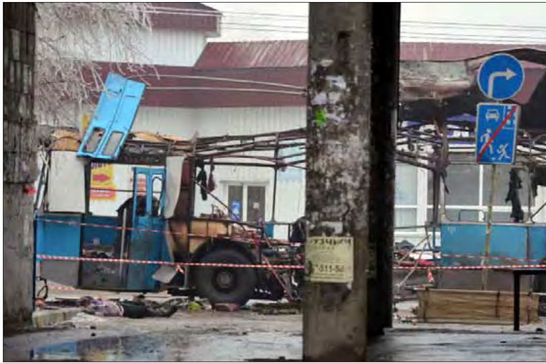
14 شخصا وقعوا ضحية الاعتداء الإرهابي يوم أمس (أ ف ب)

ورأت وزارة الخارجية الروسية، في بيان، أن التفجيرين الإرهابيين في مدينة فولغوغراد يمثلان محاولة لتأجيج العداء الطائفي في المجتمع الروسي. وجاء في الوثيقة التي نشرت على موقع الخارجية أمس: «إن هذه المحاولة الوقحة التي دبرت قبيل الاحتفال بعيد رأس السنة هي محاولة أخرى لفتح «الجهة الداخلية» وزرع الهلع والفوضى وتأجيج العداء الطائفي والمواجهة داخل المجتمع الروسي». وأضاف البيان: «لن نتراجع وسنواصل بحزم وشدة كفاحنا ضد العدو الشرس الذي لا يعرف أية حدود ولا يمكن وقفه إلا بجهود مشتركة». وأشارت الوزارة إلى أنه «على خلفية الدعوات المتواصلة لقادة الجماعات الإجرامية، مثل دوكو عمروف، إلى توحيد القوى تحت راية «الجهاد» وزج المزيد من المسلحين في الحرب الإرهابية، تصبح واضحة خطورة مواقف بعض الساسة وواضعي التكنولوجيا السياسية الذين لا يزالون يحاولون تقسيم الإرهابيين إلى «صالحين» و«غير صالحين»، حسب المهمات الجيوسياسية التي ينفذونها». وحذرت من أن «مثل هذه