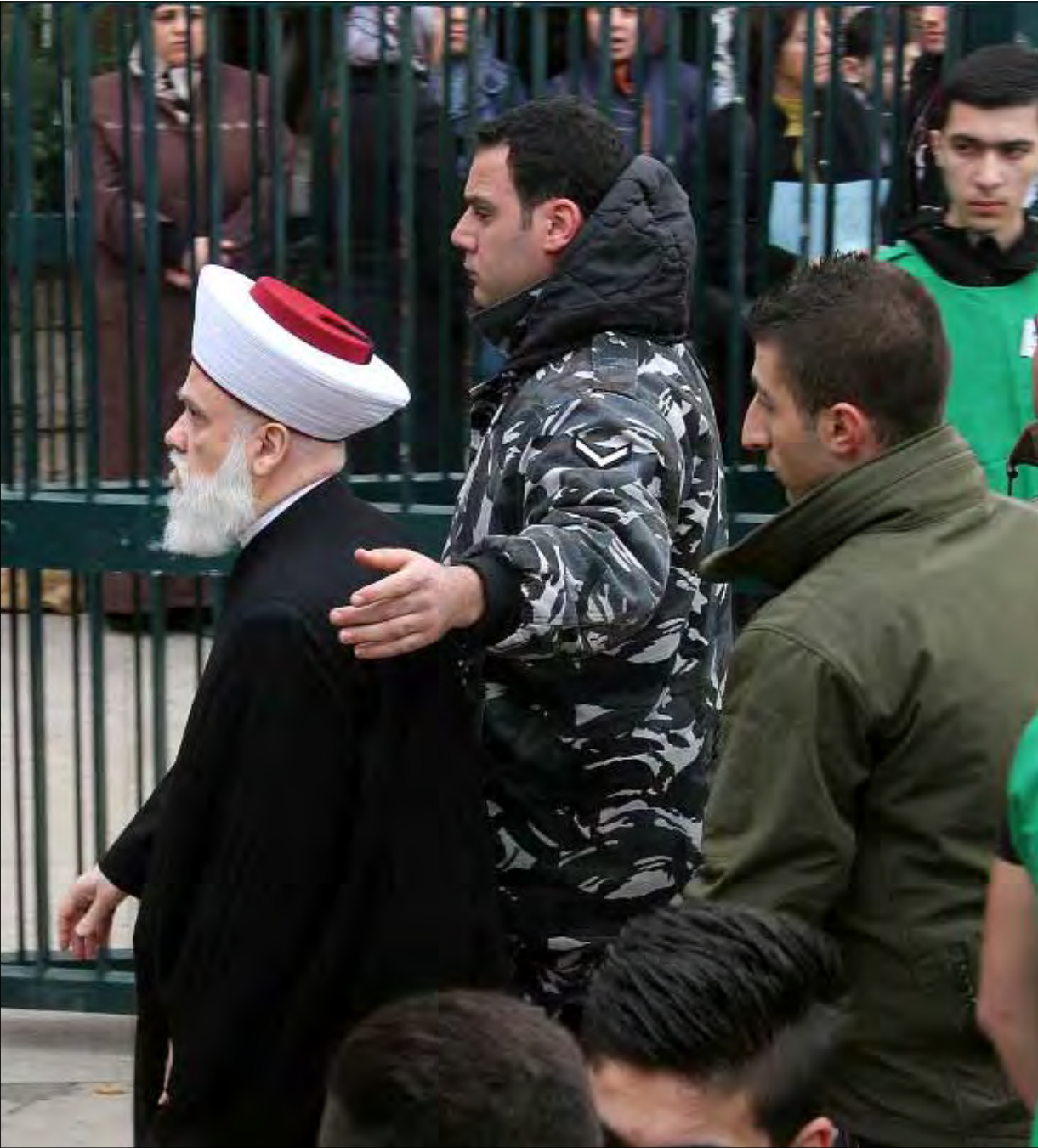
حزب الله: العدوان على المفتي محاولة استثمار سياسي على حساب الشهداء

يبدو أن رئيس الجمهورية لا يزال مصراً على تأليف الحكومة مطلع العام المقبل، وربما في الأسبوع الأول منه، من دون التوافق مع قوى 8 آذار والتيار الوطني الحر، فيما بقي ردّ فعل الفريقين الأخيرين على خطوة كتلك غامضاً، لكنه سيكون مفاجأة