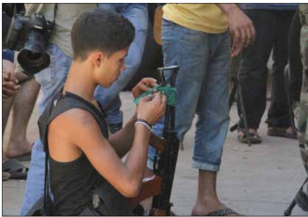
يمكن القول إن ما يحصل هو «على عين الدولة» (أرشيف)