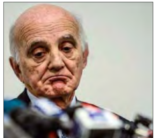
البروفيسور جيرارد سايان في المؤتمر الصحافي

الأطباء لا يخفون بأن وضع ميكائيل شوماخر «حرج للغاية» ويؤكدون بأن الخوذة أبقته على قيد الحياة، في وقت التف فيه عالم الفورمولا 1 حول «شومي» معبراً عن مشاعره التضامنية وصلواته لشفاء «الأسطورة»