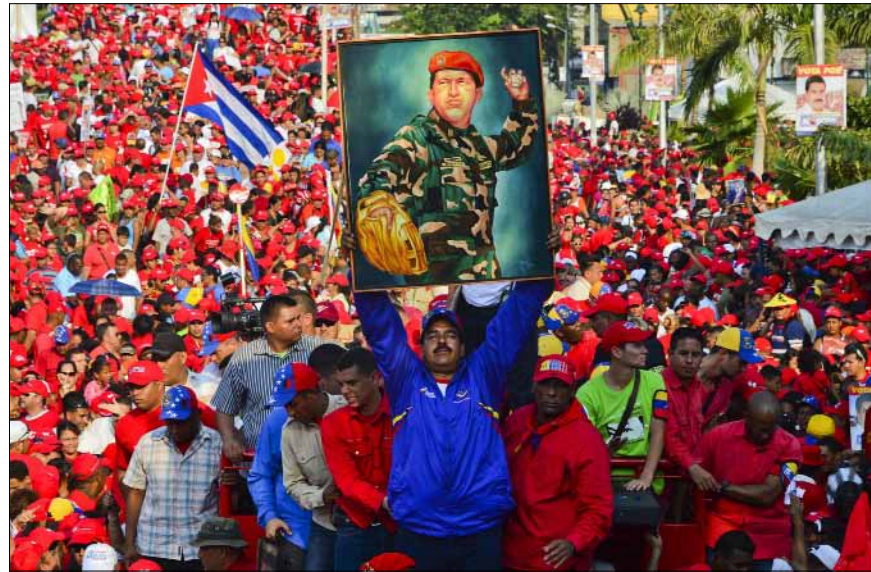
الرئيس الفنزويلي مادورو رافعا صورة الرئيس الراحل هوغو تشافيز

تعني أمراً مختلفاً لدى أهل الباريزون وشعرائهم ومغنيهم ومفكرهم.