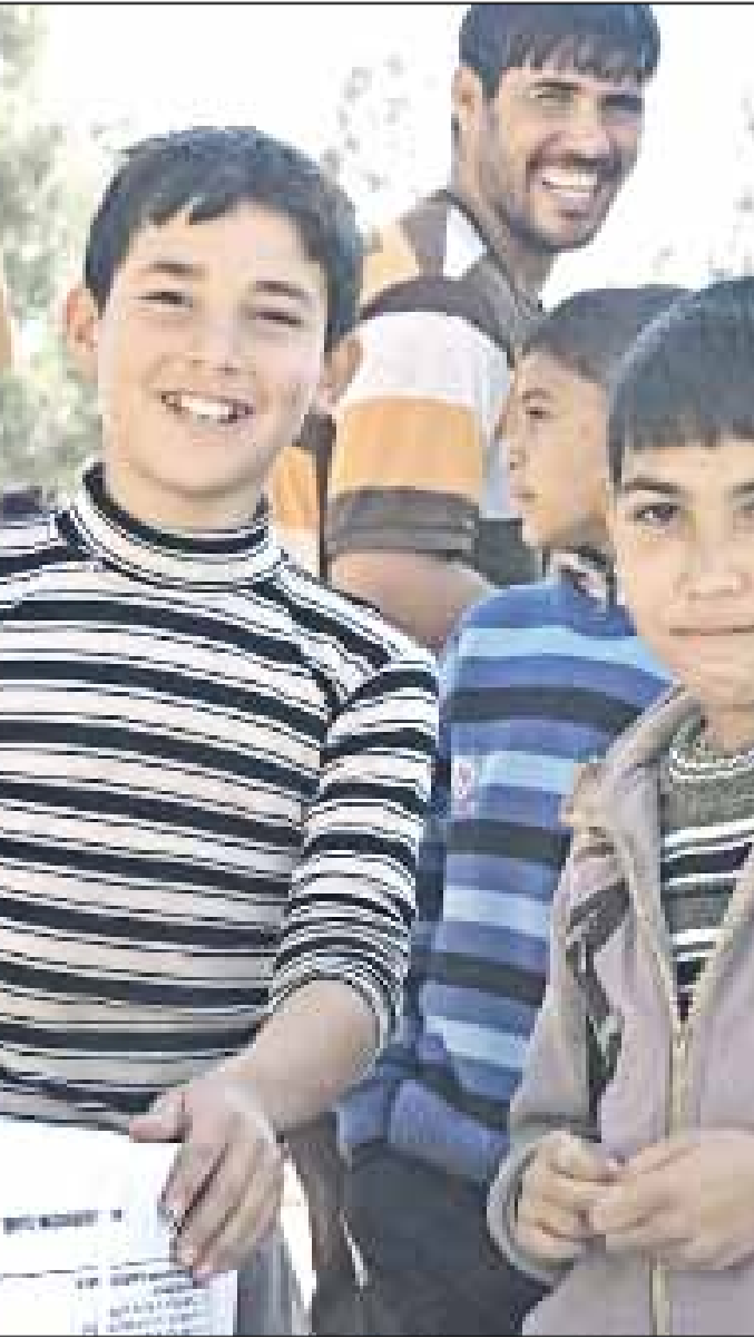
يشكو النازحون من استغلال وهدر وعشوائية في توزيع المساعدات

«شبعاً ترحّب بكم». هذا في المبدأ، أما في الواقع فأهالي بيت جن السورية هم الذين يرحبون بكم. لا مبالغة في هذا الكلام. فمن يعرف شبعا يعلم جيداً أن هذه البلدة القابعة على سفح جبل الشيخ تصبح شبه مهجورة في الشتاء. إلا أن الواقع اختلف منذ سنة بنحو جذري. شبعا اليوم مكتظة بالسكان، بعدما لامس عدد النازحين السوريين إليها عتبة 6 آلاف نازح