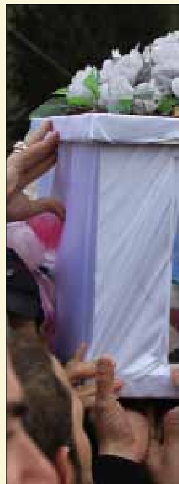
جراح أصيب بها في تفجير الهرمل الأسبوع الفائت.