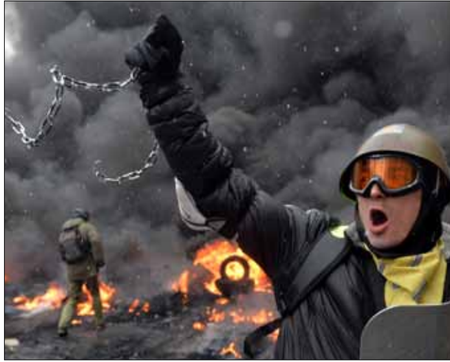
من مواجهات كييف أمس

وأعلن فيتالي كلتشكو، الملاك الذي تحول إلى سياسي ويات من زعماء المعارضة، أن عناصر الشرطة «اليوم يستعدون لإجلائنا من الميدان. يتعين علينا أن نفعل كل ما نستطيع لمنعهم من إبعادنا». وحث المتظاهرين على البقاء والدفاع عن الميدان، مضيفاً وسط صحبات التأييد من المحتجين في ساحة الاستقلال وسط العاصمة كييف، أنه «إذا لم يستجب الرئيس غداً (اليوم)، فسنكون في موقف الهجوم»، مشيراً إلى أن يانوكوفيتش قادر على إنهاء الأزمة من دون أعمال عنف من خلال الدعوة إلى انتخابات مبكرة. بدوره، امهل ارسيني ياتسينيوك المقرب من رئيسة الوزراء السابقة المسجونة بوليا تيموشينكو، السلطة «24 ساعة» لتجنب حصول «حمام دم». وكانت المعارضة قد أعلنت في وقت سابق أمس أن الرئيس وافق على لقاء ثلاثة من زعمائها لبحث الأزمة. يأتي ذلك بعد تحذيرات حكومية من فض المتظاهرات بالقوة عقب نفاذ قانون التظاهر، فيما أعرب الاتحاد الأوروبي عن «صدمته» لأعمال العنف الأخيرة، محذراً كييف من «العواقب»، وذلك في خطوة تزامنت مع إعلان الولايات المتحدة أول العقوبات من خلال سحب تأشيرات مسؤولين أوكرانيين. وبعد