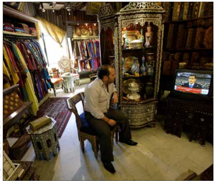
تنبهت دمشق منذ اللحظات الأولى إلى موضوع الذرائع باعتباره العصب الحساس في تطوير مسلسل الغزو

ما انفكت معضلة النظام الإعلامية تكمن في أنه يحقق انتصاراته عسكرياً، من طريق إثبات عجز وفشل مشروع المعارضة الحربي. وهنا نرى أن الحقيقة الوجودية هي التي تقرر مفهوم الانتصار، لا التحول البنوي في نمط التفكير والسلوك. إن المنظومة الحكومية والحزبية تنتصر بمقدار فشل الطرف الآخر، لا بمقدار تقدمها الفكري وتطور نشاطها الاجتماعي النوعي على أرض الواقع. هنا تكمن نقاط ضعف الإعلام الرسمي، فهو يركز على إنجازات المؤسسة العسكرية، التي تعتمد هي بدورها، بدرجة أساسية، مبدأ البقاء باعتباره الشرط الحاسم لإثبات فشل الآخر، وتالياً لتجسيد الصورة «العيانية» الواقعية للانتصار: الصورة الميدانية الحربية، لكن، ربما يعكس هذا الأمر