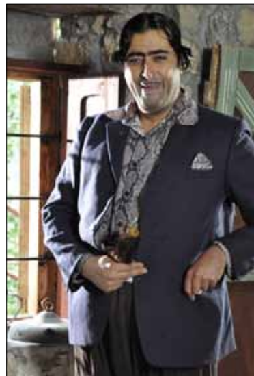
«جودة» وصلت موايله إلى جنيف

القوافل القديمة التي انتشرت صورها الساخرة على مواقع التواصل الاجتماعي، معلنّة عن ذهابها إلى «مؤتمر جنيف 2» وصلت إلى سويسرا. وانضمت إليها أيضاً درّاجة «جودة» (باسم ياخور) من مسلسل «ضيعة ضايعة» الذي ذهب لتمثيل جماعة «ماحا لحا وماحا بعب حا». الطريق إلى موننترو السويسرية، فتحت