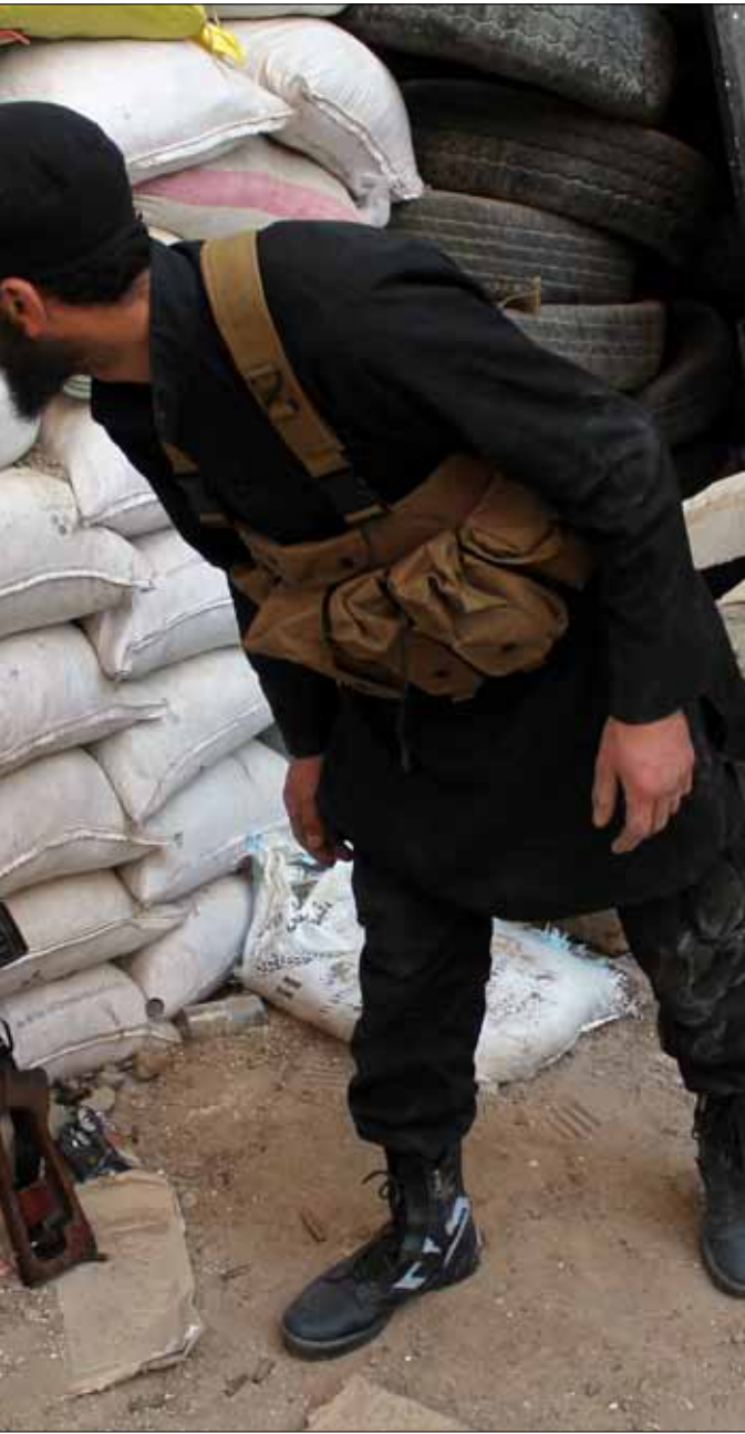
من الخطوط الأممية للمعارك في دير الزور أمس

مواقع استراتيجية (شمالي شرقي حلب) وهي النقارين والطعانة والزرزور والمجبل.