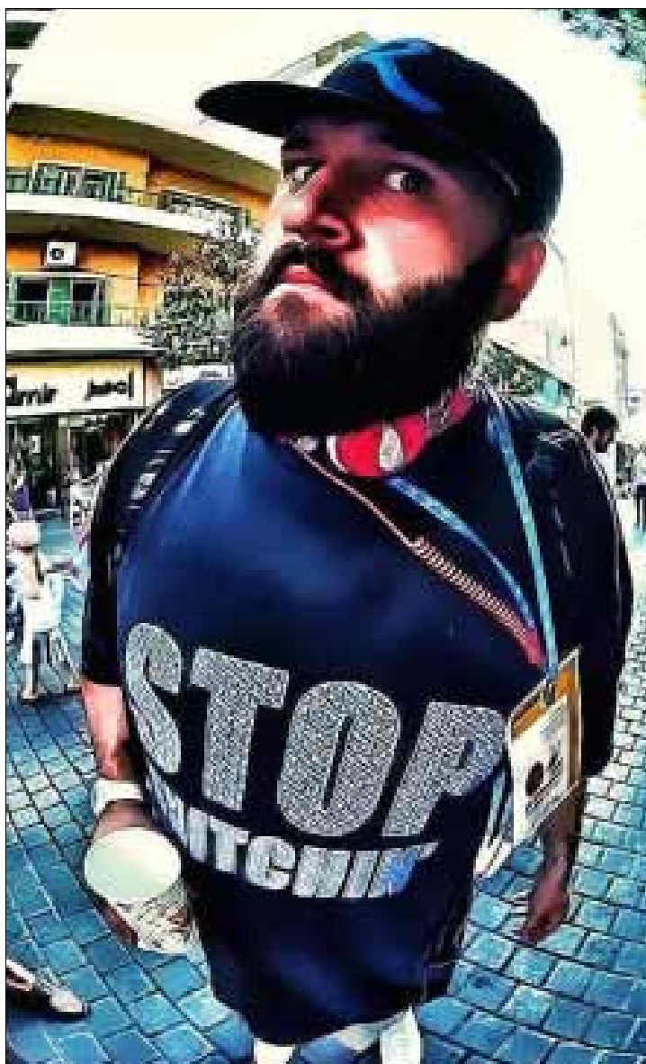
هو ابن مدينة صيدا وعضو في فرقة The Banana Cognacs

«حدا يعمل هالعمله؟». سؤال رذده كثيرون على social media بعد الكشف عن هوية «الإرهابي» الحقيقية. أيعقل لشاب (معروف بأسلوبه الفريد في الأزياء) حليق بلحية طويلة وثياب غريبة (جلابية) «تشبه أزياء التفجيريين» في هذه الظروف الأمنية الدقيقة؟ قد يكون