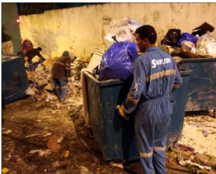
عقد الطمر يلزم تأمين بديل قبل 6 أشهر من استنفاد الطاقة الاستيعابية

وبالعودة إلى الملحق رقم 6 لعقد جمع وكسب النفايات العائد لعام 2008 الذي لا يزال ساري المفعول إلى اليوم، يتبين أنه في حال نفذت القدرة الاستيعابية لمطهر الناعمة، وتعذر على مجلس الإنماء والإعمار تأمين موقع بديل (المادة 16 من عقد الطمر) قبل فترة ثلاث سنوات، تتنازل شركتنا سوكونمي عن أي مطالبات من جراء توقف العمل في أي من هذه العقود أو جميعها بفعل نفاذ القدرة الاستيعابية لهذا المطهر، على أن يعلم مجلس الإنماء والإعمار الشركة قبل مدة ستة أشهر بتعذر تأمين موقع بديل من مطهر الناعمة. ويستدل من هذا النص على أنه لا مفر من أن يعلن مجلس الإنماء والإعمار تأمين بديل من مطهر الناعمة، إلا إذا كان المجلس يخطط لاستملاك أراض جديدة في المنطقة، وهو ما يتوقع أن يؤدي إلى المزيد من الاضطرابات ومواجهات قد تكون دامية هذه المرة.