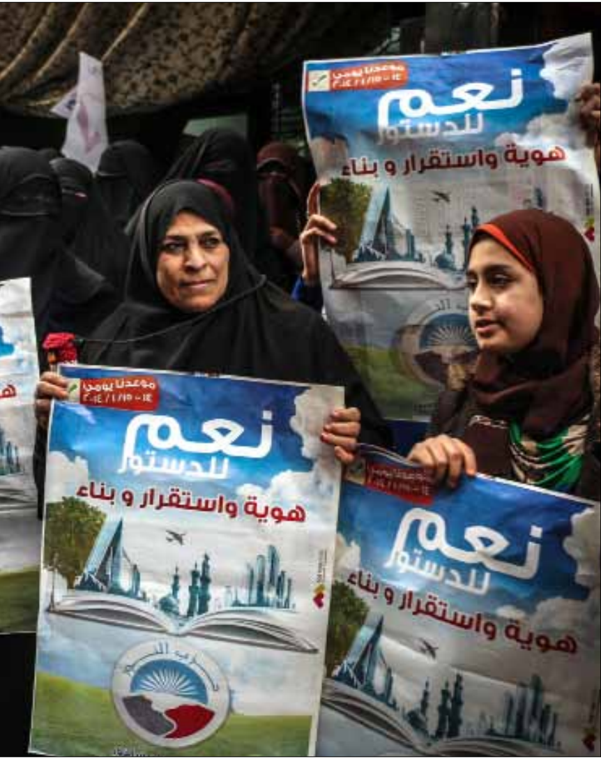
بالنسبة للسلفيين فإن ممارسة الحكم ليس له أهمية في الوقت الحالي

الصمود الأيديولوجي وحدود التنازلات كان السلفيون دائمي الفخر بانهم الأكثر التزاماً بما يكتبونه في أدبياتهم، وكانت الصورة المأخوذة عنهم أنهم لا يتنازلون في سبيل الحفاظ على انحيازاتهم الفقهية، والعقدية. لكن منذ ثورة «25 يناير» بدأت الدعوة في التراجع عما اعتبرته «ثوابت» أو ما نظرت ضده خلال العقود الماضية، بدءاً من رفض الديموقراطية والمجالس النيابية، مروراً بالحزبية واشتغال النساء بهذه السياسية الحزبية، الأمر الذي