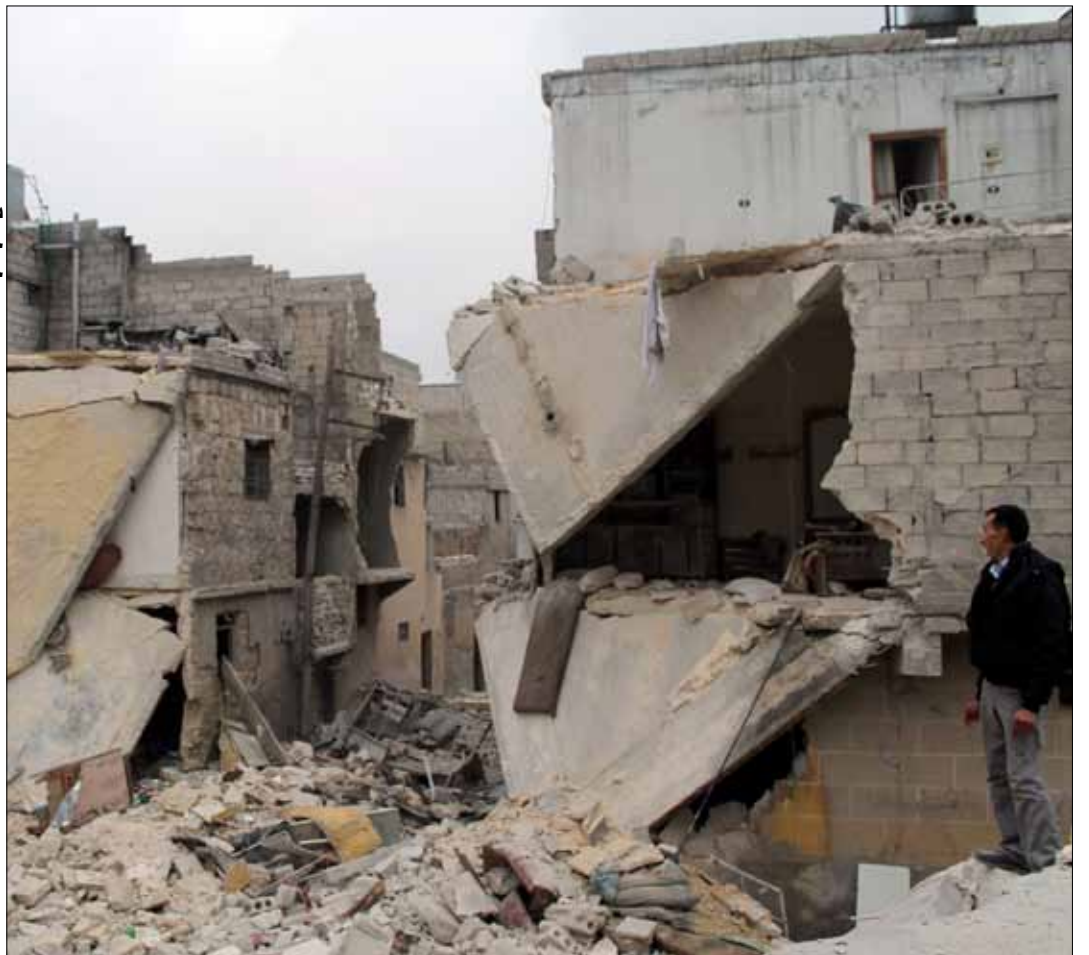
شمالي مدينة حلب أمس

وفي ظل سيطرة «داعش» على الرقة، باشر أصحاب المحال