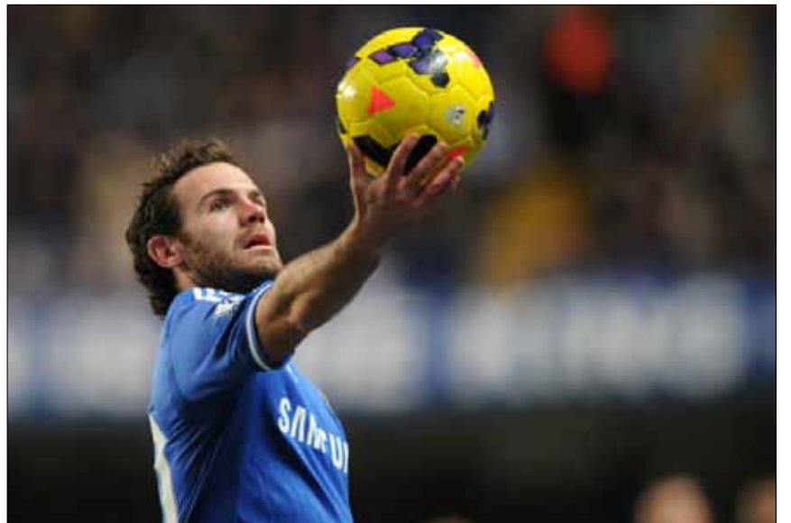
خوان ماتا

يضع مانشستر يونايتد الإنكليزي نصب عينيه تعزيز صفوفه في سوق الانتقالات الشتوية بعد النصف الأول الكارثي من الموسم الحالي والذي وضع مدربه الإسكوتلندي، ديفيد مويز، في موقف حرج للغاية أمام جماهير النادي.