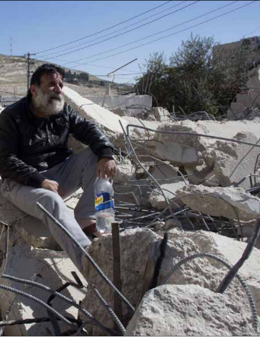
على أطلال منزله الذي هدمته قوات الاحتلال أمس في القدس