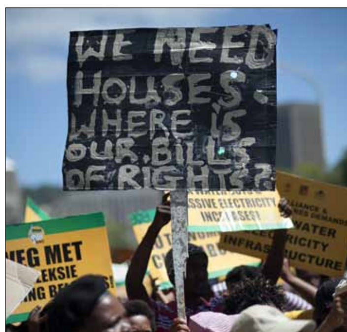
سيوذي الحرمان المتنامي إلى تقويض النسيج الذي يضمن تماسك المجتمعات (أ ف ب)

اليوم، هناك من يتمتع برفاهية الانتظار ليعرف الإجابة عن هذا السؤال. ولكن في المقابل، هناك 1,2 مليار نسمة يعيشون في الفقر المدقع، يسرق الجوع أرواحاً كثيرة منهم يومياً، فيما تتكفل الأمراض والأفات الأخرى بشريحة دسمة؛ هؤلاء يريدون الإجابات الآن.