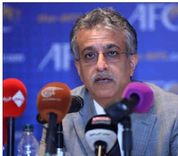
رئيس الاتحاد سلمان بن إبراهيم

الآسيوي، وجدت سلطات كرة القدم في ماليزيا أن فريقاً باكملة في إحدى الدرجات الأدنى من الدوري مذنب في أحدث فضيحة فساد تضرب المسابقات في البلاد. وأكد الاتحاد الماليزي لكرة القدم أمس الأربعاء تقريراً في صحيفة ذا ستار، قال إن 17 لاعباً من نادي كوالالمبور إف ايه المنتهي إلى دوري الدرجة الثالثة تم تغريمهم خمسة آلاف رينجيت ماليزي (1500 دولار) بسبب التلاعب بنتائج المباريات.