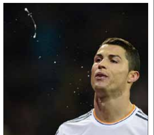
كريستيانو رونالدو

بدت لجنة المسابقات في الاتحاد الإسباني حازمة مع نجم ريال مدريد البرتغالي كريستيانو رونالدو، حيث أقرت عقوبة إيقافه في المباريات الثلاث المقبلة ضد فياريال وخيتافي والتشي