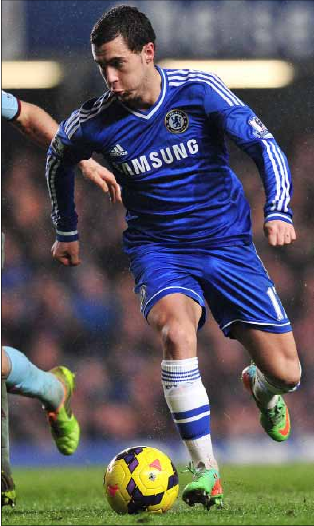
يعدّ هازار من اللاعبين القلائل الذين يمكنهم فعل أي شيء مطلوب

تشلسي بطلاً لإنكلترا وأوروبا، وبلجيكا تؤدي دوراً أساسياً في المونديال؛ لم لا، ما دام هازار يرتدي ألوان الفريقين المذكورين.