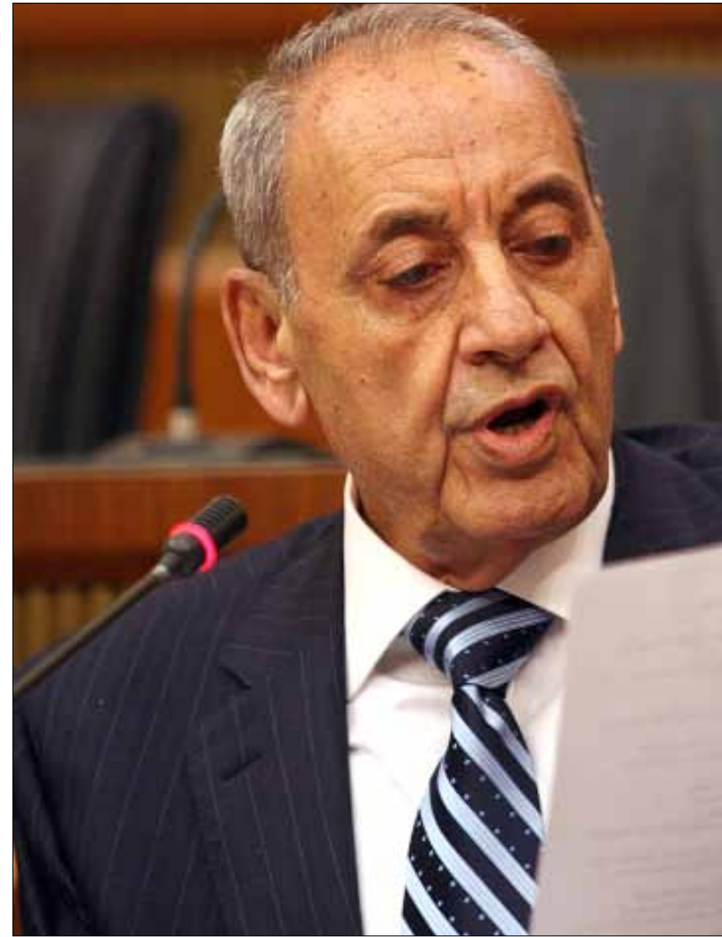
بري: انسحاب فرنجية والطاشناق يعني سقوط الميثاقية عن الحكومة (هيثم الموسوي)

وإذ لفت إلى أن لا وساطة من بري حالياً، أشار إلى أن الأخير كان قد نصح سلام عندما زار عين التينة وتمنى عليه إكمال الاتصالات مع كل الفرقاء للتوصل إلى تفاهم. وأكد «أننا لسنا مستعجلين إلى درجة الإقدام على خطوة قد تخرّب كل شيء والكرة في ملعب رئيس الجمهورية».