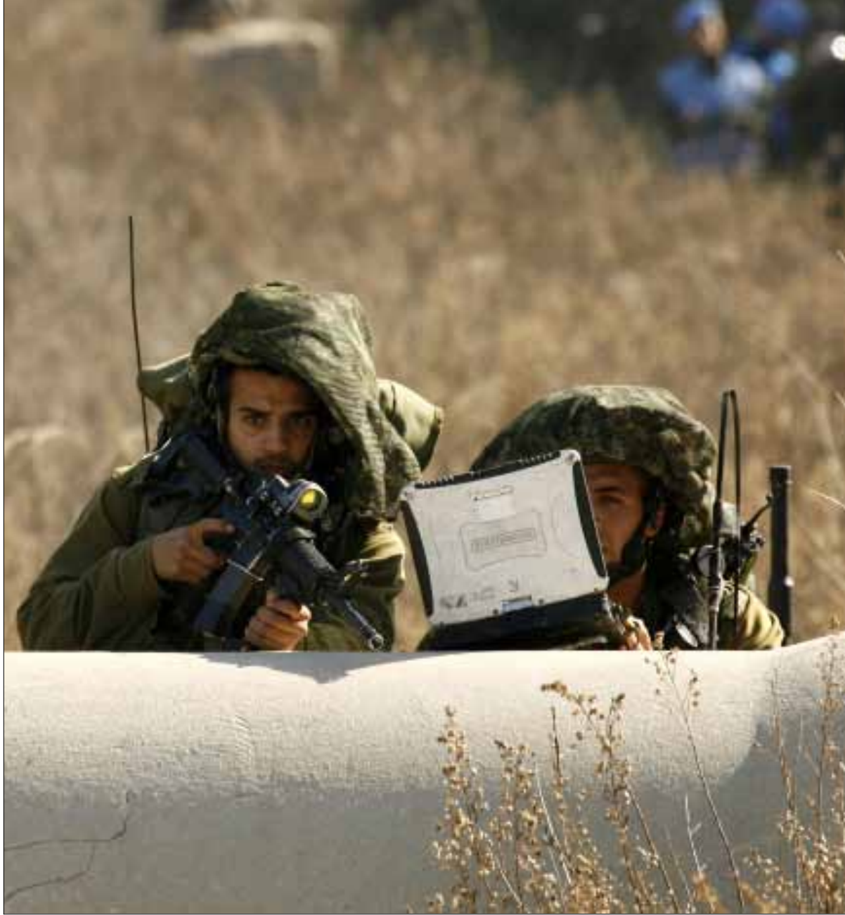
جنود اسرئيليين على الحدود مع لبنان

رغم حديث المسؤولين الإسرائيليين عن تعاضم قدرات حزب الله العسكرية التدميرية، يواظب هؤلاء يومياً على تهديد لبنان بحرب مهولة، ما يطرح علامات استفهام عن الغاية من هذه التهديدات، وهل هي مقدمة لحرب أم هروب منها؟