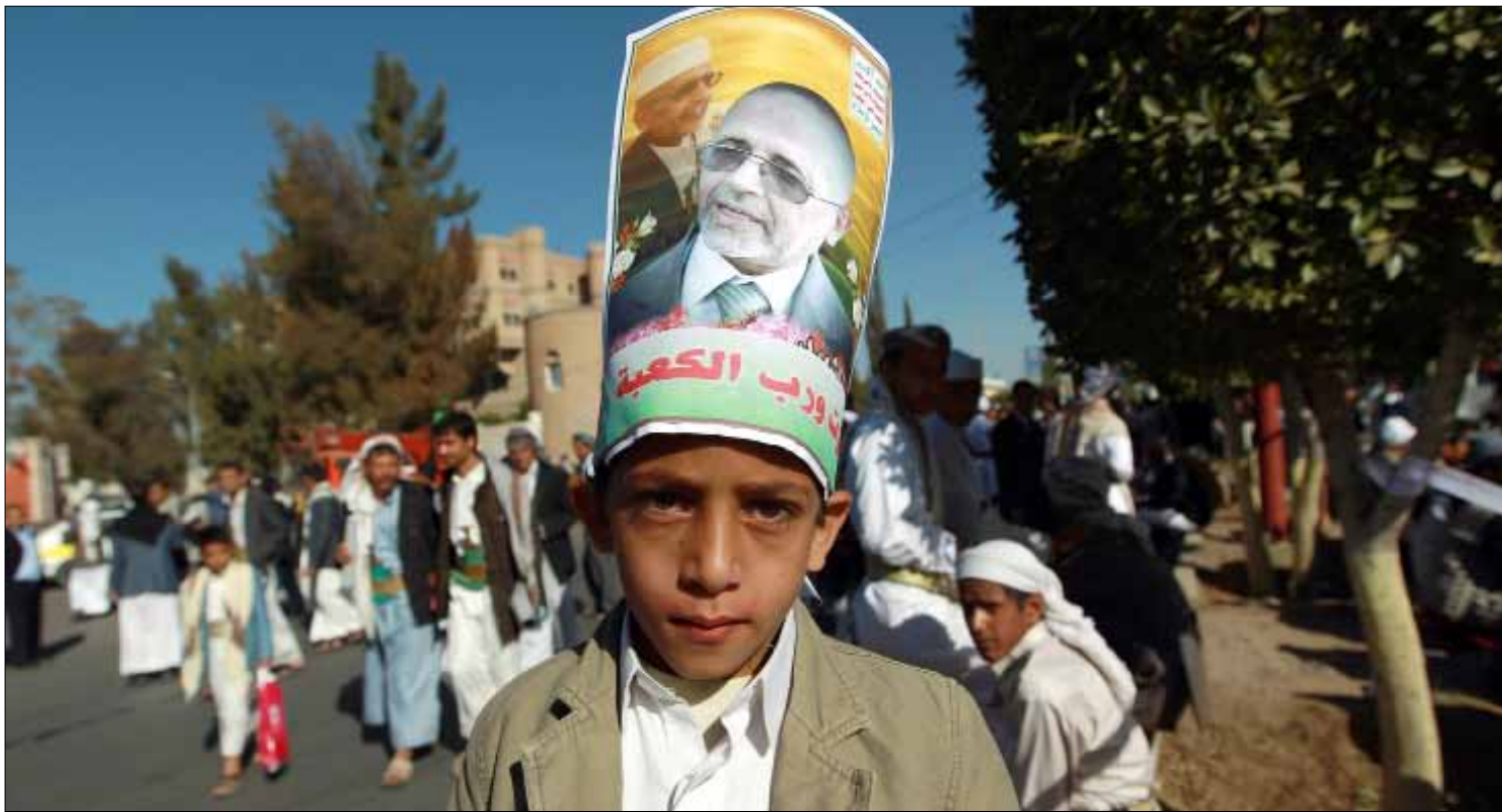
اتضح أن ميليشيا الحوثي تتمتع بقدر أكبر من التماسك وفرض قواعد الاشتباك

اليمن الذي يعتمد على «توازن الرعب» في بقاء اللعبة السياسية، بنحو يضمن للجميع المشاركة فيها، يمثل كل طرف فيه عنصر ردع للطرف الآخر. وهذه الطريقة عاش عليها البلد سياسياً لعقود، مع انهيار مركزية الدولة، وقوتها، لمصلحة قوة الأطراف المحلية المختلفة ونفوذها، وهي آلية اعتمدت لحكم «اليمن السعيد».