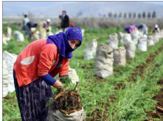
عاملات سوريات في حقول الجزر في انطاكيا (الاناضول)

لم تتوقف المعارضة السورية عن «التكاثر». يشهد الميدان بنحو دائم ولادة تنظيمات مسلحة جديدة، إما من خلال تشكيل كتائب وألوية جديدة، أو من خلال اندماج مجموعات لتأليف الجيوش والفيالق. آخر ما نبت في تربة المعارضة، «فيلق الشام»