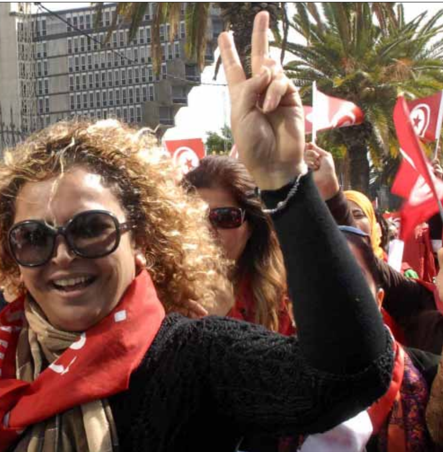
من الاحتفال بيوم المرأة العالمي في تونس