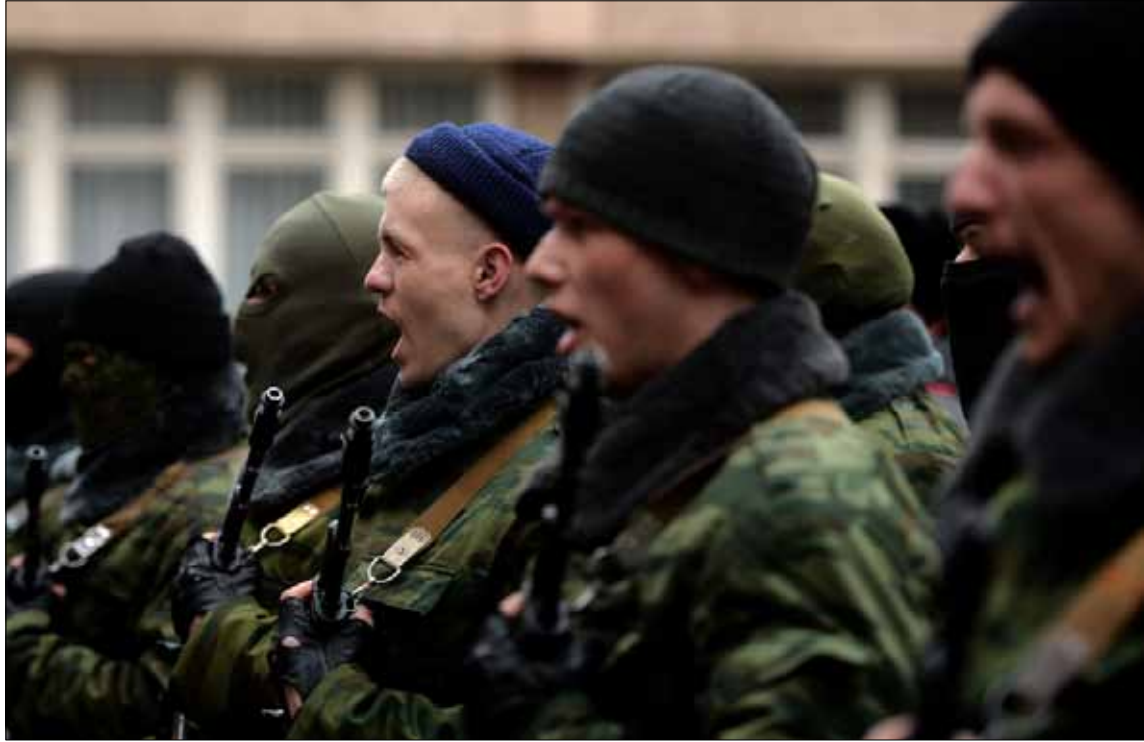
اطبقت القوات الموالية لروسيا سيطرتها على جزيرة القرم