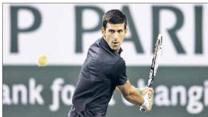
ديوكوفيتش خلال مباراته وهانيسكو

2. في المقابل، خرج التشيكي توماس بيردبتش المصنف رابعاً من الدور الثاني اثر خسارته أمام الإسباني روبرتو باوتيستا 4-6 و2-4، ويلتقي هذا الأخير في الدور المقبل مع مواطنته فيليبسيانو لوبيز الفائز على