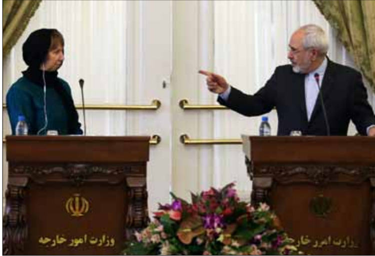
انتقدت طهران انتقائية أشتون في التعاطي مع حقوق الانسان

خطاب بالغ الدلالة للشيخ حسن روحاني. تشديد على أن الغرب عاجز عن فرض أي شيء في المنطقة دون إرادة طهران، وآخر على أن لا انقسام ولا خلافات في إيران عندما يتعلق الأمر بقيم الثورة والمصالح الوطنية، وثالث على أن وفد التفاوض يعمل تحت إشراف هيئتين عليين