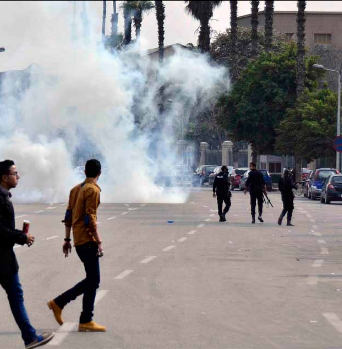
اطاح الحكم القضائي بعودة الحرس الجامعي أحد مكتسبات ثورة «25 يناير»

4 مرات وإحالتة على مجالس التأديب 4 مرات وصدور قرار بفضله في الفصل الأول ومنعه من تقديم الامتحانات وفضله 3 أسابيع مع بداية الفصل الثاني وصدور قرار بمنعه من دخول جامعة المنصورة». بالتزامن مع الحراك الطلابي، كشفت مصادر طلابية في جماعة الإخوان