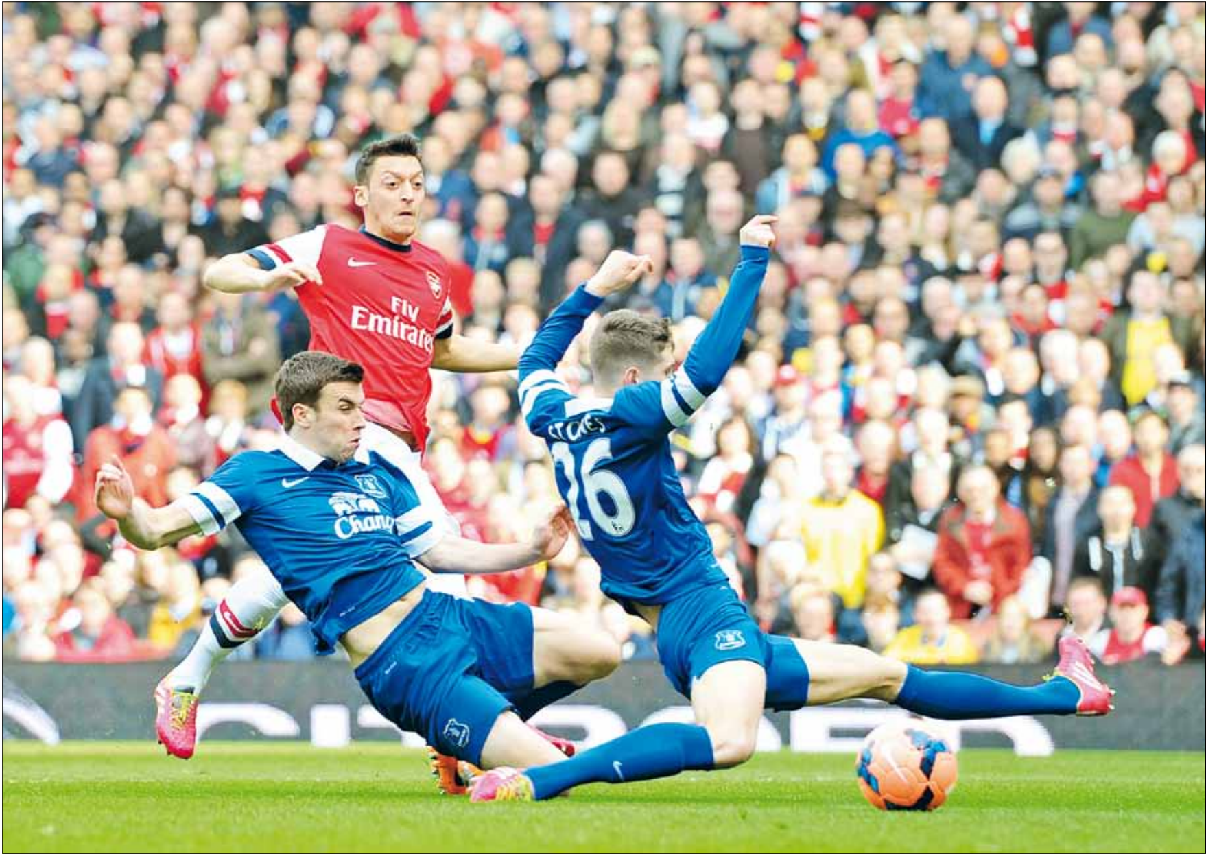
متطلبات الكرة في إنكلترا تترك تأثيراً قاسياً على كثير من اللاعبين