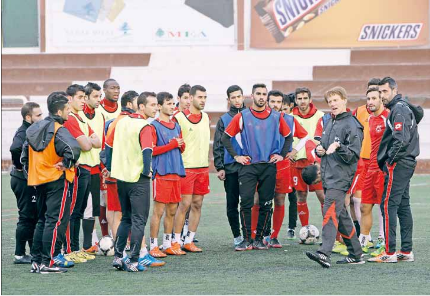
يسعى بوكير إلى تعويض الخسارة الأولى أمام الكويت

ويلعب في مباراة ثانية ضمن المجموعة ذاتها السوق العماني مع مضيفه ذات راس عند الساعة 17,00.