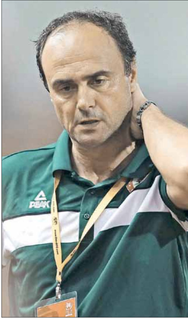
مدرب منتخب لبنان جوسيب جيانيني (عدنان الحاج علي)

فالموضوع أكبر من التعاقد مع مدرب جديد أو بقاء القديم، إذ إن المسألة تلامس مدى قدرة المعنيين على اعتماد مشروع شامل للمنتخبات