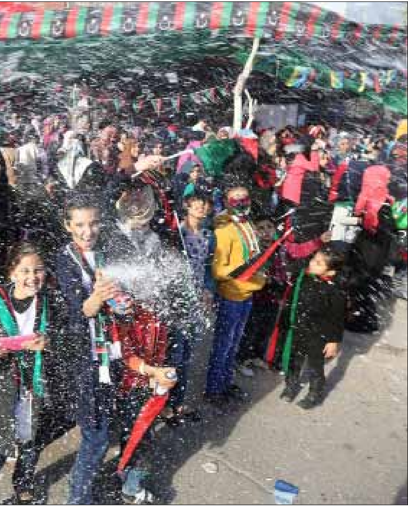
الوضع الليبي شديد التشابك لأسباب كثيرة لا تقتصر على غياب القيادة الواضحة للشعب