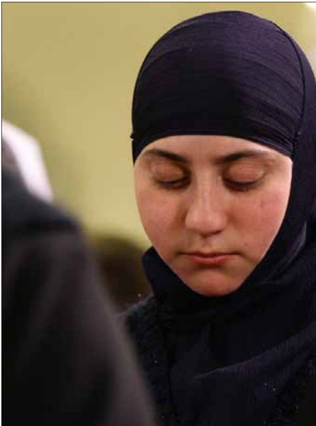
أثناء قداس شكر على عودة الرهبات في دمشق أمس

يحضر، في ليل انتظار راهبات معلولا، السؤال عمّا كانت الصورة ستكون عليه لو كان «الجناح العسكري» المناوئ لقوى 14 آذار، لا المناصر لهم، هو من خطف الرهبات، خصوصاً أن ساعات قليلة، فقط، فصلت بين مشهدي جديدة يابوس وزحلة