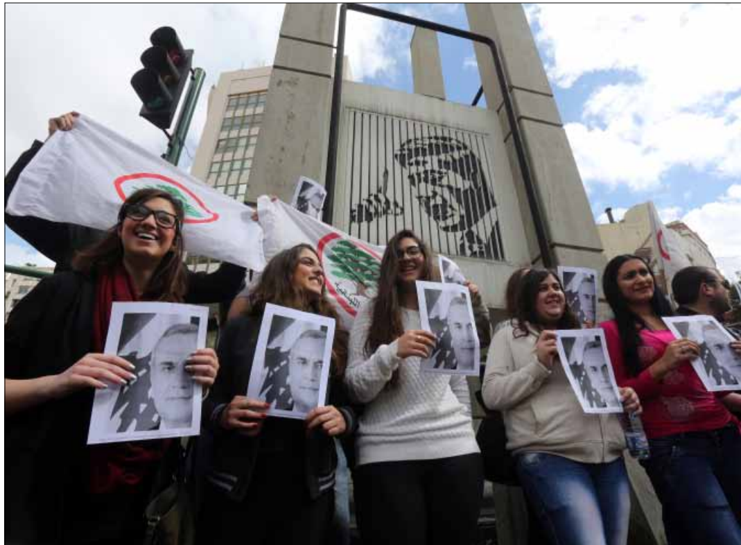
«تجمّع» في ساحة ساسين دفاعاً عن رمز لبنان

«عبّوا المطارح، قُربوا من بعض، خلونا نبيّن كتار»، يقولها أحد منظمي الحراك الخجول جداً لزملائه للحفاظ على القليل ما بقي من ماء الوجه، وخصوصاً أن الأحزاب تعمل على تنظيم الوقفة التضامنية منذ نهار الجمعة، وقد أعطت كل منظمة طلابية في كل جامعة حرية اختيار الوقت بما يضمن أوسع حضور ممكن، لكن القواعد الطلابية لقوى الرابع عشر من آذار لم تبدّ معنية بالتضامن مع الرئيس سليمان. حتى الحاضرون من الأكثر تحزباً، لم يعرفوا فعلياً سبب وجودهم هنا. يعرفون فقط أن الرئيس