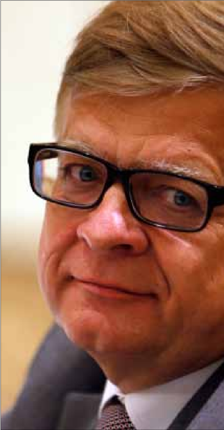
روسيا متفائلة بالوضع اللبناني وبإجراء الاستحقاقات الدستورية (هيثم الموسوي)

لا يمكن قلب موازين القوى في سوريا بعد الآن