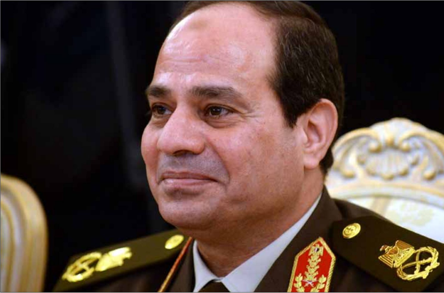
السياسي: المصريون يستحقون أن يعيشوا بكرامة وأمن وحرية

وقال السياسي، في كلمته أمس مخاطباً «شعب مصر العظيم»: «اليوم، أوقف أمامكم للمرة الأخيرة بزي العسكري، بعد أن قررت إنهاء خدمتي كوزير للدفاع... قضيت عمري كله جندياً في خدمة الوطن، وفي خدمة تطلعاته وآماله، وسأستمر إن شاء الله». وأضاف أن «هذه اللحظة مهمة جداً بالنسبة إلي. أول مرة ارتديت فيها الزي العسكري كانت سنة 1970، طالب في الثانوية الجوية عمره 15 سنة... يعني نحو 45 سنة وأنا أنتشر في بزي الدفاع عن الوطن... واليوم، أترك هذا الزي أيضاً من أجل الدفاع عن