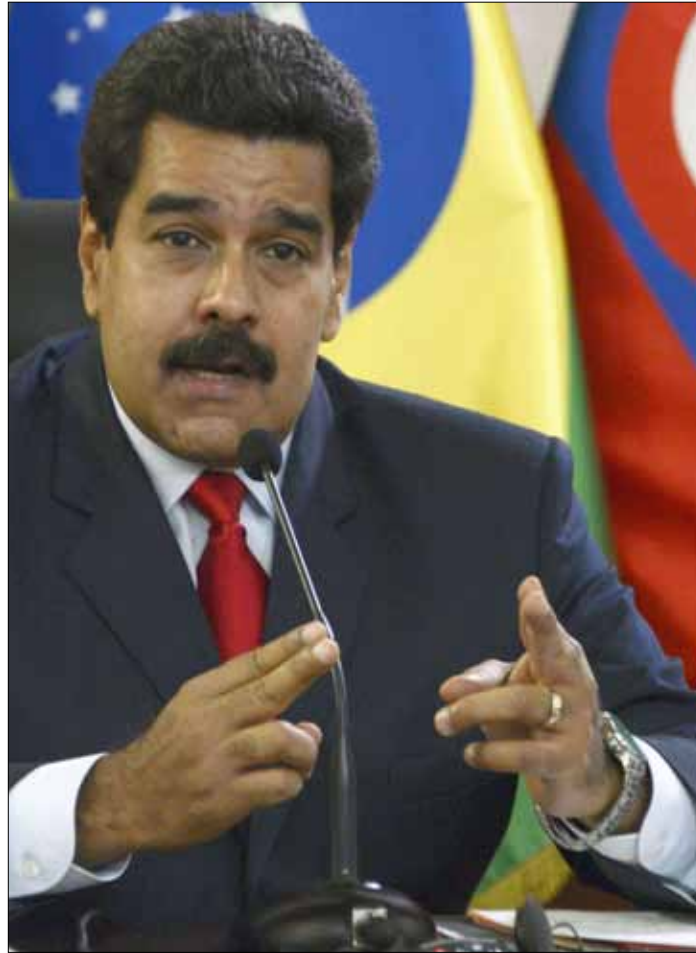
تتهم المعارضة الحكومة باستخدام العنف في مواجهة المتظاهرين

التقويم الاقتصادي الذي تجرته هذه المؤسسة سنوياً للدول الأعضاء فيها. وقال مجلس إدارة الصندوق، في بيان، إنه اطلع على «عرض مقتضب غير رسمي» لفرقه حول الوضع الاقتصادي في فنزويلا، موضحاً أن التقويم الفعلي للوضع في هذا البلد «تاخر 98 شهراً». وتعاني فنزويلا تضخماً كبيراً، وتشهد حالياً أزمة سياسية خطيرة. والدول الأعضاء في صندوق النقد ملزمة نظرياً الخضوع لتقويم سنوي لاقتصاداتها، لكن عدم احترام هذا الشرط لا يستدعي فرض عقوبات. (أ ف ب، الأناضول)