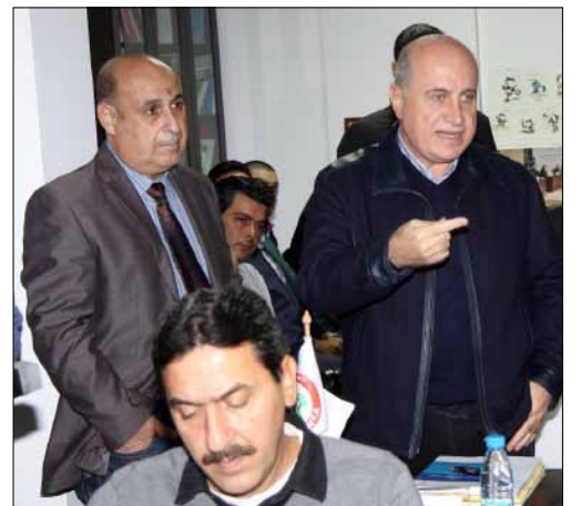
اعتراض حيدر بدا من طريقة تركيب اللجنة التنفيذية

اختتم الأسبوع السادس عشر من الدوري اللبناني لكرة القدم بخيبة صفاوية بعد تعادل سلبي، فيما تشهد اللجنة الأولمبية حراكاً لافتاً مع عودة نائب الرئيس هاشم حيدر إلى حضور الاجتماعات