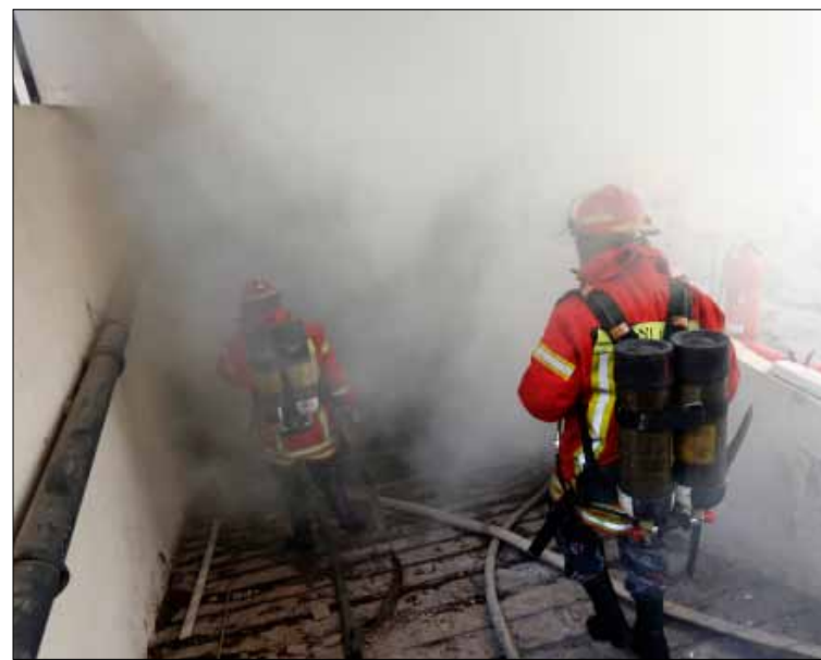
الحريق الأخير في الضمان يشبهه بانته مفتعل (هيثم الموسوي)

المساعدة المطلوبة. لم يكثر أحد. صباح أول من أمس أعدت مريم العدة لخطونها التي تعبر عن ياسها الشديد، فوضعت في حقيبها اليدوية قنينة بلاستيكية صغيرة، مملوءة بمادة البنزين، وعندما أخبرها موظفو المفوضية بأن اسمها قد شطب من