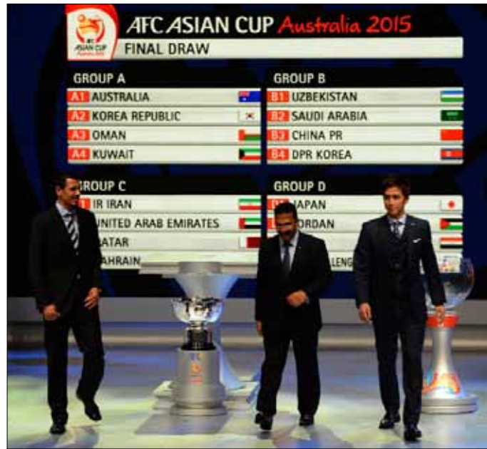
القرعة النهائية بعد سحبها

قَسَّت قرعة نهائيات كأس آسيا 2015 التي تحتضنها أستراليا من 9 إلى 31 كانون الثاني المقبل، والتي سحبت أمس الأربعاء في دار الأوبرا في سيدني، على المنتخبات العربية وأوقعتها في مجموعات صعبة، أقواها الأولى الحديدية والتي ضمت عمان والكويت مع أستراليا المضيفة ووصيفة النسخة الأخيرة وكوريا الجنوبية الثالثة. وتجمع المباراة الافتتاحية المقررة في ملبورن بين أستراليا والكويت بطلا عام 1980. وأوقعت القرعة 3 منتخبات خليجية هي الإمارات وقطر والبحرين في المجموعة الثالثة، إلى جانب إيران حاملة اللقب 3 مرات وأحد الممثلين الأربعة للقارة الصفراء في مونديال البرازيل 2014، إلى جانب أستراليا وكوريا الجنوبية واليابان. وجاءت السعودية حاملة اللقب 3 مرات أيضاً أعوام 1984 و1988 و1996 في المجموعة الثانية إلى جانب أوزبكستان التي بلغت الملحق الآسيوي المؤهل إلى المونديال، والصين وصيفة بطلا 2004 على أرضها، وكوريا الشمالية بطلا كأس التحدي الآسيوي لعام 2012.