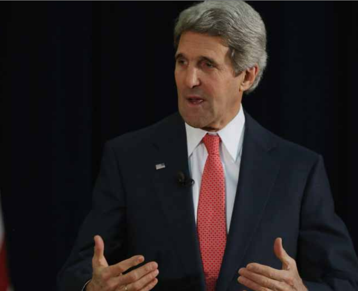
التقى كيري بالملك الأردني والرئيس الفلسطيني في عمان أمس

عباس يلتقي كيري: إسرائيل استغلت كل فرصة لإفشال الجهود الأميركية