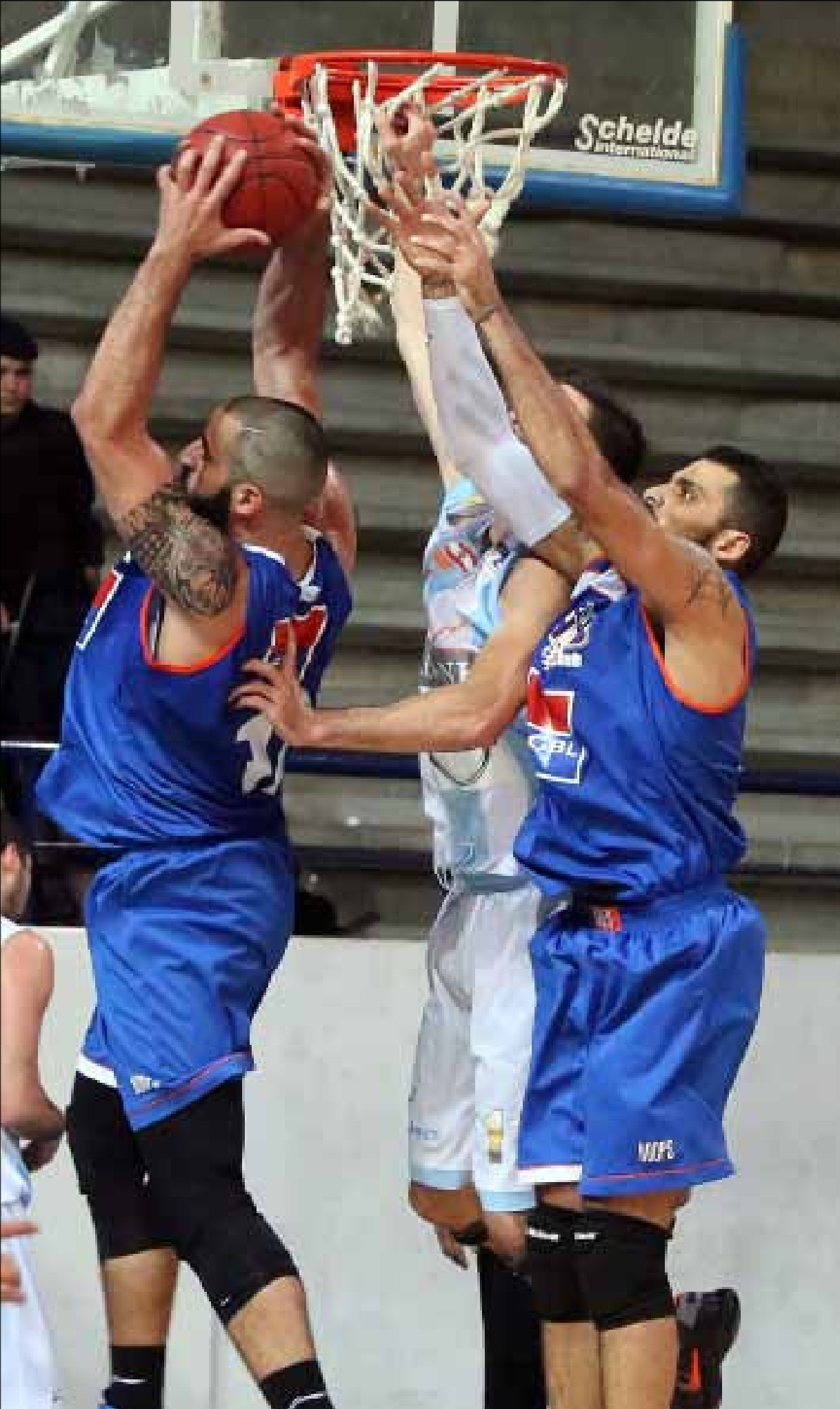
ريبوند لهوبس أمام محاولة للشانفيل