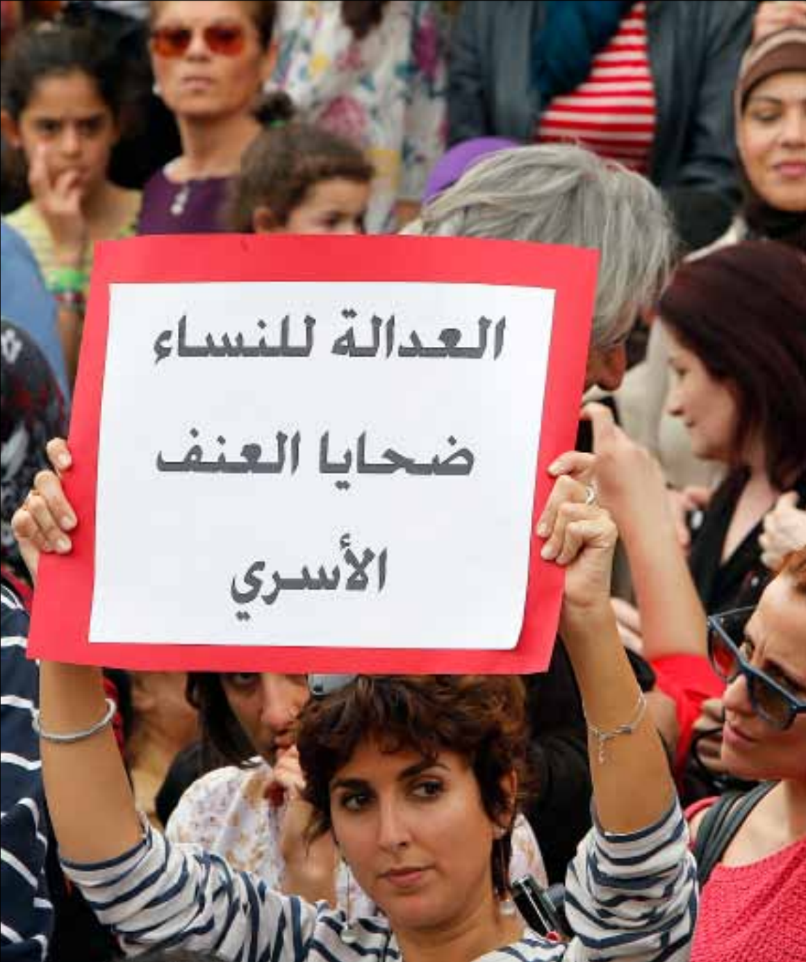
مسح جريمته من ذاكرته وكاد يكمل حياته، فهو بنهاية المطاف «رجل ومحامي من عائلته» (هيثم الموسوي)

رقية فارقت حياتها في طريقها إلى طوارئ مستشفى الرسول الأعظم. هذا ما يذكره رتيب التحقيق. لم يأت الرتيب بما ذكره من عدم، فهناك في الحي الذي كانت تقطنه رقية، روى الفضوليون الكثير من الحكايات عن ذلك الموت، فمنهم من قال إنها انتحرت، وآخرون قالوا إنها قُتلت على يد زوجها. واحدة