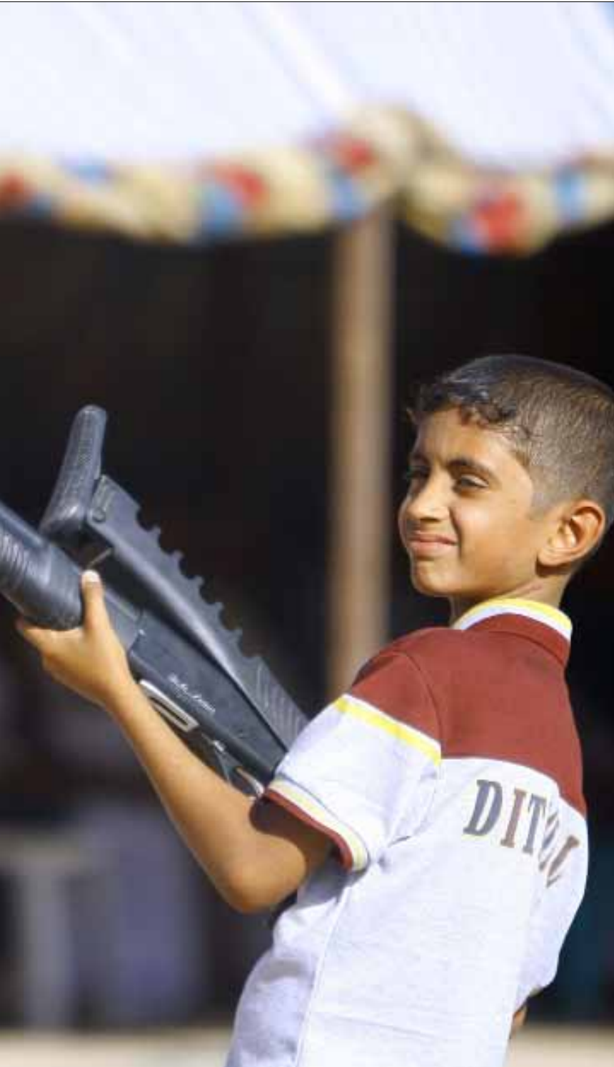
شنت الحكومة العراقية هجوماً لاذعاً على السعودية وحملتها مسؤولية الجرائم في العراق

اتهام عراقي صريح للسعودية بدعم الإرهاب وتمويله، أتى على خلفية البيان الذي نشرته الرياض أول من أمس، في وقت قررت فيه واشنطن إرسال 275 جندياً إلى العراق لحماية سفارتها