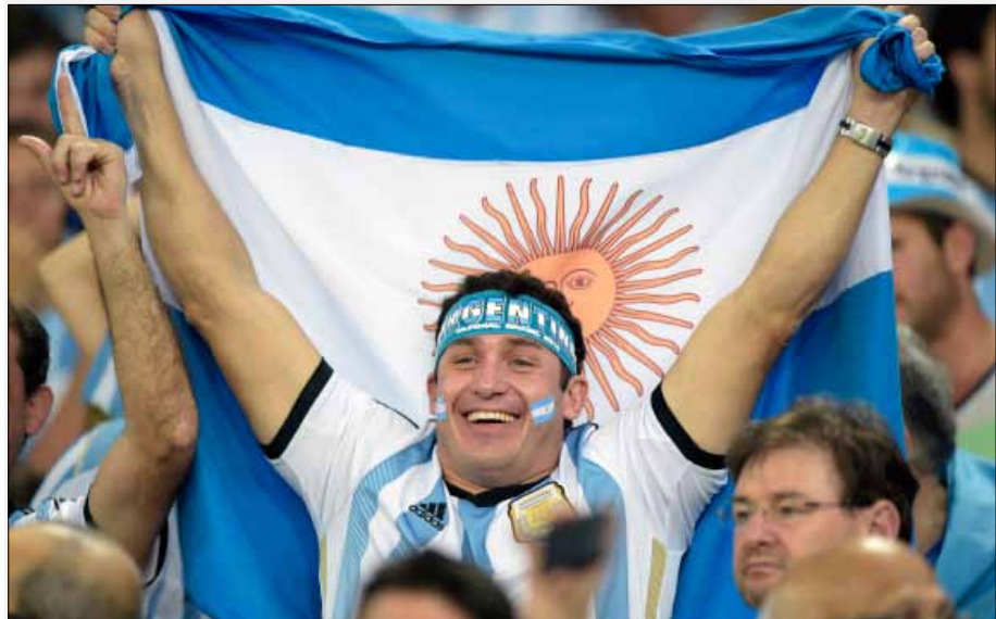
شهدت المباراة حضور 74 ألف متفرج

وتقدّر الحكومة البرازيلية أن عائدات مباراة منتخب الأرجنتين والبوسنة تصل إلى 50 مليون دولار، وفقاً لما أعلنه مسؤول السياحة في ولاية ريو دي جانيرو، كارلوس ماغنافيتا.