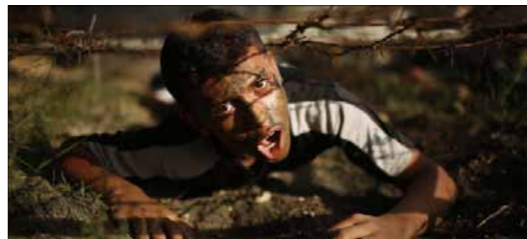
تستغل إسرائيل الفرصة لاجتثاث حماس من الضفة في ظل سيطرتها على غزة