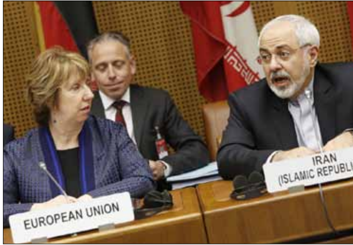
أكد المتحدث باسم أشتون أن المفاوضات تجري في أجواء إيجابية

والثلاثاء». وأضاف أن «الجلسة العامة جرت، أمس، بحضور كافة أعضاء الوفود المتفاوضة في أوروبا، ما يكل مان، أن «المفاوضات بين إيران ومجموعة 1+5 تجري في أجواء جيدة لتحديد عناصر الاتفاق النووي الشامل».