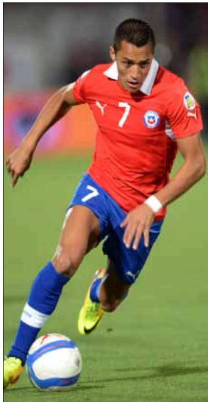
التصميم الإسباني في مواجهة الحماسة التشيلية

وتخوف عشاق «فاتريني» من اصابة نجم الوسط لوكا مودريتش، لكن الاتحاد المحلي أعلن جاهزيته لمواجهة الكامبيون، التي قد تفتقد نجمها صامويل ايتو، صاحب الخبرة الكبيرة، بسبب الإصابة.