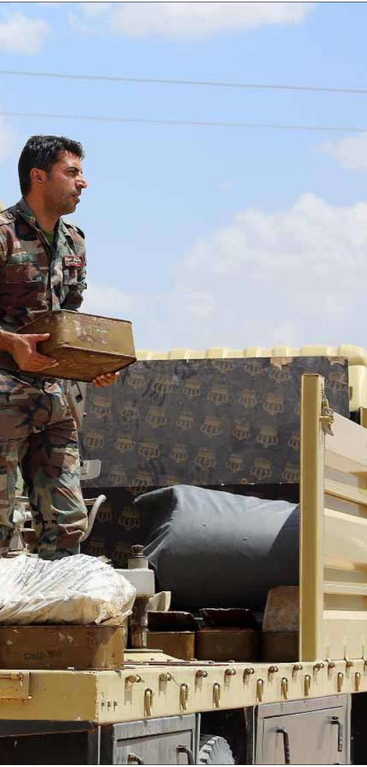
عنصر من البشمركة على معبر ربيعة من الجانب العراقي

وشهد محيط جبل عزان في ريف حلب الجنوبي اشتباكات عنيفة أدت إلى مقتل أحد قادة «جبهة النصرة» إسماعيل العيسى الملقب بـ«أبو نجيب». في موازاة ذلك، أصدرت «غرفة عمليات المسلحين في الريف الشمالي» بياناً أعلنت فيه استئخاف معركة «النهران» التي تهدف إلى السيطرة على قرى وبلدات الريف الشمالي التي يسيطر عليها «داعش».