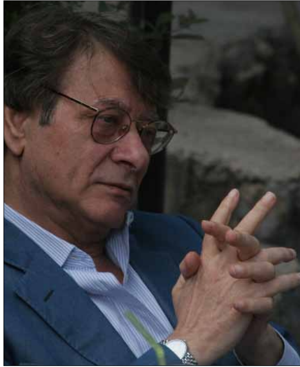
محمود درويش: مارادونا يعيد الجزيرة إلى الأرجنتين. وينتج الإمبراطورية البريطانية إلى أنها تحيا في أفراح الماضي

«لماذا لا تكون كرة القدم موضوعاً للفن والأدب؟» تساؤل طرحه الشاعر محمود درويش (1941 - 2008) في قصيدة كتبها عن ديبغو مارادونا في أعقاب مونديال 1986. يومها، كانت المباراة تجري بين الفريقين الألماني والأرجنتيني الذي فاز بفارق هدف. طرح درويش لم يأت من عبث. فكرة القدم مفقودة في الأدب العربي. أكثر من ذلك، قد يعد إيجاد كتاب يتناول موضوع الرياضة في لغة الضاد ضرباً من المستحيل. أما في اللغات الأخرى، فثمة كتب عدة تتحدث عن تلك الكرة ومختلف أنواع الرياضات. في ما يخص كرة القدم تحديداً، سنجد قصيدة درويش وحيدة. تلك التي استفاد فيها بمدح «الأرجنتيني» ونعى فيها نفسه والمعجبين بلعبه الذي ترك فراغاً في حياة كثيرين بعد انتهاء المونديال. هكذا، يدخلنا درويش عالم كرة القدم وكواليسه، فيصور لنا مهارات مارادونا. ويستحضر في وصفه أيضاً النعد السياسي والتاريخي للدول المتنافسة، معتبراً أن الفوز في البطولة تعويض معنوي للدولة الفائزة بقوله: «مارادونا يتقدم بالكرة من حيث تراجعت السلطة. مارادونا يعيد الجزيرة إلى الأرجنتين. وينتج الإمبراطورية البريطانية إلى أنها تحيا في أفراح الماضي... الماضي البعيد». يتساءل درويش عن «السحر الجماعي» لكرة القدم واللغز الذي