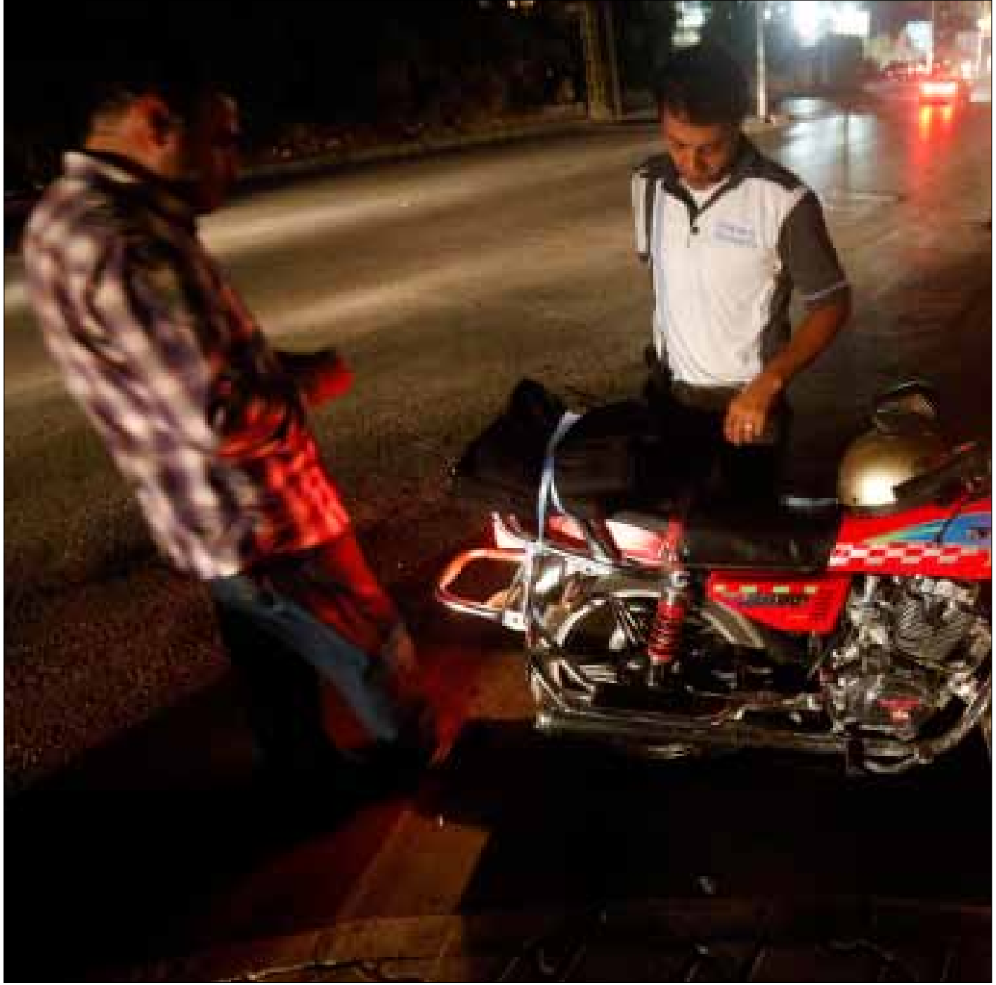
تفتيش دراجة نارية في الضاحية (هيثم الموسوي)

منذ سقوط بلدة يبرود في القلمون، آخر معقل «مديني» مسلحي المعارضة السورية على الحدود اللبنانية - السورية بيد الجيش السوري وحزب الله مطلع أذار الماضي، أرخت الحواجز الأمنية على مداخل الضاحية الجنوبية قليلاً من تشددها في أعمال التفتيش والتدقيق، إذ تزامن تحرير بلدات القلمون مع مراقبة مشددة للمعابر