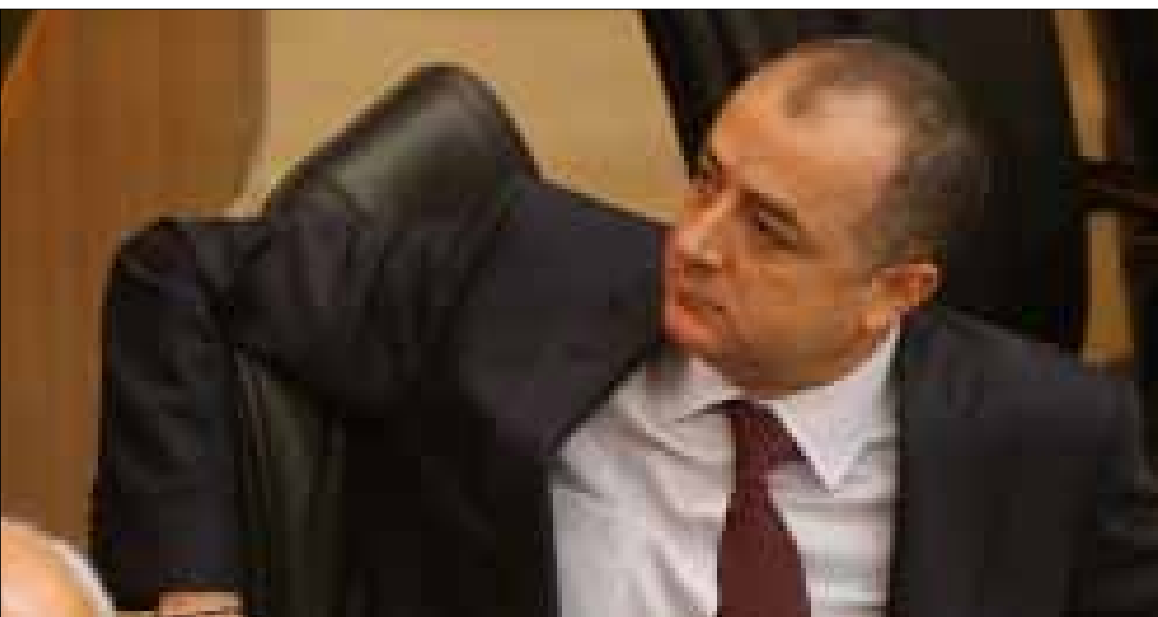
رابطة الاساتذة حذرت من اضطرارها الى تصعيد تحركاتها دفاعاً عن الجامعة

ففي إطار «التوافق السياسي» المفترض، يبدو أن الاجتماع، الذي عُقد بين مختلف الأفرقاء السياسيين في مكتب وزير التربية، لم يناقش توزيع العمداء، أو أن الأطراف السياسية تقوم تباعاً بالتوصل من هذا الاتفاق. مسرحية توزيع الأدوار تحدث تباعاً: المستقبل يوافق بداية ثم يبديل موقفه متذرعاً بضرورة تحقيق التوازن، ويطالب بعمادة كلية التربية «حفاظاً