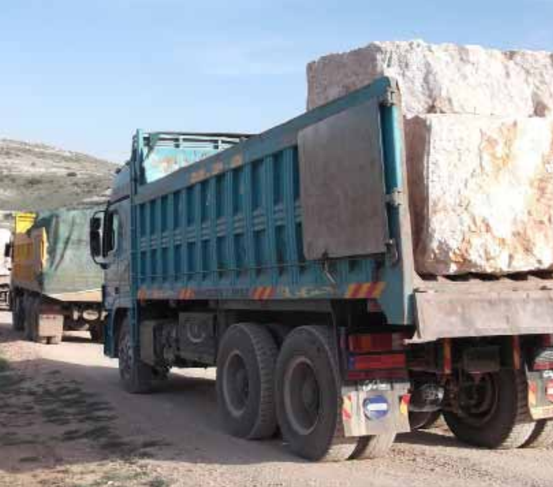
أكثر من عشرة مقالع على طول وعرض جرد تمنين الفوقا (الأخبار)

بين ذرائع رخص استصلاح اراضي وشق طرق، ما زالت المقالع تعمل في جرد تمنين وتمتد الى صنين. عشرات الشاحنات تحمل يومياً اطناناً من الحجارة، وتعتبر دون حسيب او رقيب، لتتحول الى امر واقع تمهيداً لمنحها مهلاً ادارية وسياسية كافية لاستكمال الجريمة البيئية