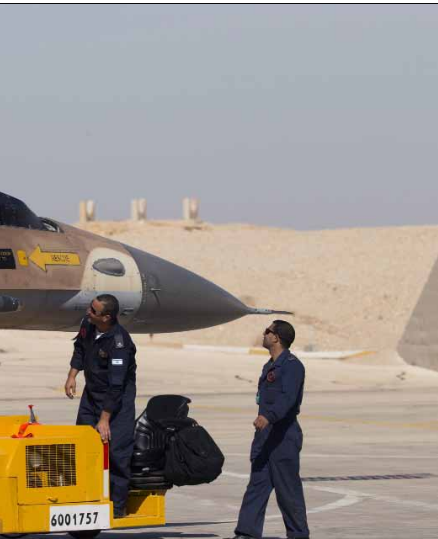
هل كون مدى الطائرات الإسرائيلية يصل إلى العمق المصري كفيل بالقدرة على تدمير ما في مطاراته من طائرات؟

الآن، هل كون مدى الطيران الإسرائيلي واصلاً إلى العمق المصري كفيل بالقدرة على تدمير ما في مطاراته من طائرات إن تجمعت فيها، من باب توقي ضربته؟ الجواب أن بُعد الهدف يتناسب عكساً مع مفاجأة مستهدفه له، إذ