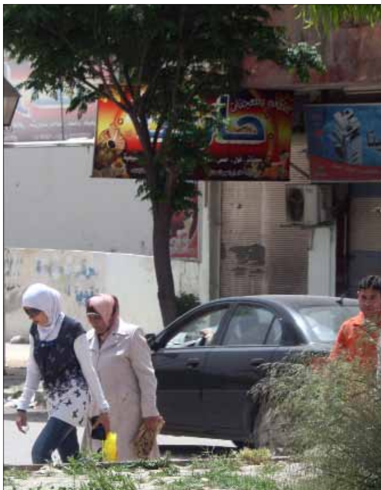
الأحداث دفعت بعض سائقي سيارات الأجرة إلى ترك هذه المهنة

يذكر أن دمشق تعتمد في مجال النقل العام الجماعي على منظومة باصات كبيرة تعود ملكيتها إلى الدولة وإلى بعض الشركات الخاصة المستثمرة، كما تعتمد على شبكة «الميكروباص»، وهي عائدة إلى القطاع الخاص، إضافة إلى «التكاسي» التي بلغ عددها في دمشق وريفها 35 ألف سيارة.