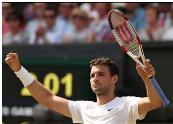
ديميتروف يحتفل بالفوز على موراي

وتقديم عرض جيد». هذا وقد تاهل السويسري روجيه فيديري المصنف رابعاً إلى نصف النهائي بفوزه على مواطنه ستانيسلاس فافرينكا الخامس 6-3 و6-7 و6-6 و4-6، وهو سيلتقي