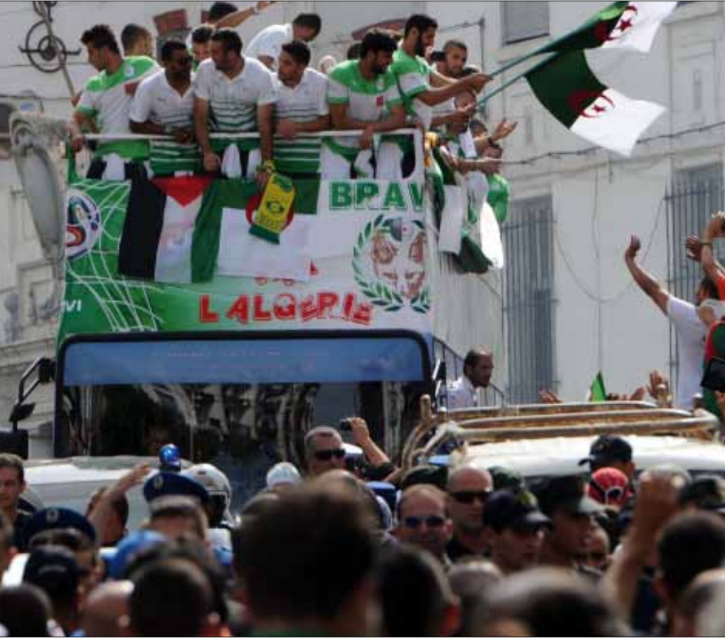
لاعبو منتخب الجزائر على متن الحافلة التي أفلتهم من المطار