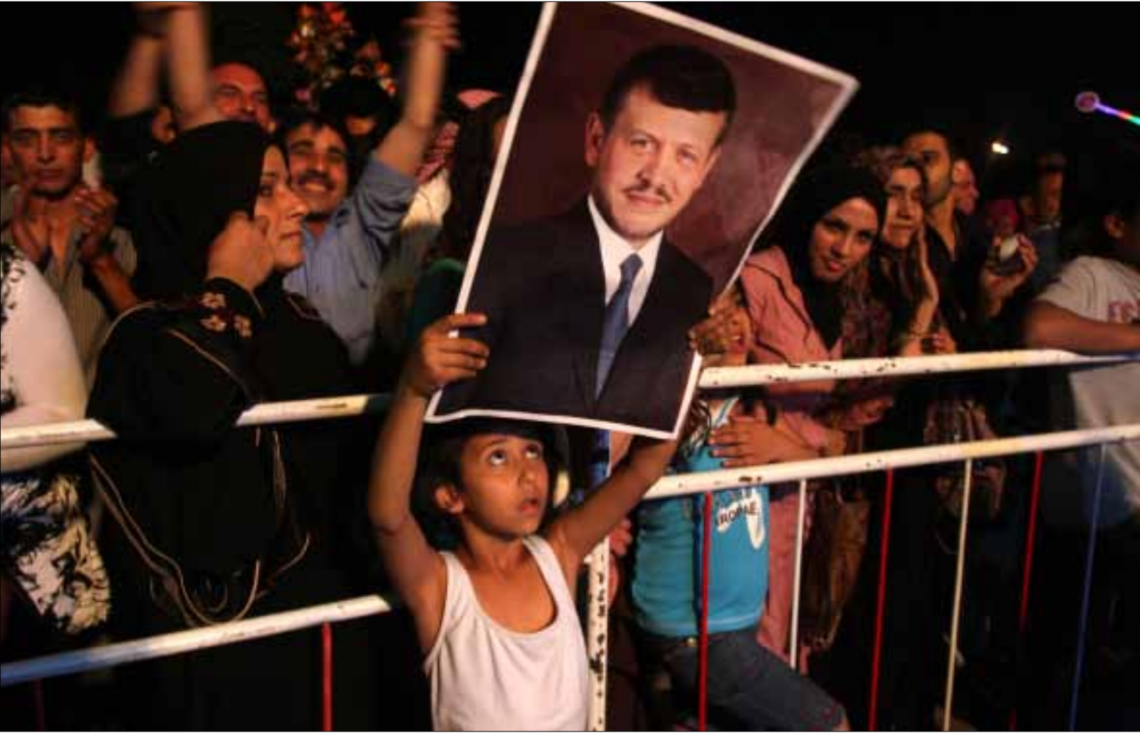
محافظ عبد الله على توازن العلاقات مع العشائر التي تمثل تركيبة أساسية من المجتمع الأردني

إخوان الأردن يختلفون عن إخوان المنطقة! ما أثار هذه المقاربة تسريبات نسبت إلى عبد الله الثاني وفيها اتهامه الجماعة بتدبير مؤامرة لإثارة فتنة فلسطينية - أردنية على وقع ما يحدث في معان. قيادات «إخوانية» رفضت التعقيب لـ«الأخبار»، لكنهم قدموا مبادرة اقتصادية جديدة وطلباً للقاء الملك