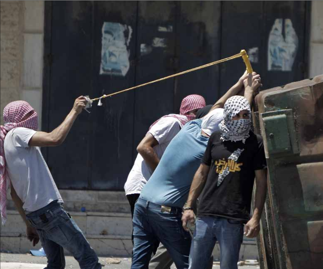
تقدر مصادر فلسطينية وإسرائيلية أن مواجهات مخيم شعفاط أمس غير مسبوق وقد تمهد لامتداد رقعة المواجهات

أهالي شعفاط يستنفرون ردا على قتل المستوطنين فتى وحرقة جثته