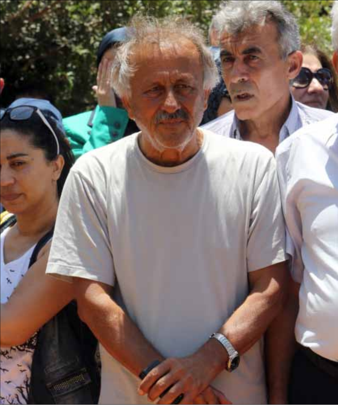
تجمع كبير للطلاب والأهالي في وزارة التربية الأربعاء المقبل

بينما تناقش هيئة التنسيق النقابية خطوات تصعيدية تنفذها الأسبوع المقبل لإقرار الحقوق في سلسلة الرواتب، تجري محاولات للمساومة على الحقوق تحت عنوان الخروج من الأفق المسدود أمنياً وسياسياً