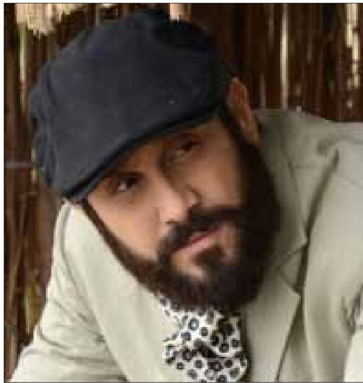
الممثل قصي خولي في مشهد من المسلسل

هكذا، دشّن المؤرّخ المعروف ماجد فرج المتخصص في تاريخ الأسرة العلوية سلسلة يومية لمتابعة أخطاء المسلسل عبر حسابه على الفايسبوك، مشيراً إلى أنّ الأخطاء لم تقف عند حاجز التواريخ فقط، بل امتدت إلى ما هو أكبر من ذلك. مثلاً، ورد شعار المملكة