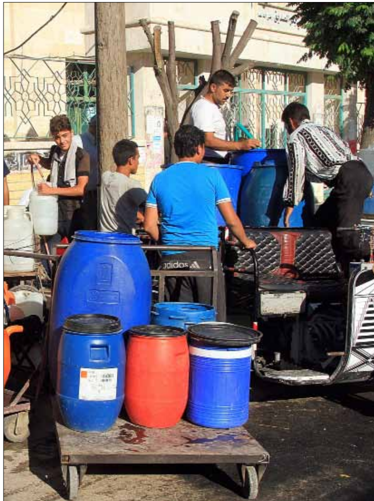
ينتظرون دورهم لتعبئة المياه في حلب امس

«الدولة الإسلامية»، وخاصة في دير الزور بعد «تمدد» الأخير نحو الحدود العراقية، أعلن أمس، في فيديو مصور، «فصائل وأهالي مدينة الشحيل والنملية والحريجي الكف عن قتال الدولة ومبايعة أبي بكر البغدادي».