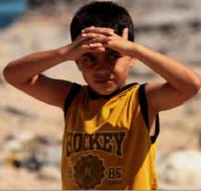
تظهر خلال الساعات القليلة ننانج الوساطة المصرية للتهدئة مع انتهاء مدة التهديد الإسرائيلي