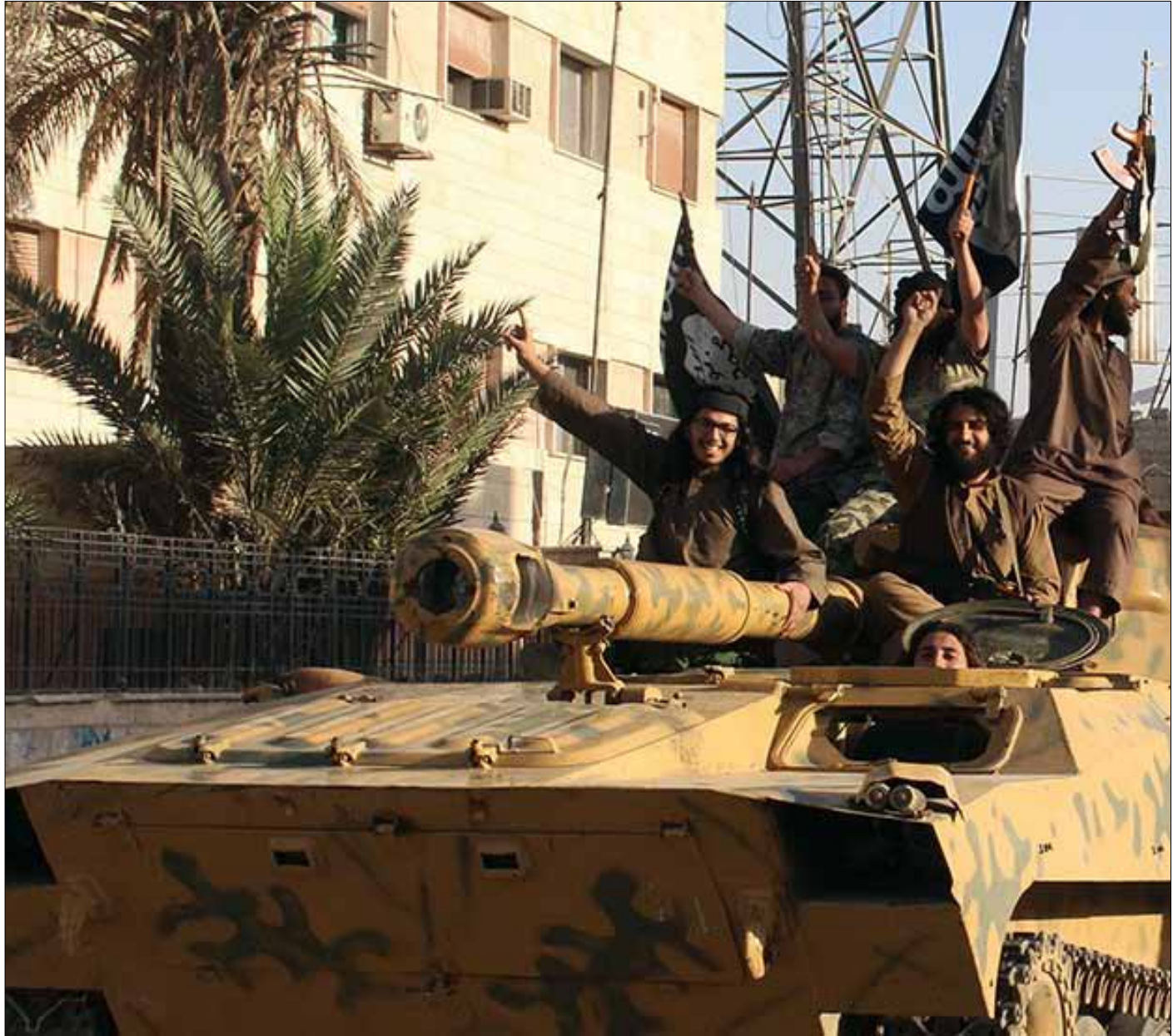
«توجيهات شرعية» صدرت أخيراً عن «مرجعيات جهادية» تحثّ «المهاجرين» على الانضمام إلى «الدولة»

ويقع الحقل في منطقة الشعيطات (الريف الشرقي). وهي المنطقة التي أكدت مصادر من السكان أن «وجهاءها دخلوا في مفاوضات مع الدولة الإسلامية، ويبدو أن اتفاقاً وشيكاً سيُعقد بين الطرفين». ووفقاً للمصادر، تتمحور المفاوضات حول إعلان الشعيطات خاضعة لنفوذ «الدولة»، على أن يضمن التنظيم لأبناء المنطقة عدم نزوحهم خارج أراضيهم، وعدم تسليم أسلحتهم، وعدم دخول أي عنصر من «الأنصار» (السوريون المنضوون تحت لواء التنظيم) إلى المنطقة، علاوة على تعيين أمير من أهالي الشعيطات على منطقتهم. وثشابه هذه البنود تلك التي قيل إنها كانت بنود تسليم الشحيل للتنظيم، لكنّ مصدراً جهادياً مرتبطاً بـ«الدولة» أكد أن «كل ما قيل عن شروط وضعها أهالي الشحيل لتسليم بلدتهم عار من الصحة». وقال المصدر لـ«الأخبار» إن «المنتصر عادةً هو من يملئ شروطه، وبالتالي، فإن دولة الخلافة هي من أملت الشروط». ووفقاً للمصدر، فإن أبرز شروط التسليم كان «تسليم جميع الأسلحة والذخائر الموجودة في الشحيل للدولة، إضافة إلى إجلاء كل مسلحها (وهم معظم أبناء الشحيل) إلى أجل غير مسمى». وقد حظي