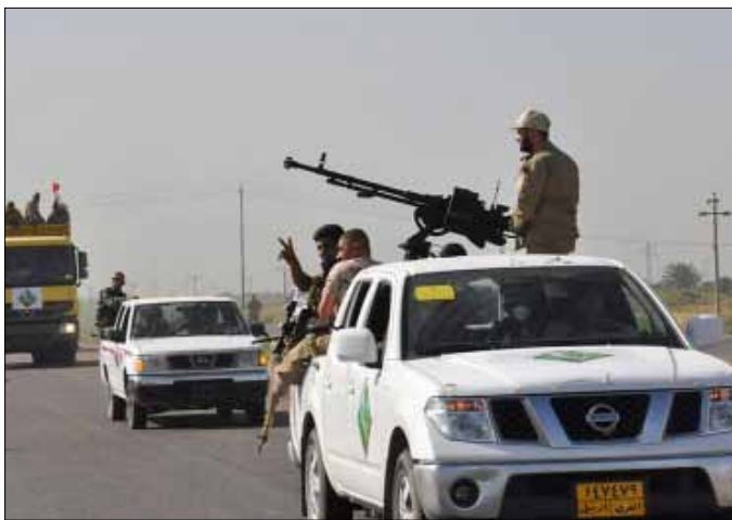
أفاد مصدر أمني، أمس، عن مقتل 38 من مسلحي «الدولة» في ديالى (أ ف ب)

وفي وقت لاحق أمس، أعلن مسؤول عسكري رفيع المستوى في المصفى، وصول قوات أمنية وأسلحة ذات تقنيات عالية لتأمين محيط المصفى، مؤكداً أن القوات الأمنية الموجودة في المكان، تتمتع بروح معنوية عالية وتتحدى محاولات العصابات الإرهابية. إلى ذلك، أعلنت وزارة الخارجية الهندية، أمس، إخراج 46 ممرضة هندية علقن في العراق منذ الشهر الماضي، وهن الآن في طريق العودة إلى بلادهن. (الأخبار، أ ف ب)