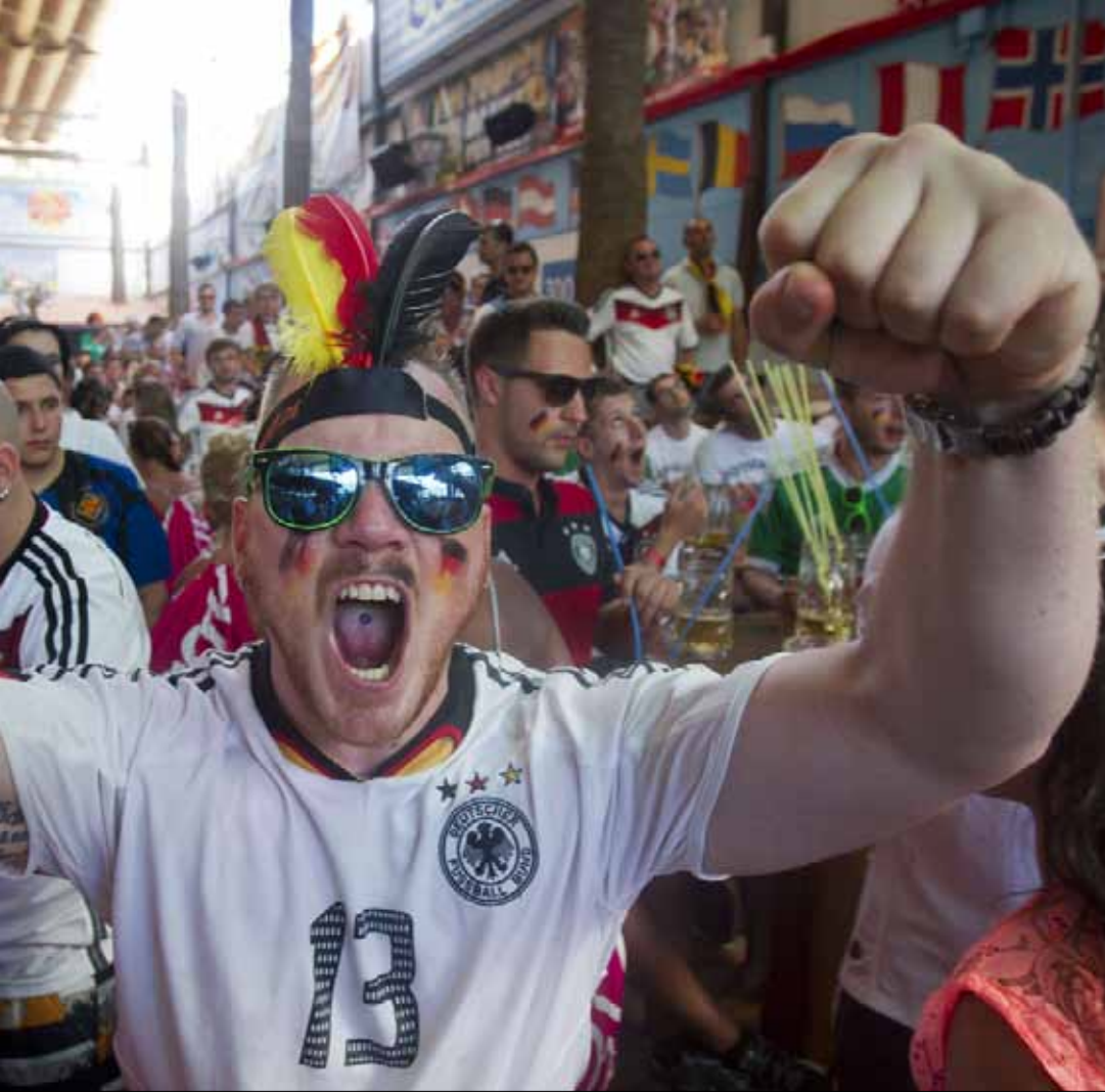
المونديال لكل الناس على تلفزيون لبنان

• أولاً: مدى وجوب استحصال الشركة على ترخيص من المراجع المختصة في لبنان حتى تقول إن لديها حقاً حصرياً في البث في لبنان وممارسة هذا الحق. ثانياً: إن العقدين الموقعين بين وزارة