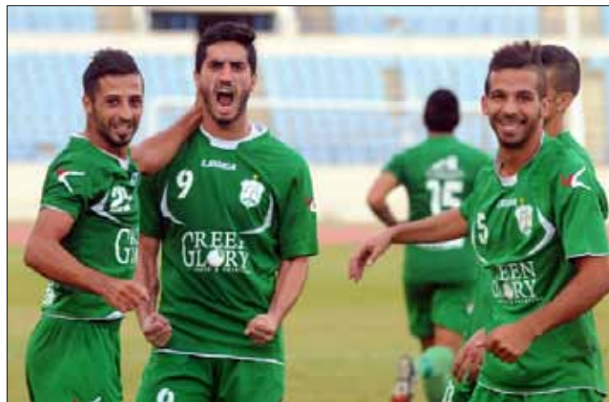
يحتاج الانتصار إلى ورشة عمل كبيرة كي يكون منافساً (أرشيف - عدنان الحاج علي)

حول ما قاله مدير النادي عباس حسن في حديثه إلى «الأخبار» أول من أمس، مستغرباً أن يصدر كلام عن موظف بحق عضو لجنة إدارية منتخب ومتطوع وهو في خدمة الانتصار منذ 17 عاماً.