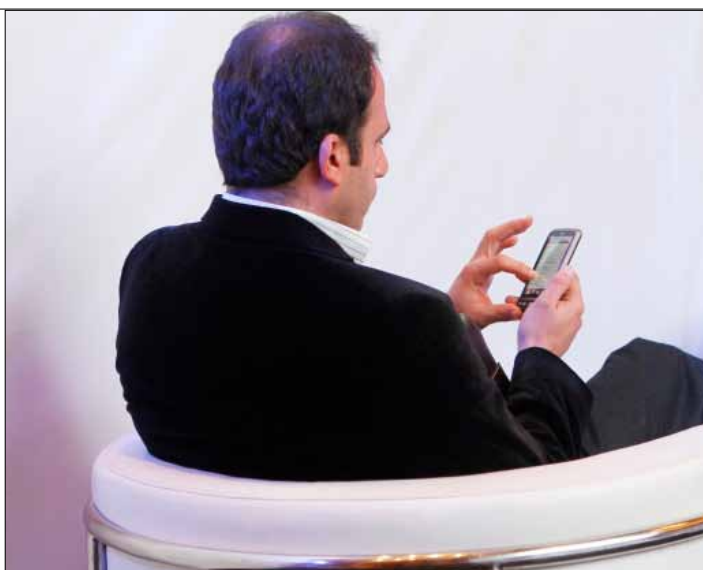
شروط للتخفيضات عبر ربطها ببنية الاسعار وطريقة بناء الكلفة واحتسابها