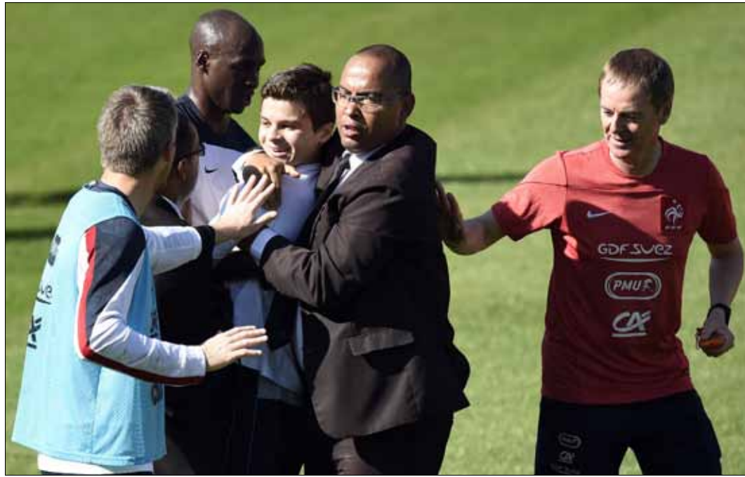
رجل أمن خاص يبعد مشجعا اقتحم ملعب تمارين المنتخب الفرنسي

فعلاً، كان الأمن النقطة الأهم التي أثارت اهتمام الجميع، من وافدين إلى البرازيل، ومن جهات منظمة ومشاركة في الحدث. لكن حتى يومنا هذا، مزت الأمور على خير. البعض قال إنه بسبب دخول الغالبية الساحقة من البرازيليين في موجة الموندياك، والبعض الآخر اعتبر أن الإجراءات المتخذة أرست حتى الآن بطولة من دون مشاكل أمنية تذكر. طبعاً، الحالة عينها عاشها العالم قبل أربعة أعوام عندما استضافت جنوب أفريقيا فعاليات الموندياك، وحيث معدل الجريمة مرتفع أيضاً. لكن البرازيل، بسبب ضخامة مساحتها الجغرافية وتنوع المشكلات الحاصلة في البلاد، تركت عملاً كبيراً أمام الجهات الأمنية المرافقة للحدث. وهذا الأمر درسته الحكومة البرازيلية في