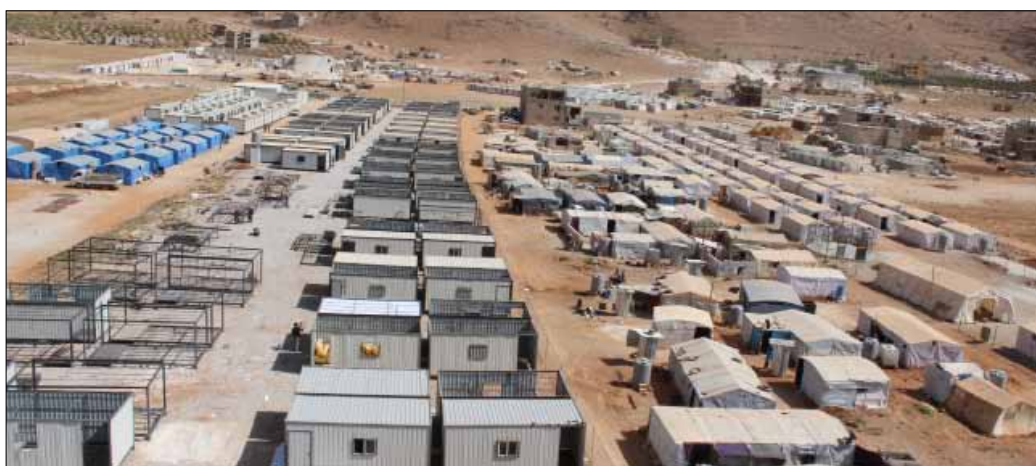
ورشة بناء الكرافانات في عرسال

استنجرت الارض لمدة 5 سنوات وتبلغ كلفة المجمع 980 ألف دولار