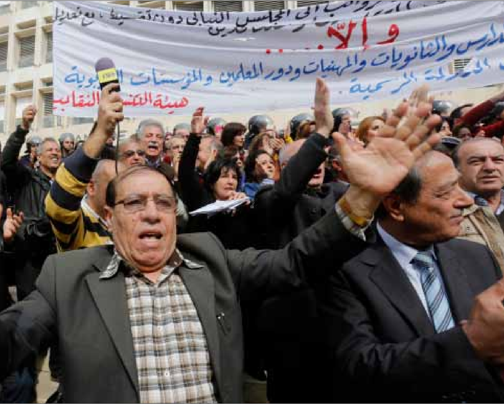
هل سجد مجلس الوزراء مخرجاً أم سيلجأ الموظفون إلى الشارع؟ (مروان طحطح)

لم يعد الهاجس الأمني وحده هو ما يلقي بثقله على لبنان. لبنان مُقبل على أزمة جديدة تتعلق بغياب التغطية القانونية لصرف رواتب موظفي القطاع العام نهاية الشهر الحالي. وزير المال علي حسن خليل حذر مجلس الوزراء في جلسته الأخيرتين