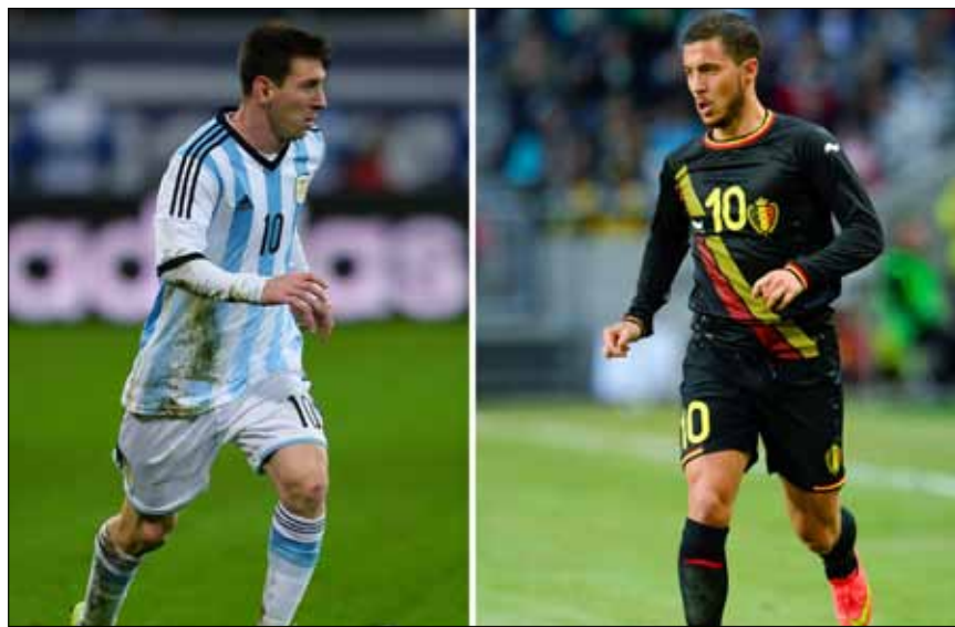
مواجهة مثيرة بين ميسي وهازار