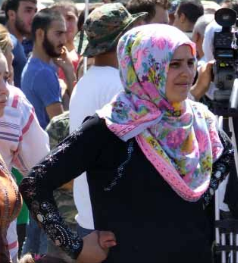
من اعتصام أهالي السجناء المخطوفين (الأخبار)

مع عدد من الموقوفين الإسلاميين في السجون اللبنانية، بعدما هددوا في الماضي باختطاف مدنيين لاستبدالهم بالموقوفين». وأشار المصدر إلى أن «العملية طويلة ومعقدة للغاية، وإذا لم تتم إدارة الملف بشكل أفضل مما حصل الآن، فإن الأمر قد يشكل انتكاسة لصورة الدولة وهيبة المؤسسات العسكرية». في حين، نفت مصادر المدير العام للأمن العام اللواء عباس إبراهيم لـ«الأخبار» ما تردد عن نية قطر عدم التوسط لإطلاق سراح العسكريين، على غرار ما فعلت في قضية مخطوفي أعزاز. وأكدت مصادره أن «الإمارة لم تبلغ الحكومة اللبنانية أنها لن تتدخل، بعدما كانت قد قطعت علاقاتها مع داعش وجبهة النصرة وأخواتهما». إلا أن أمانة قال لـ«الأخبار» إنه «تبلغ بالمعلومة لكن ليس من مراجع رسمية»، واصفاً إياها بـ«المنطقية»، لأن «أيدولوجية تلك الجماعات باتت بعيدة عن قطر وسياساتها، ولا سيما في هذه المرحلة». وزار وفد من الهيئة إبراهيم، أول من أمس، ووضعه في أجواء عملية التفاوض التي تجريها مع الإرهابيين، علماً بأن إبراهيم كان قد زار السفير السعودي على عواض عسيري، أول من أمس، وسط ترجمات عن وساطة ملكية قد تخوضها السعودية مع الخاطفين. كما تلقى اتصالات من عدد من أهالي الأسرى، يطالبه بالتدخل في الوساطة.