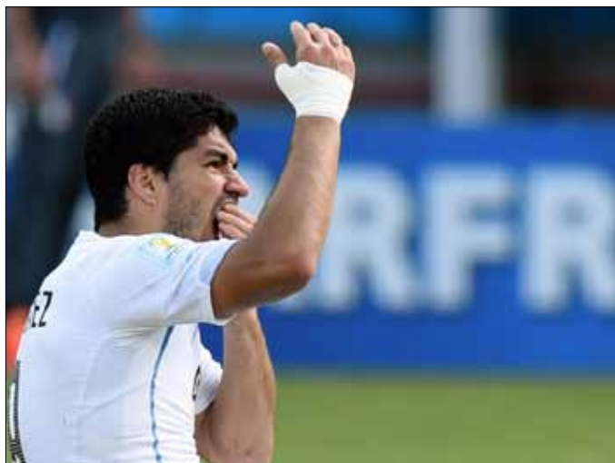
تنتهي عقوبة سواريز في 26 تشرين الأول المقبل

التي ارتكبها اللاعب، وسيكون له التأثير الهام على مشواره إلى ما بعد انتهاء فترة الإيقاف، أي