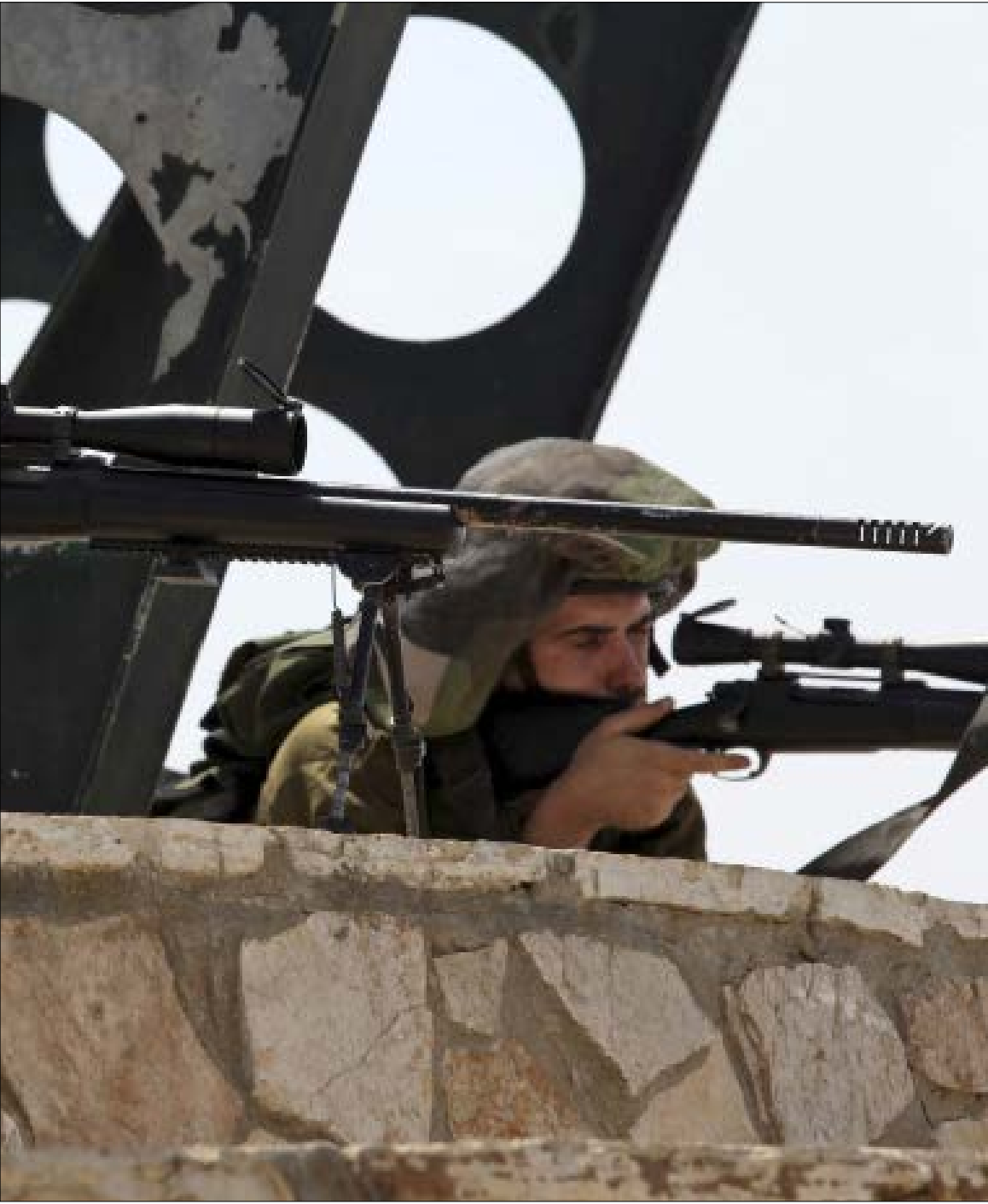
غانتس: هل حزب الله قادر على احتلال الجليل؟ نظريا نعم

إعلامية. صحف ومجلات ومواقع إخبارية عبرية على الإنترنت، عرض فيها رئيس أركان الجيش الإسرائيلي التهديدات الماثلة أمام إسرائيل. في المقابلة مع «معاريف - الأسبوع»، استفز سؤال الصحيفة غانتس، عن قدرات حزب الله والخسائر الإسرائيلية المرتقبة. سال المحاور «عن قدرات حزب الله وتهديده، وعن سيناريوات الخسائر جراء الآلاف من الصواريخ الدقيقة والثقيلة، التي ستجبي من إسرائيل أعداداً كبيرة من القتلى؟». الرد من غانتس كان تأكيداً لما ورد في السؤال، لكنه طلب في المقابل