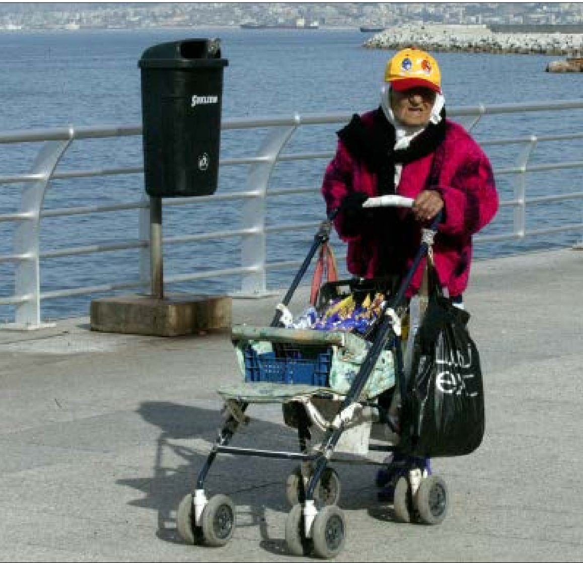
لن يستفيد إلا من سدد اشتراك فعلي في الضمان على 20 سنة