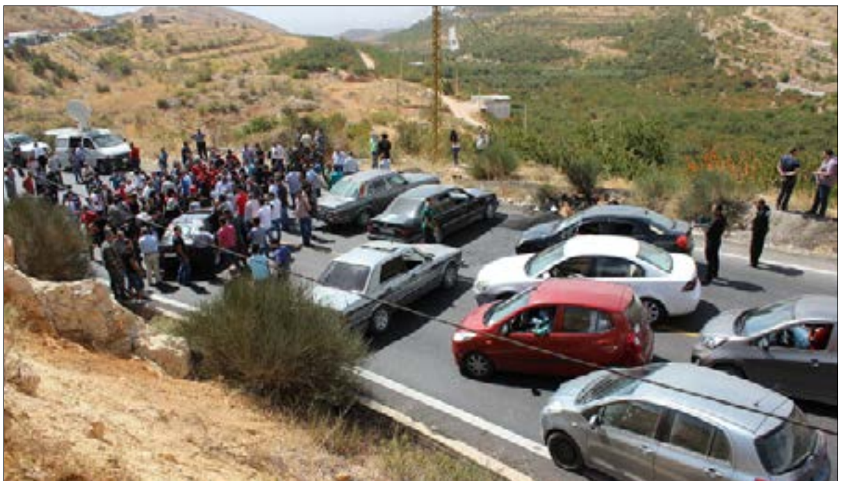
تسبب قطع طريق البيدر وترشيش بالقطاع صلب عن العاصمة (إسامة القادري)

طريق، ظهر البيدر مقطوعة لليوم العاشر على التوالي. التدايعات الاقتصادية التي يسببها قطع الشريان الأساسي للبقاع تتفاقم يومياً. إذ حذرت الهيئات النقابية وممثلو القطاعات الاقتصادية. أولئك من أمس. من ارتفاع الخسائر الاقتصادية. ولفتت إلى أن نحو ألف طن من الإنتاج البقاعي ينتظر من ينقله إلى العاصمة