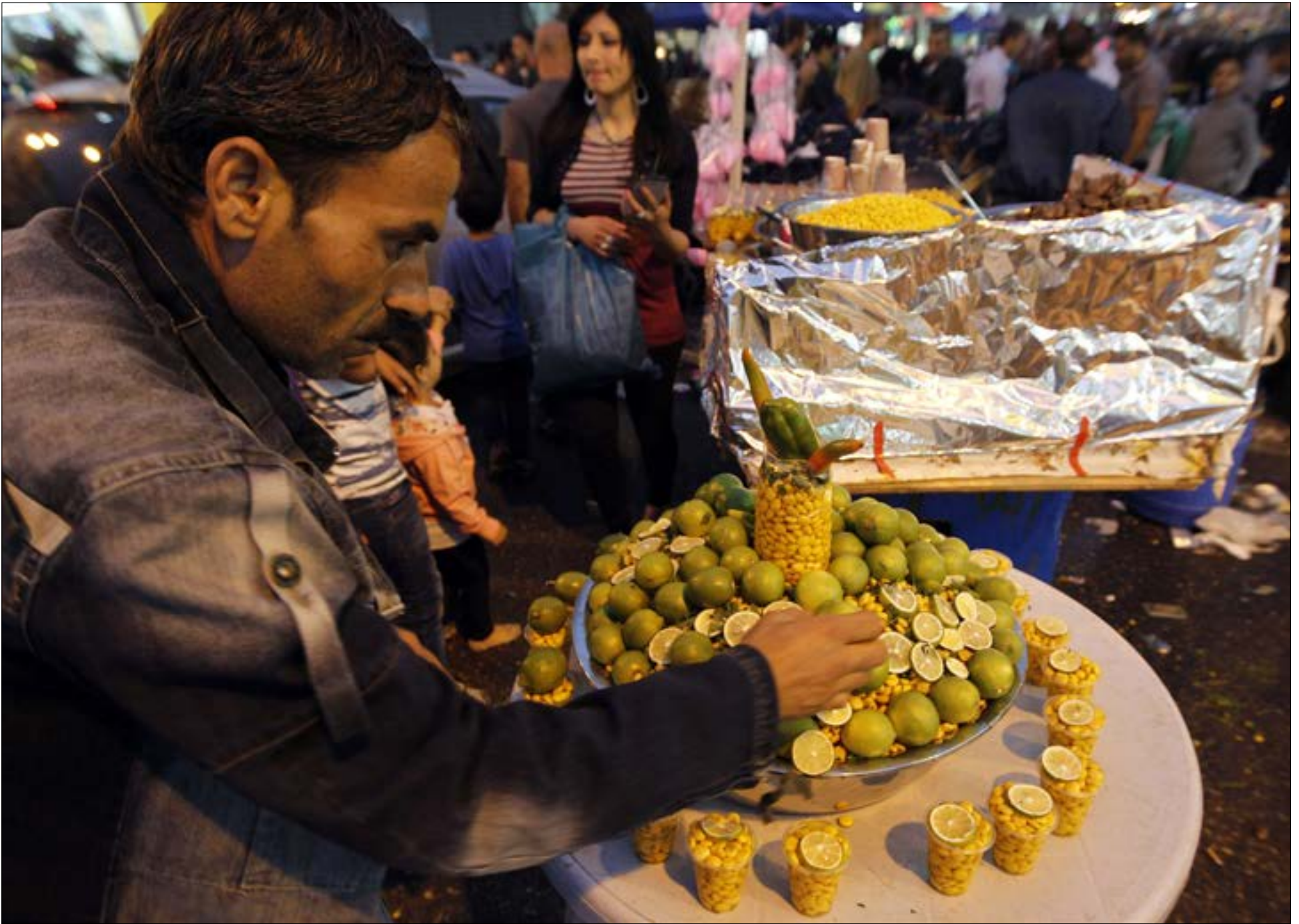
والفلسطينيون يحبون الحياة إذا ما استطاعوا إليها سبيلا. رغم الموت والحصار وفرض قوات الاحتلال إغلاقا كاملا على الضفة المحتلة وقطاع غزة ومدن الـ 48 حتى يوم الأحد، سيبتكر اطفال فلسطين العابهم وارجيحهم، وسيفرض الباعة بضائعهم لاستقبال عيد الاضحى