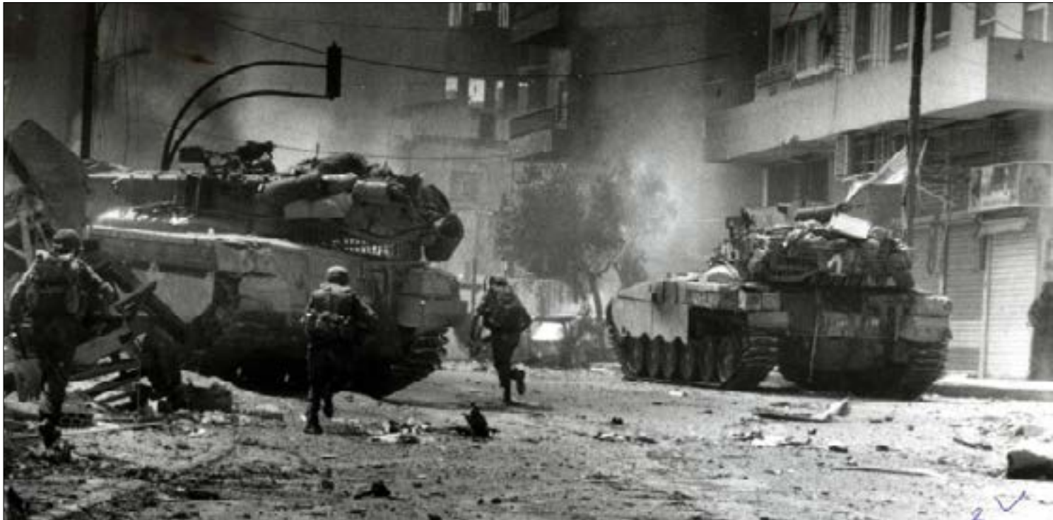
الهدف المعلن كان «سلامة الجليك»، لكن الهدف السري هو خطف «رزمة شرق أوسطية».

السرعة في إنجاز الخطة كانت ضماناً لتجنب الاعتراض الأميركي