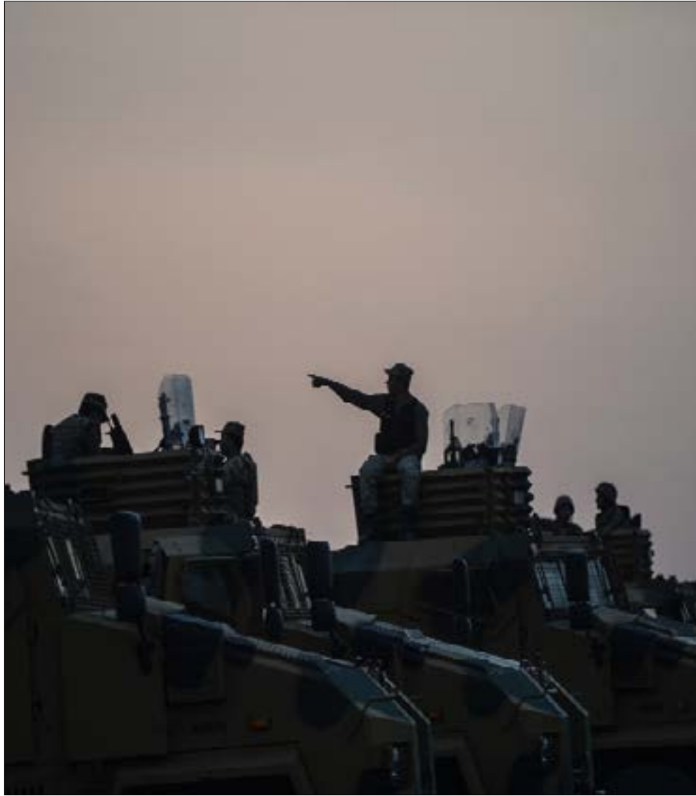
قوات تركية تنتشر في جنوب شرق البلاد بالقرب من الحدود السورية