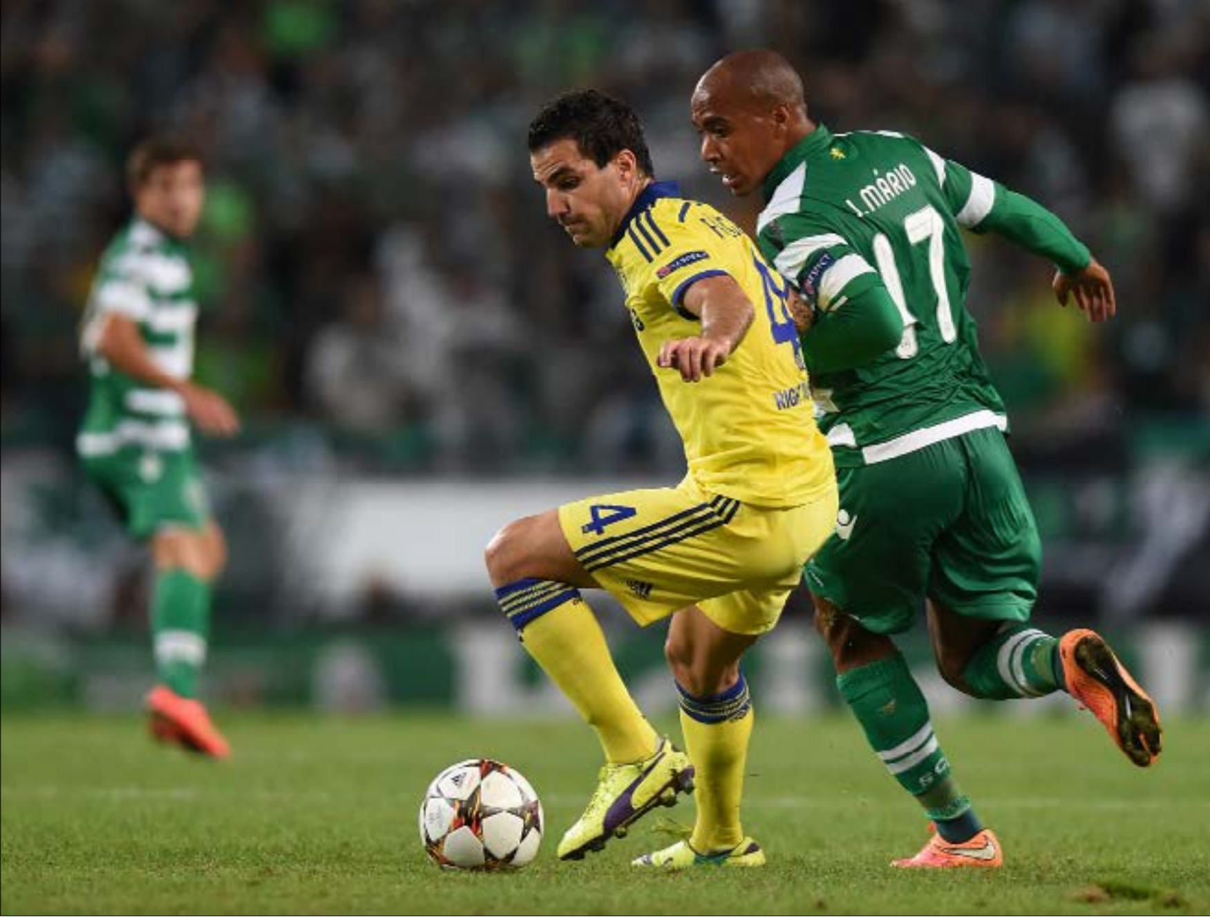
مواجهة أولى لفابريغاس أمام فريقه السابق

معه بدلاً من أرسنال الذي كان لديه خيار ضمه أولاً استناداً إلى بند من بنود انتقاله إلى «البرسا». وصل أرسنال وسيكس إلى حالة طلاق، رغم محاولة الأخير تجريد الأجواء مع فينغر وجماهيره، غير مرة. فينغر، لم يتحدث معه منذ انتقاله خلال الصيف إلى «البلوز». ردة فعل أرسنال كانت حاضرة أيضاً، فننادي «المدفعية» الذي كان يرفع حول ملعبه أعلاماً لبعض لاعبيه الأسطوريين، من بينهم سيسك، ذهب إلى إزالة صورة الأخير.