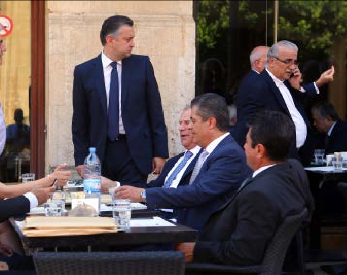
من مفاضلة متراخية بين التمديد او الانتخابات الى مفاضلة صادمة بين التمديد او الفراغ (مروان بو حيدر)

متراخية بين التمديد او الانتخابات الى مفاضلة صادمة لا تحتمل التأخير والتأجيل: التمديد او الفراغ في السلطة الاشرافية. ثالثها، على وفرة تهديد اكثر من فريق، واخصه المسيحيين، بالتصويت في مجلس النواب ضد اقتراح قانون تمديد الولاية اياً تكن مدته، والانتقال من ثم الى مجلس الوزراء لرفض توقيع القانون تمهيدا لاصداره ونشره، الا ان احداً حتى الآن على الاقل، ليس في وارد الطعن به لدى المجلس الدستوري على غرار تمديد 2013. ليس لاحد في الفريق المسيحي خصوصاً مصلحة سياسية في ابراز وهن المجلس الدستوري وعجزه مرة اضافية بعد اكثر من تجربة مزة اقتيد ليها رغم عنه. اولها بين عامي 2005 و2008