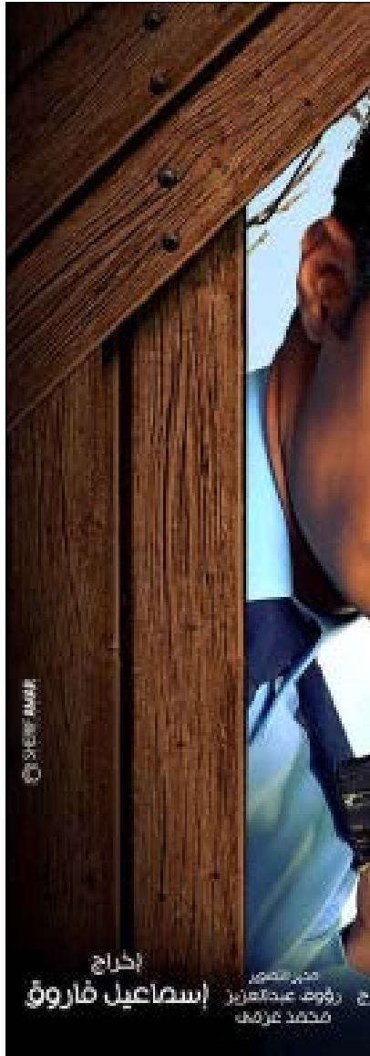
افيشان شريط «واحد صديقي»