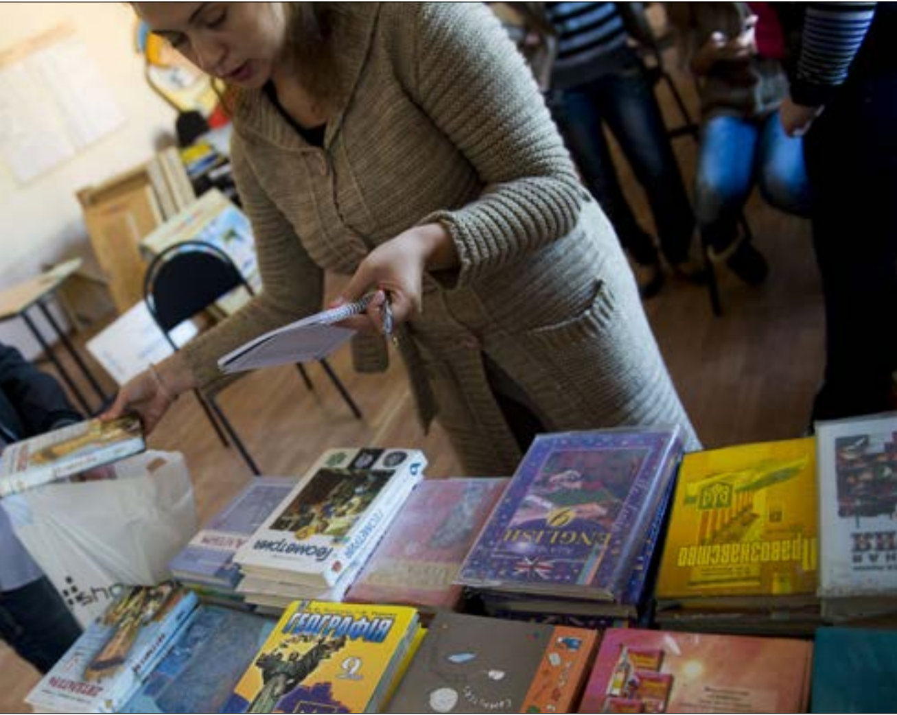
تحتاج دراسة الغرب إلى أكثر من تدريس اللغة الإنجليزية وإلقاء محاضرة من قبل استاذ زائر أميركي