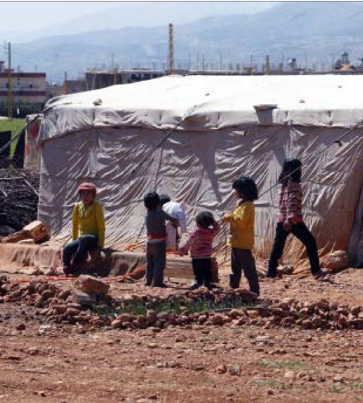
لا تحذره الميات والمساعدات المقدمة للجنين ضمن الموازنات العامة (هيلم الموسوي)