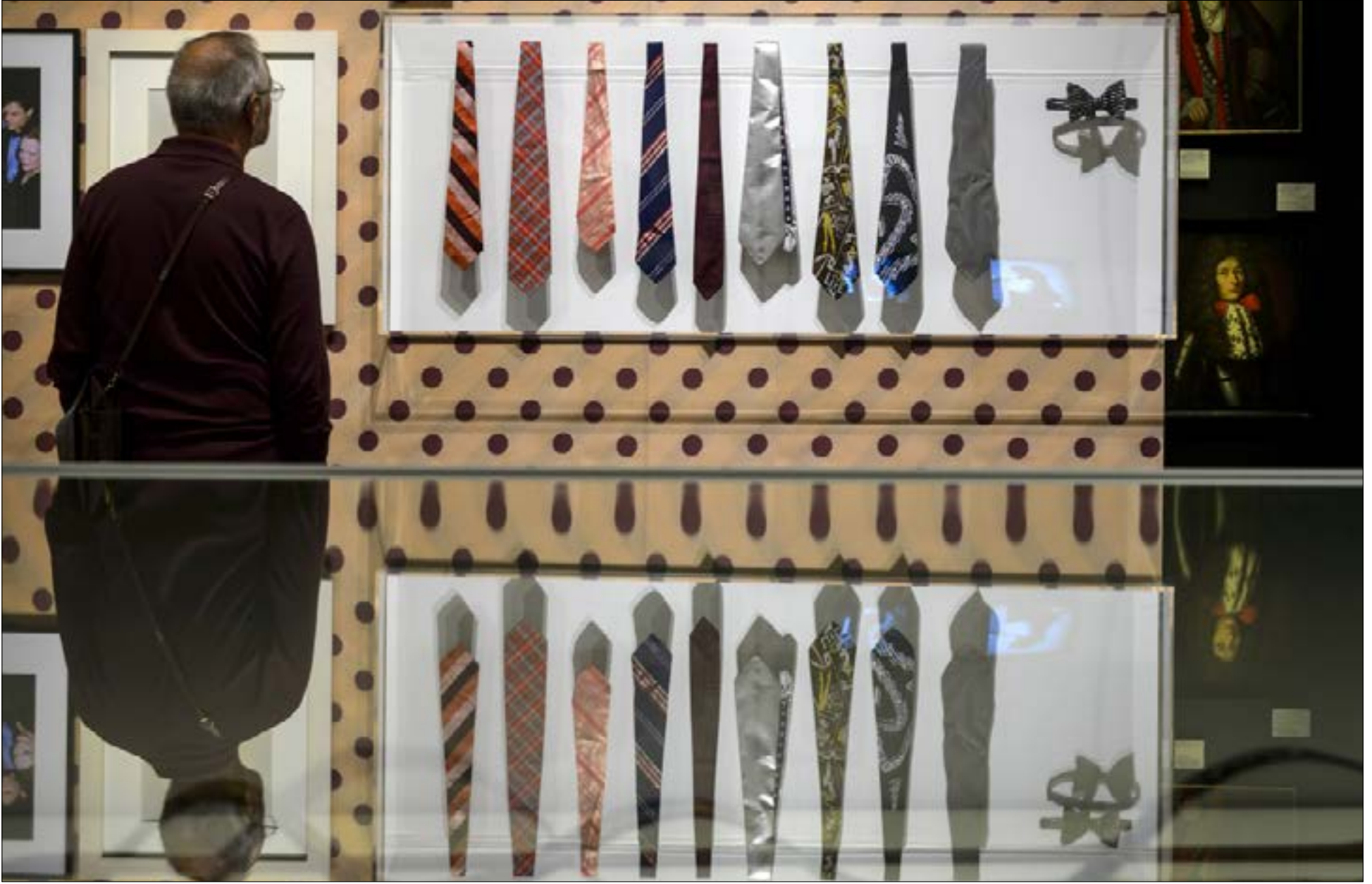
ما زال معرض The Tie. men fashion power مستمرا في مدينة زيوريخ السويسرية، على ان يغادرها في 18 كانون الثاني (يناير) المقبل. المعرض الذي لاقى نجاحا كبيرا في «المتحف الوطني السويسري»، يضم مجموعة واسعة من ربطات العنق المتنوعة التي تحمل توقيع راند البوب آرت الأميركي آندي وارهول (1928 - 1987)، والموضوعة في «متحف آندي وارهول» في مدينة بيتسبرغ في ولاية بنسلفانيا الأميركية.