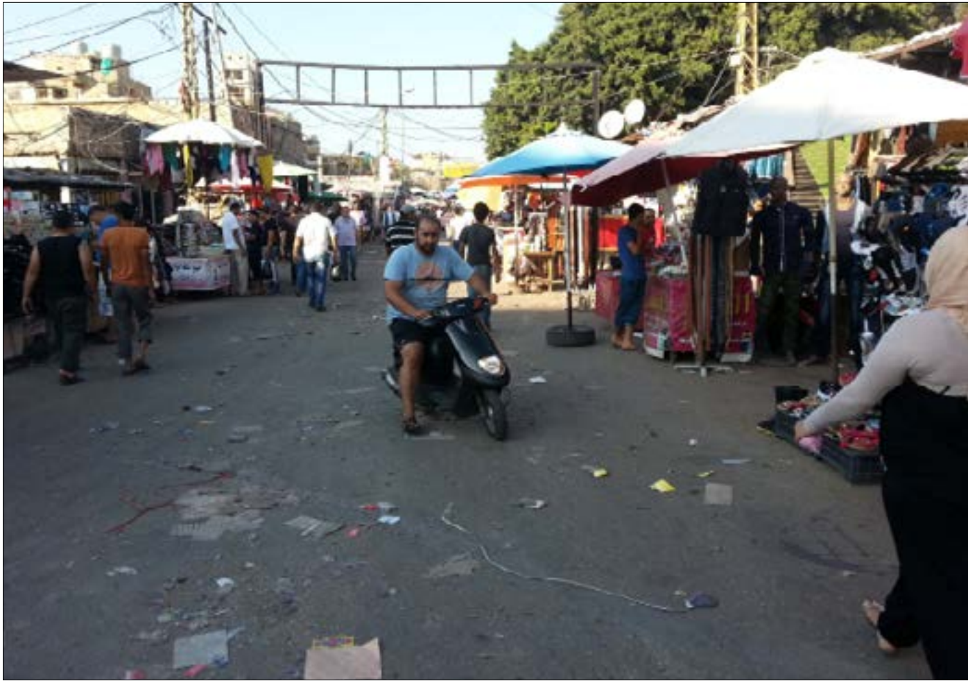
لا يمكنك ان تفهم صبرا إلا إذا كنت جزءاً من عالمها

قتل على قارعة الطريق، انتهت «مدة صلاحيته» عند الدولة الأمنية. قتله الدولة التي صنعته، ربه وكبرته وسمته. ثم قدمته «أضحية» على مؤائد ذوي «البشرة الناعمة». هو خريج صبرا، أشهر العشوائيات، الآلة الاجتماعية التي لا تنفك تصنع، على عين الدولة، مشاريع فوضى وضيام وقاتل