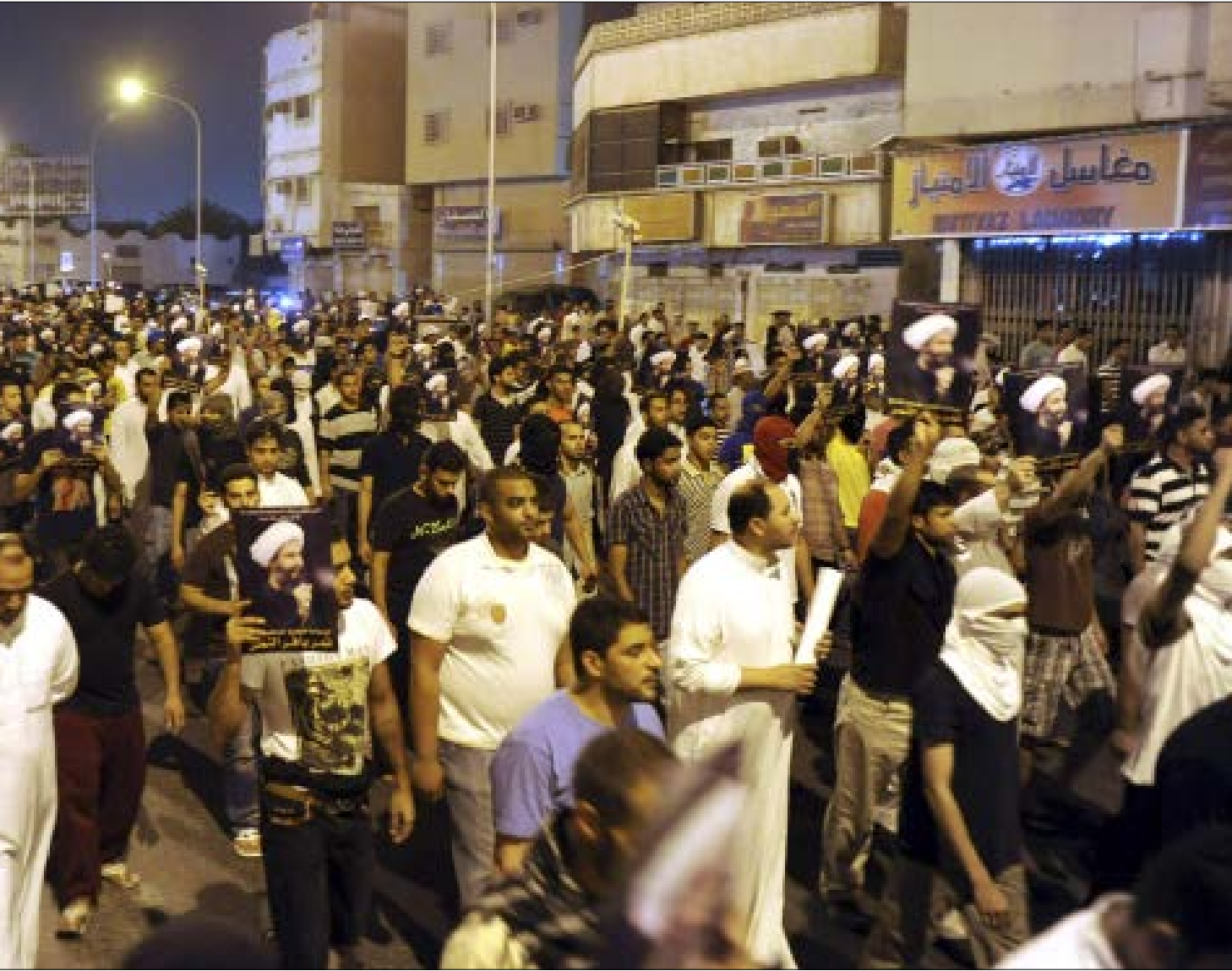
خرج اهالي المنطقة الشرقية امس في تظاهرات منددة بالحكم (الرياض)

يمنياً وتقف عند هذا الحد. وهو ما يفسر، على الأرجح، كلمات الفيصل في تلك المناسبة. لكن توالي الأحداث منذ ذاك اللقاء - الاختراق، إن كان على مستوى تمدد الحوثيين في أكثر من محافظة، أو على مستوى فرضهم، ليس فقط معادلة سياسية جديدة، وإنما قيادة جديدة تمثلت برئيس وزراء من اختيارهم، أطلق صفارة الإنذار في الرياض، التي كانت قد حركت خلاياها من تنظيم «القاعدة» هناك ومعها القبائل الموالية لها. صفارة دوت بأعلى طاقتها، على لسان الفيصل نفسه، مع بلوغ «أنصار الله» البحر الأحمر، ليأتي بعدها بيومين القرار الذي سبق أن حذرت طهران منه بقتل الشيخ النمر، علماً بأن الرجل لا ينتمي إلى مدرسة فقهية وسياسية من غير المحسوبين على الجمهورية الإسلامية. محاولة الرياض وضع صراعها مع شعبها ومطالبه في إطار إقليمي ليست جديدة. هي تعمد دوماً إلى حرف الأنظار، للإيحاء بأن كل تظلم في داخل المملكة وراءه «أيام فارسية». لكنها هذه المرة تضيف إلى غايتها السابقة هدف آخر: ابتزاز طهران. كل عويل الفيصل، ومعه القرار الخاص بالنمر، يبدو أن الغاية منهما إيصال رسالة للمسؤولين الإيرانيين تقول «تعالوا ففاوضونا». هي مقامرة إقليمية بدماء الشيخ الأسير.