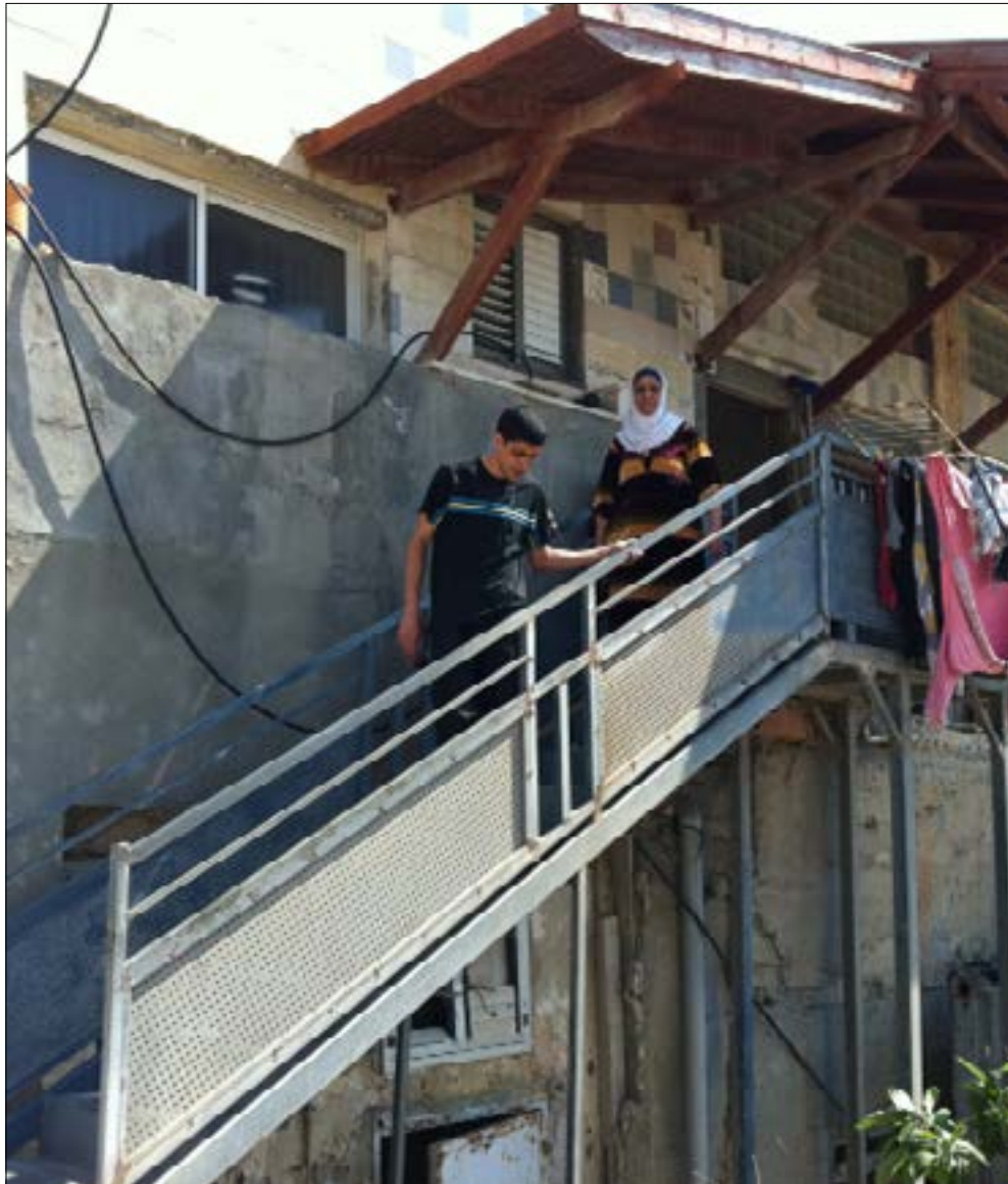
حي العجمي يتعرض لحملة تهويد لإقامة مبانٍ كبيرة للمستوطنين على انقاض منازل المواطنين العرب البسيطة (الأخبار)

إزاء هذه الحملة الشرسة، أطلق سكان يافا حملة بعنوان (يافا ليست للبيع)، وقالوا إن هدفهم مواجهة السياسات الإسرائيلية الرامية إلى تضييق الخناق عليهم وصولاً إلى تهجيرهم عن