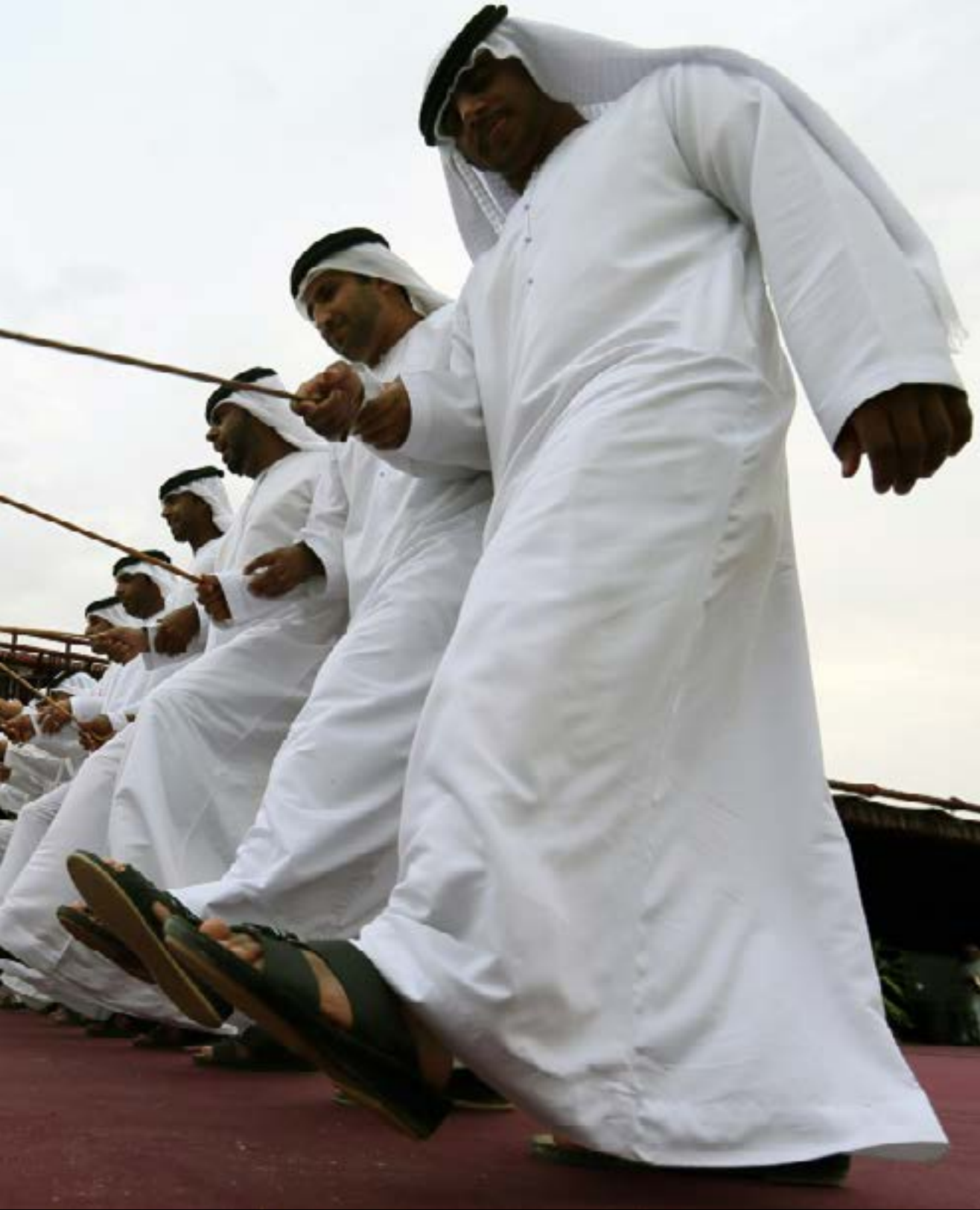
ياتي معظم البترول الإماراتي من أبوظبي التي تشكل نحو 86% من أراضي الدولة (أ. ف. ب)

وقد استثمر محمد بن زايد، الأخ غير الشقيق لرئيس دولة الإمارات، خليفة بن