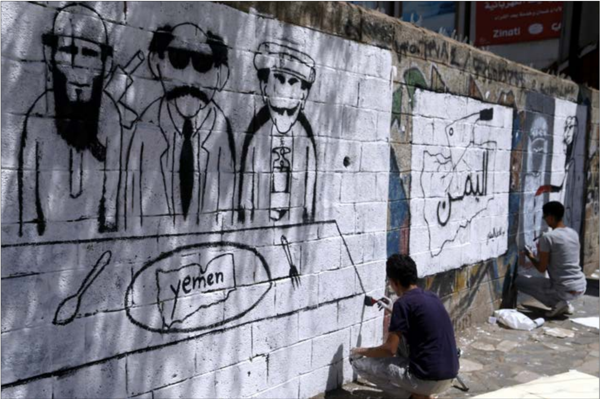
خرج عدد من فناني الغرافيتي اليمنيون إلى شوارع صنعاء وزينوا جدران مجموعة من شوارعها برسوماتهم، مصورين العنف الذي تشهده العاصمة في الفترة الأخيرة. الخطوة تأتي في إطار محاولة التخفيف من حرارة الواقع، وتجميع بعض من قباخته.