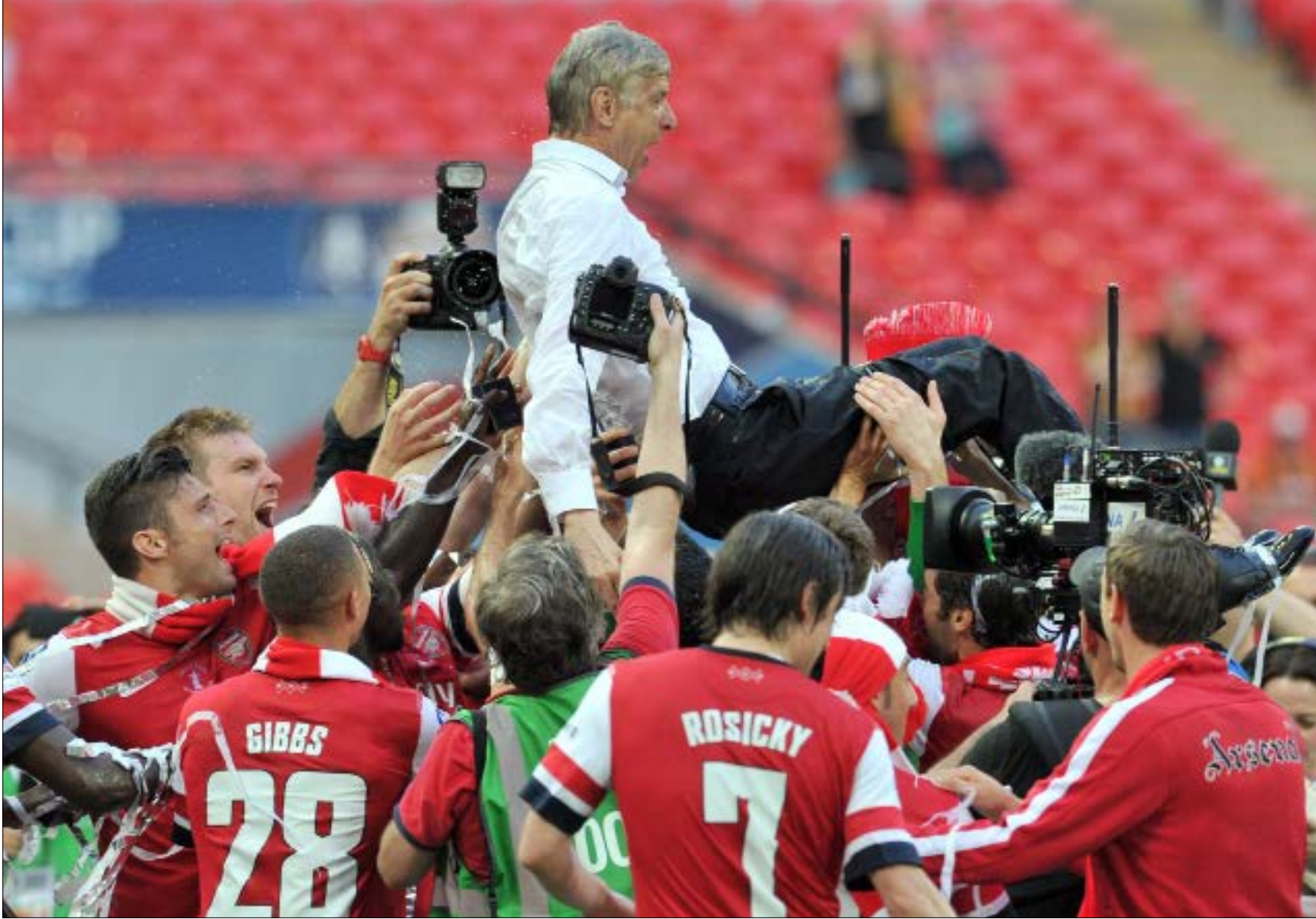
لقب كأس انكلترا في الموسم الماضي لم يقنع جماهير ارسنال (ارشفيف)