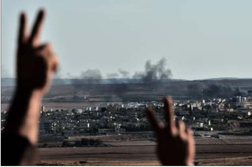
الفضاء الأساسي في تراجع التنظيم يعود إلى إصرار «الوحدات» على الدفاع عن المدينة (أ ف ب)

تواصل تراجع تنظيم «الدوبة» في عين العرب، فيما تحدثت مصادر كردية عن تنسيق مباشر مع «قوات التحالف»، أكدت مصادر «جهادية» أن «داعش» يحضر ل«مفاجأة في شكل محرقة»