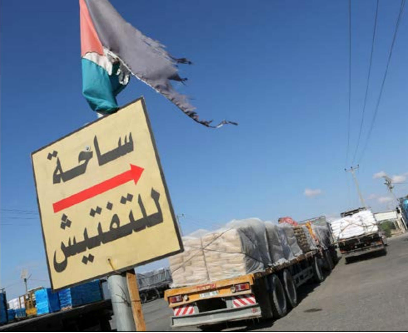
كلمة احتلال باتت تشير فقط إلى الأراضي المحتلة في عام 1967 (أ. خ. ب.)

وفي هذا السياق، استورد الإعلام العربي قللاً بالغاً على «سايكس - بيكو» وكان السيد سايس والسيد بيكو تربيًا في أحياء بيروت أو دمشق أو القاهرة. تحوّلت اتفاقية استعمارية لتقسيم العالم العربي على مقاس التنافس البريطاني. الفرنسي (والروسي قبل «الثورة») إلى مشروع قومي عربي، والندب عليها بات من واجبات العروبة المستحدثة. الكل يعتر عن خشية من مصير «سايكس - بيكو». لماذا هذا القلق على حدود «سايكس - بيكو»؟ ولماذا الخوف على قدسية اتفاق استعماري على تقسيم تركة الإمبراطورية العثمانية؟ وهذا الخوف من الإخلال بمضامين اتفاقية «سايكس - بيكو» هل هو نابع من تقدير كل مضاعفات ونتائج الاتفاقية المذكورة على مَرّ القرن الماضي؟ أم أن الخوف هو ترجمة لمخاوف المصالح الغربية التي أنتجت الاتفاقية؟ ها نحن نكاد «نحتفل» بذكرى مرور قرن واحد على عقد الاتفاقية، فهل نتهيج بها؟ وهل نشكر الراعي المستعمر على ما فعله بنا من خير وتوحيد للجهود والحدود؟ هذه واحدة فقط من مسلمات الإعلام