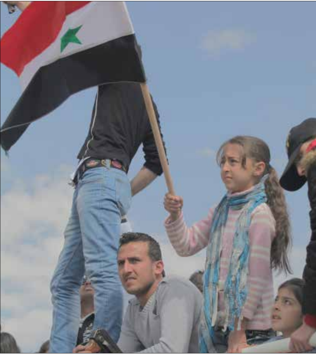
دعم المسيحيون واليزيديون في العراق ثمن الحياض تهجيراً وقتلاً

سقط أكثر من 27 مقاتلاً من «الدفاع الوطني» في معارك مع «جبهة النصرة» في جبل الشيخ، غالبية من الدروز، فخيم التوتر على قرى الجبل السورية واللبنانية والفلسطينية. وفي مقابل قتال الدروز الجماعات التكفيرية إلى جانب الجيش السوري وحزب الله، ثمة من يروج لـ «التدخل الإسرائيلي» ونظرية «التحيد»