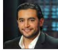
هانى سلامة يحكم