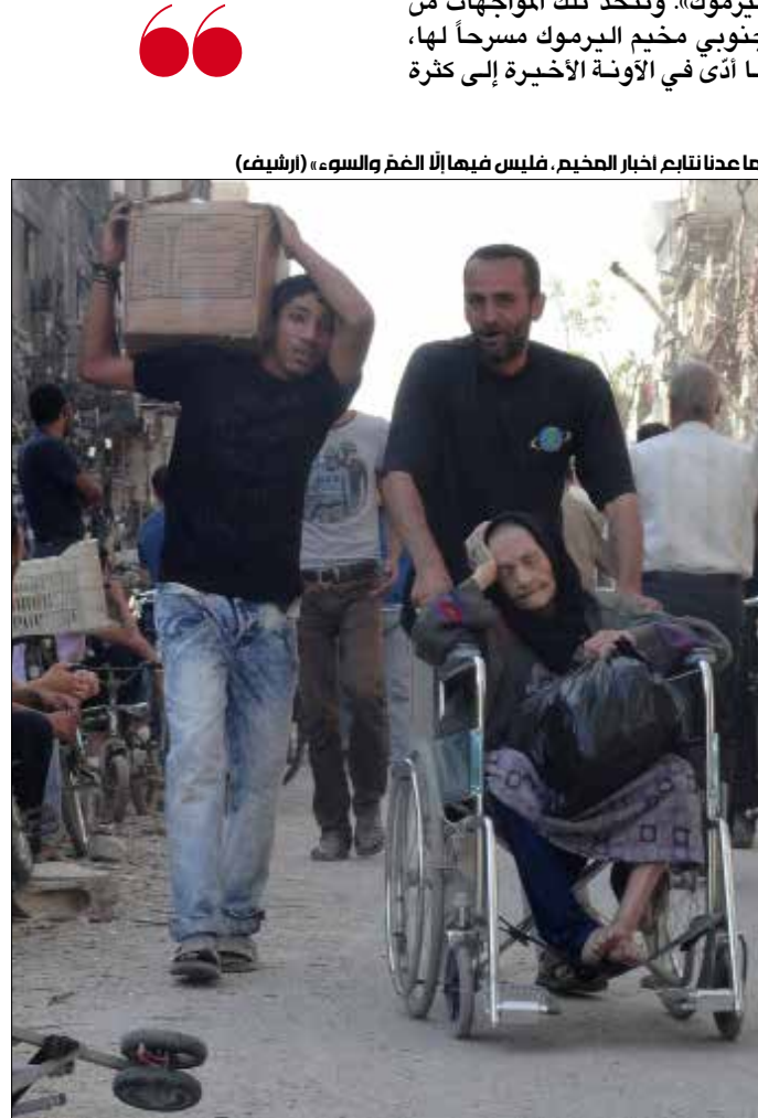
«ما عدنا نتابع أخبار المخيم، فليس فيها إلا الغم والسوء»

ما استطاعت التسويات إنجازه هو تحييد عشرات المسلحين فقط