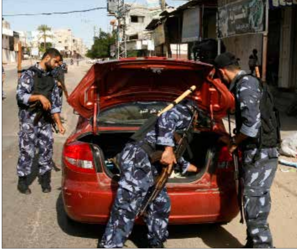
أقامت «داخلية غزة» نقاط تفتيش بعد سلسلة الانفجارات التي استهدفت بيوت قيادات في «فتح»

وإذا كان هناك من يريد أن يتهم القيادي المفصول محمد دحلان بالتخطيط في الإمارات والإيعاز إلى «بقايا عناصره» في غزة لتنفيذ الهجمات، فإن الأولى به مراجعة مستوى الضبط الأمني في القطاع، وتذكر أن الانفجارات وصلت إلى بيوت الطرفين من مؤيدي عباس ودحلان. وبدلاً من انتظار لجان تحقيق لا تخرج بنتائج كالعادة، على عباس أن ينهي حفلة الإذلال لموظفي «حماس» حتى ولو بدفعات مالية أولية، فيما على من نفذ هذا العمل، أياً كان، أن يتذكر أن هناك أولويات أخرى، إن كان يفقه «فقه الأولويات»، لأن فلسطين لا يقصها اسم «داعش» وعمل «عصابات الليل»، فيما تنهض حالة انتفاضة «لا فصائلية» يقودها أبناء القدس.