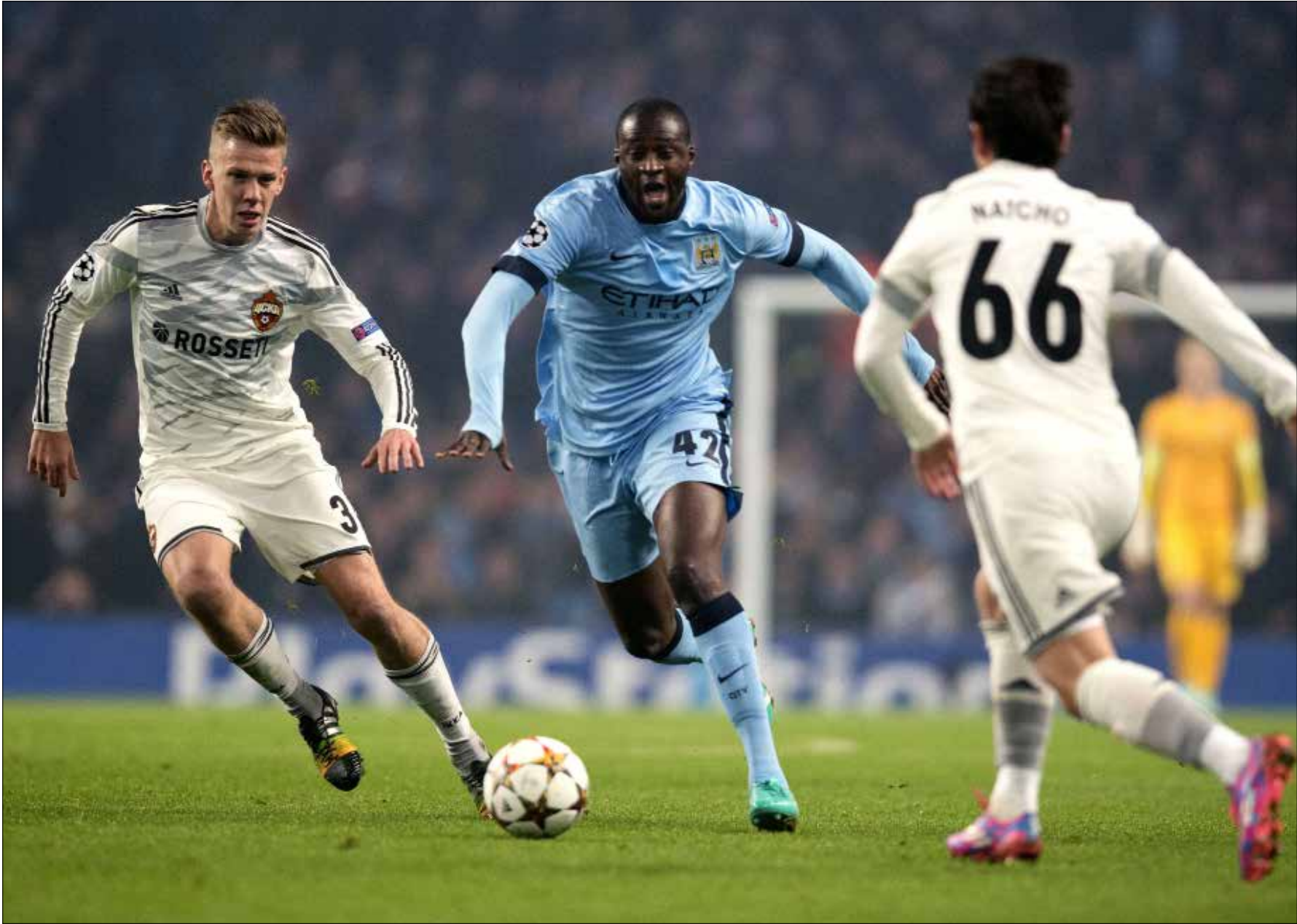
يستحق توريه الانتقادات فهو بدأ عبثاً على الفريق في الفترة الاخيرة

النتائج التي يحصدها الفريق. فإذا كانت النزعة الدفاعية «الوحشية» قد غابت عن توريه أخيراً، فهذا ربما لأنه لم يجد إلى جانبه مقاتلين آخرين، فأهمل واجباته الدفاعية من منطلق اليأس من وضع قائم. كذلك، يضاف إلى هذا الأمر نقطة حاسمة أخرى، هي غياب الإسباني دافيد سيلفا، الذي سبب فراغاً فكرياً لدى رجال بيلليغريني، الذين اعتادوا وجود رجل «بخترع» لعبة ما ليصل زملاؤه إلى الشباك من دون عناء كبير، وهذا ما افتقده الفريق منذ إصابة صانع الألعاب الموهوب. وهنا يمكن ربط ما يحصل بالاستراتيجية غير الدقيقة التي بني عليها سيتي، إذ رغم تخمة النجوم في تشكيلته فإنه ليس لديه أي لاعب قادر على الحسم في المباريات الصعبة، إذ في نهاية المطاف الكل يعرف أن الأرجنتيني سيرجيو أغويرو ليس مواطنه ليونيل ميسي أو البرتغالي كريستيانو رونالدو اللذان يحملان فريقيهما على اكتافهما في الاوقات الحاسمة. وهذا الأمر ينطبق على نجوم آخرين مثل البوسني إيدين دزيكو والمونتينيغري ستيفان بوفيتيتش وغيرهم. مشكلات فريق بيلليغريني كثيرة، وقد كشفت أخطاء الفرنسيين غايل كليشي وإلياكيم مانغالا، أن المسألة تتعدى مرور الفريق بيوم سيئ، بل إن عامل التركيز مفقود لدى غالبية أفراد، والدليل ما ظهر عليه البيدلان الفرنسي الآخر سمير نصري والبرازيلي فرناندينو. سماء سيتي الزرقاء باتت ملبدة بالغيوم السوداء وعاصفة مرتقبة في وقت قريب.