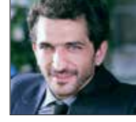
السينما «المستقلة» مصرية