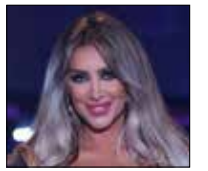
مايا ترقص لك ترقصا