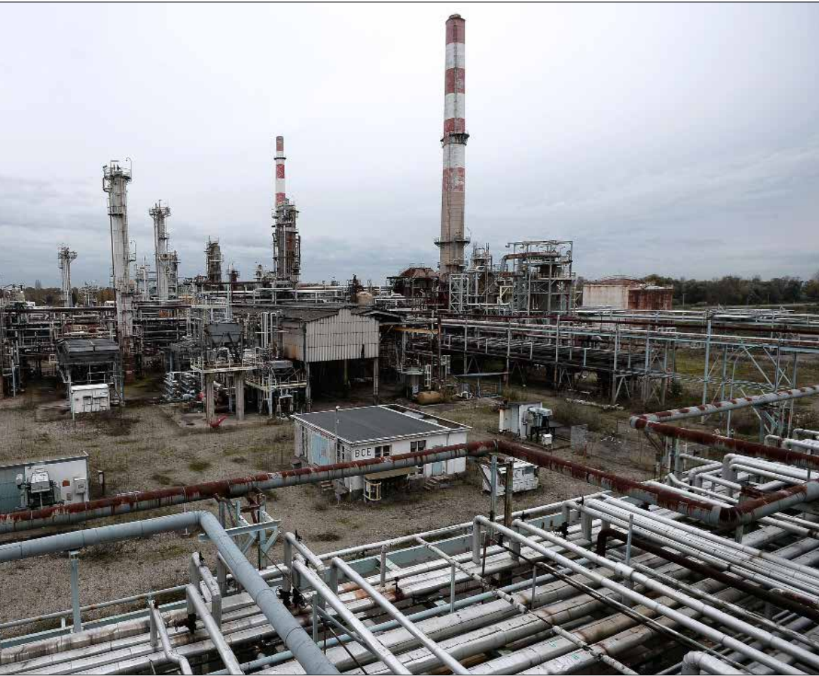
على الدولة ان تحافظ على سرية جميع المعلومات ذات الطبيعة التجارية (الف ب)

المعتمد تصاعدياً، فكلما ارتفعت أسعار البترول أو ازداد الإنتاج أو انخفضت تكاليف الاستكشاف والتطوير والإنتاج، كبرت حصة الدولة من بترول الربح. حصرت هيئة إدارة قطاع البترول عدد العناصر الخاضعة للمزايدة بعنصري سقف استرداد بترول الكلفة وتقاسم بترول الربح بين الدولة والشركة بالاستناد الى العامل ر، وذلك بهدف تحصيل الحصة الأكبر من عائدات البترول، كذلك إن جعل سقف استرداد التكاليف عامل مزايدة يمكن الدولة من الاستحصال على حصة أكبر من بترول الربح بالإضافة إلى الإتاوة منذ بدء الإنتاج.