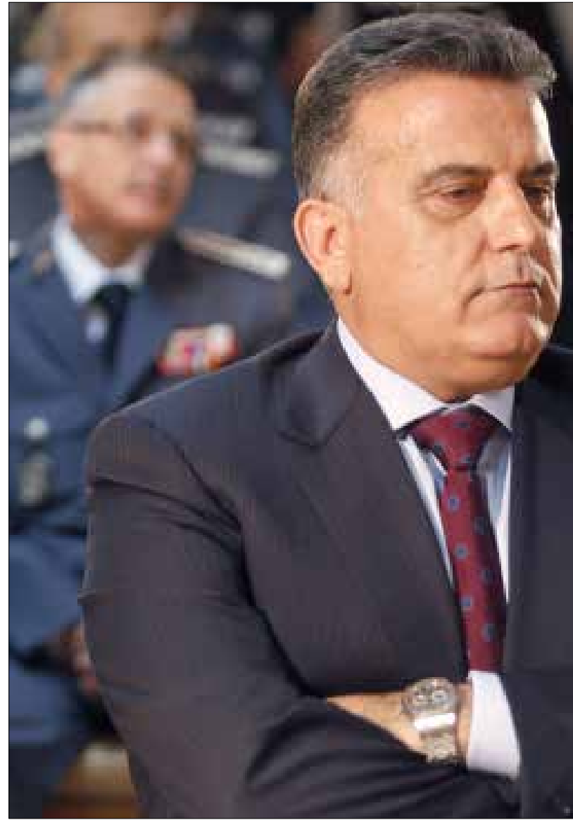
هاتفك نتيجة. على الأقل بالنسبة الى جزء من الملف مع «جبهة النصر» (هيلم الموسوي)

هل هي ثقافة عامة؟ حب اطلاع أو سعة معرفة أو رحابة أفق فكرية؟! بل هي ذهنية الوصاية الموروثة في الشخصية القاعدية لمكان سُمي وطناً، في الوجدان والمتخيل والذاكرة. ومن ثم المستدخلة والمستتبنة والمبلوغة بوعي ولا وعي ودرية إذعان وذل وخضوع وخنوع، عند غالبية سياسية ساحقة. وصاية تقتضي الأمانة التاريخية الاعتراف بأنها تطورت مع مرور الزمن فواكبت الحداثة والعصرنة. في زمن الوصاية العثمانية - التي لم تدم قرناً بالمصادفة أو لسباقات إقليمية، بل نتيجة طواعية طبقة سياسية داخلية بلدية جداً أيضاً - في زمن وصاية السلطنة، كانت رتب التبعية لدى الوصي من نوع «شيخ» و«بيك» و«باشا». بعدها تقدم الزمن، فتطور «جارغون» الوصاية عندنا. حتى أننا في زمن الوصاية السورية - والتي للأسباب نفسها كذلك دامت عقوداً ثلاثة - صارت رتب التبعية عندنا مستقاة من قاموس الدولة الحديثة: نائب ووزير وصاحب دولة