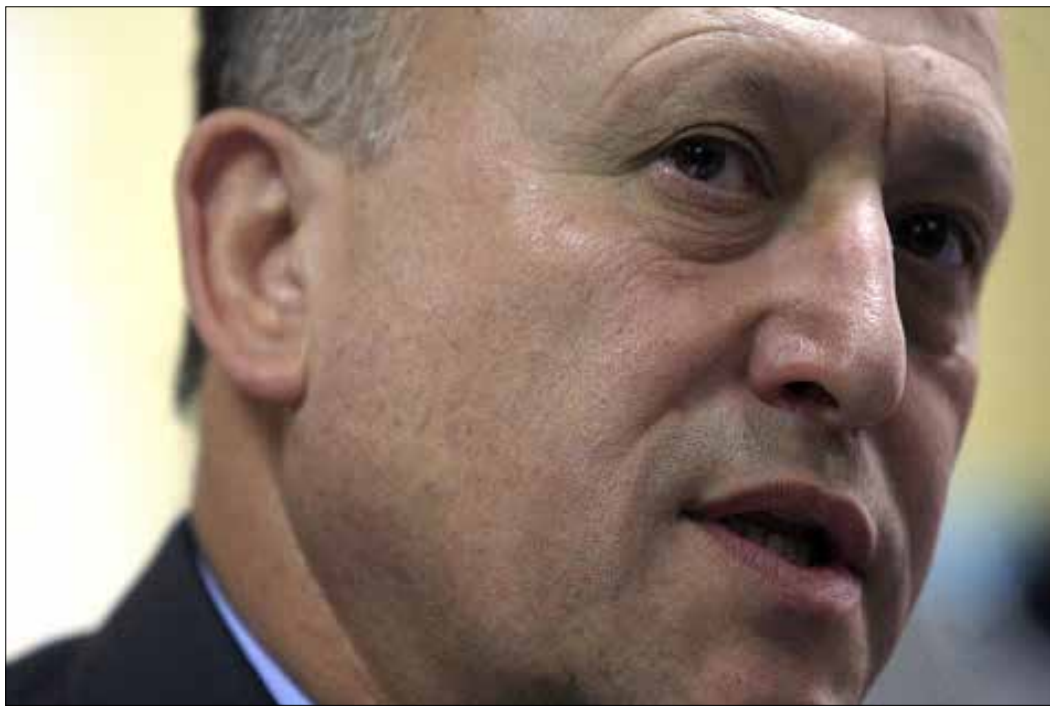
أمر ريفي بصرف مبلغ 877 مليون ليرة لمرافقه الشخصي، لتأمين المازوت الأخضر،

خلال الأيام الماضية، خرجت إلى العلن بعض التسريبات عن سرقة محروقات من مستشفى رفيق الحريري الحكومي. المكتوم من الملف هو الجزء الأكبر منه: مئات ملايين الليرات المهدورة والمسروقة في المديرية العامة لقوى الأمن الداخلي، في عهد مديرها العام السابق اللواء أشرف ريفي. التحقيقات طاولت بعض حاشية وزير العدل، فأخرج مرافقه سريعاً من القضية