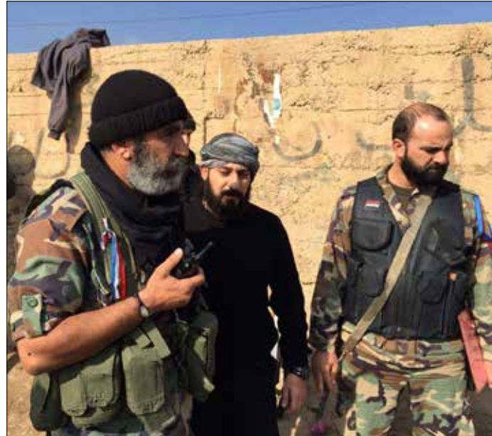
العديد في الجيش السوري عصام زهر الدين في مطار دير الزور قبل يومين

شيء من الارتياح يشعر به مواطنو مدينة حلب مع الإجراءات الجديدة التي اتخذتها قيادة شرطة المدينة بإزالة عدد من الحواجز. وفتح العديد من المعابر أمام حركة المرور