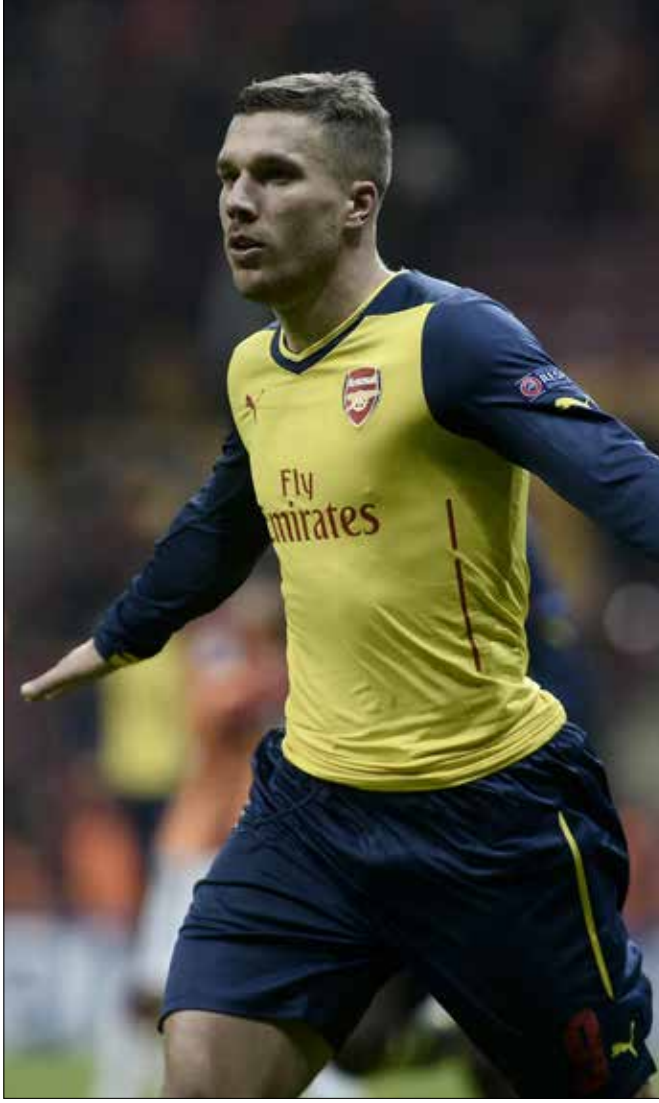
بودولسكي مطلوب من عدة أندية كبيرة

على بودولسكي أن يقف أمام تجاهله تماماً، وعدم الاكتفاء بالكلام أمام وسائل الإعلام. سوق الانتقالات الشتوية على الأبواب، وأندية من إنكلترا وألمانيا وإيطاليا أبرزها بوروسيا دورتموند وشالكه، ويوفنتوس ونابولي تسعى إلى التعاقد معه، وإن كان يحده أمل «أخرق» بالبقاء والعودة إلى ما كان عليه لحظة مجيئه، ذاك اللاعب الذي يحب مدربه أن يشاهده أمام المرمى، فلا يجب أن يلوم بودولسكي إلا نفسه، بعد أن وضع هو نفسه في هذا الموضوع. حاله كحال البرازيلي ريكاردو كاكّا أيام لعبه مع ريال مدريد تحت قيادة المدرب البرتغالي جوزيه مورينيو. كثر الحديث عنهما، وتناقضت التصاريح، لكن بالنهاية خسر كاكّا نجميته. رحل إلى ميلان، ثم إلى أورلاندو سيتي الأميركي الذي أعاره إلى ساو باولو البرازيلي. صحيفة «أس» الإسبانية ذكرت أن هذا كان هدف مورينيو: عدم انتقال كاكّا إلى فريق كبير. لا يعلم أحد ما هو هدف فينغر تجاه بودولسكي، لكن إذا ما استمر على حاله، فهو بطريقة نحو الهاوية.