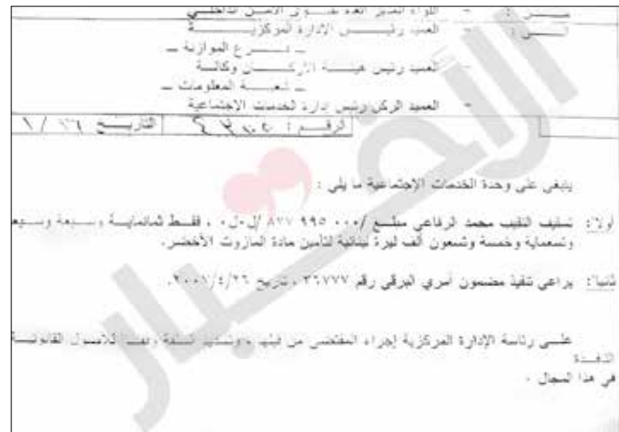
أحد الوثائق التي يجري التحقيق فيها