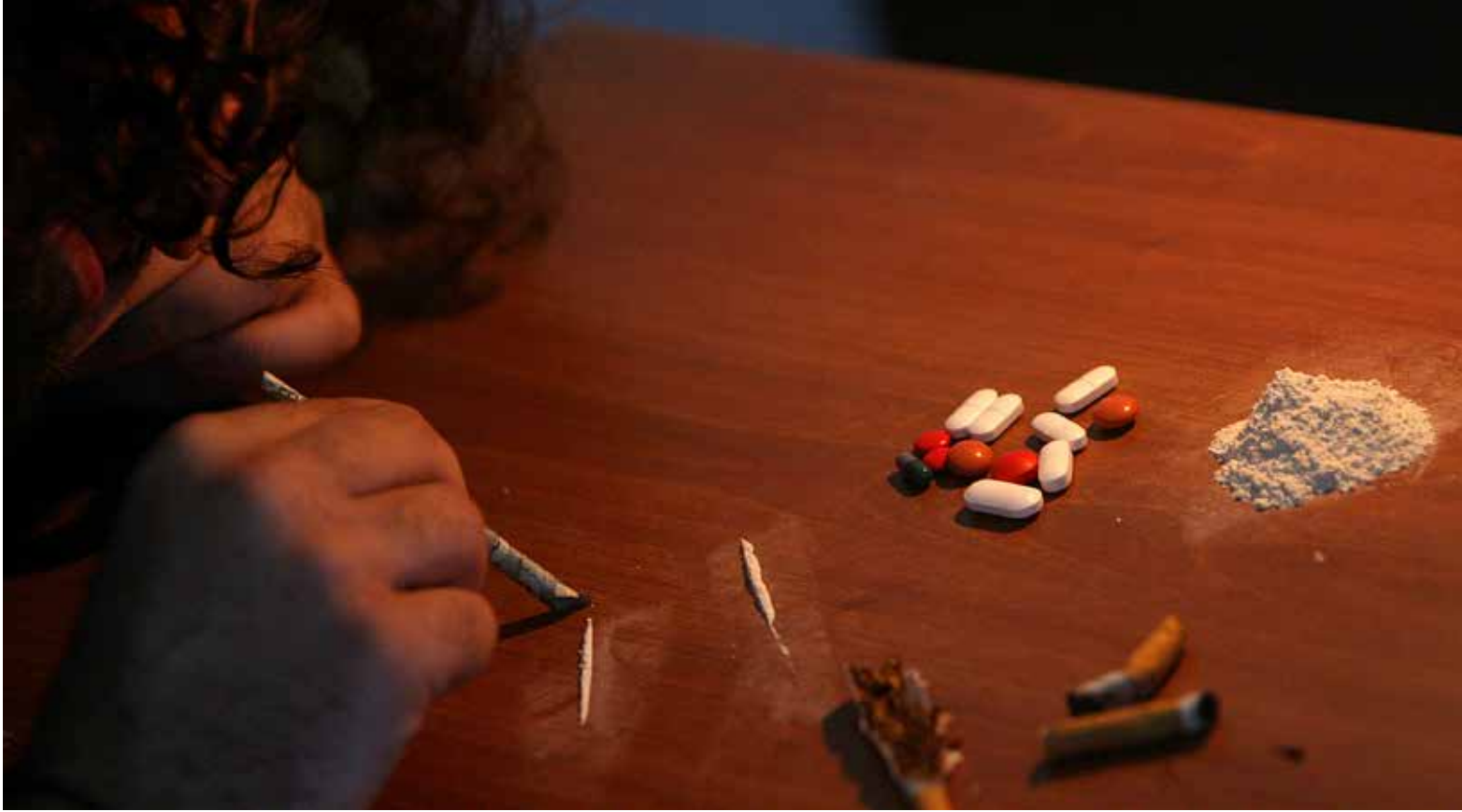
تؤمن زراعة الحشيشة مداخل محترمة للمزارعين وللتجار الذين يشتغلون بها (مروان طحطح)

نعم، تؤمن زراعة الحشيشة مداخل محترمة للمزارعين وللتجار الذين يشتغلون بها، تماماً كما تؤمن هي الشعور بالنشوة الفكرية في الرؤوس التي تشتغل بها. هي جزء من التجارة العالمية للمخدرات/ المنوعات، التي يؤدي حمل بضعة غرامات فقط منها إلى ليال أو أشهر في سجون بائسة. بحسب بيانات هيئة الأمم المتحدة للدواء، المنشورة عام 2014، فإن أكثر من 5% من سكان العالم استهلكوا أحد أنواع المخدرات مرة واحدة في الحد الأدنى خلال فترة العام المنصرم. تبرز الحشيشة على رأس اللائحة بعدد مستهلكين