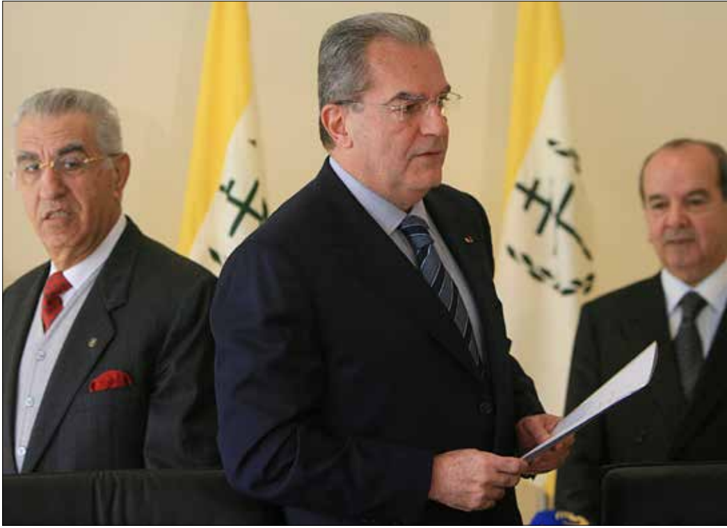
طلب جمع من الخازن إقناع البطرك وجس نبض حزب الله قبل مفاتحة عون بموضوع ترشحه

لعل ما نقلته «اللواء» عن الخازن أخرج الأخير أمام القوات اللبنانية، فسارع إلى إصدار بيان التملص من كلامه. ولعله تنبّه إلى سلبية عون تجاه مواقفه فحاول سحبها، إلا أن الموضوع لا يتعلق بالخازن بل بجعج. فرئيس حزب القوات يقول بنحو غير مباشر إن مواصفاته لرئيس الجمهورية المقبل تختصر بأن يكون من دون مواصفات، سواء كان اسمه وديع الخازن أو شارل رزق أو سمير أبي اللمع أو نعمة أفرام أو مروان شربل أو «أياً كان، بغض النظر عن مواصفاته». فهو يهتم فقط بأن يحفظ له تيار «المستقبل» حصته من النواب المسيحيين ولو كانوا خاسرين بين الناخبين المسيحيين. وهو سيهتم حكماً بالحفاظ على المواصفات الحزبية لرئيس الجمهورية. لا هم من موقفه السابق أو الحالي من النظام السوري وحزب الله والرئيس رفيق الحريري، ولا تهم علاقته في الداخل والخارج، ولا يهتم مشروع وسماته الشخصية؛ المهم ألا يكون ميشال عون أولاً وأن يكون رئيس تيار المستقبل قادراً على إغوائه تانياً وأخيراً.