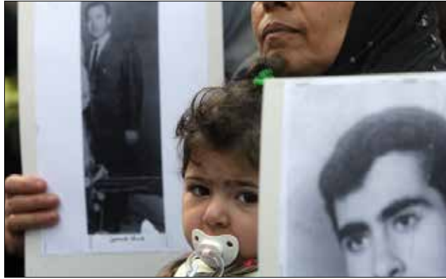
ستسلم اللجنة ملف التحقيقات للجنة الدولية للصليب الأحمر

ظننا، لم يسأل أحد عنّا. أصبح أبنائنا ضحايا الحرب وأصبحنا ضحايا السلم. هذا السلم السطحي، الفارغ الذي كان تصالحاً بين مجرمي الحرب فقط. بقي الشعب عالماً في تلك الحرب من دون أن يعي ذلك. وحدهم أهالي المخطوفين والمخفّين أعلنوا أنهم لن يمضوا فوق أجساد الأبناء والأحفاد والأشقاء. اجتاحت الحزن وجوه الأمهات اللواتي انتظرن سنوات طويلة. هناك أمهات انتظرن 40 عاماً، والانتظار دليل أمل