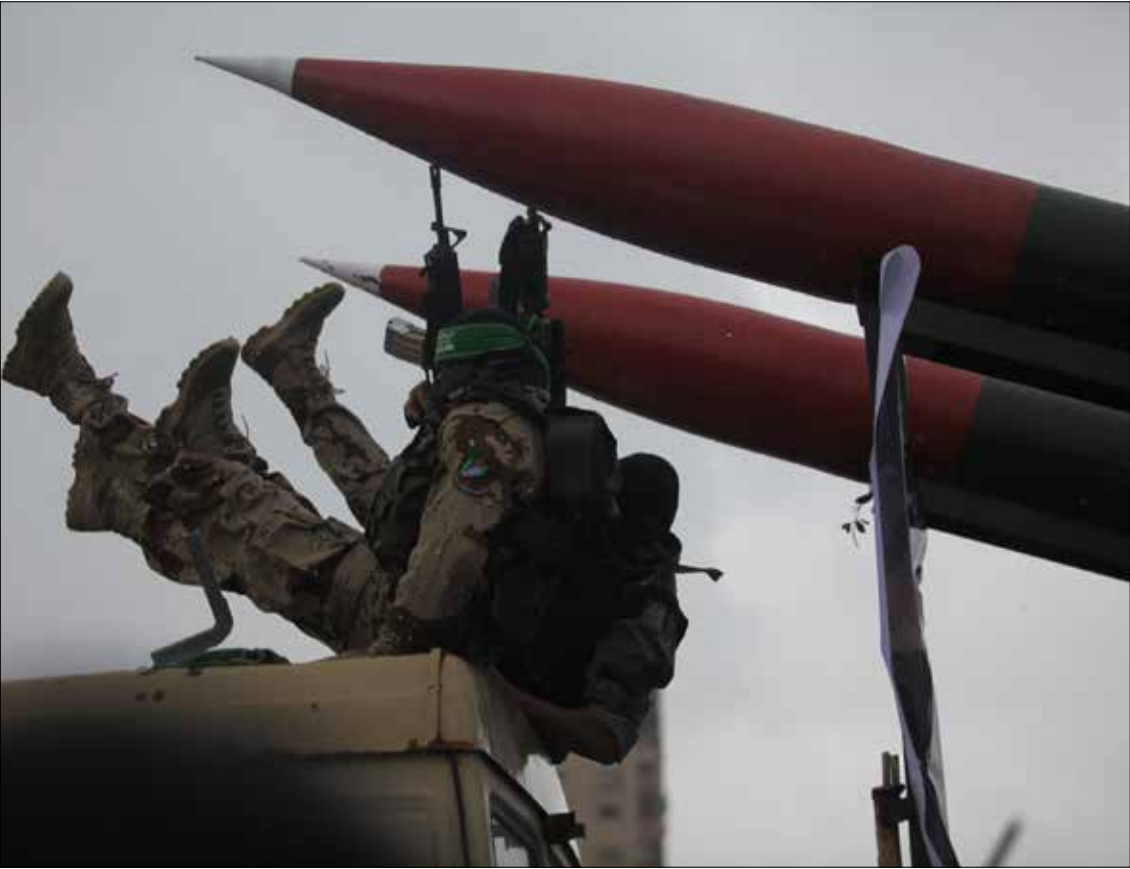
شاركت وحدات عسكرية متنوعة في عرض كتائب القسام العسكري (أي بي إيه)

أن يخرج عسكر «حماس» ليقول «شكراً إيران»، مع عبارات تفصيلية عن السلاح الذي قدمته الجمهورية الإسلامية والمال و«أشياء أخرى». ليس بالأمر العابر في هذا التوقيت. صحيح أن المستوى السياسي مهّد للشكر في الزيارة الأخيرة لطهران، لكن هناك من يتلمس تغييراً في أولويات الحركة