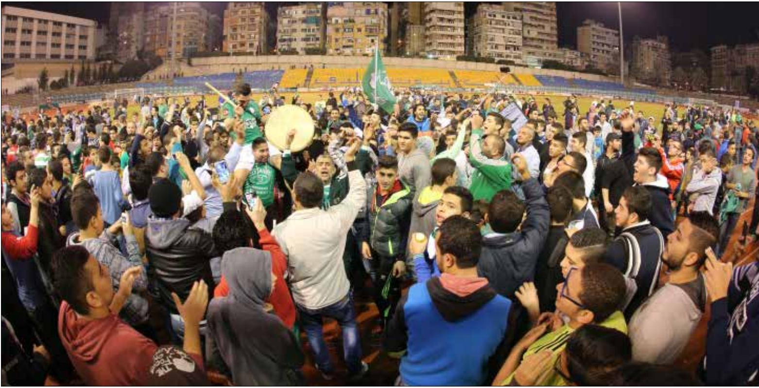
جمهور الانصار يحتفك مع لاعبيه بالفوز على الصفاء (عدنان الحاج علي)