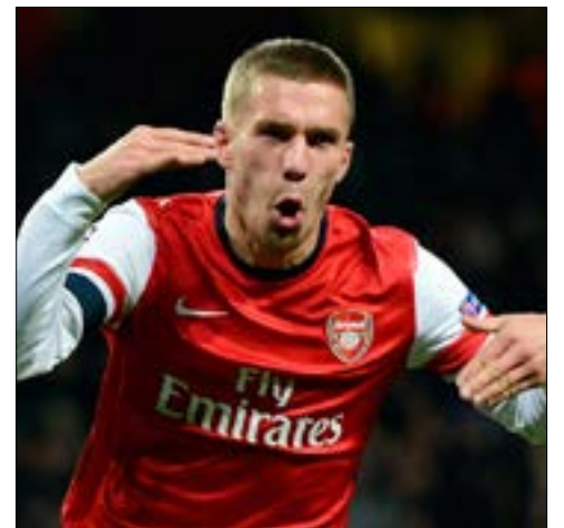
لوكاس بودولسكي (أرشيف)

لم تكتمضي ساعات على شراء ميلان الإيطالي نهائياً الإسباني فرناندو توريس الذي كان معاراً إليه من تشلسي الإنكليزي، حتى أعلن أتلتيكو مدريد، بطل «الليغا»، أن «إل نينيو» سيعود إلى صفوفه اعتباراً من الشهر المقبل بعقد اعارة لموسم ونصف موسم. «فرناندو توريس سيعود إلى أتلتيكو مدريد بعد التوصل إلى اتفاق بين نادينا وميلان ينتقل بموجبه المهاجم الدولي البنا على سبيل الاعارة لما تبقى من الموسم الحالي إضافة إلى الموسم المقبل». هذا ما أعلنه «الروخيبلانكوس» في موقعه على شبكة «الانترنت».