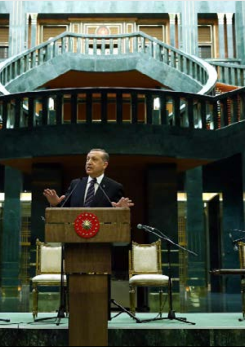
أثار انتقال اردوغان إلى قصر جديد اتهامات بتغيير هوية تركيا الحديثة

أن يكون «رئيس ظل» في الحكومة والحزب أيضاً. وظّف أعداداً كبيرة من المستشارين في قصر الرئاسة ليتولوا الإشراف على المؤسسات الحكومية التي تعد من اختصاص الوزراء وكانهم يمثلون وزراء ظل. أثار قرار انتقاله من قصر شنقايا، قصر تاريخ الدولة التركية الحديثة، زوبعة من الانتقادات بين صفوف المعارضة التركية، التي اتهمته بانتهاك القوانين وتبذير أموال الشعب «لبناء سلطنة لنفسه»، إلا أن مؤيديه رأوا أن القصر الرئاسي الجديد «مفخرة» للشعب التركي، ورمز يعكس شعار «تركيا الجديدة» الذي رفعه منذ كان رئيساً