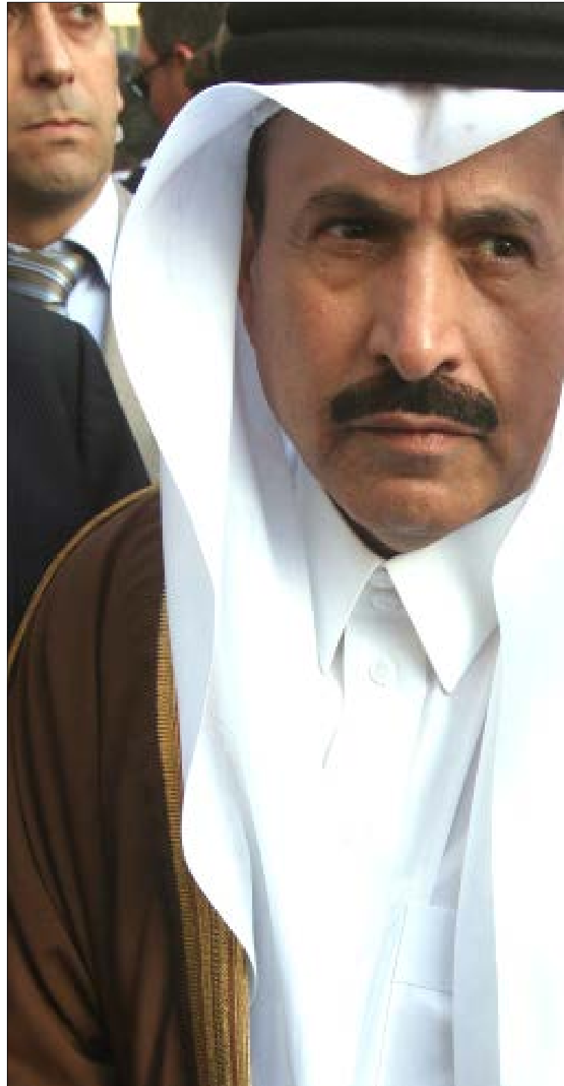
تحدث السفير السوري إلى كرامبي، لدى عيادته والده الرئيس عمر كرامبي، ميديا فريدا من الانفتاح (هيلتم الموسوي)

في مكتب «اللينو»، اجتمع مسؤولون في الفصائل الفلسطينية ومشايخ في القوى الإسلامية. جزم أحد المشايخ بأن ما يحكى عن استهداف للاحتفاليين من المجموعات المتشددة في المخيم هو