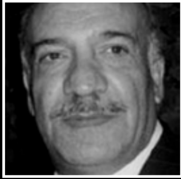
«أبو ابراهيم» يترجل

تعبت «بنت البلد» دفعة واحدة. لم يمهلهما سرطان الكبد أكثر من بضعة أسابيع. في العاشر من تشرين الثاني الماضي، ماتت معالي زايد عن عمر يناهز الستين عاماً وتركت الكثير. أما ما لا نعرفه عنها، فهو أنها كانت فنانة تشكيلية مولعة بفن رسم البورتريه، وقد افتتحت معارض عدة قبل دخولها التمثيل، أولها كان معرض «الوجه الآخر».