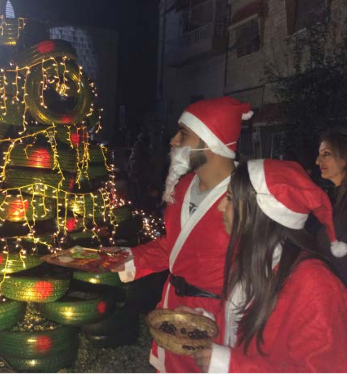
أمام باحة كنيسة يوحنا المعمدان في مرمريتا

الرحلة القصيرة، بين حي الحميدية وسط حمص ووادي النصارى في الريف الغربي، تثبت إرادة الأهالي على الفرح والحياة. ففي الحي يغالب السكان الخراب للقيام، فيما يتمسك أهل الوادي بصور شهدائهم... وسط أفراح الأعياد