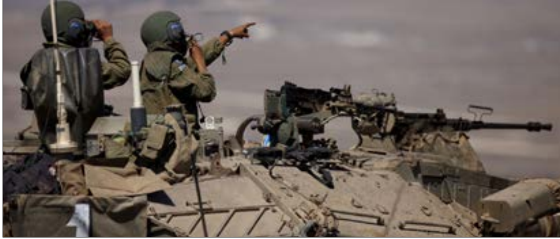
لم تعمل سلطات العدو على إصلاح العيوب التي كشفت عنها في منشآت أمنية حساسة