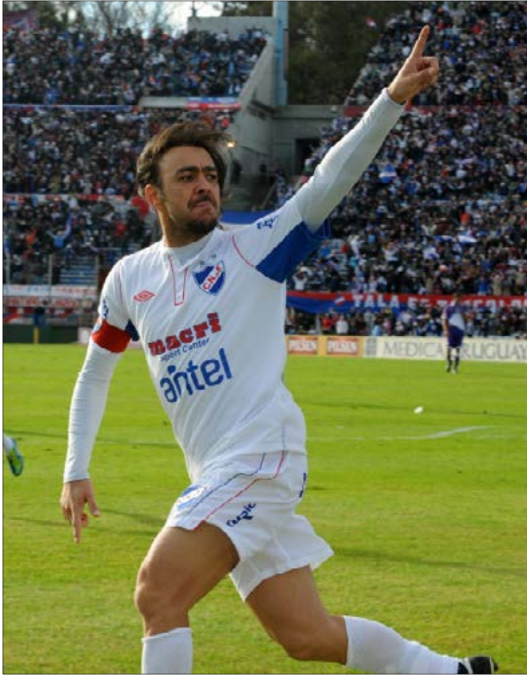
بواصك ريكوبا مسيرته في سن الـ 39 عاماً مع فريق ناسيونال في بلاده

عدد كبير من النجوم السابقين لا يزالون برغم تقدمهم في السن، يواصلون مشوارهم في الملاعب لكن مع فرق صغيرة انقطعت فيها أخبارهم. بعدما كانوا يرتدون قمصان أشهرها، هؤلاء اللاعبون الذين كانوا يملأون الساحات يوماً، أصبحوا الآن مجرد ذكريات من الماضي.