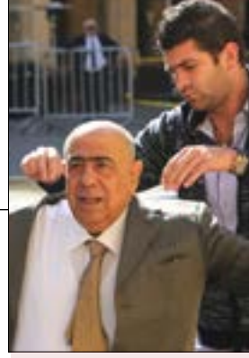
«كسارة» في العديّة