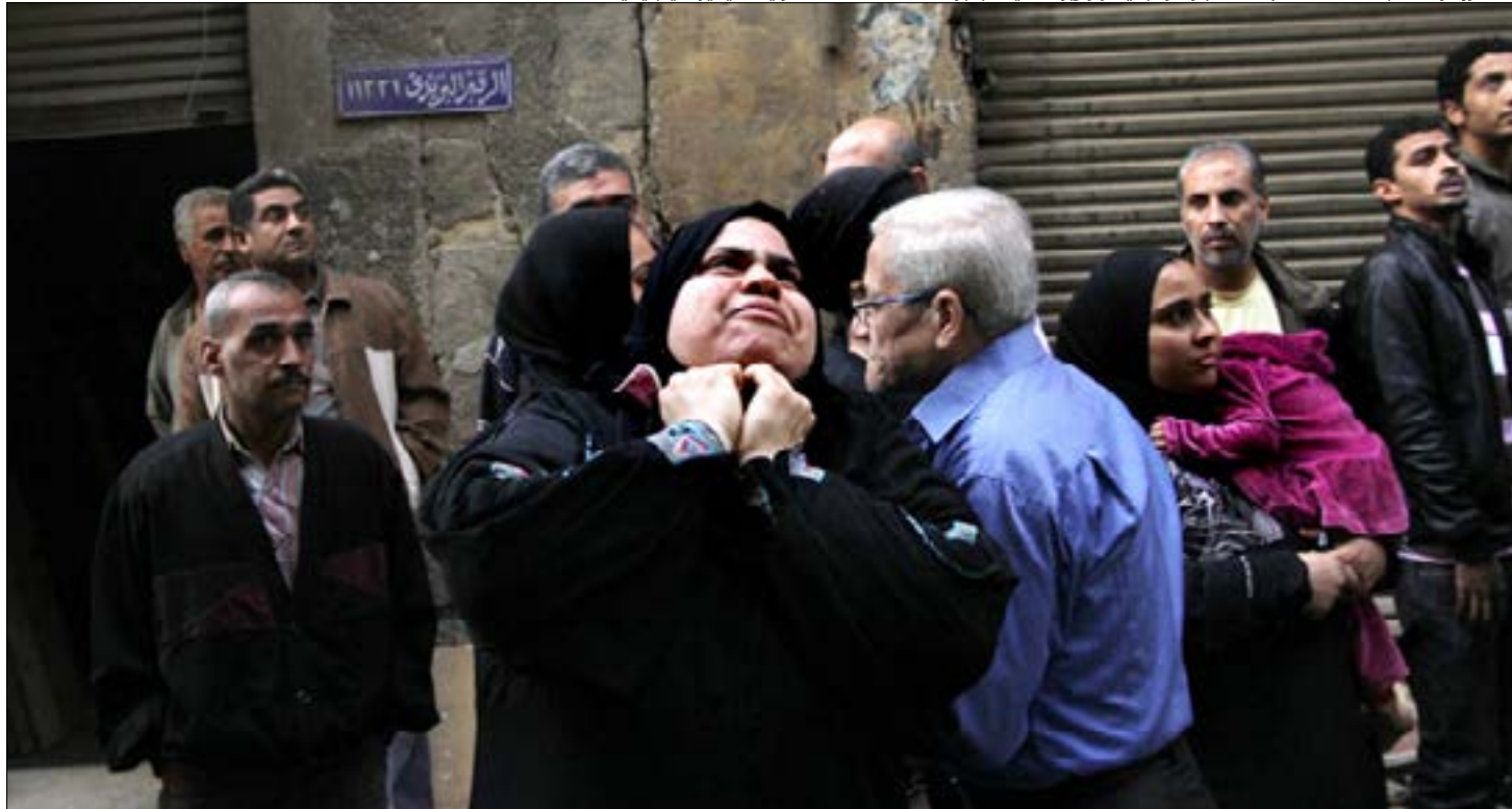
الانكسار إثارة للضجة كان الحكم على مبارك ونجليه ووزير داخلته بالبراءة من قتل متظاهري 25 يناير

«فابيسوك». وبعد تحويله إلى المحاكمة إثر احتجاج دام شهرين، خرج لعدم وجود ما يدينه. يقول سليمان، إن القبضة الأمنية اشتدت بعد وصول عبد الفتاح السيسي إلى سدة الحكم، فعادت «الأجهزة الأمنية لتتحكم في الأمور وتضطهد النقابيين، وبات تحويل القيادات العمالية إلى المحاكمة بتهمة فضفاضة، سياسة روتينية ومنهجية للتكثيف بالنقابيين». ومن أكثر الأمور فظاظة ووحشية إطلاق النار الحي على العمال عندما كانوا يقفون عزلاً أمام شركاتهم للمطالبة بحقوقهم في الأجر الكامل. هذا ما حدث مع عمال الغزل في الإسكندرية، الذين تعرضوا بعدها للضغوط، كي لا يقدموا بلاغات ضد الضباط الذين ارتكبوا هذه الجريمة بحقهم، مقابل عدم تقديمهم إلى المحاكمة بتهمة التظاهر من دون ترخيص.