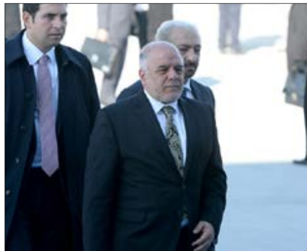
شدد العبادي على ضرورة توزيع الثروة بنحو عادل

بنقل الصلاحيات إلى المحافظات من أجل السير بالبلاد على الطريق الصحيح، ولكننا بحاجة إلى ضوابط في الإدارة يلتزمها