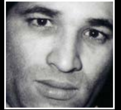
مرسي تهزم يا رجالة

ماتت صباح مرات كثيرة قبل السادس والعشرين من تشرين الثاني الماضي. لاحقتها شائعة الموت حتى أيامها الأخيرة. هكذا، كان يأتي خبر موتها في كل حين، ويليه بعد ساعات قليلة بيان النفي. كأنها كانت تعيش على حسابنا، قالتها يوماً. أما اليوم، فقد ماتت فعلاً على حسابنا، مخلّفة ذكريات كثيرة وصورة واحدة: وجهها المبتسم أبداً. تركت 83 فيلماً بين مصري ولبناني و27 مسرحية لبنانية وما يزيد عن 3 آلاف أغنية.