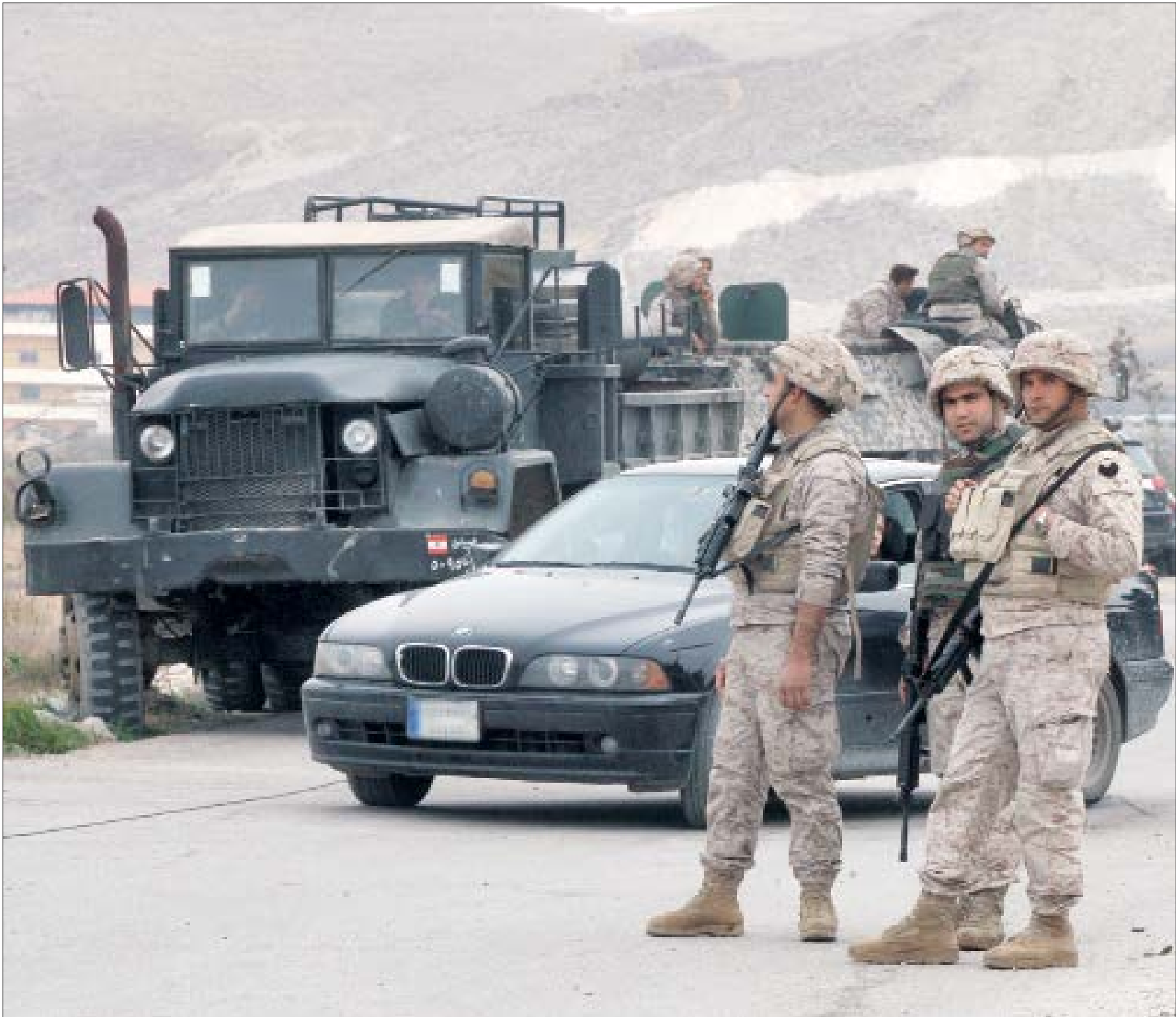
مصدر أصلي: أغلبية المعتزضين على إجراءات الجيش يدرهم الإرهابيون (هيلم الموسوي)

بدأ حصار الجيش اللبناني يوتي ثماره على الإرهابيين في جرود عرسال، في ظل الظروف المناخية القاسية وسيطرة تنظيم «داعش» على أغلبية الجرود المحاذية للبنان. فيما أوقع الجيش السوري عشرات القتلى من المسلحين بكمين في عسال الورد