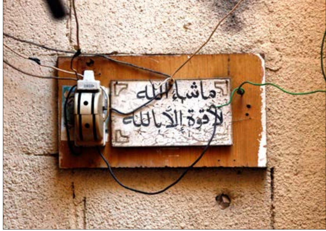
◀ وصلت ساعات التقنين في المناطق خارج بيروت الإدارية. إلى حدود 14 ساعة في اليوم، أي بمعدل 60% تقنين، فيما حافظت بيروت الإدارية، في عز الأزمات، على مستوى تغذية «سوبر»: 21 ساعة من أصل 24 ساعة.

◀ بعد طول غياب، عاد الرئيس السابق سعد الدين الحريري إلى لبنان عودةً ميمونة. وأحضر معه حقيبة سامسونات سوداء، فيها 3 مليارات دولار أميركي، كمكرمة من المملكة العربية السعودية، ذهب حصة وافرة منها... للفوج المجولق!