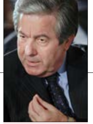
الجريء بما يكفي