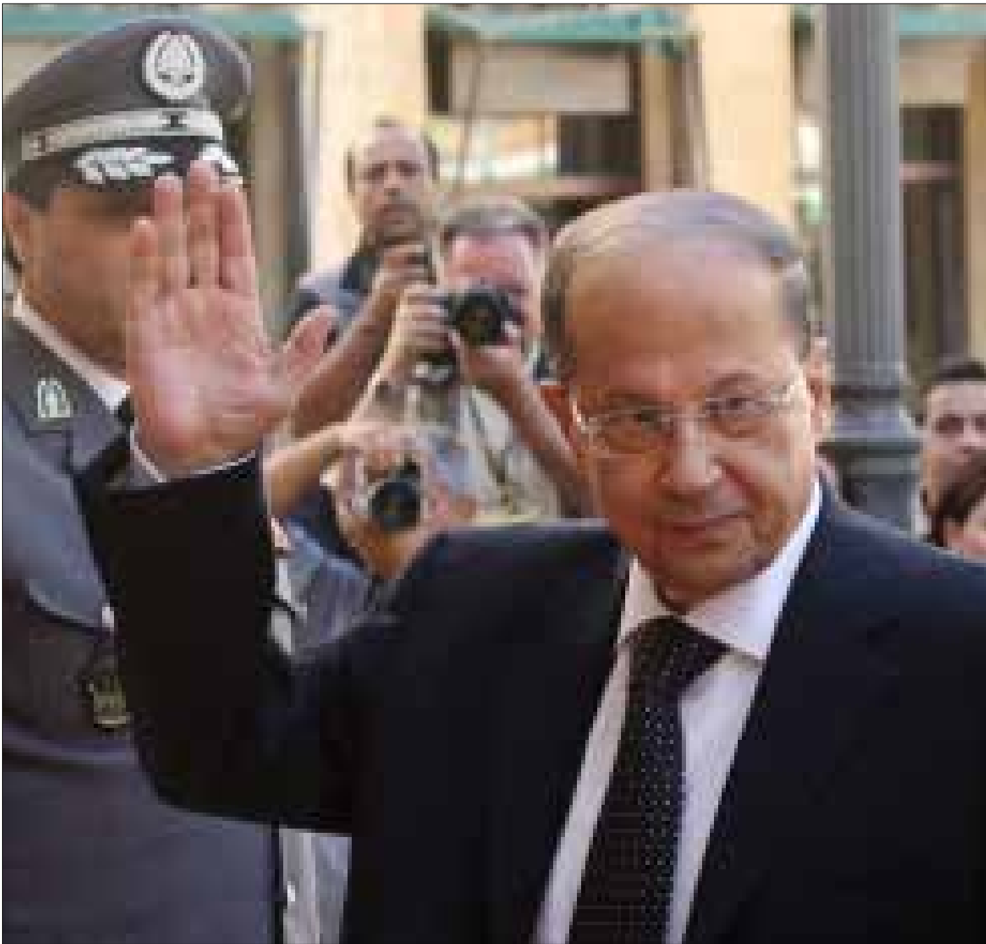
لا يزال عون يتمسك بوجهة نظره القائلة انه لا يسهل الانتظار الى ما شاء الله