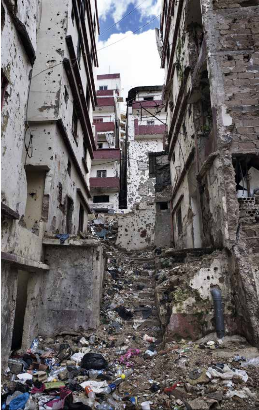
في الطريق إلى جبك محسن من التبانة