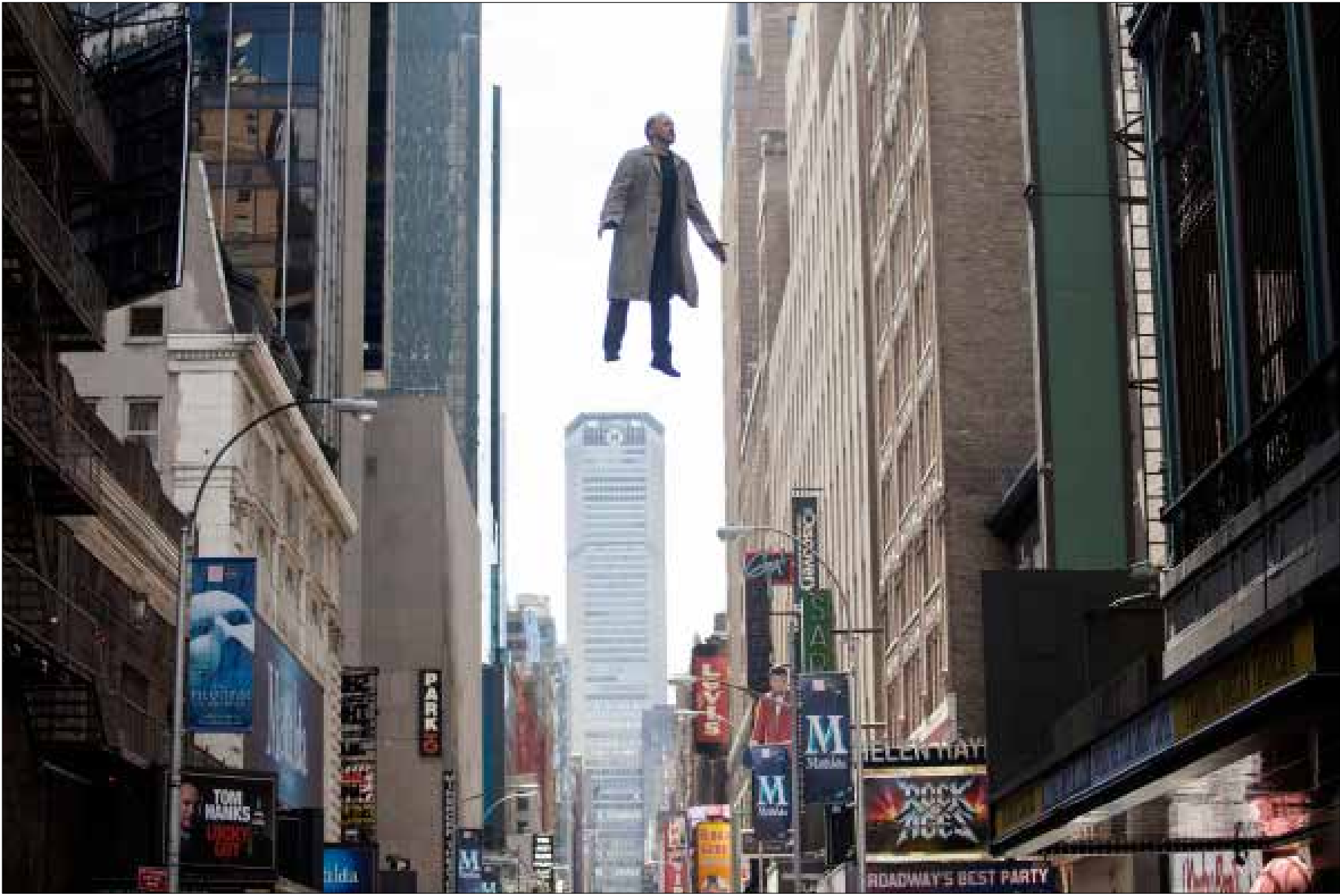
مايكل كيتون في مشهد من «بيردمان»

سينما لحظات ومحطات عدة شهدتها الدورة الـ 87 من الاحتفال الذي احتضنه «مسرح دولبي» في لوس أنجليس أول من أمس. الأكيد أنّ السينمائي المكسيكي الذي أعلن ولادة جديدة في فيلمه «بيردمان»، نال حصة الأسد من التتويجات، فيما دخلت جوليان مور التاريخ بوصفها ثاني ممثلة بعد جوليت بينوش تنال جوائز التمثيل الخمس الأبرز عالمياً