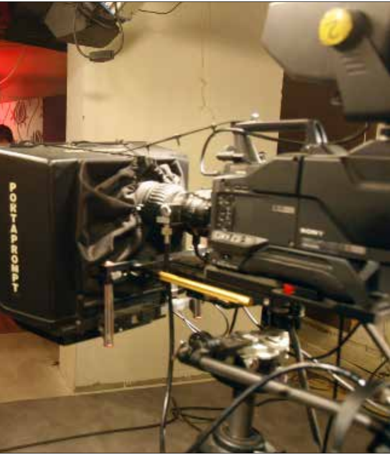
يعيش «الإعلام الديني» اختلافاً بنوياً عن صناعة الإعلام ذاتها (هيثم الموسوي)

المذاهب وانشغالهم الحديث بالدعوة الاستقطابية مثل نقطة مقتل للمشروع الإسلامي؛ ولم يترك حيزاً كافياً لنشر الفكر المسلم فيما يُعنى ببناء الحضارة الإنسانية على الأرض، فضلاً عن الانطلاق بمشروع بنائها فعلاً.