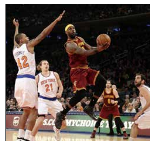
جيمس صاعداً للتسجيل في سلة نيويورك

واصل «الملك» ليجرون جيمس تألقه وقاد فريقه كليفلاند كافالييرز إلى الفوز على مضيفه نيويورك نيكس 83-101، في الدوري الأمريكي الشمالي للمحترفين في كرة السلة. وسجل جيمس 18 نقطة رافعاً رصيده إلى 24383 نقطة منذ بدايته في الدوري الأميركي للمحترفين قبل 12 عاماً ليرتقي إلى المركز الـ 22 في الترتيب التاريخي لهدافي الدوري متخطياً نجم طفولته هدف فيلادلفيا سفنتي سيكسرز السابق الن أيفرسون. ويبلغ معدل أفضل لاعب في الدوري 4 مرات حتى الآن، 27.4 نقطة في المباراة الواحدة منذ بداية مسيرته أي ثالث أفضل معدل في التاريخ خلف مايكل