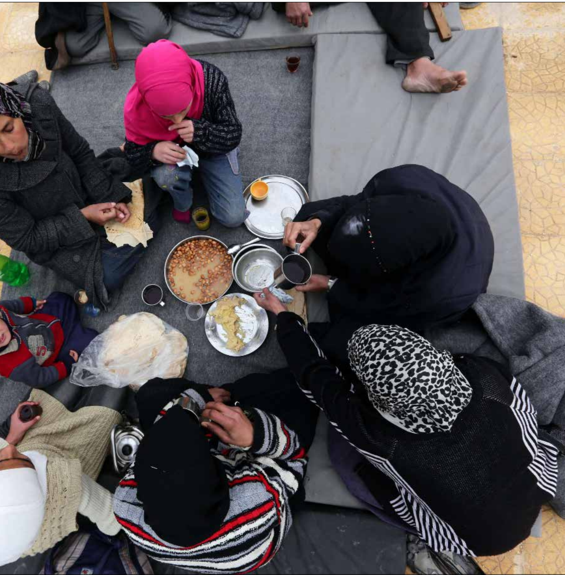
خارجون من القوطة الشرقية في مكان الإيواء المخصص لهم في ضاحية قدسيا أمس

تشير بيانات مديرية الجمارك العامة إلى أن مستوردات سوريا عام 2014 بلغت قيمتها ما يقرب من 6 مليارات دولار وفق سعر الصرف الرسمي حالياً (1300 مليار ليرة سورية)، أي ما معدله يومياً 16,4 مليون دولار، وقدمت المواد