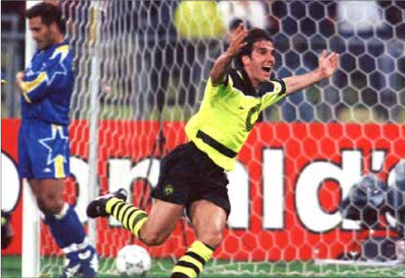
كارل - هاينز ريدل يركل بطل فوز دورتموند على يوفنتوس في نهائي الابطال عام 1997 (ارشيف)

يحل بوروسيا دورتموند ضيفاً على يوفنتوس، الليلة (الساعة 21,45 بتوقيت بيروت). في دور الـ 16 لدوري أبطال أوروبا في مواجهة قوية تحمل ذكريات عام 1997 عند تواجدهما في النهائي الذي فاز به دورتموند. مواجهة يكفي اختصارها بأنها إيطالية - ألمانية