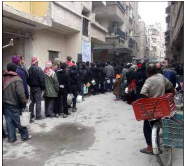
بانتظار المساعدات الغذائية في مخيم البرموك أمس

«مجموعات الاقتحام» في ريف حماة. وفي ريف اللاذقية الشمالي، قتل القيادي في «جبهة النصرة» بلال الصوفي مع 3 من مرافقيه، إضافة إلى مسلحين آخرين، أثناء قصف الجيش لبلدات سلمى وكنسبا وجبل زاهية ومزرعة أبو الريش. من جهة أخرى، انفجر معمل للعبوات الناسفة تابع لـ«جبهة النصرة» في معرة النعمان في ريف ادلب، ما أدى إلى مقتل عدد من عناصر التنظيم.