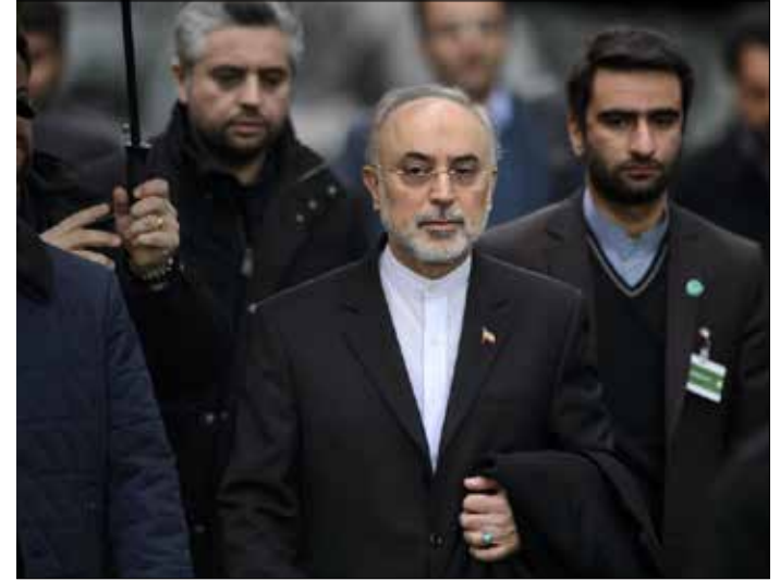
صالح مفادرا جنيف بعد الاجتماع بين المسؤولين الإيرانيين والأميركيين

انتهت مساء أمس في جنيف، المحادثات النووية بين وزير الخارجية الإيراني، محمد جواد ظريف، ووزير الخارجية الأميركي، جون كيري، على أن تعقبها جولة أخرى من المفاوضات الأسبوع المقبل. وجاءت هذه المحادثات إثر جولة أولى من المفاوضات عقدها الجانبان يوم الأحد، شارك فيها، للمرة الأولى، كل من وزير الطاقة الأميركي إرنست مونيز ورئيس المنظمة الإيرانية للطاقة النووية علي أكبر صالح، ومن ثم عقدا صباح أمس جولة ثانية استمرت 3 ساعات للبحث في نقاط الخلاف القائمة في طريق الوصول إلى الاتفاق النووي النهائي الشامل، وفيما بدا أن الخلاف ما زال قائماً، فقد توافق الإيرانيون والأميركيون على أن الطريق ما زال طويلاً للتوصل إلى اتفاق نهائي، برغم الأجواء المغفدة والبناءة التي طغت على المحادثات. ووصف وزير الخارجية الإيراني، محمد جواد ظريف، جولات المفاوضات الأخيرة بأنها «مفيدة وبناءة وجادة»، مضيفاً أن الجولة التالية ستجرى الأسبوع المقبل. وقال ظريف: «أجرينا محادثات جادة مع ممثلي مجموعة الخمسة زائداً واحداً وخصوصاً مع الأميركيين في الأيام الثلاثة الماضية. لكن الطريق ما زال طويلاً أمام التوصل إلى اتفاق نهائي».