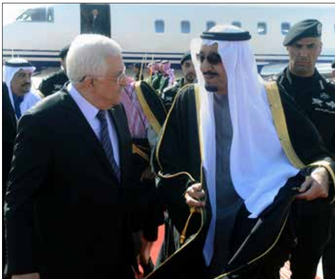
اختتم عباس أمس زيارته إلى السعودية حيث التقى الملك سلمان

من الصعب على «حماس» أو «فتح» أن تخزيا ظهور ساحة منافسة جديدة عنوانها استرضاء السعودية بملكها الجديد. فبعد حديث حمساوي عن إمكانية زيارة خالد مشعل للرياض، سبقه إليها محمود عباس