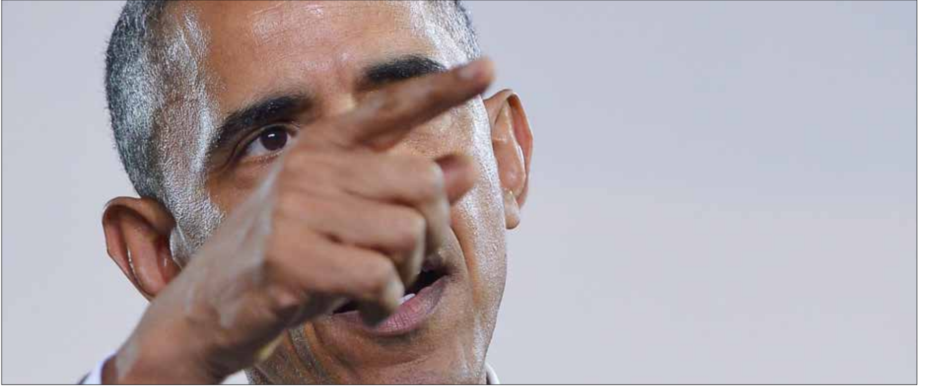
سعى الديمقراطيون على رأسهم أوباما إلى طمأنة المتخوفين من دور الكونغرس المستجد