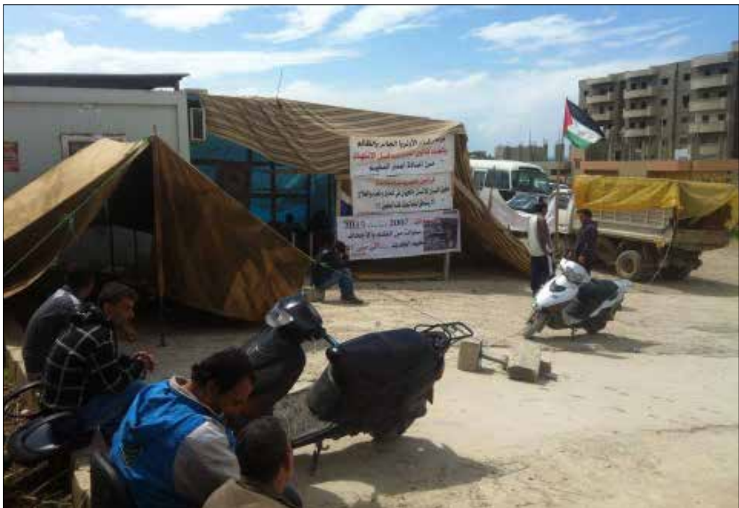
يشكو أبناء المخيم من سوء التنفيذ في المشاريع ووجود رشا وصفقات واختلاسات مالية (اللاخبار)

يعيش مخيم نهر البارد منذ أيار 2007، مأساة حقيقية، إن كان من ناحية الوضع الأمني أو الاجتماعي أو السكاني. عند مداخل المخيم، لا تزال حواجز الجيش اللبناني قائمة، ولا يزال أبناء المخيم يعانون من الاصطفاف لساعات طويلة، ليسمح لهم بالدخول إلى منازلهم. يفهمون هذه الإجراءات ويتحملونها بمرارة، فهم لا يريدون أن يعود المخيم إلى سابق عهده الأمني. رضخوا لقساوة العيش داخل المخيم، ولم يقبلوا الخروج منه، حيث أنشأت لهم منظمة الأونروا ما يسمونه «البراكسات»، وهي عبارة عن بيوت تتألف من غرفتين لكل عائلة، لا يتعدى حجم الغرفة الواحدة المترين، لتشكل تجمعا سكانياً كبيراً يضم ما يقارب ألف عائلة فلسطينية، على مساحة لا تتعدى 1000 متر، وهم وعدوا بأن لا تتخطى فترة سكنهم