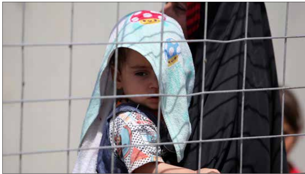
وصلت أعداد النازحين إلى بغداد في اليومين الماضيين إلى 123 ألف نازح