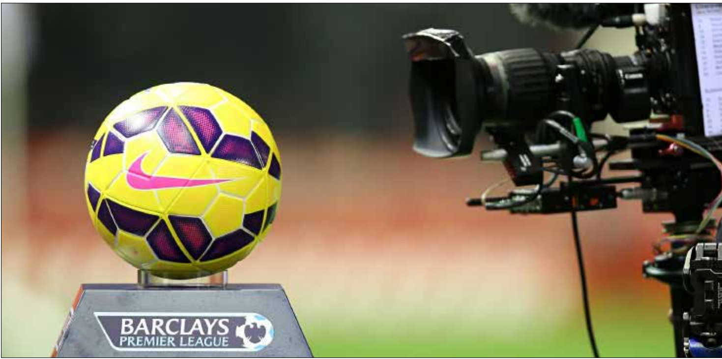
حصلت «سكاي» على حقوق نقل 126 مباراة مباشرة على الهواء مقابل 4,2 مليارات جنيه استرليني

2,7 مليون جنيه في العام الواحد (بعد جمع قيمة العقود المحلية والخارجية)، في حين سيبلغ مجموع عقود كل من الدوري الإيطالي (حوالي مليون جنيه استرليني) والدوري الفرنسي (0,7) والألماني (0,6) لكل منهم) والدوري الإسباني (3 ملايين جنيه استرليني) حوالي 3 ملايين جنيه استرليني. وبهذا ستصل فرق «البريمير ليغ» العشرين في المواسم المقبلة لتكون من أغنى 30 فريقاً في العالم، حيث سيصبح بيرنلي أغنى من أياكس!