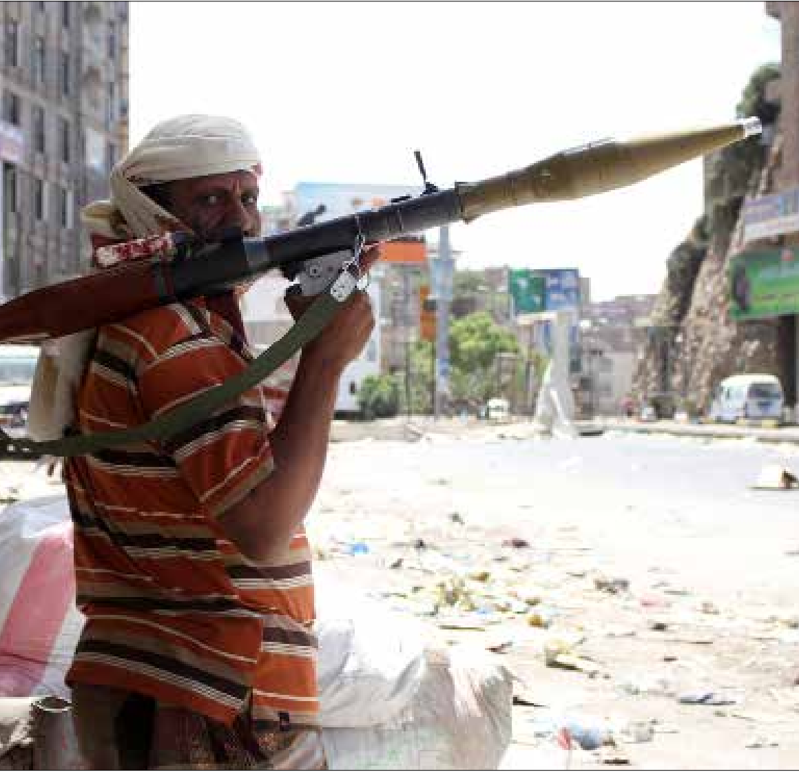
نقاشات العائلة الحاكمة والعواصم الخليجية أظهرت ضرورة تلفف أي مبادرة «معقولة» (أ ف ب)

نفاذ بنك الأهداف لسلاح الجو، وهو أصلاً ما أكدته المتحدث باسم العدوان عن انتهاء المرحلة الأولى، واعتباره أنه تحقق هدف حماية دول الجوار من أي خطر صاروخي مصدره اليمن، وإشارته إلى الجهد على الجانب الحدودي.