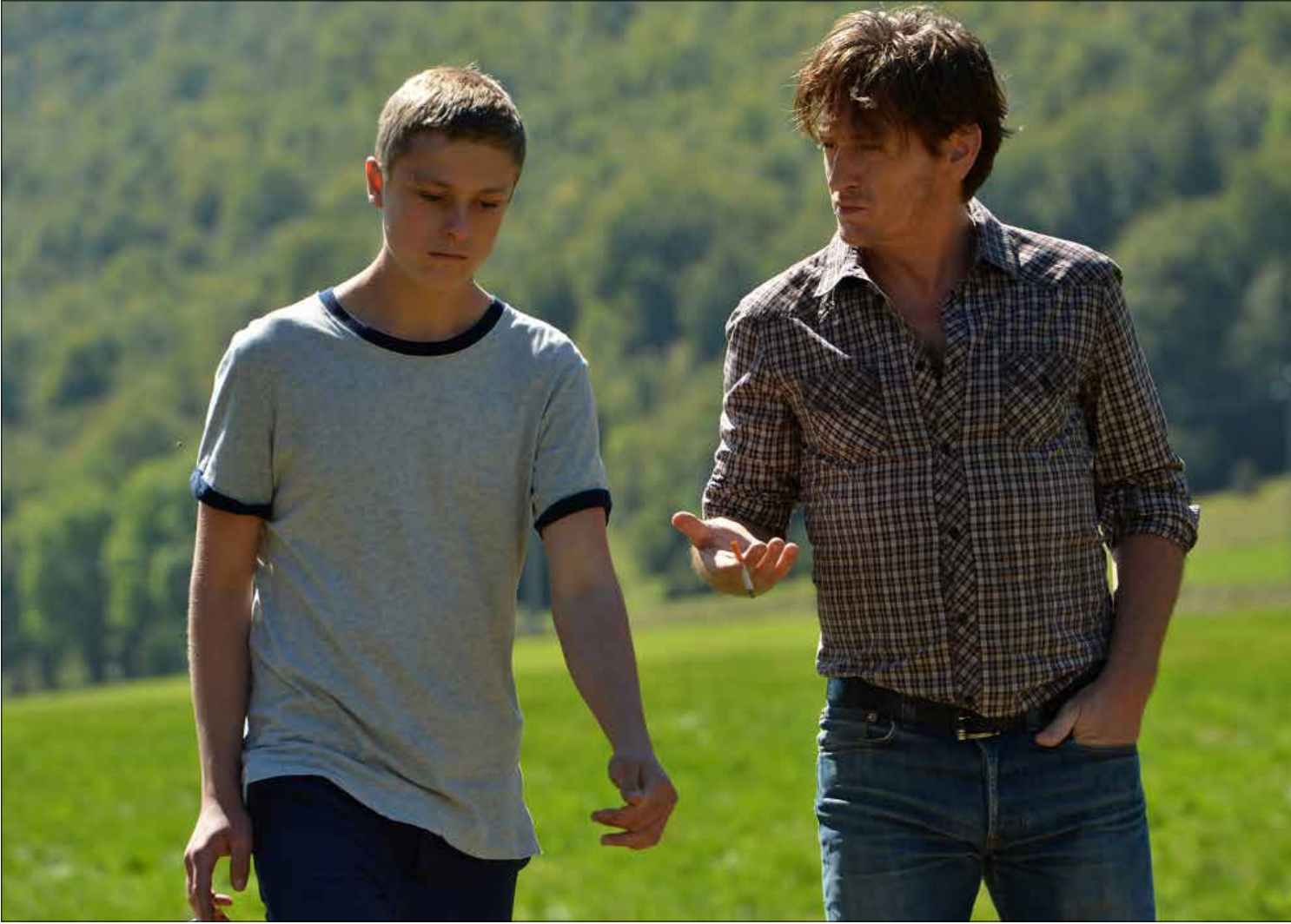
مشهد من فيلم الافتتاح «الراس المرفوع» لابمانويك بيركو