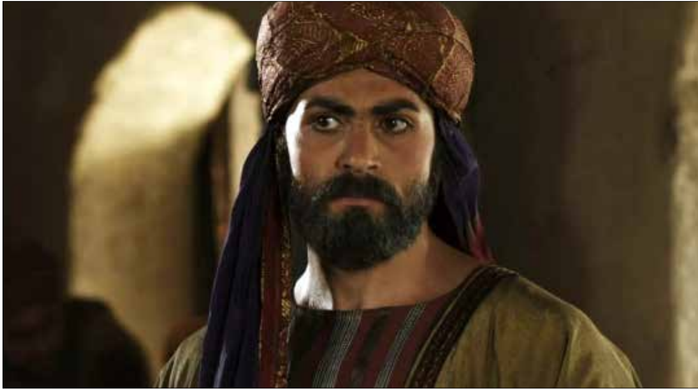
يؤدّي مهيّار خضور دور الإمام أحمد بن حنبل