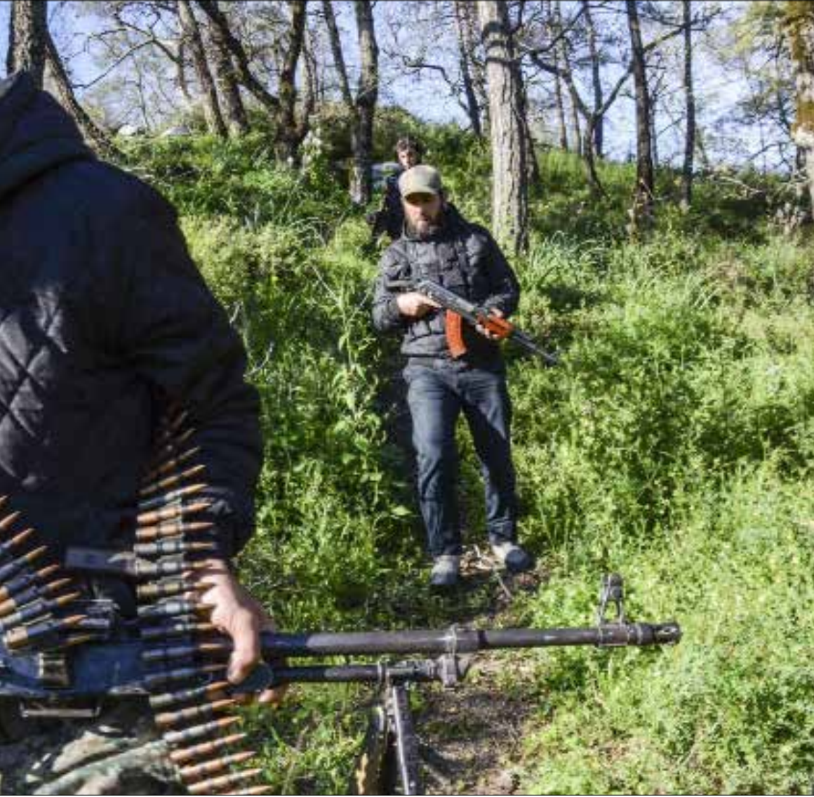
مقاتلون من «الكتائب التركمانية» في ريف اللاذقية الشمالي قبل أيام (الناضوك)

فيما تتقدم وحدات الجيش السوري شمالاً، مسيطرة على بلدات جديدة في محافظتي إدلب وحلب، يخوض «داعش» معارك على أكثر من جبهة في شرقي العاصمة، تحت قيادة «أمير» جديد للتنظيم