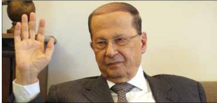
مصادر عون: سمعنا كلاماً إيجابياً من حلفائنا (هيثم الموسوي)

بوادر خلاف حكومي حول مشاركة لبنان في اجتماع رؤساء أركان الجيوش العربية