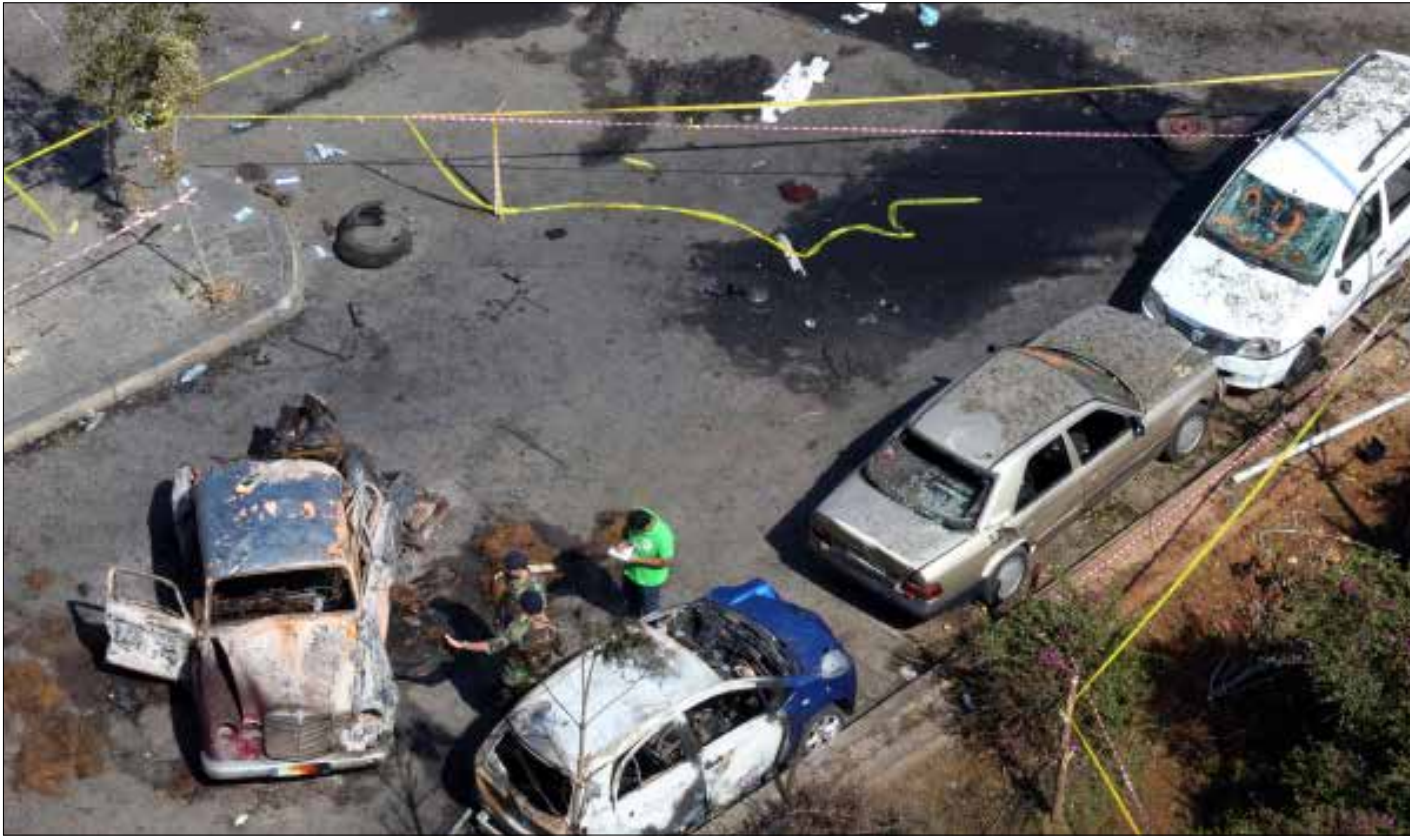
نحو استئناف العمليات الانتحارية وتمزيقها بـ «انغماسيين» وسيارات مفخخة

الهدوء في لبنان لن يدوم طويلاً. هذا ما توّكّده مصادر كشفت لـ «الأخبار» عن مرحلة جديدة من العمليات الأمنية ستبدأ قريباً تعدّها لها «التنظيمات الجهادية». وهي مرحلة ستشهد تغييراً جزيئياً في أسلوب العمليات الأمنية، وسيتولى الاشراف عليها قيادي «جهادي» وصل أخيراً إلى لبنان يُعرف بـ «الأشعث»