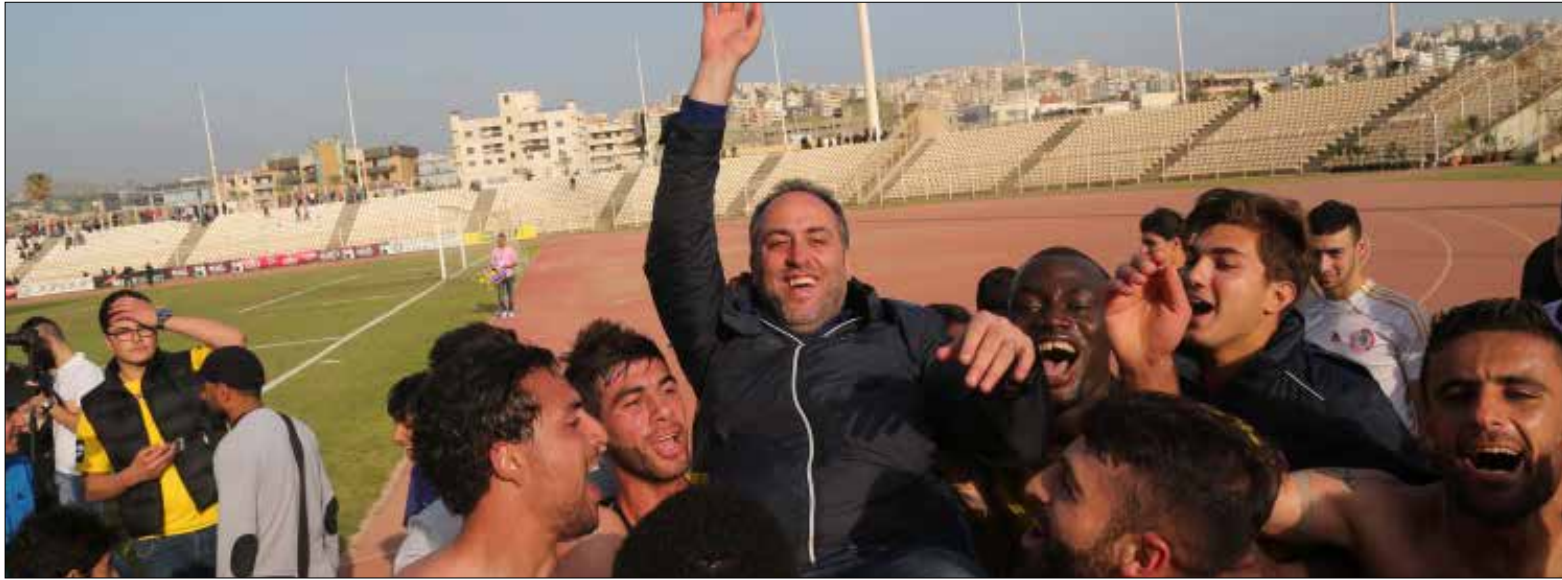
لاعب العهد يحتفلون مع الرئيس نعيم سليمان بعد المباراة (عدنان الحاج علي)

المقاء شهد تغييراً في هوية الحكم الرئيسي حيث قاد الشوط الأول الحكم جميل رمضان، قبل أن يتعرض للإصابة ويقود الحكم الرابع محمد زعتر الشوط الثاني. أما الإخاء فقد أصبح رصيده 17 نقطة بعد تعادله المخيب مع ضيفه التضامن صور 0 - 0 على ملعب بحمدون الذي بدأ يستعيد صورته الحضارية للأسبوع الثاني على التوالي مع حالة الانضباط الأمني والإداري وحتى الجماهيري، رغم بعض التوتر المقبول من قبل بعض الجمهور نظراً إلى حراجه وضع الإخاء.