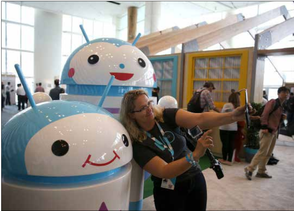
كشفت غوغل عدة مزايا حديثة خلال مؤتمرها، كنسخة حديثة من نظام تشغيل الأندرويد وقدرات جديدة لخدمة الخرائط

اختتمت شركة غوغل مؤتمرها السنوي للمطورين في حدث Google I/O 2015 الذي عقد في مدينة سان فرانسيسكو الأسبوع الماضي، حيث عرضت الشركة رؤيتها المستقبلية للتكنولوجيا