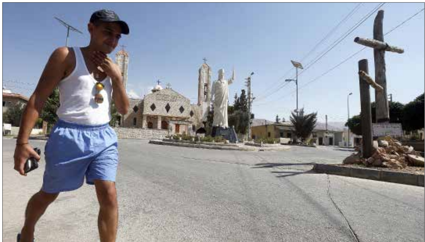
أهل الراس والقاع مجتمعون من استحواذ عرسال على الاهتمام، فيما من أملاكهم ممنوعة عليهم