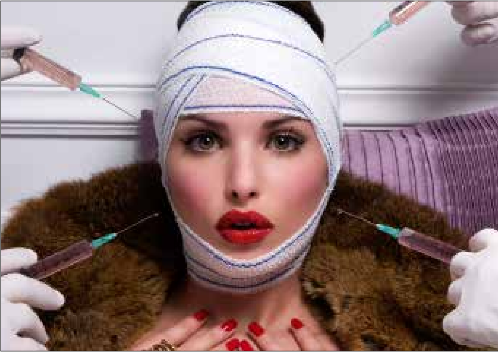
العلاقة بين موسم الصيف والبحر، والرغبة الشديدة في الحصول على جسم مثالي نفسية بحث

ليست قصة عناية المرأة بمظهرها ووليدة الامس طبعاً. مع الوقت اختلفت النظرة تجاه المرأة التي ترنّد البحر أو النهر وتطورت ليختلف معها مفهوم "الجمال". في البداية شام التبرج والطرق الطبيعية المختلفة للعناية بالبشرة. حتى وصلنا اليوم الى عمليات التجميل وطرق التحفيف وفورة الكريمات والمنتجات... التي تزداد فانورتها مع إطلاء كل صيف