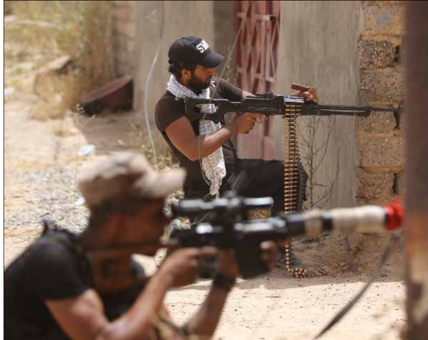
رات هيئة «الحشد الشعبي» إن هت العبر الخوض في تفاصيل معركة الموصل (أفب)

المحافظة على دخول «الحشد الشعبي» عقب سيطرة «داعش» على الرمادي وتهديده لما بقي من مناطق المحافظة (البغداد، حديثة، عامرية الفلوجة، الخالدية، الحبانبة).