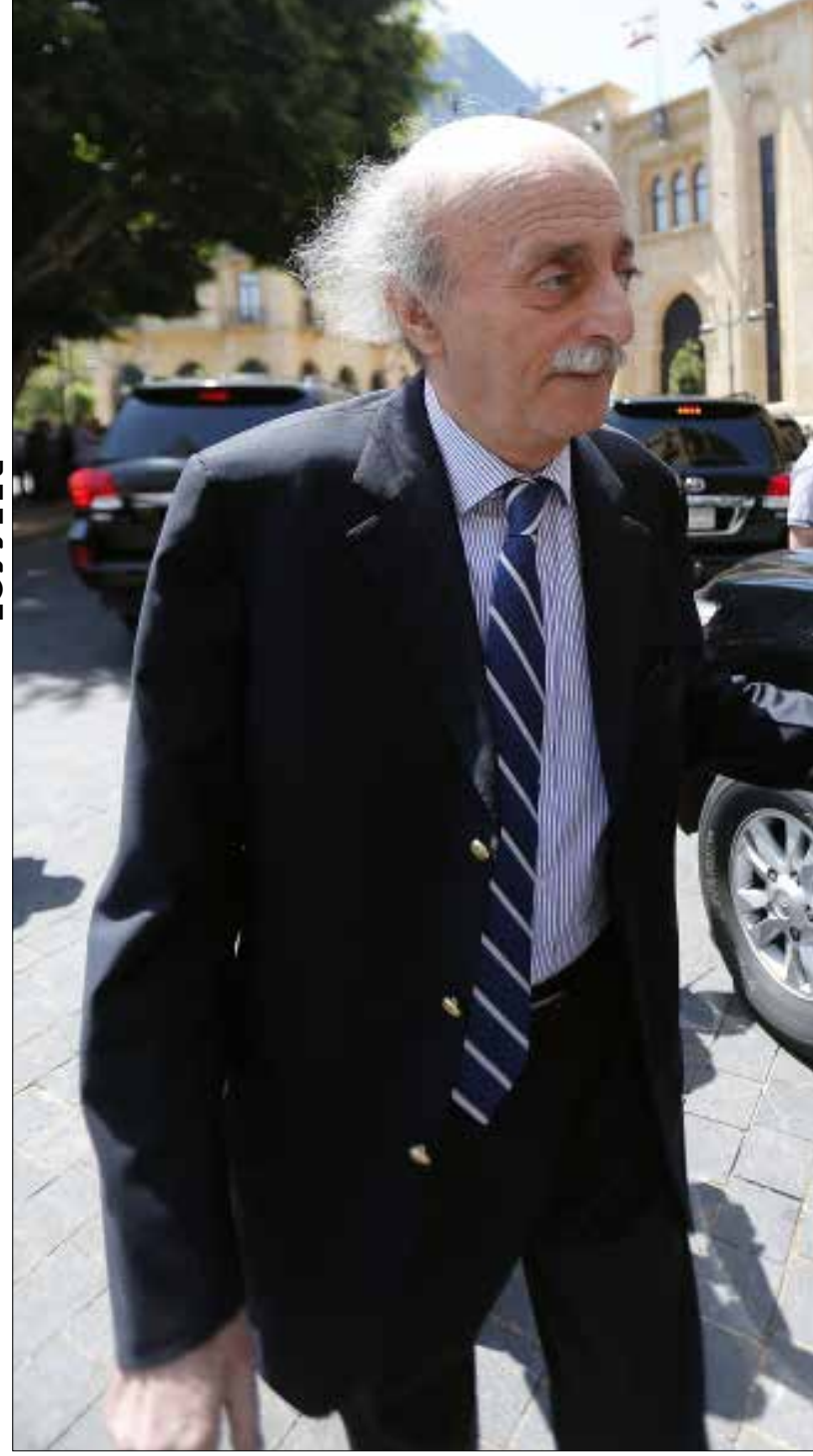
لا يريد الرئيس بربح الدخول في مفاوضات غير هيلمة (هيلم الموسوي)

ووسط كل هذا التعقيد الميداني، نلاحظ ما يلي: أولاً، في مقابل المحدودية الواقعية للتجنيد والحشد لدى الجيش السوري، واستشهاد ما يقرب من