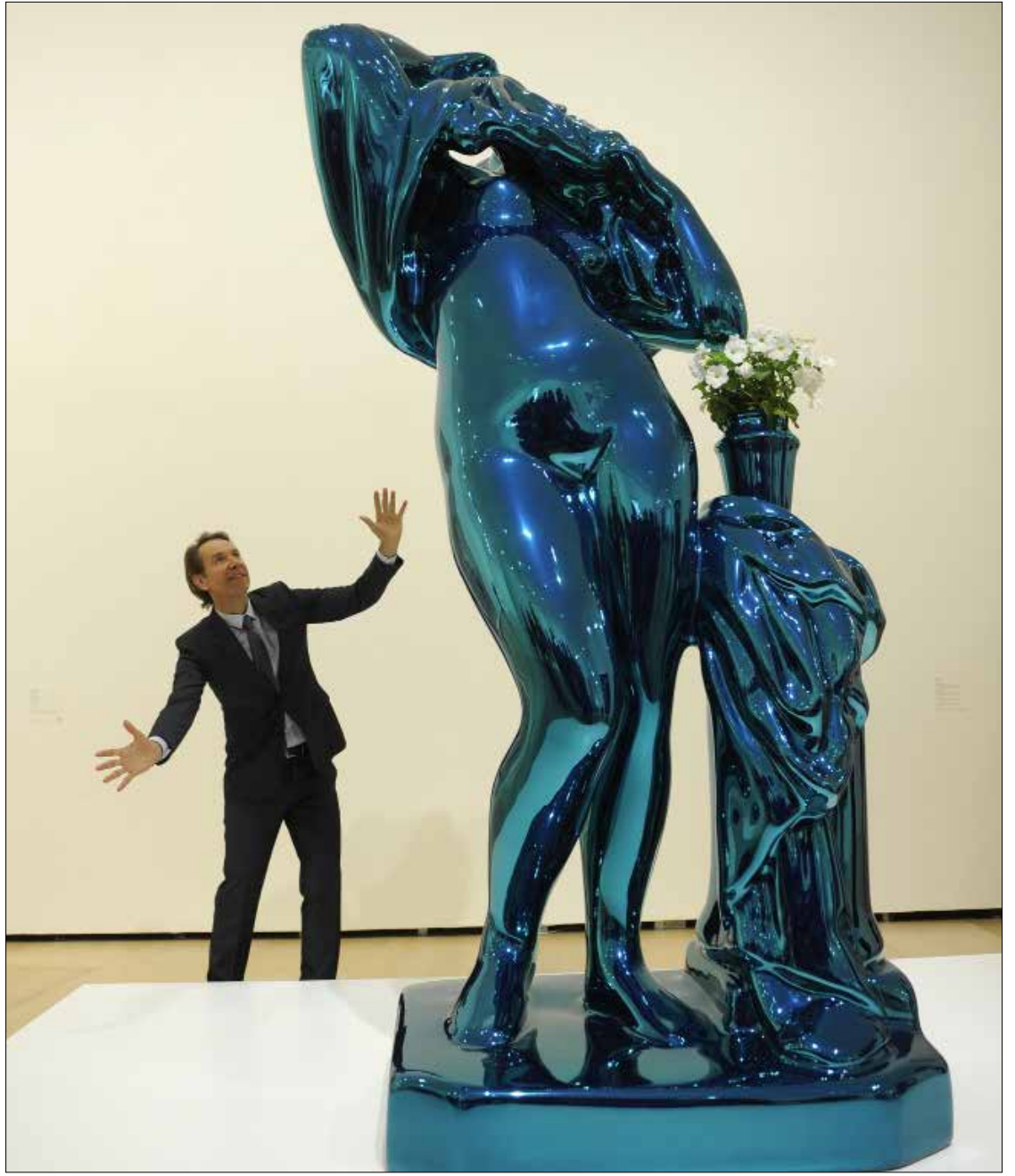
نقل الفنان الأميركي جيف كونز معرضه الذي يحمل عنوان: Jeff Koons Retrospective إلى «متحف غوغنهايم بلباو» في إقليم باسك الإسباني (شمال). المعرض الذي فتح أبوابه أمس أمام الزوار مستمر حتى أيلول (سبتمبر) المقبل، ويضم عددا من أعمال كونز المعروف بإعادة إنتاج قطع عادية مثل بالونات على أشكال حيوانات مصنوعة من الستانلس ستيل مغلطة بأوراق عاكسة للضوء كالمرآة.