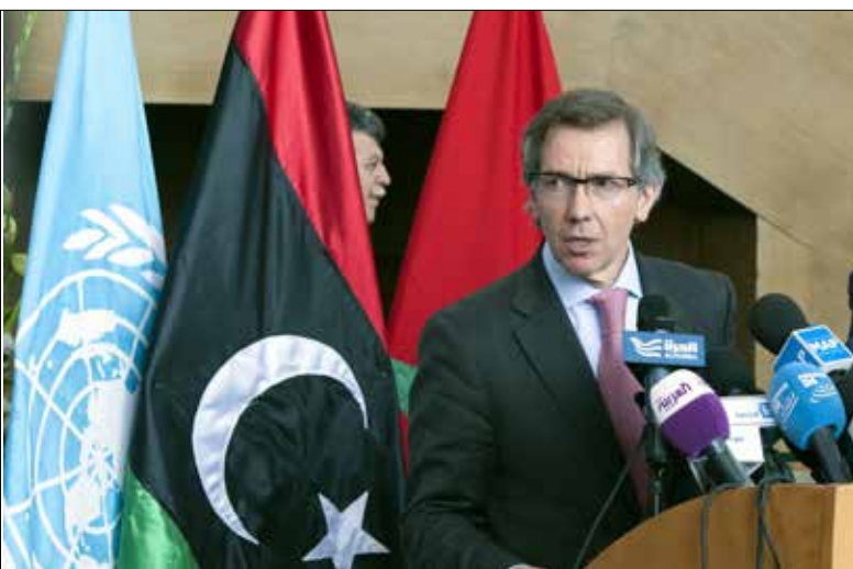
استأنف ليون مشاوراته في منتجع الصخيرات قرب الرباط (الأنضول)

نهاية أيار الماضي، وعلى محطة حرارية مجاورة، كما أفاد المركز الأميركي لمراقبة المواقع الإسلامية (سايت). ونشر «داعش» - ولاية طرابلس على الإنترنت مجموعة من الصور لمقاتلين، مشيراً إلى سيطرته على سرت (450 كلم شرق طرابلس)، بعدما طرد منها قوات «فجر ليبيا»، وهي تحالف لقوى