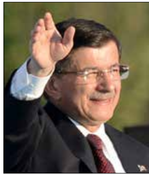
سيكون أحمد داوود أوغلو «كبش الفداء»