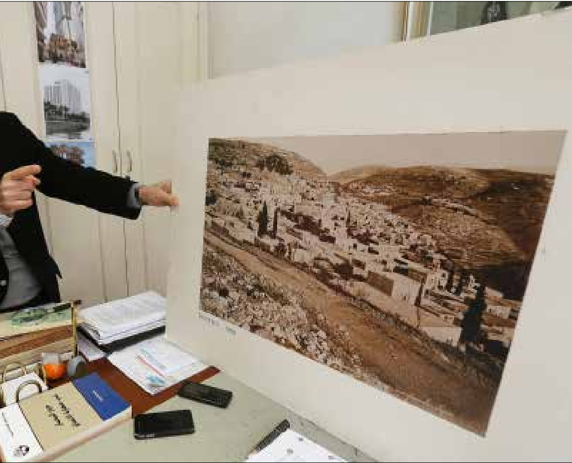
قتل الاماكن ضروري لقتل المدينة (رهياف الموسوي)

مشتركة»، فتكون المجالات العامة مركز التفاعل والتلاقي. «أين يصاغ الرأي العام؟ في الحدائق والساحات، امكنة التظاهرات والإضرابات».