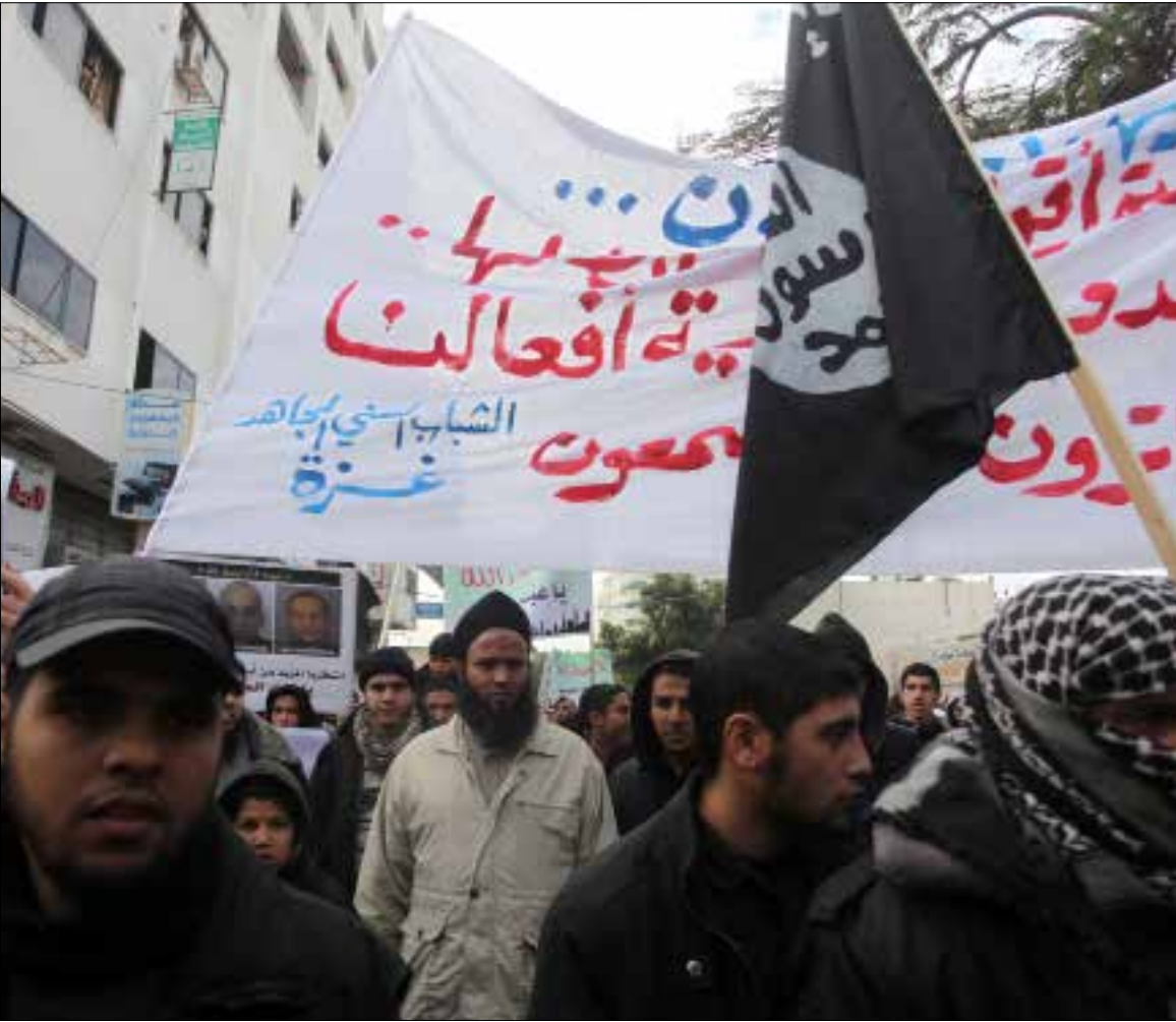
عنصر شرطة يظهران بجانب متظاهرين سلفيين في مسيرة سابقة في غزة

الاتفاقيات جرى التوصل إليها مع «حماس» تتقدمها السماح لهم بممارسة نشاطاتهم في غزة «ما لم تضر المواطنين وأمن حماس»، كما اتفق على «ضرورة إخلاء سبيل إخواننا مقابل التزام القوانين التي تفرض في القطاع». يضيف الأنصاري: «ما جرى بيننا وبين حماس أتى بناء على المصلحة الوطنية وضمان الإفراج عن إخواننا الذين لا يسعون إلى قتل المسلمين ولكن إلى قتل الأعداء الصهيينة». وذكر المتحدث السلفي أنه تم الإفراج عن العشرات على أن يكون الإفراج عن البقية خلال الأيام المقبلة، ولكنه رفض الكشف عن الوسيط بينهم وبين الحركة، فيما لمحت مصادر في الأخيرة إلى أن «الجهاد الإسلامي» تدخلت بناء على علاقاتها الجيدة مع الفصائل لتقنع الطرفين بضرورة التفاوض ومنع جر غزة إلى تصعيد جديد.