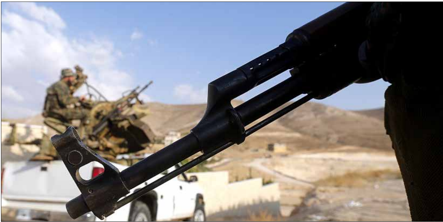
المعارك دارت على مسافة 14 كلم من بلدة راس بعلبك

سزم هجوم إرهابي تنظيم «داعش» على مواقع لحزب الله بين جروود راس بعلبك والقاع، بالهجوم المضاد الذي كانت تعدّه المقاومة والجيش السوري لطردهم في المرحلة المقبلة من كامل جروود القلمون، بعد القضاء على إرهابي «النصرة»