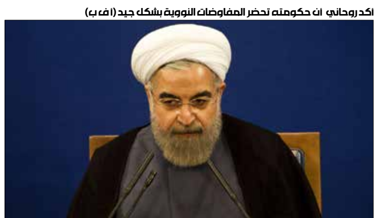
أكد روحاني أن حكومته تحضر المفاوضات النووية بشكل جيد

التصديق على الاتفاق النووي مع الدول الست من قبل المجلس، مضيفاً أن احتمال التوصل إلى اتفاق نهائي ليس كبيراً بسبب مطامع الطرف المقابل. وقال بروجردي، وإعتبر رئيس لجنة الأمن القومي والسياسة الخارجية في مجلس الشورى أنه يجب أخذ كل الخيارات في الاعتبار، مضيفاً: «في أقل التقديرات نحن قد اثبتنا للعالم أننا لسنا دعاة الحرب والغطرسة، بل نحن دعاة المنطق والتعامل ولا شك في أن نظرة العالم تجاه إيران قد تغيرت اليوم».