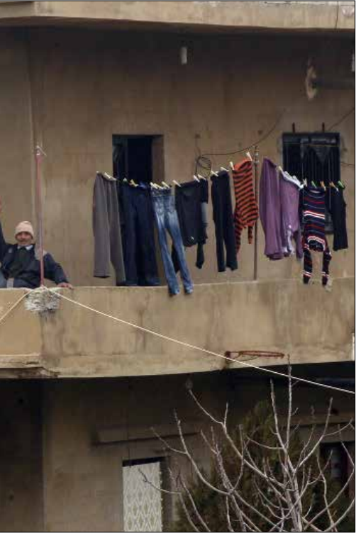
هناك سمات مشتركة بين أهالي عرسال وأبناء بعلبك - الهرمل (هيلم الموسوي)

متخاصماً مع واقعه الاجتماعي، في الأحداث التي شهدت أعمال عنف وصراعاً مسلحاً، ولغت هذا الدور القوى السياسية والسلطات الرسمية، في لبنان وسوريا، وبدأ هذا المشوار الصعب للبلدة المقيمة على سفوح الجبل الشرقي في محطات المراحل التالية: