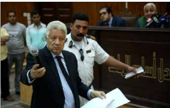
ردت الخارجية المصرية ببيان على «استهداف مصر» (إ ب ب إيه)

أما على الصعيد الشعبي، فشهدت العاصمة البريطانية لندن، الثلاثاء،