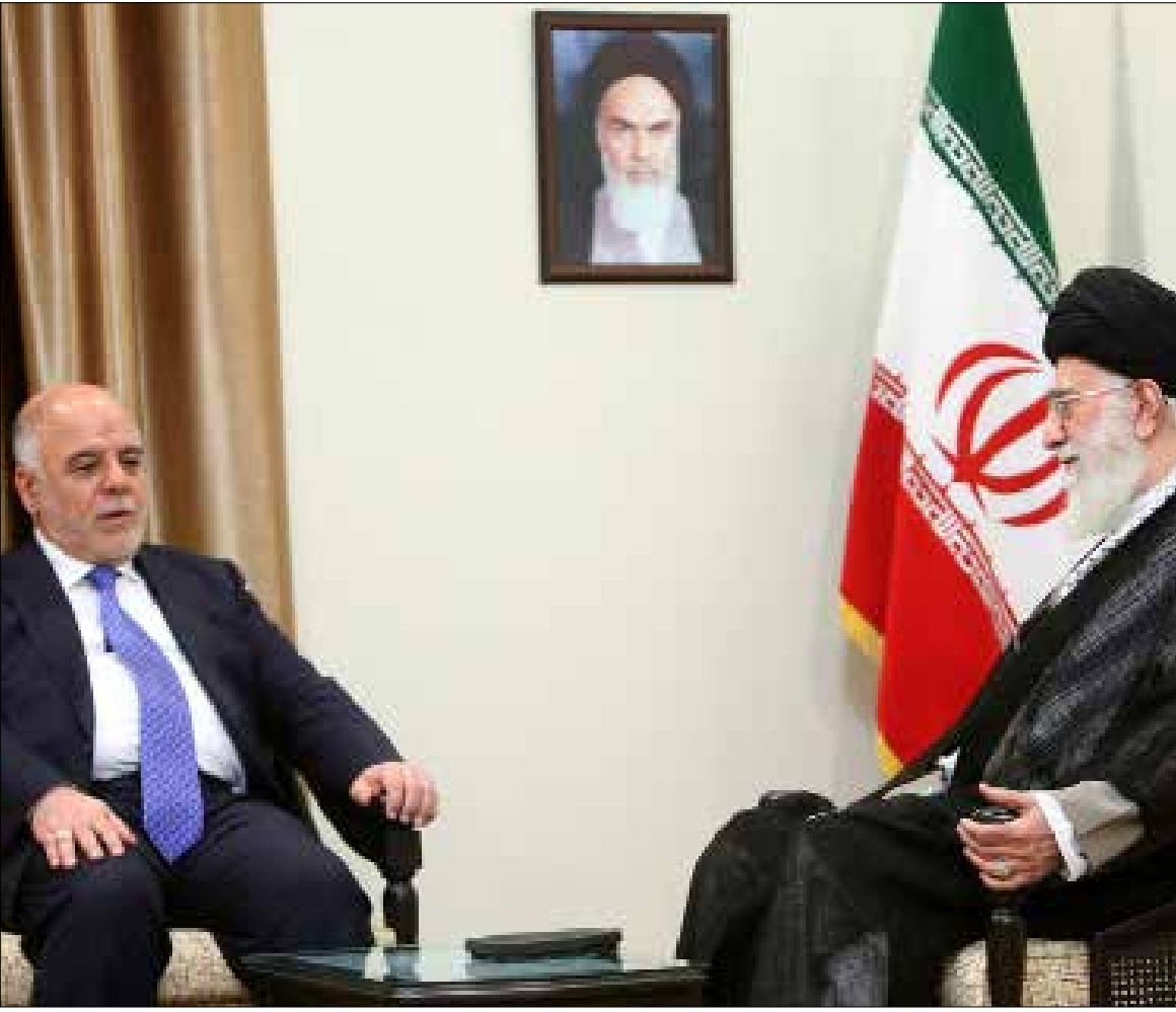
العبادي من طهران: تواجه الإرهاب نيابة عن العالم

شدد رئيس الحكومة العراقية، حيدر العبادي، على أن بلاده تقاتل اليوم نيابة عن كثير من الدول في العالم، وأكد أن الإرهاب الذي يتعرض له العراق لا يهدده وحده بل يهدد الأمن الإقليمي والعالم.