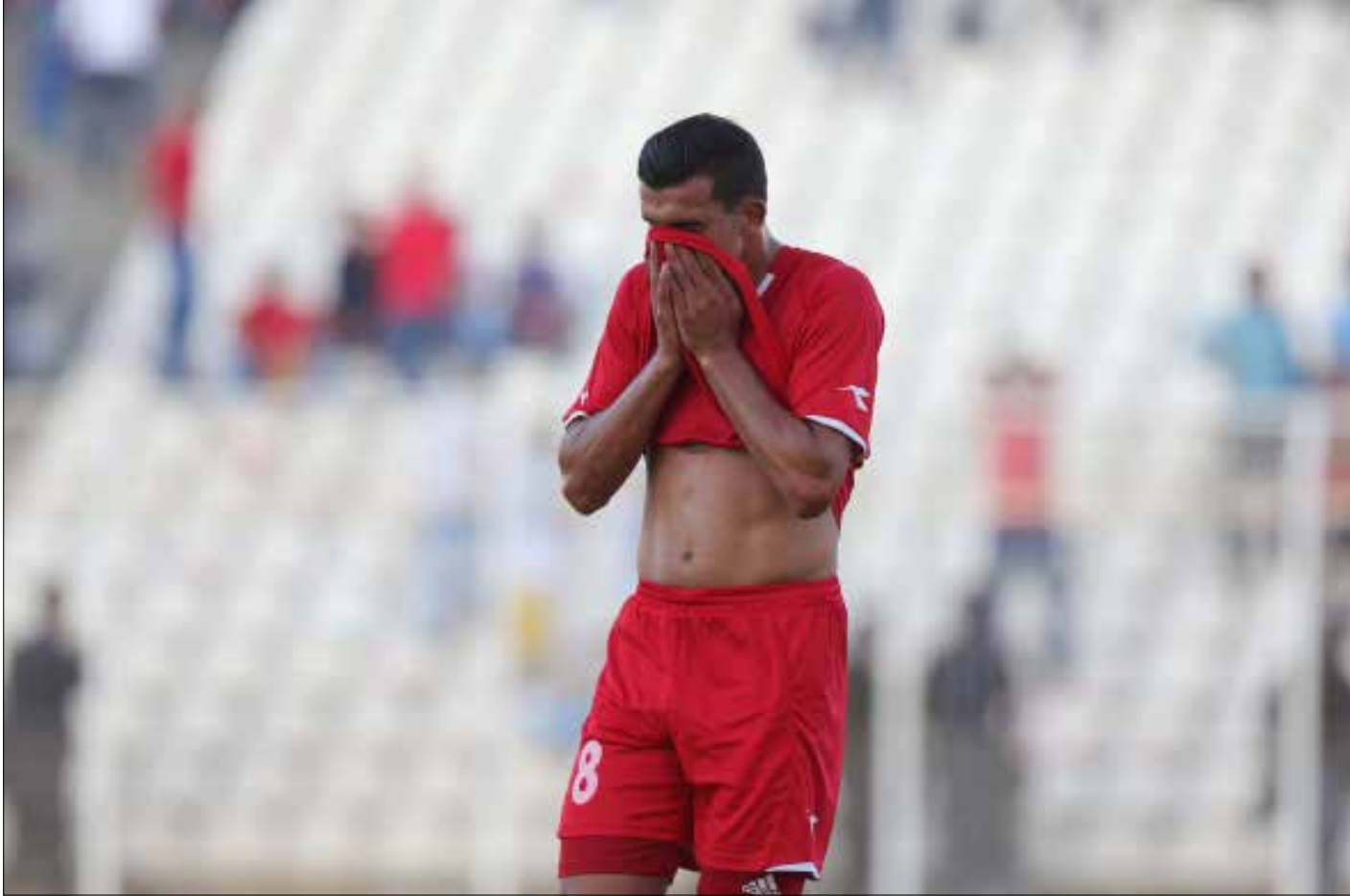
قد يذهب رادولوفيتش الى حسابات اخرى في المرحلة المقبلة بسبب عدم ارتباط بعض اللاعبين بندية (عدنان الحاج علي)

اسئلة كثيرة بدأت تطرح عقب المباراة الثانية لمنتخب لبنان لكرة القدم في التصفيات المؤهلة الى نهائيات كأس العالم 2018 وكأس آسيا 2019. وجميعها يتمحور حول المرحلة المقبلة، التي من المفترض ان تشهد تغييرات جذرية على صعيد الاستراتيجية العامة المتبعة لاعادة المنتخب الى سابقه عهد