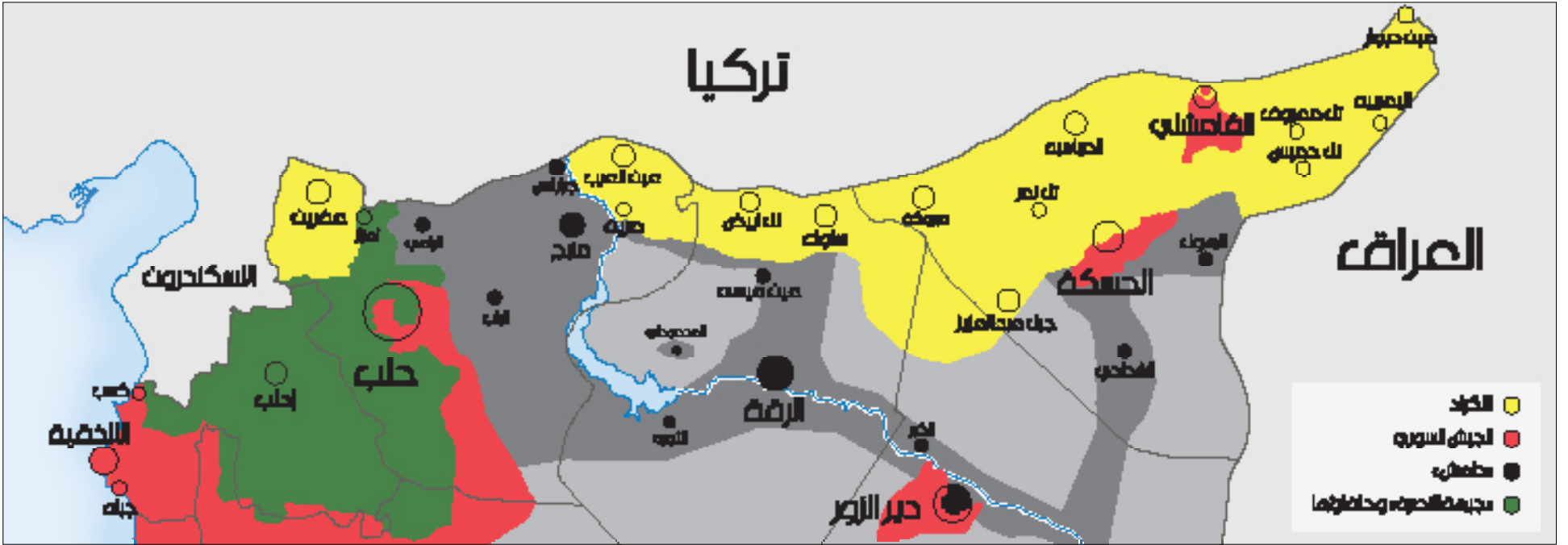
تصميم: علي فرات