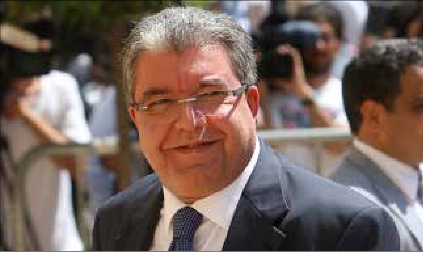
المستقبل: حل التعيينات بتخلي عون عن الرئاسة

تدخل الحكومة في إجازة جديدة تستمر حتى نهاية شهر رمضان، على أقل تقدير. وفيما يزداد شدّ الحبال في مسألة جلسات الحكومة والتعيينات الأمنية، يجري الحديث عن زيارة للوزير نهاد المشنوق إلى النائب ميشال عون كوسيط بينه وبين الرئيس سعد الحريري