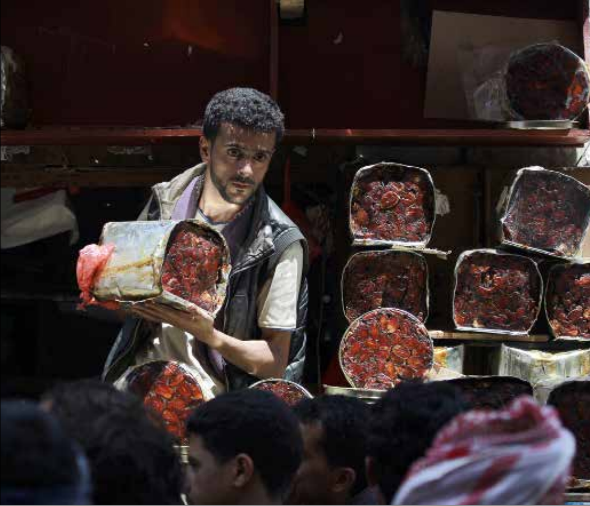
يميني بيوم التمر في صنعاء تحضيراً لشهر رمضان

يبدو أنّ المبعوث الدولي، إسماعيل ولد الشيخ، لم ينجح في كسر الأجندة السعودية، بل انحاز لها بنحو أدى إلى الفشل. الحتمي، لمؤتمر جنيف، حتى إن وفد صنعاء كان واضحاً: إن كان ولد الشيخ يمثل الطرف السعودي، فنحن لا نحتاجه، لأن الحوار المباشر قادرون عليه