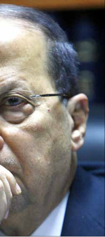
حزب الله لعون: نحن قريك، لكنك محوط بالأعداء في كل جانب (مروان طحطح)

لا تستطيع اصداره لتفنيده في ظل انقسام أفرقائها. فاذا هي اقرب ما تكون إلى حكومة تصريف أعمال سياسي أكثر منه قانونياً. ناهيك بتفنيدها من ان ما يوازن تريثها في استقلالها، ان ليس في وسعها تجاهل مكوثين رئيسيين في صفوفها يقفان على طرف نقض من رئيسها ومن تيار المستقبل، هما تكتل التغيير والاصلاح وحزب الله. بذلك تخفادى حكومة