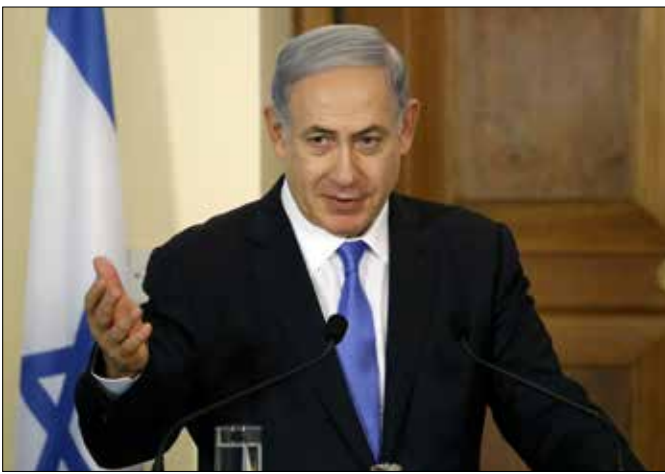
مصادر في مكتب نتنياهو وصفت زيارته إلى قبرص بالمهمة جدا

مصادر في مكتب نتنياهو وصفت زيارة نتنياهو لقبرص بـ«المهمة جدا»، وأشارت في حديث مع موقع «واللا» العبري إلى أنه