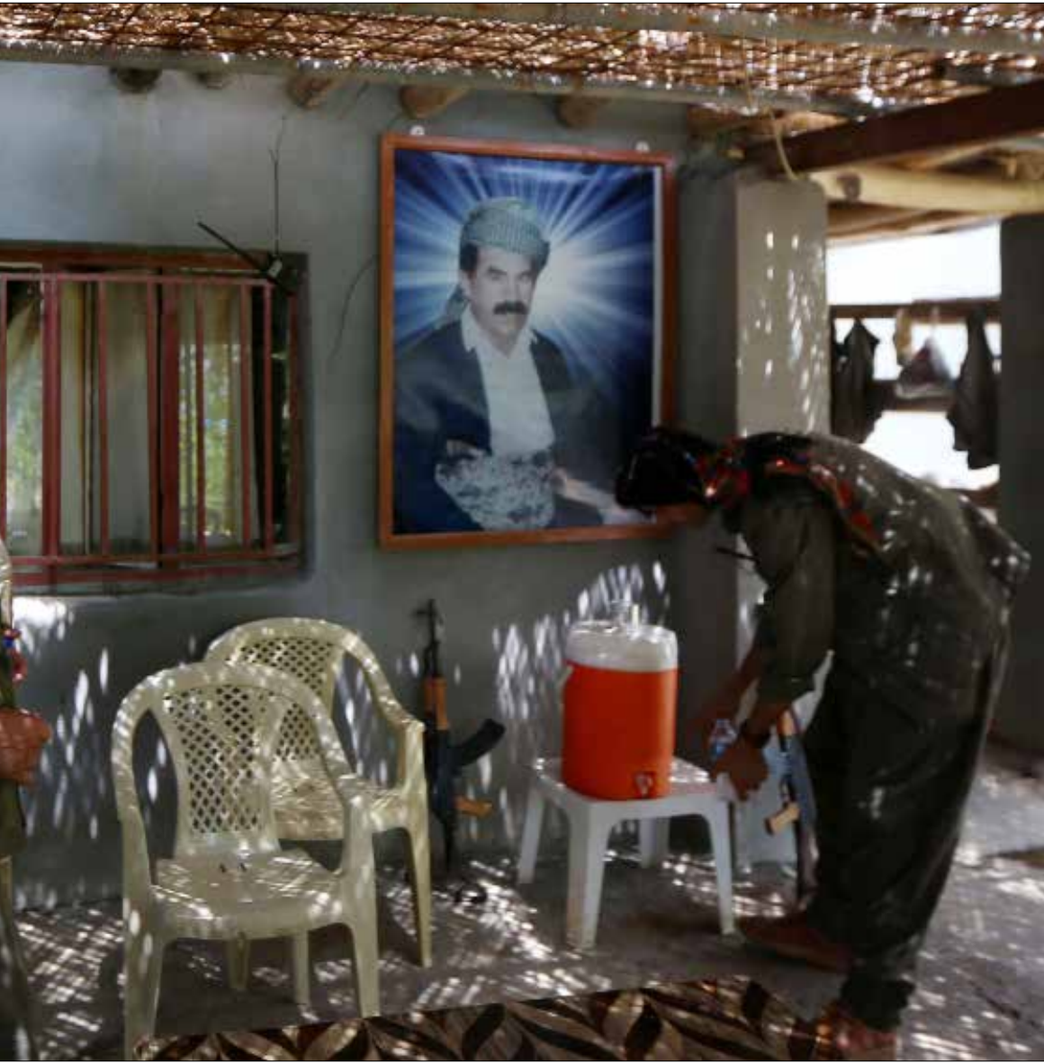
مقاتلان من حزب «العمال الكردستاني» امام صورة الزعيم عبدالله اوجلان في جبك قنديل

على وقع قصف الطائرات الحربية التركية مواقع لـ «حزب العمال الكردستاني» في العراق، وأخرى لتنظيم «الدولة الإسلامية» في سوريا. جاءت التحليلات الغربية حول اتفاق واشنطن. أنقرة ناقصة تشوبها بعض الفجوات التي لم يستطع المسؤولون الأميركيون الإجابة عنها بعد