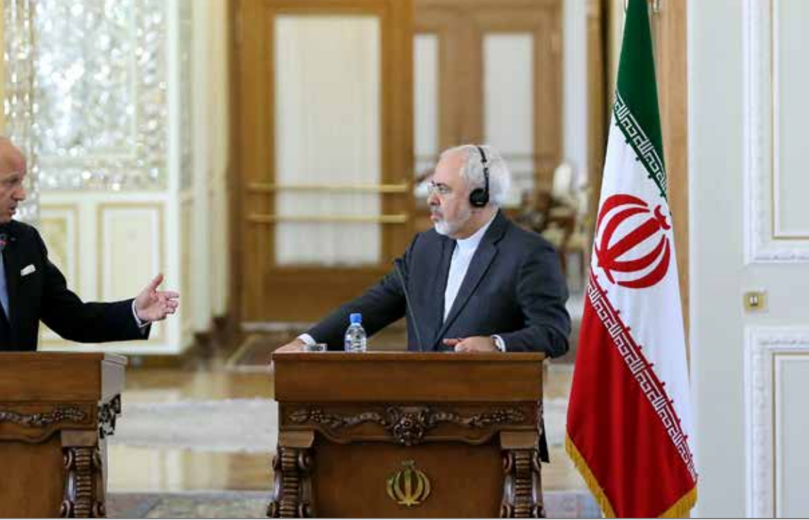
الكعكة الإيرانية أغرت سكان الإليزيه وزيارة طهران لم تخرج عن إطار المجالات الدبلوماسية

فاحت رائحة محركات «بيجو» و«رينو» و«ميراج» وغيرها من الشركات الفرنسية بقوة. أمس. في طيات زيارة لوران فابيوس لإيران. خصوصاً أنه واعد بحضور وفد تجاري إلى طهران. نهاية العام الحالي