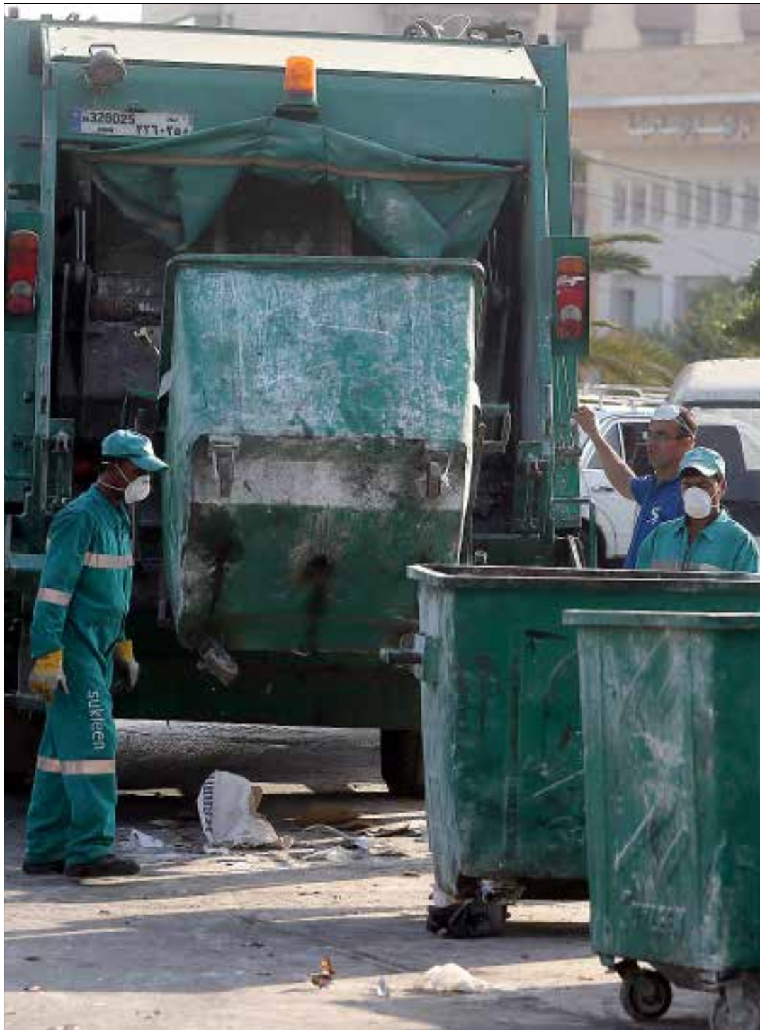
النفايات الطبية تشكل خطراً كبيراً على الصحة العامة، وتحتاج الى معالجة علمية دقيقة

هذه الفقرة التي نجدها في غالبية المراسلات بين الشركة ومجلس الانماء والاعمار وبين الأخير والامانة العامة لمجلس الوزراء، هي نقطة اللخل الأبرز التي طغت على