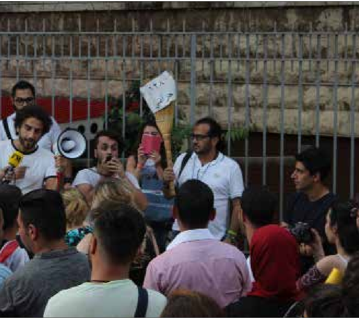
وعد صاغية باستكمال المعركة إعلامياً وقضائياً حتى محاسبة درباس (هيفاء البنا)