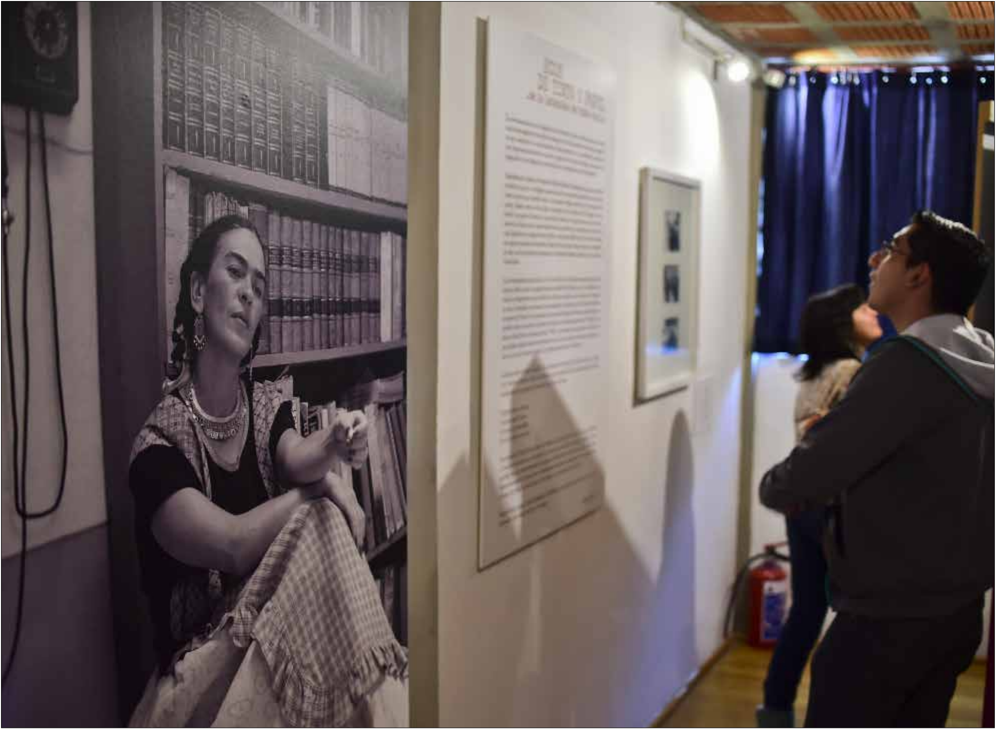
ينتمتع زوار متحف Casa Estudio Diego Rivera y Frida Kahlo في مكسيكو سيتي بفرصة الإطلاع على مجموعة من الرسائل التي تحمل توقيع الرسامة المكسيكية فريدا كالحو (1907 - 1954). إضافة إلى صورها التي تستعرض جزءاً من حياتها الخاصة. يأتي ذلك ضمن معرض بعنوان Echoes of ink and paper. From the intimacy of Frida Kahlo.