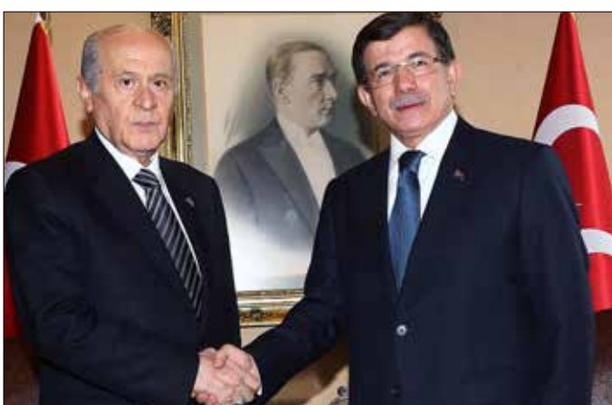
من المرجح أن يلتف أردوغان على الدستور مجدداً ويبقى على حكومة داوود أوغلو (إفب)

ونقل عن بهشتلي قوله إنه لا يؤيد دعم أي حكومة أقلية يشكلها حزب «العدالة والتنمية». وكان داوود أوغلو قد أعلن الخميس الماضي، انهيار محادثات تشكيل ائتلاف استمرت أسابيع مع «الشعب الجمهوري»، وقال إنه يبدو أن الانتخابات المبكرة هي «الخيار الوحيد» أمام تركيا.