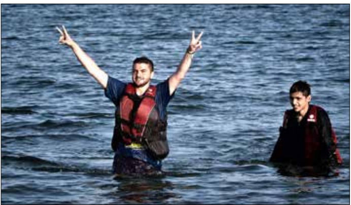
مهاجران سوريان نجحا بالوصول إلى السواحل اليونانية أمس

والمدنيون ورفقتهم الوحيدة. هذا هو حال مسلحي ريف اللاذقية الشمالي، الباحثين عن ورقة ضغط في وجه الدولة السورية. وللمرة الثانية، في أقل من أسبوع، صعد المسلحون استهدافهم بالصواريخ للأحياء السكنية في اللاذقية، ما أفضى إلى استشهاد 6 مدنيين، وجرح عدد آخر. وشهدت المدينة الساحلية منذ أيام قصفاً طاول عدداً من أحيائها، وضعه المسلحون في إطار «نصرة الزبداني».