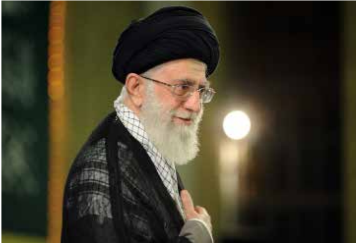
الحرب في سوريا واليمن والعراق ليست مذهبية بل سياسية

روانجي تأكيده، خلال جلسة استماع أمام اللجنة البرلمانية المعنية بمراجعة الاتفاق، أن «خطة العمل المشترك الشاملة تفتقر لطابع المعاهدة، ولذلك فهي لا تحتاج إلى تصديق البرلمان»، الأمر الذي لاقى معارضة أعضاء اللجنة، الذين رأوا أن «نص الخطة يتضمن اتفاقاً وقبول التزامات من قبل الحكومة، لذا يجب أن يحظى بإقرار أعضاء البرلمان». وفي السياق ذاته، أكد مساعد وزير الخارجية الإيراني عباس عراقجي أن أي شخص خارج نطاق عمل المفتشين الحائزين للتأييد لا يستطيع دخول إيران بصفته مفتشاً للوكالة الدولية للطاقة الذرية. وقال عراقجي إن «الوكالة الدولية تقدم مفتشيها لحيازة التراخيص اللازمة في دخولهم الأراضي الإيرانية، حيث تقوم وزارة الأمن والمؤسسات المعنية في البلاد ببت هذا الموضوع». إلى ذلك، غادر نائب وزير الخارجية للشؤون العربية والأفريقية حسين أمير عبداللهيان طهران، متوجهاً إلى ألمانيا، على أن يزور بعدها سويسرا لدراسة التطورات الإقليمية. وسيعقد عبداللهيان، خلال الزيارة مباحثات مع مسؤولي ألمانيا وسويسرا، تتناول تطورات المنطقة وأحدث مستجداتها بما في ذلك الوضع في سوريا واليمن والعراق ومكافحة التطرف، «بما أعادت وكالة الأنباء الإيرانية «ارنا» (الأخبار)