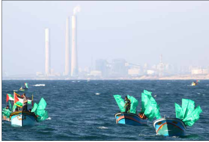
زوارق صيد فلسطينية تبحر قريباً من ميناء مدينة اسدود المحتلة

مناورة إسرائيلية رسمية وإعلامية بشأن «هدنة طويلة مع حماس»، أنهاها أوبدها أمس، مكتب بنيامين نتنياهو بنفي الخبر جملة وتفصيلاً. وأن يكون قد طلب التفاوض مباشرة وغير مباشرة. مع الحركة، يقابل ذلك رواية حماسية تعالها قيادات وتسرها آخره