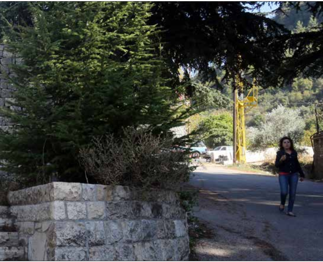
اتصل الالهالي الملف، فتبين لنا انهم ليسوا على علم بالملف، حينها اتصل السفير البابوي بالرهبان للاستفسار. بناءً على هذا الامر، بعث الدير «شبه حل» الى روما، دون ان يطالع المفاوضات على تفاصيله، «زاعمين اننا وافقنا على بنوده». وصل الرد من روما عام 2007 يطلب اعطاء الاراضي قبل ايلول 2011. نحن في 2015 وما زلنا نحاول ايجاد حل. «الحل المطروح من الدير غير قابل للتنفيذ، اذ يعرضون اقامة ما يشبه الاسهم بشركة عقارية باراض غير مفرزة، على ان يكون تنفيذ مشاريع البنى التحتية من مسؤولية سكان القرية». مساحة القرية 14 مليون متر2، والحل ينص على توزيع مليوني متر، على ان تكون مساحة 500 الف متر مخصصة لفرز الطرقات. الدير يطلب اليوم تنازلاً الى 1700 متر بدل 2000 للفرد. «نحن طلبنا إعطاء الاراضي، الا ان الدير يصر على البيع». هذا الحل نال الموافقة في مجلس المديرين والابائي والرئاسة العامة، ونملك رسائل من رئيس الدير السابق يعلن موافقته عليه. احد الابهاء سأل عن نسخة الحل التي نمتلك، قلنا اننا لا نملكها، الا ان في حورتنا رسائل من الرئيس العام، فكان رده «بما انكم لا تملكون نسخة، يمكننا ان ننكرها».

البابوي لمعرفة سبب التأخر في بت الملف، فتبين لنا انهم ليسوا على علم بالملف، حينها اتصل السفير البابوي بالرهبان للاستفسار.