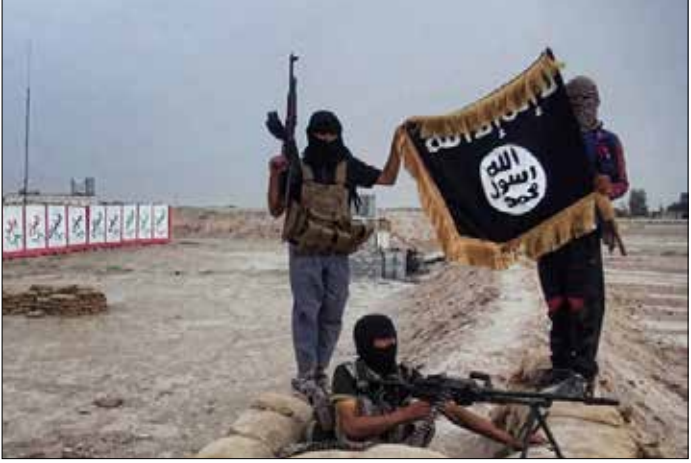
«داعش» نفذ عدة هجمات بمادة الكلورين على مقاتلين أكراد

على خطٍ كفريا والفوعة اللتين دخلتا الشهر الخامس من الحصار، هدأت المعارك أمس بعد محاولات المسلحين المستمرة اقتحامهما منذ إعلان فشل التسوية يوم السبت الماضي، إذ قُصفت البلدتان بنحو 2300 قذيفة وصاروخ، لكن «اللجان الشعبية» أفشلت جميع محاولات التقدم البري. وعلمت «الأخبار» أن هذه اللجان «طلب منها أن لا تبادر بالهجوم على نقاط المسلحين القريبة أو قصف القرى التي ينطلق منها المسلحون إذا ما تعرضوا لأي اعتداء» إفساحاً في المجال أمام إمكان إنجاح «تسوية جديدة». معظم الأهالي «أصبحوا في جوة المغادرة»، تروي مصادر متابعه في البلدتين الإذليبتين، وهم قد يتخلصون من حжим يومي، بعد المئة في الفوعة مثلاً، في ظل شخ المحروقات حتى لمضخات المياه، حيث يعيش أكثر من 40 الف مواطن حالة حصار كامل، لا تكسرهما سوى مساعدات الدولة السورية الملقاة من الجوّ.