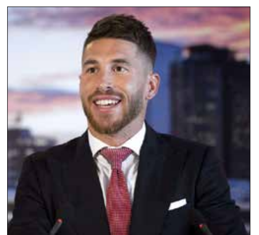
راموس خلال مؤتمر صحفي عقب تجديد عقده لريال