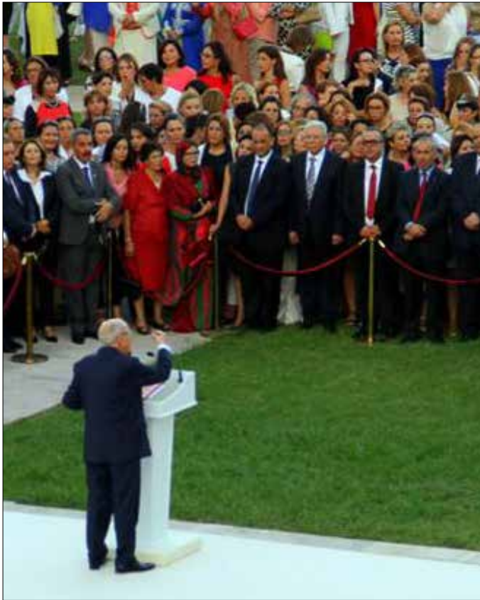
تصريحات السبسي وضعته في مرمى نيران عدد من الجهات

وفي السياق نفسه، ترى النائبة في البرلمان عن «حركة النهضة»، يمينة الزغلامي، أن رئاسة الجمهورية ووزارة التربية ليس لهما أي حق في منع الحجاب أو المحجبات عن الدراسة، مشيرة إلى أن التونسيين عانوا طويلاً من قمع الحريات الدينية، خاصة خلال عهد بن علي الذي منع الحجاب حتى في الجامعات. ويذكر أن نظام بن علي كان يمنع ارتداء الحجاب في كل المؤسسات التربوية والجامعية من خلال ما يُعرف بـ«المنشور 108». الملغى بعد هروب بن علي.