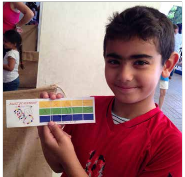
هك تضفي على عمل المخيمات الصيفية الترفيهية المنتشرة في المناطق (الاخبار)

بدورها ارسلتها الى بكركي». كان امام السفير البابوي احتمالان، إما اخذ الموافقة من روما شفهيًا، او إرسال موافقة البطريرك، لان أسماء 150 شابا اعمارهم فوق الثامنة عشر، لم تدرج على الموافقة القديمة التي بتت عام 2009. تؤكد البلدية ان هناك تأخيرا اداريا، «لو كان بإمكاننا اخذ موافقة السفارة البابوية دون الحاجة الى موافقة روما، لكننا ليوم في عيد السيدة قد اعلنا الحل». يستغرب الحاج عدم رغبتهم في الحل، «فالاراضي لا تعود لهم بأي ربح مادي، ولا يمكنهم استثمارها، لان هناك دعوى قائمة عليها، الا ان كانوا يملكون نية تهجير الناس واعادة بيع الاراضي، كما