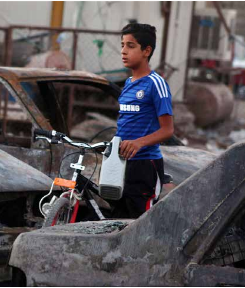
تباينت آراء الكتل المنضوية في «التحالف الوطني» بشأن التقرير