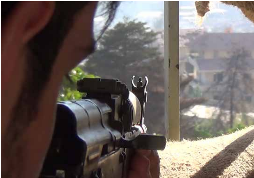
من معارك الزبداني أمس (خاص «الأخبار»)

في السياق، علمت «الأخبار» أن السلطات السورية نقلت جزءاً من النازحين من أهالي الزبداني في بلودان باتجاه مضايًا، وذلك للضغط على مسلحي هذه البلدة. إذ بعد الزبداني، تشكل مضايًا جزءاً من «المشكلة» حيث فيها عدد كبير