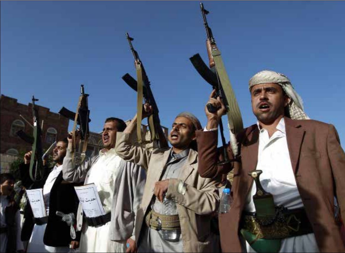
الأيام المقبلة «ستشهد تصعيداً قوياً وضربات مؤلمة ضد قوى العدوان على اليمن»

الأراضي التي دنسها نظام آل سعود». وأكد الصماد في بيان نشره عبر موقع «فايسبوك»، أن «بواب النصر والتمكين تلوح في الأفق وأن حجم الانتصار هو بحجم المعاناة والتأمر»، مشدداً على أن الشعب اليمني «سيحرز نصراً يخزي العدوان ومرترقته في الداخل ويخزي العالم المتواطئ ويجعل العالم يركع وينحني أمام شعب اليمن» (النص الكامل للبيان على الموقع الإلكتروني).