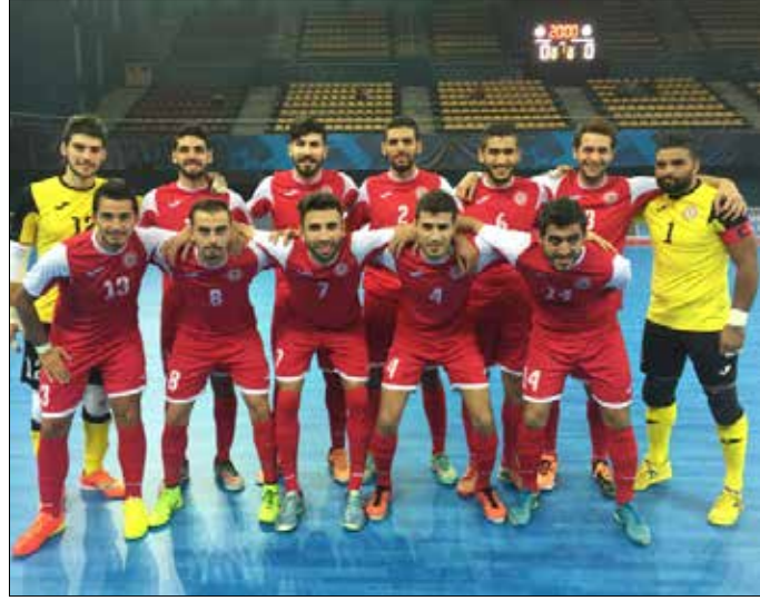
تشكيلة المنتخب اللبناني التي خاضت المباراة امام السعودية

وعن تاهل منتخبه بتفوق علق اراوجو: «هناك طريق طويلة امامنا للوصول الى مبتغانا اي التاهل الى كأس العالم، لذا سنجلس في الاسبوع المقبل ونضع الاستراتيجية الامثل للاستعداد للبطولة الآسيوية التي ستقام في شباط المقبل».