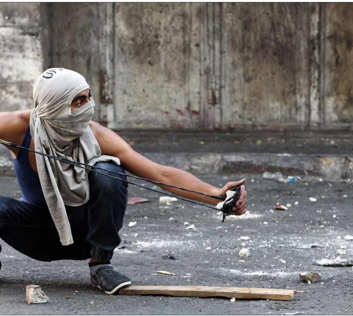
أعلن جيش المدور رفضه تسليم أهله الشهداء، جلاميت ابناهم (ا، ب)

التبديل وخلو الشارع من الجنود لتنفيذ عملياته. بعد استشهاد حليبي، اشتعل الشارع الفلسطيني وخصوصاً في مدينة البيرة وأحياء الخليل وبيت لحم والقدس، كما اندلعت المواجهات مع المستوطنين الذين حاولوا اقتحام القرى الفلسطينية المحاذية لمستوطناتهم في بيت أمر وسردا وبيت إيل. وفي