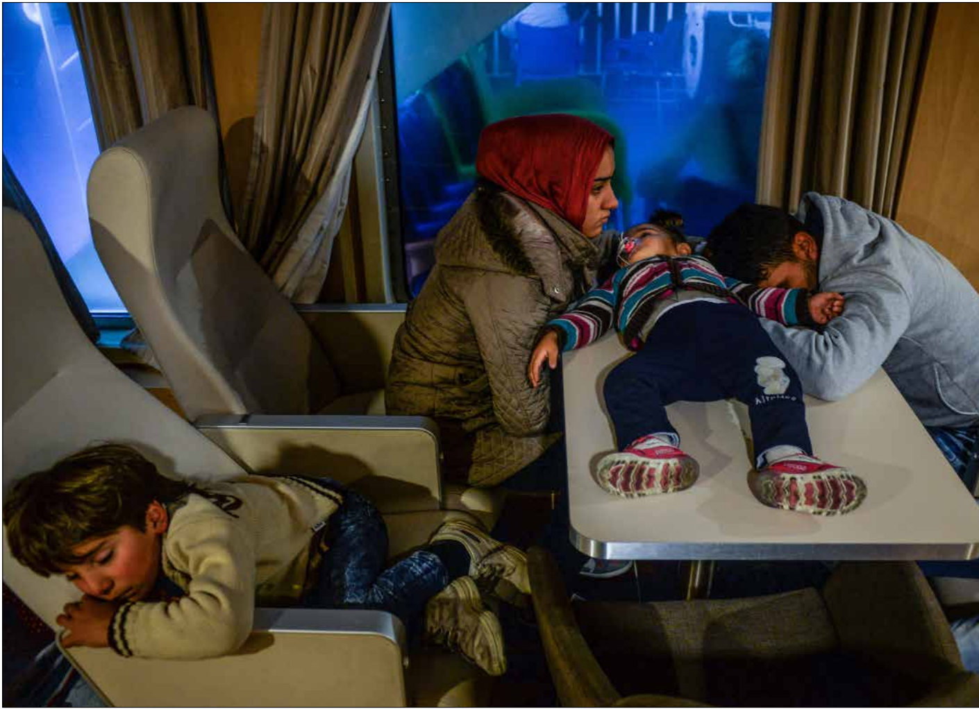
هل يُعقل أن يهاجر السوريون دفعة واحدة وبهذه الكثافة؟

رحلة اللجوء السوري ما زالت مستمرة، ويستمر الاستثمار فيها بمختلف الوسائل غير المشروعة، وتبقى أبواب الدول الأوروبية مشرعة لكل من جارت عليه أوضاع بلاده... على الأقل حتى تضع الحرب أوزارها.