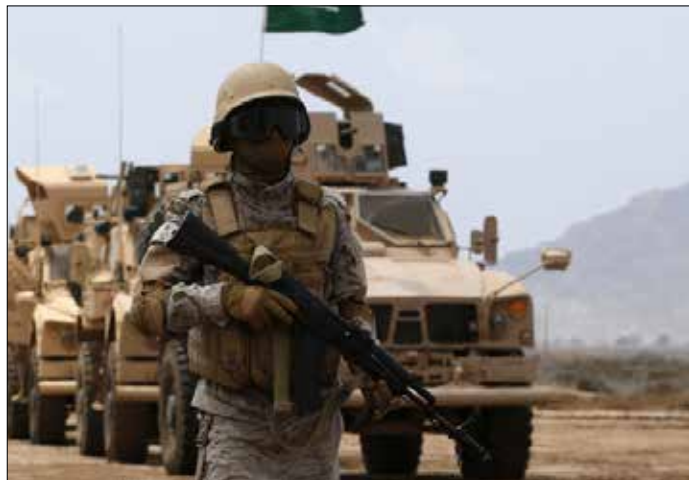
خسر الجيش السعودي نقاطاً ومحاور مهمة في العمليات الميدانية

تقدم اليمنيين، وأفقدت الجيش السعودي نقاطاً ومحاور مهمة في العمليات الميدانية، كذلك تفتح الطريق أمام تقدم الجيش اليمني و«اللجان الشعبية» نحو السيطرة على مزيد من المساحة الجغرافية، سيما التابعة لـ«الخشل» شمال شرق مدينة الخوبة.