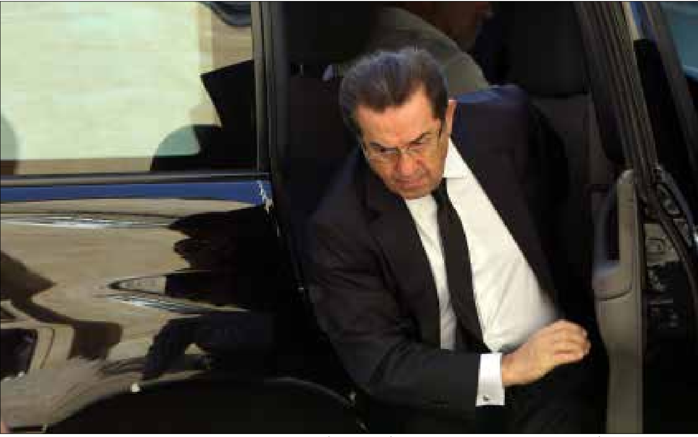
رفض حرب اقتراح مدير الشركة المودة إلى العقد لعقد إيجار 4 سنوات

استأجرت شركة «تاتش»، بأموال الدولة اللبنانية، مبنى ليكون مقرها العام الجديد. دفعت أكثر من 8 ملايين دولار من قيمة الصفقة. وزير الاتصالات بطرس حرب طلب منها فسخ العقد، وإجراء تسوية مع المالك قيمتها نحو 10 ملايين دولار، والبحث عن مبنى آخر لاستجاره، وتالياً، إعادة إنفاق المبالغ ذاتها