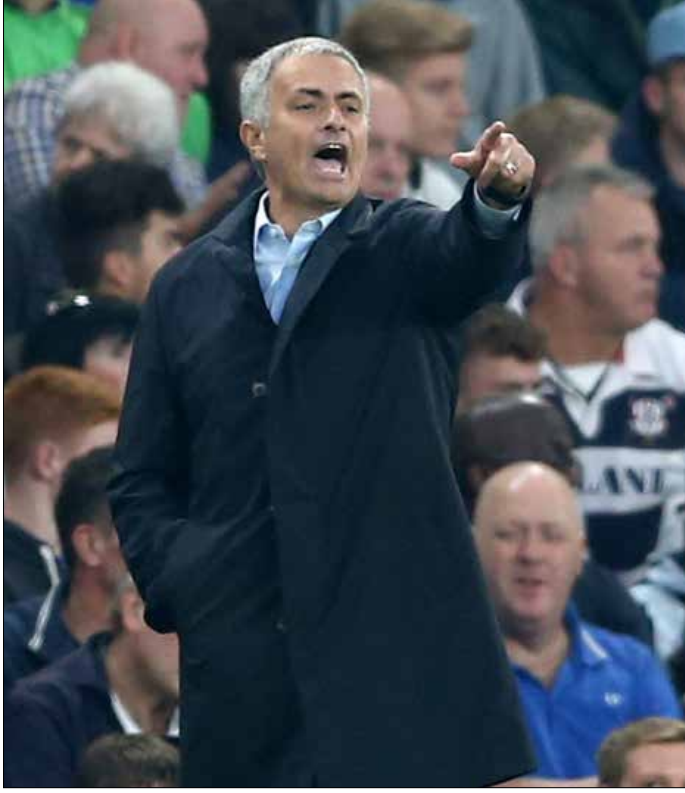
مورينيو خلال المباراة أمام ساوثهامبتون

الأمر وصلت الآن بالتأكيد إلى مرحلة الخطر بالنسبة إلى موسم تشلسي وإلى مصير مورينيو المهدد بالإقالة برغم إبداء إدارة تشلسي تمسكها به بعد الخسارة الأخيرة، وهي مسألة ما كان يُحْتَلَّ لأحد أن يصل إليها البرتغالي في لندن بعد دوره الكبير في إعادة «البلوز» إلى مصاف الكبار في كرة الإنكليز، إلا أن استمرار الحال السيئ على ما هو عليه سيكون كفيلاً بتعديل هذا الموقف المستند إلى الرصيد الكبير الذي جمعه البرتغالي في قلوب اللندنيين، وهذا ما اتضح أيضاً من خلال إعلان اللاعبين وفي مقدمتهم جون تيري مساندتهم لمديريهم في الأزمّة الحالية، وما على مورينيو الآن، وفي أسرع وقت، إلا ردّ التحية بمثلاً.