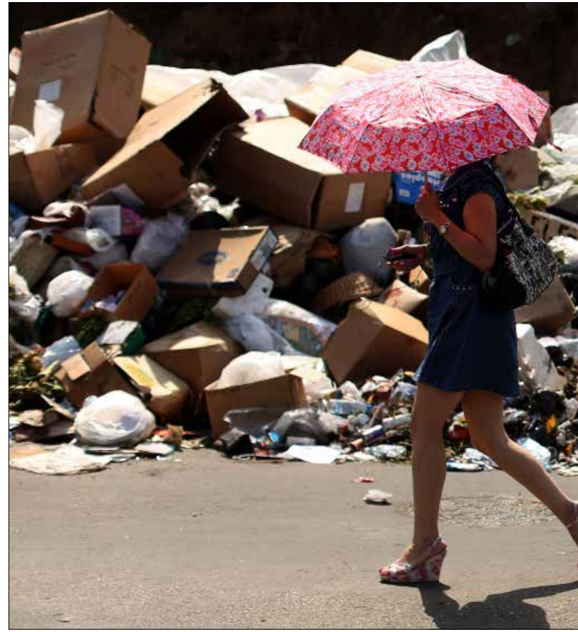
ازمة النفايات: المراهقة مستمرة

تمام سلام لحسم موقفه. وبناءً على هذا اللقاء سيبتين ما إذا كان تيار المستقبل سينجح في إمرار تسوية تفضي في نهاية المطاف لبدء العمل في تحويل الموقع من مكب عشوائي الى مطمر صحي. وفيما لم يحسم حزب الطاشناق أمره بالنسبة إلى برج حمود، لم تترجم مباركة العماد ميشال عون لخطة شهاب بعد زيارة الأخير له، بل على العكس فان عددا من البلديات في عكار التي يملك فيها التيار الوطني الحر حضوراً واسعاً اعلنت رفضها للخطة. ويبدو ان عون ينتظر ان تقابل ايجابيته بامرار الخطة داخل مجلس الوزراء، بقبول الطرف الآخر للمبادرة التي عمل عليها النائب وليد جنبلاط والمتعلقة بالحل المقترح لتعيينات السلك العسكري ولآلية عمل مجلس الوزراء، ولغيرها من الملفات العالقة داخل مجلس الوزراء وخارجه. وفي مقابل تعثر الحل السياسي، الذي سينعكس حكماً على تنفيذ خطة النفايات، فان الحراك الشعبي الذي لم يوافق على اقتراحات المرحلة الانتقالية والمتعلق بالمطامر، سينتقل مع بدء تنفيذ الخطة الى مرحلة جديدة من الاعتراض، عنوانها الاساسي مدى التزام الحكومة